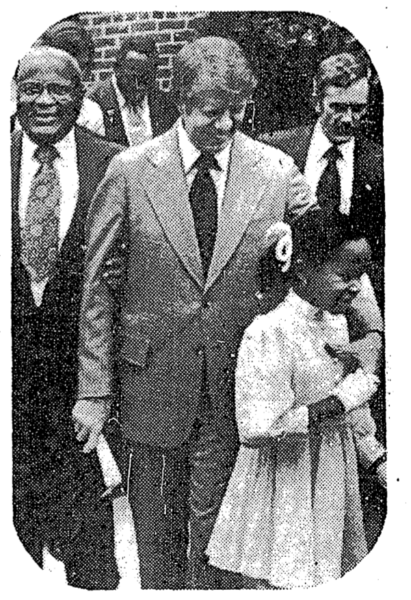
WASHINGTON, 25.- El Presidente Carter estrecha la mano de una niña que se abrió a saludar. Junto al mandatario (I) se ve el Rev. Martin Luther King Sr., y a la derecha un agente del servicio secreto mantiene vigilancia sobre la niña. La escena tuvo lugar al salir de la iglesia este domingo después de los servicios religiosos.

También habló de que en las invasiones, "En Sinaloa estamos apoyando a los pequeños propietarios. Los apoya el gobierno del Estado y la Reforma Agraria y tan es así que se está procediendo a un desalojo paulatino".