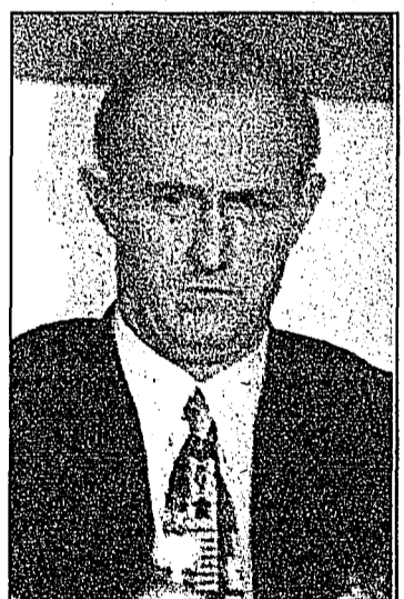
Algunas versiones indican que Chapa aceptó venir.

En un comunicado, la PGR precisó que una vez, aquí, al ex funcionario se le iniciarán, por el momento, los procesos por la probable responsabilidad en la comisión de los delitos de asociación delictuosa, simulación de pruebas materiales, así como por uso indebido de atribuciones o facultades, violación de las leyes de inhumaciones y exhumaciones, así