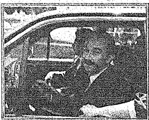
Carlos Salinas de Gortari.

Los hombres de empresa opinan que las prioridades del próximo gobierno deberán ser