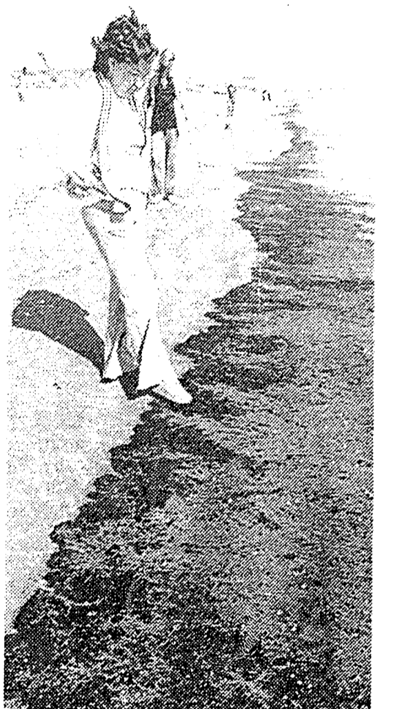
GALVESTON, Texas, 6 (UPI).- Una mujer visitante de esta playa toca con la punta del pie la capa de petróleo que ha llegado procedente del derrame sufrido por el tanque petrolero Burmah Agate que chocó contra el carguero Minosa y desde entonces (Nov. 1) ha estado derramando al mar su contenido. (UNIFAX).

Partidos de ideología disímula, como el Comunista Mexicano y el Demócrata, apoyaron la propuesta priista y elogiaron la lucha boliviana por preservar la legitimidad del poder público. José Guzmán Gómez, del PDM, dijo que es necesario insistir en que la democracia debe ser el sistema de gobierno que debe prevalecer