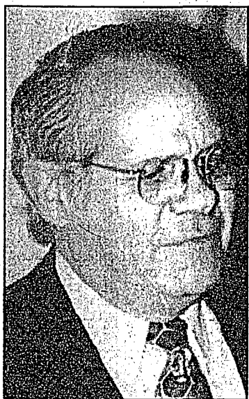
Coindreau. Se busca lo mismo que con otros gobernadores panistas.

y el gobierno de Canales, al igual que ha pasado con las administraciones panistas de otros estados, ayudados por los medios de comunicación nacionales.