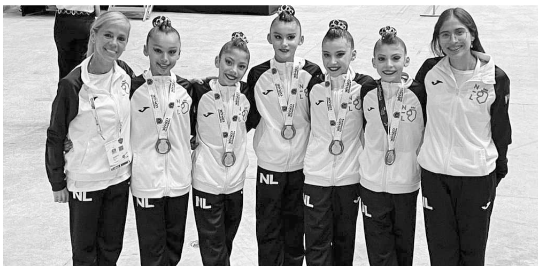
El equipo de gimnasia de Nuevo León abrió con victorias.

Cabe señalar que Jalisco lidera en el Medallero de los Nacionales Conade, teniendo más de 100 medallas de oro respecto al sublíder Nuevo León.