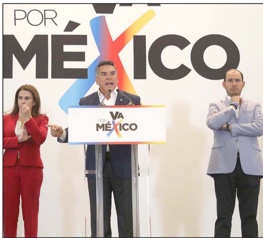
El que tenga mejor promedio de la encuesta (mitad de los puntos) y de la elección (50%), será quien encabece el frente opositor.

que el partido realice consultas ciudadanas con otras fuerzas políticas con ese fin.