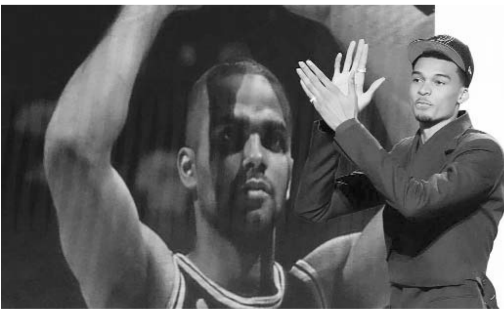
Wembanyama, amarrado con las Espuelas.

Víctor Wembanyama, la primera selección del Draft de la NBA en este año, ya fue presentado el sábado con su equipo.