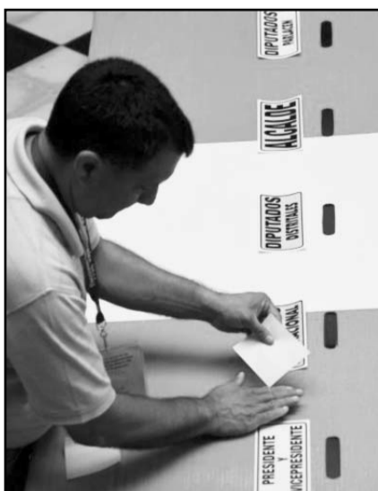
Hoy votarán por el nuevo presidente, vicepresidente y diputados.

Los principales aspirantes se encuentran en el extremo conservador del espectro político. La ex primera dama Sandra Torres, que busca por tercera vez la presidencia, ha tenido éxito con una campaña populista en la que