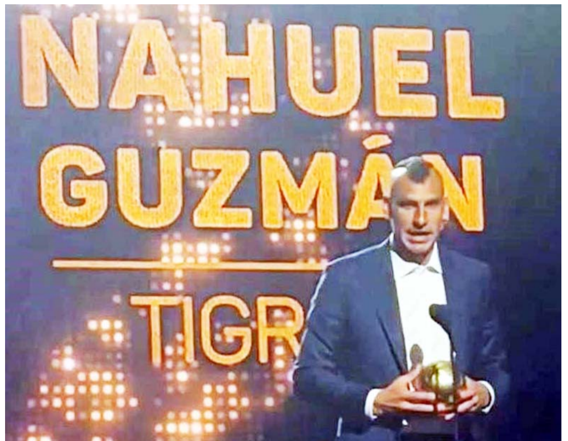
El argentino obtuvo el galardón del Balón de Oro en dicha categoría.

Eso sí, será hasta este día por la noche, este domingo, cuando la televisora TUDN dé a conocer a los ganadores de manera oficial.