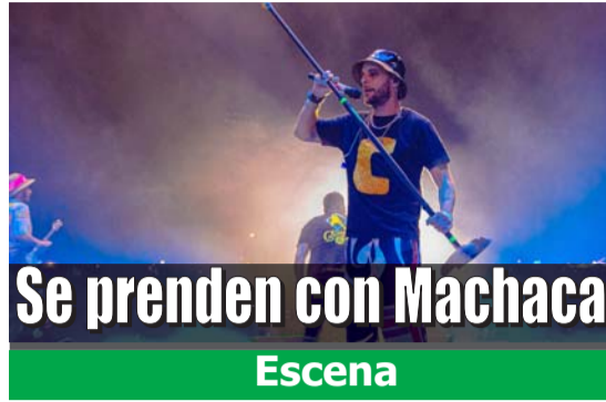
Se prenden con Machaca