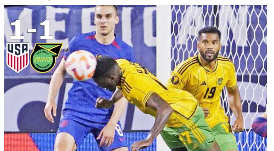
Se conformaron con el empate.

El juego quedó así y con eso Jamaica lidera el grupo A y lo hacen con un punto, seguido de los Estados Unidos que cuenta también con una unidad. La actividad en la fase de grupos seguirá este domingo con la Copa Oro, todo esto con los duelos entre Trinidad y Tobago ante San Cristóbal de las Nieves, Haití frente a Qatar y México frente a Honduras.