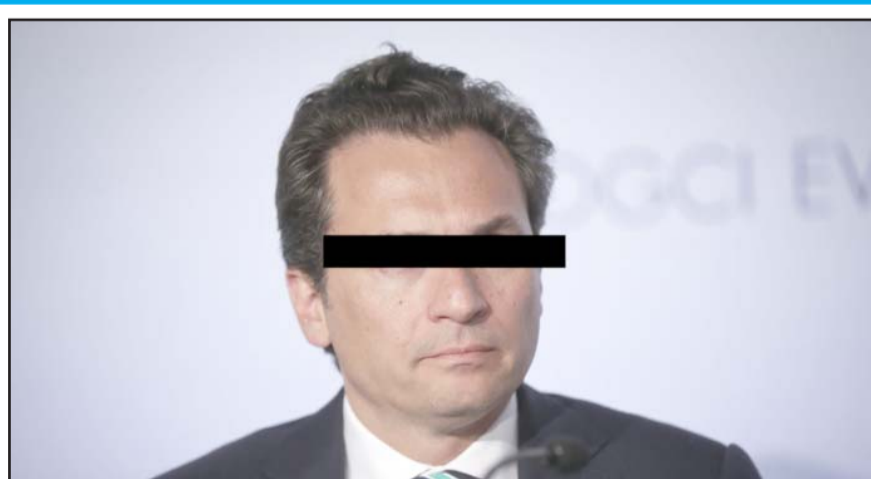
El exfuncionario deberá continuar preso en el Reclusorio Norte