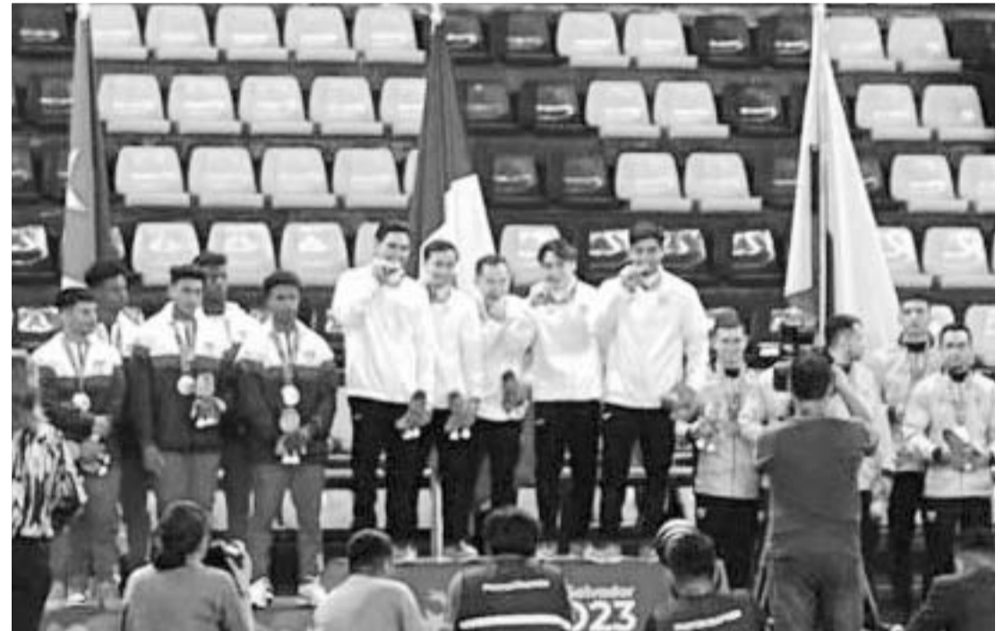
México, en lo más alto del podio.