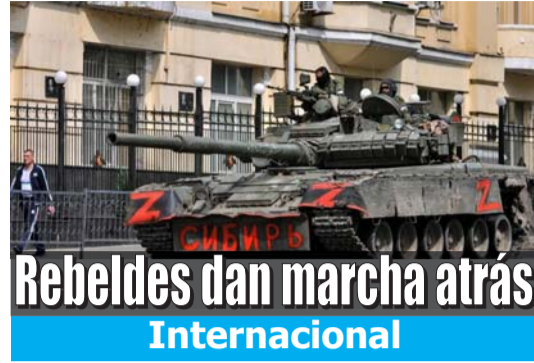
Rebeldes dan marcha atrás