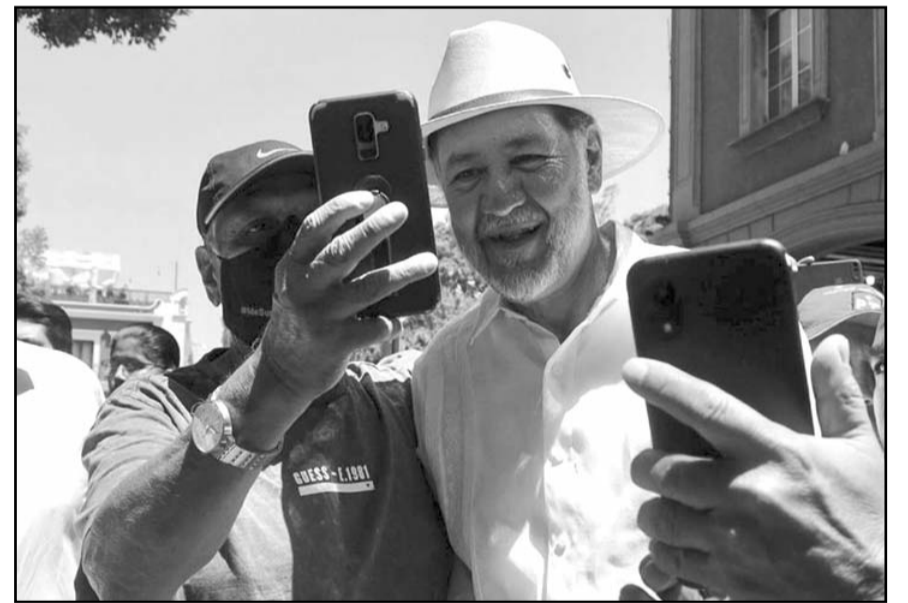
"Yo soy el verdadero tapado", bromeó.

Gerardo Fernández Noroña expresó que Andrés Manuel López Obrador es un líder excepcional y un político fuera de serie por lo que no hay lugar para sembrar duda sobre si el proceso interno de selección de candidato de