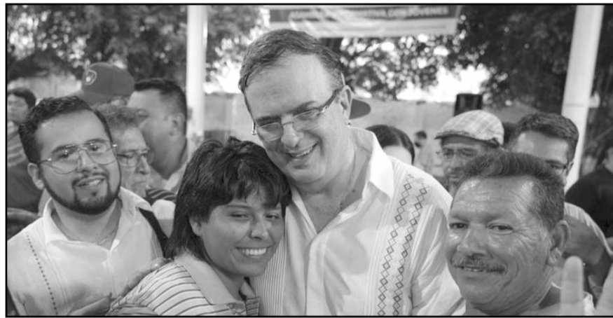
Jóvenes cobijan a Marcelo

Durante el arranque de la Asamblea Informativa, Claudia Sheinbaum aprovechó para recalcar que como muestra de la importancia que tiene la entidad en su trayectoria, decidió pasar este sábado su cumpleaños en este estado, lo que provocó respuesta de los asistentes que de inmediato le cantaron las tradicionales mañanitas.