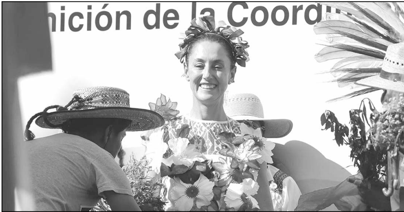
Claudia Sheinbaum aprovechó para recalcar que como muestra de la importancia que tiene la entidad en su trayectoria, decidió pasar este sábado su cumpleaños en este estado

Agregó que "qué sentido tiene un gobierno sino se destina los recursos para reducir las desigualdades, los gob-