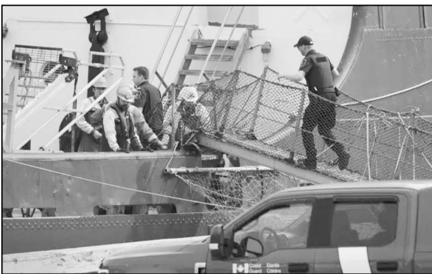
La Junta de Seguridad en el Transporte busca deslindar responsabilidades.

Es probable que una parte clave de cualquier pesquisa sea el propio Titán. Se han planteado dudas sobre si estaba destinado al desastre debido a su diseño poco convencional y la negativa de su creador a someterlo a controles independientes que son estándar en la industria.