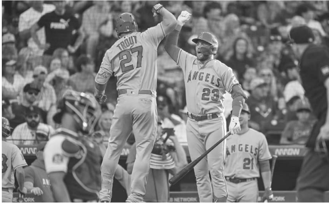
Los Angelinos propinaron la paliza de su vida.