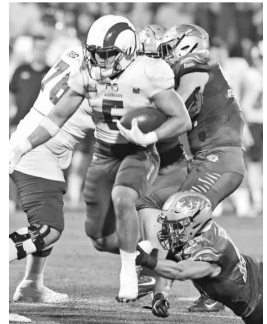
Los regios se internacionalizarían.

Este jugador logró triunfar en el basquetbol colegial de la NCAA, pero ahora llega a unos San Antonio Spurs que están ávidos de éxito tras no llegar a los playoffs en la temporada anterior.