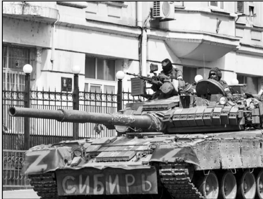
El jefe del grupo Wagner, Yevgeny Prigozhin, partirá a Bielorrusia y se le retirará el caso penal en su contra.

Peskov dijo que los mercenarios de Wagner que deseen firmar un contrato con el Ministerio de Defensa pueden hacerlo, y los combatientes