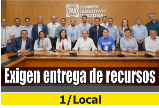
Exigen entrega de recursos