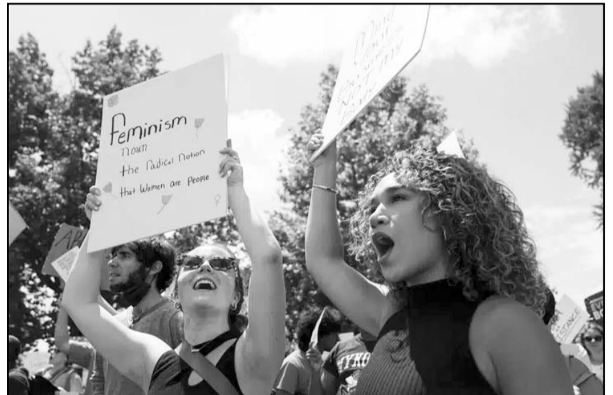
Activistas de ambos lados protestaron o celebraron el fallo de la Suprema Corte que anula el derecho a la interrupción del embarazo.

Pero la verdadera batalla se dará por el segundo lugar para el eventual balotaje del 20 de agosto. El diplomático Edmond Mulet se enfrenta a la ultracconservadora Zury Ríos Sosa, hija del fallecido dictador Efraín Ríos Montt.