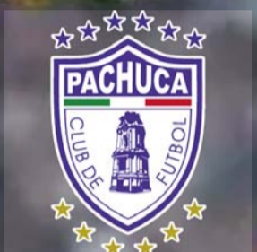
Los felinos son los campeones más recientes.