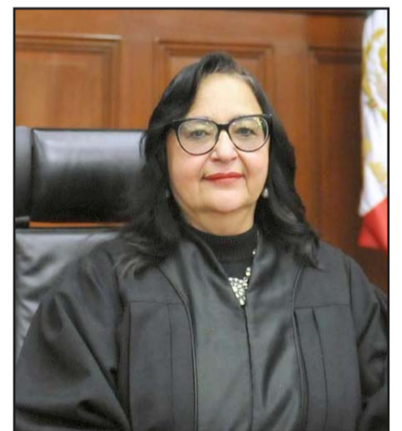
Ministra Norma Lucía Piña

Piña Hernández aseguró que el Poder Judicial de la Federación trabajará hasta lograr que el orgullo y la vida de la diversidad sexual y de género sea motivo de alegría todos los días de su vida.