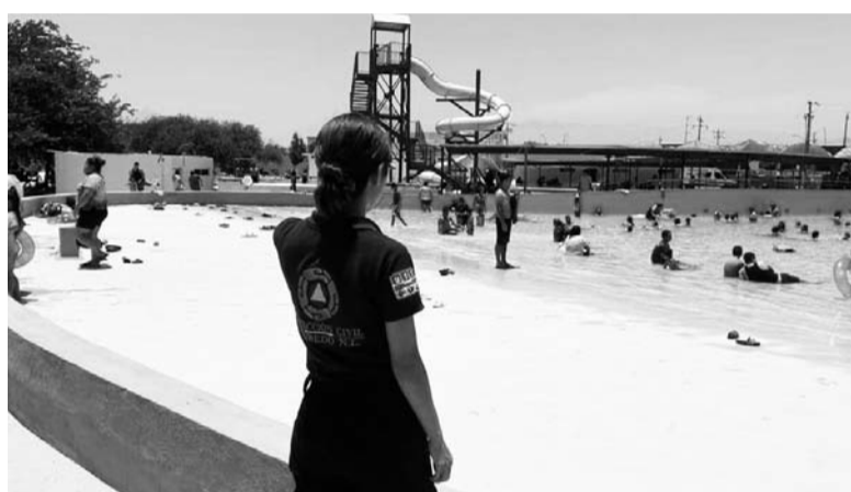
Eso fue durante el día en que se reabrió el lugar.

Per si los números reportados por Salud estatal de Nuevo León son reales, ¿de dónde sacó la autoridad federal sus cuentas?