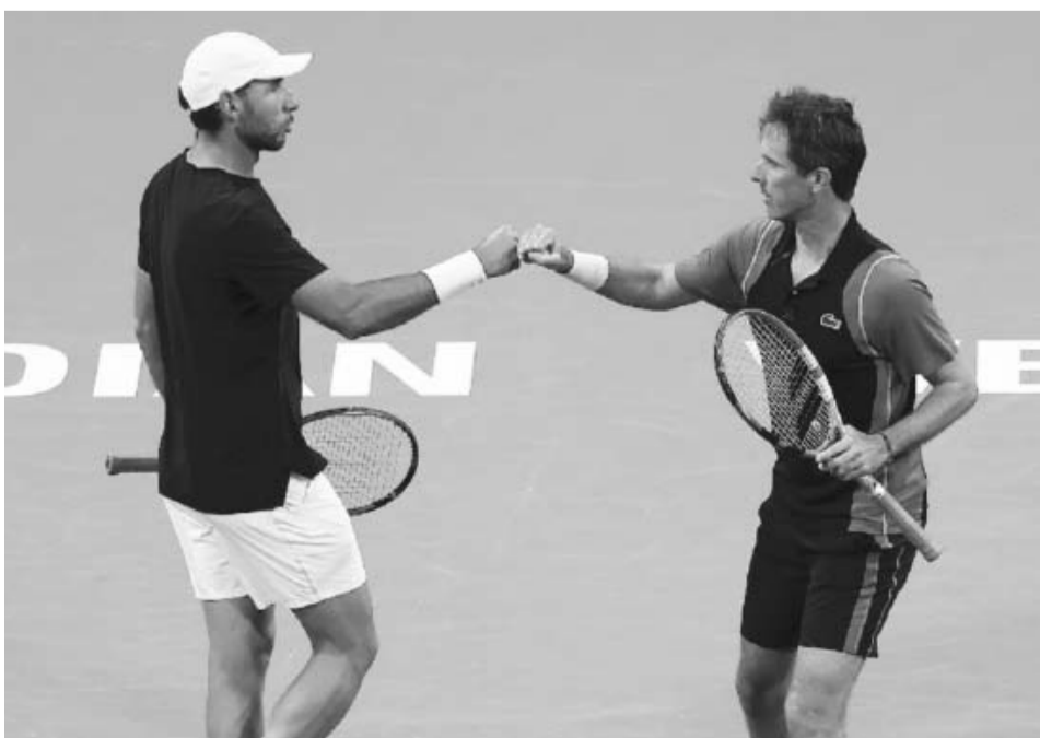
El mexicano tuvo una buena tarde ayer.