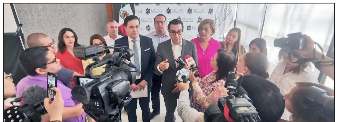
El objetivo es modificar el artículo 159 correspondiente del proceso de selección del titular de la Fiscalía.

Dejó en claro que esto lo hace el Ejecutivo estatal porque pretende seguir con la persecución política que ha emprendido contra diputados y personajes de otros partidos.