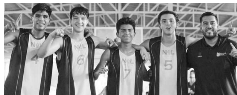
Un oro, una plata y un bronce se logró ayer.