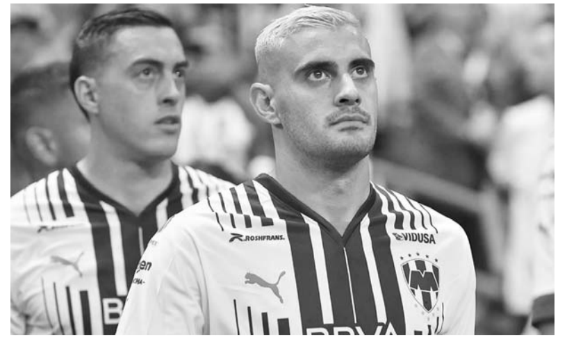
Funes Mori y Berterame irían de arranque.

"La selección mexicana pasa por un momento complicado y le deseo la mejor de las suertes a Jaime (Lozano) en el Tricolor", expuso. (AC)