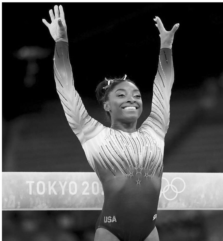
Simone Biles, multimeditallista en los dos últimos Juegos Olímpicos.

El 'US Classic' reúne a la elite de las gimnastas estadounidenses y sirve como evento clasificatorio para los Campeonatos de Gimnasia de Estados Unidos, previstos del 24 al 27 de agosto en San José (California).