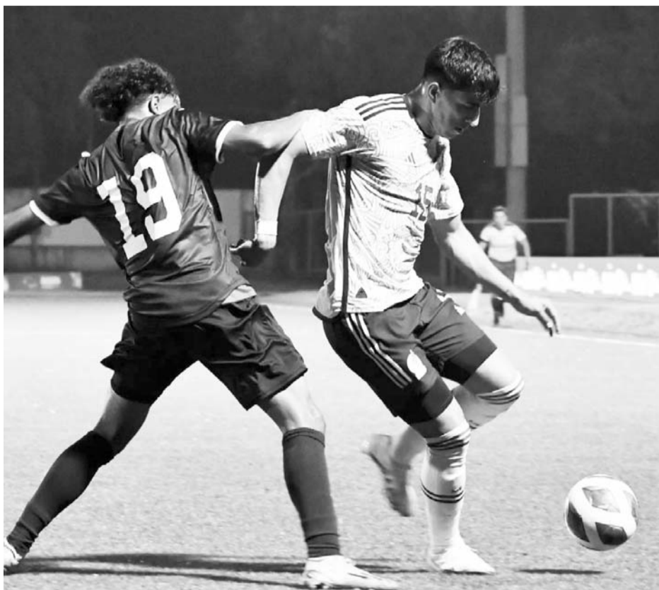
México venció 2-0 a República Dominicana.