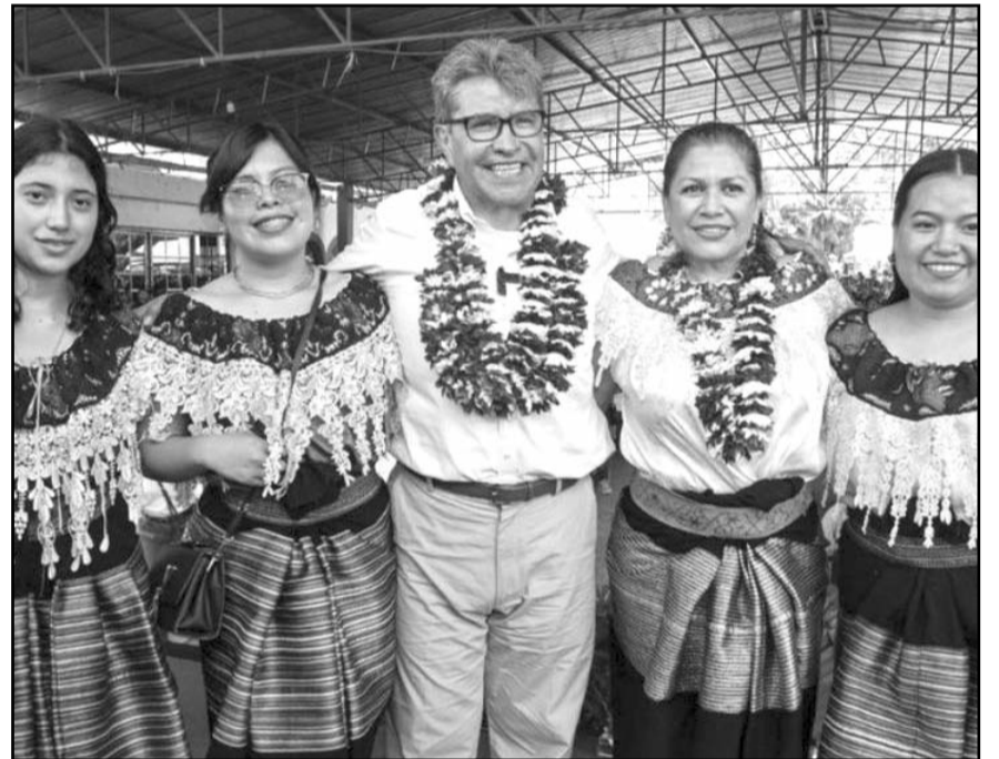
"En una competencia y en una contienda de esta naturaleza es la gente la que decide".

"Faltaban seis meses, y cuando nos cambiamos, que mi esposa empezamos