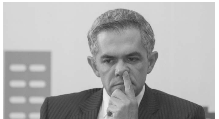
Miguel Ángel Mancera reiteró que no se bajará de la contienda por la candidatura presidencial del Frente Amplio por México.

¿Miguel Ángel Mancera no se baja?, se cuestionó. "No, no me bajo", subrayó.