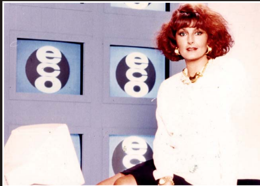
La Dama del Buen Decir tuvo una longeva carrera en televisión y radio.

En los últimos años algunas enfermedades