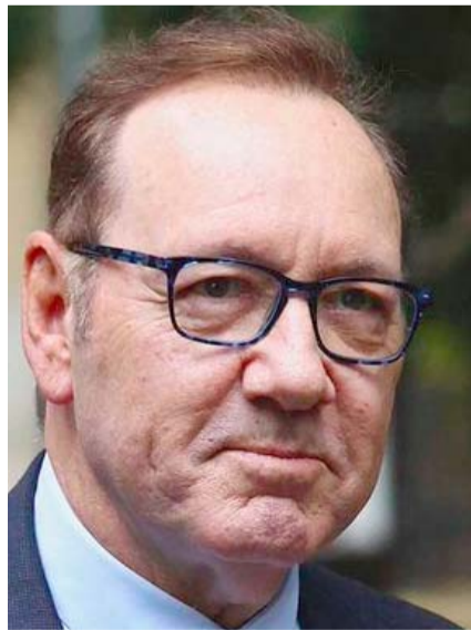
Los hechos habrían sucedido cuando fue director de teatro en GB.