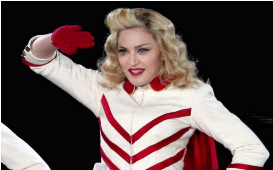
Trascendió que a la cantante le fue retirado el tubo de ventilación.