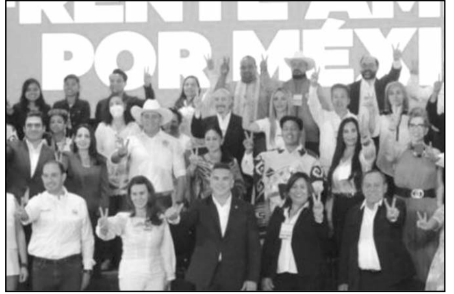
La instalación se realizará este jueves 29 de junio a la 13:00 horas, en un hotel ubicado al centro de la Ciudad de México.

Por lo que reiteró que es "tiempo de mujeres", al señalar que es la única mujer que está participando por la coordinación de la defensa de la transformación por lo que seguirá recorrido el país, "no nos vamos a cansar de luchar, y vamos a seguir caminando el país porque lo que no puede permitir Guerrero es regresar al pasado".