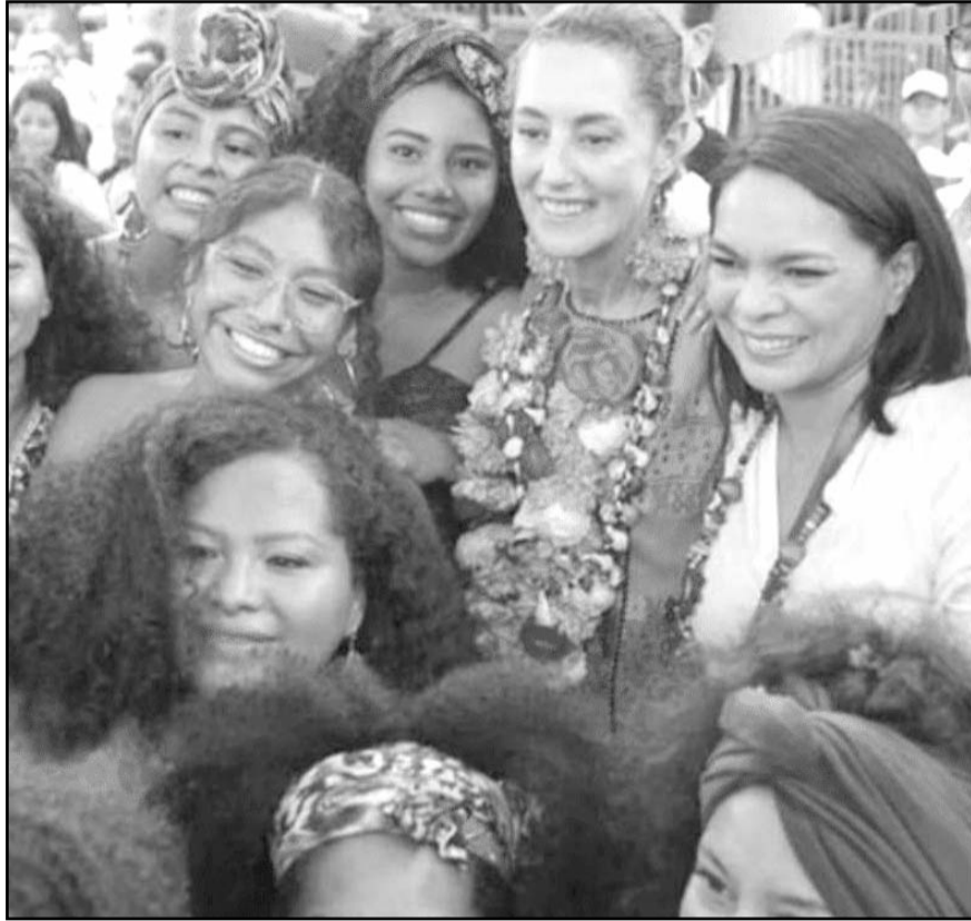
Claudia Sheinbaum señaló que las mujeres pueden ser lo que quieran pues es "tiempo de mujeres".