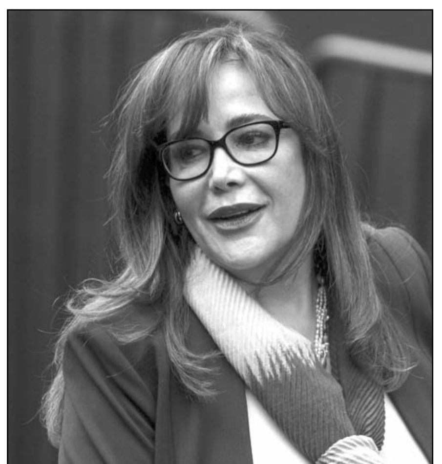
Se determinó reencauzar la demanda a la Comisión de Honestidad y Justicia de Morena, para que resuelva el asunto.

Yeidckol Polevnsky señaló su intención de buscar la candidatura del partido, pero se le negó el registro al no estar entre los nombres acordados por el partido.