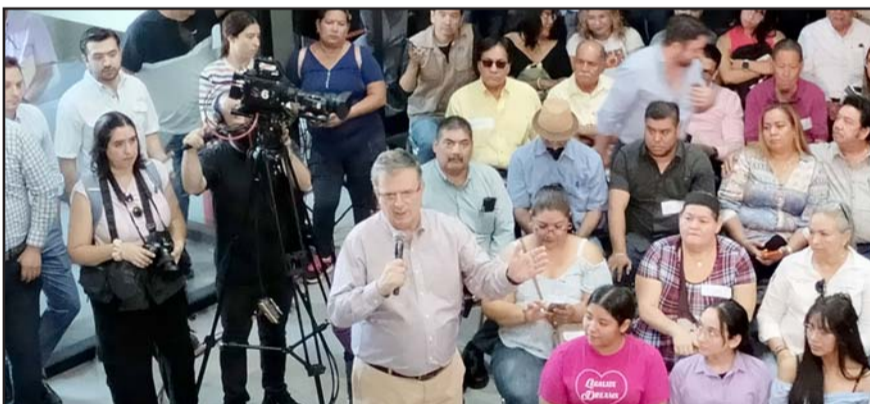
El aspirante a la presidencia estuvo ayer en la ciudad y tuvo varios eventos.