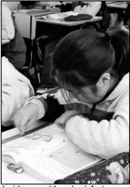
La idea es cuidar a los infantes