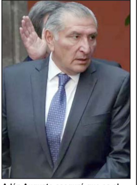
Adán Augusto aseguró que es el único que ha sido transparente.

En rueda de prensa posterior a un encuentro con unos 180 simpatizantes reunidos en el salón Mitsubishi del Parque Fundidora, Ebrard comentó lo anterior cuestionado sobre la presentación del informe de gastos presentado por el extitular de Gobernación, quien aseveró que ha gastado poco más de 300 mil pesos, ante lo cual excanciller replicó a quien le formuló la pregunta "¿Y tú le crees?".