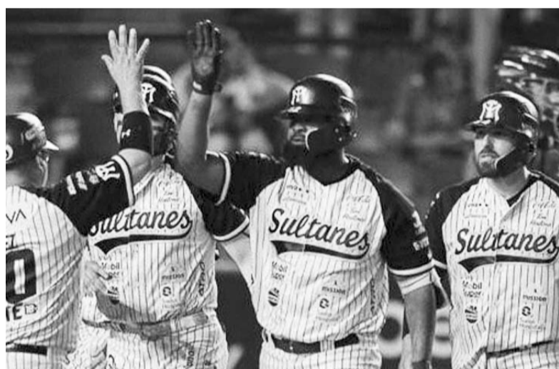
Los Fantomas Grises empataron la serie a los Generales.

Ahora esa cifra de dinero la podría seguir ganando para la temporada 2024-2025, ya sea con los Lakers u otra franquicia, pero mientras seguirá teniendo un sueldo no tan alto en el conjunto angelino para la temporada entrante.