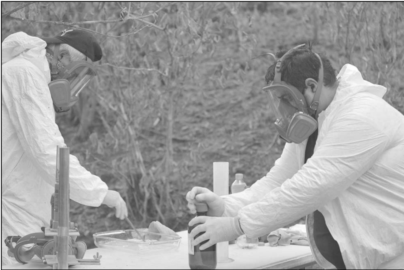
México tiene un papel importante para todas las drogas que se trafican a EU, considerado el mercado más grande de consumo de estupefacientes.

"Las drogas sintéticas pueden reemplazar a algunas drogas naturales y debemos tener en cuenta que en un