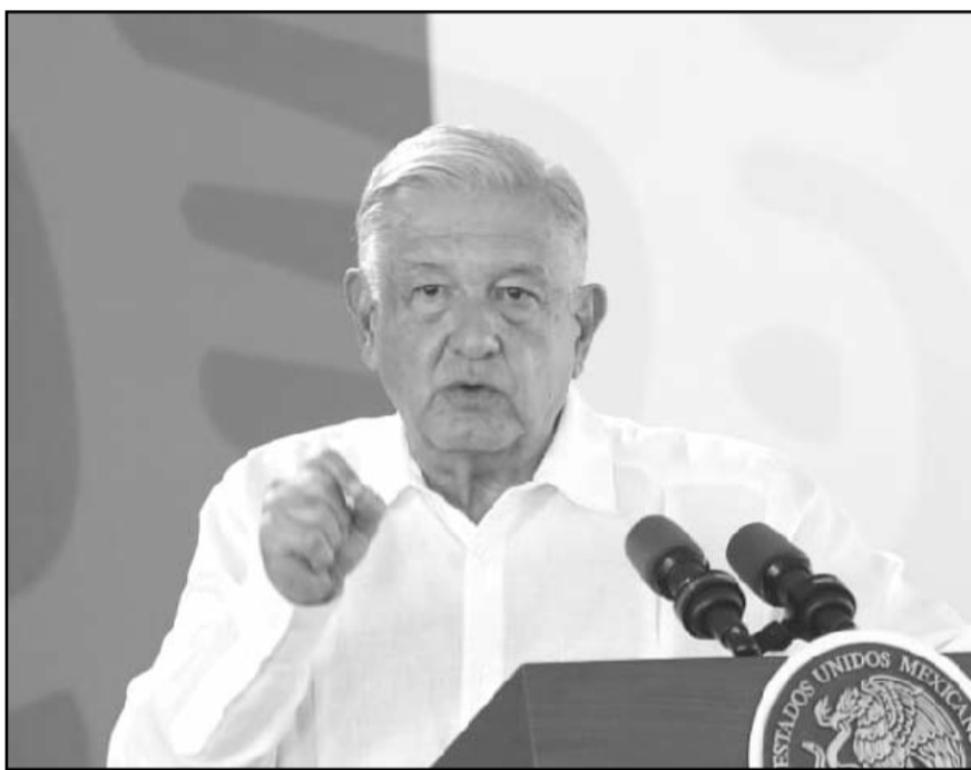
"Que ellos tomen la iniciativa y que abandonen la actividad ilícita, y que no sigan dañando, pero nosotros no tenemos contemplado ningún acuerdo".

"No estoy seguro si ha llegado a América del Norte, pero en los mercados ilegales de América del Sur sí hemos visto", apuntó.