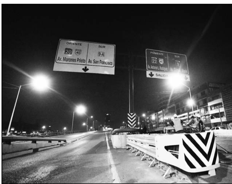
Es parte de las acciones para la seguridad vial de los regiomontanos.

Las acciones en esta ocasión se enfocaron en avenidas como Constitución, en la división de los ramales hacia Antonio L. Rodríguez y San Jerónimo; en Morones Prieto, para acceder a Cuauhtémoc y varios más.