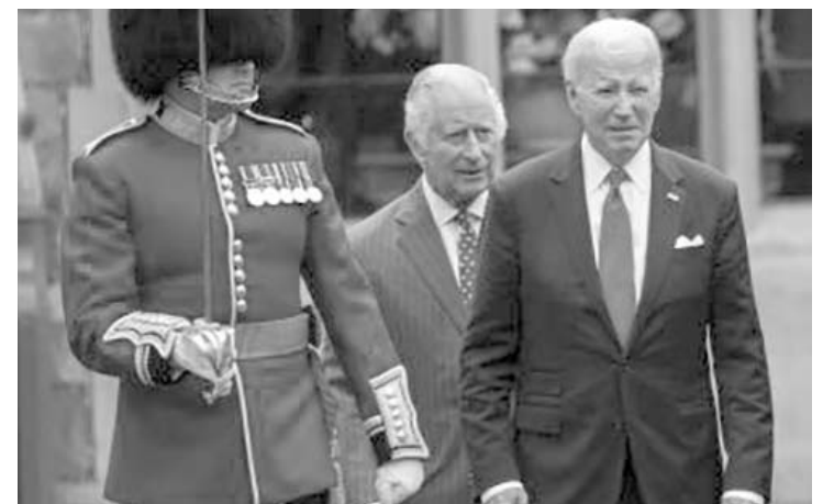
También se reunió con el Primer Ministro, Rishi Sunak.

importancia de ayudar a Ucrania para conseguir una paz justa y duradera, añadió la residencia oficial en un comunicado divulgado hoy.