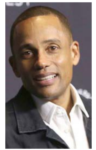
Asegura que no es político de carrera.

El aspirante al senador de Estados Unidos representando a Michigan, expuso que "yo creo que en este momento los