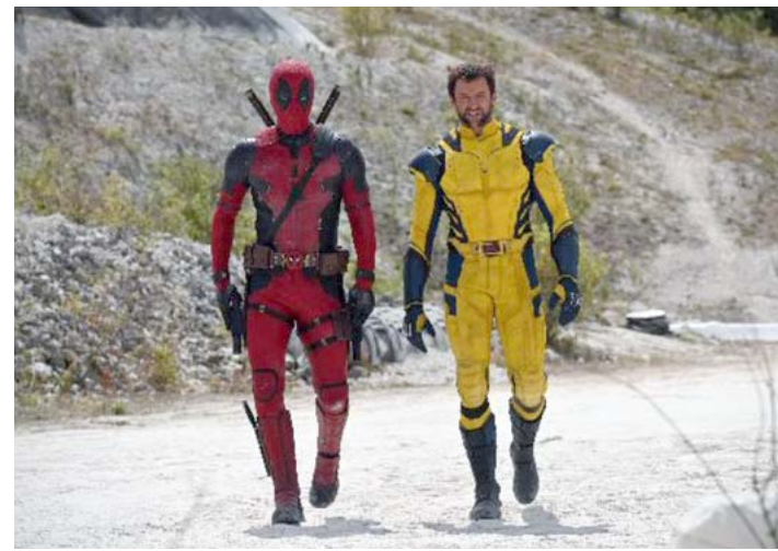
Aún no se sabe si Jackman aparecerá en toda la cinta, o sólo en una escena de la tan esperada entrega de Deadpool 3.

El estreno exclusivo en cines de "Deadpool 3" está programado para el 3 de mayo de 2024. Los fans están emocionados por la posibilidad de ver nuevamente a Hugh Jackman en el traje de Wolverine, un personaje que se convirtió en un ícono del cine de superhéroes gracias a su interpretación.