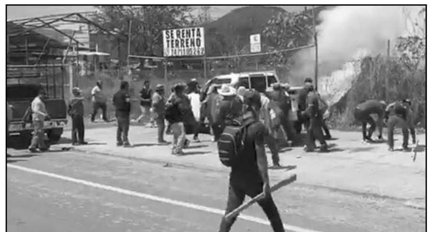
Los hechos violentos que se registraron en Chilpancingo, Guerrero, atentan contra la paz, estabilidad social y seguridad.

La Coparmex pidió luchar contra la violencia, inseguridad e impunidad porque se afecta la convivencia social, la inversión y el desarrollo.