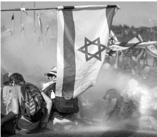
Rechazan la forma arbitraria de elegir a los jueces.

Una amplia franja de la sociedad israelí, incluidos oficiales militares de reserva, líderes empresariales, LGBTQ+ y otros grupos minoritarios, se han unido a las protestas.