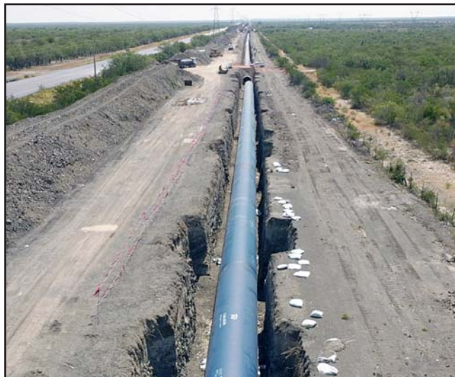
A unas semanas de iniciar operaciones, la construcción avanza en tiempo y forma.