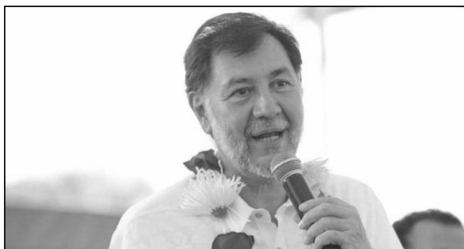
Fernández Noroña señaló que tiene desglosadas sus cuentas, y dijo que es incongruente que él y Monreal tengan más gastos que el resto de los aspirantes