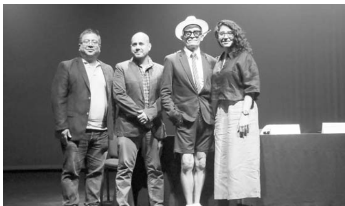
Presentarán "Los sueños se tejen entre sí 40 aniversario", el jueves 13, en el Teatro del Centro de las Artes.

están: "Time Life", 1996; "Andy on canavas", 2004, "Transición", 1999; "Sueño", 1992; "El peso de una imagen que golpea", 1992; "Fractura", 1994; "Me quiero morir", 2021 y "Elementales y El tenista, El beisbolista y El boxeador", de 2023.