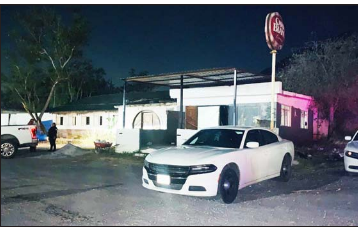
Uno de los vehículos tiene reporte de robo.