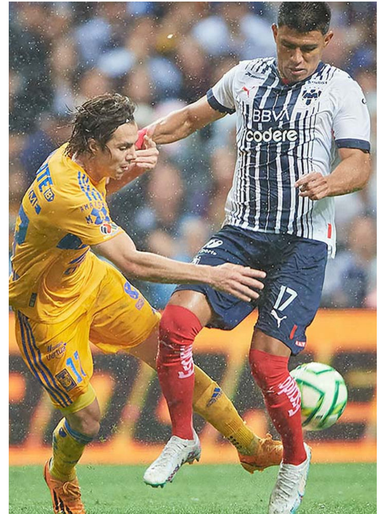
Monterrey y Tigres deleitarán a sus seguidores en EUA.

Ahora Tigres Femenil volverá a la actividad cuando en la jornada uno del Torneo Apertura 2023 de la Liga MX puedan enfrentar en casa al cuadro del Puebla, siendo eso el próximo lunes 17 de julio.