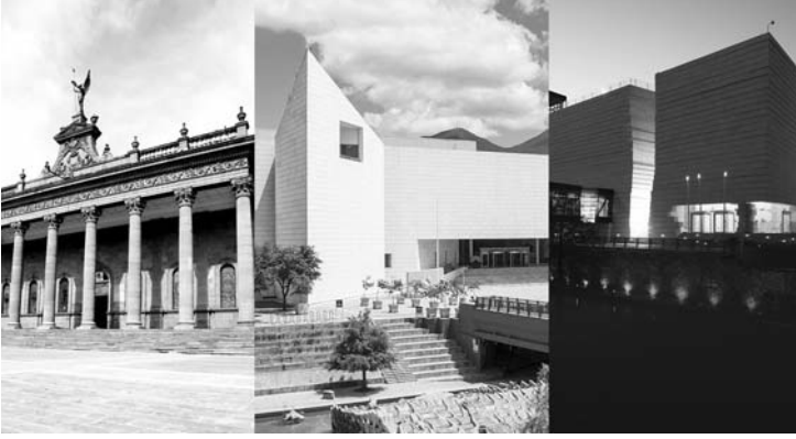
Invitan a la sociedad a aprovechar los espacios museísticos, danza, teatro y música.