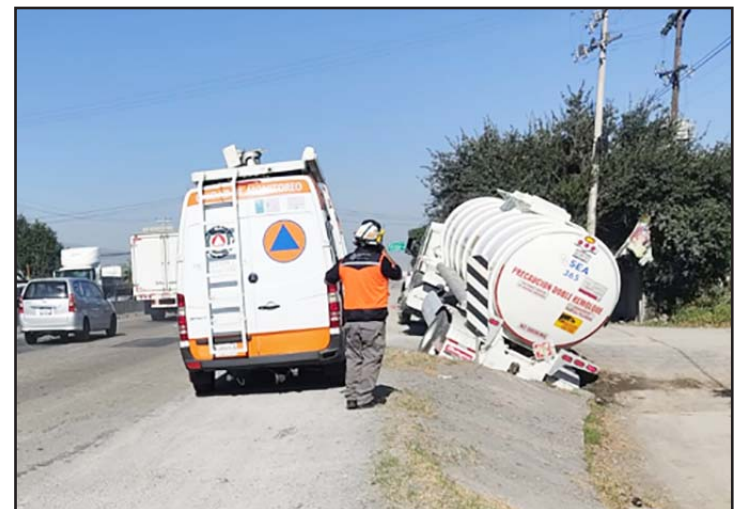
Transportaba 30 mil litros de diésel.

Guardia Nacional, que retiró un vehículo auto tanque blanco Kenworth con placas del Servicio Público Federal 229 DN 5.