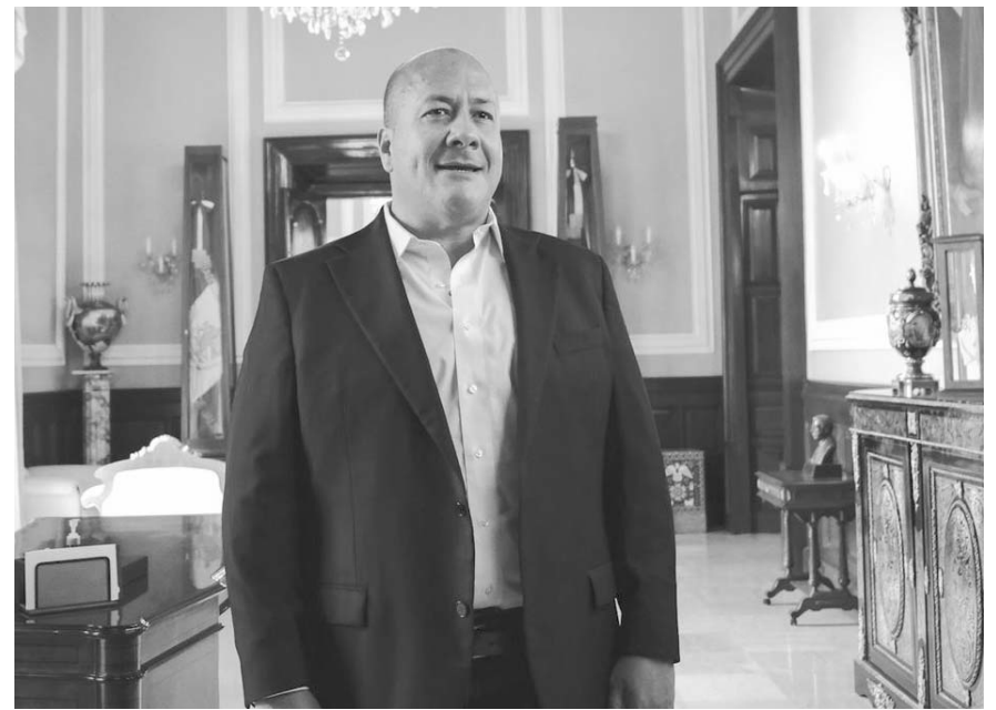
El gobernador expuso que su decisión está tomada y se retirará por completo de la política al terminar su mandato

Señaló que expresar abiertamente su postura y diferir con Delgado