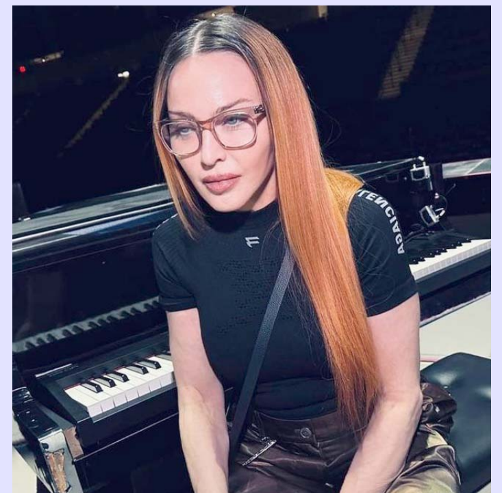
La reina del Pop se sigue recuperando en casa, a fin de poder retomar su "Celebration Tour".

Por su enfermedad, Madonna tuvo que posponer su Celebration Tour, el cual empezaría el próximo 25 de julio en Vancouver, Canadá.