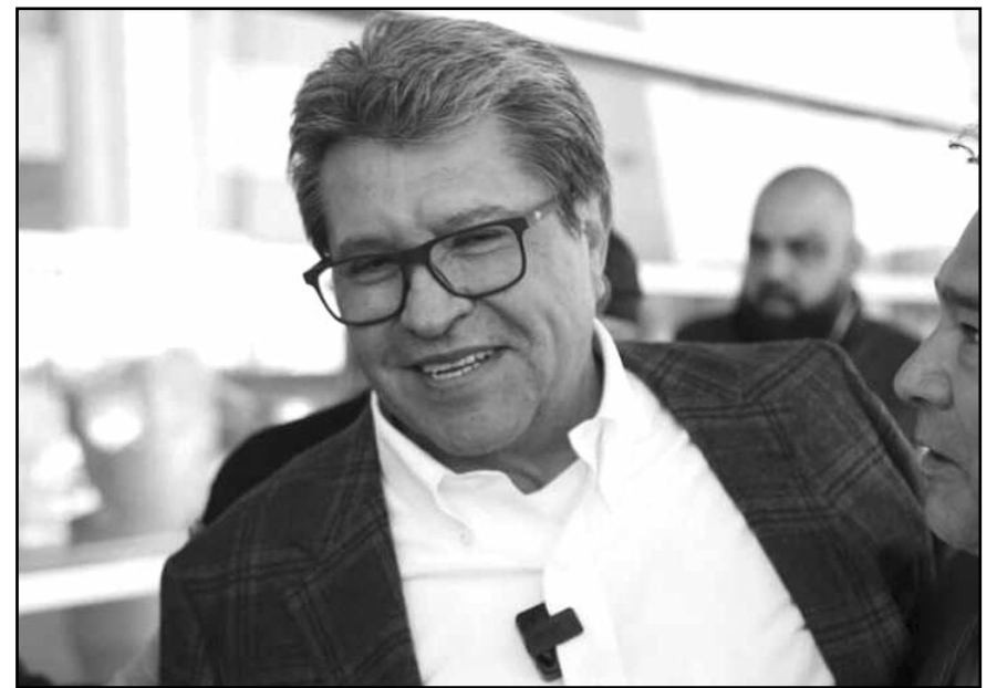
"Soy el más preparado y tengo una experiencia acumulada que representa al país"

En total, Monreal informó que ha gastado un millón 65 mil 833.20 pesos, de los 5 millones que corresponden al límite de gastos que definió el partido para cada aspirante.