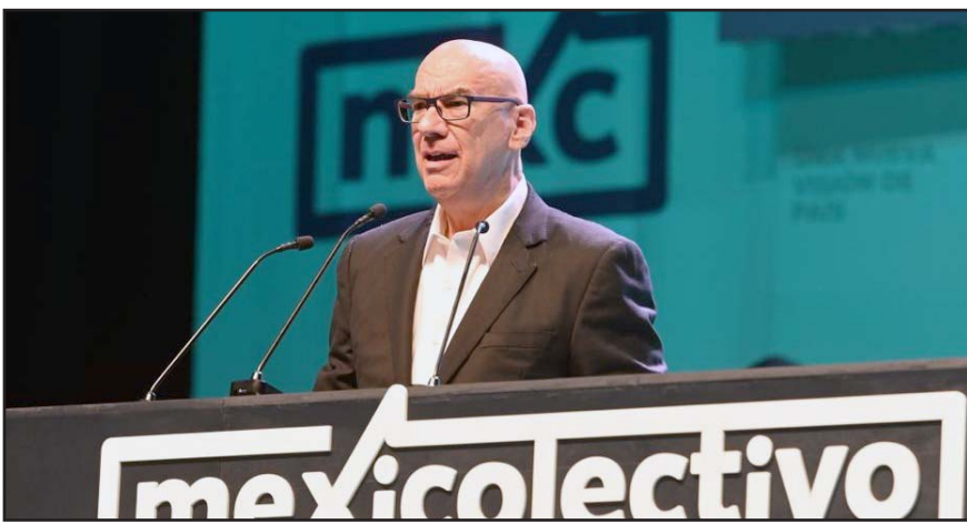
Durante presentación en Mexicolectivo, el dirigente de Movimiento Ciudadano recalcó que el país requiere 'opciones políticas nuevas'.

Al término de la presentación de la lista de los aspirantes que pasaron a la siguiente etapa, dijo que aún se encuentran el diseño del foro y todavía no está definido, pero que no será acartonado.