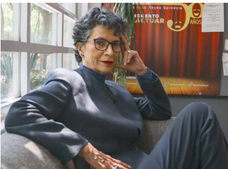
"Vivo como me soñé, siempre quise dar clases, vivir de mi trabajo y lo hago, tener una pareja, tenemos 30 años juntos".

De acuerdo con OCESA, las fechas de los conciertos de la cantante eran el 25 y 27 y 28, por lo tanto, si alcanza a recuperarse es posible que puedan llevarse a cabo después de todo. Por lo pronto, a esperar.