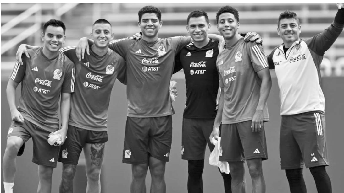
Mañana buscará la Selección su pase a la final en la Copa Oro.

La Selección Mexicana de Fútbol que dirige Jaime Lozano ya empezó con su enfoque en la semifinal de la Copa Oro que será en las Vegas y en Jamaica.