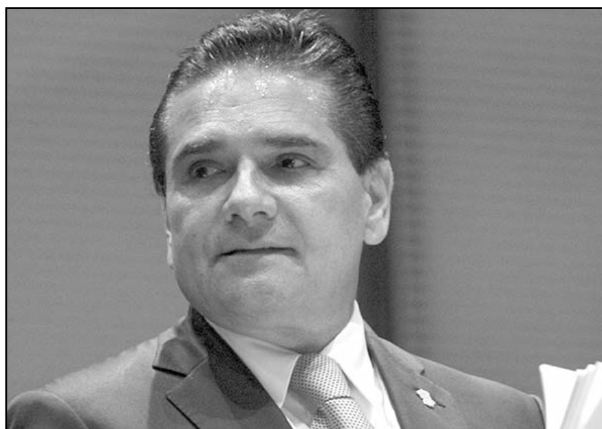
Se percibe una clara tolerancia y complicidad del estado hacia la actuación de los grupos delictivos que controlan el 80 % del territorio nacional, por lo que existe el riesgo de que estos pretendan "meter su cuchara".