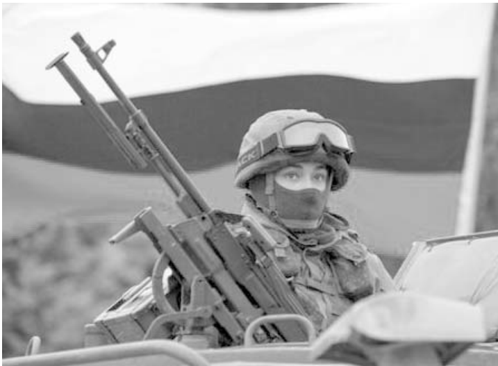
Las cifras son conservadoras ya que ninguno de los frentes actualiza sus bajas.