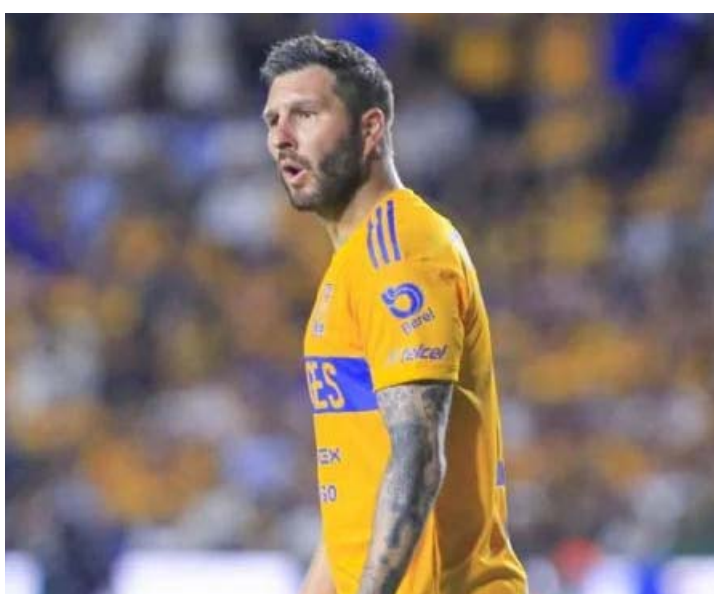
El francés aún no se recupera al cien.

Cabe señalar que años atrás ya han habido Clásicos Regios en los Estados Unidos y esos fueron en la Interliga, teniendo Tigres un saldo favorable de dos victorias y un empate sobre Rayados de Monterrey.