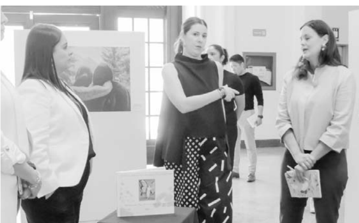
Se plasma la lucha diaria de quienes buscan cruzar la frontera.

La exposición plantea un acercamiento a la lucha diaria en donde una botella de agua, un mapa, un diccionario o una muñeca de plástico significan un día más de vida.