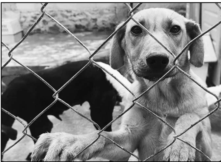
Hubo cambios a la Ley de Protección de Bienestar Animal