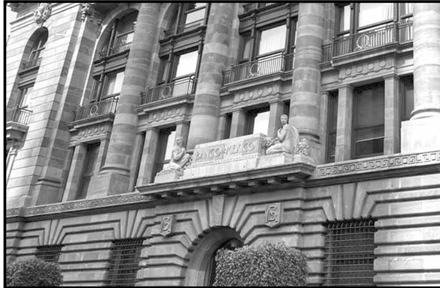
La mayoría están explorando esta opción conocida por sus siglas en inglés como CBDC.

En el documento que dio a conocer este lunes el llamado banco de los bancos centrales en el mundo, resume lo que encontró en la última encuesta