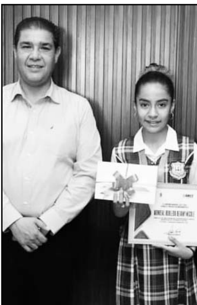
Los otorgó personalmente.

Así es que, en aras de fomentar cada vez más una sana educación desde lo local, el Ayuntamiento de Juárez comenzó con la entrega de iPad como de computadoras a los chicos y chicas que se esmeran en mejorar sus calificaciones.