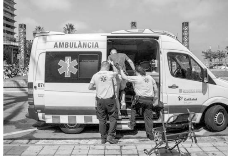
Francia tiene el menor número de casos.

Sin las medidas de prevención adecuadas, “esperaríamos una carga de mortalidad relacionada con el calor de 68 mil 116 muertes en promedio cada verano para el año 2030”, dijeron los autores. Pronosticaron que la cifra aumentaría a más de 94 mil para 2040 y más de 120.000 para mediados de siglo.