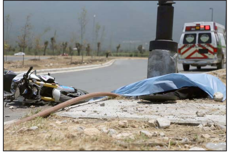
Los hechos ocurrieron en la Avenida Paseo de los Leones.

Hasta anoche las autoridades investigadoras no habían proporcionado más información sobre el ataque a balazos.