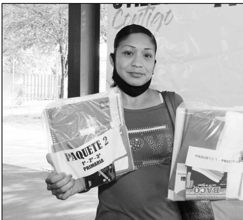
Los padres de familia ya empezaron a recoger los paquetes.

Garza Villarreal puso a disposición de los ciudadanos un teléfono, para cualquier duda o aclaración 8113252827, donde mediante un mensaje de WhatsApp, podrán resolver sus inquietudes.(ATT)