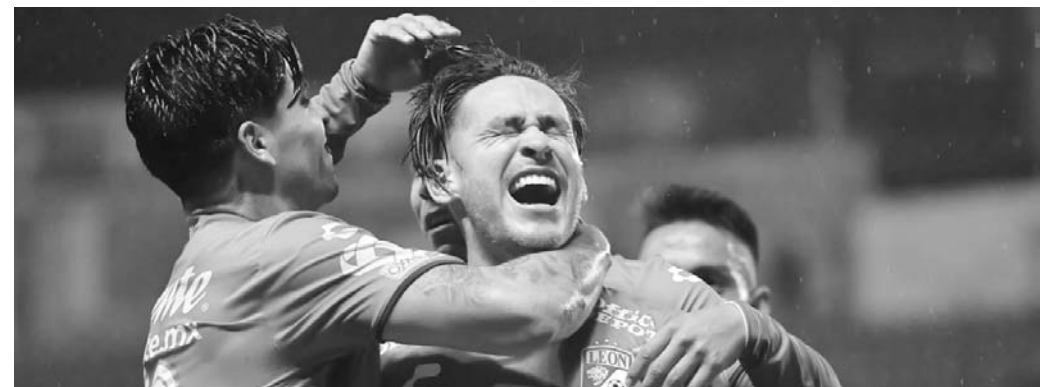
León se despachó con la cuchara grande.