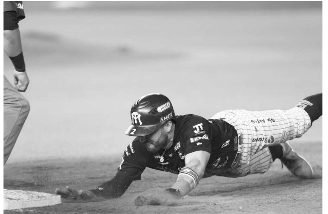
Sultanes tendrá una complicada serie ante Tecos.

Tecolotes, por su parte, cuenta con un récord ganador de 35 victorias por 29 derrotas, aspecto por el cual serán un duro rival de estos Sultanes de Monterrey, equipo que viene de tres series con récord perdedor y conjunto que buscará salir de ese bache durante este martes de beisbol. (AC)