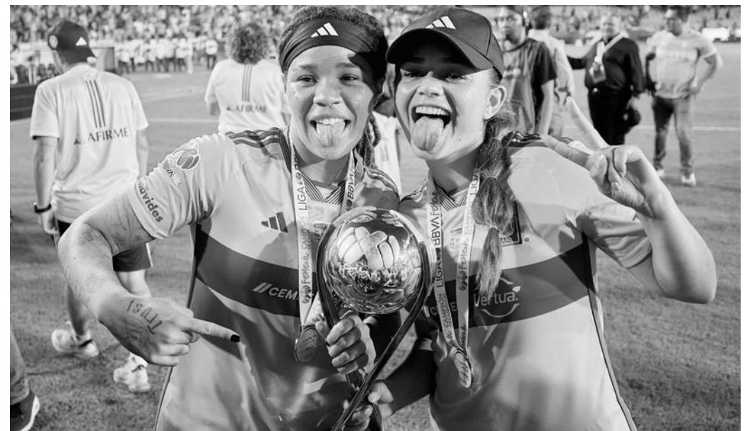
Tigres se coronó ayer ante América, y quieren más.

"Cuando las conoces te digo que es hasta