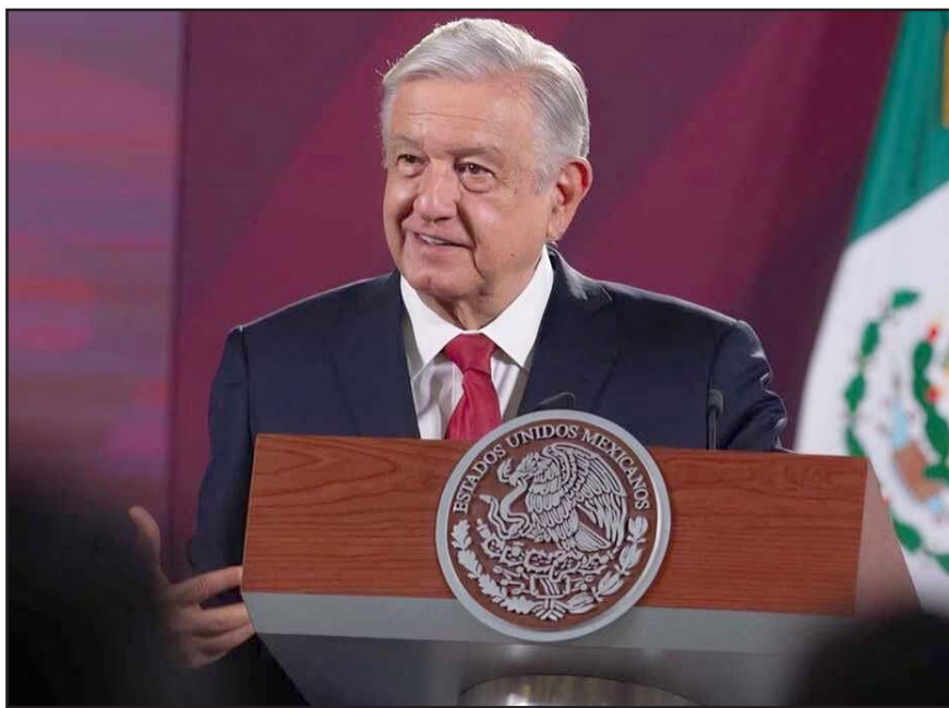
El mandatario reiteró que el pueblo decidirá 'a quién le dará la estafeta'.

"Va a depender de los resultados, hay que esperarlos y la verdad es que todos los que están participando son gentes con mucha experiencia en la administración pública, en la política, en la buena política, son honestos y aquí tienen las puertas abiertas, nunca se les ha cerrado las puertas, pero va a depender de ellos, y de los resultados del proceso de cómo decida la gente