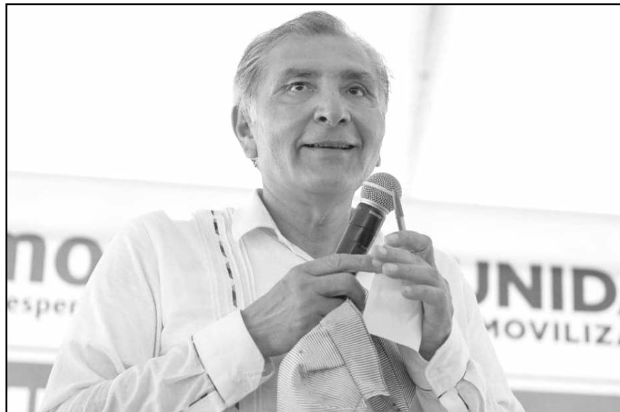
El exsecretario de Gobernación prometió que en la próxima administración se hará todo para que Guerrero salga adelante.

Ante cerca de 4 mil asistentes a la asamblea informativa, el exsecretario de Gobernación prometió que en la próxima administración se hará todo para que Guerrero salga adelante.