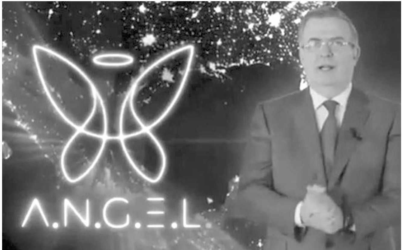
Ebrard indicó que el plan lo creó a partir de sus recorridos en distintos países cuando fue canciller

También, reconocimiento morfológico de delincuentes por la forma de caminar, pues se podrían evitar homicidios y feminicidios, rastreadores de vehículos, drones que marcan y siguen a criminales. Además, cámaras inteligentes para la Guardia Nacional, así como crear un ecosistema con base de datos con inteligencia artificial, "una macroaplicación para conectar las base de datos de todos los estados".