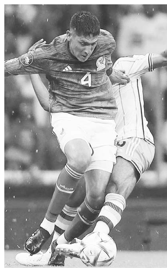
Jamaica buscará frenar al Tricolor.

Ya siendo más generales en esta tema de la semifinal, el Tri ha llegado a esta instancia de la Copa Oro en un total de 13 ocasiones, avanzando a la final en 10 de ellas y siendo eliminado en otras tres; una de esas frente a Jamaica y en el verano del 2017, hace seis años.