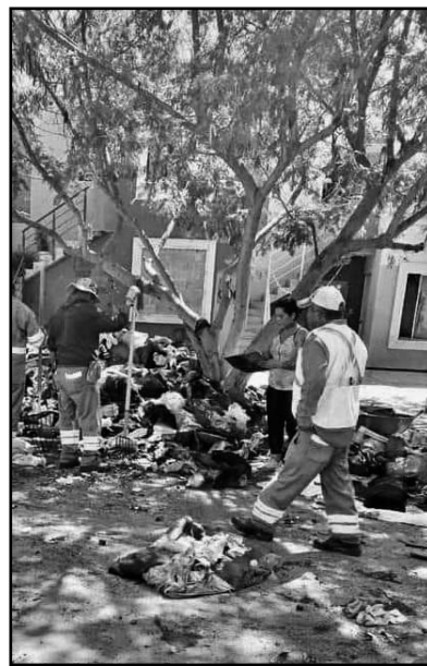
Aprovecharon las vacaciones.

Además, el personal trabajó en la limpieza de casas abandonadas y el retiro de escombros de diferentes calles y avenidas de la zona. (AME)