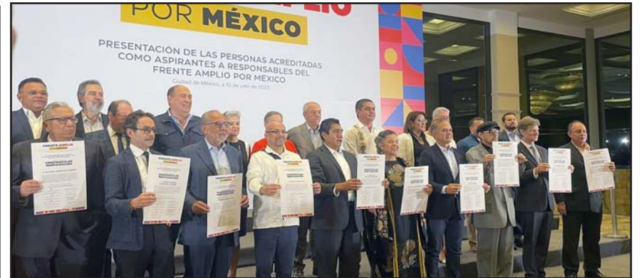
Reciben constancia de aceptación por parte del Comité Organizador.