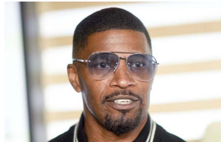
Desde abril, el actor no había interactuado.

"Estoy tan contenta de que Dios haya creído conveniente mantenerme con nosotros, ore por tu recuperación", "mi corazón saltó cuando te vi esta mañana. Ese es el amor de Dios. No te conozco personalmente, pero yo, junto con el mundo ore por tu y sentí alegría y esperanza al verte", fueron algunos comentarios del público.