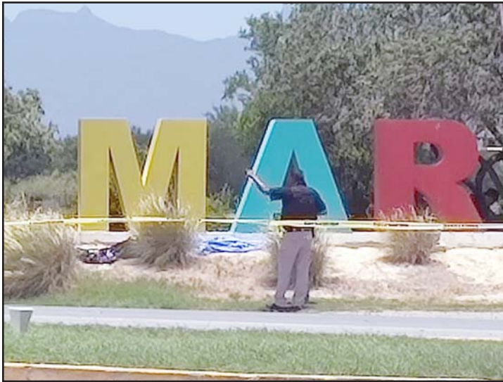
Dejaron la cabeza y las extremidades.

También la Policía encontró un mensaje escrito en un cartoncillo con amenazas, pero no se dio a conocer el contenido.