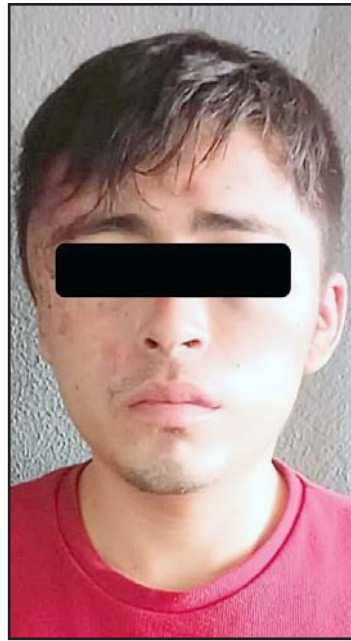
Uno de los detenidos.

La riña fue reportada al 911, y al arribar los oficiales observaron a cuatro hombres discutiendo en la vía pública.