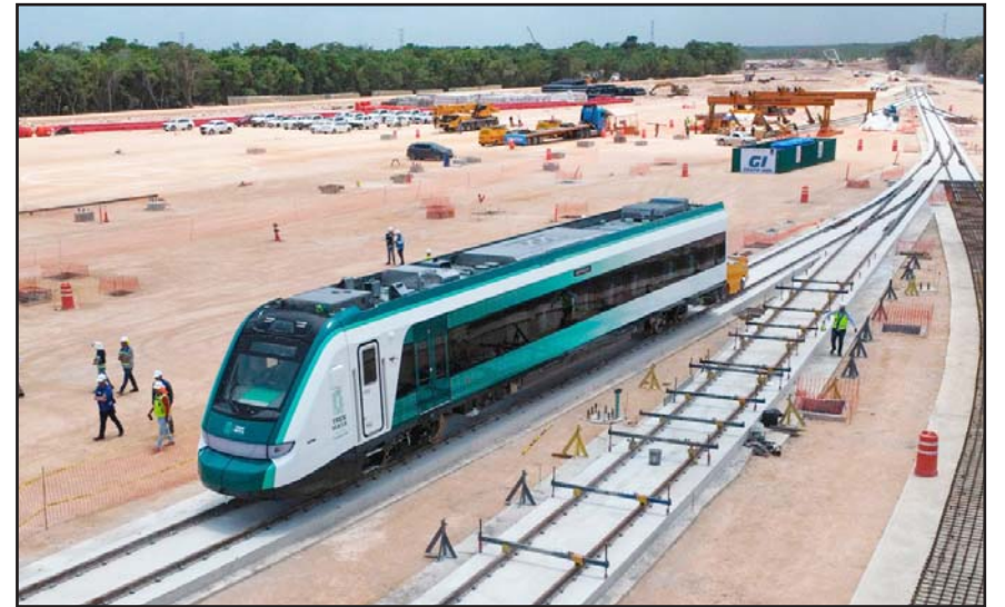
Corresponden a Quintana Roo, Tabasco, Chiapas, Campeche y Yucatán.

El decreto, publicado en el Diario Oficial de la Federación detalla que el monto de indemnización, con base en el valor comercial de la superficie por expropiar es de 72 millones 31 mil 297 pesos con 65 centavos, de acuerdo con