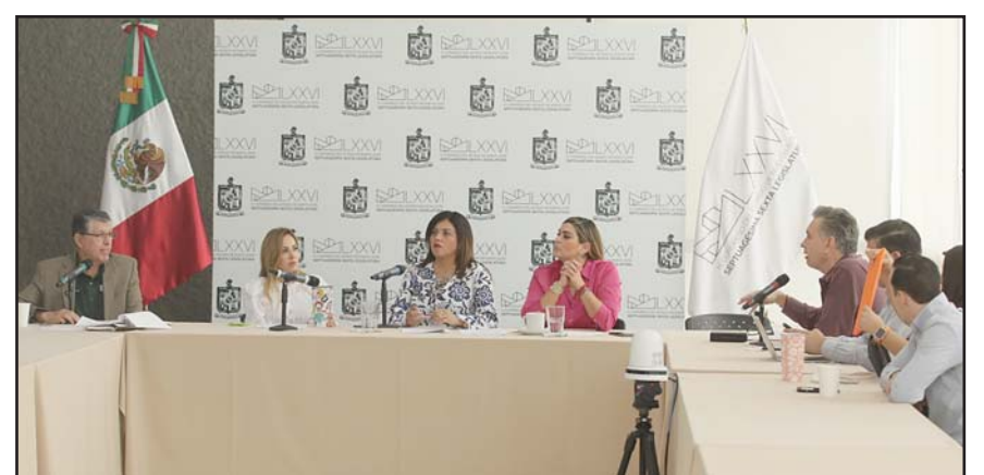
Las organizará el Congreso para analizar el tema junto a especialistas.