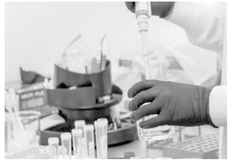
Cualquier persona puede desarrollar la enfermedad.

De acuerdo con el Instituto, la afección aparece unos pocos días o semanas después de los síntomas de una infección viral o bacteriana. No obstante, las causas siguen siendo imprecisas, por ejemplo, puede ser por predisposición genética, así como otras enfermedades.