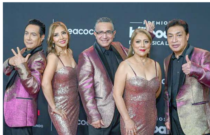
Han llevado los ritmos de la cumbia a otro nivel.

Con sus clásicos de siempre como "El listón de tu pelo" y "Como te voy a olvidar", entre otros, han puesto a bailar a continentes enteros y además han logrado que otras grandes celebridades de la música, incluso los que nunca han cantado cumbia, incursionen en el género. El evento será el 5 de octubre en Florida.