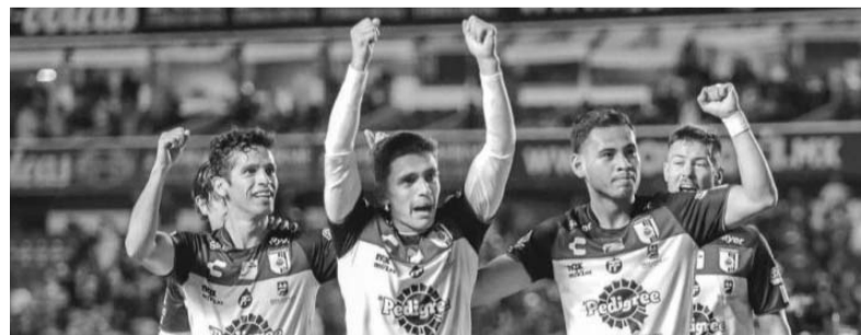
Ambos conjuntos llegan a este duelo en condiciones similares