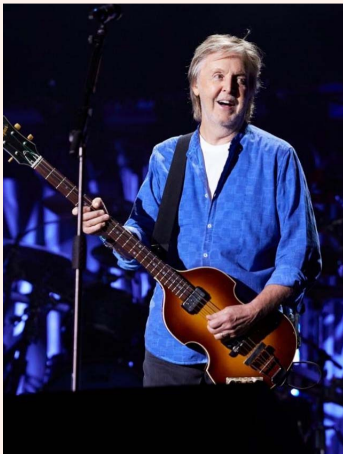
Nadie se quiere perder la experiencia de escuchar a Paul McCartney en su gira "Got Back".

No cabe duda que la emoción se contagia entre los afi-