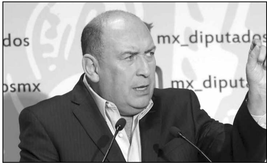
"MC tiene que demostrar si está con México o si es un factor de división"

"Primero, nosotros queremos seguir haciendo equipo y bloque ahí en el Senado de la República para cuidar a México; segundo, nosotros queremos hacer una coalición nacional de cuatro partidos y por supuesto también una coalición local en donde sea conveniente sumar a los cuatro partidos particularmente Jalisco".