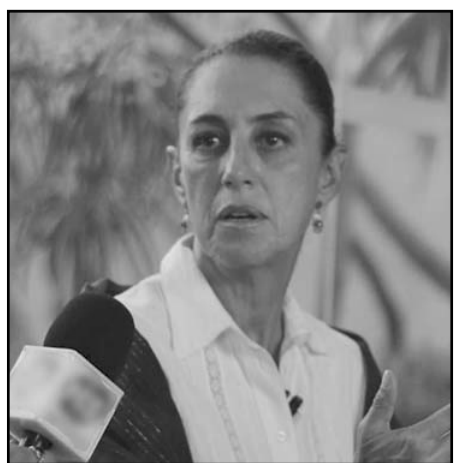
Sheinbaum usó sus redes sociales

En ese sentido, Sheinbaum Pardo mencionó que, junto su equipo de trabajo, han sentido extraño estos días ya que durante