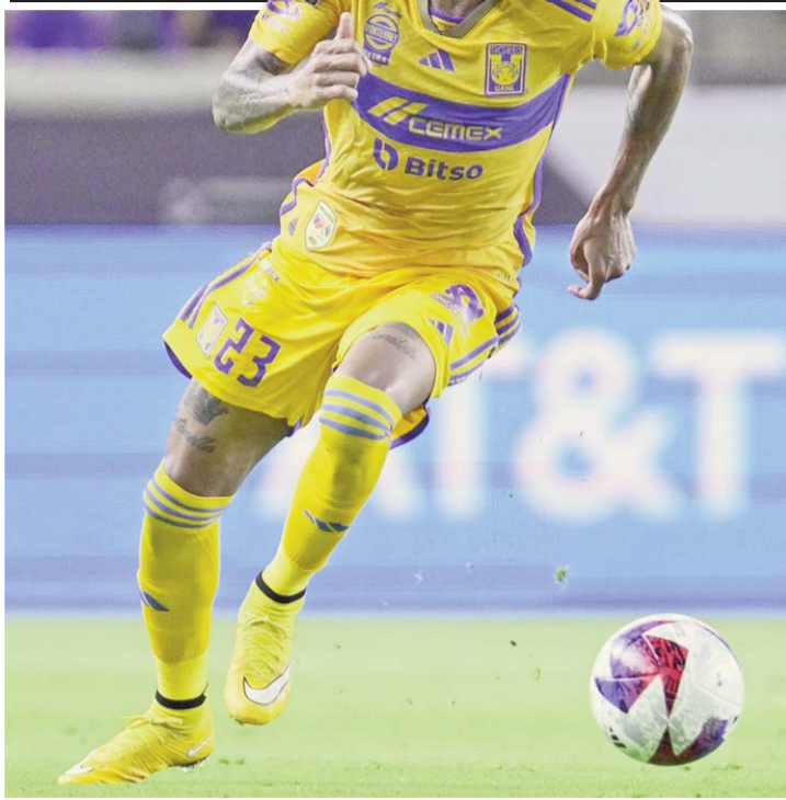
Los Albiazules quieren regresar a la victoria.

MONTERREY, N.L., MIÉRCOLES 30 DE AGOSTO DE 2023