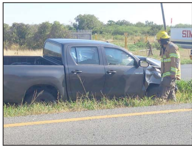
El conductor resultó con lesiones.

Después de desestabilizarse terminó perdiendo el control del volante y volcó