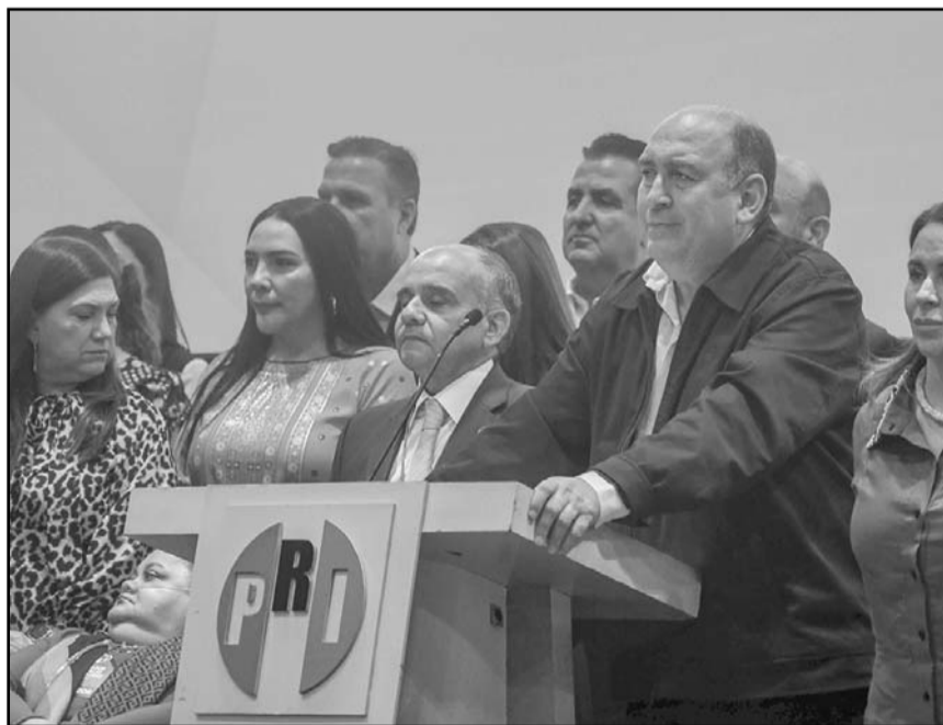
El PRI prevé injerencia del gobierno federal en el proceso del Frente Amplio

Ello debido a que el ejercicio es 100% partidista-ciudadano y no participa ninguna autoridad electoral, lo que