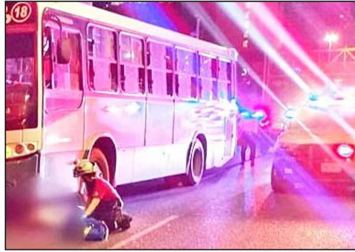
Los hechos se registraron en el municipio de San Pedro.

La persona cruzaba los carriles laterales de Lázaro Cárdenas, momento en que pasó el transporte urbano de la Ruta