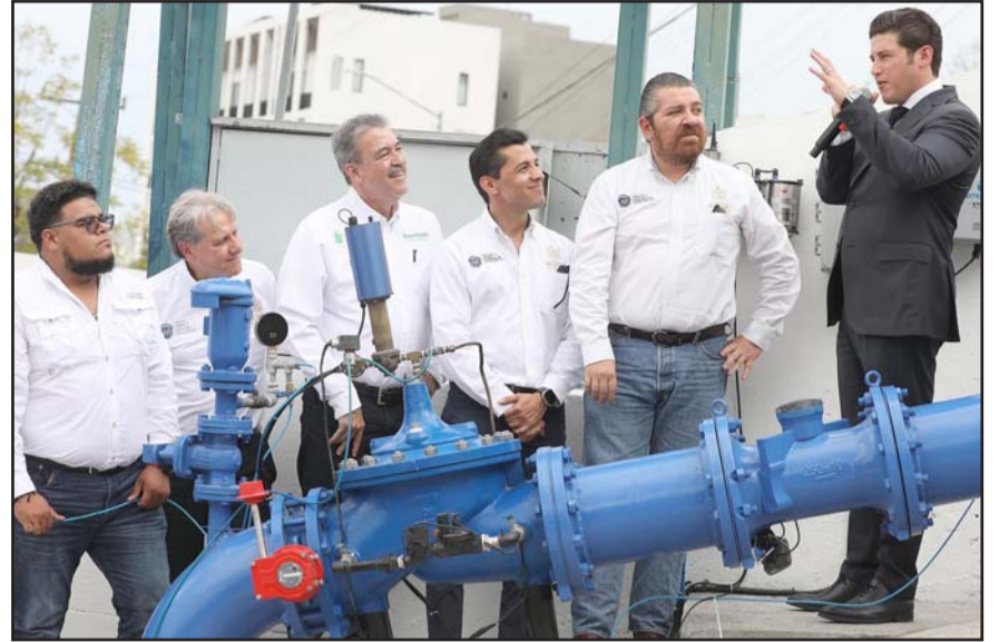
Aunque días atrás dio por concluida la crisis hídrica, aceptó que se siguen teniendo problemas por la falta de lluvias en el estado.

La recuperación de agua asciende ya a más de 2 mil litros por segundo y se busca llegar a 2 mil 500, el suministro de