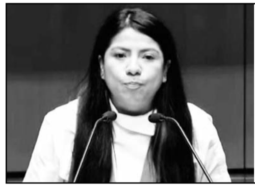
La senadora del estado quiere la presidencia

"Se nos vino un agua de las buenas, ya le dije que abra un puente por semana para que se nos venga la lluvia", expresó.(JMD)