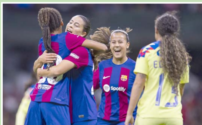
En otro duelo, Barcelona superó al América.