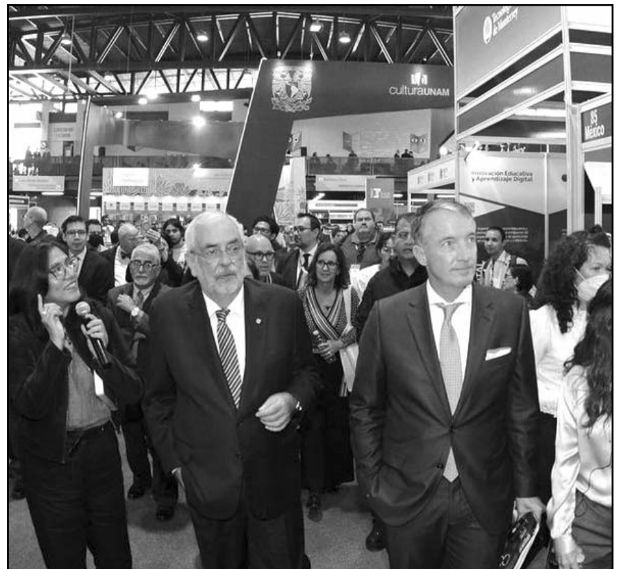
Graue afirmó que existe piso parejo para las y los aspirantes al cargo que dejará en noviembre próximo