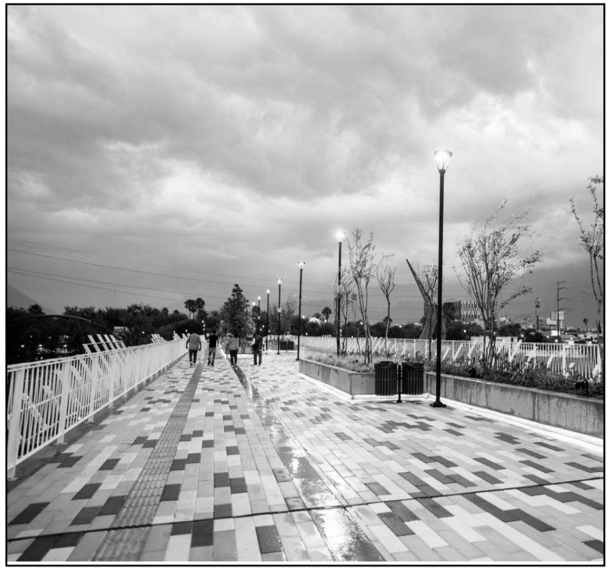
Con esta obra se unirán los parques Fundidora y España

Samuel García le pidió a Luis Donaldo Colosio que construyera