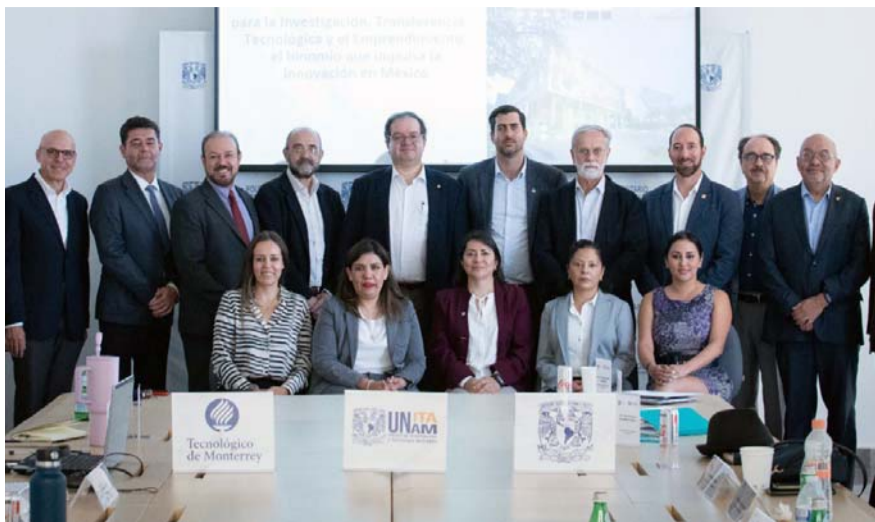
Generar soluciones viables en distintos campos de acción, un gran logro.