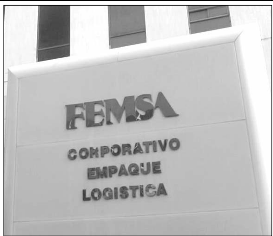
En la operación, Femsa recibirá unos mil 700 millones de dólares en efectivo y retendrá una participación accionaria de 37 por ciento en la empresa combinada resultante del acuerdo

Los Angeles, EU.- La embotelladora y minorista mexicana Femsa anunció este martes que alcanzó un acuerdo con la distribuidora estadounidense BradyIFS para crear una nueva plataforma de suministro para las industrias de limpieza, productos desechables para alimentos y paquetes en el vecino país. En la operación, Femsa recibirá unos mil 700 millones de dólares en efectivo y retendrá una participación accionaria de 37 por ciento en la empresa combinada resultante del acuerdo, dijo la firma mexicana en un comunicado enviado a la Bolsa Mexicana de Valores. De acuerdo con Femsa, se espera que la nueva plataforma, que reunirá a Envoy Solutions, subsidiaria estadounidense de la empresa mexicana, con BradyIFS, tenga "ingresos pro-