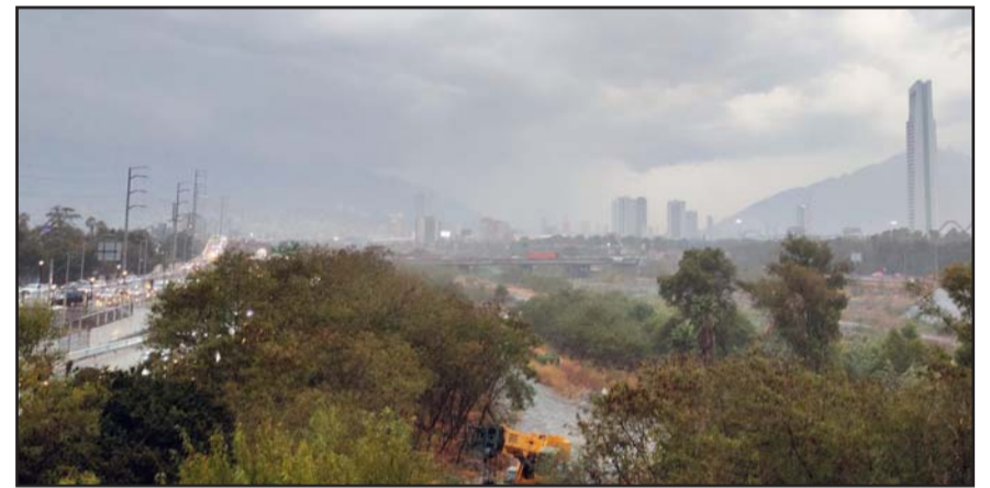
Ayer por la tarde se presentaron algunos chubascos en la ciudad.

Evitar cruzar lugares de riesgo como ríos, arroyos, corrientes de agua y pasos a desnivel; tener cuidado con instalaciones eléctricas, estructuras, anuncios panorámicos y postes; intentar permanecer en un lugar seguro y no arrojar basura, son parte de las recomendaciones.