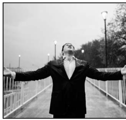
El gobernador disfrutó de la lluvia

de la obra se ocuparon 325 millones de pesos, 280 millones para la infraestructura y 45 más en la fachada y rehabilitación del parque España.