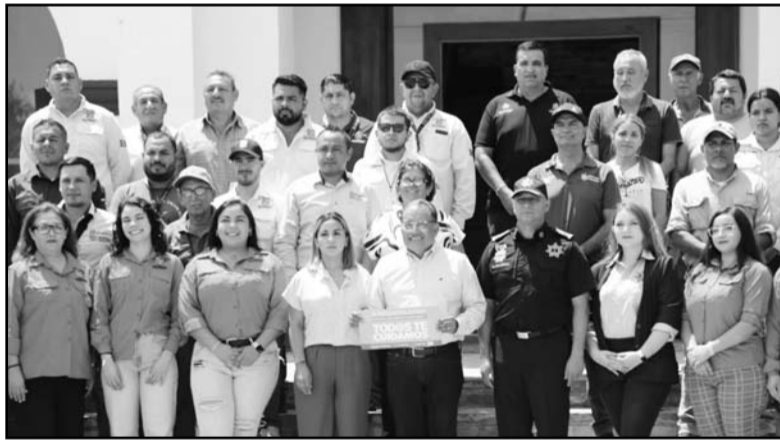
La idea es combatir la violencia en contra de las mujeres.

El arranque de la campaña "Tod@s te cuidamos" consistió en colocar calcas en los autos oficiales, a fin de que las ciudadanas pueden identificarlo como puntos seguros y así puedan ser canalizadas a la autoridad competente. (CLR)