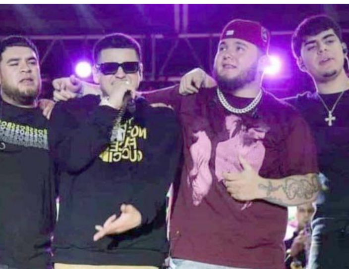
El incidente ocurrió en la autopista Puebla-Córdoba.