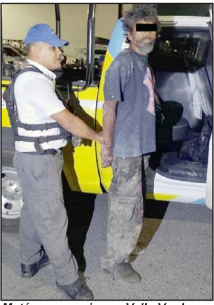
Mató a una mujer en Valle Verde.

Elementos de Tránsito de Monterrey arribaron al sitio de los hechos.