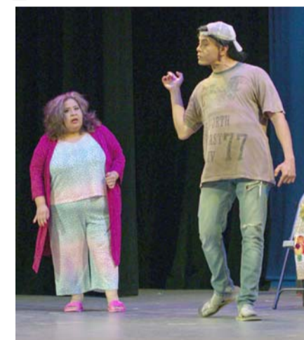
El taller se brinda los sábados.

"El amor al teatro es una pasión, una vocación. Veo hoy a los integrantes plenos, felices de haber encontrado su tribu, su gente, un grupo de iguales. Aquí tenemos contadores, psicólogos, fotógrafos,