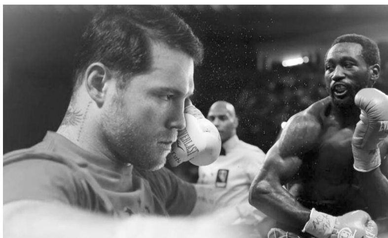
Saúl "Canelo" Álvarez.

Ya en más actividad de los peloteros mexicanos en las Grandes Ligas, Joey Meneses en Washington logró una carrera y un hit en el triunfo sobre los Azulejos de Toronto, mientras que Alex Verdugo en Boston se mandó una carrera con dos hits en el traspie frente a los Astros de Houston y Ramón Urias se hizo de una carrera y dos hits con Baltimore en el triunfo sobre las Medias Blancas de Chicago.