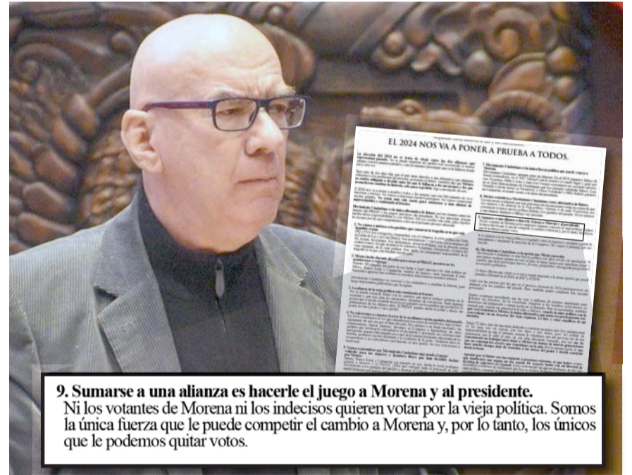
9. Sumarse a una alianza es hacerle el juego a Morena y al presidente. Ni los votantes de Morena ni los indecisos quieren votar por la vieja política. Somos la única fuerza que le puede competir el cambio a Morena y, por lo tanto, los únicos que le podemos quitar votos.

Ante ello, el gobernador de Jalisco, Enrique Alfaro, quien recientemente se opuso a la política nacional de MC, calificó de "lamentable" la posición de Delgado y afirmó que el proyecto político que él lidera no acata órdenes de ningún dirigente y pronto tomarán una postura sobre la siguiente elección local.