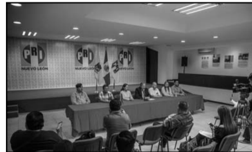
Los priistas de la entidad están listos

La Consulta se llevará a cabo a partir de 9:00 a 17:00 horas el próximo 3 de septiembre, a excepción de aquellos lugares donde en ese momento exista fila de ciudadanos que deseen participar, en cuyo caso se levantará una lista y se mantendrá abierto el centro hasta que la totalidad haya expresado su simpatía.(CLR)