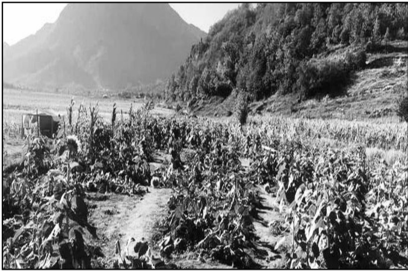
El pasado fin de semana fueron atacados por personas desconocidas.

Y, que de acuerdo a lo que se indica, buscan voluntades para sumarse a la protesta que se realizará el próximo dos de septiembre por la tarde frente a Palacio de Gobierno.