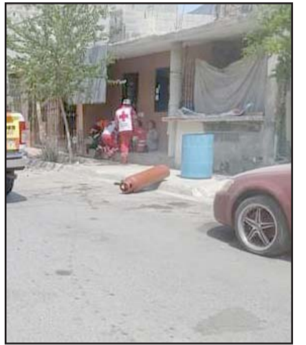
El tanque era reabastecido.

Las autoridades mencionaron que son comunes este tipo de accidentes en la zona, debido principalmente al exceso de velocidad en que se maneja.