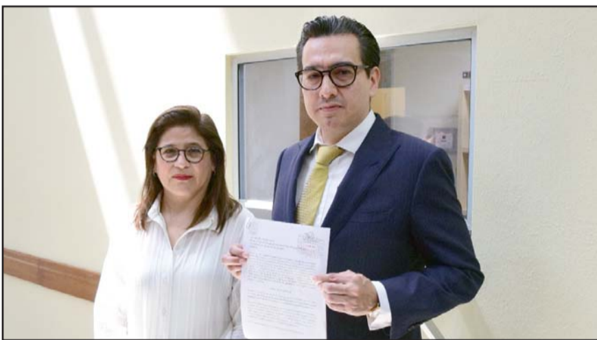
Movimiento Ciudadano presentó una propuesta sobre el tema.