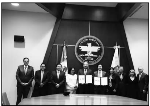
Se busca incentivar al trabajador