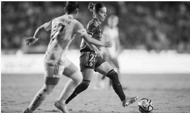
La jugadora Sofie Svava valoró el plantel de Tigres Femenil.