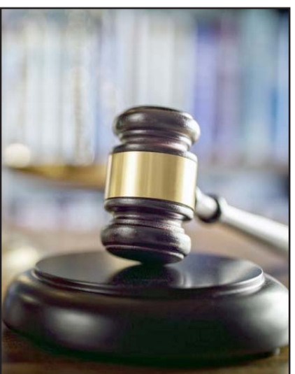
Magistrados apoyan el monto de más de 84 mmdp que la presidenta de la SCJN, Norma Piña, solicitó.