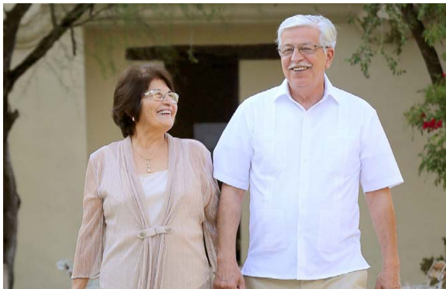
El público en general podrá explorar diversas actividades terapéuticas para dar apoyo integral a quienes viven con el Alzheimer.