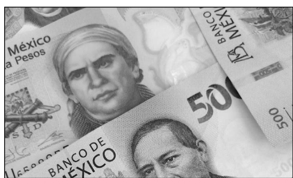
En el segundo trimestre de 2023 se ubicó en 675 mil 448 millones de pesos, contra 643 mil 565 millones de pesos del mismo periodo de 2022

Ciudad de México/El Universal.- Una vez más, el saldo de la deuda de estados y municipios creció como efecto de las altas tasas de interés. En el segundo trimestre de 2023 se ubicó en 675 mil 448 millones de pesos, contra 643 mil 565 millones de pesos del mismo periodo de 2022, revelan datos de la Secretaría de Hacienda y Crédito Público (SHCP). Con ello, el saldo de la deuda subnacional aumentó en 30 mil millones de pesos más, en un entorno en el que la tasa de referencia se mantuvo en 11.25%. El líder del área de Finanzas Públicas de ARegional, Omar Lugo Bautista, observó que mientras los estados y municipios no fortalezcan sus ingresos propios, seguirán endeudándose o no podrán hacer frente a sus obligaciones. Es posible dotar a la población de los servicios básicos sin recurrir al endeudamiento, recalzó. Por ejemplo, mencionó el caso de Querétaro, entidad que recientemente decidió no tomar deuda y se está financiando con sus propios ingresos. Así, hay dos gobiernos estatales que adoptan esta política de no endeudamiento, siendo Tlaxcala el primero, recordó. La deuda estatal se concentra en siete entidades federativas, que tienen 63.3% del total: Ciudad de México, Nuevo León, Estado de México, Chihuahua, Veracruz, Coahuila y Jalisco. En el caso de la Ciudad de México, dijo que es de las más endeudadas por las necesidades que tiene en infraestructura, como el Tren Suburbano, lo que le trae mayores gastos. Pero no tiene tanto problema, indicó,