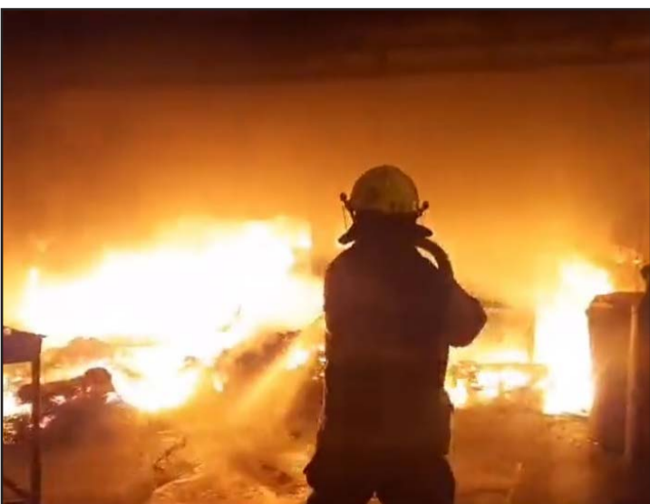
Durante más de ocho horas combatieron las llamas.

Los efectivos de la Policía de Santa Catarina municipal también estuvieron en el sitio de los hechos para tomar conocimiento.