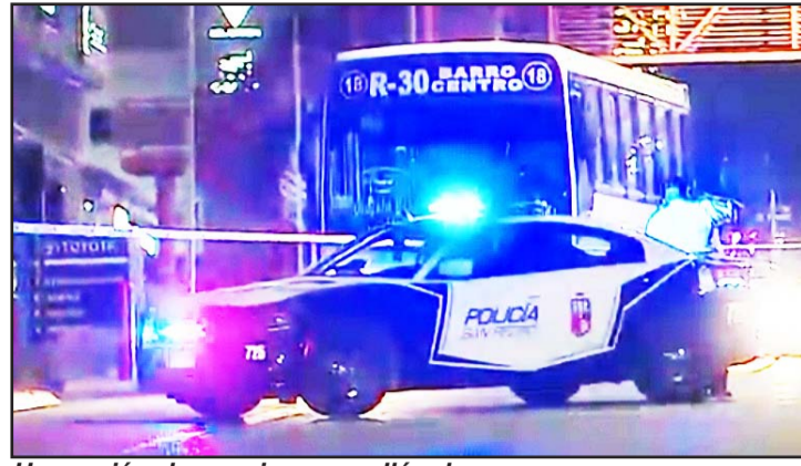
Un camión de pasajeros arrolló a la persona.

El cadáver fue revisado por el personal del Instituto de