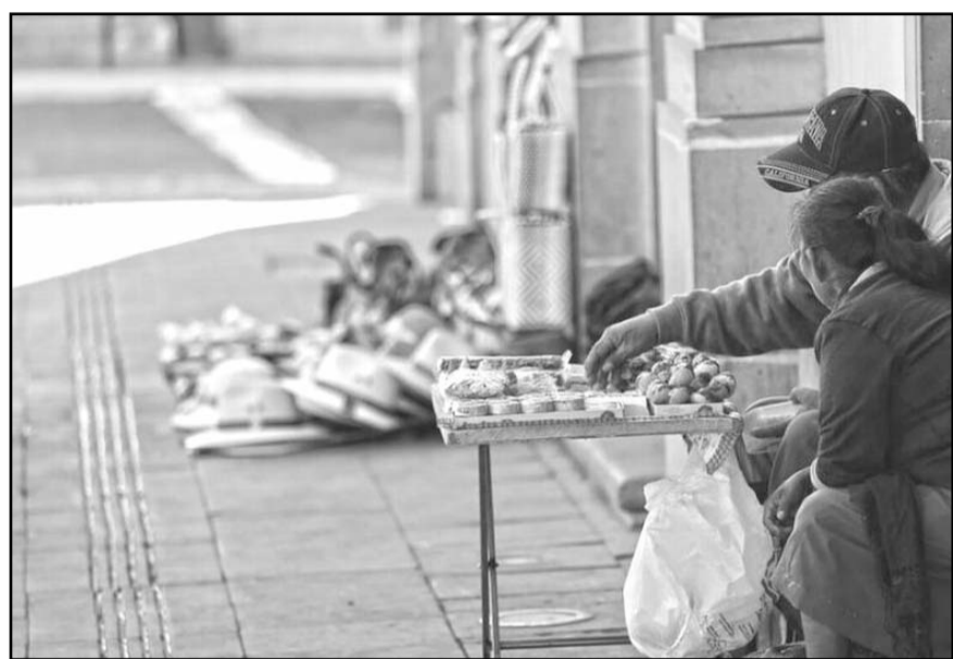
Entre las entidades con mayor incremento destacan Hidalgo, con alza de 5.2 puntos porcentuales; Veracruz, 3.7; Aguascalientes, 2.6; Colima, 2.4, y Oaxaca, con 2.2 puntos porcentuales.

Scott. CONTRACCIÓN DEL INGRESO Para todo el país, el ingreso laboral per cápita reportó un incremento marginal de sólo 0.8% en términos corrientes entre el primero y el segundo trimestre del año, tasa muy inferior a la de 8.5% reportada de enero a marzo. Sin embargo, descontando la inflación de la canasta alimentaria se ve una baja de 0.2% de este ingreso en el periodo. El deterioro de las percepciones de los trabajadores es más evidente en los estados donde creció más el porcentaje de la población en pobreza laboral. Por ejemplo, una vez descontada el alza de la canasta alimentaria, el ingreso laboral per cápita en Hidalgo se redujo 9.2% del primero al segundo trimestre del año y en Veracruz bajó 6.9%. Les siguieron caídas de 3.7%, 3.0% y 2.8% en Aguascalientes, Colima y Oaxaca, en ese orden, por