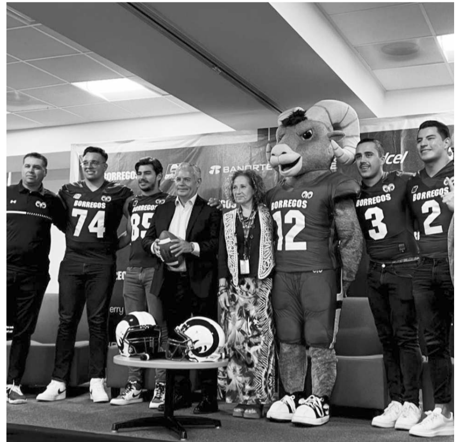
Borregos es el actual campeón de la Onefa.

temporada cuando el día ocho del mes entrante jueguen en la semana uno de la temporada regular en la Liga Mayor de