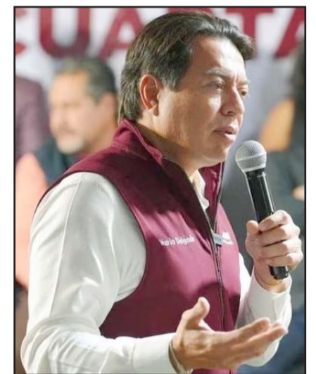
Presidente nacional de Morena urgió no hacer promoción.

También está prohibido realizar actos que alteren la equidad o que influyan en las preferencias; tener brigadas, grupos