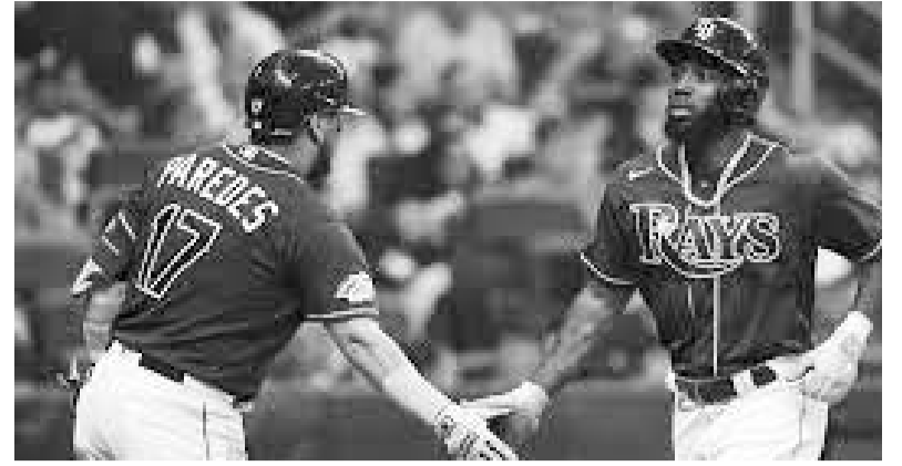
Arozarena pegó bambinazo ayer ante los marlins.