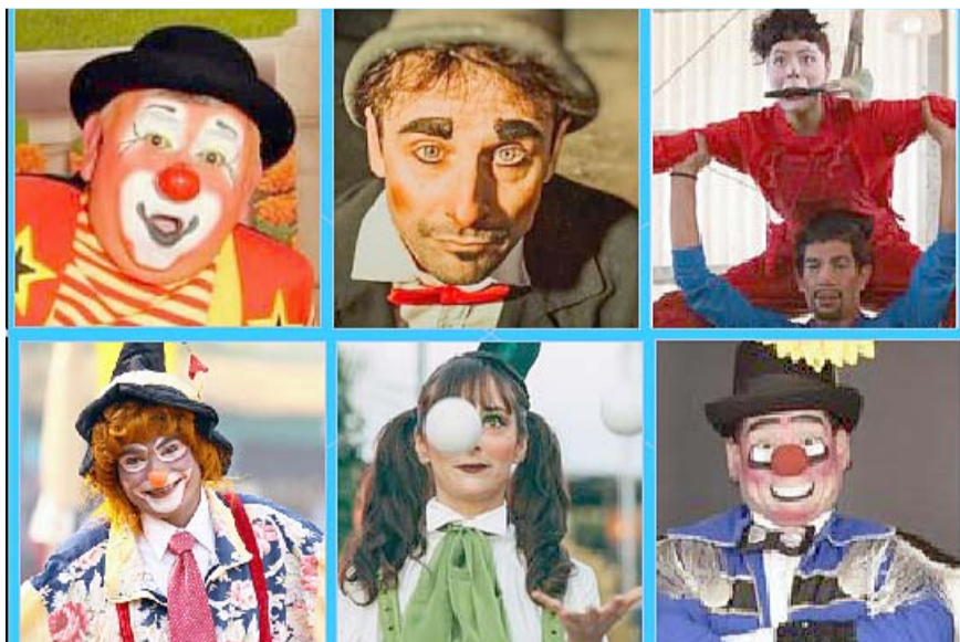
Dos días de gran diversión, aprendizaje y reconocimientos.

El tercer Encuentro de Circo en Nuevo León es organizado por la Compañía de Arte Escénica y Circense "Arte de color mixto" en colaboración con la EAP.