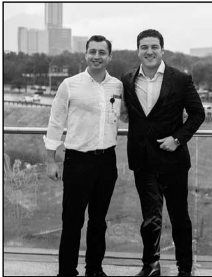
Al final se tomaron la foto del recuerdo

Antes de iniciar con la inauguración comenzó a caer la lluvia que fue bien