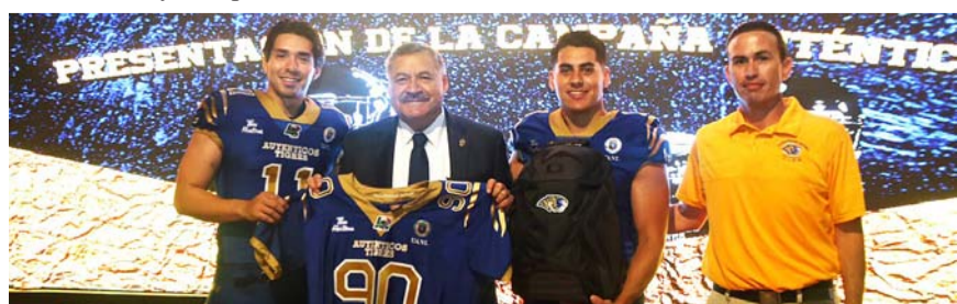
El equipo se tomó ayer la foto oficial de cara a la temporada por arrancar.

El equipo felino arrancará el camino al campeonato enfrentando a los Borregos Salvajes del Instituto Tecnológico y de Estudios Superiores de Monterrey el día ocho de este mes en la ciudad de Houston, Texas.