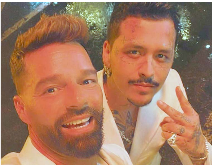
Preparamos algo que seguro les gustará, dijo el boricua en sus redes sociales.