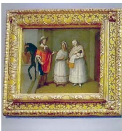
Décimo aniversario de Las Castas.