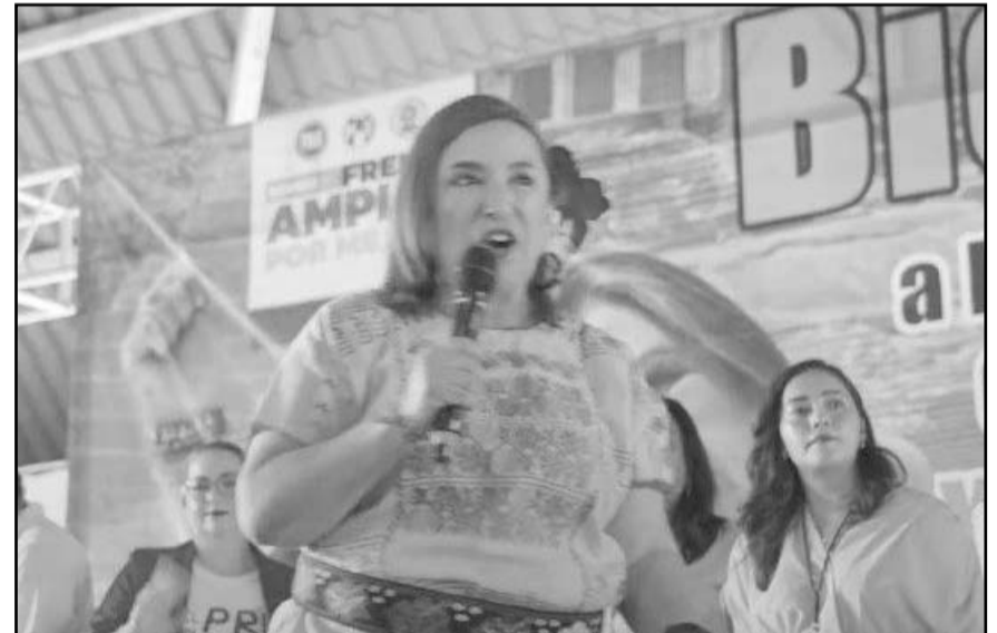
La senadora panista expresó su solidaridad con "las víctimas del ataque terrorista al pueblo de Israel", señaló.

La mañana de este sábado 7 de octubre, la senadora panista manifestó que el extremismo y la violencia nunca serán la vía para solucionar conflictos, y expresó su solidaridad con "las víctimas del ataque terrorista al pueblo de Israel", señaló.