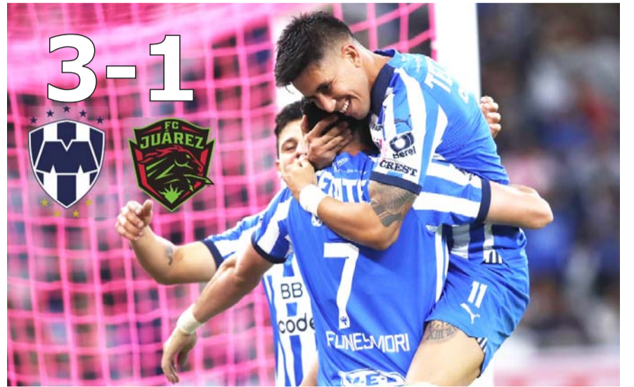
Monterrey sigue con sus problemas de lesiones.

Se reencuentra Rayados con el triunfo, pero suma lesionados