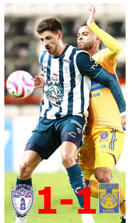
Felinos y Tuzos sumaron un punto.

Ahora los Tigres volverán a la actividad cuando el día 14 de este mes tengan el Clásico Regio que será amistoso y el cual pretende realizarse en Houston.