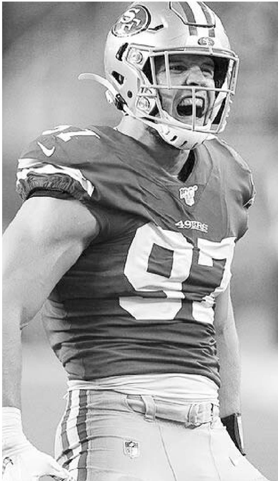
San Francisco pone en riesgo su invicto ante los Vaqueros.