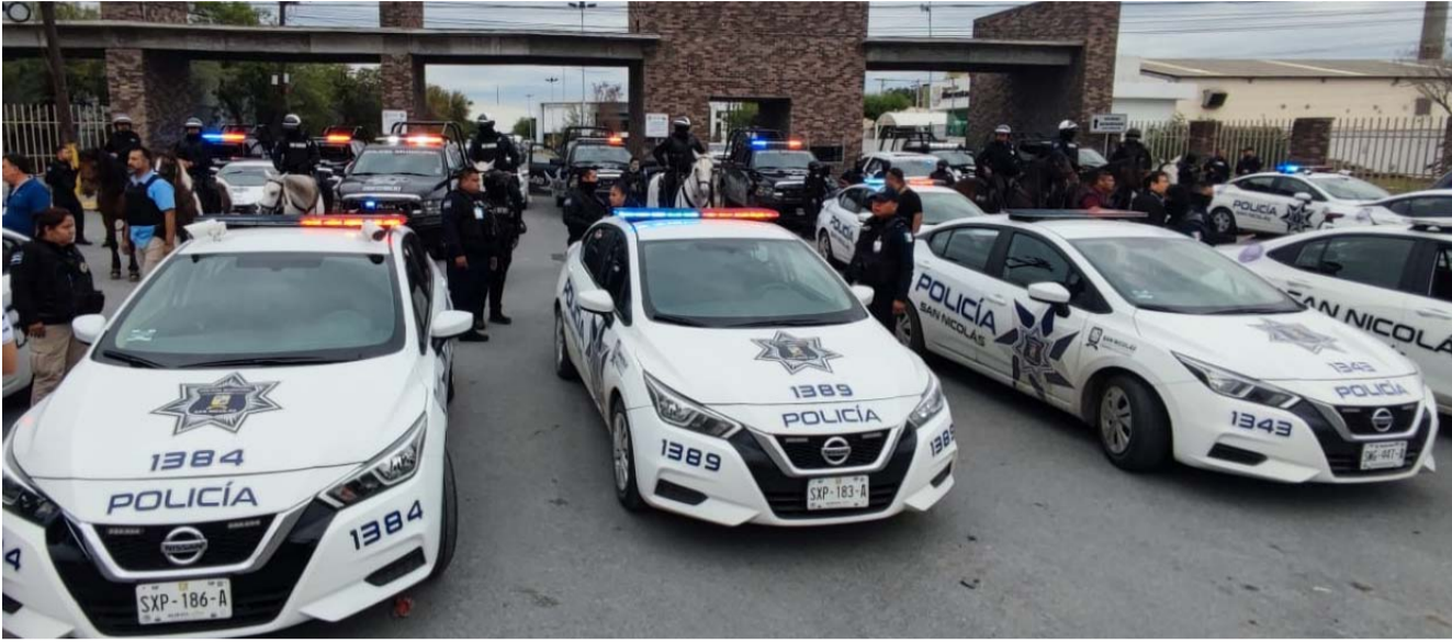
Unidades de Seguridad de San Nicolás, Guadalupe y Apodaca resguardaron la sede de la corporación policiaca.