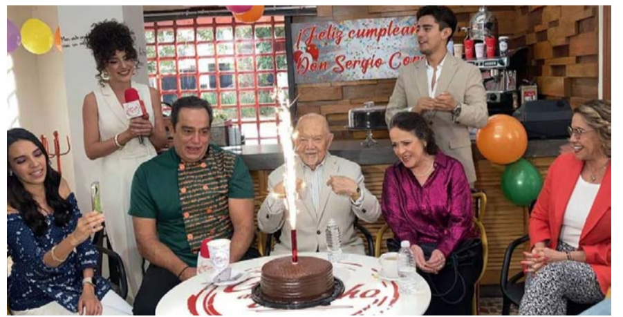
El actor de Como dice el dicho fue celebrado por sus colegas de la producción.

cafetería "El dicho" fue decorada con globos y hasta acudió un payaso, además estuvo presente su amiga la actriz Nora Velázquez quien le dedicó unas palabras."