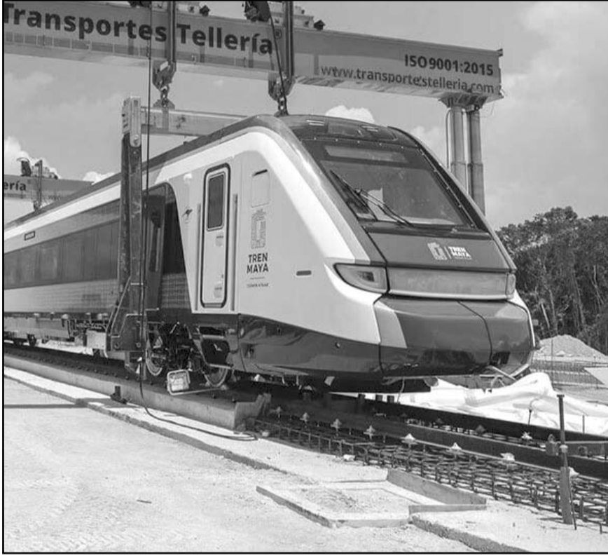
Luis Crescencio Sandoval informó que 3 mil 200 elementos de la Guardia Nacional llegarán a Quintana Roo para cubrir la seguridad del Tren Maya.

A toda esta fuerza policial, se suma la inversión histórica hecha por Mara Lezama, por más de 2 mil millones de pesos para la adquisición de 689 unidades vehiculares, 507 chalecos balísticos y un helicóptero para el fortalecimiento de la seguridad de la población.