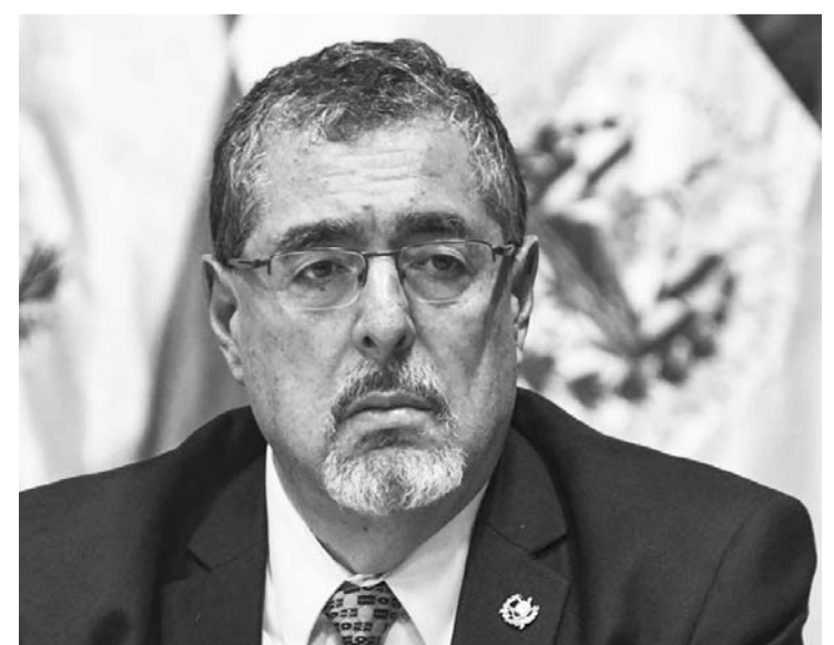
La decisión surge tras manifestaciones y bloqueos; el presidente electo denuncia 'un golpe de Estado a cámara lenta'.

La situación política en Guatemala sigue siendo tensa y sujeta a un escrutinio internacio-