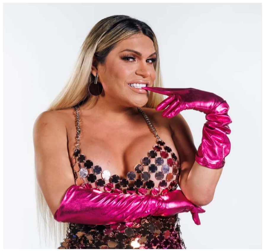
La influencer fue elogiada por el medio internacional.

Por su parte, la influencer reveló al medio cuánto tiempo tiene de exclusividad con Televisa. "Lo diré aquí por primera vez. Nunca había mencionado cuánto tiempo... Me lo han preguntado muchas veces, y nunca había querido decirlo. Tengo un contrato de exclusividad de dos años, pero sólo para televisión".