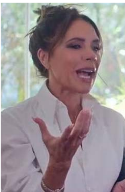
La empresaria decía que provenía de la clase trabajadora.

Hace un par de años atrás, la diseñadora compartió en una entrevista, que no le gustaba que su papá fuera por ella a la escuela, debido a que su automóvil era muy lujoso y no quería despertar la envidia entre sus compañeros.