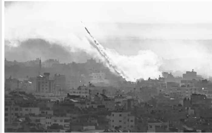
Miles de cohetes fueron lanzados desde Palestina por Hamas.

"La primera fase termina a estas horas con la destrucción de la mayoría de las fuerzas enemigas que penetraron en nuestro territorio. Al mismo tiempo, iniciamos la formación ofensiva, y ésta continuará sin reservas y sin