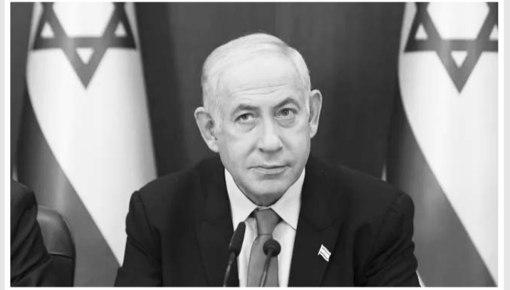
El primer ministro de Israel, Bentajim Netanyahu, prometió 'destruir a Hamas'.