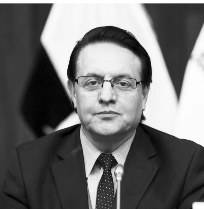
Fue ultimado en prisión el séptimo acusado del crimen contra Fernando Villavicencio (foto), sin que se dieran detalles.