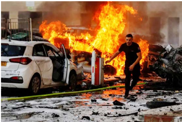
El grupo palestino asegura que lanzaron 5 mil cohetes.

Al ver el corto circuito, el presidente López Obrador se levantó para mirar lo que ocurría, al igual que los demás acompañantes.