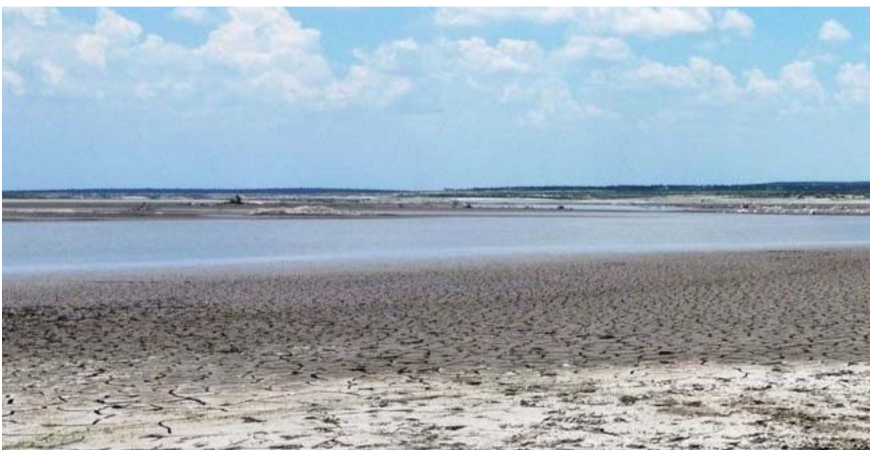
La totalidad del territorio registra algún grado de crisis hídrica.