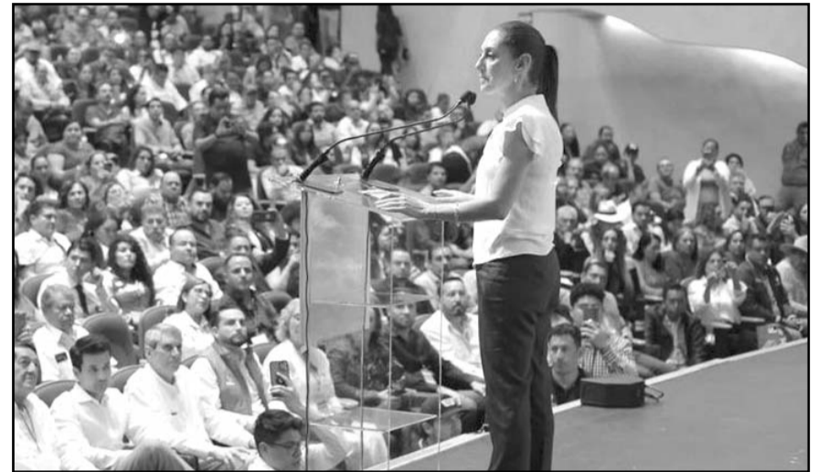
"El único camino de México es continuar con la honestidad"

En ese sentido, Sheinbaum pidió a los militares y simpatizantes trabajar