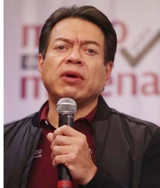
El presidente nacional morenista (izq.) sostuvo que el líder de la asociación 'El Camino de México' debe responsabilizarse de sus actos, y será él quien defina su futuro en el partido.