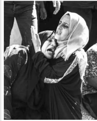
Familiares de palestino lloran su pérdida tras reacción.

"Estas son escenas extremadamente inquietantes para