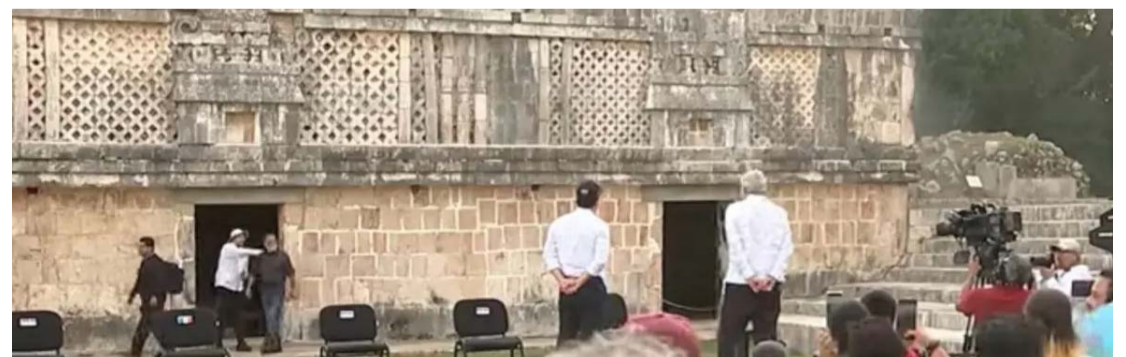
El mandatario escuchaba informe de funcionaria del INAH cuando ocurrió el suceso.

‘Israel se embarca en una guerra larga’ Página 5