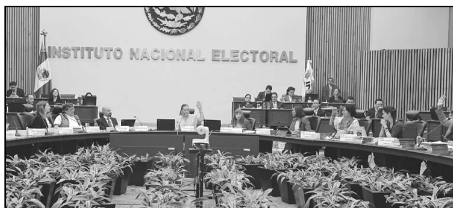
El registro será electrónico

El registro será electrónico y se prevé que del 15 de enero y hasta el 11 de marzo del 2024, los partidos políticos y candi-