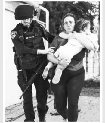
Mujer corre a resguardarse de ataques en Israel.

Por su parte, Hamas lanzó un mensaje de audio en el que aseguran que tienen decenas de israelíes retenidos en toda la franja de Gaza.