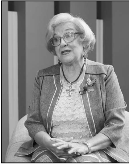
Esmeralda Arosemena de Troitiño, vicepresidenta de la CIDH

"México ha tenido una historia de la migración que fue muy propia de los países de Centroamérica, pero ya hoy no es así. Actualmente, esto está desbordado incluso con países de otros continentes. Y una política de Estados Unidos muy difícil y muy dura para enfrentar el flujo migratorio que hoy se evalúa como una grave crisis", señala