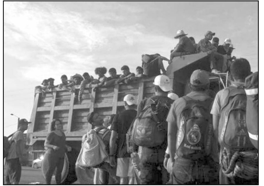
El país enfrenta en la actualidad una grave situación en el tema migratorio

del país, sobre todo en la frontera sur?