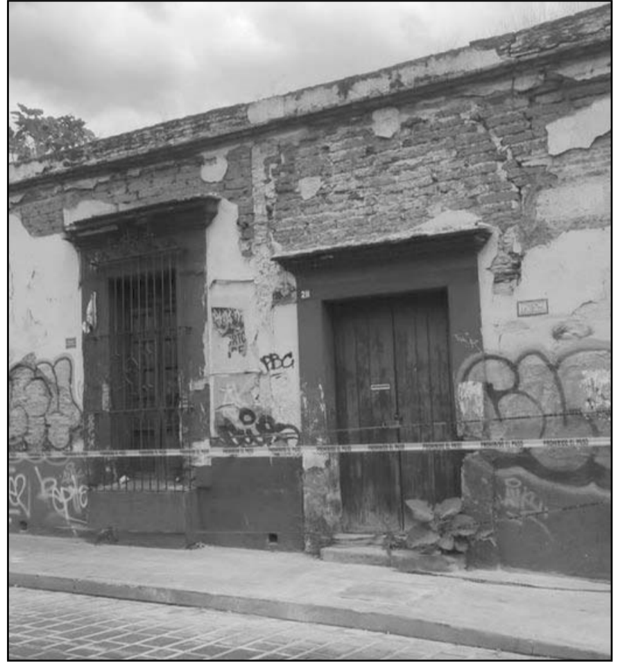
La Dirección de Protección Civil Municipal realizó el acordonamiento por desprendimiento de aplanado en un inmueble en mal estado.