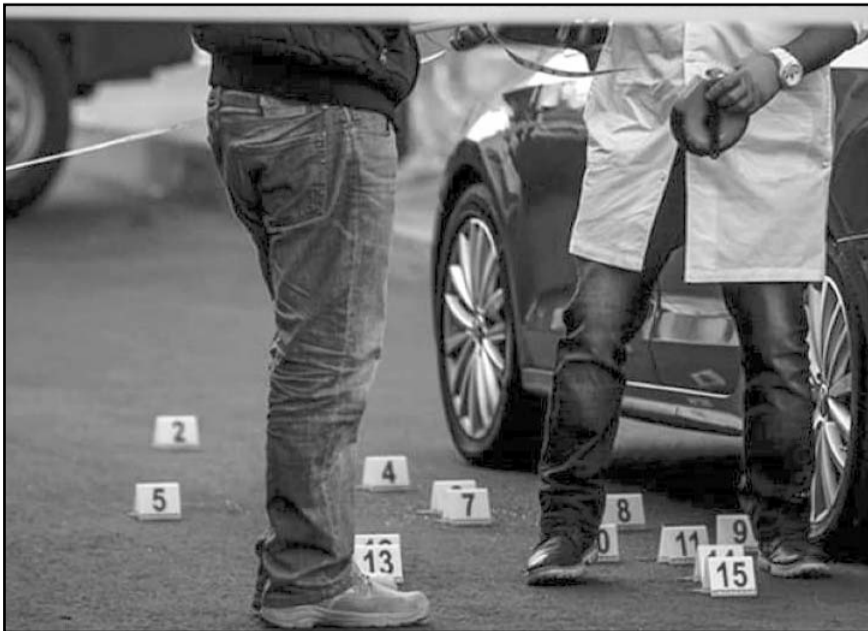
El pasado domingo primero de octubre es al momento el día más violento de la semana, con 92 asesinatos, seguido del 3 de octubre, 71.

Los imputados que tenían órdenes de aprehensión pendientes fueron trasladados a diferentes centros penitenciarios estatales; al resto los llevaron al Ministerio Público, informó la Secretaría de Seguridad y Protección Ciudadana.