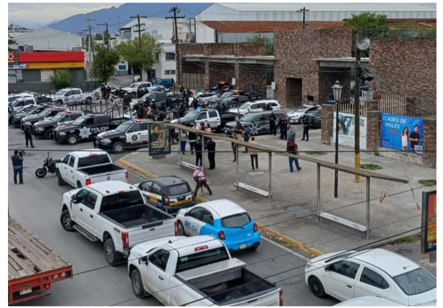
Exigieron al Ejecutivo respeto a la autonomía municipal.

"Lamentamos que los Ayuntamientos de Juárez y Guadalupe hayan dejado vulnerable el tema de seguridad en sus municipios, al enviar a sus policías municipales a San Nicolás a fin de resguardar un recinto con fines políticos y mediáticos, lo que claramente puede representar un desvío de recursos públicos.