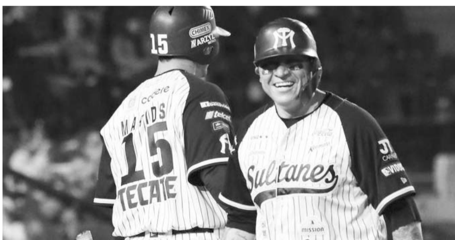
Sultanes se prepara la Liga del Pacífico.

Eso sí, aún Sultanes está falto de hacer su debut en la temporada regular de la LMP cuando el día 13 de este mes visiten a las Águilas de Mexicali. (AC)