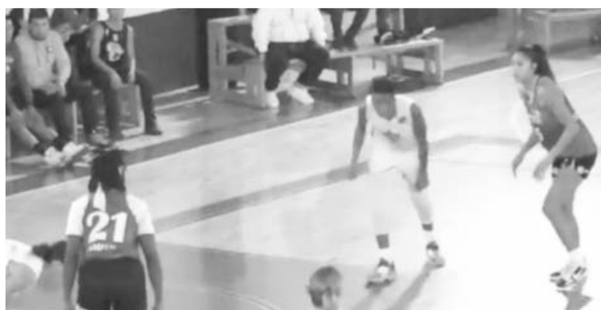
Las de Santiago están contra la pared.

Ahora Auténticos volverá a la actividad cuando el día 14 de este mes enfrenten de visitantes a los Leones UAMN. (AC)