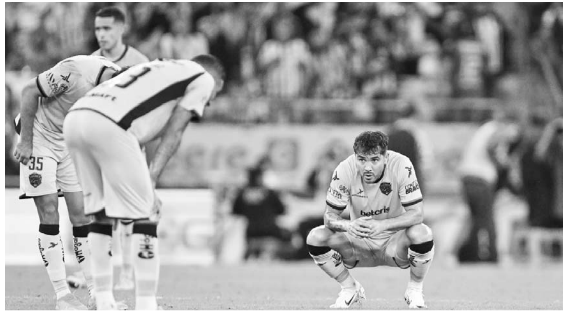
Ciudad Juárez se desmoronó desde el gol temprano.

tos, es un enojo, lo importante es lesión, sintió una molestia”, expuso. que Jesús está bien, no tiene una (AC)