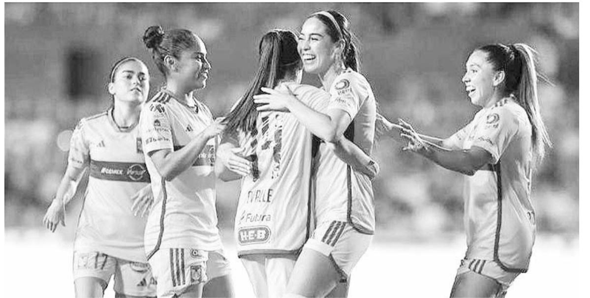
Las felinas están teniendo otro torneo de ensueño.

Tras esta situación, hoy se espera un triunfo no tan sencillo de Tigres Femenil, pero sí que les afiance aún más en la parte alta de la justa nacional, misma de la que por cierto ya amarraron la Liguilla.