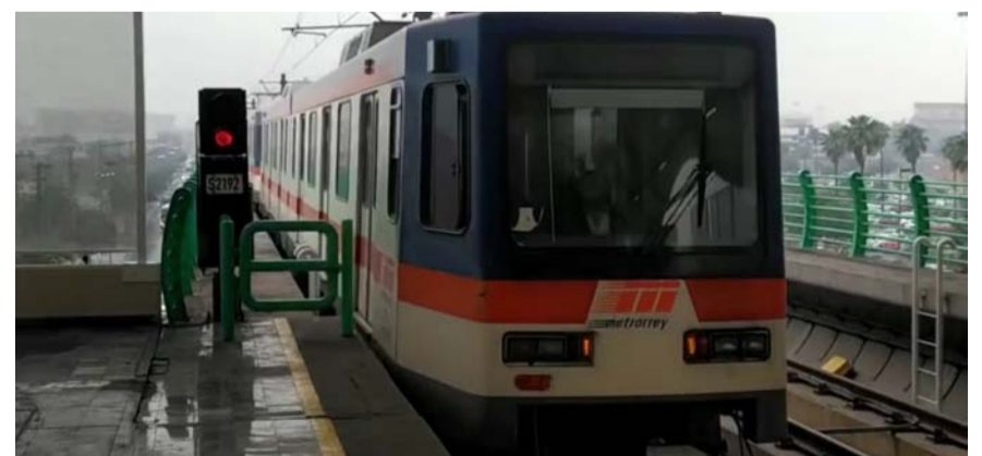
Habrà trabajos de reconstrucción de capiteles en el viaducto elevado.

"Por esto, manifestamos que la cultura y la literatura son valores fundamentales".