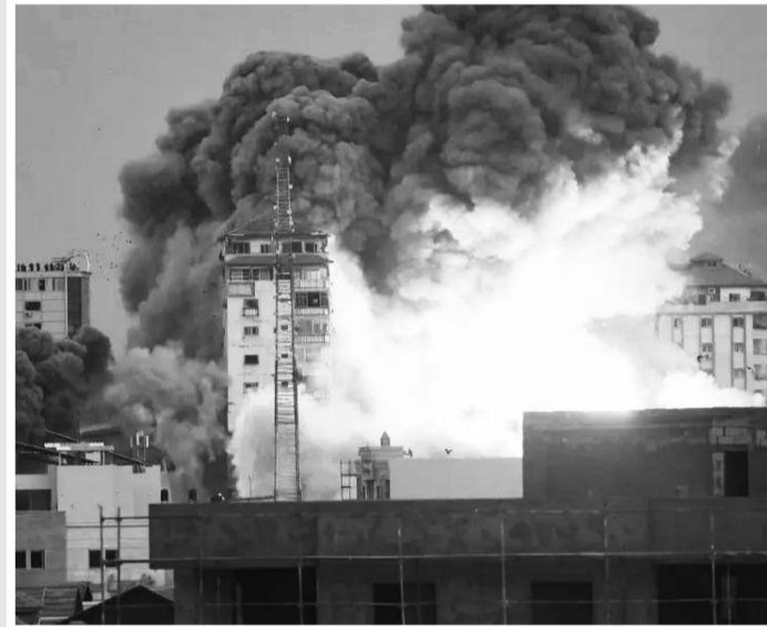
Israel respondió con bombardeos a edificios en Gaza.

cualquier israelí. No quiero ni imaginar cuál será el destino de estos israelíes a manos de estos animales sedientos de sangre".