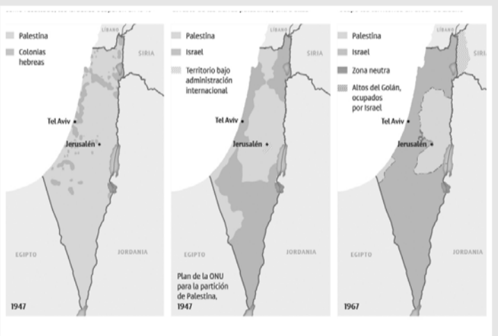
Así ha sido la expansión del Estado de Israel desde 1947.

Desde 2007, Hamas controla Gaza y desempeña un papel importante en el conflicto actual en Israel.