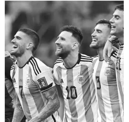
Argentina comanda en sudamérica.

De esta forma es que Argentina buscará este día un paso más rumbo a la Copa del Mundo del 2026, aunque también el mantenerse en la cima en las eliminatorias.