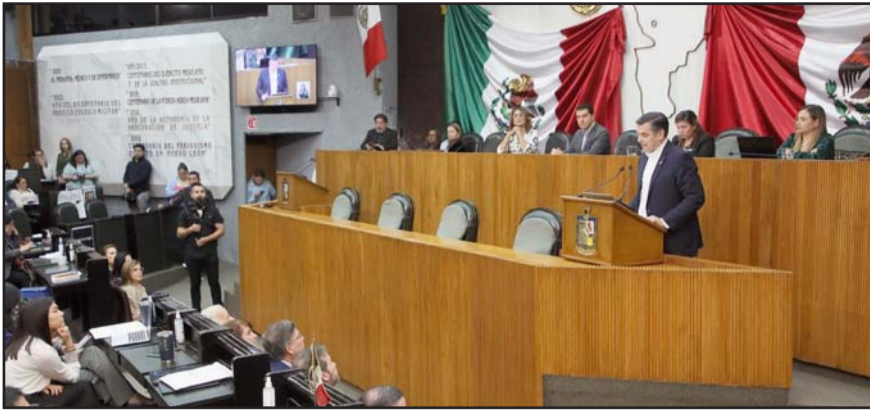
Señalan que ausencia del Gobernador es un desacato más a la Constitución.