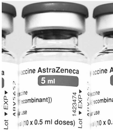
La Cofepris señaló que no ven con claridad la respuesta inmunogénica contra variantes de covid.