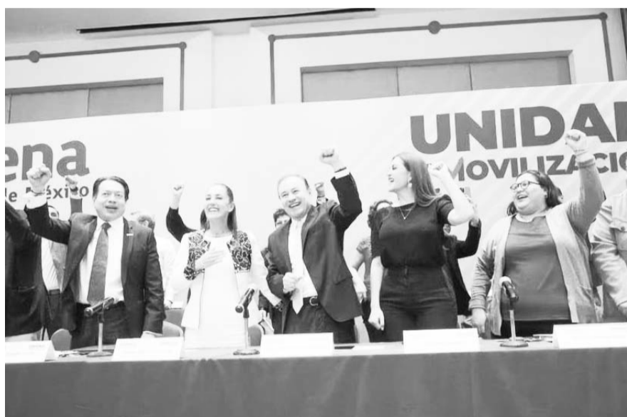
Los que buscan las candidaturas a ocho gubernaturas y Ciudad de México firman una carta en la que pactan aceptar los resultados.