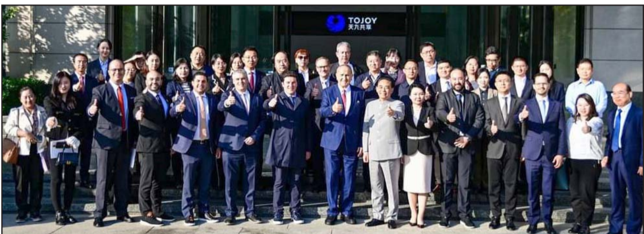
Se trata de la compañía Lingong Machinery Group (LGMG), líder en fabricación de maquinaria para la construcción.