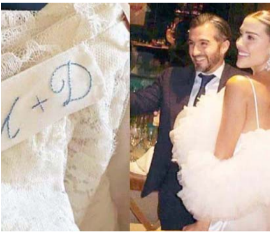
Fueron tres días de fiesta en La Toscana.

Más tarde las redes sociales del programa "El Gordo y La Flaca" publicaron la foto de la detención y fichaje del músico.