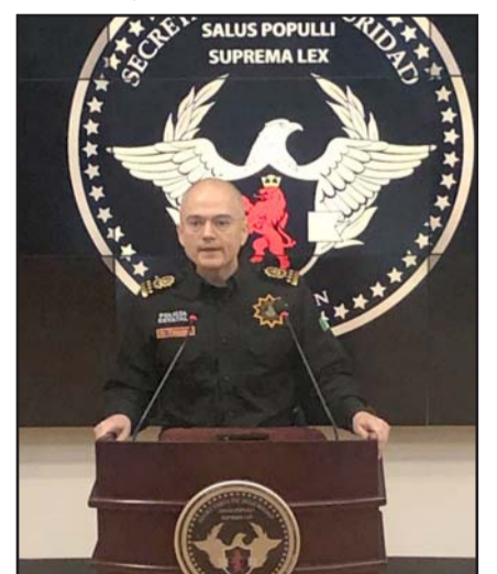
Gerardo Saúl Palacios Pámanes, Secretario de Seguridad Pública

"Hemos incrementado la presencia, si bien ya lo habíamos hecho, ahora es todavía más está la presencia de Fuerza Civil, de la Guardia Nacional y del Ejército Mexicano en el municipio de Anáhuac", resaltó.