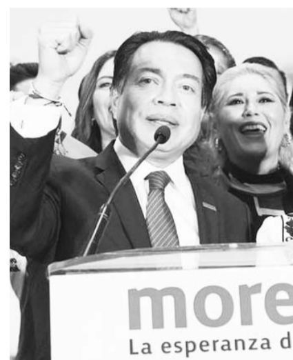
El presidente morenista aseguró que respetarán paridad de género.

"Se respetará lo que mandaten las autoridades electorales: serán cuatro o cinco ganadores o ganadoras, dependiendo de lo que se fije, si serán cinco mujeres o cuatro mujeres se va a respetar el género. Morena ha sido un partido promotor de la participación política de las mujeres, así lo demuestra que, del 2021 a la fecha, Morena ha postulado más mujeres que hombres en las candidaturas a gobiernos estatales y nosotros, por supuesto, que vamos a respetar esa disposición por convicción, no porque lo mandaten las autoridades", aseguró.