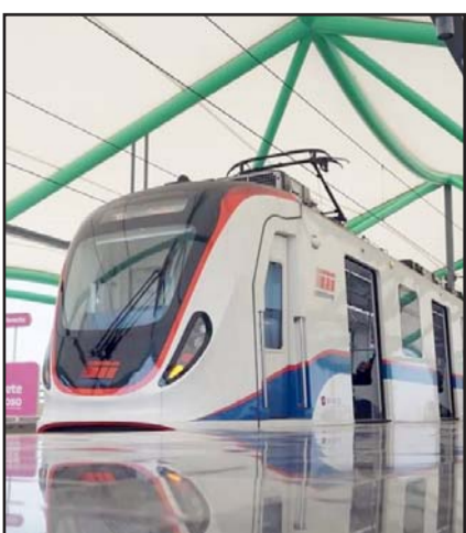
Ahora buscan prevenir.