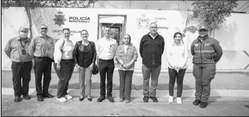
El municipio de Monterrey puso en operación la renovada caseta de vigilancia en la colonia Colinas de San Jerónimo.