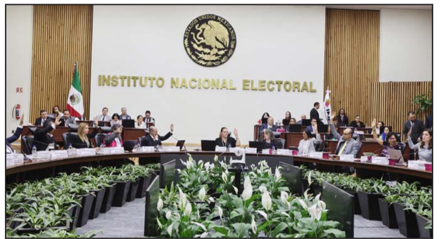
Con la oposición de los partidos, el organismo electoral aprobó en comisiones la obligación de postular a cinco mujeres y cuatro hombres.

“Asimismo, ambas aeronaves volvieron a Israel para recoger a otras 275 personas mexicanas que continuaban en el Aeropuerto Internacional Ben Gurión, en Tel Aviv, para traerlos a México y completar así las repatriaciones”, apuntó la SRE.