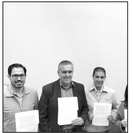
Buscan tener injerencia en la toma de decisiones