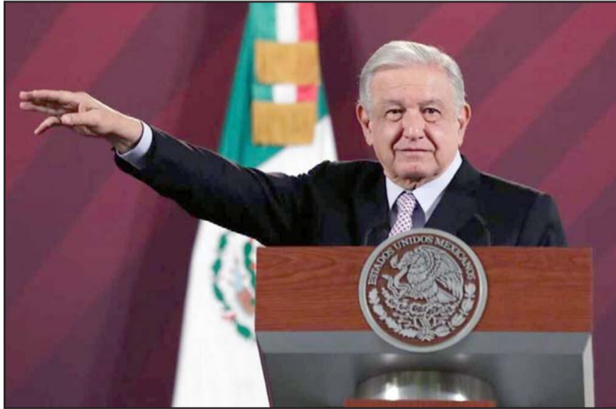
Todos los connacionales que solicitaron salir de la zona hasta el fin de semana lograron hacerlo, afirmó la Cancillería.

“Ya han salido de Tel Aviv 720 mexicanos que estaban en Israel y estas depor-