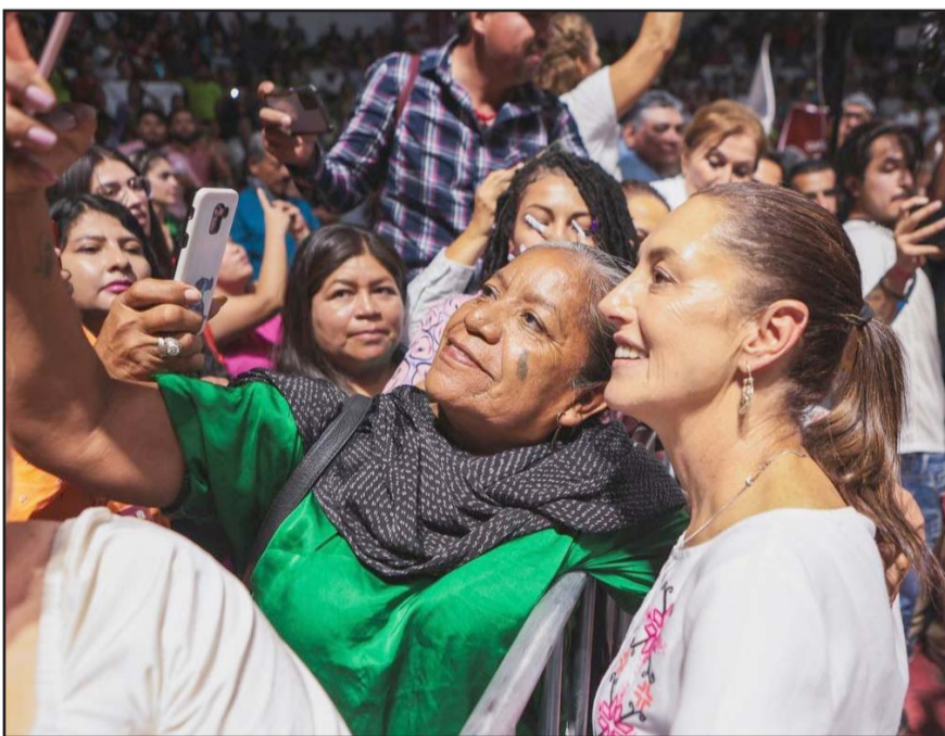
Sólo podrá realizar mítines o reuniones en lugares cerrados y dirigidos a los militantes, tras advertir violaciones a la equidad de la contienda.

“El desorden jurídico no contribuye a la democracia porque vulnera varios de sus principios, independientemente de que vulnera gravemente la vida interna de los partidos, los derechos de sus militantes y eso incluye los derechos de las mujeres que militan en los partidos, cosa que nunca se menciona”, subrayó.