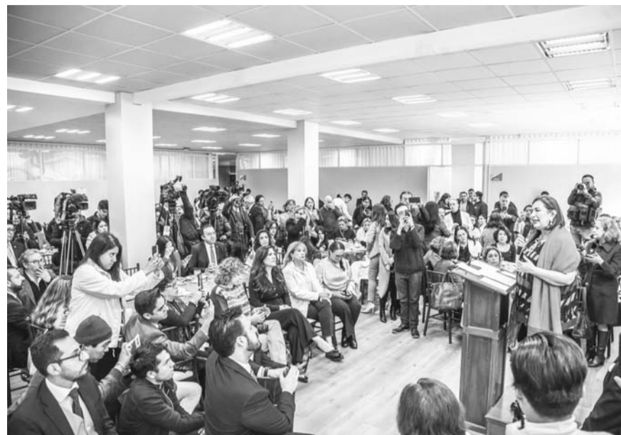
La panista dice que la pretensión de disolverlos tiene un trasfondo político.

"Entonces, nosotros vamos a apoyar y a defender a la Corte en su autonomía, porque, además, 15 mil millones de pesos, 20 mil millones de pesos lo resolvemos con el precio del petróleo", apuntó.