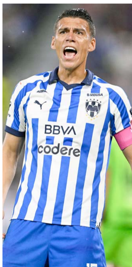
Monterrey, en mal momento.

Tras esta situación, en Rayados viven en un mal momento en los resultados y deportivo, aunque ahora deberán de mejorar esa situación cuando el próximo domingo enfrenten a Pumas en la capital del país, buscando