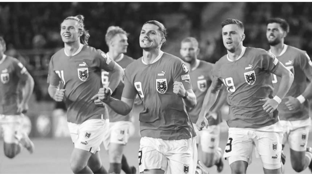
Austria venció al débil Azerbaiyán.

La Selección de Austria es una invitada más a la Eurocopa de las Naciones del próximo año, tras imponerse a Azerbaiyán 1-0 en un partido más de la fase clasificatoria y como loca.