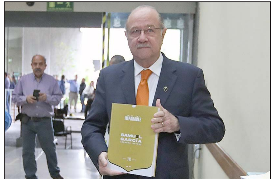
El funcionario estatal calificó como un circo la sesión solemne del "supuesto informe" llevada a cabo el pasado viernes.

Dijo que hubo una descortesía política por parte de los legisladores por eso el mandatario estatal no se presentó, además señaló que era lamentable que hayan venido invitados.