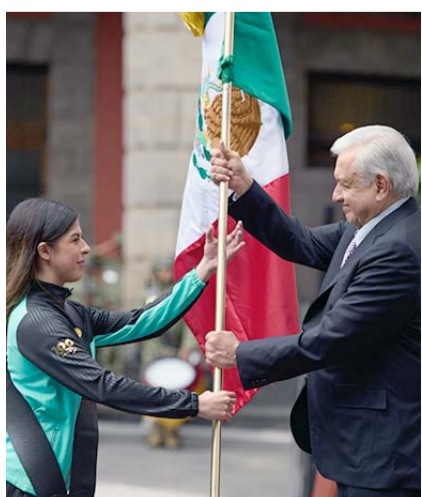
Mañana se abren las hostilidades.

Cabe señalar que la ceremonia de los Juegos Panamericanos será el próximo viernes, pero la actividad iniciará desde el día de mañana.