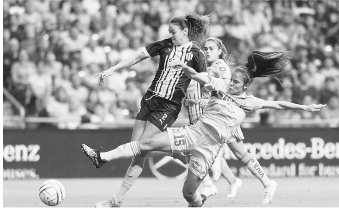
EL Clásico promete emociones el próximo jueves.

Apertura 2023, entonces el duelo del próximo jueves podría ser el último Clásico Regio que ella dirija en el fútbol local.