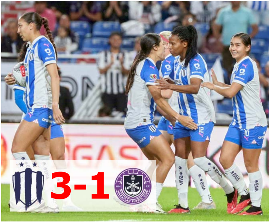
Las albiazules vinieron de atrás para vencer al Mazatlán.