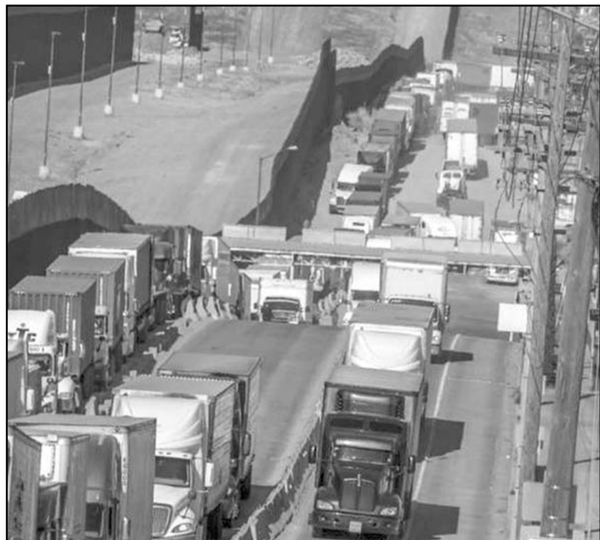
El Consejo Empresarial Mexicano de Comercio Exterior, Inversión y Tecnología (Comce) aseguró que las revisiones que se realizaron en Texas van contra el T-MEC.

Significan un "puntapié" para los estadounidenses, pues retrasan la normalización en las cadenas de valor y la proveeduría de los productos