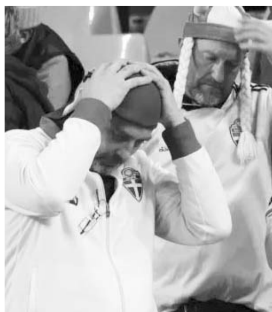
Todos lamentaron el atentado.

El partido entre Bélgica y Suecia del día de ayer en los duelos clasificatorios rumbo a la Eurocopa del 2024 fue suspendido, después de que dos fans suecos fueran asesinados horas antes en Bruselas.