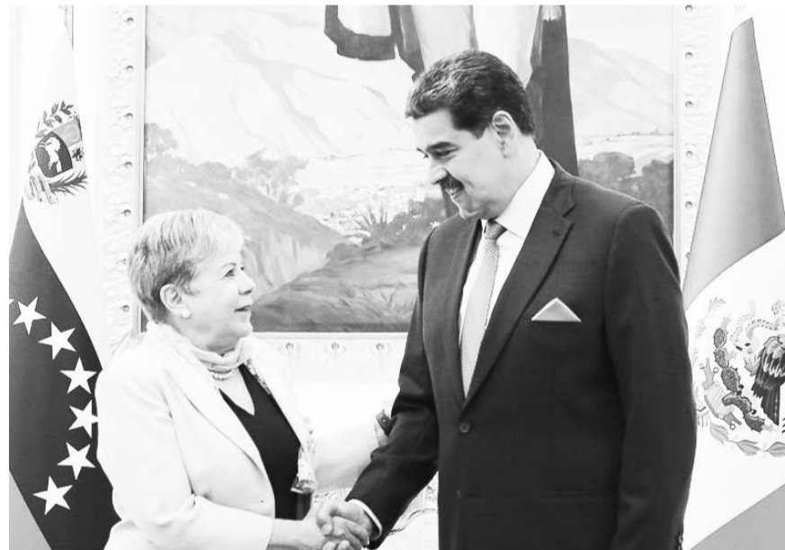
La canciller celebró la decisión del Gobierno y oposición venezolanos de retomar el diálogo y las negociaciones.

Indicó que nuestro país participará en la sesión de reactivación a celebrarse mañana, 17 de octubre, en Barbados y refrendó su compromiso de seguir facilitando el diálogo, con-