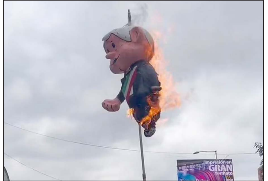
El Poder de la Judicatura reprobó lo que consideró ‘expresiones de odio’.

Ante los hechos registrados esta tarde, el Poder Judicial de la Federación condenó las expresiones simbólicas de