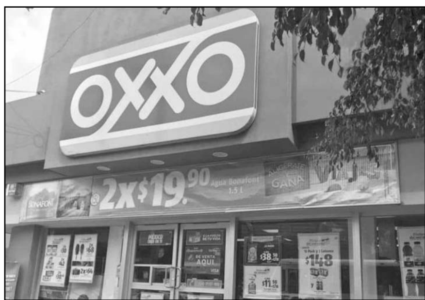
Oxxo tiene alianzas con los principales bancos que operan en México.

Oxxo tiene alianzas con los principales bancos que operan en México y la semana pasada informó que se encuentra en el piloto de un programa para aumentar la entrega de dinero en efectivo a clientes desde sus cajas.