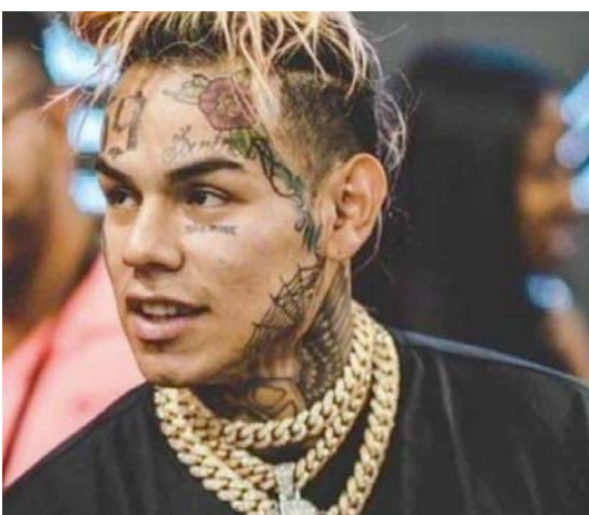
Se entregó en forma voluntaria.