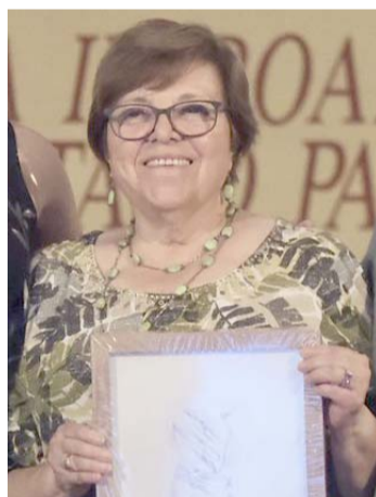
Su trayectoria y su obra marcan el perfil acorde a los temas alfonsinos.

También se destacó su labor docente y de investigación que, de acuerdo con el acta delibera-