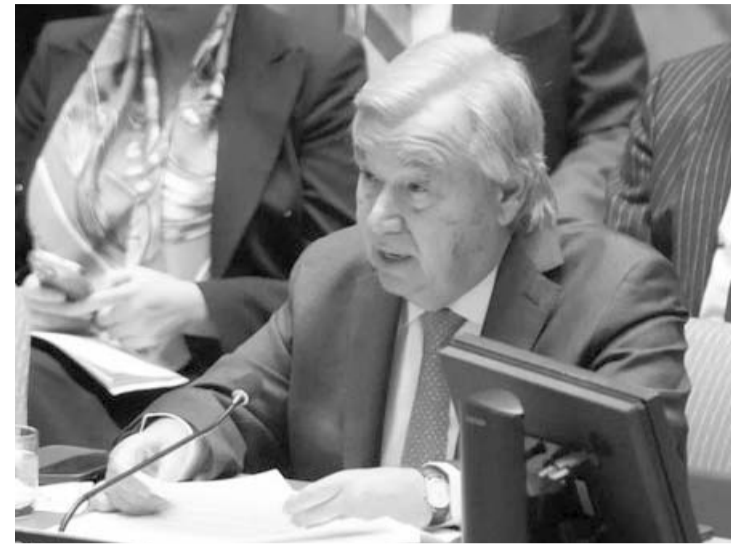
Los palestinos viven una ocupación sofocante de 56 años, dijo el secretario general y que causaron controversia.