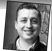
Luis Donaldo Colosio

“Era crónica de una licencia anunciada, creo que el gobernador fue bastante claro desde hace algunos meses en sus intenciones”