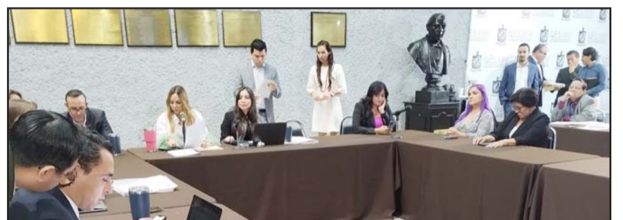
Después de seis meses la Comisión Jurisdiccional lo reactivó

"Se cierra el proceso en materia de incidente de Recusación y Declaración