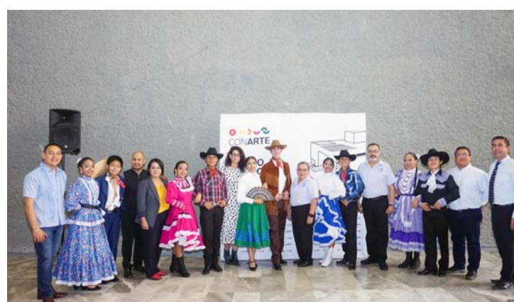
Participarán más de 200 parejas de NL, Coahuila, Chihuahua, Tamaulipas y Durango.

Además del diploma digital, habrá incentivos económicos para las parejas ganadoras, de 10 mil pesos, y una placa.