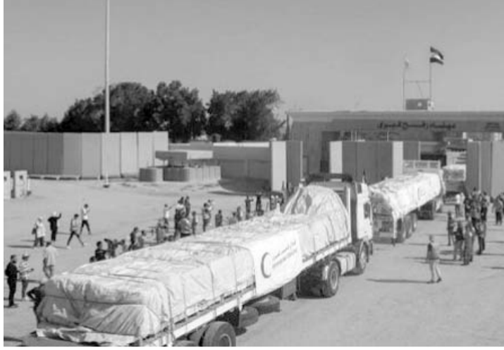
Con la ayuda no llega todo lo necesario, señalan, especialmente agua y combustibles.

También el gobierno de Egipto condenó que "las autoridades israelíes siguen insistiendo en no permitir el paso de combustible" a la Franja, pese a que el recurso es "de máxima importancia para la vida" de millones de gazatíes.