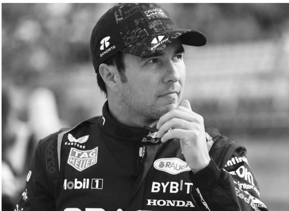
El mexicano tratará de aprovechar que será el anfitrión del GP de la Ciudad de México.

El mexicano correrá este domingo en su carrera de casa dentro de la Fórmula 1, iniciando el viernes con las prácticas libres en el Autódromo Hermanos Rodríguez de CDMX