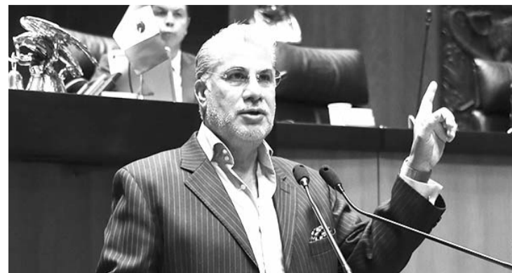
El senador morenista se opuso a la eliminación de las partidas.