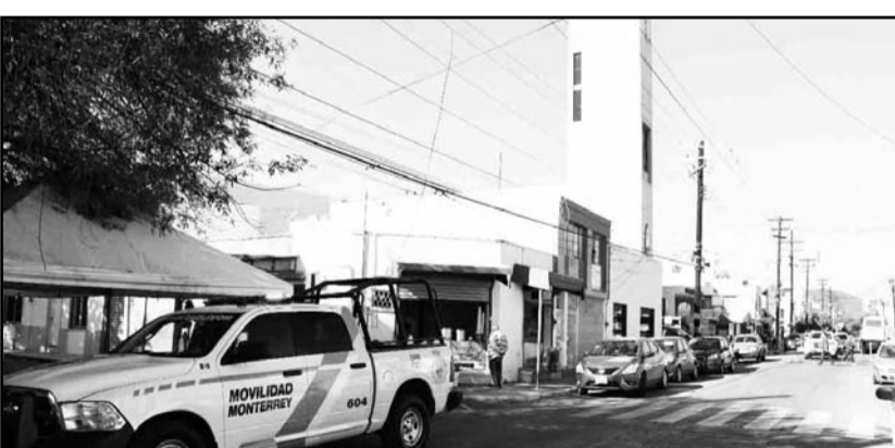
Será desde hoy y hasta el 29 de octubre cuando se haga la vigilancia.

En esta edición buscan recaudar 2 mil juguetes para las y los niños de las colonias de atención prioritaria del municipio de San Pedro Garza García, con el fin de regalarles una sonrisa al recibir un regalo para esta Navidad.(ATT)