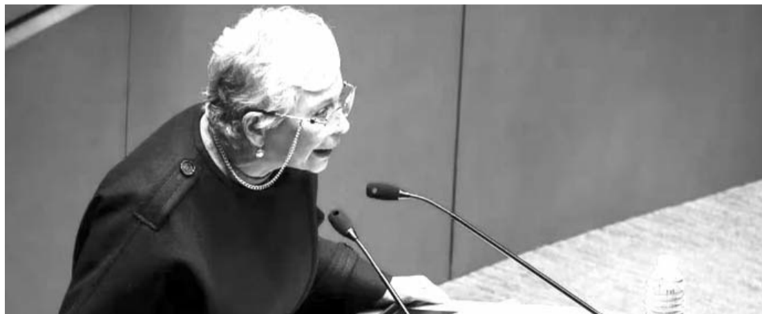
La legisladora por Morena considera que los fondos que desapareció su bancada son parte de las 'conquistas laborales' de los empleados de dicho poder.

"Estamos violando el artículo 17 constitucional los mexicanos tenemos derecho a la justicia pronta y expedita", sentenció el morenista.