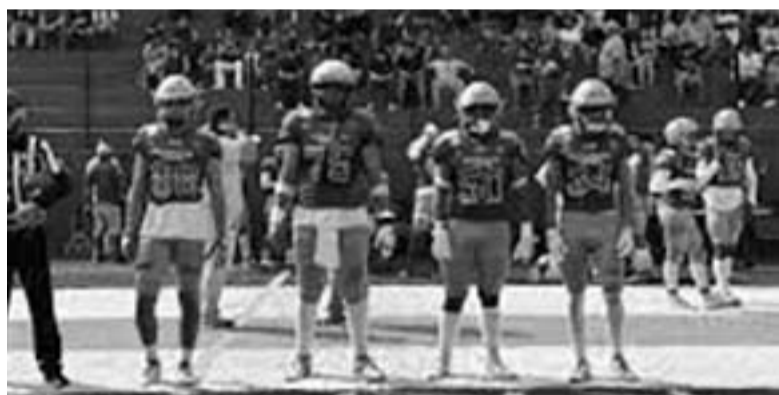
Los Auténticos Tigres vencieron al Politécnico Guinda.