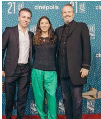
Presentación especial de "Tacones Lejanos" en Morelia.

El artista recordó sus inicios en el cine, anterior a su carrera musical, en la película "Gli eroi" ("Los héroes millonarios") de Duccio Tessari. El director era amigo de su madre Lucia Bosé. Duccio estaba a punto de rodar una