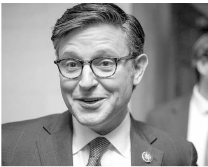
Quieren que Johnson sea líder del Congreso.

Con esta medida, el régimen de Nicaragua ha cerrado más de 3 mil ONGs