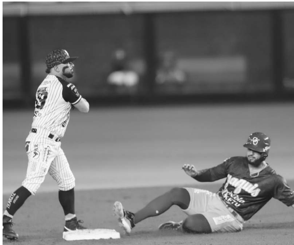
Sultanes fueron ampliamente superados por la nocena sonorensa.

Mientras tanto, los regios llegarán al mismo con un récord perdedor en la temporada que es de tres victorias por cuatro derrotas. (AC)