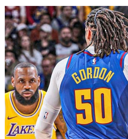
Nuggets venció a Lakers.

Jokic, el MVP de las finales de la NBA en la temporada anterior, tuvo un juego de 29 puntos, 11 asistencias y 13