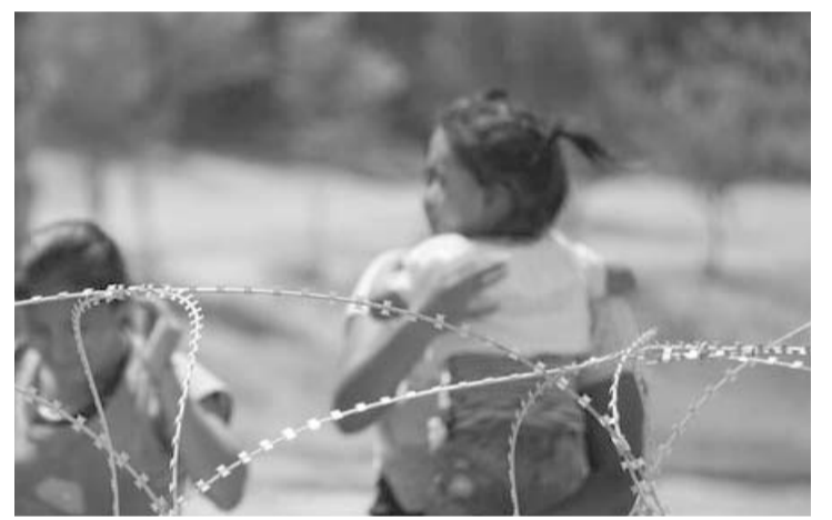
Cuestionan se mande cortar el alambre de púas.

Texas alega que la práctica de cortar el alambre aumentó recientemente cuando miles de migrantes cruzaron el río y llegaron al área de Eagle Pass a fines de septiembre. "Al cortar el alambre concertina