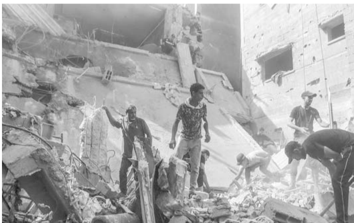
Llegaron ya a Tel Aviv los asesores de EU, que apoyarán en la estrategia de combate.

Por otro lado, el director general exigió un cese al fuego para que haya paz en territorio palestino y calificó el apoyo humanitario de Egipto como "una gota de agua en un océano de necesidades", pues los camiones con víveres apenas y pueden cruzar a Gaza a través del Cruce de Rafah.