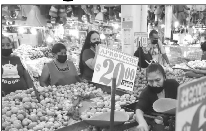
Con este resultado, el alza general de precios ya habría alcanzado su punto más bajo a tasa anual en 2023.