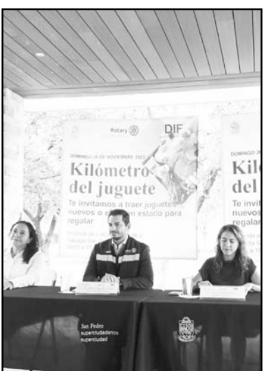
Será el próximo domingo.

Para cualquier auxilio, se pueden acercar a las autoridades que se encuentran en los alrededores del Santuario.(CL)