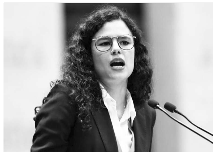
Luisa María Alcalde, secretaria de Gobernación.

En el Salón Tesorería de Palacio Nacional, el presidente López Obrador refirió que "lejos de disminuir año con año, los recursos de estos fondos han ido acumulándose".