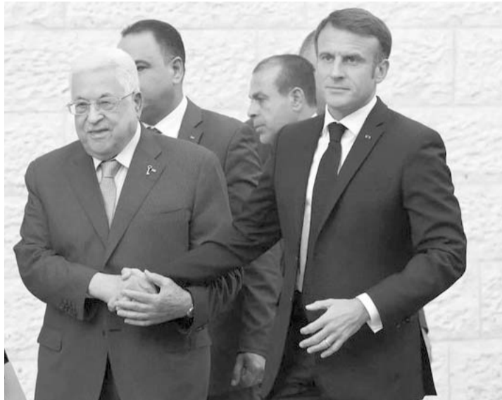
El presidente francés, en Medio Oriente.

El presidente de Francia, Emmanuel Macron, llegó este martes a Amán, la capital de Jordania, en la segunda etapa de su viaje por Medio Oriente para expresar la solidaridad de Francia con Israel, tras el ataque del movimiento terrorista Hamás contra su territorio. El dirigente francés llegó hacia las 22:30 horas tras visitar Israel y Cisjordania ocupada. En Amán, tiene previsto reunirse el miércoles con el rey jordano Abdalá II, con quien hablará de reactivar el "proceso político" para llegar a una "solución de dos Estados", uno palestino y otro israelí.