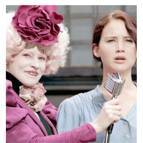
Debutará en Londres.