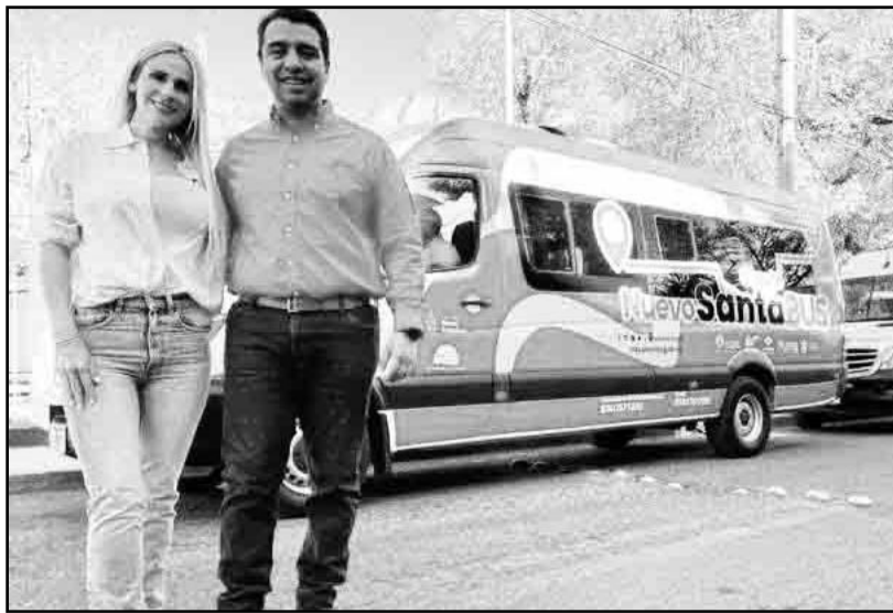
El presidente municipal y su esposa hicieron el anuncio.

“Ahora el Santa Bus aumentará en forma gradual de 30 a 60 unidades, con servicio eficiente en tiempo y recorrido, con lo que ahora el beneficio pasará de tres mil a seis