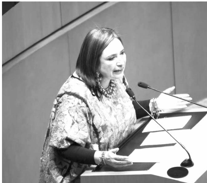
La panista Xóchitl Gálvez afirmó que darán a conocer a los mexicanos que el debate no es sobre los sueldos de los ministros.

"Trabajar al lado de ustedes. Ustedes acá afuera, nosotros allá dentro, pero cuenten con todo el respaldo del Partido