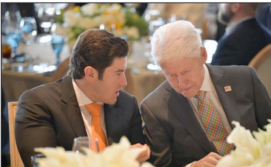
El ex presidente de Estados Unidos dijo que la edad no importa