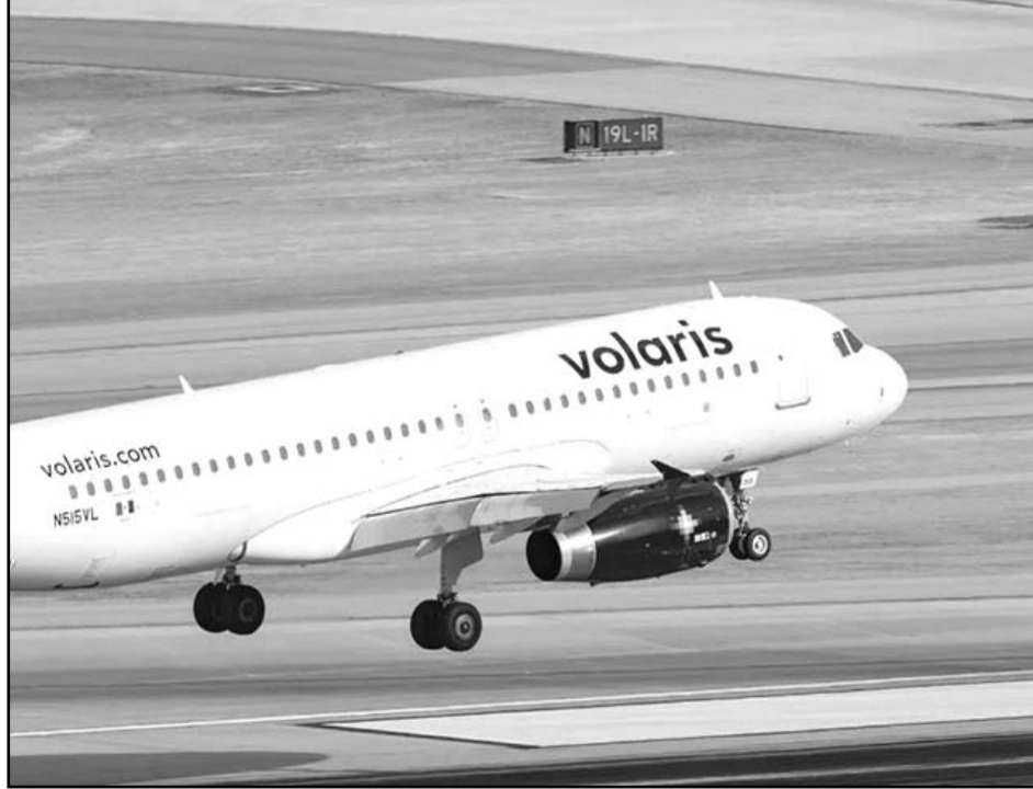
Volaris comentó que se enfrenta al reto de las inspecciones preventivas y aceleradas de los motores GTF por parte de Pratt & Whitney.

mano de Pratt & Whitney para obtener la asistencia técnica necesaria y la compensación monetaria por los motores afectados", agregó Beltranena. Volaris ha desarrollado un plan de miti-