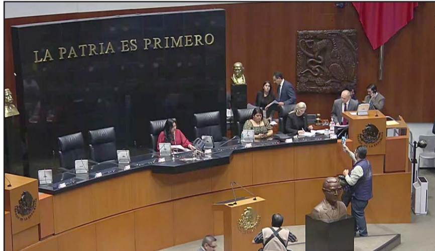
Morena defiende la decisión al argumentar que eran destinados para mantener los privilegios de los altos mandos de dicho poder.

"Morena gobierna con el populismo autoritario (...) Con una doble moral que crea fideicomisos para la