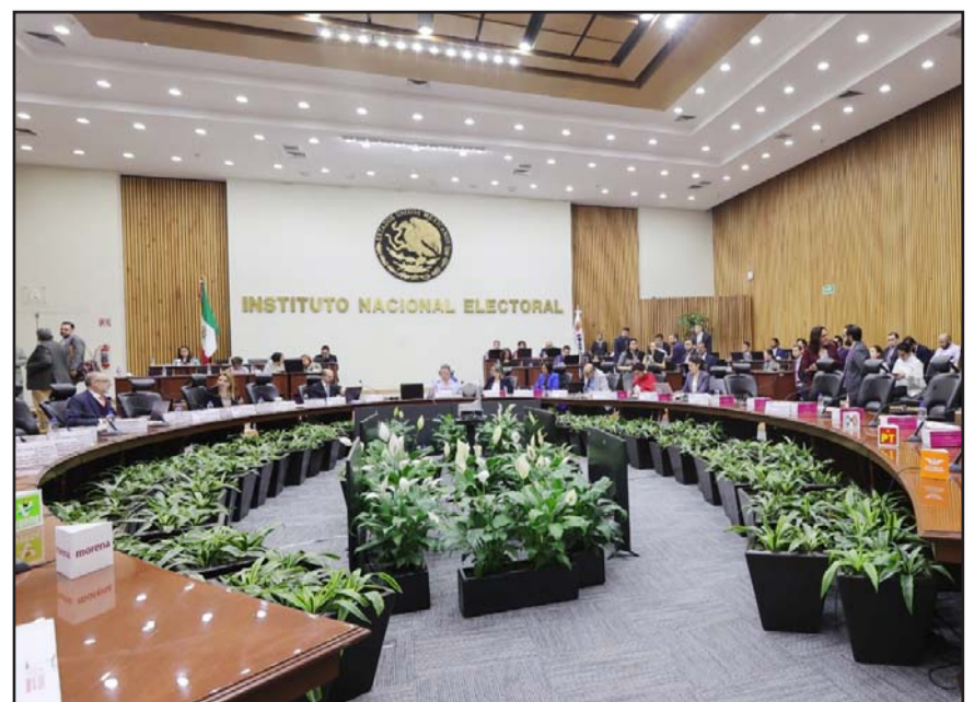
La medida fue aprobada por unanimidad, luego de que la semana pasada se rechazara por una confusión en la votación.

"Seguimos trabajando para que Nuevo León tenga agua siempre. ¡ánimo!", escribió García en redes sociales.