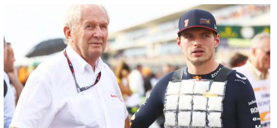
Red Bull sabe que Max y Helmut no serán personas muy gratas en México.

En la escudería Red Bull Racing ya están preparados para el ambiente hostil en el Gran Premio de México que