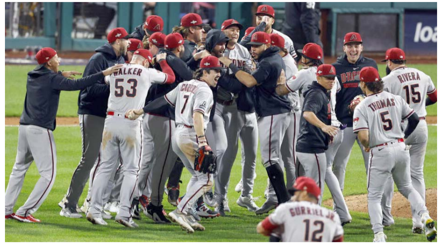
Los Diamantes se enfrentarán a los Rangers en la Serie Mundial.