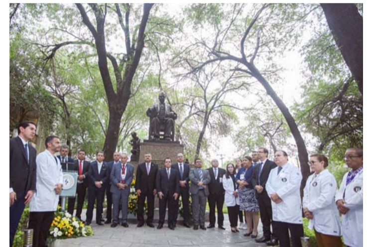
Se montó guardia de honor frente a la figura del doctor Gonzalitos, en la Facultad de Medicina.