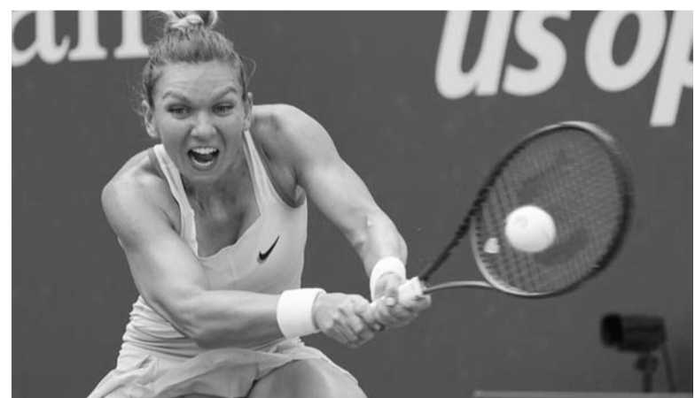
La rumana se dice inocente del caso.