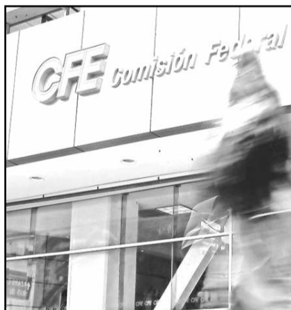
La empresa reportó pérdidas.

La Comisión Federal de Electricidad (CFE) reportó una utilidad neta de mil 567 millones de pesos en el tercer trimestre de 2023, de acuerdo con los estados financieros publicados este martes por la firma que dirige Manuel Bartlett Díaz. Esta pérdida contrasta con las ganancias netas que había registrado la compañía productiva del estado en el primer semestre de 2023, las cuales ascienden a 87 mil 794 millones de pesos. El resultado es menos negativo que el observado en el mismo lapso de 2022 cuando en ese entonces la pérdida neta ascendió a 50 mil 671 millones de pesos. Esta situación obedece a que, si bien los ingresos se incrementaron en una comparación anual, los gastos con-