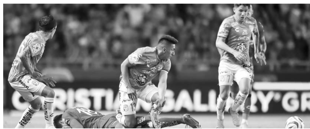
León y Atlas dividieron puntos y se alejaron de los primeros lugares del campeonato.

Tras este resultado, la ‘Fiera’ llegó a 19 puntos para que sean séptimos en el campeonato mexicano, mientras que los rojinegros llegaron a 16 unidades.