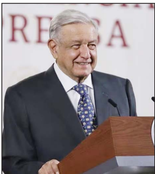
Anunció que pronto entrará en operaciones otra bomba del acueducto El Cuchillo II.