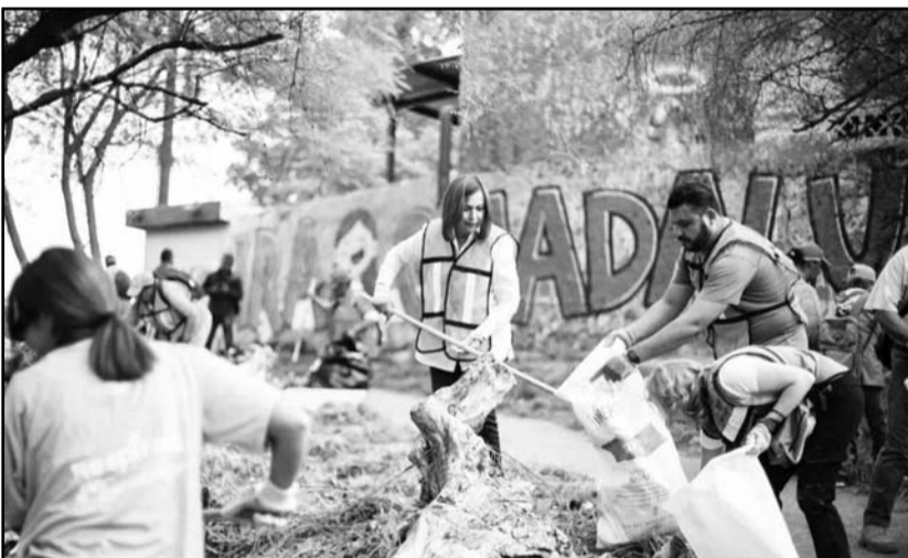
Se vio muy activa la alcaldesa de Guadalupe.

“Debemos tener presente, hoy que conmemoramos el Día Internacional del Cambio Climático, y siempre, el crear conciencia en las familias de Guadalupe sobre que cuidar el medio ambiente significa también preservar nuestra vida y salud”, dijo.(ATT)