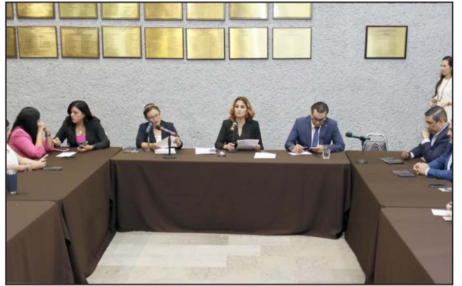
Si no da una respuesta entonces no admitirán la licencia

"Era crónica de una licencia anunciada, creo que el gobernador fue bastante claro desde hace algunos meses en sus inten-