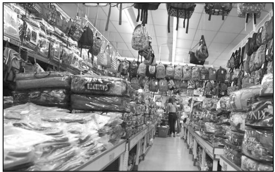
En México las importaciones de productos chinos crecieron 42% entre 2019 y 2022, para alcanzar un valor de 118 mil 697 millones de dólares.

terminó su vigencia durante octubre en 18 ciudades del país. Otros bienes y servicios cuyo aumento tuvo una fuerte incidencia en la inflación de la primera mitad del presente mes fueron el transporte aéreo, con un alza quincenal de 11.04%; los servicios turísticos en paquete, con 5.84%, así como el azúcar, que repuntó 5.6%. También los servicios profesionales, con un aumento quincenal de 3.57%; frijol, 1.99%; cerveza, 0.65%; automóviles, 0.41%; loncherías, fondas, torterías y taquerías, 0.19%, y vivienda propia, 0.15%. Al interior del Índice Nacional de Precios al Consumidor, los productos agropecuarios sirvieron de contención a esos incrementos, pues su descenso de 1.72% en la quincena no estaba contemplado y permitió evitar que el repunte de 2.03% en los precios de energéticos ocasionara un impacto significativo, explicó Arias. Los productos cuya baja de precios quincenal tuvo una mayor incidencia en la inflación durante la primera mitad de octubre fueron el jitomate, con -9.67%; cebolla, -7.33%; naranja, -6.76%; aguacate, -4.46%; limón, -3.6%; pollo, -3.28%; plátanos, -2.18%; huevo, -1.65%; así como gasolina de bajo octanaje, -0.25% y pañales, -1.05%. Debido a una base comparativa menos favorable y a los mayores precios del petróleo, se prevé que la inflación interanual se acelere ligeramente al cierre de año, para retomar su tendencia descendente a partir del primer trimestre de 2024, estimó Alejandro Saldaña, economista en jefe de Ve por Más.