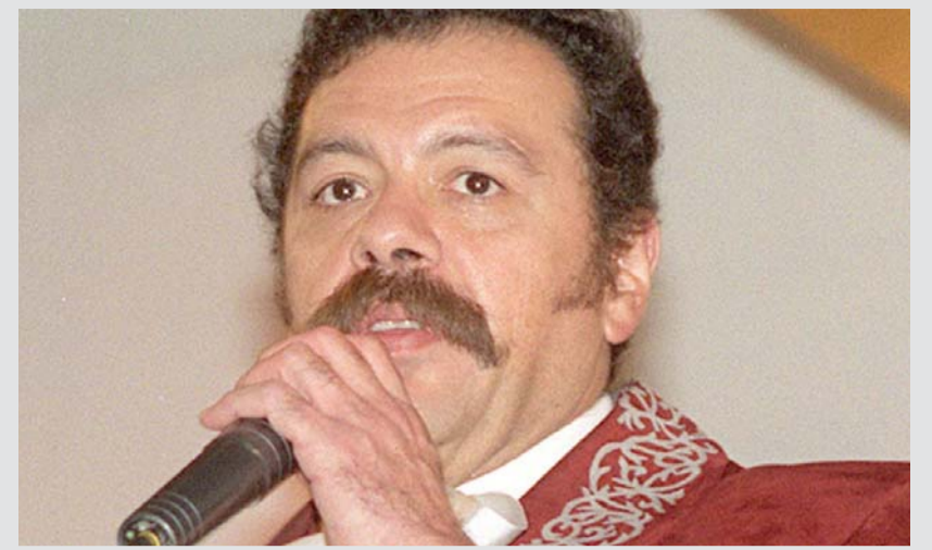
Fuentes periodísticas aseguran perdió la vida por cáncer de tiroides.

Y aunque no se podía quejar de su suerte, fue hasta 1999 cuando saltó a la fama internacional gracias a "Bob Esponja" donde interpretó al tacaño dueño del negocio de hamburguesas, El Crustáceo Cascarudo y jefe de Bob Esponja, Don Cangrejo.