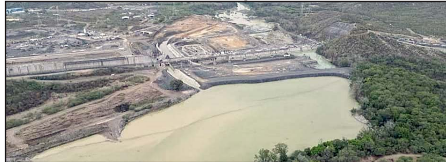
Faltan seis días para que se cumpla el plazo establecido.

Es de destacar que si se toma en cuenta la operación del segundo acueducto en el Cuchillo, cuya construcción aún no concluye, las condiciones cambiarían a favor de Nuevo León.