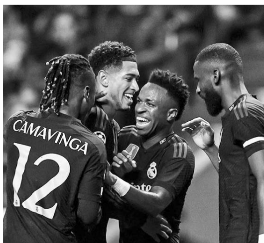
El equipo merengue marcha sin perder.

Manchester United venció 1-0 al Copenhague, Real Sociedad derrotó 1-0 a Benfica, Lens igualó 1-1 con PSV, Arsenal superó 2-1 a Sevilla, Napoli derrotó 1-0 al Unión Berlín, Inter de Milán se impuso 2-1 al Salzburg y Bayern de Munich se