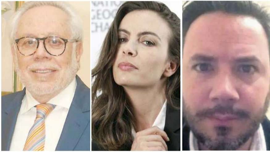
La cantante dice que donará el dinero de la demanda.