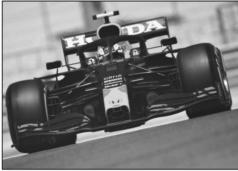
Pérez tuvo su vuelta más rápida en un tiempo de un minuto, 25 segundos y 112 milésimas

Por su parte, el mexicano Sergio Pérez, quien no estuvo en su RB19 de Red Bull Racing en la práctica libre número uno ya que fue sustituido junto a Max Verstappen por pilotos reservas, si lo estuvo en la segun-