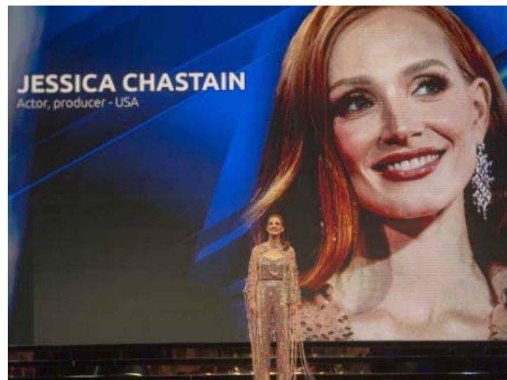
El príncipe Moulay Rachid que encabeza la fundación del Festival, lo llamó "bastión de paz que acerca a la gente".

Debido a esta situación fue que el Festival Internacional de Cine de El Cairo y el Festival de Cine de Cartago en Túnez, fueron cancelados.