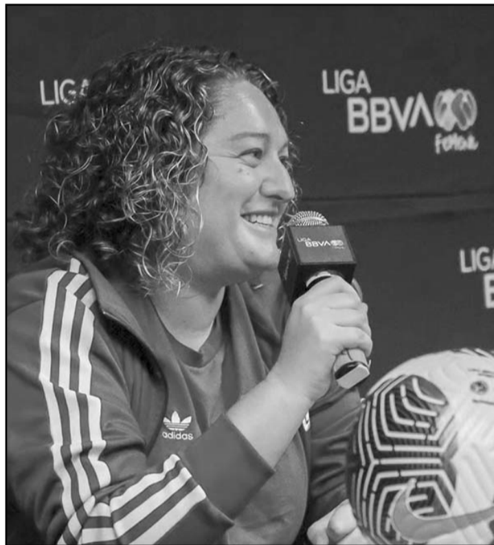
Martínez ve el duelo de vuelta como si el juego estuviera igualado a cero dianas.

Aunado a eso, Martínez dijo que Tigres Femenil ya puede ser