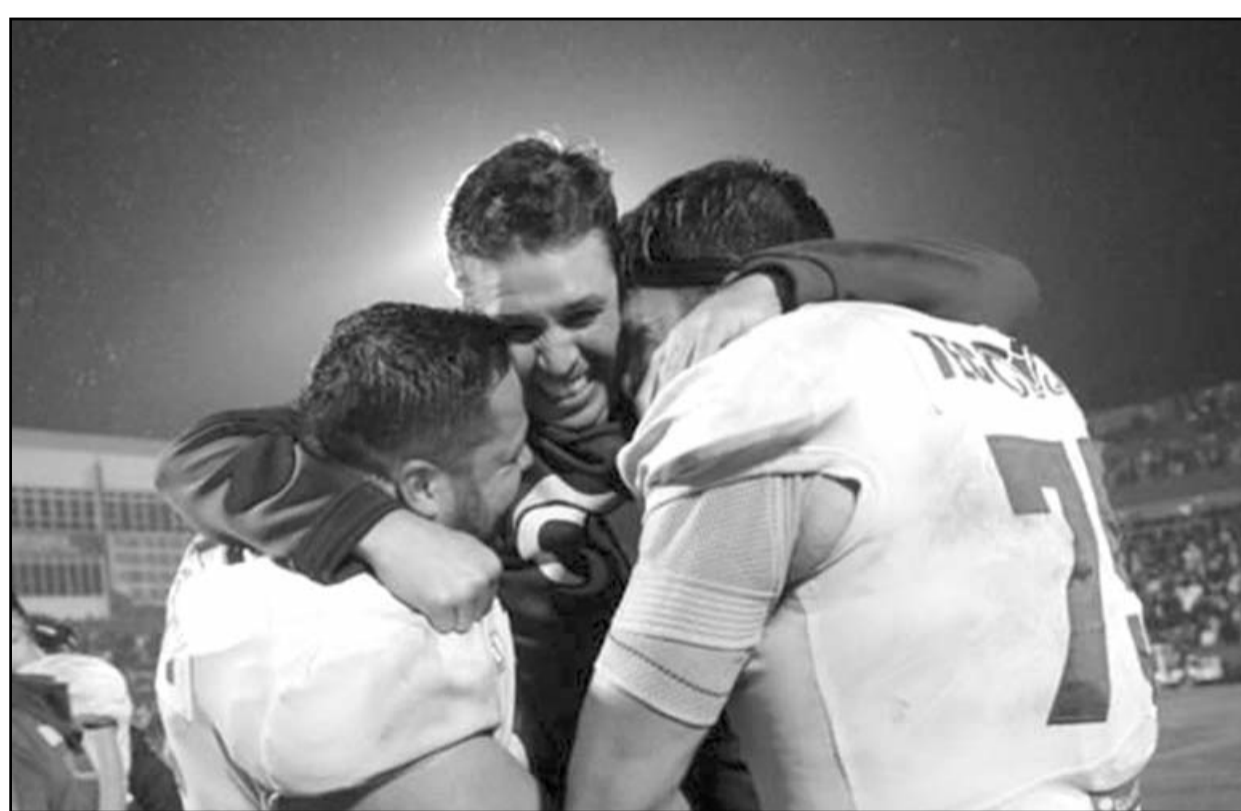
"Estamos contentos de que en nuestro ochenta aniversario cerramos de esta manera".

"Estamos contentos de que en nuestro ochenta aniversario cerramos de esta manera, nos llenó de orgullo iniciar la temporada con