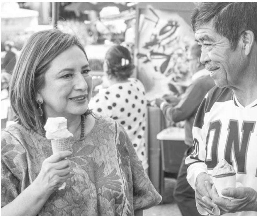
La precandidata del Frente Amplio por México minimizó las pugnas internas entre los partidos de la alianza opositora.

Rechazó las críticas hacia su coordinador de campaña, Santiago Creel, y dijo que hay argumentos para ganar las elecciones, porque “yo he iniciado campañas con 35 puntos abajo”, pero el tema es que “estamos compitiendo contra demasiados millones de Sheinbaum”.