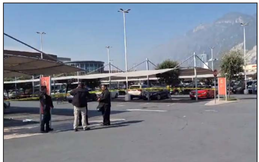
Se registró en el municipio de San Pedro.

Las autoridades se entrevistaron con el conductor del tráiler, quien resultó ileso en el accidente y estableció como se registró el choque y volcadura.