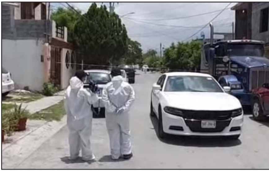
Ocurrió en la colonia Valles de San Francisco.

Fueron vecinos del lugar quienes reportaron a una unidad de la Policía preventiva de Escobedo, que se apreciaban manchas de sangre en el piso y el barandal.