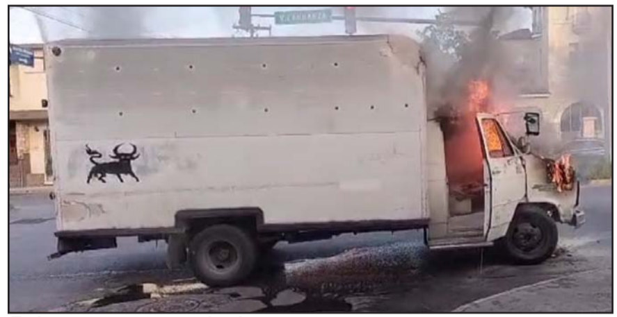
Todo apunta a un cortocircuito.

Al acusado también se le condenó a cumplir tratamiento médico - psicológico en forma integral ininterumpida.