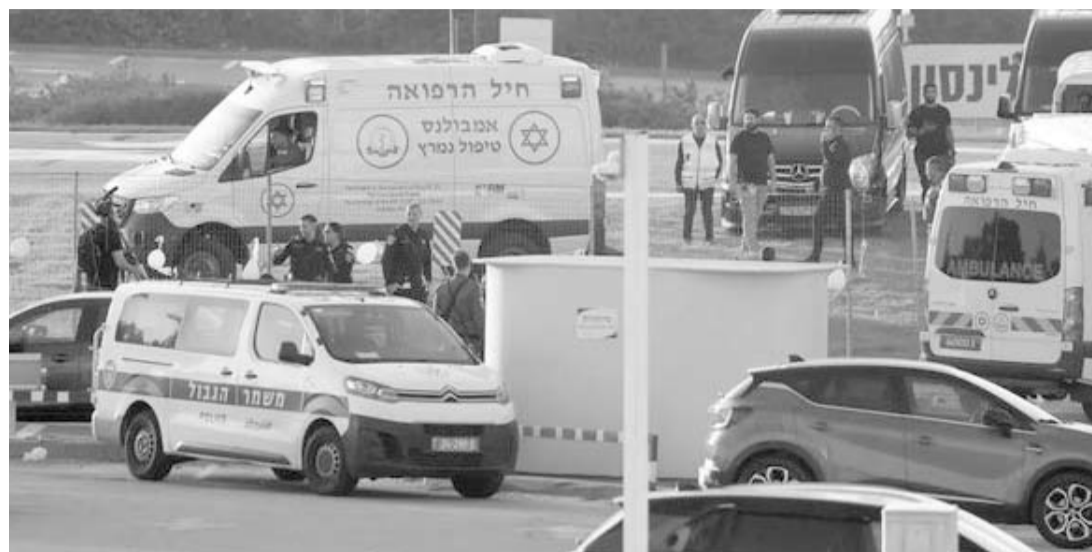
Las corporaciones de socorro trasladaron a los cautivos a zona de resguardo para revisión médica.

Israel también informó que los rehenes liberados han sido sometidos a controles médicos. El primer ministro de Israel, Benjamín