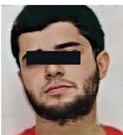
Fue pieza clave en el 'Culiacanazo'.