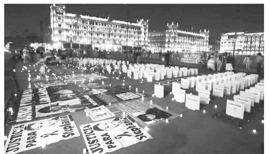
La protesta se da en el marco del Día Internacional por la Eliminación de la Violencia en Contra de las Mujeres.

El presidente López Obrador aseguró este viernes que el Poder Judicial está "muy podrido" por lo que reiteró que antes de que se vaya impulsará una reforma para reformar la Constitución y en donde se establezca el pueblo elija a jueces, magistrados, ministros.