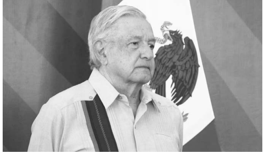
El mandatario mencionó que buscan que el exdirector de Pemex ‘devuelva lo sustraído al Estado, a la hacienda pública’.

“No hay todavía un acuerdo. Nosotros lo que estamos planteando es la reparación del daño, que devuelva lo sustraído al Estado, a la hacienda pública, lo que ilegalmente obtuvo, y hay diferencias en cuanto al monto, ellos están planteando creo que 20 millones de dólares devolver, y Pemex y Hacienda hablan de 100 millones de dólares, en esos términos, y por eso no se ha concedido la libertad condicionada, porque no hay ese arreglo”, explicó.