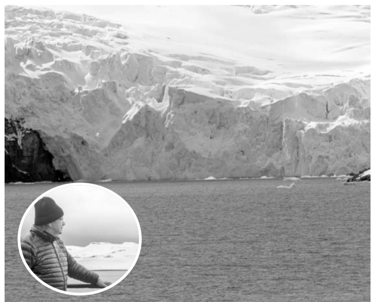
El secretario general de la ONU estuvo en la Antártida previo a la reunión del Cambio Climático, COP28.

"Lo que sucede en la Antártida no se queda en la Antártida", dijo Guterres. Además de reflejar mucha luz solar lejos de la Tierra, la Antártida regula el clima del planeta porque su hielo y sus aguas frías impulsan las principales corrientes oceánicas. Cuando grandes cantidades de hielo se derriten, eleva el nivel del mar y cambia cosas como la salinidad y los hábitats de los animales marinos.