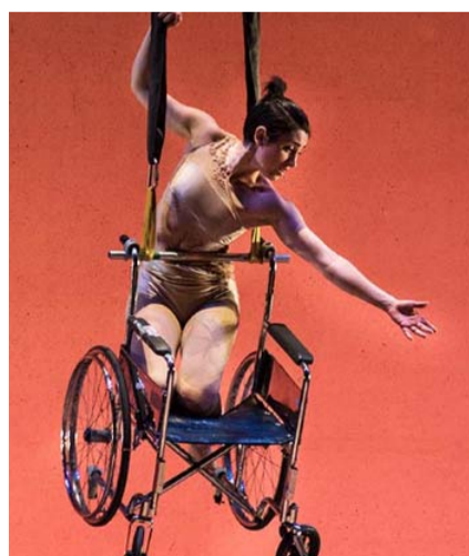
También se llevará a Apodaca, Allende y Monterrey.

Este año cuenta con la colaboración del Consejo para la Cultura y las Artes de