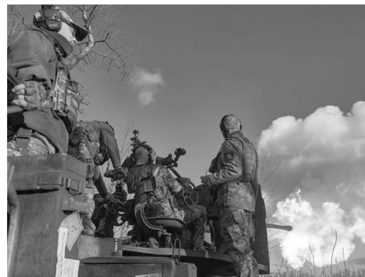
Apremia robustecer a la ONU para alcanzar la paz global.

Guterres se encuentra en una visita oficial de tres días al continente sur. El presidente chileno