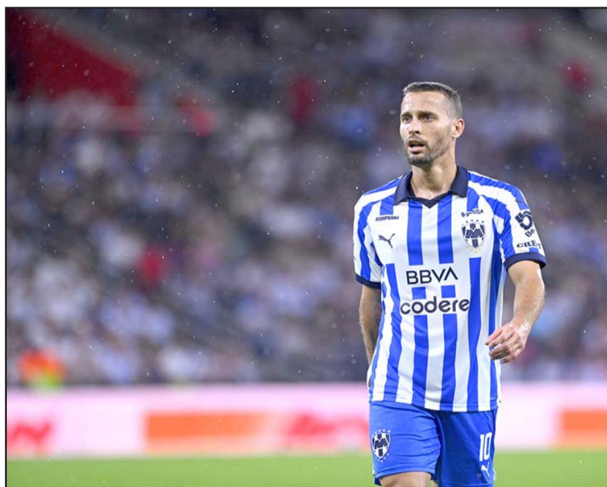
El español está tenido una increíble recuperación post cirugía luego de su lesión miotendinosa del recto anterior del cuádriceps izquierdo.

El primer equipo. Ya en más de la rueda de prensa de Fernando Ortiz, el técnico charrúa dijo que respetarán en todo momento al San Luis en la Liguilla y que por la cabeza no les pasa el hacer menos al plantel potosino que consiguió su pase a la fiesta grande por medio del Play-In.