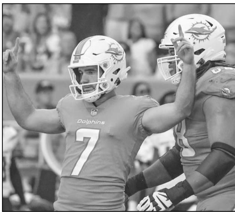
El conjunto de Miami aprovechó su gran momento para vencer en Nueva York a los Jets y por marcador final de 34 puntos contra 13.

Cabe señalar que este duelo entre Sultanes y Tomateros, el cual será el segundo de los tres en total en esta serie, iniciará hoy en punto de las 21:00 horas.