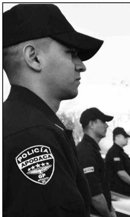
Se rediseñó el sistema policial.

Cabe destacar, que de acuerdo al INEGI, el Gobierno Municipal de Apodaca ocupa el primer lugar en Nuevo León en desempeño gubernamental, y el segundo lugar a nivel nacional, con 57.2 por ciento.