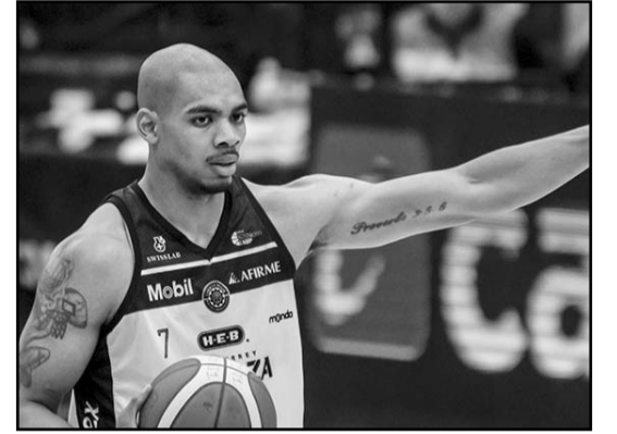
Fuerza Regia venció en casa a las Abejas de León

Y el tercero va a ser el próximo lunes en el Domo de la Fiera, comenzando el compromiso en punto de las 20:00 horas.