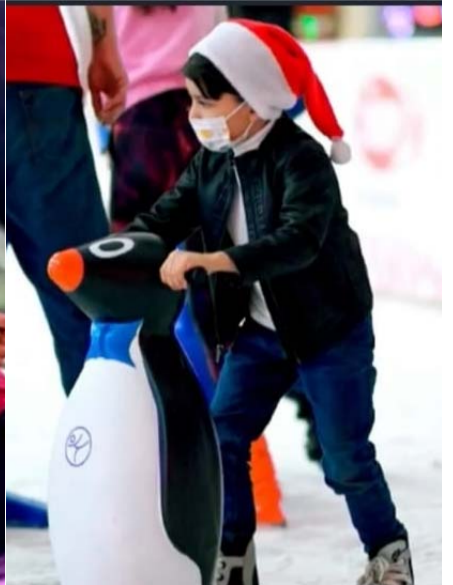
Las diferentes actividades pueden ser disfrutadas por chicos y grandes.