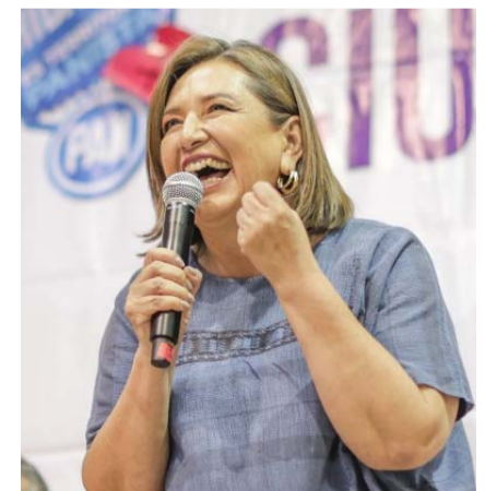
Dijo que dicha estrategia ha causado la muerte de 170 mil personas.

"Para eso tengo tres cosas, tengo cabeza, mucha cabeza, tengo mucho corazón y tengo mucho carácter, yo no voy a andarle dando abrazos a los delincuentes, porque la estrategia de abrazos y no balazos, no es una estrategia, es una ocurrencia criminal y esa ocurrencia criminal ha hecho que hayan fallecido 170,000 personas, que hayan desaparecido 46,000 personas, vamos a aplicar la ley, porque la ley es la ley, aquí no hay de otra, vamos a trabajar duro para resolverle la paz y la tranquilidad".