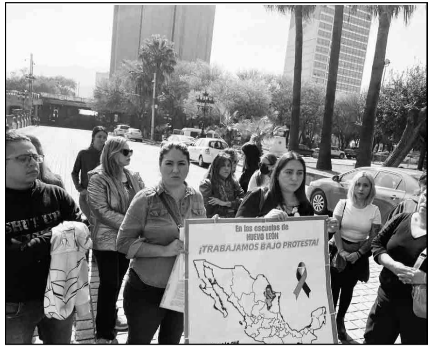
Decenas de profesores de las dos secciones protestarán.