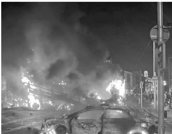
La violencia se desata tras el apuñalamiento de cinco personas, incluyendo tres niños y una mujer.

"Como país necesitamos recuperar Irlanda. Necesitamos arre-