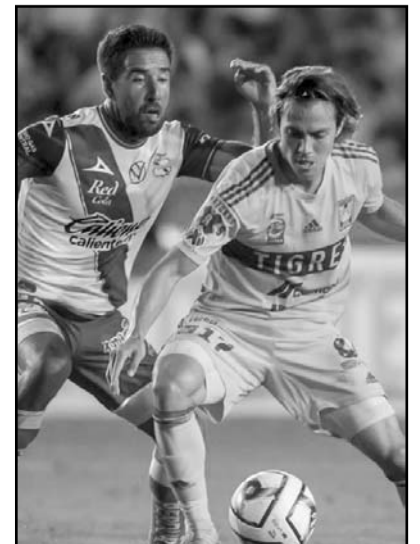
Puebla tienen poco más de seis años sin perder frente a Tigres

Si bien el conjunto felino tiene buenos resultados ante Puebla en estos últimos años cuando los enfrentan en el estadio Universitario, también es un hecho que los enfranjados con dos triunfos cuentan con más victorias que los de la UANL en territorio camotero desde marzo del 2017 en adelante, con cero.