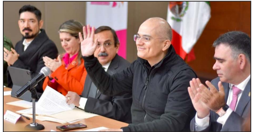
Se destacó la integración de seis comisiones de trabajo.

"Estas seis comisiones han estado trabajando y articulando acciones que nos permiten poner en marcha las 53 líneas de acción que componen el Programa Estatal, de forma transversal en los 51 municipios del estado", expuso.