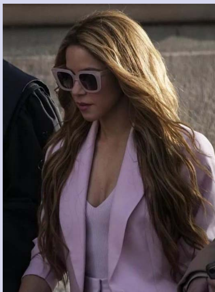
Shakira quiere superar estos tragos amargos por sus hijos y poder seguir su carrera musical.