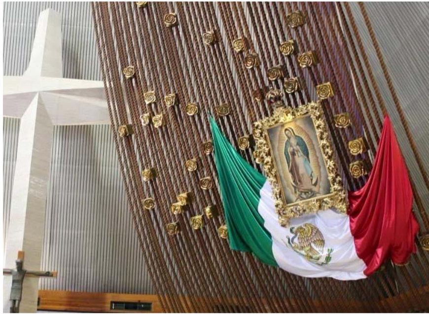
La celebración será el 6 de diciembre.