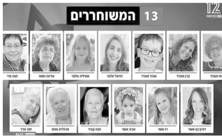
Algunas de las personas cautivas, hoy ya en libertad.

La administradora de la Agencia de los Estados Unidos para el Desarrollo Internacional (USAID), Samantha Power, dijo que "Estados Unidos acoge con agrado la pausa en las hostilidades en Gaza como una oportunidad