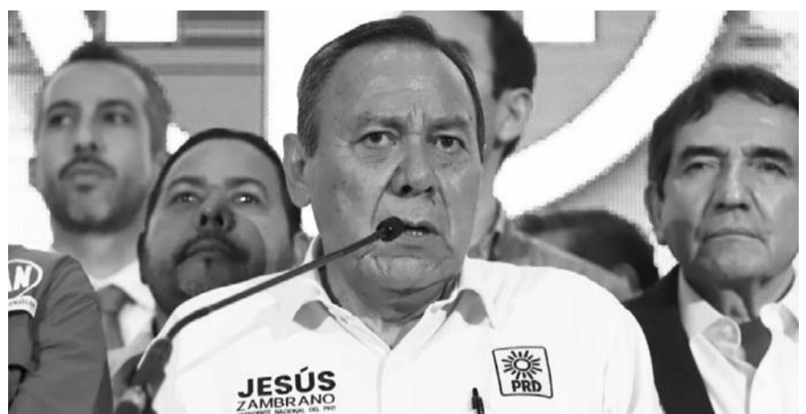
El líder del PRD, Jesús Zambrano, afirmó que ‘no está en funcionamiento’.