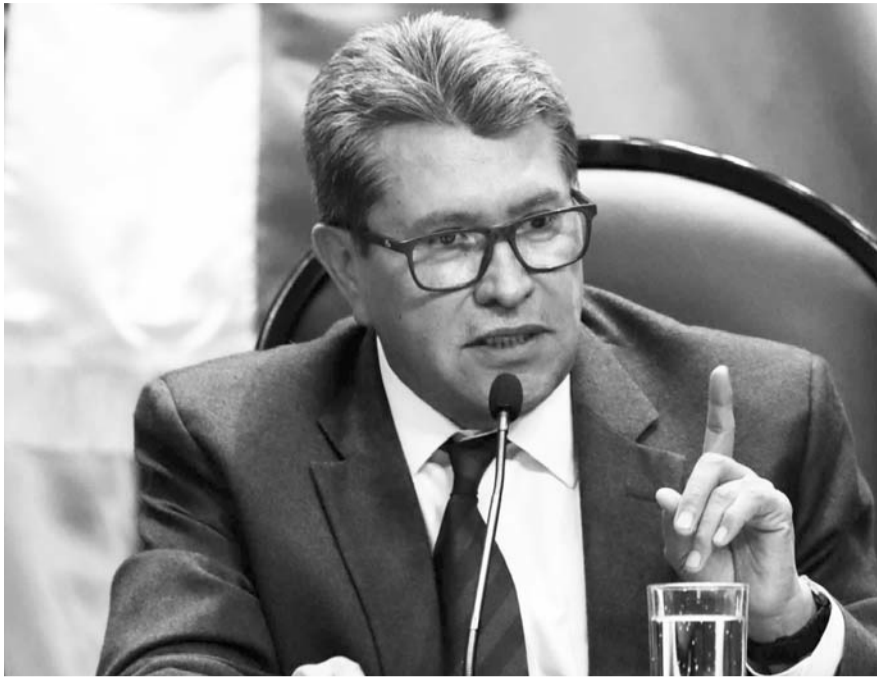
El legislador perdió la encuesta para definir al coordinador nacional de la 4T.