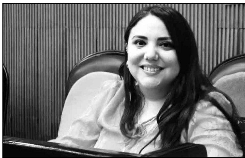
La propuesta es que se implementen estrategias adecuadas.