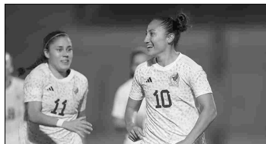
Fueron convocadas para los duelos ante Puerto Rico y Trinidad y Tobago.

La Selección Nacional de México Femenil visitará a Puerto Rico el próximo viernes 1 de diciembre en el Estadio