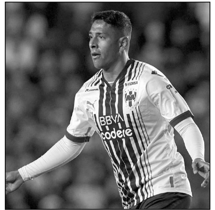
Los Rayados volvieron el viernes a los entrenamientos