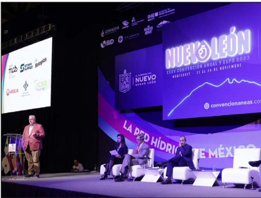
Durante tres días se desarrollaron 26 cursos y talleres.

En Torreón, donde efectuó un pegeoteo, habló de los logros en Nuevo León.