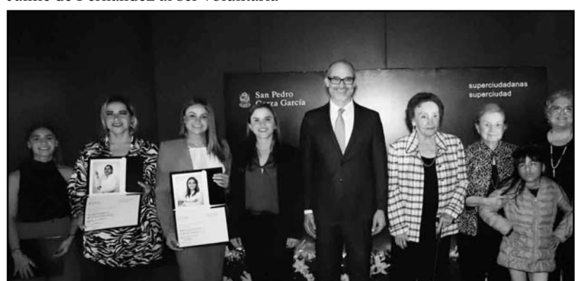
Fue parte de la convocatoria ‘Sampetrinas Mujeres Líderes’