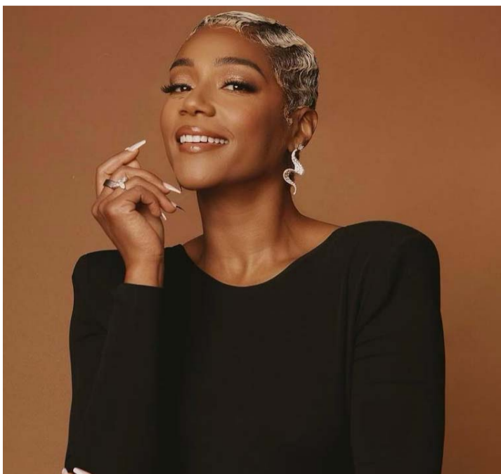
No es la primera vez que le sucede.