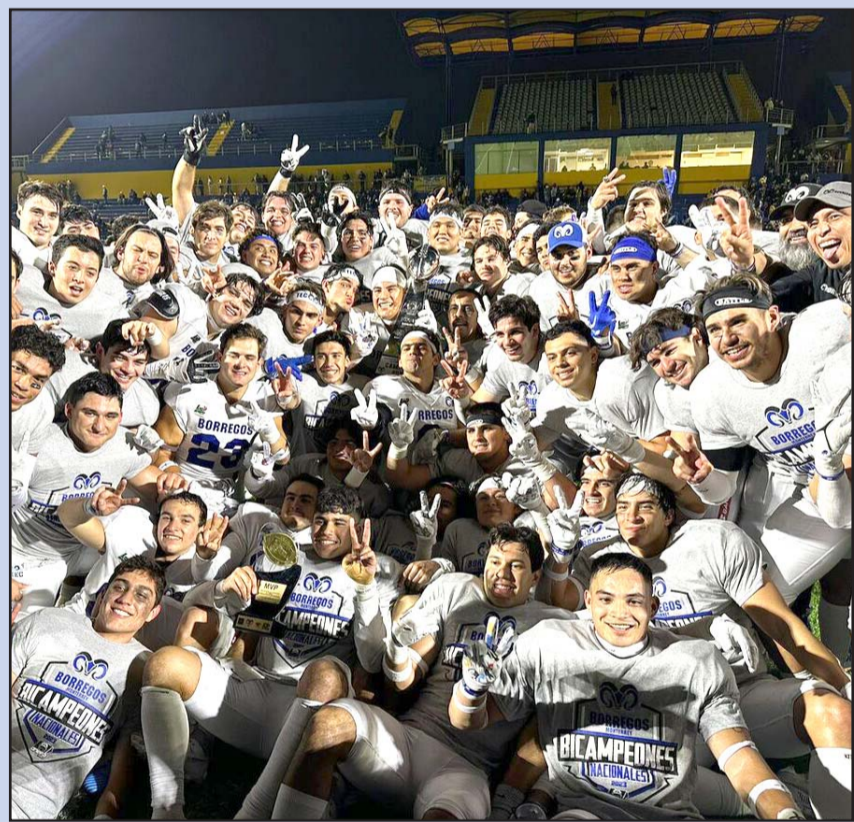
Por segundo año consecutivo, los Borregos Salvajes volvieron a coronarse en el Gaspar Mass ante los Auténticos Tigres.