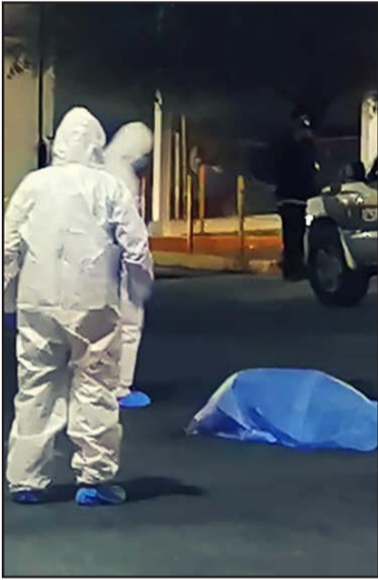
Un camión la arrolló.

Un hombre de la tercera edad se encuentra en estado grave, después de