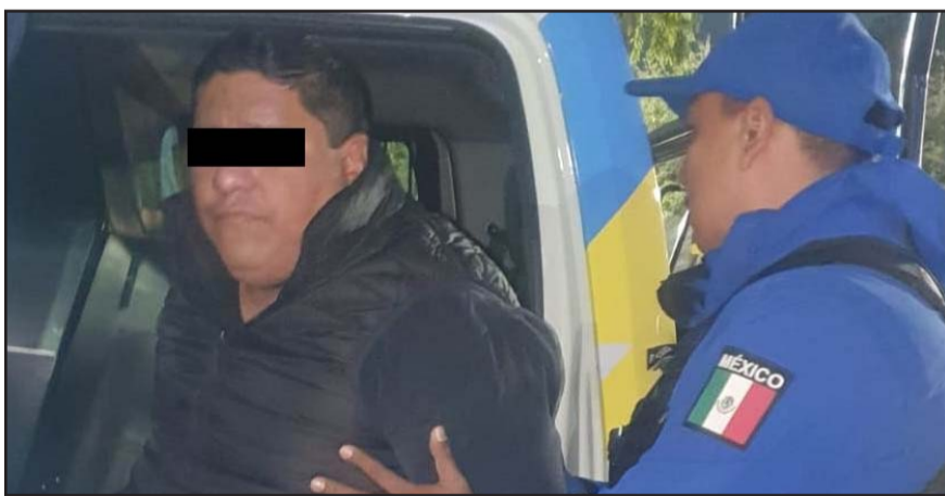
Fue detenido por las autoridades.

En las cámaras de seguridad del centro comercial, se aprecia como tres sujetos descienden de un segundo automóvil, que se detuvo a pocos metros de distancia.