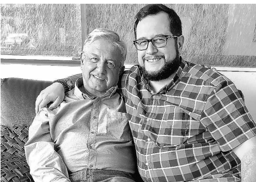
El presidente dijo que algunas publicaciones de su hijo no le gustan.

Alrededor, las mujeres llevan a cabo una velada silenciosa para manifestarse de forma pacífica con el objetivo de visibilizar las muertes violentas de niñas y jóvenes.