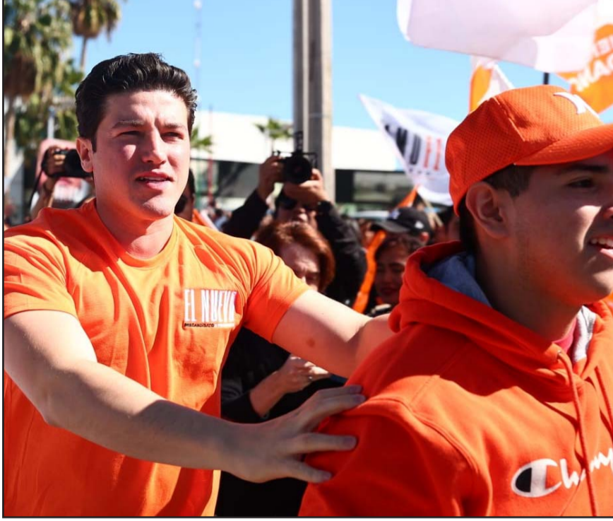
El PAN y el PRD se quejaron por supuestos actos anticipados de campaña durante el registro del precandidato de Movimiento Ciudadano.

"(Se le exhorta a) respetar su deber de abstenerse de realizar, difundir manifestaciones y emitir señalamientos de carácter electoral, conduciéndose con prudencia discursiva en todo momento para evitar que sus expresiones busquen favorecer o