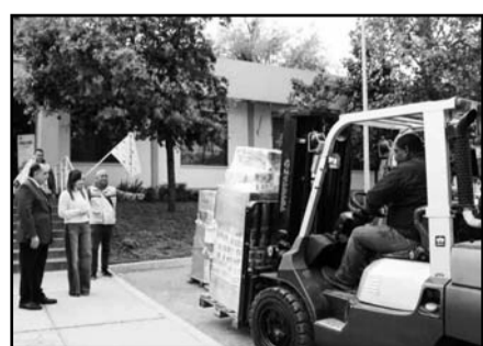
Es lo que logró recaudarse.

“Queremos agradecerles en nombre de todo el Gobierno de Monterrey por respon-