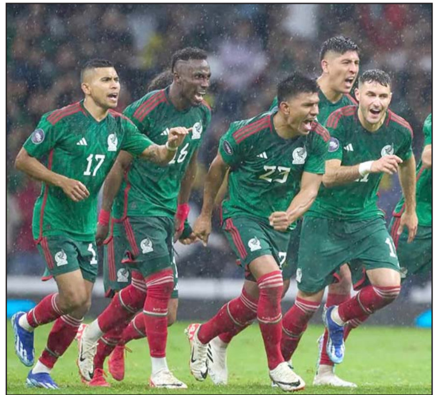
México estará en el bombo número uno con Argentina, Brasil y Estados Unidos.

Hay que recordar que la Copa América iniciará el 20 de junio y terminará el 14 de julio del próximo 2024.