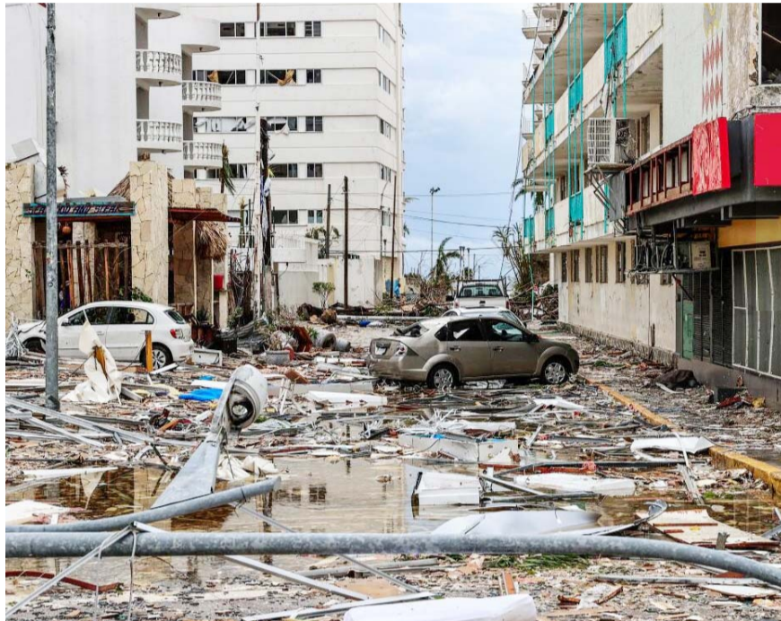
Acusan que hay 'desinterés presidencial' en atender problemáticas de la ciudad.