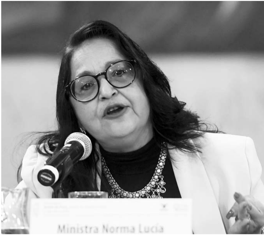
La ministra presidenta de la Suprema Corte, Norma Piña, sostuvo que laboran por la justicia, la igualdad y el respeto a los derechos.

A través de un video difundido al inicio del Foro "Feminicidio, la forma extrema de violencia contra las mujeres y las diferentes caras de la violencia contra la mujer", señaló que la sensibilización es uno de los primeros pasos hacia la acción, por lo que las sentencias y resoluciones que emite el PJF tienen como objetivo de reconstruir una sociedad libre de violencia.