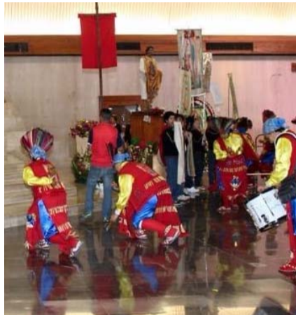
Crece la devoción por la Virgen.

En la coronación de la Virgen, se aclama a María como señora y patrona. Este acto litúrgico es ocasión para renovar el deseo de entrar en el reino, para intensificar la fe en la vida eterna y para impulsar gestos de misericordia y de perdón.