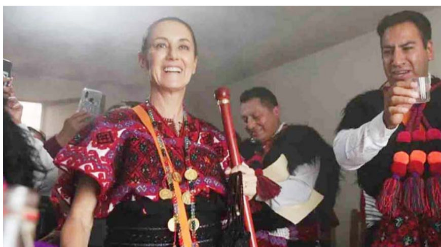
La precandidata de la 4T recibió bastón de mando en los Altos de Chiapas.

"México es para todos y para todas y que la igualdad se construye juntos. Los derechos de las mujeres son igual que los