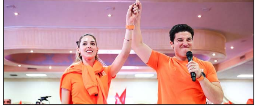
Pidió le pusieran a Xóchitl o a Sheinbaum a las que ya noqueó.

"Sin embargo, la Comisión de Quejas y Denuncias determinó por unanimidad la improcedencia de las medidas cautelares, ya que las manifestaciones realizadas fueron en el contexto del registro; sin embargo, se hace un llamado a conducirse de manera prudente", refiere el documento.