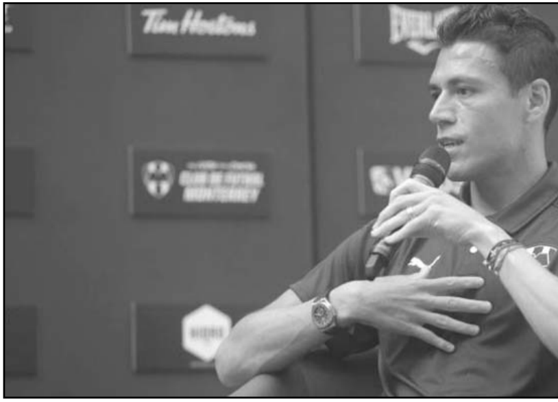
Moreno llegará a cuatro años con los Rayados

Después del entrenamiento, los jugadores pasaron a la sala de prensa del estadio Universitario y después al vestidor, en donde formaron parte de las fotografías y grabaciones de esta situación.