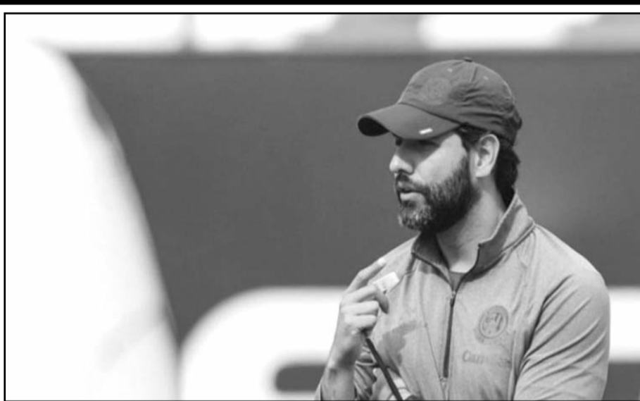
San Luis logró su pase a los cuartos de final tras vencer por marcador de 3-2 al León en el duelo del Play-In.

"Sabemos de la calidad de Monterrey, del gran equipo que son y jugar contra