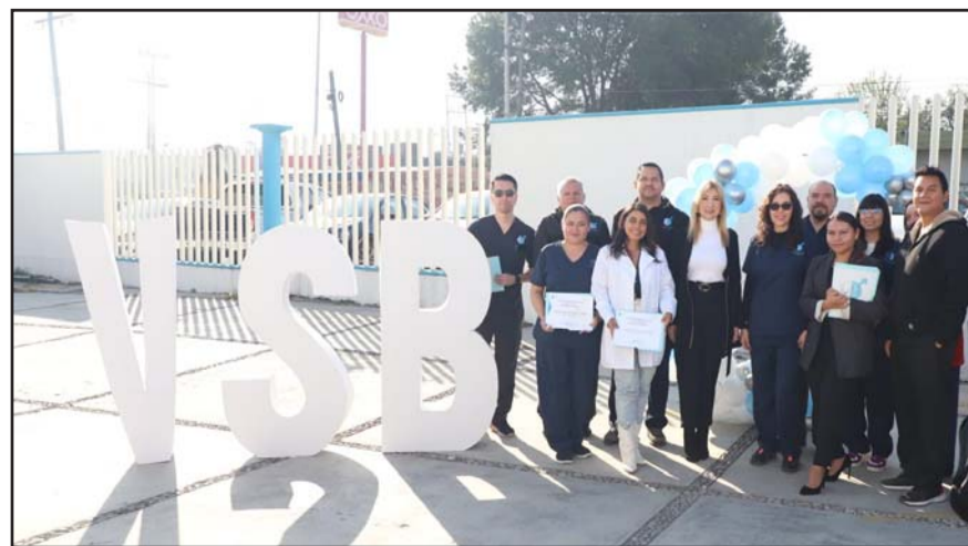
Más de mil 500 procedimientos al año se hacen en el estado.

Los interesados pueden pedir informes y agendar una cita al teléfono 81 8130 7052.