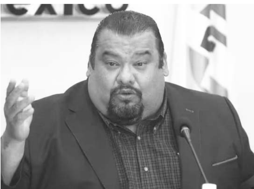
El conocido como 'Rey de la Basura' fue líder del PRI en el Distrito Federal.