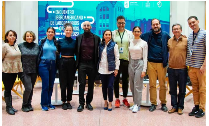
Toda propuesta busca el bien común de la sociedad.

de experimentación sonora donde atmósferas, ruidos, máquinas, grabaciones de campo y sonidos experimentales estarán a cargo del mediador y artista sonoro Homero Salazar, el