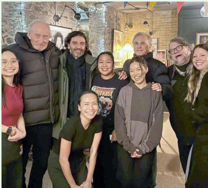
Del Toro y parte del elenco se reunieron a comer en un restaurante de comida tailandesa.

Sin embargo, y de manera más reducida, la presencia del