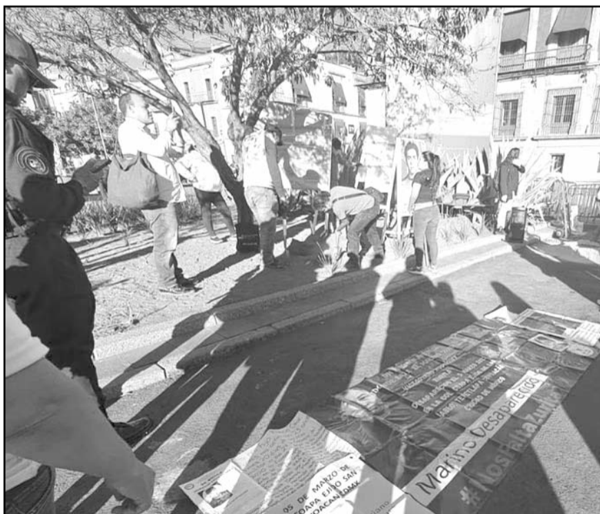
"La única respuesta que tenemos por parte del gobierno federal en este fin de sexenio es el interés para reducir las cifras"