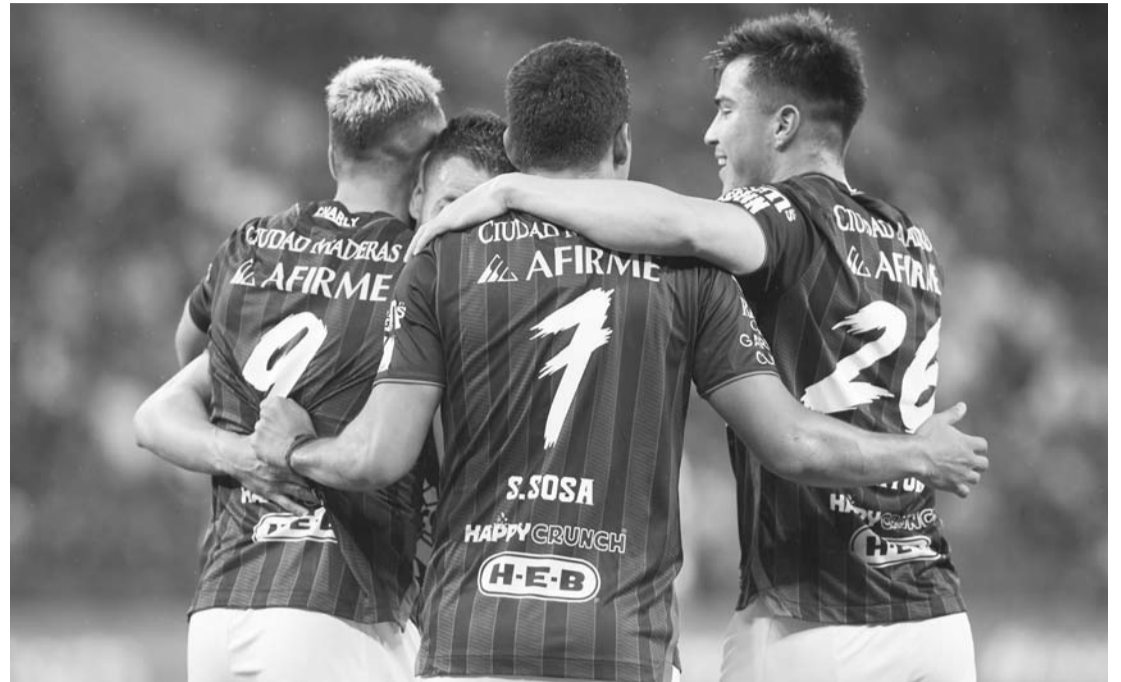
Querétaro no se esperaba irse con el empate del BBVA.