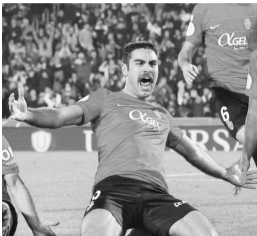
Mallorca venció al Girona.

Javier Aguirre, técnico mexicano del Mallorca en la Liga de España, logró el día de ayer el pase a la semifinal de la Copa del Rey.