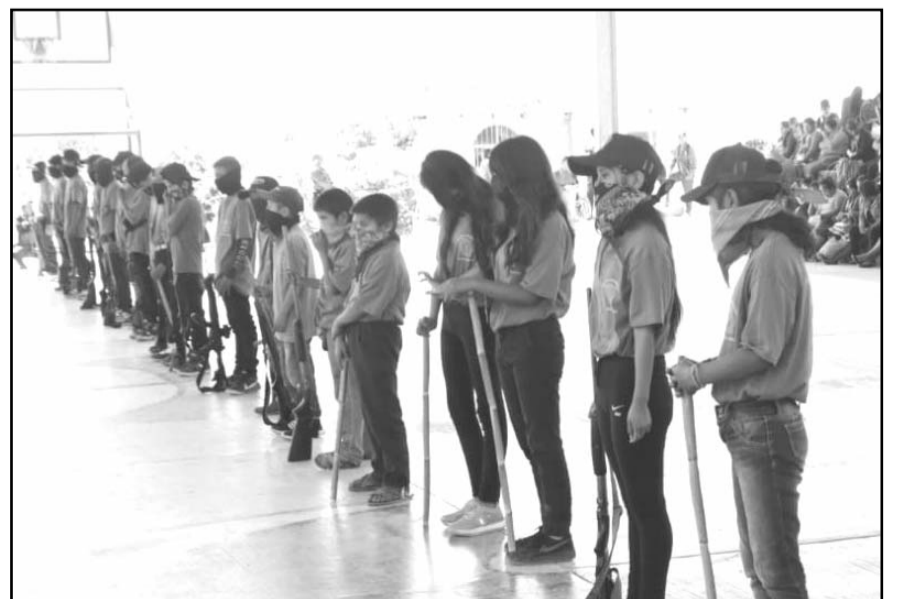
Los menores sólo realizarán tareas de vigilancia en la comunidad.