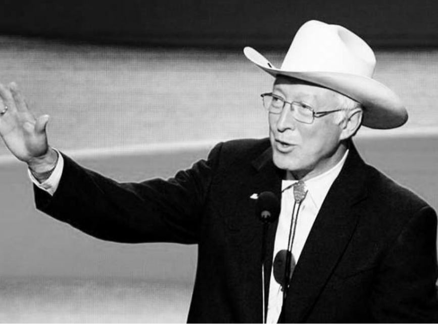
El embajador de EU en México comentó que las personas que lleguen de manera ilegal a la frontera tendrán que enfrentarse a las consecuencias.