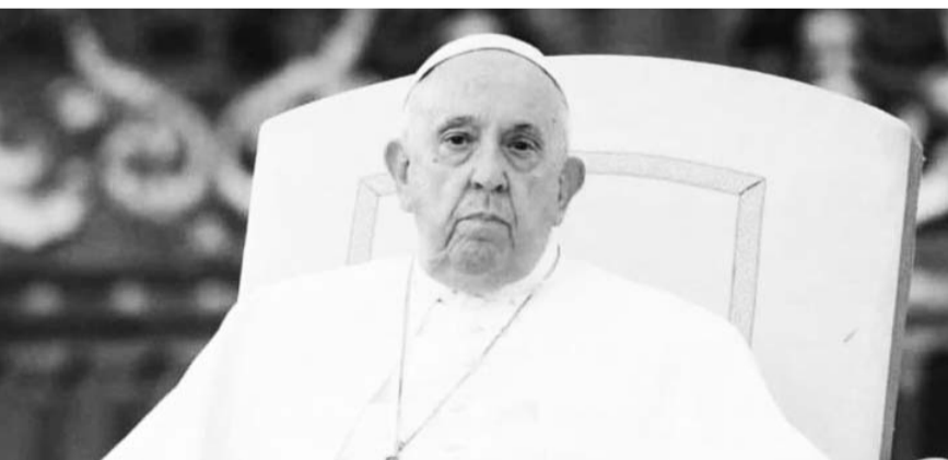
El Pontífice sugirió como necesario actuar preventivamente proponiendo modelos de regulación ética.

Además, la ética en la investigación científica y en el desarrollo tecnológico se convirtió en un pilar fundamental para evitar posibles abusos y riesgos asociados con nuevas tecnologías.