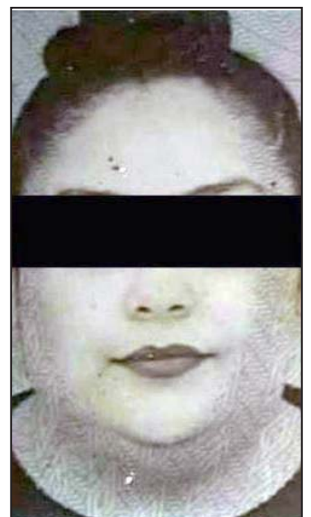
Está en prisión preventiva.