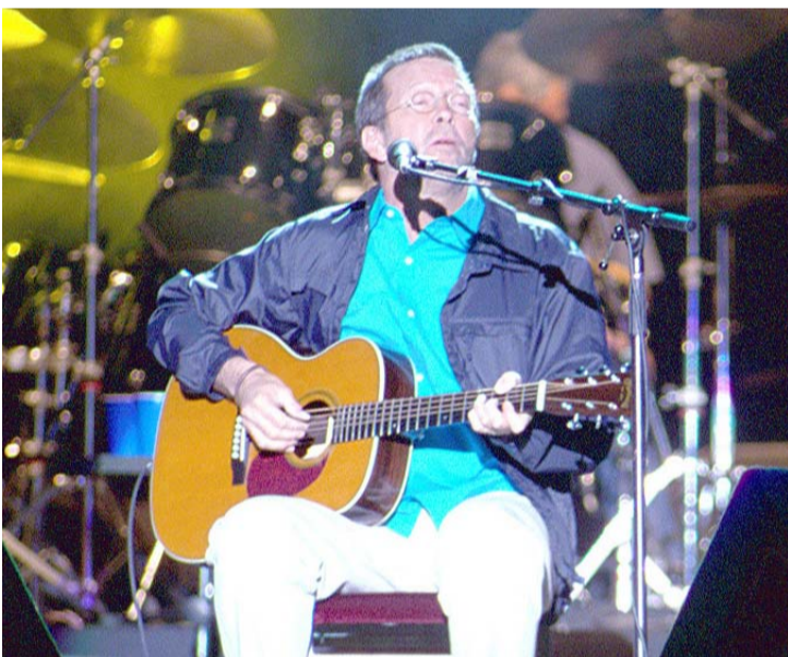
La espera terminó.

Ambos conciertos se celebrarán a las 21:00 horas en las dos fechas.