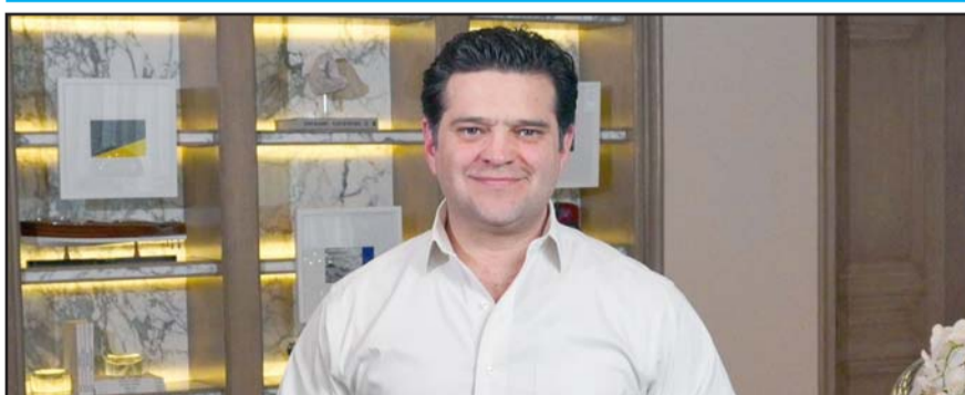
Se encuentra en la lista de representación proporcional.