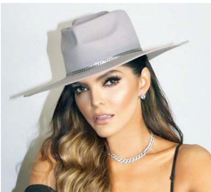
Consolida su legado como mujer influyente en la música.

nombre artístico Ana Bárbara, se suma a la lista de celebridades que en el pasado han sido honrados con esta distinción como Paulina Rubio, Daddy Yankee y Gloria Trevi.