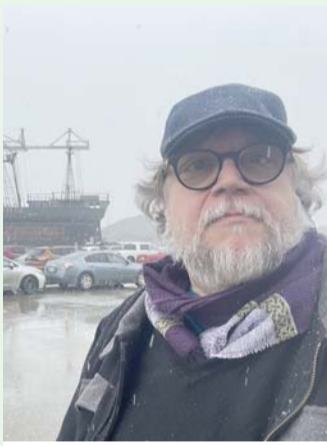
El mexicano se encuentra en Canadá.

El mexicano se encuentra acompañado de gran parte de su elenco, conformado por el dos veces ganador del Oscar, Christoph Waltz, el intérprete guatemalteco Oscar Isaac, la actriz Mía Goth así como el legendario actor, director y guionista inglés Charles