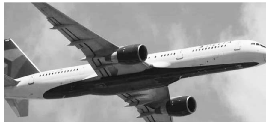
La aeronave llevaba 172 pasajeros a bordo cuando ocurrió el percance.

La decisión de Eslovaquia se desarrolla en el contexto de la prolongada y compleja crisis entre Rusia y Ucrania, que ha marcado la región desde principios de la década de 2010. Uno de los episodios más significativos fue la anexión de Crimea por parte de Rusia en 2014, tras la destitución del presidente ucraniano Viktor Yanukóvich. Este acontecimiento desencadenó tensiones entre ambos países y llevó al inicio de un conflicto armado en el este de Ucrania, donde grupos separatistas apoyados por Rusia buscaron la independencia.