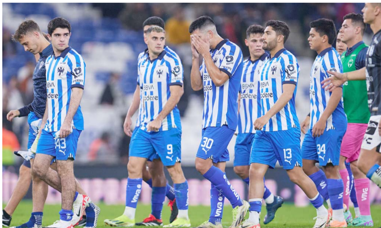
Rayados, de regreso a las andadas al dejar ir puntos en casa.