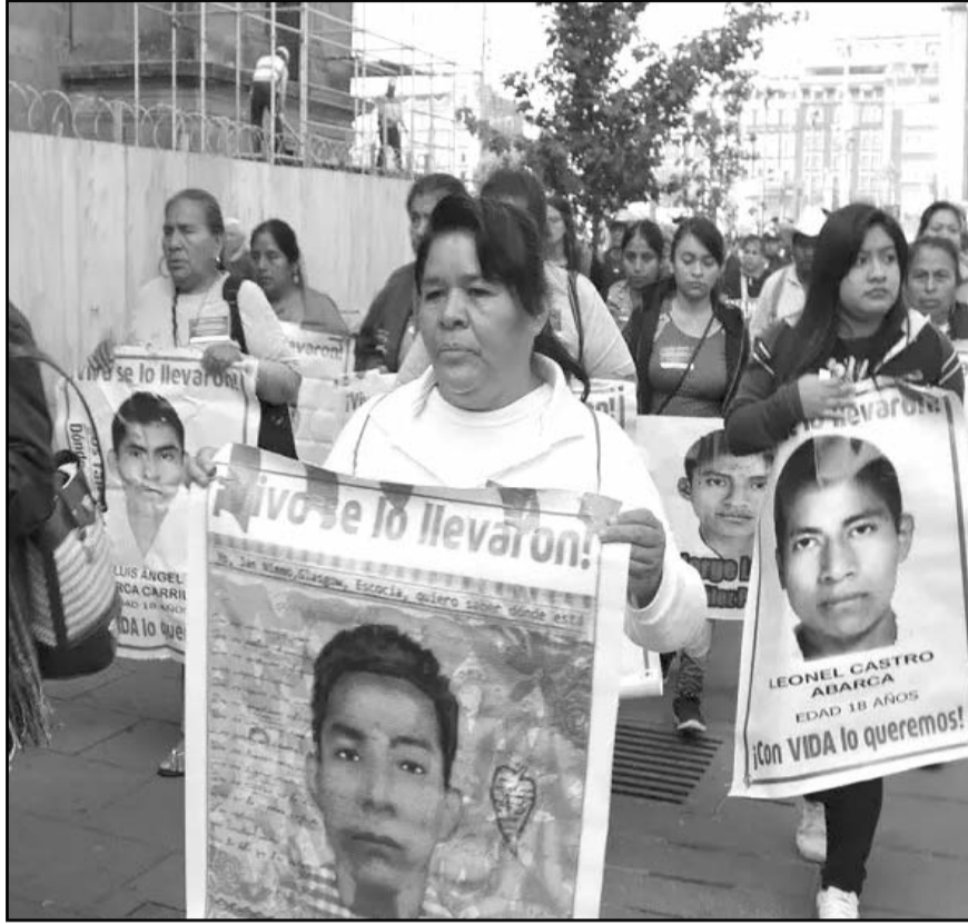
Los militares tienen prohibido salir del país y acercarse al estado de Guerrero.

Asimismo, tienen prohibido salir del país y acercarse al estado de Guerrero.