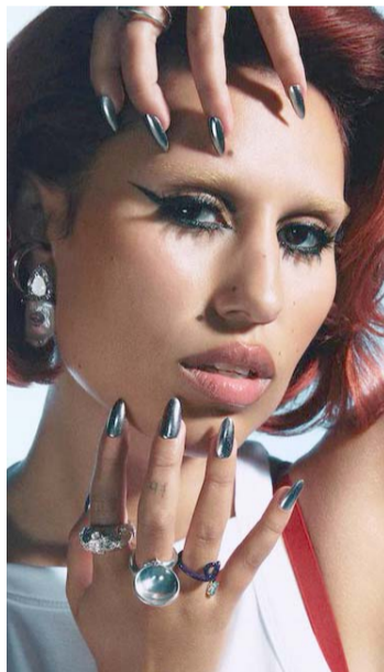
Raye impactó con su álbum debut "21st Century Blues".

Además, la presencia internacional destaca con nombres