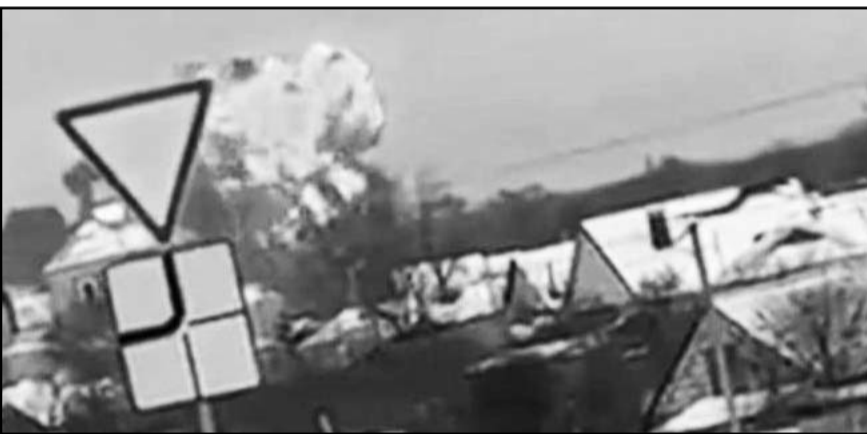
Testigos capturaron el desplome y explosión del avión en la región de Bélgod.

Es importante destacar que las compañías aéreas y fabricantes de aeronaves invierten considerablemente en tecnología, mantenimiento y entrenamiento de la tripulación para mitigar el riesgo de incidentes como la pérdida de una rueda.