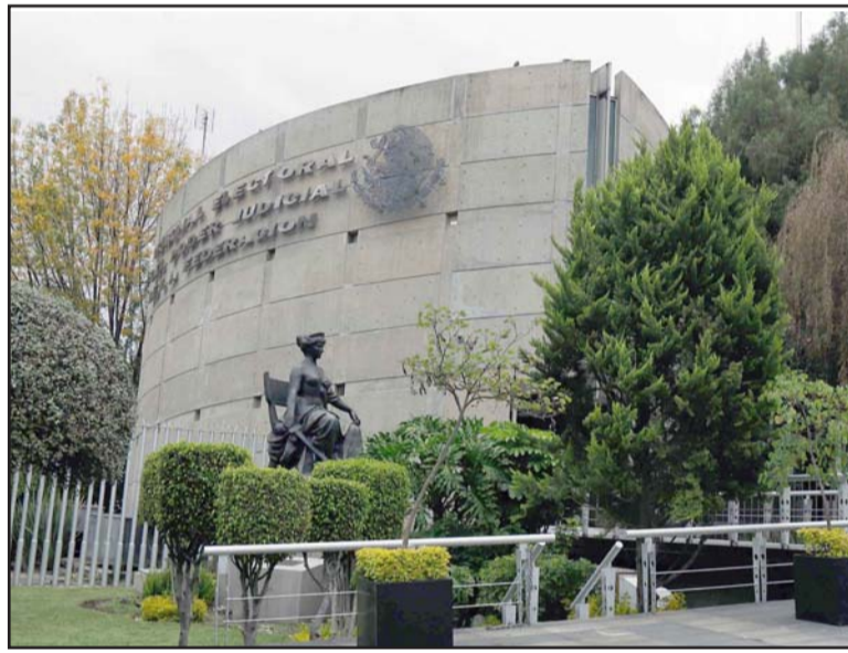
Por 4 votos a favor y 1 en contra, consideran hubo omisión.

El magistrado Reyes Rodríguez Mondragón propuso vincular a la actual legislatura para que, antes de que concluya su periodo, regule las condiciones paritarias que deberán observar los partidos políticos, para la postulación de candidaturas para la elección a la presidencia.