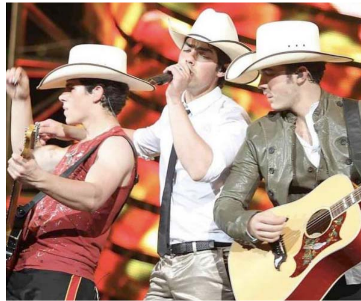
Estarán el 6 y 7 de mayo, en Monterrey.

La cinta, que aún no tiene fecha de estreno, será lanzada a través de Netflix, la cual ya ha trabajado con el director mexicano al albergar "Pinocchio" así como la serie de terror "Guillermo del Toro's Cabinet of Curiosities".