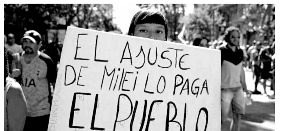
Debido a esta situación, Aerolíneas Argentinas ha experimentado cancelaciones y reprogramaciones de vuelos.

La huelga, que busca expresar el descontento de diversos sectores ante las políticas gubernamentales, ha generado un intenso debate en la esfera política argentina. Mientras el Gobierno critica la movilización, los sindicatos sostienen que es necesaria para defender los derechos laborales y sociales de la población.