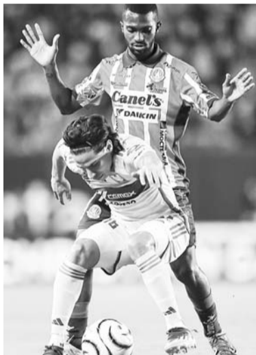
Tigres desplegó buen fútbol.

“Estamos muy contentos, vamos paso a paso, es un escalón más que cumplimos. Los muchachos hicieron un gran partido, ante un gran rival que intenta jugar al fútbol, intenta conciliar el juego, proponer y hoy supimos hacer las