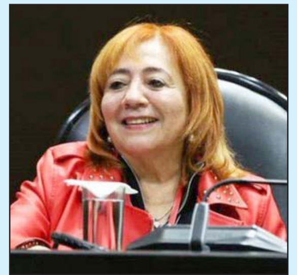
Rosario Piedra, dijo además que la CEDH está con la Cuarta Transformación.

"Sí resulta inexacto interpretar que mediante la reforma constitucional del 6 de junio de 2019, el constituyente ordenó al Congreso de la Unión que emitiera una regulación legal específica en lo relativo a los órganos unipersonales del poder público", apuntó el magistrado Fuentes.