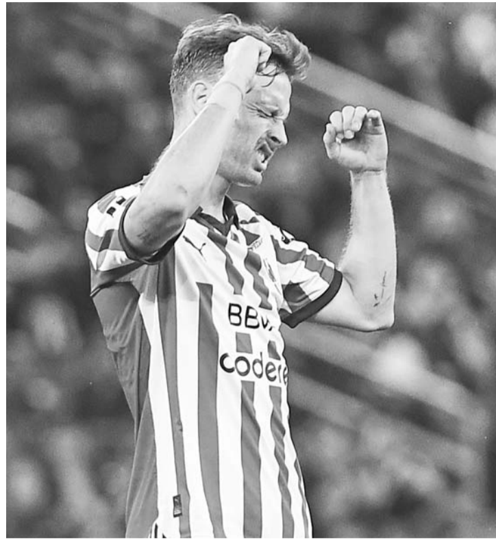
Monterrey falló mucho en el momento decisivo..

“Tenemos que cambiar los abucheos por aplausos y confío en eso”, afirmó el estratega argentino. (AC)