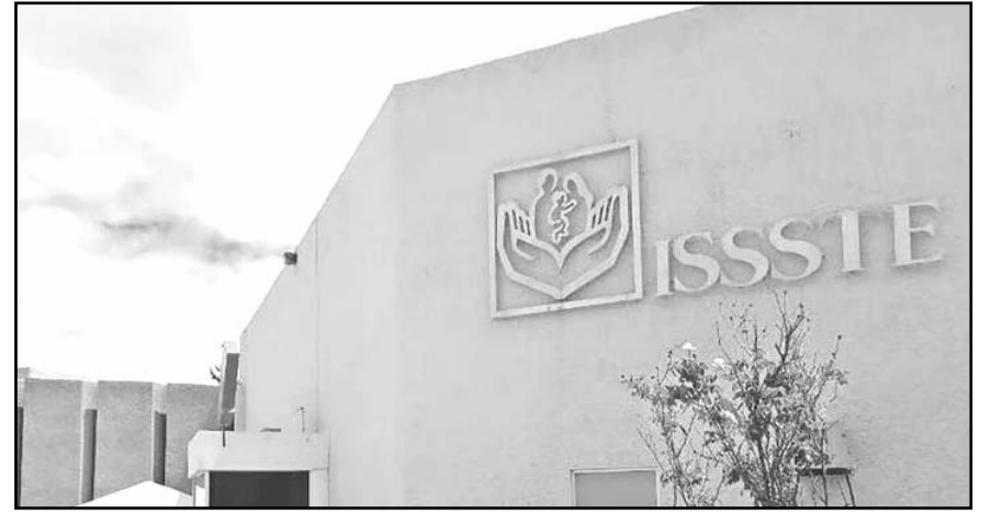
Señala que todavía hay contratos millonarios