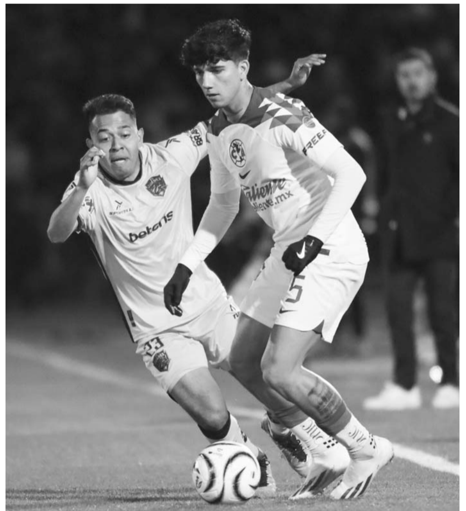
América sigue sin conocer la derrota y con su arco imbatible.

Con todo esto, América se mantuvo de líder en este campeonato mexicano, mientras que los Bravos se quedaron con solamente un punto de nueve posibles.