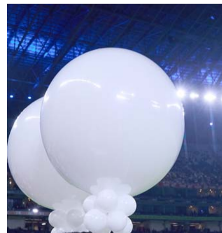
Globos blancos fueron soltados en el inicio del partido.

La 'Pandilla' estuvo cerca del 2-1 al 84' de acción con un remate del "Corcho" Rodríguez que pegó en el poste, aunque también Querétaro lucía peligroso en los contragolpes, pero al final la contundencia le faltó a los dos equipos y el juego terminó con el empate a uno.