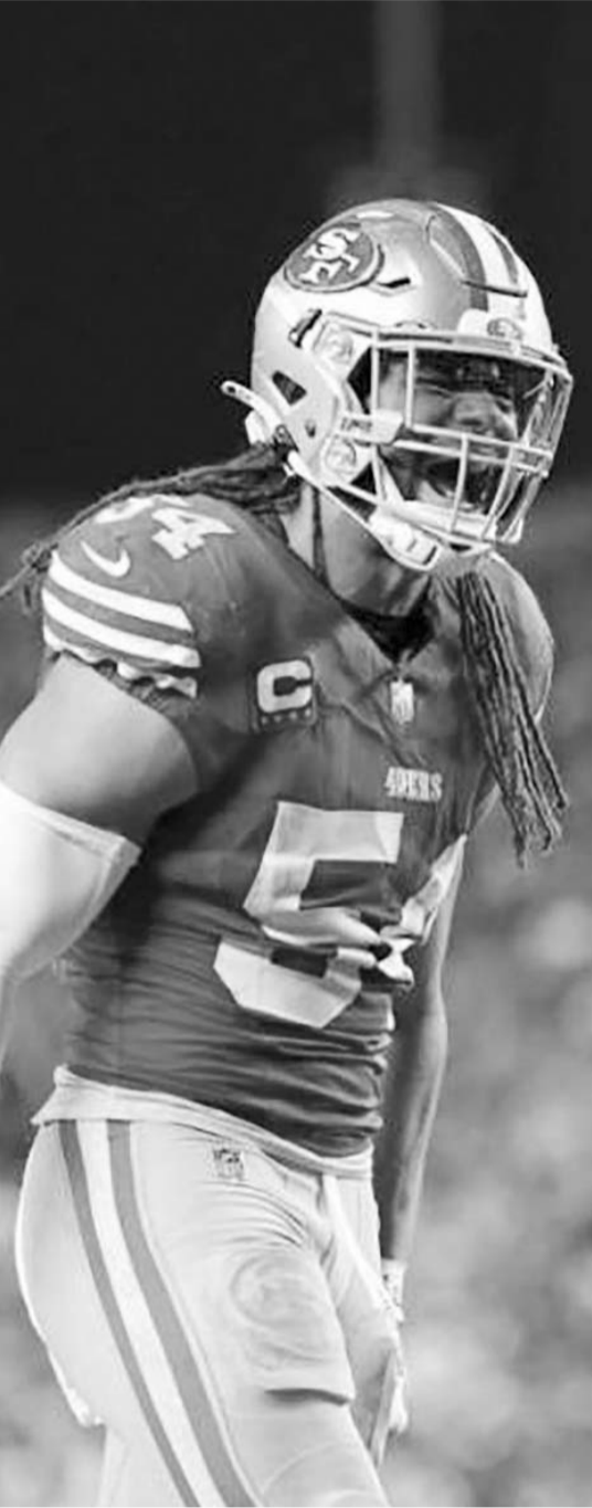
Fred Warner, de los mejores tackles.

Ante esta situación, lo que se espera el próximo domingo es un Súperbowl 58 que será parejo y equilibrado en todo momento, siendo eso lo que desean los fanáticos de la NFL, todo esto para que el duelo por la disputa del Vince Lombardi esté lleno de emociones en todo momento y no vaya a ser un cotejo algo aburrido en el que únicamente se cargue el resultado final y por mucho margen hacia el campeón. (AC)