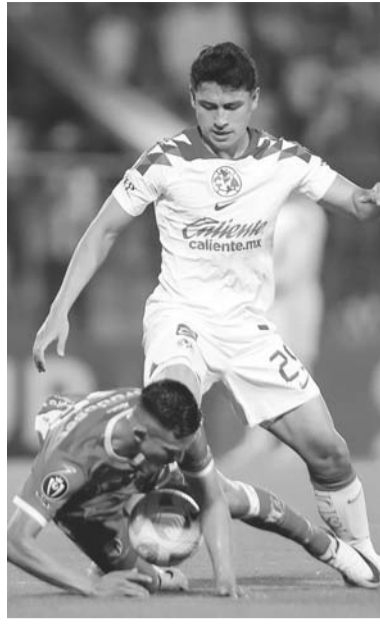
Las Águilas deberán revertir.

malo para las Águilas, aún así una derrota frente al Real Estelí es un resultado inesperado para el campeón del fútbol mexicano.