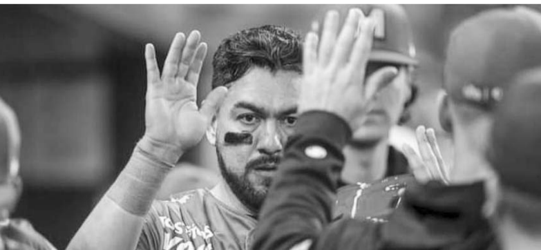
La delegación mexicana no fue el peor conjunto en esta Serie.