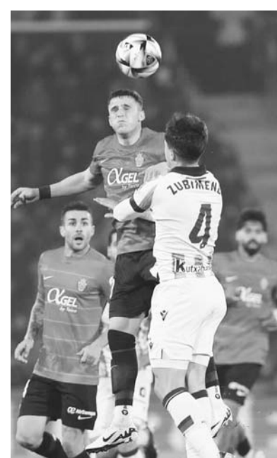
La Real Sociedad tuvo más jugadas de gol.

El mencionado ex jugador de los Pumas está en una prisión preventiva en España desde el pasado 20 de enero del 2023.