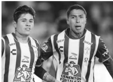
Pachuca, por el liderato.

Pachuca buscará conseguir el triunfo para llegar a 12 puntos y