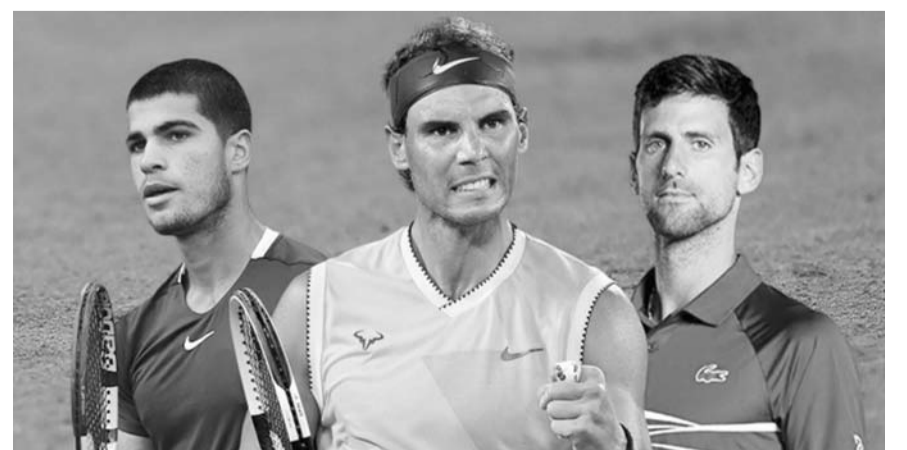
Carlos Alcaraz, Rafael Nadal y Novak Djokovic.

Carlos Alcaraz expresó que "Estoy feliz de volver a Arabia Saudita y espero mostrar mi mejor nivel", afirmó el joven tenista nacido en Murcia.