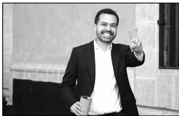
Denuncia campaña en su contra.