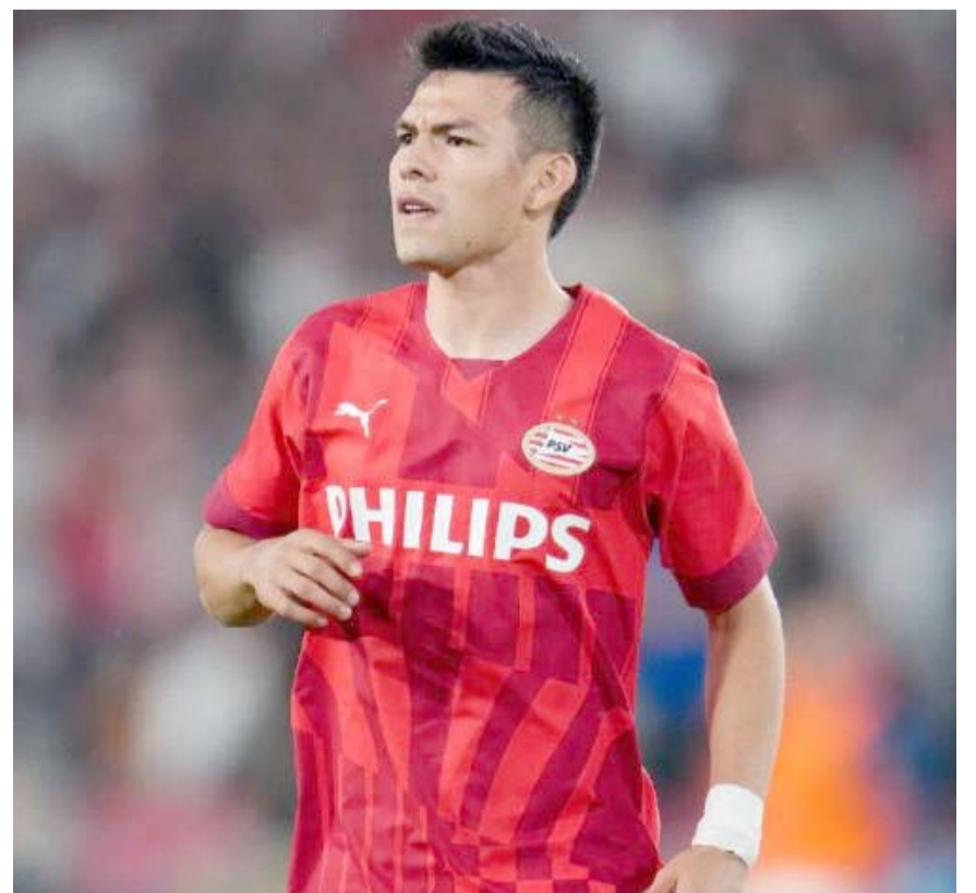
El "Chucky", por su primera "travesura" del año.

Tras esta situación, ese favoritismo intentarán trasladarlo desde hoy en la cancha y empezar con un triunfo en la fase de grupos contra de las 'Ches', lo cual les ayudaría en confianza para llegar fortalecidas a lo que venga en esta Copa Oro.