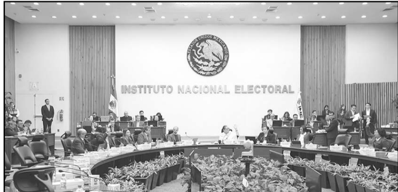
El aspirante dijo que los recursos son propios, y exhibió dos extractos de una cuenta bancaria extranjera, aperturada a su nombre.

El INE aprobó dar vista a la Unidad Técnica de lo Contencioso Electoral, por supuesta propaganda político-electoral de una organización religiosa en favor de Verástegui.