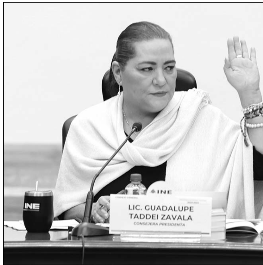
"A mí se me hace que las manifestaciones son legítimas, genuinas, y que las vamos a estar viendo constantemente".

Durante el informe de labores de la Sala Especializada del TEPJF, dijo que la democracia requiere jueces democráticos, como lo tiene esa institución jurisdiccional.