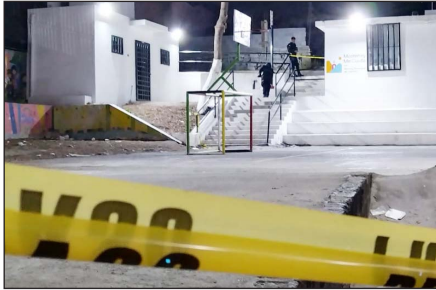
Los hechos se registraron en la colonia Genaro Vázquez.

La noche del lunes se encontraba un grupo de jóvenes en las escaleras del Centro Comunitario Otomí, en donde imparten clases de cine, cultura, entre otras cosas.