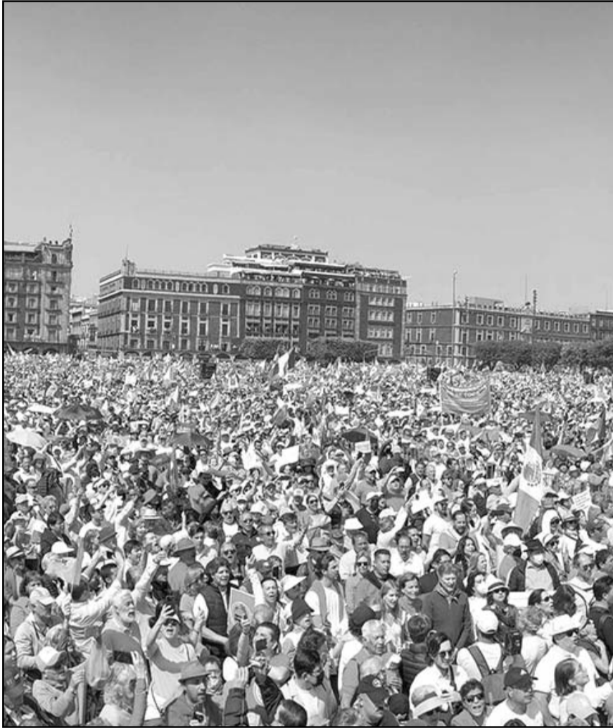
"Compartimos, con quienes, desde cualquier trinchera, expresan sus ideas y preocupaciones de manera libre".

"No hay mejor muestra de pluralidad que la libre expresión de las ideas y el ejercicio pleno del derecho de manifestación de las mismas"