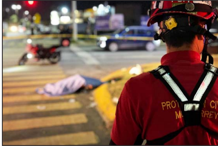
Murió un hombre de 25 años de edad.

Mientras que un masculino de 60 años de edad resultó lesionado, siendo llevado en la ambulancia al Hospital