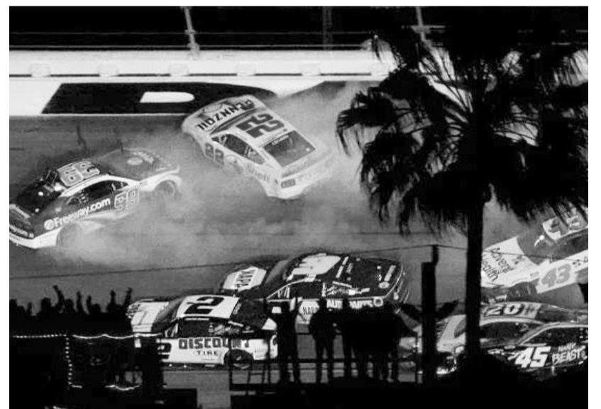
El incidente fue lamentable para el piloto regio.

El piloto William Byron fue quien al final se alzó con la victoria, en un final dramático.