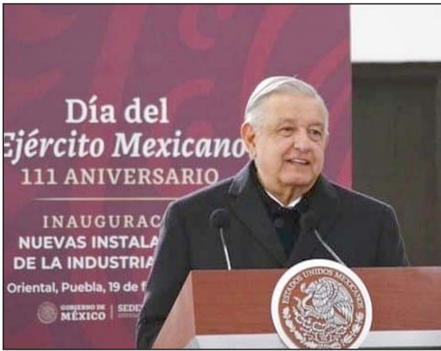
El presidente conmemoró el 111 Aniversario de la creación del Ejército mexicano en el nuevo complejo de la Industria Militar de la Sedena.

Al hacer un repaso histórico de la formación del Ejército mexicano, López Obrador señaló que nuestra milicia es una institución distinta a