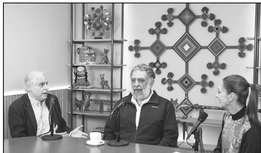
Claudia Sheinbaum minimizó las denuncias de los ciudadanos que participaron en la Marcha por la Democracia, y dijo que el gobierno del presidente López Obrador no es autoritario.

En el podcast estuvieron Pedro Miguel, consejero del Instituto Nacional de Formación Política de Morena, y el caricaturista Rafael Barajas, El Fisgón.