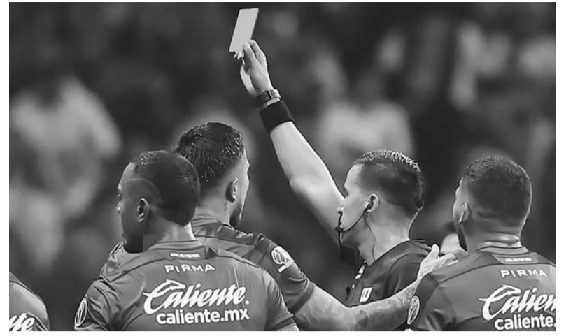
Seis expulsados arrojó la jornada siete el pasado fin de semana.

El encuentro se llevará a cabo este martes 20 de febrero en punto de las 19:00 hora centro y se transmitirá a través de TV Azteca.