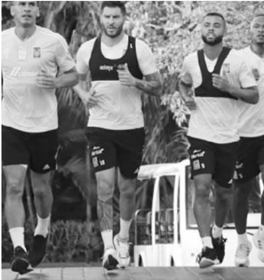
Tigres enfrenta el sábado al Atlas.

Después de tres semanas de ajetreo, que trajo cansancio a sus jugadores, Tigres tiene un cierre de mes más relajado en cuanto al trabajo