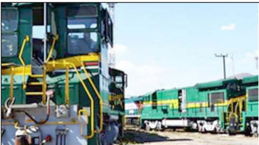
Admitió el Ejecutivo que él no va a poder dejar concluido el proyecto porque termina su mandato en la Presidencia en septiembre próximo.

Junto a lo anterior, el doctor Urzúa también colaboraba con los medios nacionales, escribiendo columnas y artículos de manera frecuente.