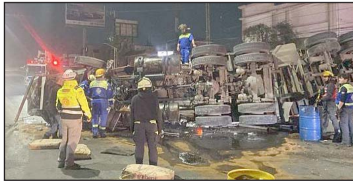
Estaba cargado con rollos de acero.