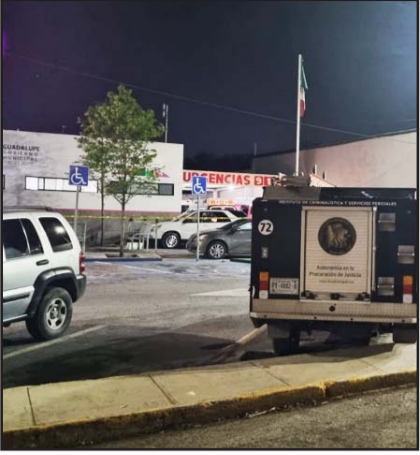
Se registró en Guadalupe.