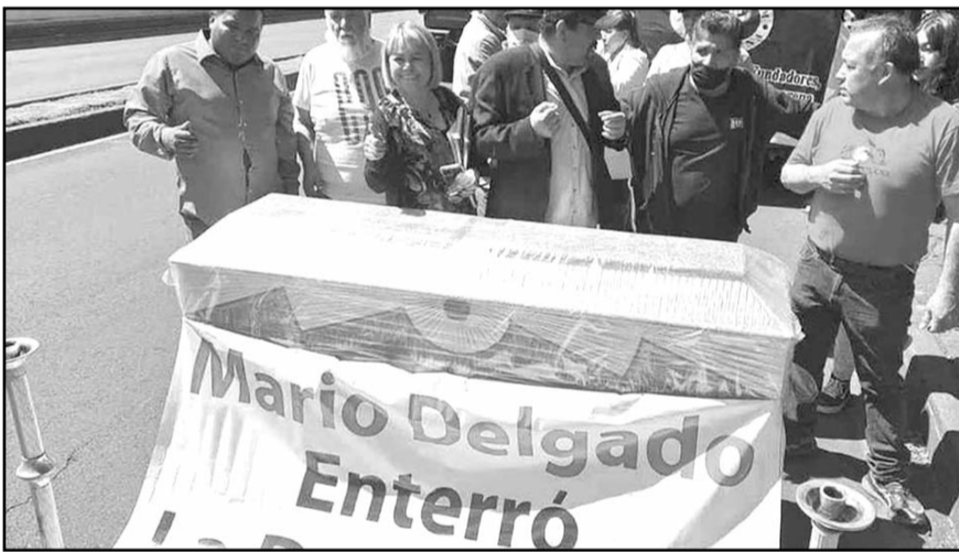
Manifestantes acampan afuera de la sede nacional del partido Movimiento de Regeneración Nacional (Morena).

Este domingo, tanto en la Ciudad de México como en decenas de urbes del país y del extranjero, miles de residentes participaron en la llamada Marcha por la Democracia, en la que tan sólo en la capital del país, la autoridad reportó una participación de 90 mil personas.