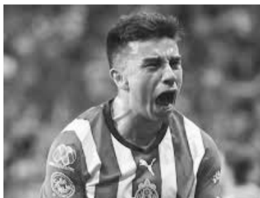
Chivas, a seguir ascendiendo.

En su partido más reciente el Rebaño Sagrado no logró consolidarse en el marcador, y es que terminaron cediendo el empate de último minuto. El juego había sido claro para los Rojiblancos en el primer tiempo al ir ganando 1-0 apenas al minuto 12, y luego caer el segundo tanto al minuto 55. Sin embargo, los tapatíos cedieron el juego y el terreno poco a poco para los locales, y ante ello el juego se les fue escapando de las manos en lo que fue el inminente empate. Fue al minuto 87 que cayó el primer tanto mazatleco y al 99 se