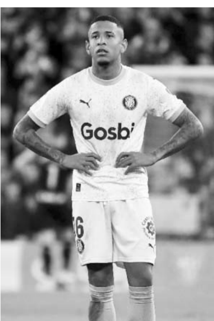
Parecen abrirle el paso al Real.

El gol de Eric García en el 75 puso emoción al tramo final, en el que el central local Dani Vivian sacó bajo palos con la cabeza un disparo del colombiano Jhon Solís.