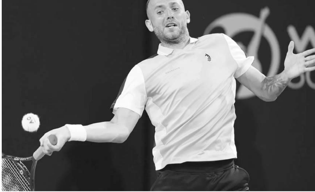
El ruso sucumbió ante el británico Daniel Evans.

Los principales favoritos del ATP 250 mexicano, donde destacan el alemán Alexandre Zverev, el griego Stefanos Tsitsipas, el noruego Casper Ruud y el australiano Alex de Miñaur, se presentarán recién hasta la jornada del miércoles en la segunda ronda.