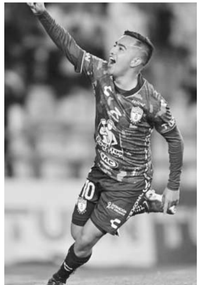
Los Tuzos se miden al Puebla en la angelópolis.

Todavía queda pendiente la resolución que dé la Comisión Disciplinaria que revelará si proceden las quejas en cada encuentro y la cantidad de partidos de suspensión en cada caso, cuando está empezando una semana con jornada doble con partidos de la Fecha 9 que se celebran este martes.