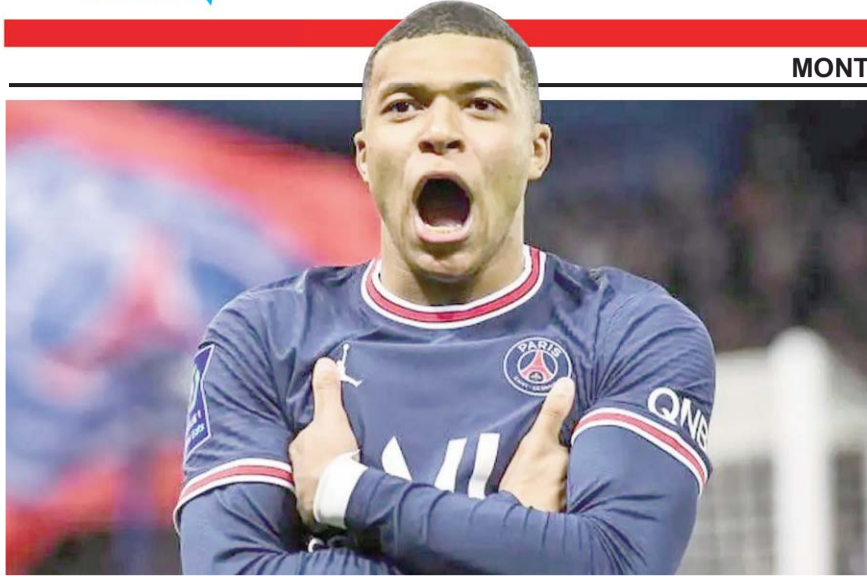
El estrella francés ya habría tenido un acuerdo con Real Madrid

MONTERREY, N.L., MARTES 20 DE FEBRERO DE 2024