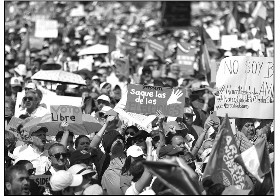
La CEM hizo un llamado a los católicos en el país para que participen en la jornada electoral del próximo 2 de junio.

mos, con quienes, desde cualquier trinchera, expresan sus ideas y preocupaciones de manera libre", enfatizó.