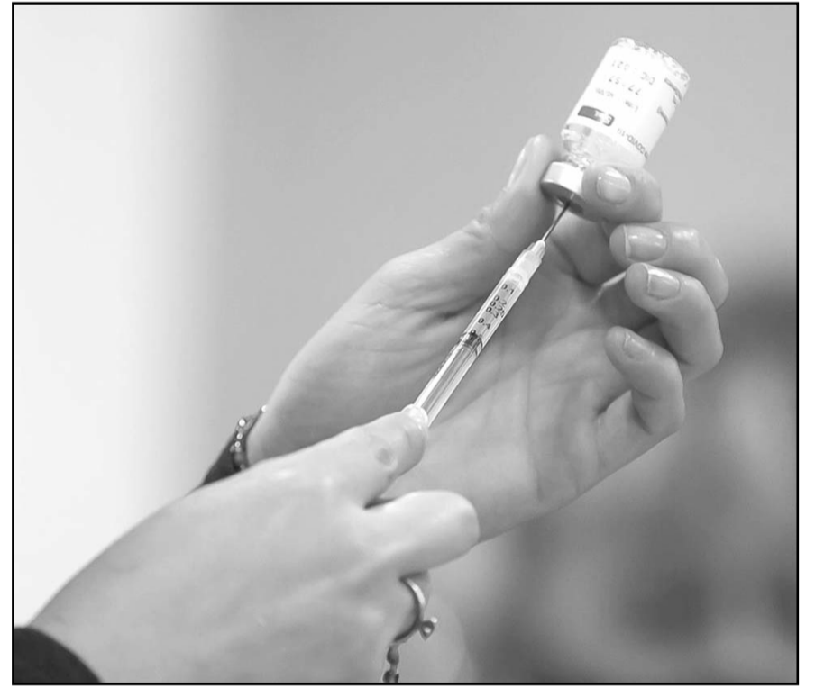
Se avaló el inmunológico contra el virus que suele causar síntomas leves, similares a los del resfriado, y es la causa viral más frecuente de bronquiolitis.

Los síntomas principales son: rinorrea, apetito reducido (hiporexia), tos, estornudos, fiebre y sibilancias, síntomas que a menudo se manifiestan en fases y no todos a la vez.