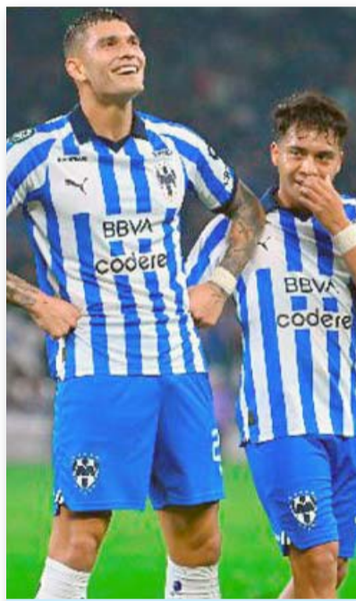
La Pandilla tienen todo para cerrar febrero sin derrota.

La derrota fue en la fecha uno ante América y por un marcador final de 2-0, aunque ya después vinieron dos empates en las jornadas tres y seis respectivamente, en donde ambas fueron de 1-1, primero ante Chivas y posteriormente en contra del Querétaro.