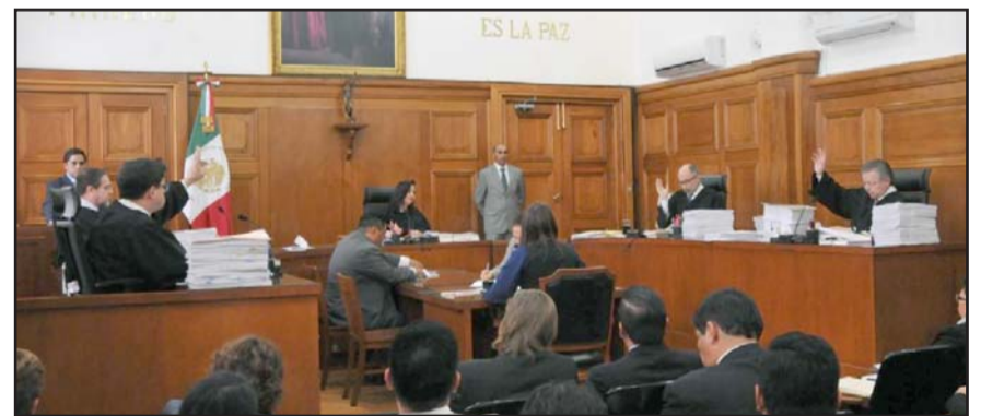
Este jueves, el Tribunal Pleno de la SCJN llevará a cabo la votación para seleccionar al nuevo integrante.

Para la selección de la terna, la ministra presidenta Norma Lucía Piña Hernández