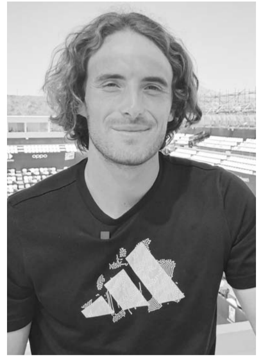
El griego está batallando esta temporada.