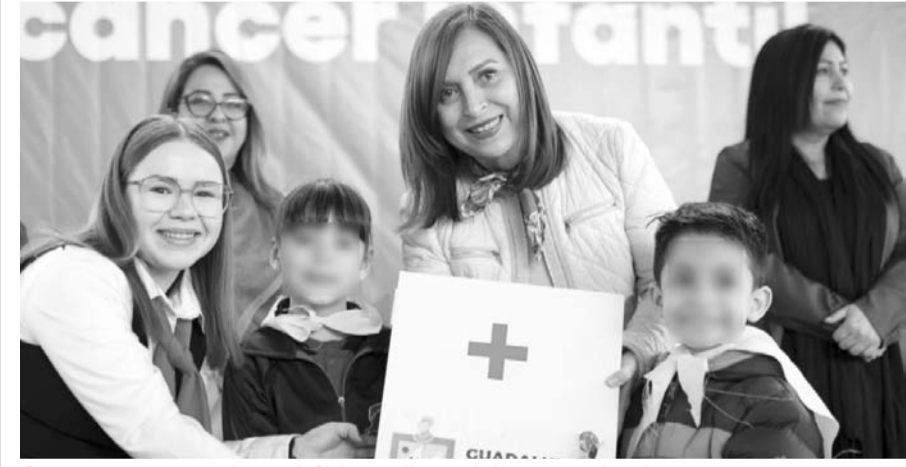
Se promueven mejores hábitos alimenticios entre la niñez.