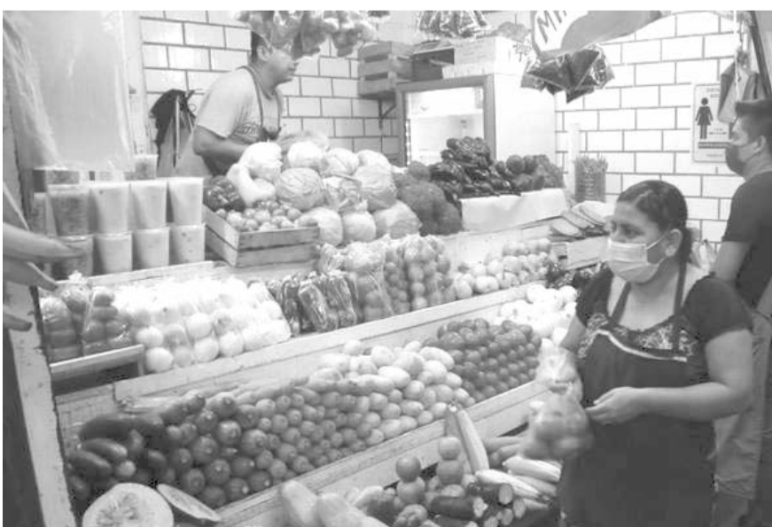
La sequía amenaza con seguir reduciendo el volumen de las cosechas y elevando los precios de productos agrícolas.

Durante enero, entre los bienes y servicios cuya alza de precios tuvo una mayor incidencia en la inflación destacaron la cebolla, con alza anual de 145.6%; jitomate, 63.5%; azúcar, 35.2%; frijol, 20.6%; leche, 6.8%, y