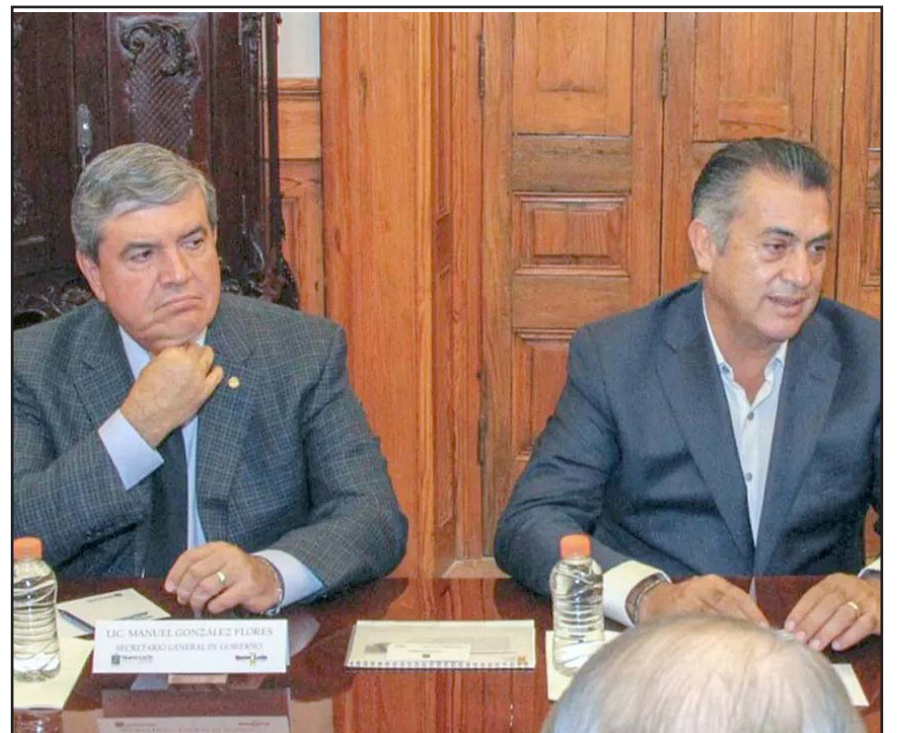
Se emplazó a los dos ex funcionarios estatales a comparecer ante los integrantes de la comisión para tratar las acusaciones en su contra.