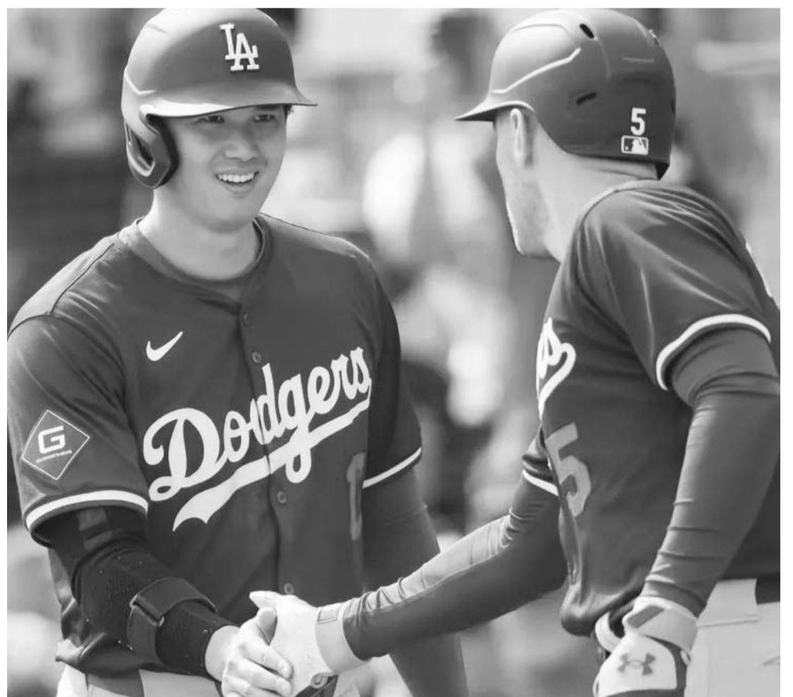
Ohtani sigue con buen paso en la pretemporada de los Dodgers.