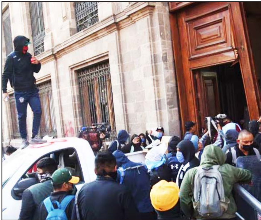
La FGR abrió una investigación por los daños en Palacio Nacional.

Los familiares y los estudiantes continúan exigiendo al gobierno restablecer el diálogo y obtener acceso a archivos que consideran fundamentales para esclarecer los hechos ocurridos la noche del 26 de septiembre de 2014 en Iguala, Guerrero.