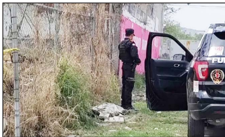
Los hechos ocurrieron en la Colonia Valle Morelos.

Los elementos de rescate controlaron un derrame de aceite sin que representara mayores riesgos.