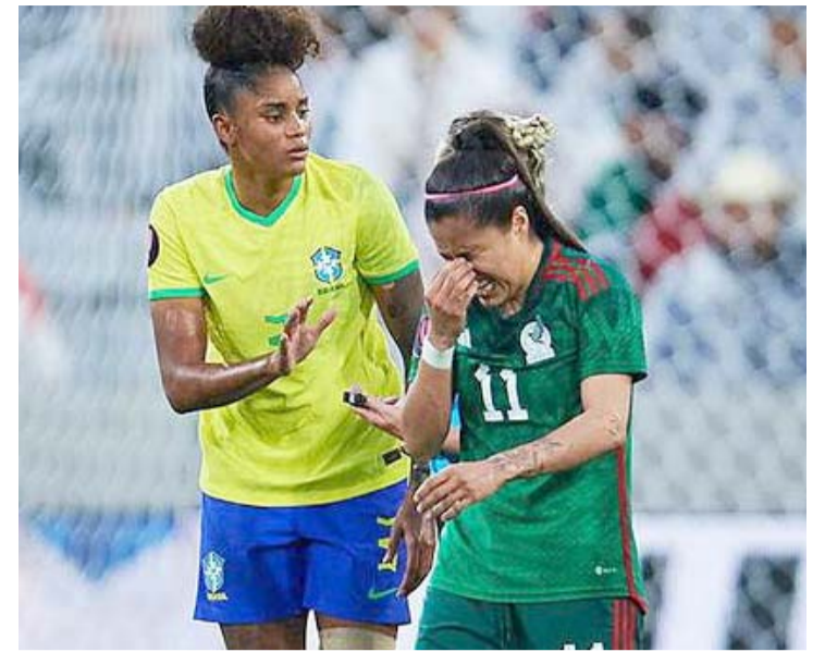
De la alegría a la tristeza pasaron las mexicanas ante Brasil.

Además del juego de Rayados, hoy Lionel Messi y el cuadro del Inter de Miami enfrentarán al Nashville en Tennessee, siendo esto en la ida de los octavos de final de la Copa de Campeones de la Concacaf, iniciando todo a las 20:00 horas en el estadio Geodis Park.