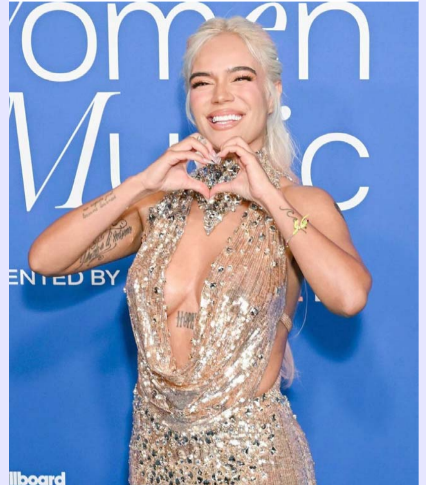
Es la primera latina en recibir el galardón.

10 primeros, una versión de "The Locomotion" de Little Eva, en 1988. Regresó al top 10 en 2002 con "Can't Get You Out of My Head".