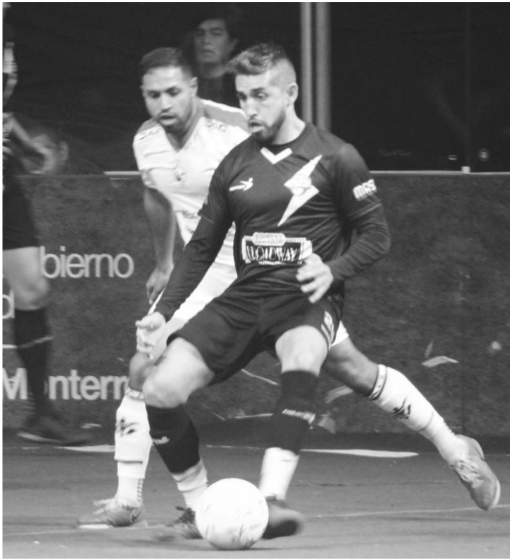
Flash buscará seguir invicto en la temporada de las MASL.

Ambos conjuntos vienen de victorias, pero el cuadro del Flash arrastra una mejor temporada regular al estar de invictos y liderar la zona Este de la MASL, motivo por el cual hoy se les tiene que dar como favoritos.