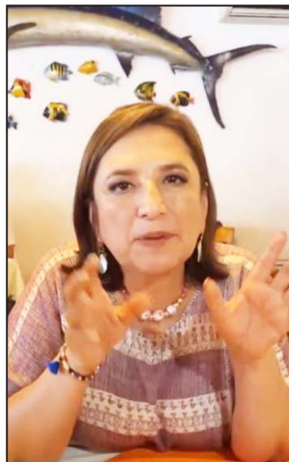
Gálvez lamentó la irrupción violenta de los normalistas de Ayotzinapa.

En entrevista, la candidata presidencial de PAN, PRD y PRI lamentó la irrupción violenta de normalistas de