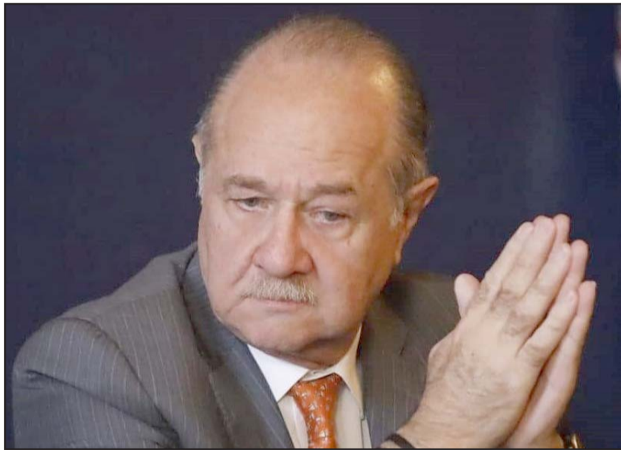
La causa es por no haber publicado los acuerdos aprobados por el Congreso

Mencionó que lo que resolvió la Suprema Corte de Justicia es solo que la controversia constitucional que había presentado el gobernador respecto a su juicio de procedencia, no era la vía, sino que era el juicio de amparo