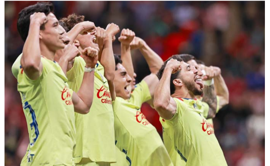
En el propio Akron, el América sacó ventaja de tres goles en la Concacaf.

Tras ello, Chivas avisó con un fallo en el área chica luego de una jugada a balón parado para que Jesús Orozco errara a merced de un vencido portero Luis Ángel Malagón, mientras que las Águilas lucían peligrosas en los contragolpes e incluso se les anuló un