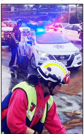
El derrame fue limpiado por las autoridades.

Dos carriles de Fidel Velázquez, fueron cerrados ante el derrame de combustible por parte de la unidad de carga, luego