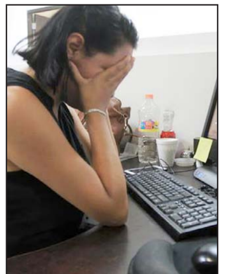
El IPN detalló que recibió 213 denuncias de acoso y hostigamiento en 2023

El ISSSTE reportó 92 casos, mientras que el Colegio de Bachilleres, 81; la Comisión Federal de Electricidad (CFE), 71; el Consejo de la Judicatura Federal (CJF), 71; Petróleos Mexicanos (Pemex) siguió en la lista con 57, mientras que la Autoridad Educativa Federal en la Ciudad de México sumó 48 y el Inegi registró 23.