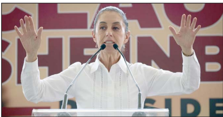
La candidata presidencial propone estrategias para fortalecer la seguridad.

La ruptura se agravó cuando ocho militares vinculados al caso fueron liberados, generando una mayor desconfianza por parte de los familiares y estudiantes hacia las instituciones gubernamentales.