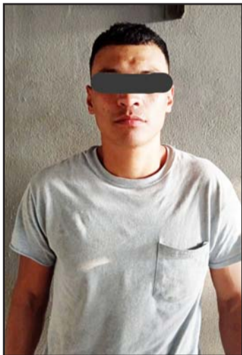
Fue detenido con envoltorios con hierba verde.