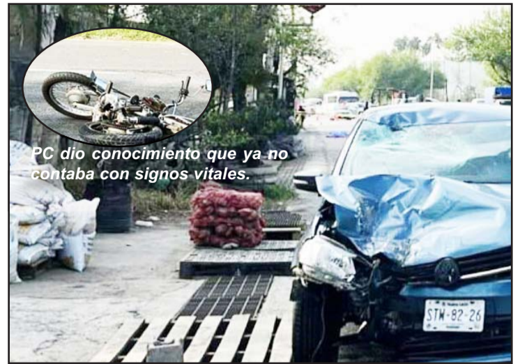
PC dio conocimiento que ya no contaba con signos vitales.

Hasta el momento el ahora occiso no ha sido identificado, siendo un hombre de unos 45 años de edad y de baja estatura.