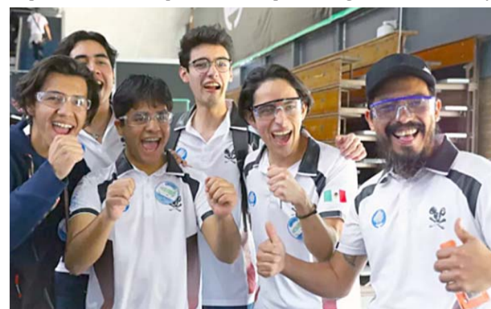
FIRST busca potenciar las habilidades de los jóvenes.

FIRST® es una de las iniciativas estratégicas de PrepaTec a nivel nacional que busca potenciar las habilidades de las generaciones actuales para que se conviertan en las y los líderes que enfrenten los retos y oportunidades del siglo XXI.