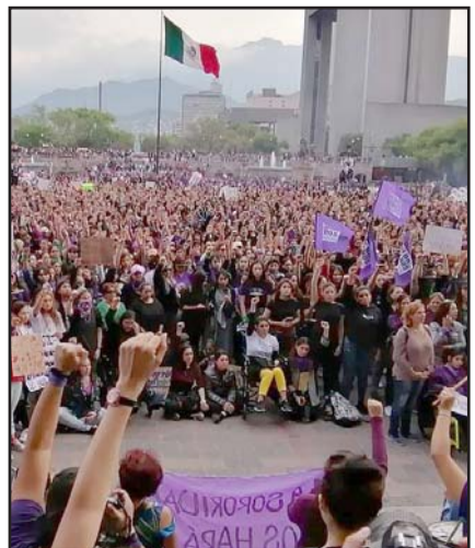
Fuerza Civil actuará si hay disturbios