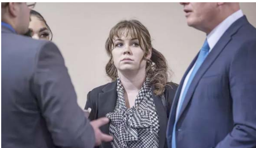
Es encontrada culpable de homicidio involuntario por la muerte de la directora de fotografía, Halyna Hutchins.

El caso de Baldwin por el mismo delito será hasta el mes de julio, sin embargo, él también se ha declarado no culpable de lo ocurrido.