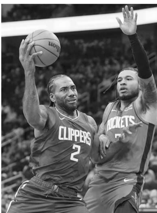
Clippers venció a los Rockets 122-116.

Su único torneo esta temporada fue en Brisbane y en enero pasado, donde el zurdo ganó dos partidos antes de caer ante Jordan Thompson.