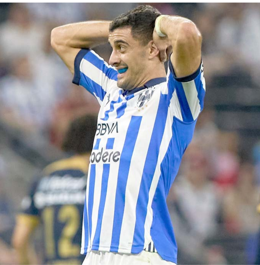
Al argentino parece no importarle la oferta de los norteamericanos.

En la otra semifinal, las selecciones de Canadá y Estados Unidos empataron a un gol en el tiempo reglamentario y 1-1 en los tiempos extras, para extender la serie hasta los penales, donde los segundos ganaron 3-1, para enfrentar a Brasil el próximo domingo en la final de la Copa Oro W. Canadá será rival de México por el tercer lugar.