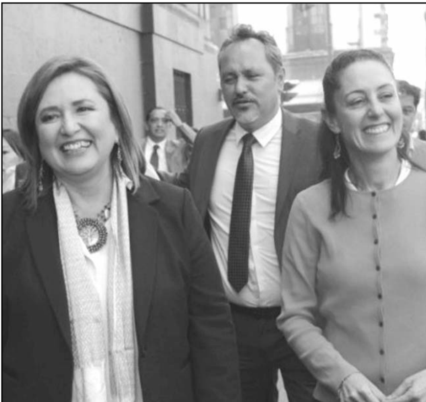
Mexicanas entrevistadas en todos los ámbitos consideran que el triunfo de una mujer en la elección presidencial es un hecho histórico.