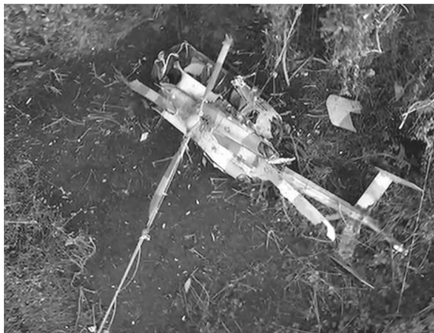
La aeronave transportaba a ocho efectivos navales, de los cuales tres fallecieron, dos mujeres y un hombre; dos permanecen en calidad de desaparecidos.

El secretario de ASPA subraya que cuando hay un accidente no es punitivo y los sistemas de investigación son correctivos.