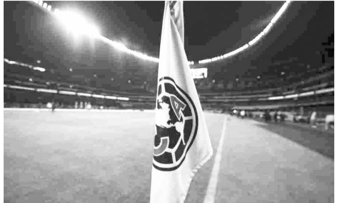
América ha doblegado a los felinos las últimas cinco ocasiones en el Azteca.