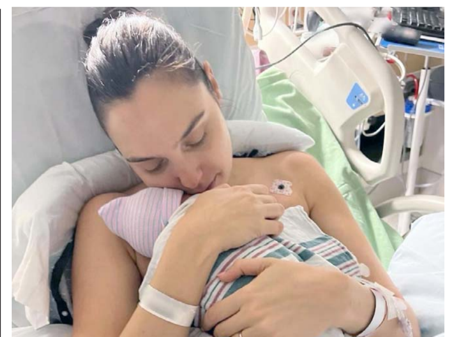
La nena recibirá por nombre Ori.