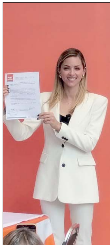
Ayer recibió la constancia de MC.

"Pensar que el protocolo señala que Fuerza Civil no puede hacer uso de la fuerza pública, es decir, hacer su trabajo cuando se están cometiendo delitos, cuando se agrede a las personas, se les rocia de thinner y se les amaga con fuego al grito de 'quémenlas vivas por traidoras', pensar que no es dable ejercer la fuerza pública basada en la Ley es un sin sentido", añadió.