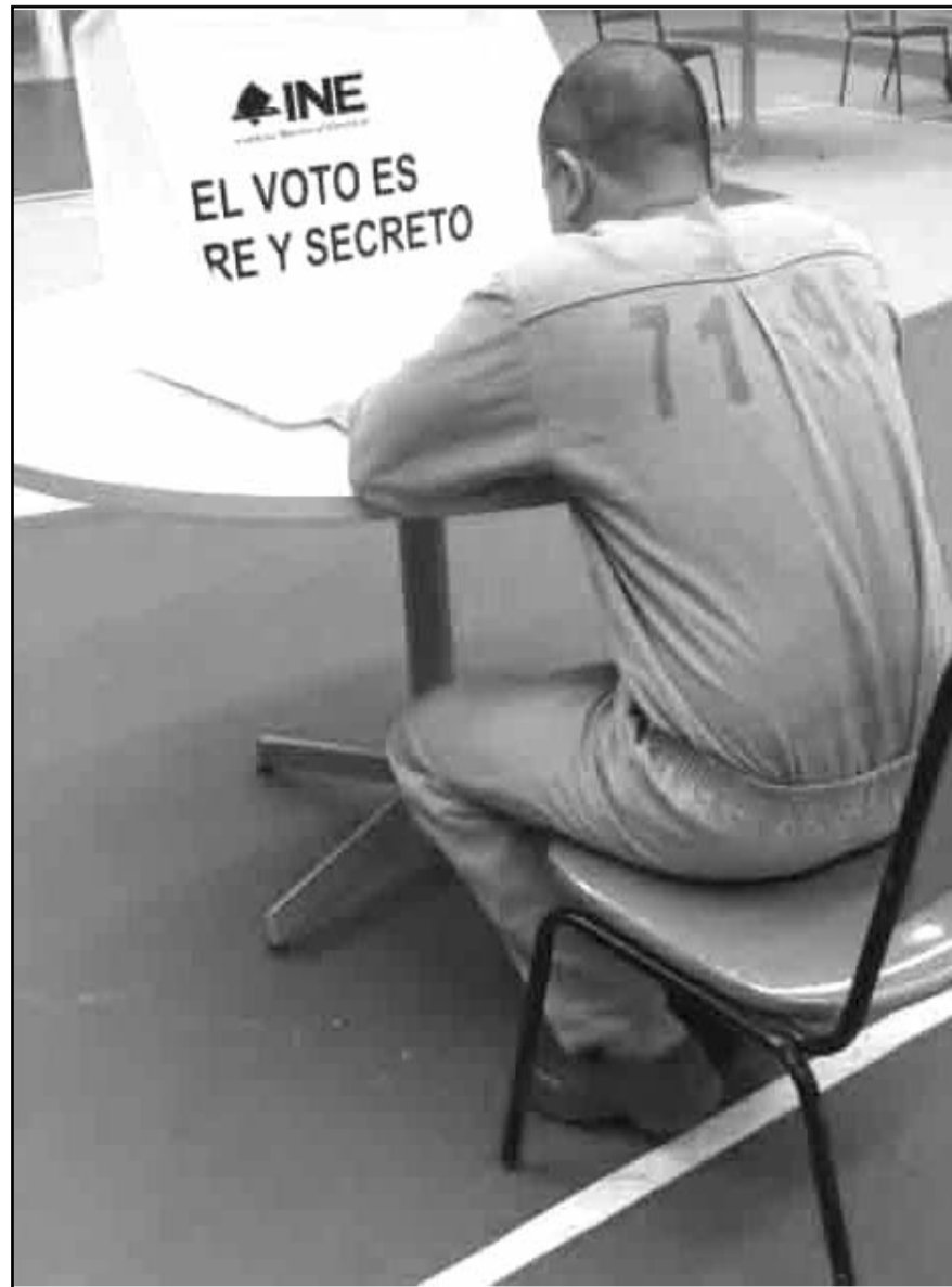
El gobernador de Veracruz, Cuitláhuac García, señaló que no firmará el convenio para permitir el voto de personas en prisión que aún no tienen sentencia, bajo el argumento de temas de seguridad.

Asimismo, descartó reunirse con ellos u otras víctimas como madres buscadoras pues considera que "hay que respetar el dolor de las familias" y no usarlas con fines electoreros.