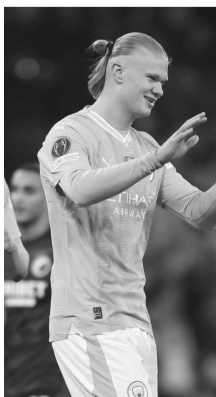
El City no batalló con Copenhague.

A su vez, Sporting de Lisboa igualó 1-1 frente al cuadro del Atalanta en el juego de ida de los octavos de final de la UEFA Europa League, la cual seguirá este jueves con más partidos.