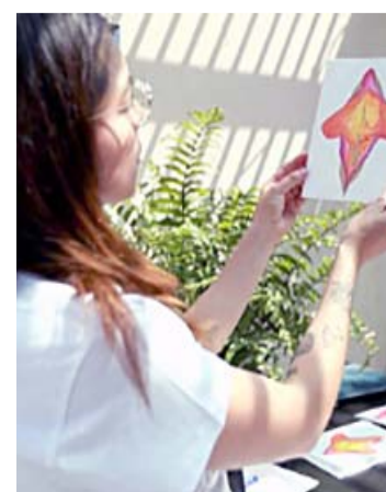
Con "Acuerparte", ha podido crear círculos de apoyo.

La feminista enfatizó que vio una problemática en la falta de educación sexual y el estigma de hablar sobre sus experiencias. "En mi contexto había mucho castigo de que yo me expresara de mi vida sexual o de tener dudas de algún método anticonceptivo", señaló.