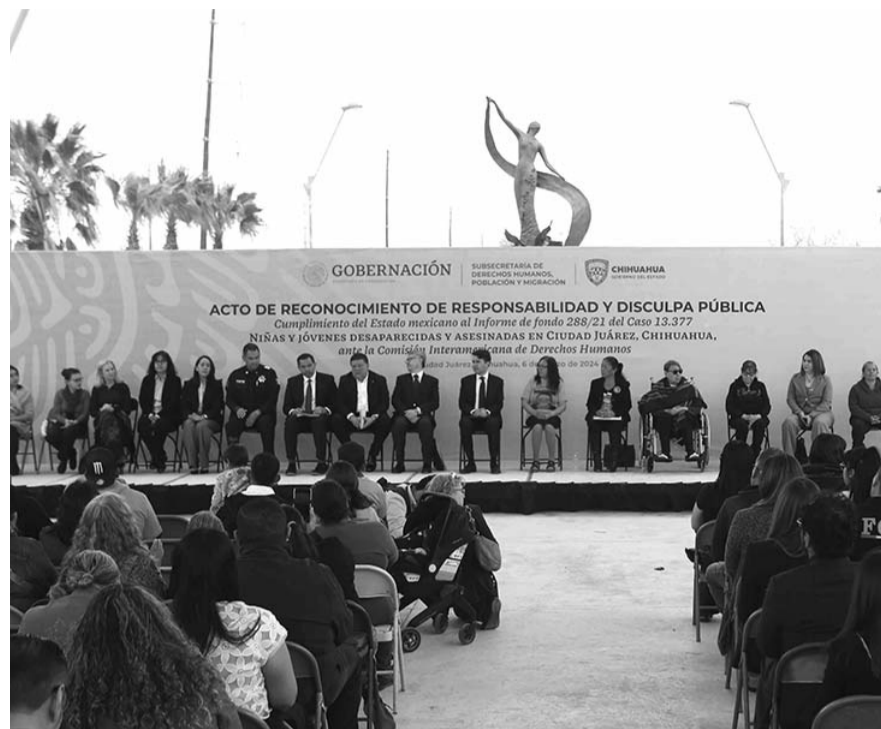
El Estado mexicano realizó un acto de reconocimiento de responsabilidad y disculpa pública por el caso de niñas y jóvenes desaparecidas y asesinadas en Ciudad Juárez, Chihuahua.

"Y ofrezco una sincera disculpa a las víctimas y a sus familias. El Estado falló en proteger la vida, la integridad personal, la libertad, la personalidad jurídica, las garantías judiciales, la