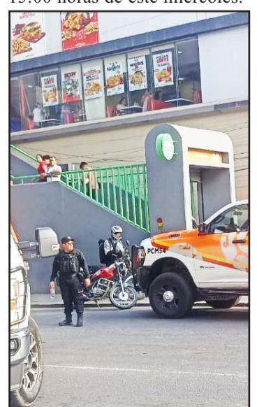
Las autoridades investigan cómo ocurrió el incidente.

el accidente se reportó a las 15:00 horas de este miércoles.