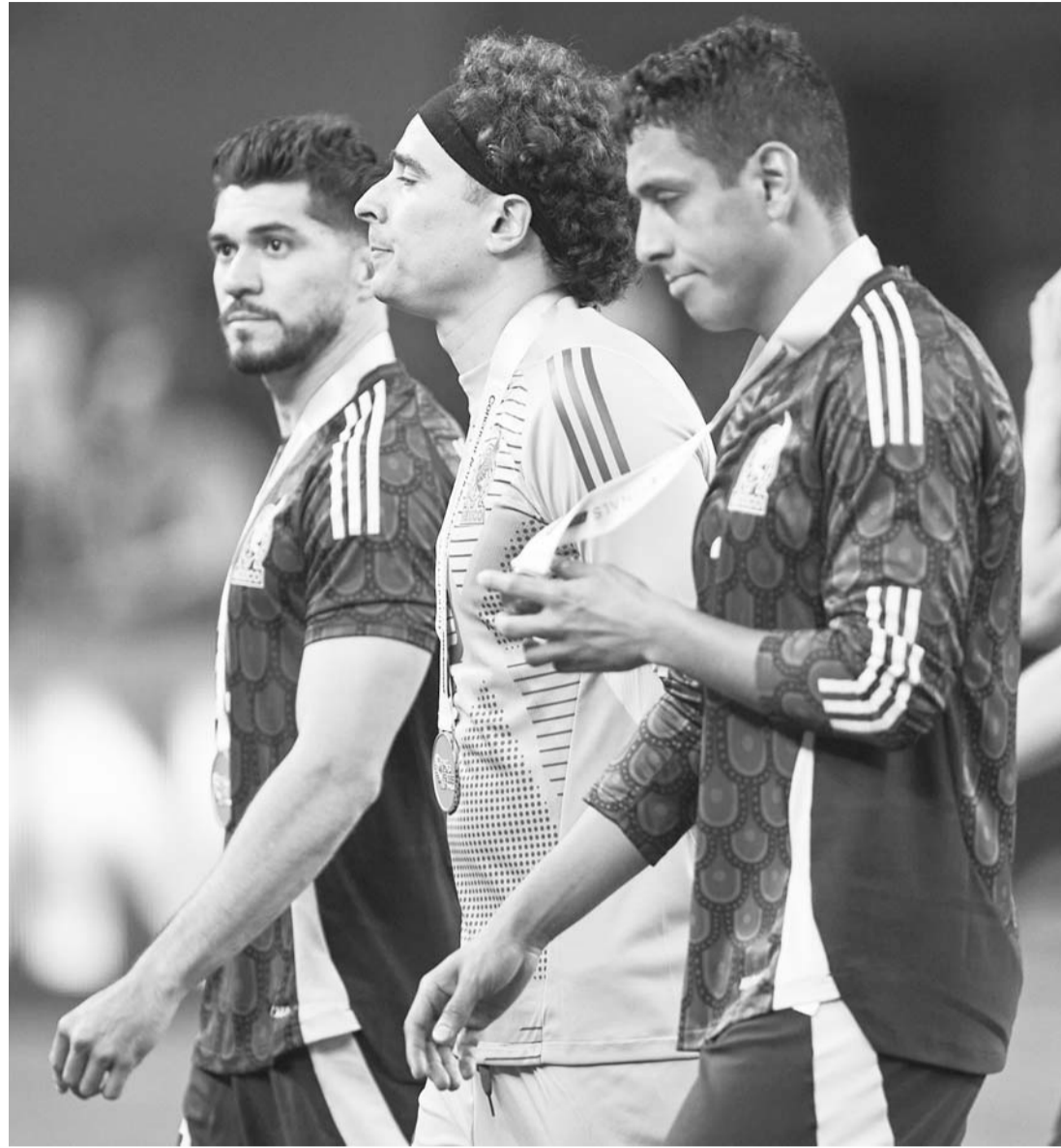
México reconoció la superioridad de los norteamericanos.

"No sé si la diferencia es el hecho de que ellos (Estados Unidos) tienen más jugadores en Europa, pero se les dio la suerte de su lado", concluyó.