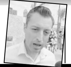
Luis Donaldo Colosio

“El legado (de mi padre) sigue vivo, él veía un México de hambre y de justicia pero de desarrollo social”