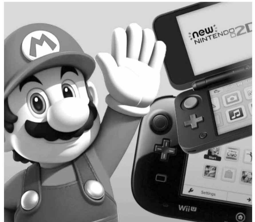
El 4 de abril a las 4:00 PM (hora del Pacífico) los servicios online detrás de casi todo el software de Nintendo Wii U y 3DS cerrarán.