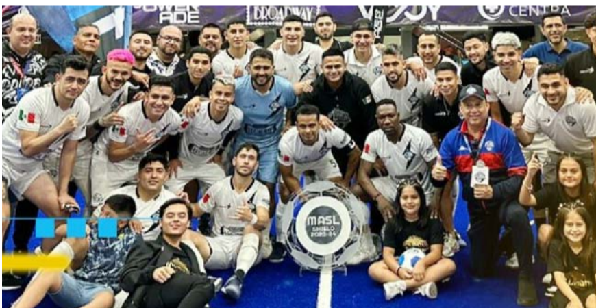
Flash busca el título que se le ha negado desde 2015