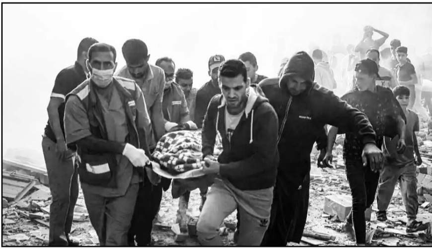
Emmanuel Macron urgió al premier israelí a conseguir un "alto el fuego inmediato y duradero".