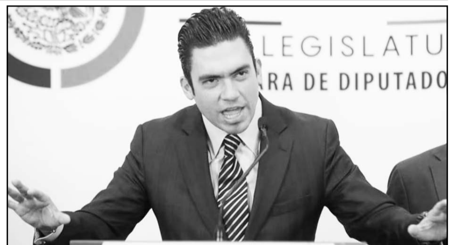
El legislador albi azul aseguró que la reforma impactará negativamente al país.