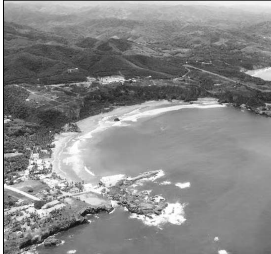
Las playas que se encuentran contaminadas son El Rosarito, en Baja California, Acapulco y Tlacopanocha, en Guerrero.

Por ello, las autoridades sanitarias hicieron un llamado a la población en general a mantener y procurar la limpieza en las playas durante la época vacacional, debido a que ello es responsabilidad de todos para la prevención de una mayor contaminación en las playas y a su vez continuar con el resguardo de las mismas para su conservación.