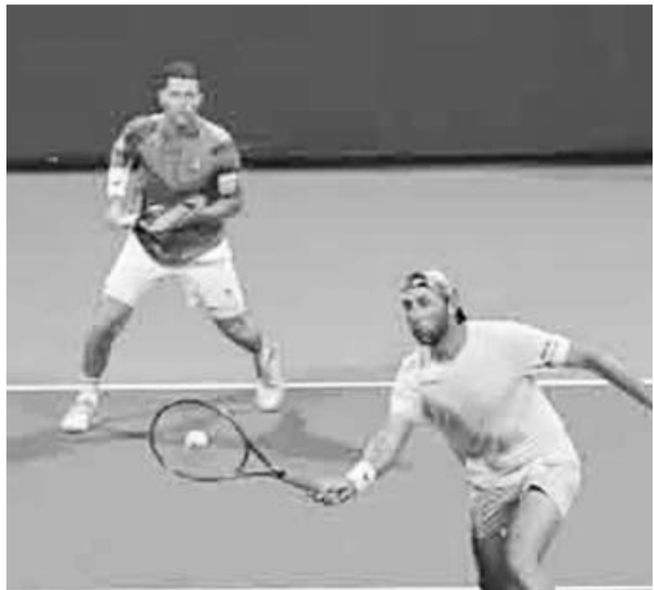
Santiago fue eliminado de manera inmediata.