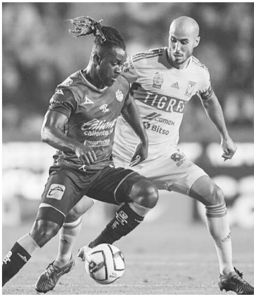
El Tigres-Mazatlán rebasó fronteras.