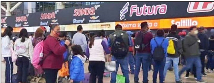
Se refleja de manera importante en la Central de Autobuses de la ciudad.