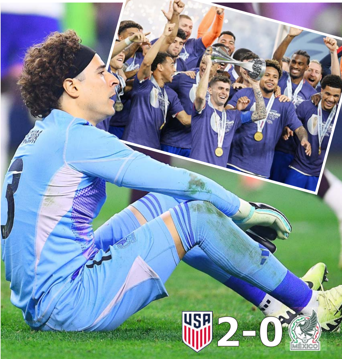
Memo Ochoa, ¿tiempo de decir adiós al Tri?