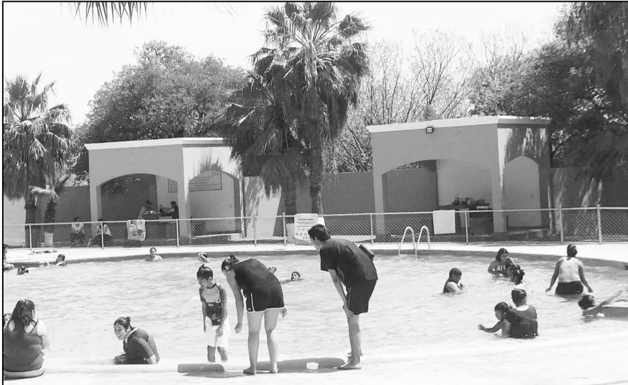
Ante el inicio del periodo vacacional se hizo la apertura de las albercas.