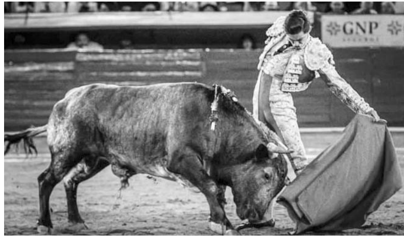
La temporada de este año termina en la Plaza México.