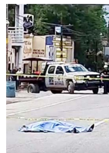
El hombre perdió la vida sobre la Carretera Nacional.

movilización de los puestos de socorro, quienes atendieron al afectado.