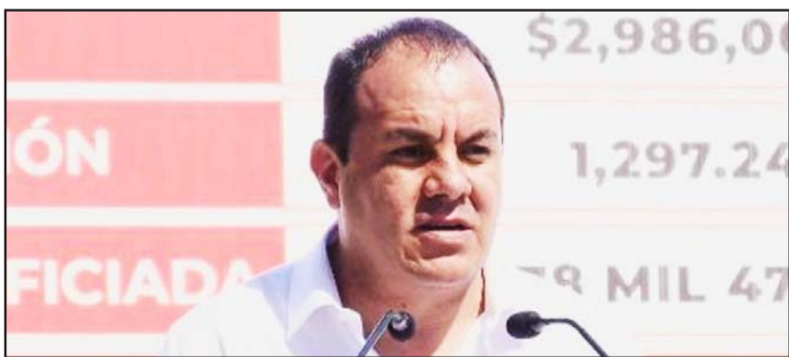
Cuauhtémoc Blanco fue registrado por Morena para aspirar al Senado, sin embargo, optó por no tomar la licencia.

"México no es un país peligroso", aseguró en la entrevista realizada en Palacio Nacional.