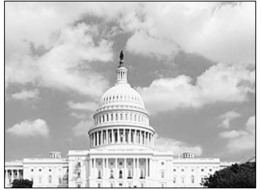
Después de superar el plazo establecido, demócratas y republicanos lograron un acuerdo para financiar las agencias federales.

El desfile de las delegaciones, navegando a lo largo del Sena desde el Puente de Austerlitz hasta el Trocadero.