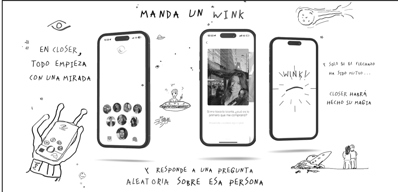
Closer, "es como volver a conocerte como hacían tus padres o abuelos".