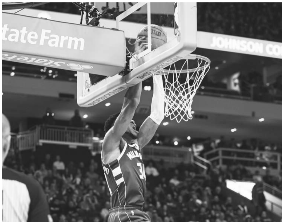
Oklahoma cayó ayer con Milwaukee 119-93.