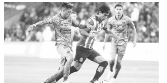
El Clásico Tapatío terminó con un pobre 0-0.

Tan malo fue el juego, que al 82' de acción el cotejo se tuvo que parar luego de que los jugadores salieran de la cancha porque la aburrida afición arrojó objetos a la cancha. (AC)