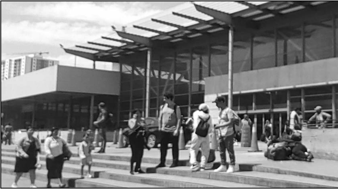
Afuera del lugar se vio durante el día a mucha gente que esperaba la llegada de un taxi

periodo vacacional escolar de los estudiantes de educación básica. En la Central de Autobuses se pudieron observar largas filas, para adquirir un boleto de autobús, por parte de personas que quieren aprovechar la semana mayor al lado de sus seres queridos o simplemente vacacionar. En este sentido, también hay gran flujo de personas en las zonas de descanso donde los viajeros aguardan la salida de su autobús, estos escenarios son los más recurrentes en esta época del año al interior de la Central de Autobuses. Además, a las afueras del lugar hay tráfico vehicular por parte de las personas que salen y que llegan a la central de autobuses, en carros particulares o taxis.(ATT)