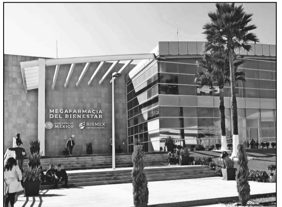
El Indaabin señaló que no localizó información relacionada con los almacenes de la Megafarmacia.

Asimismo, se advirtió que el Indaabin hizo un avalúo preciso y detallado, mediante el cual consideró que el inmueble contaba con las condiciones adecuadas para ser ocupado y fijó el costo, esto, de acuerdo con la versión estenográfica de la conferencia del presidente Andrés Manuel López Obrador del 29 de diciembre de 2023.