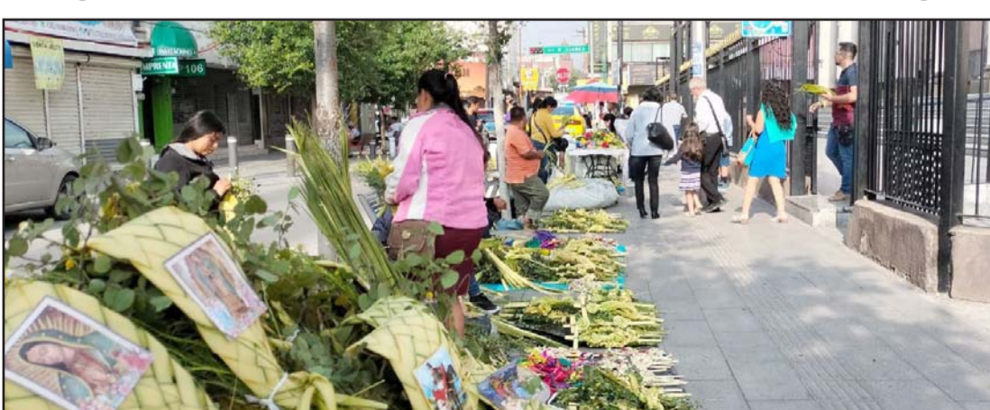
Desde temprana hora los feligreses acudieron a los diversos templos de la localidad.