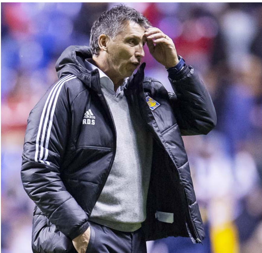
Siboldi buscará revertir la situación el viernes.

Ya en líneas generales de la temporada regular del Torneo Clausura 2024, los camateros registran una victoria, dos empates y nueve derrotas, además de cinco puntos de 36 posibles, siendo últimos en la tabla general luego de 12 goles a favor y 31 en contra.