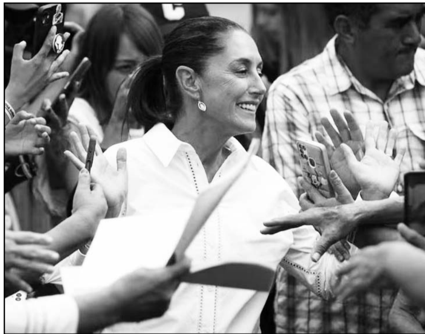
Sheinbaum mencionó que, la autollamada cuarta transformación conquistó el corazón de los mexicanos en 2018 y lo va a refrendar.

Sheinbaum dijo que Morena ha presentado quejas sobre la guerra sucia que ha llevado a cabo la oposición, pero el INE no ha investigado: "Hay cosas que no me explico. Cuando se pide revisar la guerra sucia, los bots comprados desde el extranjero, dicen que no se tiene que investigar y a una petición del PAN que dice que en La Hora Nacional se está difundiendo algo, pues de inmediato se contesta", reclamó la candidata.