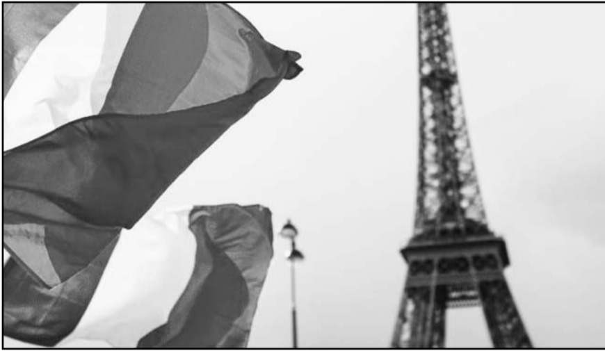
El presidente Emmanuel Macron, presidió una reunión con su consejo de defensa respecto a lo ocurrido en Moscú y sus consecuencias.

La votación sobre el presupuesto del Estado federal también tuvo su dosis de emoción, cuando la congresista Marjorie Taylor Greene presentó una "moción" para destituir al presidente de la Cámara.