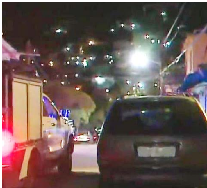
La persona fallecida es de aproximadamente 35 años.

Un grupo de elementos del Instituto de Criminalística y Servicios Periciales de la Fiscalía General de Justicia llegaron a la escena del crimen en busca de evidencias.