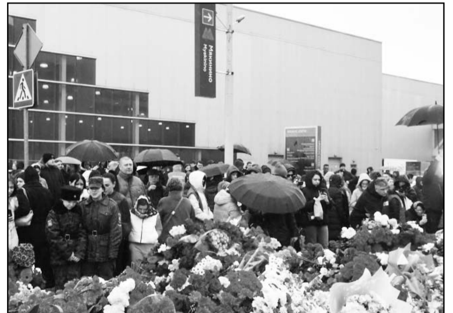
El sábado, el presidente ruso Vladimir Putin prometió castigar a los responsables del atentado.

Por lo que el día sábado, Putin prometió castigar a los responsables del "acto terrorista salvaje".