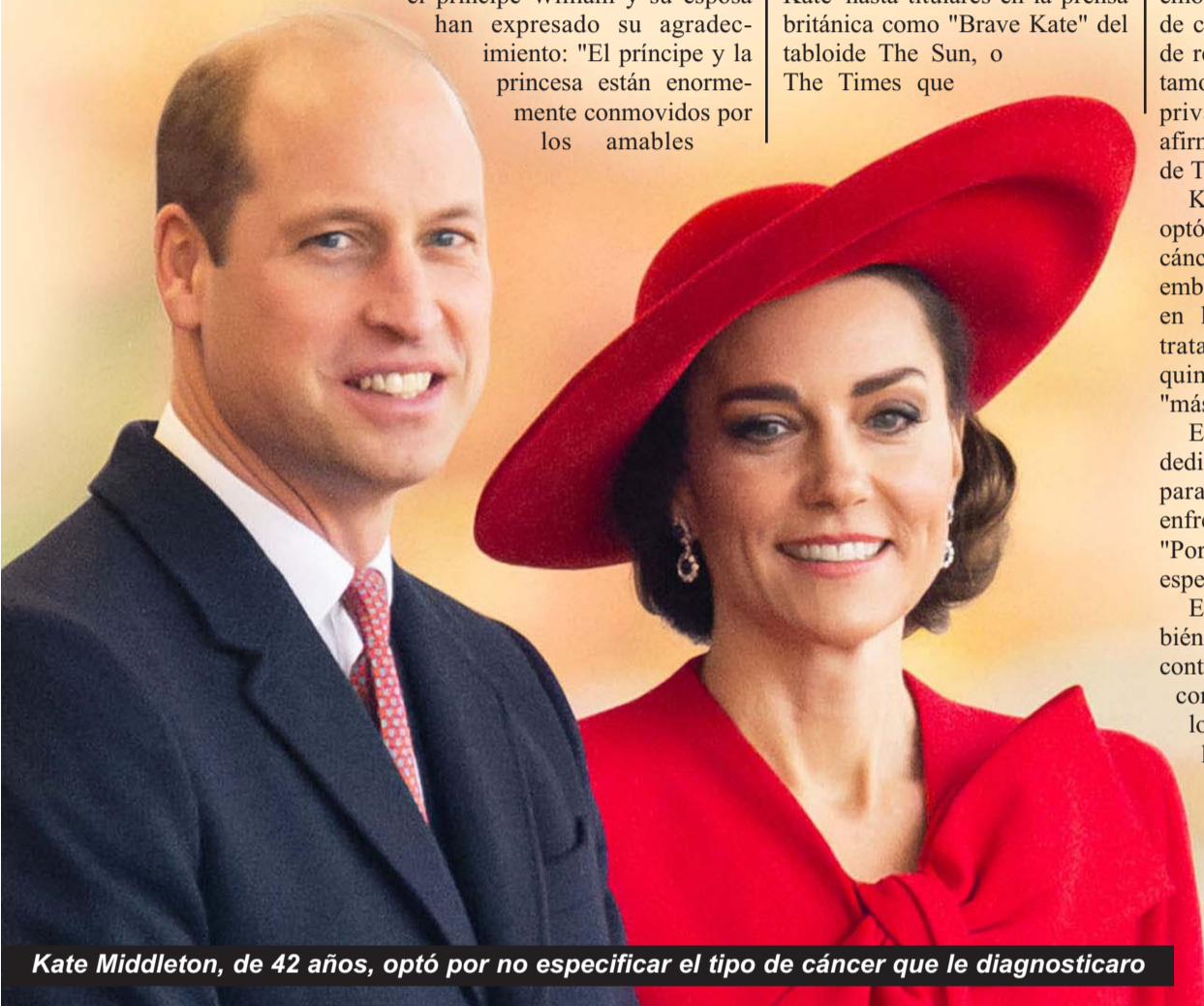
Kate Middleton, de 42 años, optó por no especificar el tipo de cáncer que le diagnosticaron

En total, Zoila Quiñones apareció en más de 30 producciones para el cine y la TV, además del teatro.