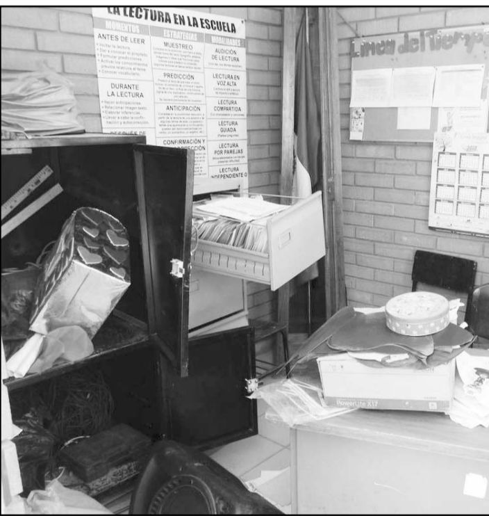
Los ladrones aprovechan estos días para entrar a las escuelas.