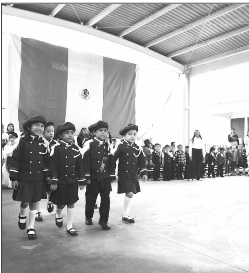
Buscan promoverlo entre todos los estudiantes de educación básica.

En todos hay una revisión permanente de instalaciones e infraestructura para mejorar la atención a los Trabajadores de la Educación y sus familias.