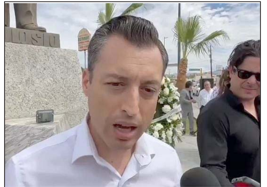
Luis Donald Colosio participó ayer en un evento en Sonora.

Durante el recorrido por esta colonia, saludó a los y las vecinas y escuchó sus necesidades de salud, alimentación y de apoyo a la niñez de la colonia.