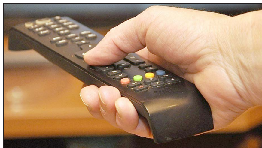
La CIRT exigió al Instituto Nacional Electoral certidumbre en torno a la legalidad de la transmisión de La Hora Nacional.

En la queja que presentaron los panistas, solicitaron como medidas cautelares la suspensión de la transmisión de La Hora Nacional "porque se corre riesgo de que sus conductores transmitan contenidos fuera del marco legal en las mil 700 estaciones de radio mexicanas en todo el país".