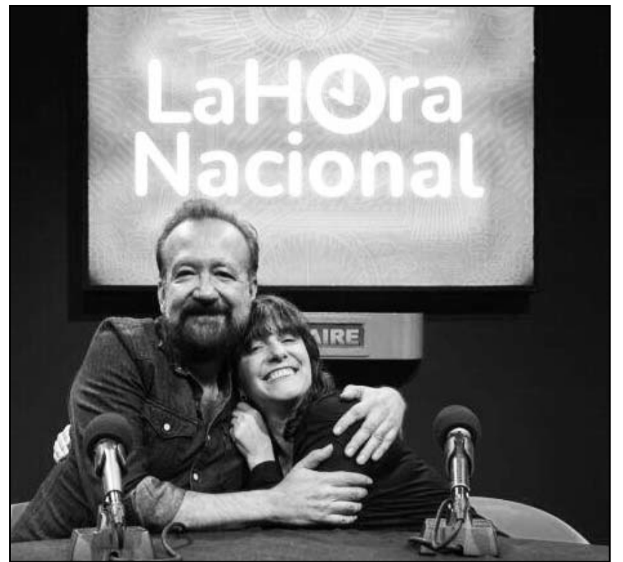
En un comunicado, la dependencia gubernamental dijo que ha entablado un diálogo con los integrantes del CIRT sobre los alcances de las quejas.

Fue en 1937, cuando, por iniciativa del general Lázaro Cárdenas, se creó La Hora Nacional fueron 93 las estaciones que enlazaron su señal por primera vez para transmitir la hora nacional.