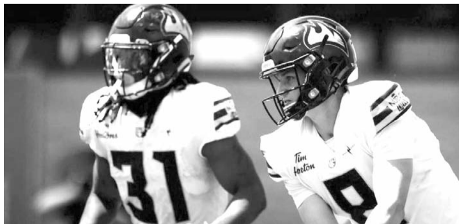
Fundidores ganó su tercer encuentro de la temporada.

Los Fundidores de Monterrey lograron ayer por la tarde su tercera victoria en la temporada regular de la Liga de Fútbol Americano de México, manteniéndose invictos en la campaña.