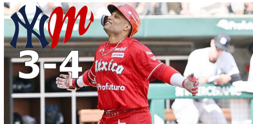
Robinson Canó brilló en el juego ante Yanquis.