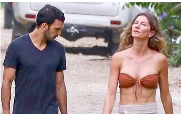
Sobre su nueva relación con Joaquim, indicó que es "algo nuevo para ella".