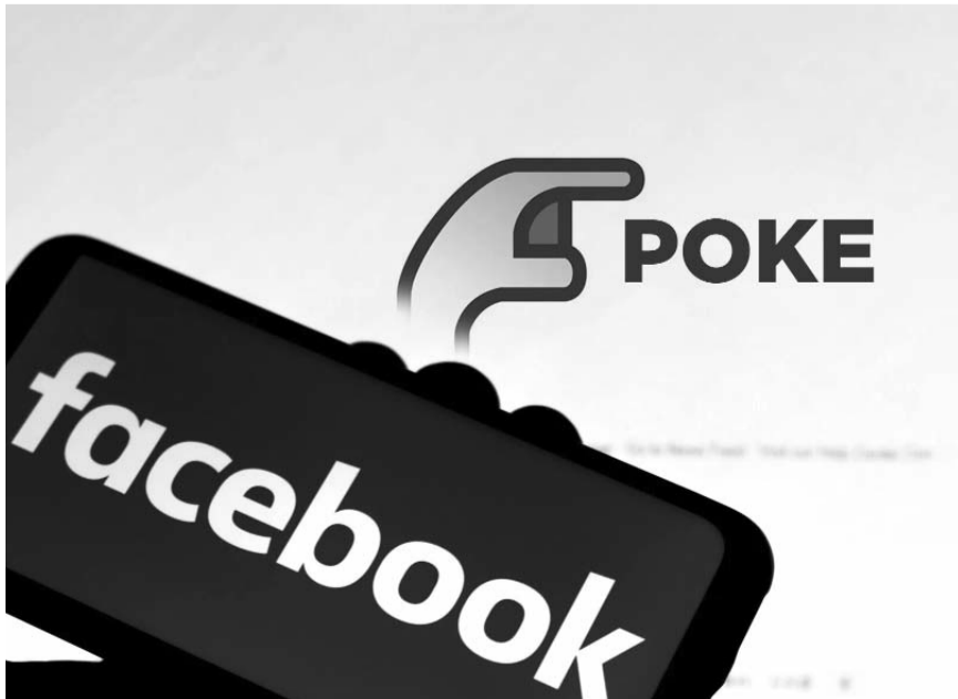
En pleno 2024, Meta decidió ponerle fin a nuestro sufrimiento y trajo de vuelta el "poke".

La razón por la que se crearon los "pokes" no es muy clara. El mismo Mark Zuckerberg indicó en una publicación "creímos que sería divertido crear una función sin un propósito específico. Entonces diviértanse con ella, porque no van a recibir una explicación de nuestra parte".