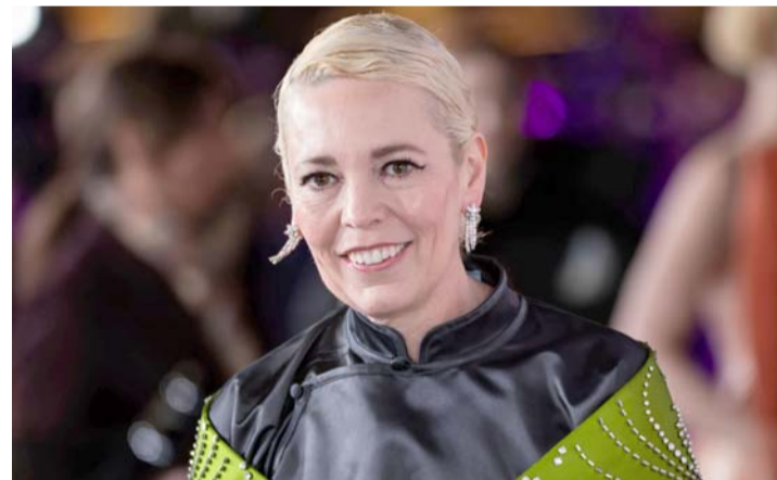
Señaló que en Hollywood aun existe una enorme brecha salarial entre actores y actrices pese a tener los mismos roles.

"Y en realidad, eso no ha sido cierto durante décadas,