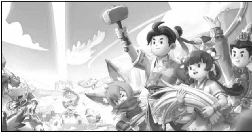
El nuevo Pathless Woods es descrito como un juego acogedor de supervivencia en mundo abierto.

Por ahora, la app tiene un rango de actuación de entre 25 y 50 metros, que es la distancia máxima que calculan que puede haber para cruzarte la mirada con alguien. Y en parte, eso ha hecho que diseñar la app haya sido un reto tecnológico, según sus creadores.