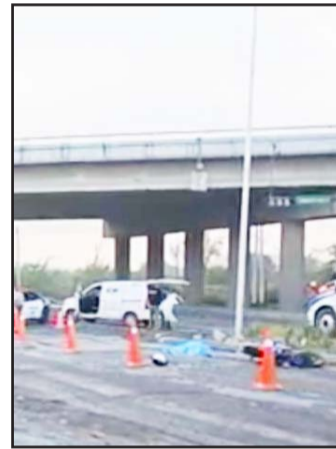
Fue en el Libramiento.

Los paramédicos de la Cruz Roja Mexicana acudieron al lugar, así como de Protección Civil, quienes al revisar al afectado se percataron que ya no presentaba signos vitales.