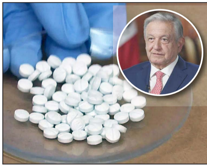
El Ejecutivo aseguró que no ve los asesinatos de candidatos como una amenaza para la democracia.

Alfonsi prosiguió: "El jefe de la DEA [agencia antidrogas de Estados Unidos] dice que los cárteles están produciendo fentanilo en masa y el Departamento de