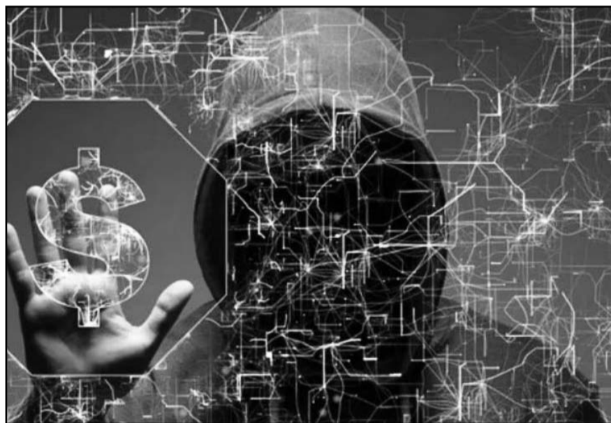
La iniciativa que se plantea modificar, es al artículo 5 de la Ley de Seguridad Nacional.