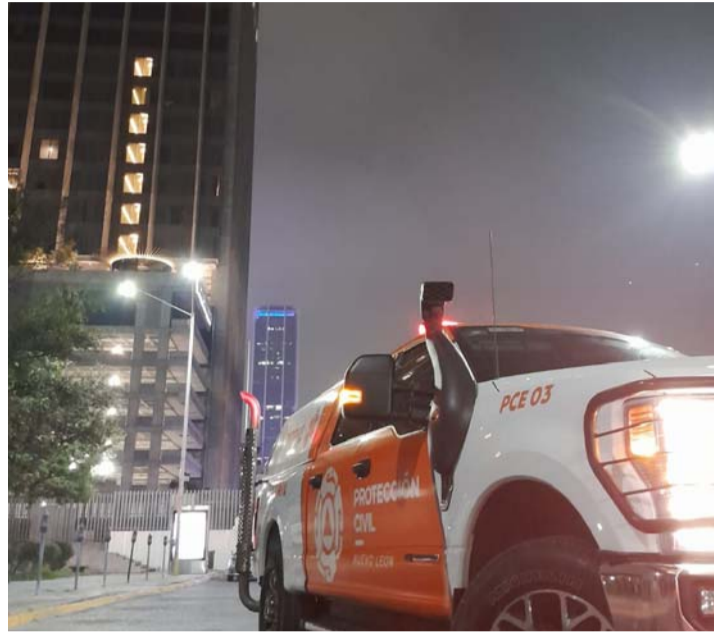
Cayó por el cubo de los elevadores al abrir una puerta.

El personal del Instituto de Criminalística y Servicios Periciales de la Fiscalía General de Justicia de Nuevo León revisó el cadáver, que posteriormente fue llevado en la Unidad del Servicio Médico Forense al Anfiteatro del Hospital Universitario.