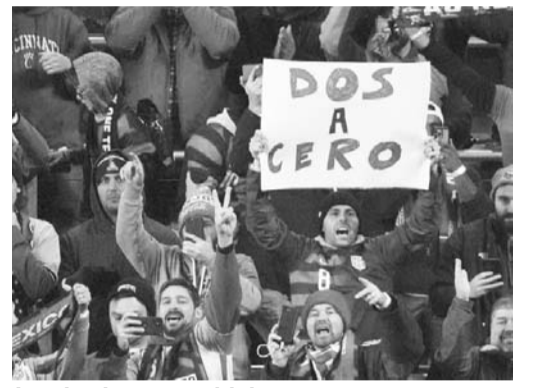
Las burlas no se hicieron esperar.

Las autoridades llegaron de inmediato a calmar los ánimos y retiraron a los aficionados rijosos, mientras que los de Estados Unidos permanecieron para celebrar el título de su selección.