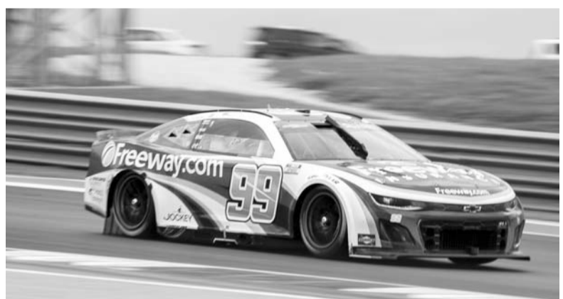
Daniel Suárez tuvo una pésima actuación.