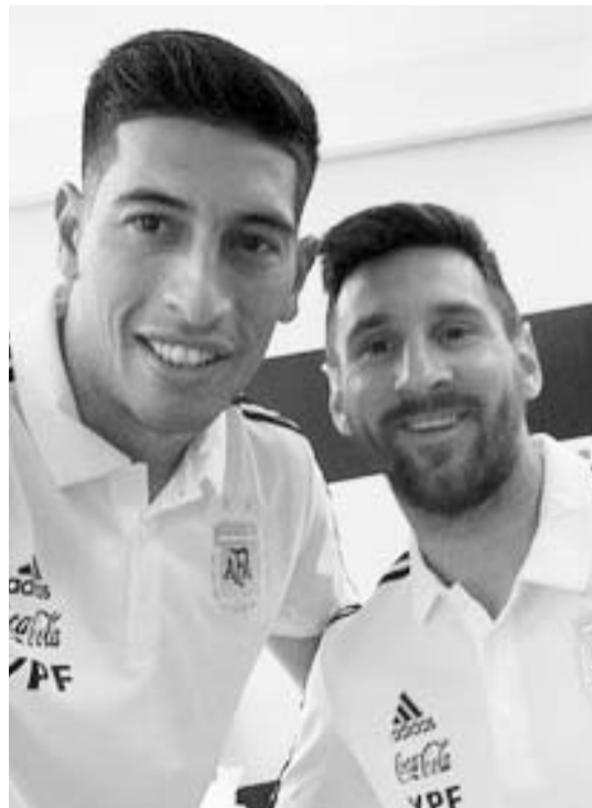
Andfada, aquí con Messi.

Rayados y Chivas se enfrentarán el próximo sábado en punto de las 19:00 horas, donde Monterrey buscará el triunfo para seguir en la cima del presente campeonato mexicano. (AC)