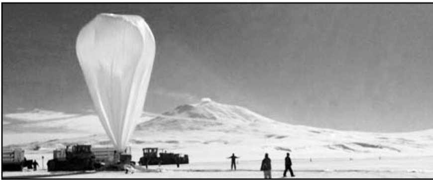
Mendoza Bárcenas, señaló que uno de los objetivos de la misión es el desarrollo para la identificación de contaminantes en la estratosfera.