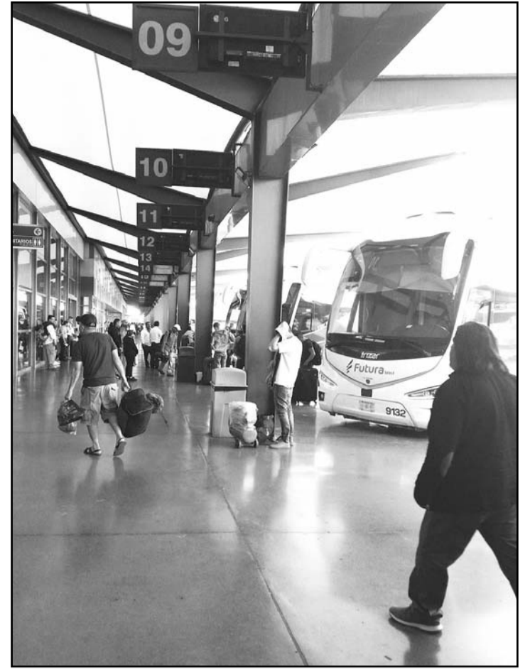
Se registraron constantes salidas y llegadas de camiones.