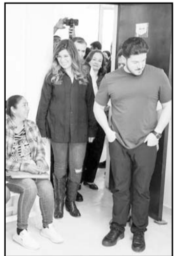
El gobernador recorrió las instalaciones. Adulto Mayor, en China, contribuirá al desarrollo de esta población a través de servicios

Como parte del compromiso del Gobierno del estado de generar espacios que permitan el desarrollo integral de la población, autoridades estatales y municipales constataron la apertura de sitios de infraestructura social enfocados en la atención de grupos vulnerables como niñas, niños, jóvenes y adultos mayores. Durante una gira de trabajo por los municipios de China y Cerralvo, donde se realizó la apertura de la Casa del Adulto Mayor y la rehabilitación del techado de un multideportivo, autoridades de la Secretaría de Igualdad e Inclusión destacaron que estas acciones contribuyen a generar entornos para un mejor desarrollo y garantizar el acceso a derechos para la población. La apertura de la Casa del