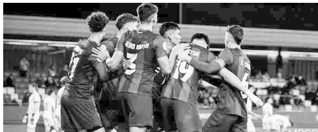
La mencionada filial del Barcelona llegó a la cifra de 57 puntos.

De hecho, el cuadro culé ahora está a un punto del líder, del Real Club Deportivo La Coruña, quienes tienen 58 unidades.