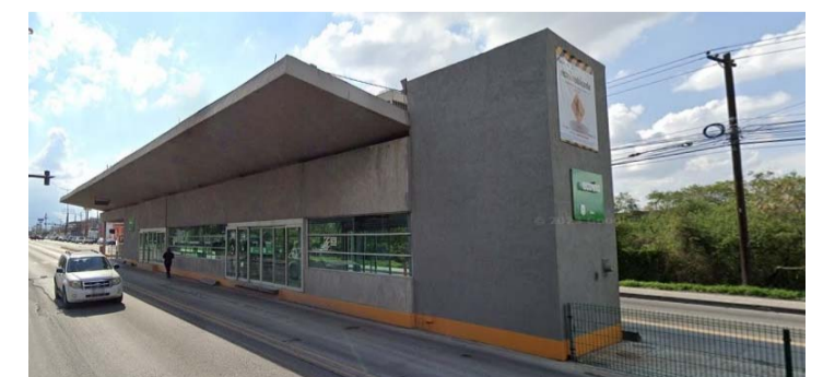
Fue en la estación Tauro, donde sufrió un infarto.

Indicaron que el lamentable hecho se reportó a las 6:00 horas de este domingo en la Estación Tauro, ubicada en la Avenida Ruiz Cortines y Tauro, frente a la Colonia Nueva Lindavista.