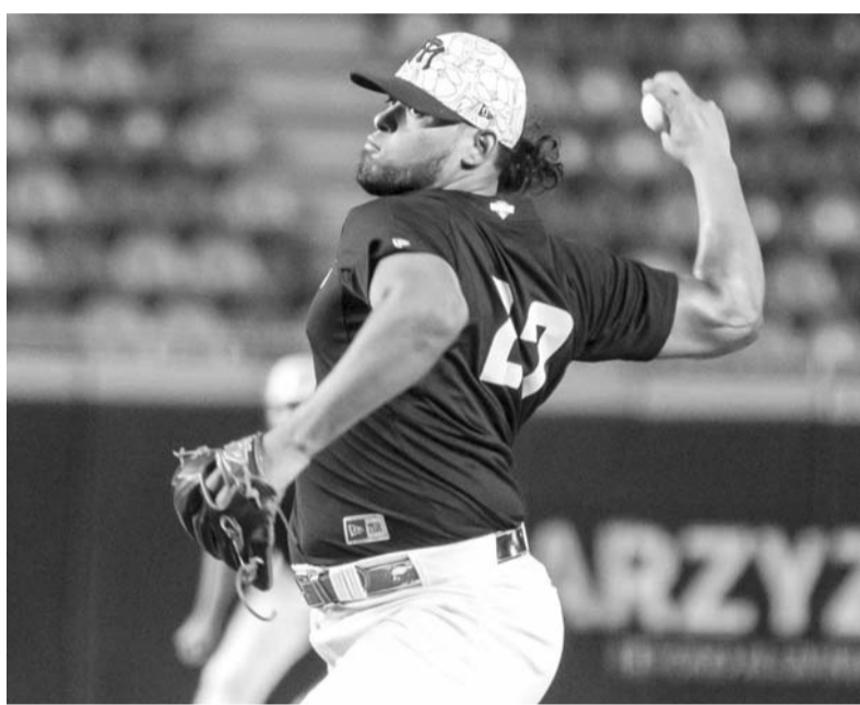
Tecolotes le volvió a pegar a Sultanes.

Con todo esto, la temporada de este año termina en la Plaza México y ahora habrá que esperar al 2025 para que vuelva a ver actividad en el Coso de los Insurgentes de la capital del país.