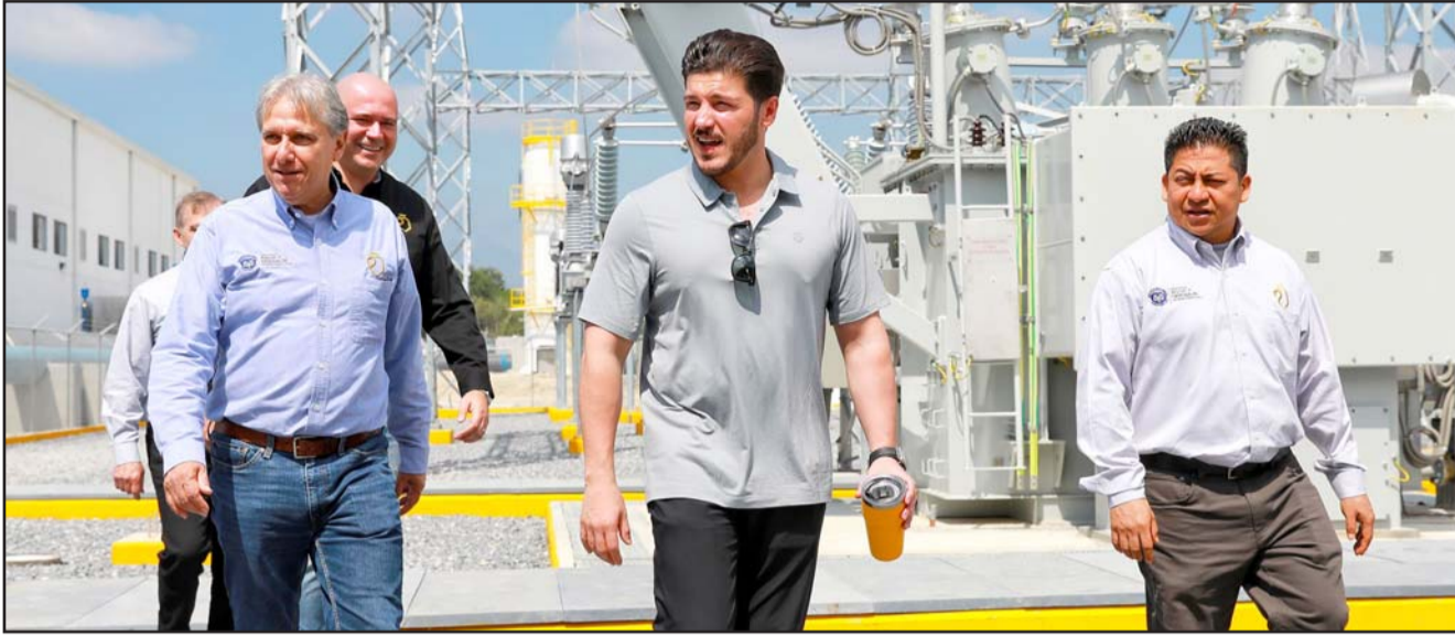
El gobernador, Samuel García Sepúlveda acudió al lugar e hizo un recorrido.