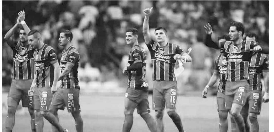
Las Chivas no la han pasado mal en el estadio de los Rayados.