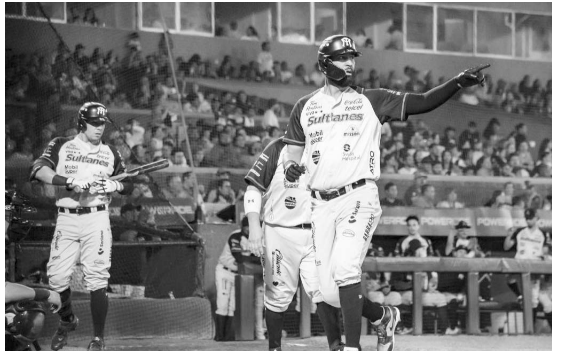
Sultanes se miden a los Bravos de León en una serie que parece sencilla.

Con todo esto, Sultanes tiene todo a su favor para ganar la serie y seguir en la cima de la Zona Norte, todo esto para irse afianzando de cara a la postemporada, en donde sin duda alguna serán uno de los equipos favoritos al bicampeonato. (AC)