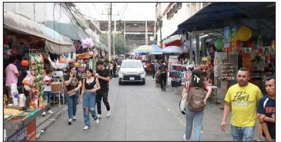
Las autoridades regiomontanas buscan que sea todo bajo un buen acuerdo

"Nunca ha sido una imposición. Siempre ha sido privilegiando la comunicación y privilegiando el diálogo" dijo