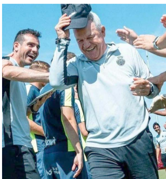
El estratega mexicano podría retirarse.

"Seguramente en la boda de mi hijo, el ocho de junio, tomaré tequila. Estaba enojado con el tequila y voy a reconciliarme. Me equivocué, me equivocué", agregó Javier Aguirre.