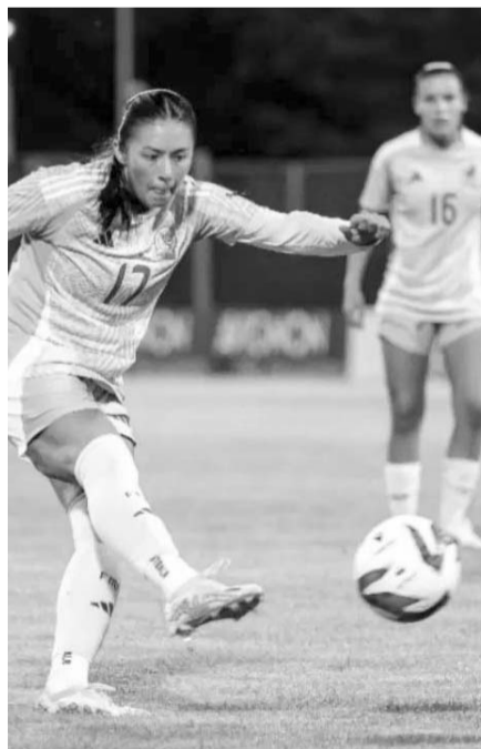
Las mexicanas dieron buen juego.

El duelo entre las connacionales y las niponas pretende iniciar en punto de las 13:00 horas, realizándose por cierto en el estadio Parc des Sports de Aviñon, en Francia.