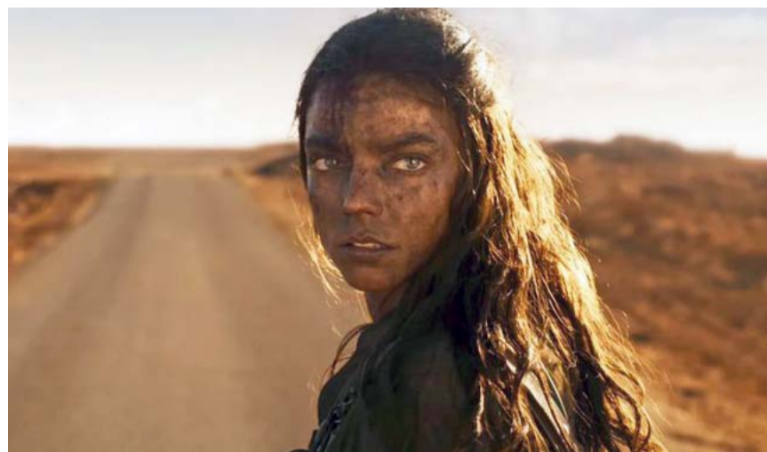
Al menor por ahora, Warner Bros. tiene a la película número uno en EU.