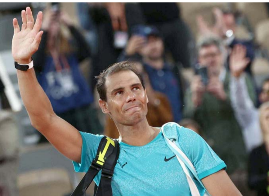
Rafael Nadal prácticamente anunció su adiós del tenis.