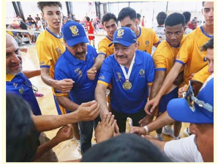
La Máxima Casa de Estudios parece no tener rival.

Con sus dos penales atajados, Tajonar le dio el título a las Rayadas, quienes con tres títulos ya son el segundo club más ganador en la historia de la Liga MX Femenil, estando detrás en este sentido y únicamente de Tigres.