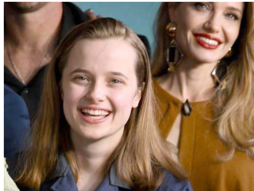
Se desconoce si ya es legal la modificación del apellido o solo es de manera artística.