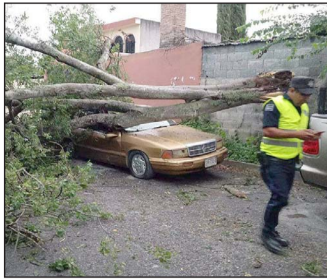
Granizo y fuertes vientos que provocaron la caída de árboles y postes fue lo que dejó la tromba.