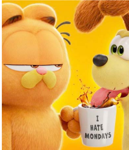
Recaudó 31.1 mdd en 4 días.

La película animada que cuenta con la voz de Chris Pratt probablemente tendrá una larga vida en taquilla a par-