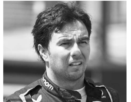
Se espera que Sergio Pérez confirme su continuidad con Red Bull Racing.