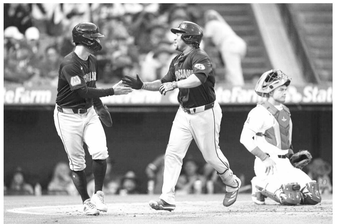
Los Rockies no batallaron con los Guardianes.

Un error con las bases llenas produjo la primera carrera. El dominicano Elehuris Montero impulsó dos más con sencillo y el segundo jonrón