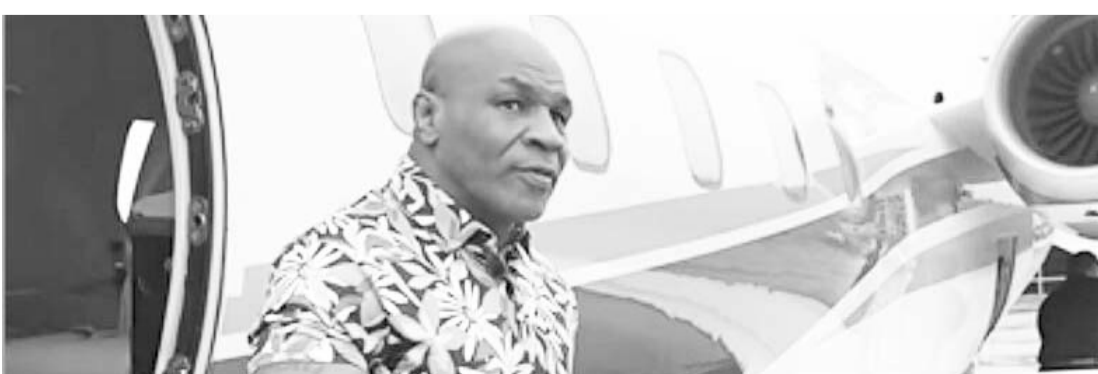
Sufrió un problema médico durante un vuelo de Miami a Los Angeles.