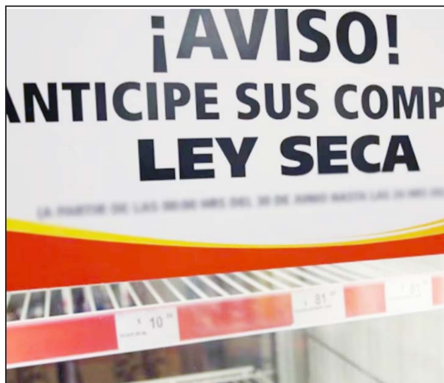
El próximo 2 de junio se disputarán más de 19 mil cargos públicos.