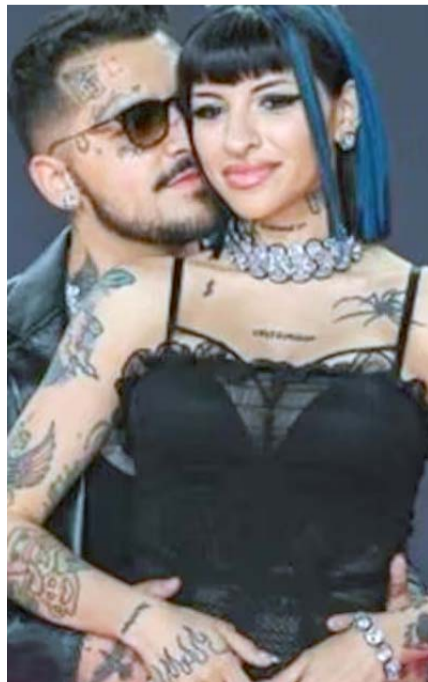
El mexicano habría aprovechado sus viajes solo, para ser infiel.

El atraco hizo que Nodal decidiera mudarse, junto a su familia, de Argentina, pues supuestamente una persona cercana a la trapera estaría relacionada con el crimen, algo que no está confirmado.