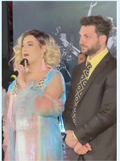
Se incorpora la actriz trans Coco Máxima, así como Nicola Porcella.