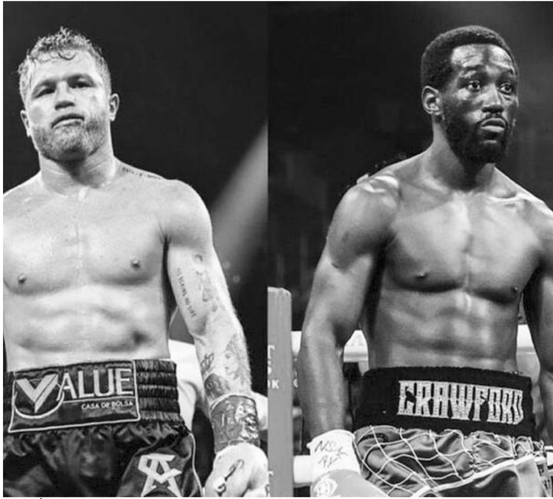
Saúl Álvarez y Terence Crawford, muy cerca de estar frente a frente.

Un combate entre ambos púgiles sería en las 168 libras, aunque todavía falta que se pueda confirmar de manera oficial para que deje de ser lo que es en estos momentos, en este caso solamente un rumor.