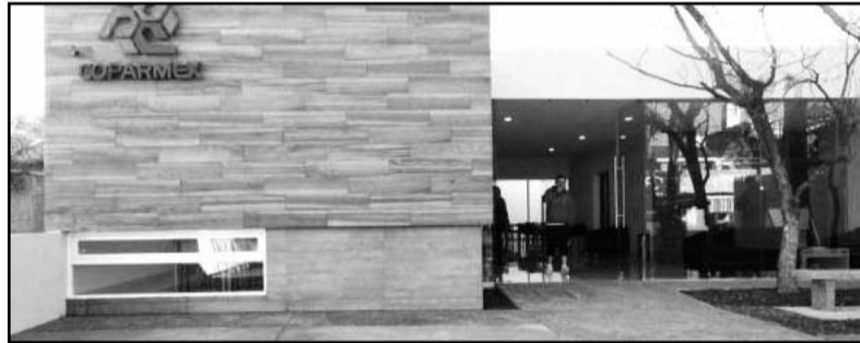
Según dicen han tratado de influir de una u otra forma.