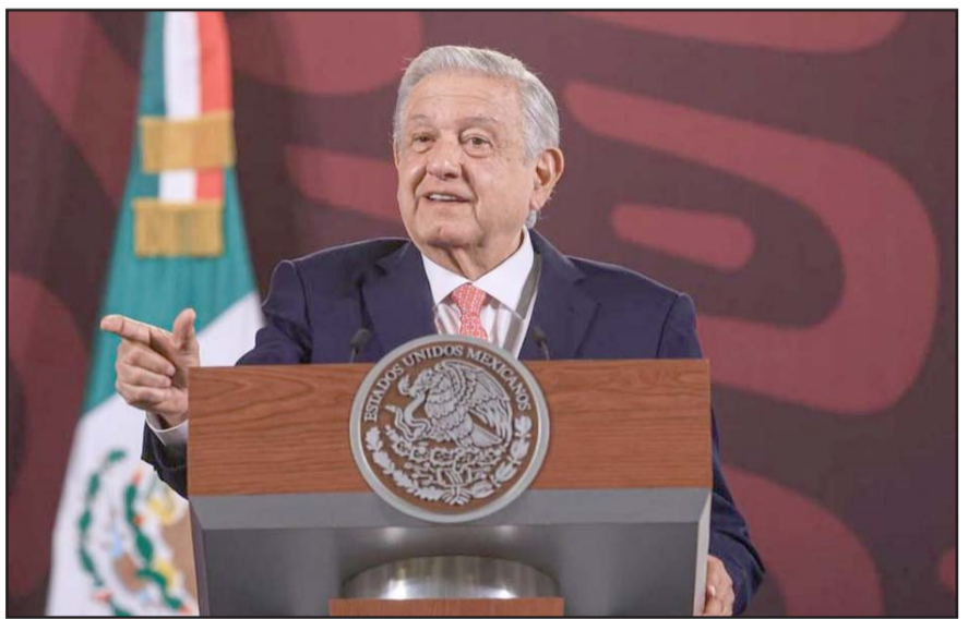
En conferencia de prensa, el Mandatario federal cuestionó que sus opositores hablen de democracia cuando, no toman en cuenta al pueblo.

La cual se fundamenta en la ley general de instituciones y procedimientos electorales en el artículo 300 apartado 1 y 2 en el cual se estipula que los cuerpos de seguridad deben asegurar el orden y garantizar el desarrollo de la jornada electoral para ello podrán establecer medidas para limitar los horarios de establecimientos que sirvan bebidas alcohólicas.