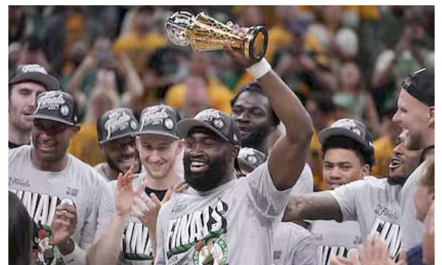
Celtics de Boston se perfila a coronar un gran año.

Indiana, que nuevamente jugó sin el dos veces All-Star Tyrese Haliburton, perdió por segunda vez seguida en casa, ambos en los últimos minutos después de dejar escapar ventajas.