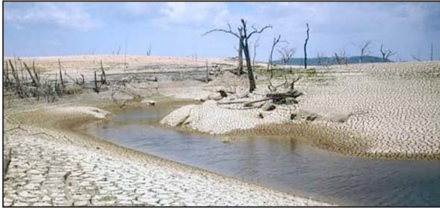
Quince municipios están en sequía moderada, siete en severa y cuatro extrema

están en anormalmente seco, mientras que las presas registran un nivel crítico.