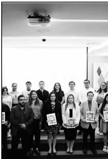
Desarrollaron sus propuestas

Como parte de la iniciativa del IEEP-CNL ¡Somos Juventud! Espacios para opinar, construir y solucionar, juventudes nuevoleonenses entregaron una agenda de temas a las representaciones de partidos políticos y candidatura independiente que participan en el proceso electoral local actual, con el propósito de que sean escuchadas y tomadas en cuenta.