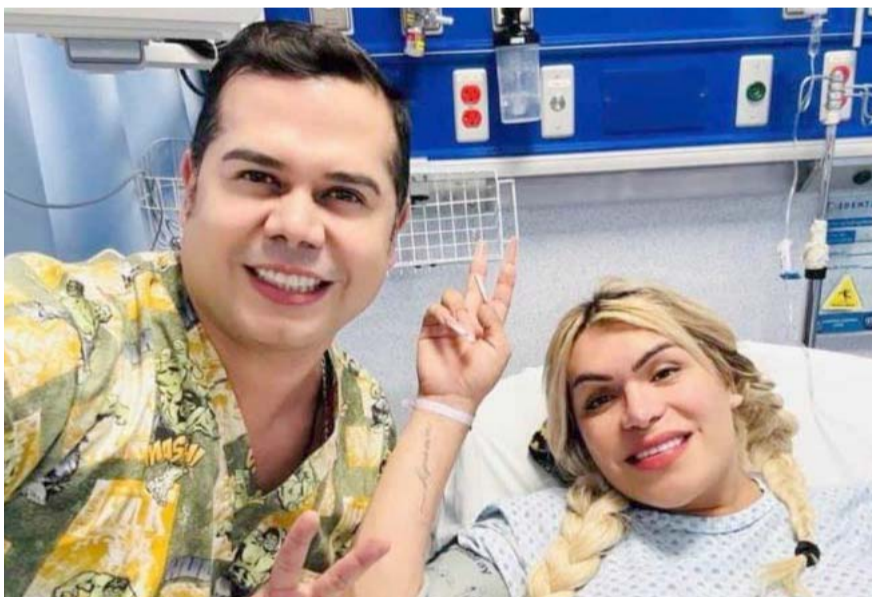
La influencer ya fue operada y se encuentra en recuperación.

Durante la mañana de este lunes, trascendió que la influencer ya fue operada, supuestamente con éxito y está siendo acompañada por sus amigos, sin embargo, Guevara no ha dado más detalles al respecto.