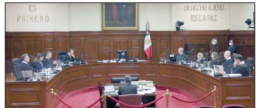
Hasta el 4 de abril, 72 candidatos se habían inscrito para el proceso de selección.

días hábiles al Senado para que informe sobre las acciones realizadas para la designación y nombramiento de los comisionados del Inai.