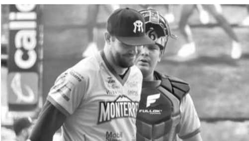
Sultanes ahora tiene un récord.