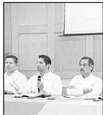
Se hizo por las lluvias.

cualquier situación que se presente, utilicen los espacios oficiales de comunicación que la organización tiene a su servicio", indicó.