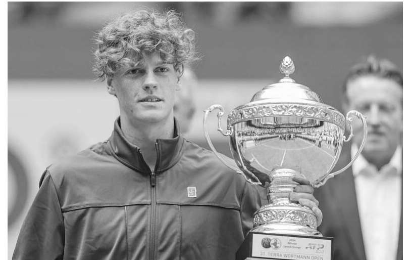
Jannik Sinner sigue siendo el número uno.