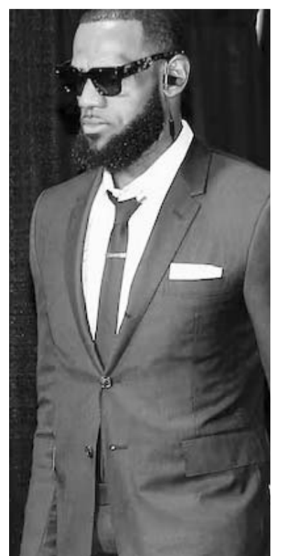
LeBron prepara las maletas.

James, de salir de los Lakers, sería agente libre y uno de los equipos interesados podrían ser los Guerreros de Golden State, aunque esto, hasta estos momentos, es solamente un rumor.