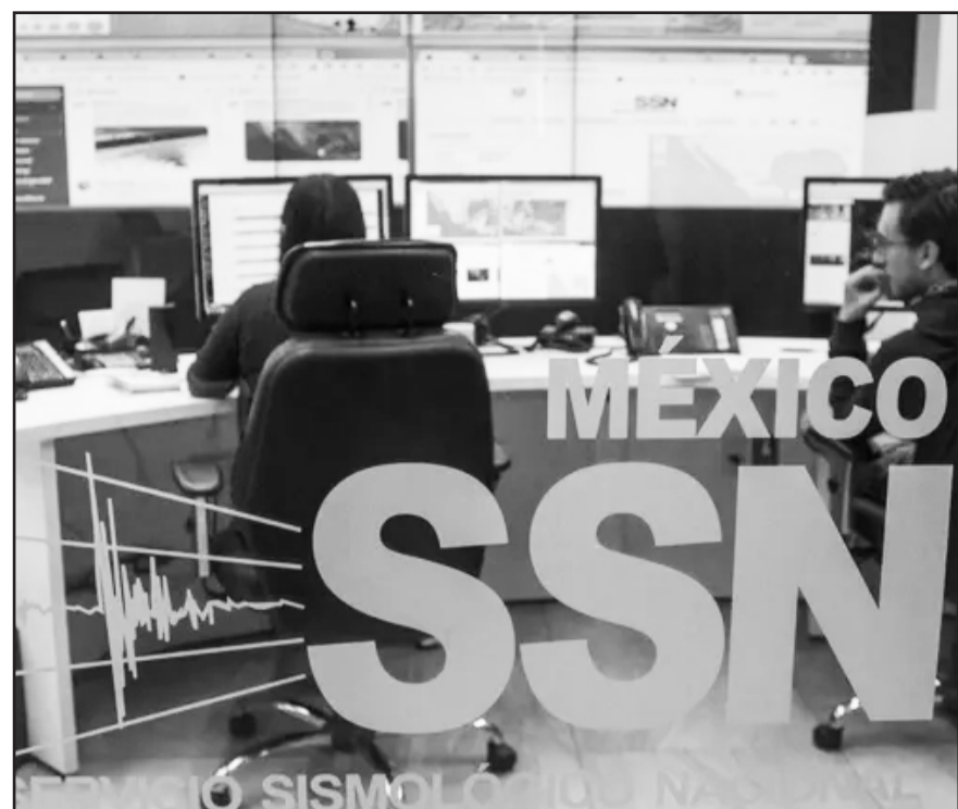
El sismo tuvo una magnitud inicial de 4.4 con una localización de 22 kilómetros al suroeste de San Marcos.

Este sismo causó severos daños estructurales en varias localidades, dejando a miles de personas sin hogar y