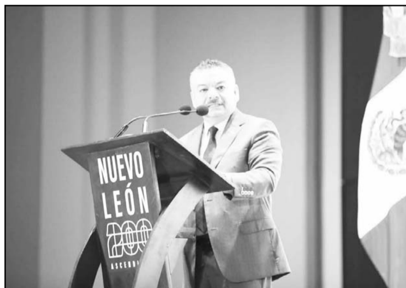
Será solo para el personal de apoyo tanto de base como de contrato