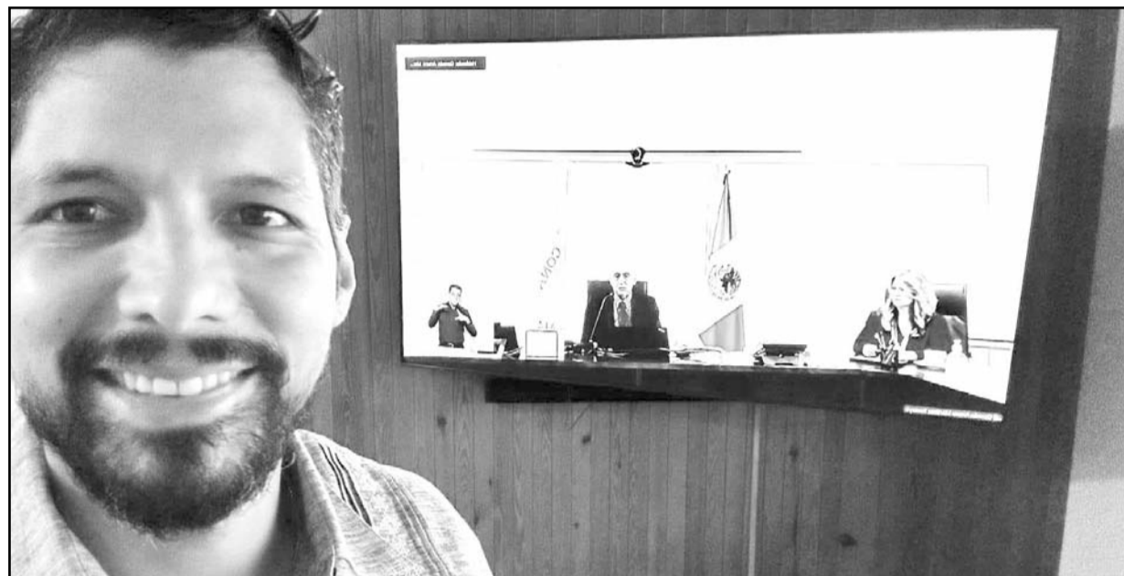
Se tuvieron conferencias con las diferentes secciones por medio de las cuales mostraron su apoyo

para mantener el ritmo vital del mundo, por ello dijo que era estratégico que se profundizará en el conocimiento de esta interrelación y se comprenda que todos debemos actuar de manera responsable para cuidar y preservar el planeta.