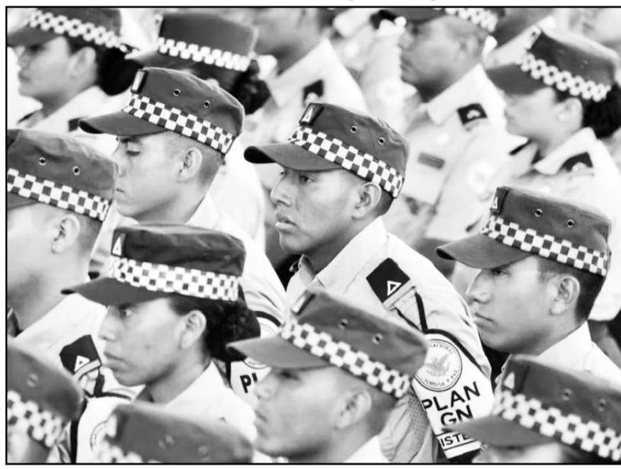
Durante el discurso, el alto mando castrense subrayó la importancia de la Guardia Nacional para la seguridad del país.

Puntualizó que eso no significa que los jueces y magistrados vayan a emprender campañas electorales a través de algún partido político, lo que implicaría un gasto adicional, sino que para dar a conocer sus propuestas, programas de trabajo y perfiles profesionales tendrían acceso a los tiempos oficiales en radio y televisión.