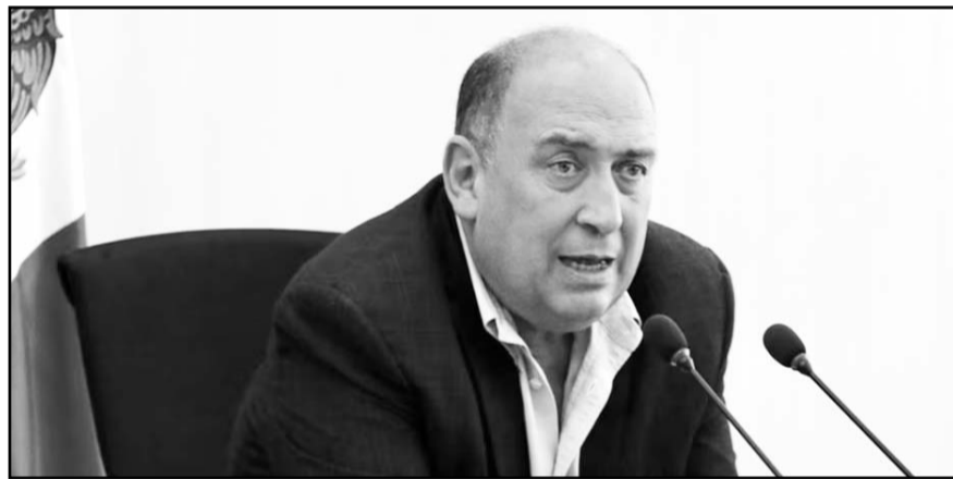
"Nos preocupa que las minorías no sean escuchadas", expresó el coordinador de la bancada priista.