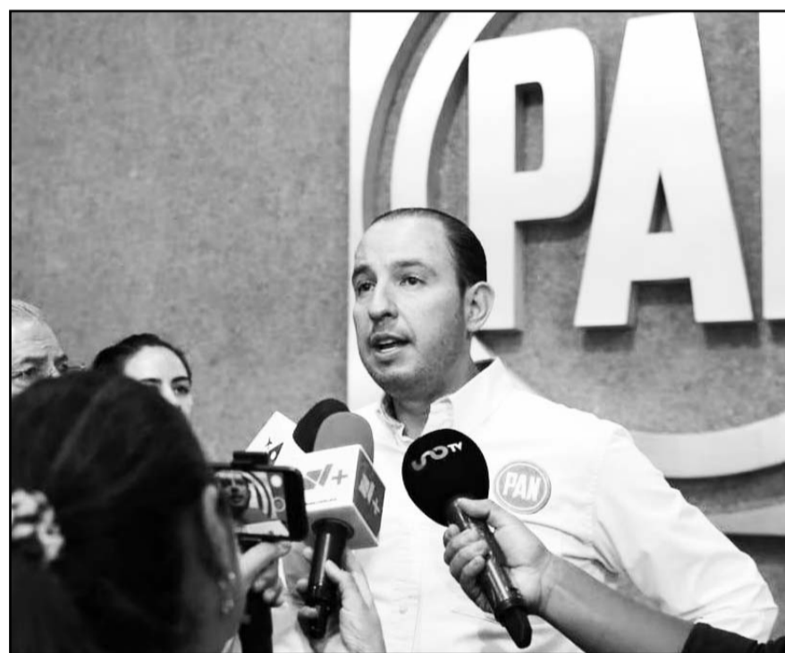
El panista expresó que, tal como está planteada la reforma, podría generar graves retrocesos en el país.

Cortés expresó que tal como está planteada la reforma, podría generar graves retrocesos en el sistema judicial del país. Destacó que los principales beneficiados serían la delincuencia, el gobierno y el partido en el poder, quienes podrían manipular el sistema judicial para sus propios intereses, comprometiendo así la ver-