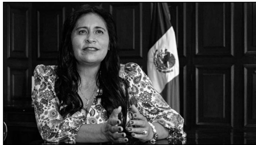
La senadora de Morena señaló que la separación de poderes debe tender a la cooperación armónica entre los órganos del Estado mexicano.

Su declaración no solo enfatizó la colaboración continua de la Sedena, sino también reafirmó el compromiso del gobierno con la seguridad y el bienestar de la ciudadanía, asegurando que la Guardia Nacional seguirá siendo una prioridad en la agenda nacional.