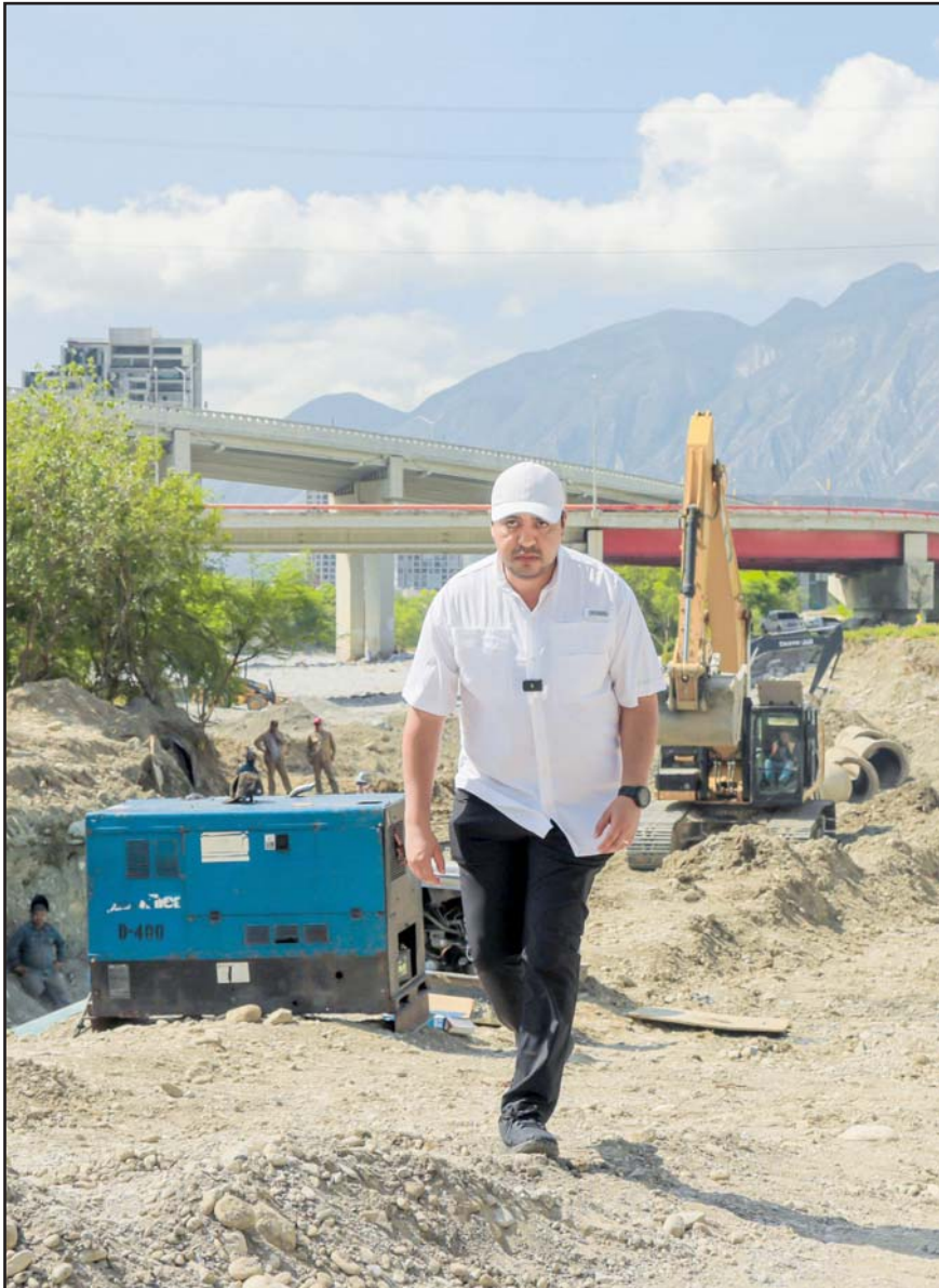
El alcalde Jesús Nava destacó la importancia de que se haga esa reubicación

Una cuadrilla de dicha dependencia municipal llevó a cabo las reparaciones en dichas vialidades del citado sector ya fueron finalizadas por el personal correspondiente y los automovilistas pueden transitar libremente por la vía que fue reparada esta mañana.