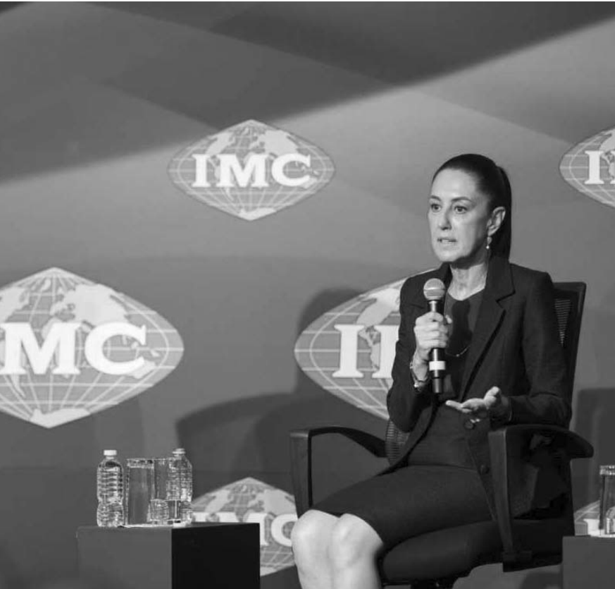
La Confederación dijo en un comunicado que ya se han reunido con Gómez en el marco de las juntas nacionales.

La Coparmex recordó que, desde hace un par de años, promueven el Modelo de Desarrollo Inclusivo, el cual