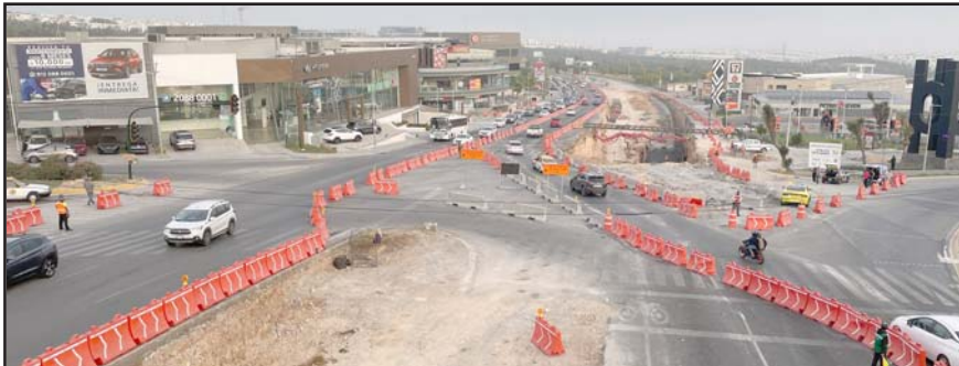
Poco a poco toma más forma el paso a desnivel que se construye.

Además, se implementa un contraflujo por la tarde-noche: de 16:00 a 22:00 horas, en sentido de oriente a poniente.