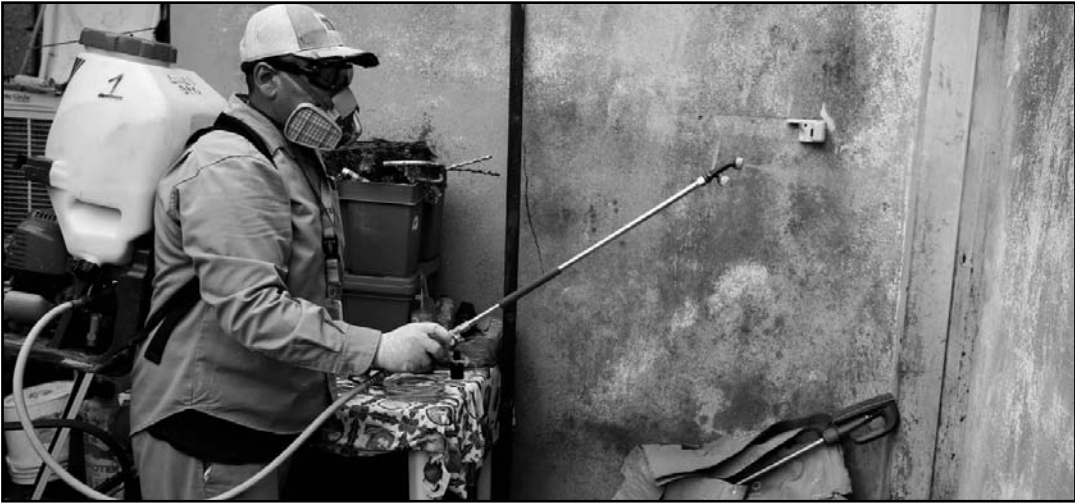
Ayer tocó el turno a la famosa colonia La Moderna, en donde se recorrieron sus calles.