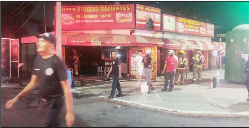
El incidente fue durante la madrugada.

andaba en estado inconveniente y derribó un tanque de gas, provocando el siniestro.