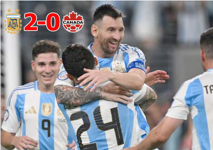
El máximo candidato a llevarse la Copa América, haciendo su tarea.

irse al descanso con una jugada de Ángel Di María en la que intentó clarear al portero canadiense y la falló, aunque después un tiro de Tagliafico fue mandado a tiro de esquina y posteriormente el futbolista Lionel Messi tuvo una más en una jugada individual que finalizó con un remate cercano al poste. Posteriormente a esto, pero en la segunda mitad, Argentina encontró el 2-0 en un tiro en el área grande de Enzo Fernández que venció el lance del portero canadiense, arquero que no tuvo una gran visibilidad en el remate ya que en la jugada intervino Messi y aún así no se marcó el fuera de lugar,