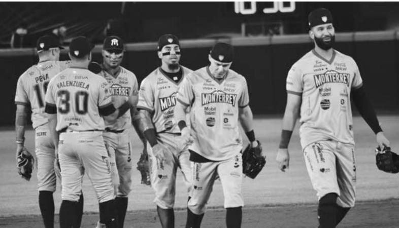
Sultanes dejó ir la ventaja.