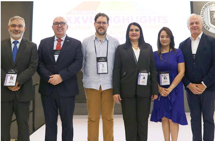
La gente minimiza las alergias por la creencia de que no hay tratamiento.

“Generalmente estas alergias se minimizan en el sentido de creer que no hay nada que hacer y la gente se acostumbra a ellas, sin embargo, el origen de una alergia