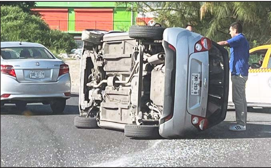
Se registró en Ciudad Solidaridad, en Monterrey.

Por lo anterior, fue detenido y puesto a disposición del Ministerio Público para lo que resulte.