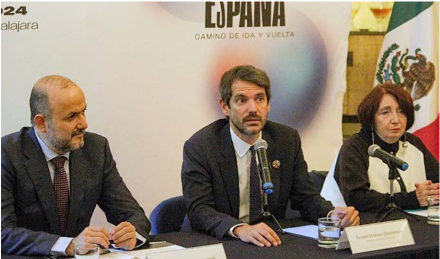
Más de 150 autores, tres exposiciones, nueve espectáculos y una muestra gastronómica, la aportación de España en la FIL que se celebra en noviembre.