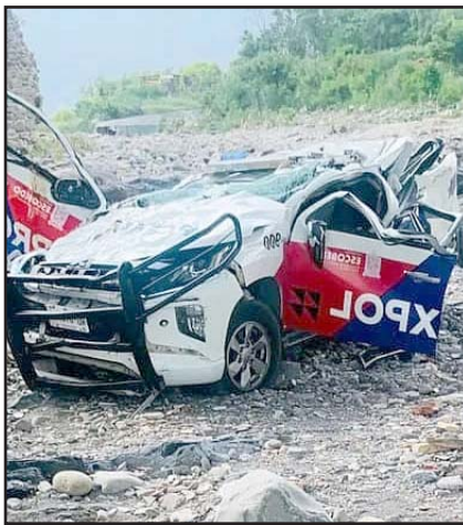
Cayó al Río Pesquería.

En ese lugar, la unidad en que viajaban los oficiales se precipitó a las márgenes del Río Pesquería.