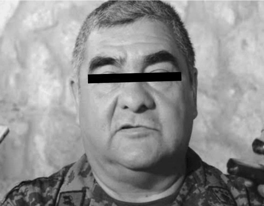
El excomandante del 27 Batallón de Infantería de Iguala, Guerrero, llevará su proceso en libertad,

Rodríguez Pérez fue detenido en septiembre de 2022 y se convirtió en el militar de más alto rango de aprehendido por el caso Ayotzinapa.