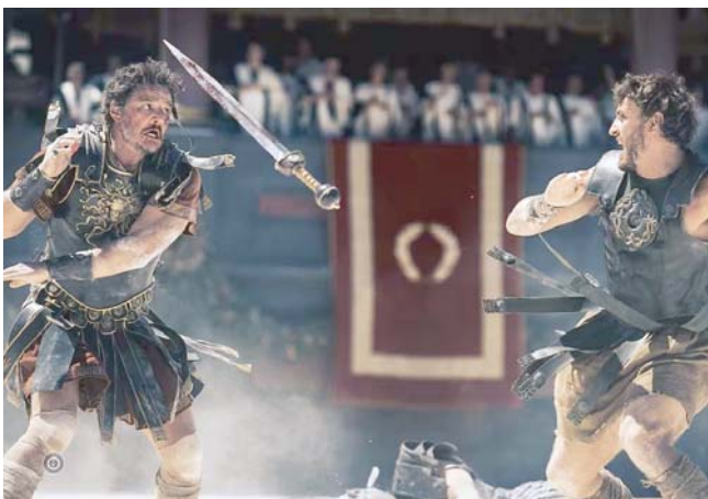
La película original de 2000, ahora es protagonizada por Paul Mescal y Pedro Pascal.

La película se estrenará el 22 de noviembre. La descripción del tráiler ofrece también