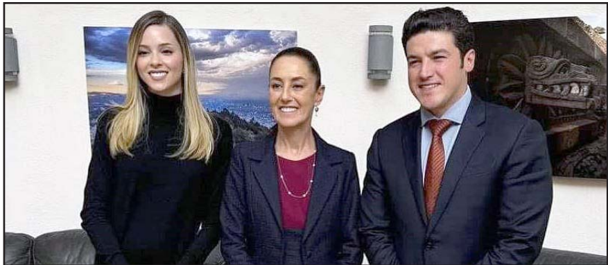
La presidenta electa, Claudia Sheinbaum recibió al gobernador y su esposa.