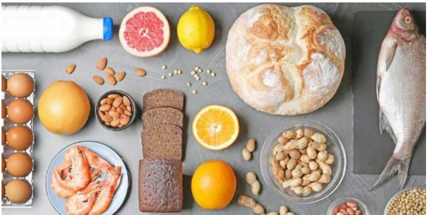
Los temas estuvieron centrados en las alergias ocasionadas por alimentos.

puede ser hereditario una cuestión ambiental.