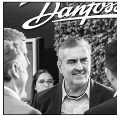
Lo presumió el alcalde.

León, es hoy la Capital Industrial de Nuevo León, somos el cuarto municipio exportador de México y tenemos en nuestro suelo el 70 por ciento de los parques industriales de Nuevo León”, dijo.