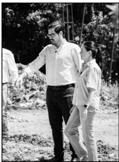
El alcalde hizo un recorrido.

“Este centro DIF le va a dar atención a La Esperanza, a Los Encinos, a la Garza Madero, a