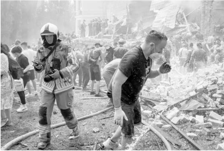
El presidente se encuentra en EU para la cumbre de la OTAN.