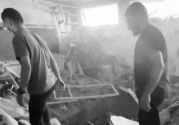
Van dos ataques a escuelas en sólo tres días.

Por su parte, Hamás acusó al primer ministro de Israel, Benjamin Netanyahu de bloquear las negociaciones para