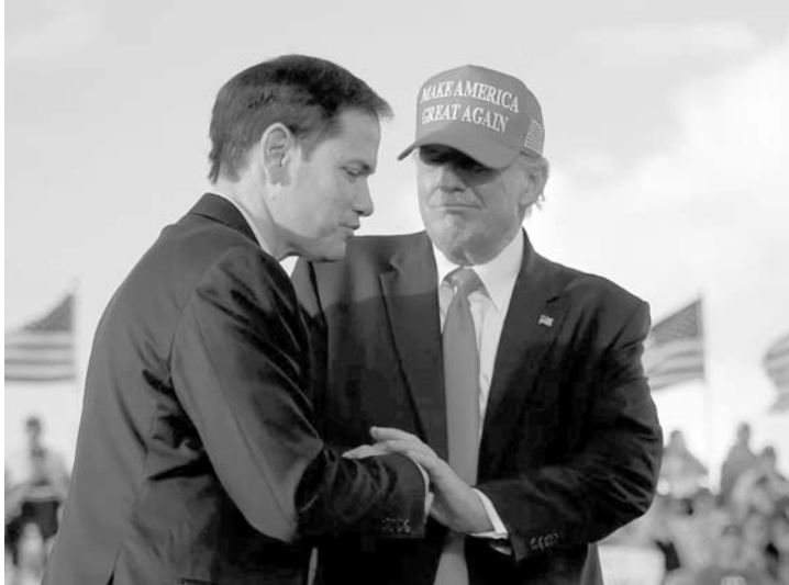
Crece fuerte la versión sobre el nuevo cargo del republicano.

desde las 2:00 pm, aunque el discurso del expresidente estaba programado para las 7:00 pm.