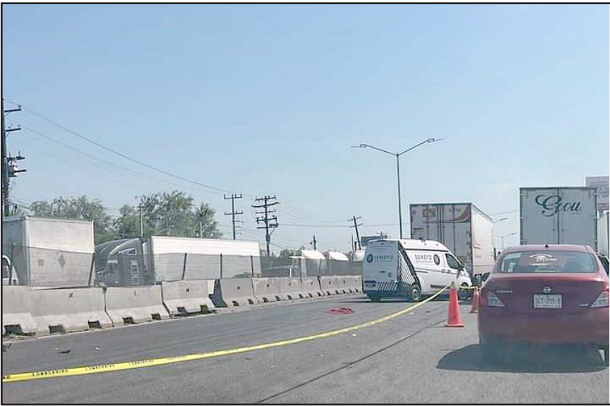
Los hechos se registraron en el municipio de Apodaca.

Una vez que el cadáver fue revisado por el personal del Instituto de Criminalística y Servicios Periciales de