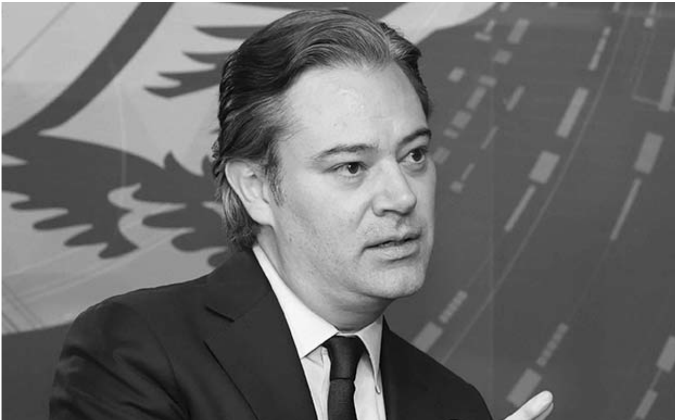
El exsecretario de Educación Pública, Aurelio Nuño Mayer.

mente todas las voces con una filosofía política bien estructurada, con una organización bien estructurada, un partido genuinamente democrático, con potencia política, con fuerza, con capacidad de enfrentar al gobierno y ser una oposición que empiece a reconquistar la confianza de cada mexicana y de cada mexicano.