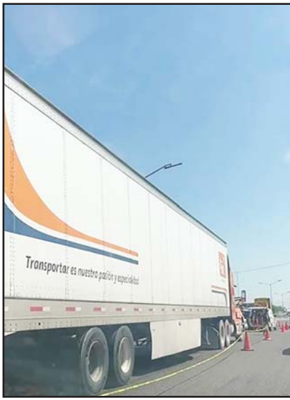
Hubo caos en la vialidad.

La fuente comentó que presuntamente el joven se pasó el semáforo en rojo, por lo cual chocó contra la