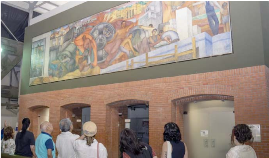
“Allegoría de la Producción”, es el mural del artista y se ubica en el interior de la Nave 2 del Centro de las Artes.

De acuerdo con la Organización Mundial de la Salud (OMS) y la WAO, se ha incrementado a 14 el grupo de alérgenos.