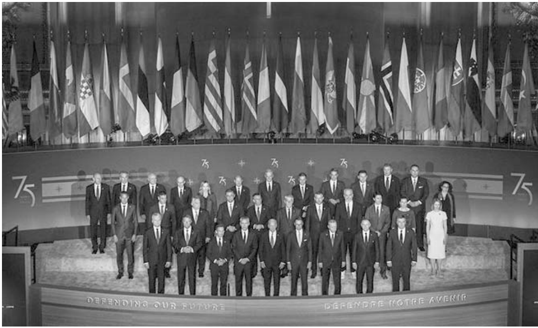
Refrendaron los Jefes de Estado la lucha a favor de la paz.

Tanto Biden como el secretario saliente de la OTAN, Jens Stoltenberg, reafirmaron su apoyo a Ucrania ante la inva-