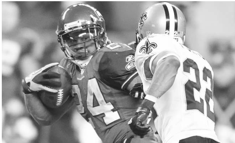
El organismo sigue cosechando grandes ganancias.

Saúl “Canelo” Álvarez, boxeador mexicano, fue colocado como el cuarto mejor púgil a nivel mundial. Según The Ring, una reconocida revista de boxeo a nivel global, Saúl Álvarez fue colocado como el cuarto mejor púgil del mundo y en la lista solamente fue superado por el ucraniano Oleksandr Usyk que apareció en la primera posición, mientras que el japonés Naoya Inoue estuvo en la segunda y el afroamericano Terence Crawford en la tercera. Ya el top 10 fue completado por los boxeadores Jesse “Bam” Rodríguez, Artur Beterbiev, Dmitry Bivol, Gervonta Davis, Errol Spence y Junto Nakatani. Álvarez, de 33 años de edad, venció el pasado cuatro de mayo en Las Vegas al tijuanaense Jaime Munguía. El boxeador tapatío volvería a pelear para el mes de septiembre y pugilistas como Edgar Berlanga, Jermall Charlo y Chris Eubank se manejan como posibles rivales para este cierre del 2024.