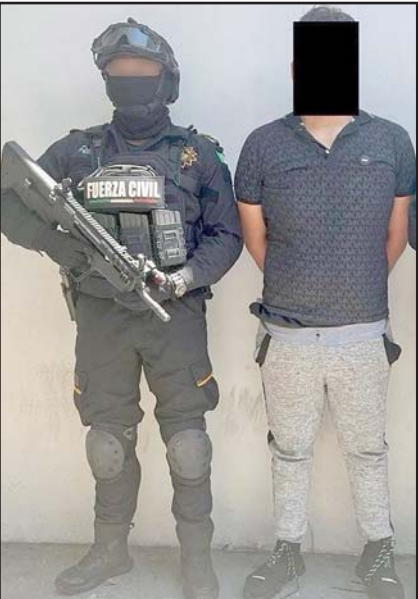
Fue detenido en San Pedro.

Familiares del matrimonio llegaron al lugar del accidente al conocer la noticia y soltaron en llanto.