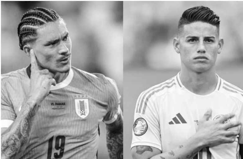
Uruguay y Colombia buscan ser el rival de Argentina.