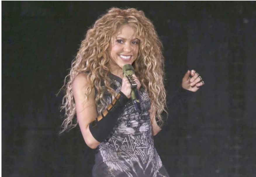
La colombiana es la primera artista en amenizar una final del Torneo.

En 2018, Chris Meledandri, fundador de la compañía de entretenimiento Illumination (creadora de "Mi villano favorito", se asoció a DreamWorks Animation con el propósito de hacer resurgir la historia.