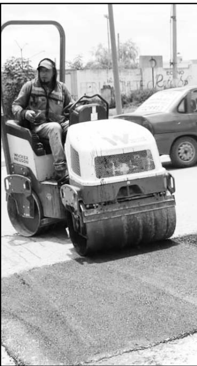
A diario se hacen los trabajos

Treviño Cantú señaló que igualmente se han incrementado los trabajos de deshierbe en áreas verdes y parques, para que estén en condiciones óptimas de ser visitados por las familias juarenses, en particular por niños y jóvenes que practican algún deporte, previniendo enfermedades como el dengue.(IGB)