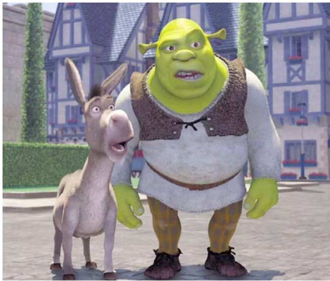
Eddie Murphy, Mike Meyers, Cameron Diaz ya confirmaron.

Mike Myers y Cameron Diaz, que doblan a Shrek y