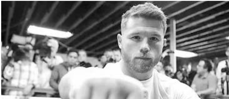
Álvarez, venció el pasado cuatro de mayo a Jaime Munguía.