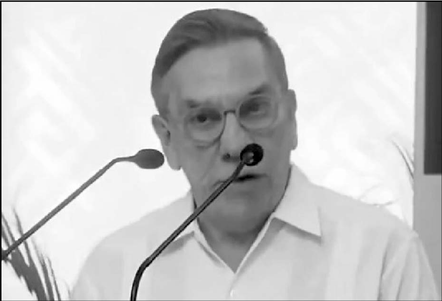
El ministro Javier Laynez Potisek aseguró que no existe un abuso de la Suprema Corte de Justicia de la Nación.

nado el asesinato de seis de los 43 estudiantes de la Escuela Normal Rural, Raúl Isidro Burgos.