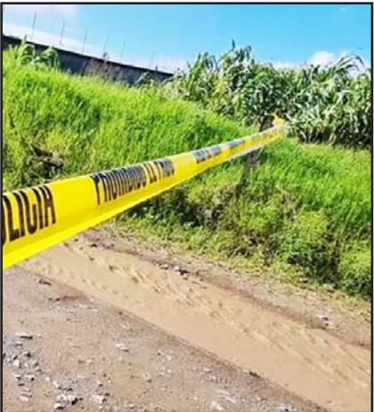
Ocurrió en Aramberri.