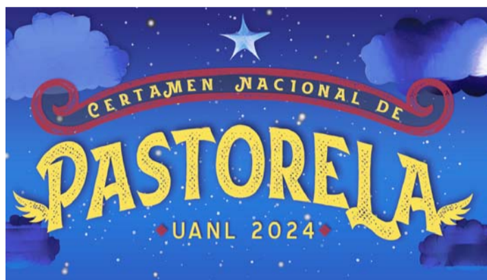
En 2023 se recibieron 14 obras.

Podrán enviarse los trabajos a través de un formulario de inscripción, donde se señalará nombre completo, domicilio,