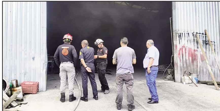
Fue en la colonia Nueva Madero.

Tras 30 minutos de luchar contra el fuego, los bomberos y brigadistas de Protección Civil lograron controlar y apagar las llamas.