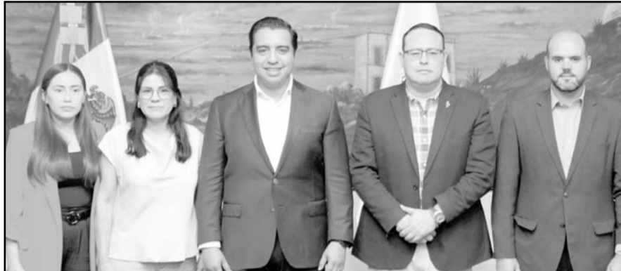
Los trabajos inician el 5 de agosto.

La finalidad y objetivo de la mesa de transición es conocer el estado actual que guardan las cuentas del Ayuntamiento saliente, sus programas y ejecución, así como el estatus de obras públicas, indicadores de gestión, conforme lo establecido en la Ley General Municipal para el Estado de Nuevo León.(AME)