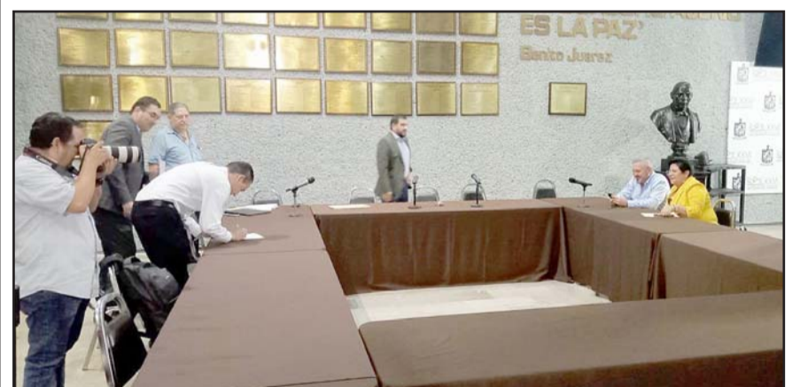
No se puso fecha para una nueva sesión.