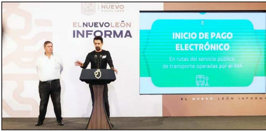
Son rutas que ofrecen servicio en Apodaca, Ciénega de Flores y Zuazua, entre otros.