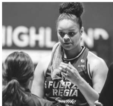
Hoy se juega el tercero.

Fuerza Regia Femenil buscará venir de atrás e igualar la serie contra las Adelitas de Chihuahua, en lo que será el juego tres de estas finales de la Liga Nacional de Baloncesto Profesional de México.