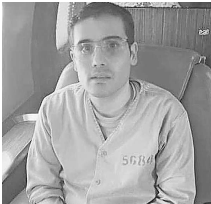
Autoridades de Estados Unidos informaron al gobierno de México que Ovidio Guzmán López, hijo de Joaquín "El Chapo" Guzmán, sigue detenido

"Sí, sí la solicitamos y solamente nos dijeron que estaba en manos, que seguía en manos de las autoridades estadounidenses; pero sí, que no estaba en ese lugar, en el penal en donde había estado originalmente", dijo.