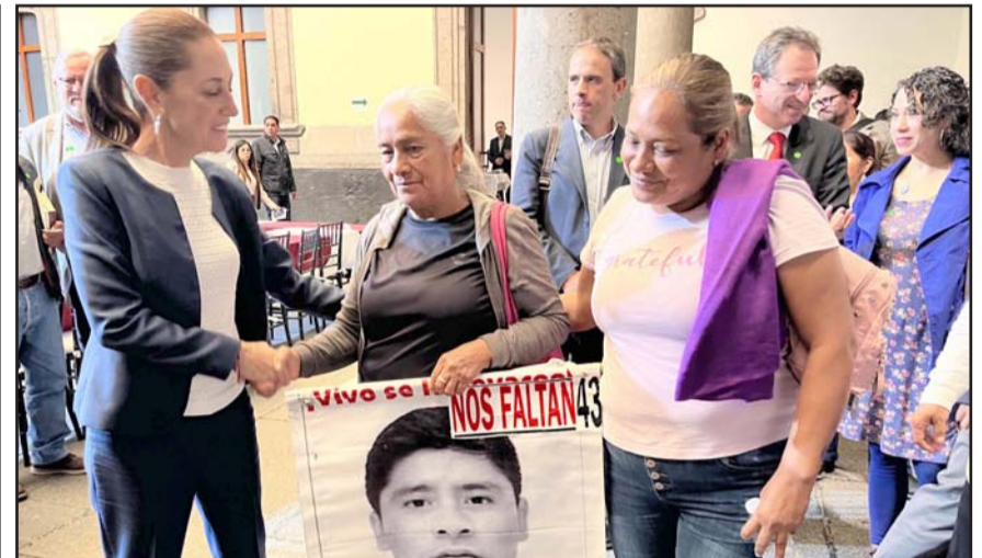
La virtual presidenta electa, aseguró que buscará la verdad y se hará justicia del caso de los desaparecidos.

"No, todavía falta mucho. Falta (información), por ejemplo, saber de dónde salieron, porque originalmente mandaron de migración de México, eso no es de Estados Unidos, lo del plan de vuelo de Hermosillo de una avioneta a Nuevo México, pero luego se menciona que no salieron de ahí, y no se tiene información confiable", dijo el Mandatario federal.