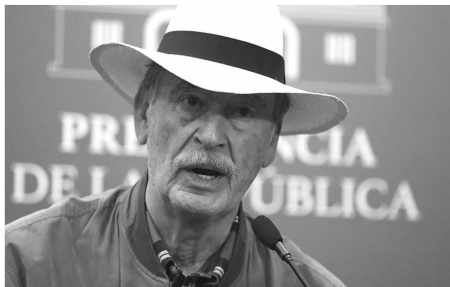
Fox respaldó al candidato opositor.

La obtención el apoyo de la ciudadanía y la precampaña será del 27 al 29 de julio; la solicitud de registro de candidaturas entre el 3 y 4 de agosto; la aprobación del registro de candidaturas, entre el 10 y el 12 de agosto; las campañas electorales, del 13 al 21 de agosto (una duración de tan sólo nueve días); la jornada electoral, el 25 de agosto, y los cómputos municipales a partir del 27 de agosto.