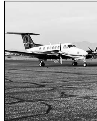
El líder del Cártel de Sinaloa, fue capturado después de ser traicionado por Joaquín Guzmán López.