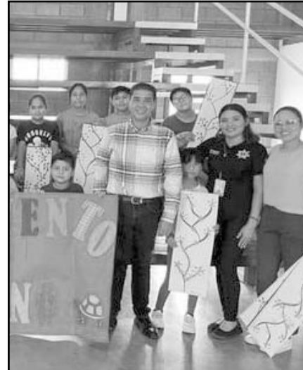
Los talleres se impartieron en Seguridad Pública y Protección Civil.

El alcalde de Juárez Francisco Treviño Cantú, encabezó la clausura de los cursos que impartieron a un grupo de niños de Seguridad Pública y de Protección Civil en la colonia Vistas del Río. El evento se realizó en las instalaciones y en el exterior del Centro Polivalente de esta colonia, donde los niños aprendieron sobre cómo actuar en las diferentes situaciones de riesgo que se pudieran presentar en el hogar, escuela o en la calle. "Los niños interactuaron con los bomberos, rescatistas y paramédicos y los dejaron usar parte del equipo", expresó el Edil. Treviño Cantú agradeció a las instituciones por mostrar a los pequeños a reaccionar en situaciones atípicas, enseñanza que sin duda servirá en mucho en su vida futura.