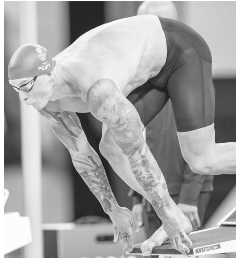
Adam Peaty se sentía mal desde el domingo.

Con esta calificación, el joven hidrocálido concluye su participación en los Juegos Olímpicos de París 2024.