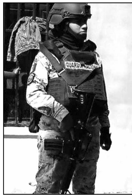
Empresas invierten más en seguridad.