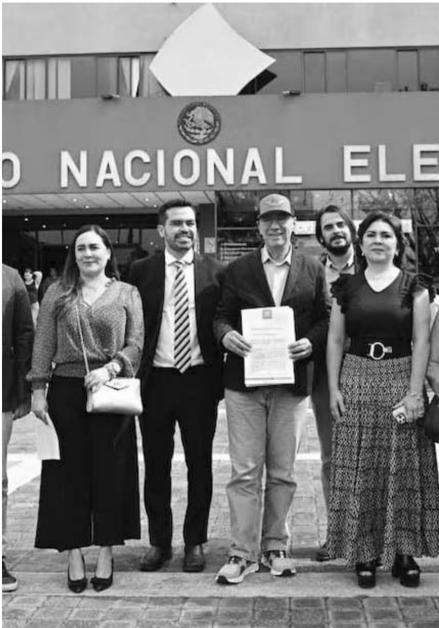
Movimiento Ciudadano pide le asignen la representación correspondiente a los seis millones de votos que consiguió en las urnas en las elecciones del 2 de julio.