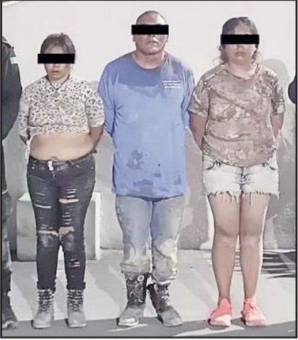
Detuvieron a cuatro delincuentes.