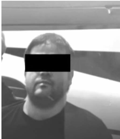
La Fiscalía General de la República ya abrió una carpeta de investigación

Rosa Icela Rodríguez precisó que la FGR abrió la carpeta federal 1882/24 en Sonora por los delitos que pudieran haber ocurrido, iniciándose acciones y diligencias ministeriales, policiales y periciales que el caso amerite: "Incluyendo el origen y destino en la aeronave en la que viajaron a Estados Unidos".