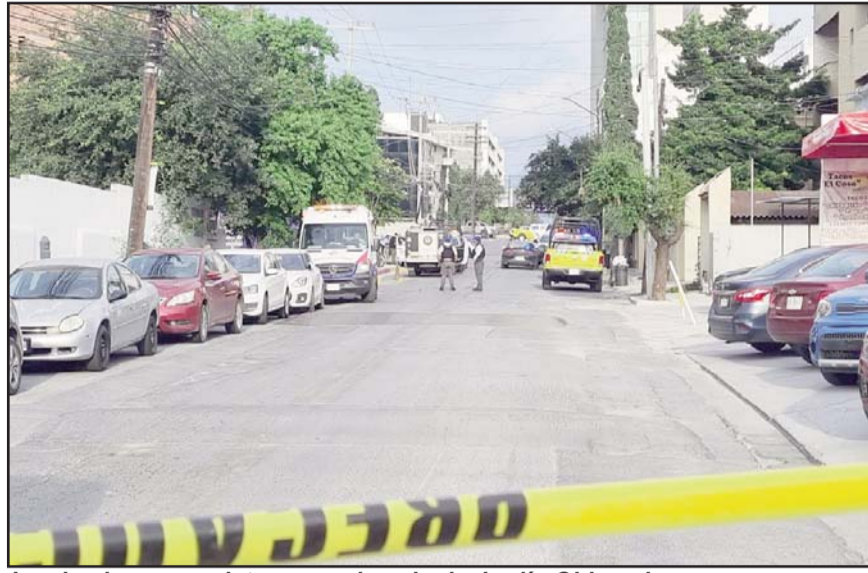
Los hechos se registraron en la colonia Jardín Obispado.

Homicidios iniciaron las indagatorias del caso, al tiempo que revisaban las cámaras de seguridad para poder obtener características del agresor que subió a un vehículo en color negro para huir.