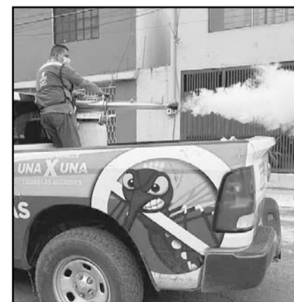
Se atienden hasta diez colonias por día.

Mientras que para el día miércoles la campaña de fumigación visitará los tres sectores de la colonia Fresnos del Lago, y Residencial San Cristóbal primer Sector.