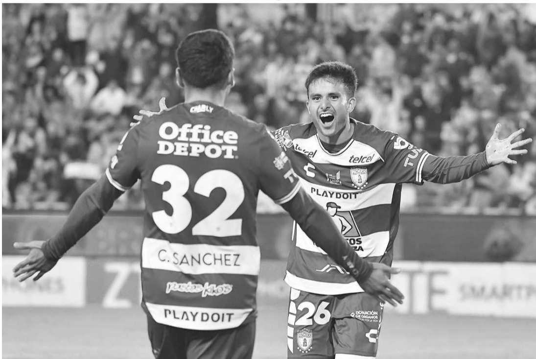
Pachuca también debuta hoy en el torneo binacional, al igual que San Luis y Necaxa.

Así que, cuatro equipos mexicanos buscarán hoy equilibrar un poco la balanza para nuestro país, en este torneo que deja cuantiosas ganancias económicas a la Federación Mexicana de Fútbol.