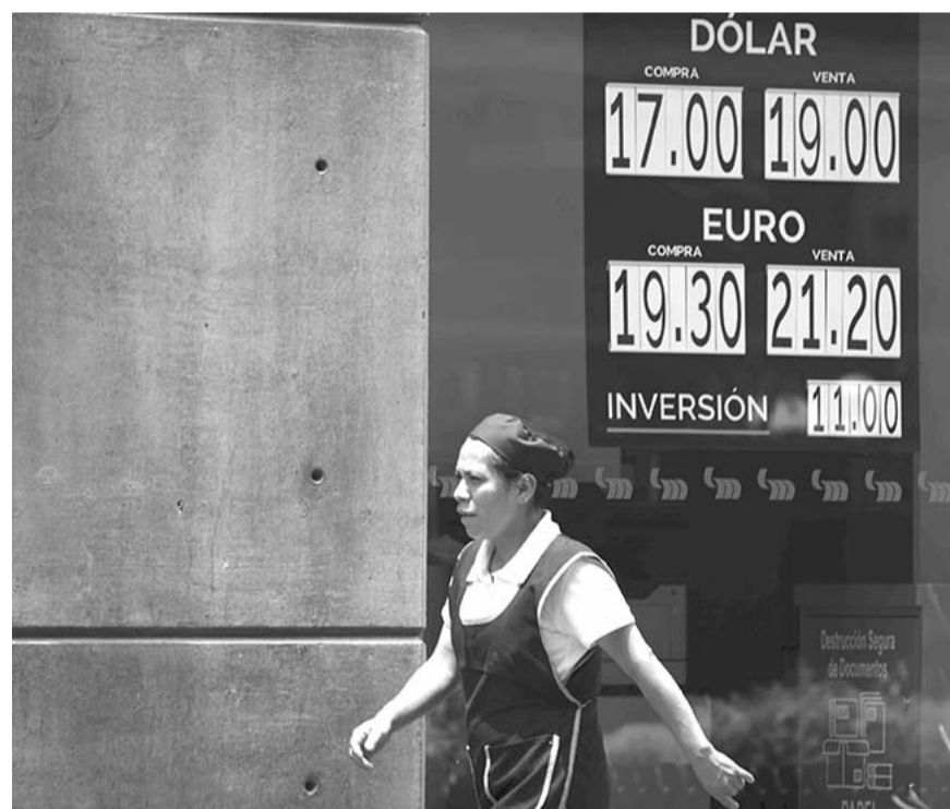
El dólar al menudeo volvió a superar las 19 unidades para cerrar en 19.10 pesos a la venta en las ventanillas de los bancos.

que seguiría fortaleciendo al yen y ocasionar mayores depreciaciones del peso mexicano, al perder atractivo las operaciones financieras que realizaban los inversionistas entre ambas monedas. Asimismo, el miércoles se dará el anuncio de política monetaria de la Reserva Federal (Fed) estadounidense, sobre el cual se espera que se mantenga sin cambios la tasa de interés, pero el mercado estará atento a los comentarios de Jerome Powell, presidente de la institución. Por ahora el mercado está descontando la primera baja a la tasa de interés de 25 puntos base para el 18 de septiembre, para un total de dos recortes antes de que acabe el año. En la canasta amplia de principales cruces, las divisas más depreciadas el lunes fueron el shekel israelí, con -1.80%; el peso mexicano, -1.08%, y el peso colombiano, con -1.03%. Por su parte, las divisas más apreciadas fueron el real brasileño, con 0.58%; el ringgit de Malasia, con 0.46%, y la corona noruega, con 0.19%.