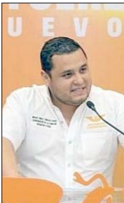
Piden también que los demandados no vuelvan a contender.

una nueva elección, los candidatos demandados no participen en las elecciones extraordinarias que resulten de dicha nulidad.