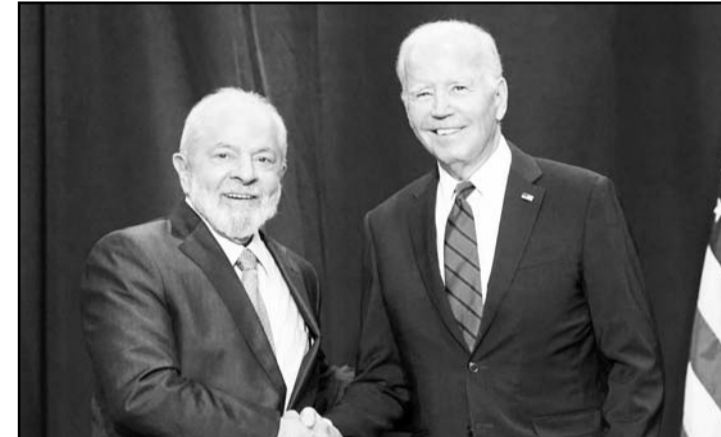
Estados Unidos ha expresado serias dudas sobre la legitimidad de los resultados presidenciales en el país latino.

liderada por González Urrutia y respaldada por María Corina Machado, también ha cuestionado la validez de los resultados.