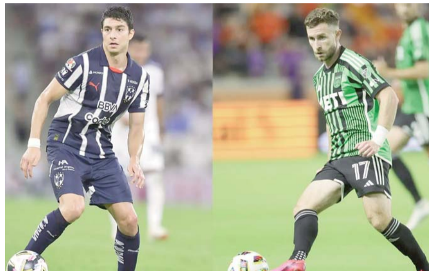
Monterrey debuta esta noche en la Leagues Cup.

Esteban Andrada; Stefan Medina, Víctor Guzmán, Héctor Moreno, Sebastián Vegas; Jorge Rodríguez, Sergio Canales; Maxi Meza, Jesús Manuel Corona, Germán Berterame y Brandon Vázquez tal vez sea el equipo que hoy inicie en Rayados de Monterrey.