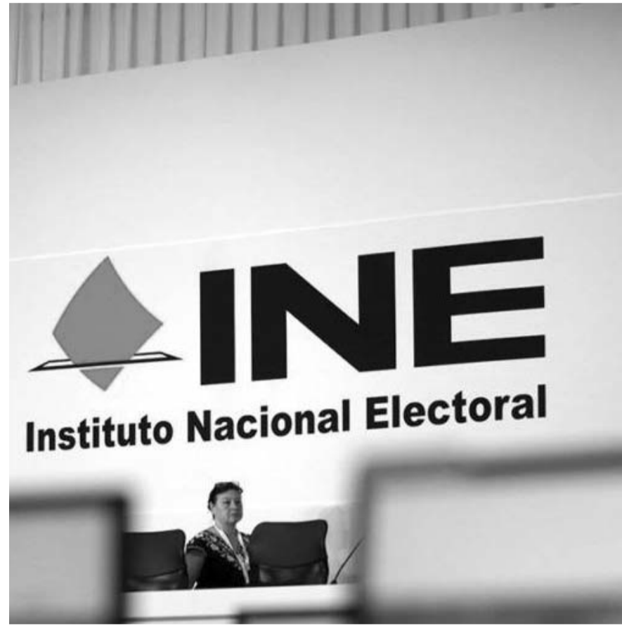
El INEC estará conformado por siete integrantes, a diferencia de las 11 consejerías del INE.

Para la Sala Superior del TEPJF se elegirán siete magistrados por un lapso de seis años improrrogables, en contraste con los nueve los actuales, y serán electos el primer domingo de junio, excepto la primera jornada electoral.