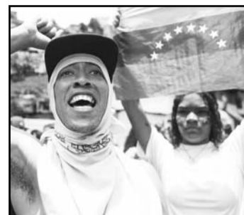
"Por el futuro de nuestros hijos, queremos libertad, ¡vete Maduro!", expresaban los manifestantes.