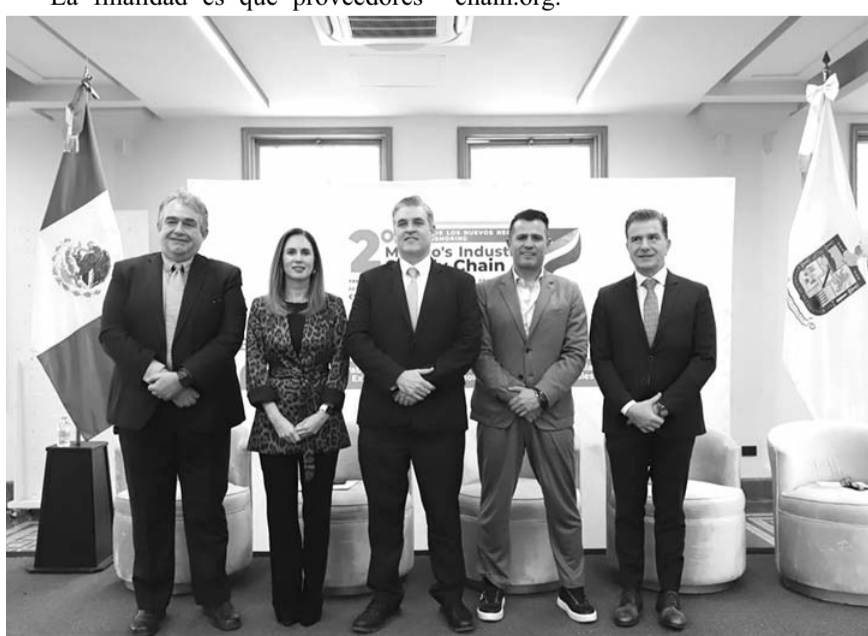
El nearshoring, sumados a las consecuencias de la nueva imposición de Estados Unidos de aranceles a más de 500 productos, han acelerado la búsqueda de proveedores en México por grandes empresas compradoras.

nacionales tengan la oportunidad de diversificar su mercado, y que los grandes compradores localicen empresas que actualmente ofrecen sus productos y servicios a otros sectores industriales. Por último, cabe mencionar que, en el Mexico's Industry Supply Chain habrá 50 conferencias con expertos en desarrollo económico, sustentabilidad, ciencia y tecnología. Para mayor información, ingrese al sitio mexicosupply-chain.org.