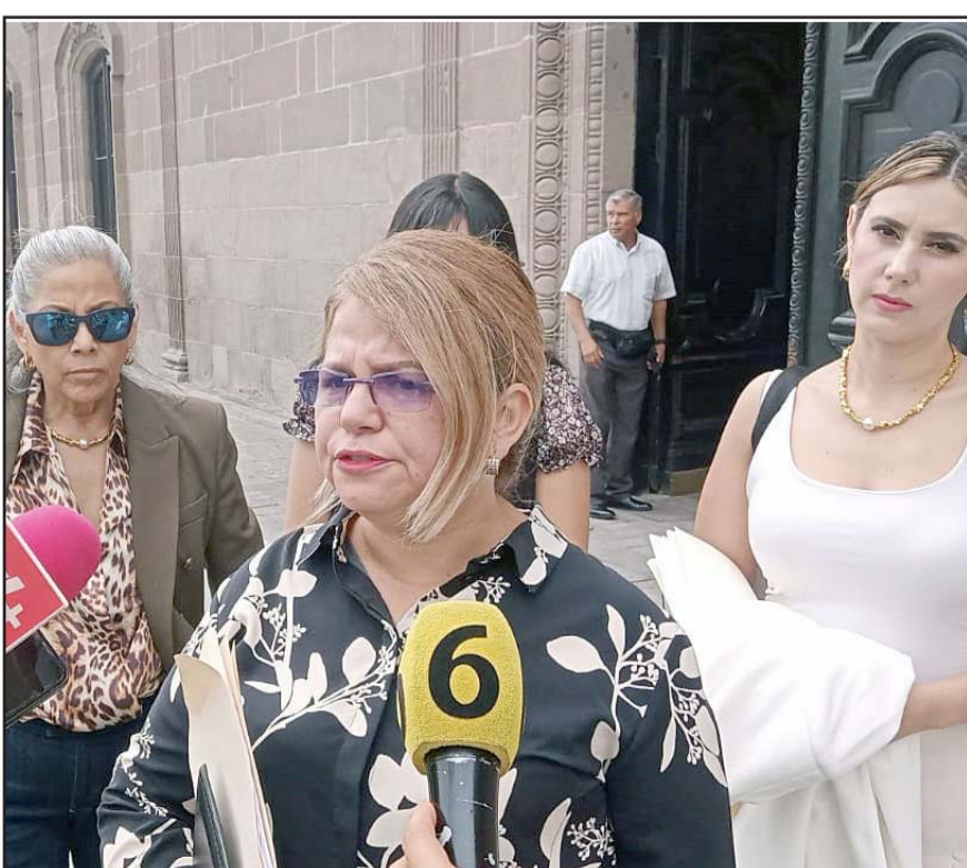
Se busca una titular que dé resultados en los temas que impactan a la mujer.