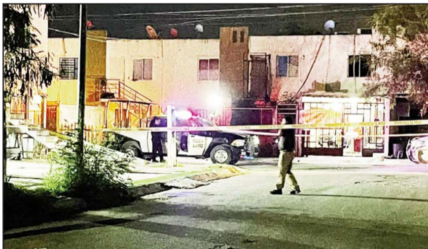
El ataque ocurrió en el municipio de Juárez.

La muerte violenta ocurrió a las 21:40 horas sobre la Avenida Juan Pablo II y Fortín de las Flores, en la