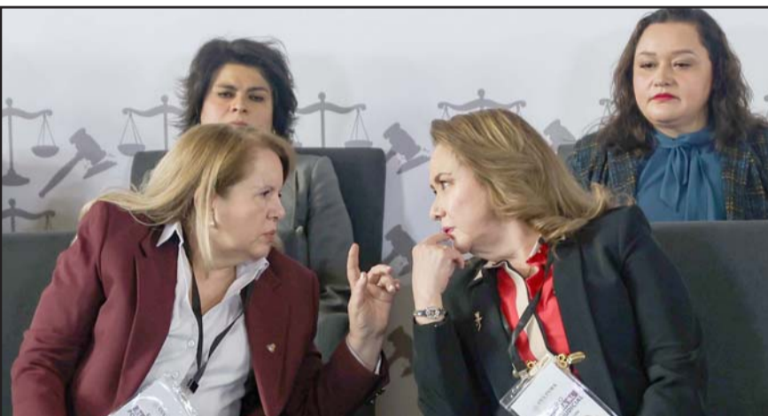
La ministra Yasmin Esquivel enfatizó que la reforma requiere un interlocutor con conocimientos suficientes para garantizar una adecuada comunicación.

Minutos después, publicó en redes sociales que se comprometió a 'poner toda su voluntad para dar seguimiento a la búsqueda y seguir con las reuniones'.