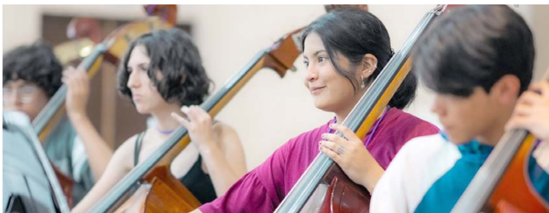
Participarán 137 intérpretes, en una gira que comprende cinco estados.

Cabe mencionar, que las y los instructores de estos talleres, se prepararon en el Curso de Primeros Auxilios Pediátricos, a fin de responder de forma inmediata ante cualquier percance.