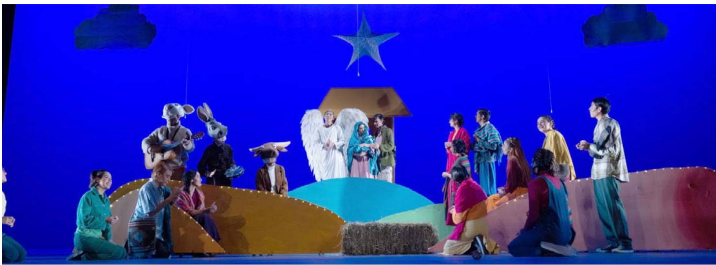
El concurso tiene el propósito de fomentar el folklor mexicano y continuar con el rescate de las tradiciones.

Esta visita constituye una ocasión excepcional para los fieles, quienes tendrán la posibilidad de venerar de cerca una pieza significativa de la historia religiosa.