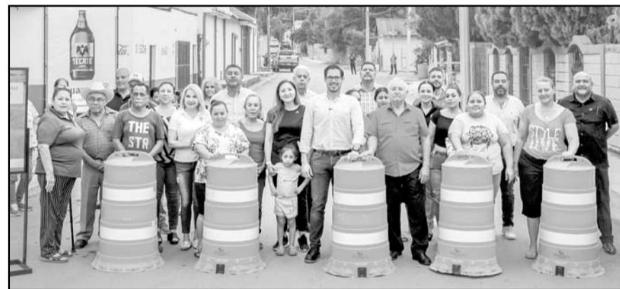
La vialidad se reforzó con concreto hidráulico.

Ante los vecinos de San José, el alcalde se comprometió a continuar con la reconstrucción de vialidades "hasta el último rincón de Santiago", y a instalar concreto hidráulico en todos los tramos necesarios para que las vías soporten las corrientes de agua generadas por las lluvias.