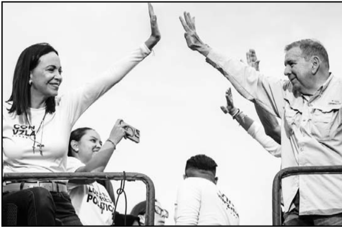
Machado convocó a los venezolanos que apoyaron a González Urrutia a reunirse en asambleas.

Estimados amigos entiendo su indignación, pero el llamado desde los sectores democráticos es de calma y firmeza, apostando siempre por la paz".