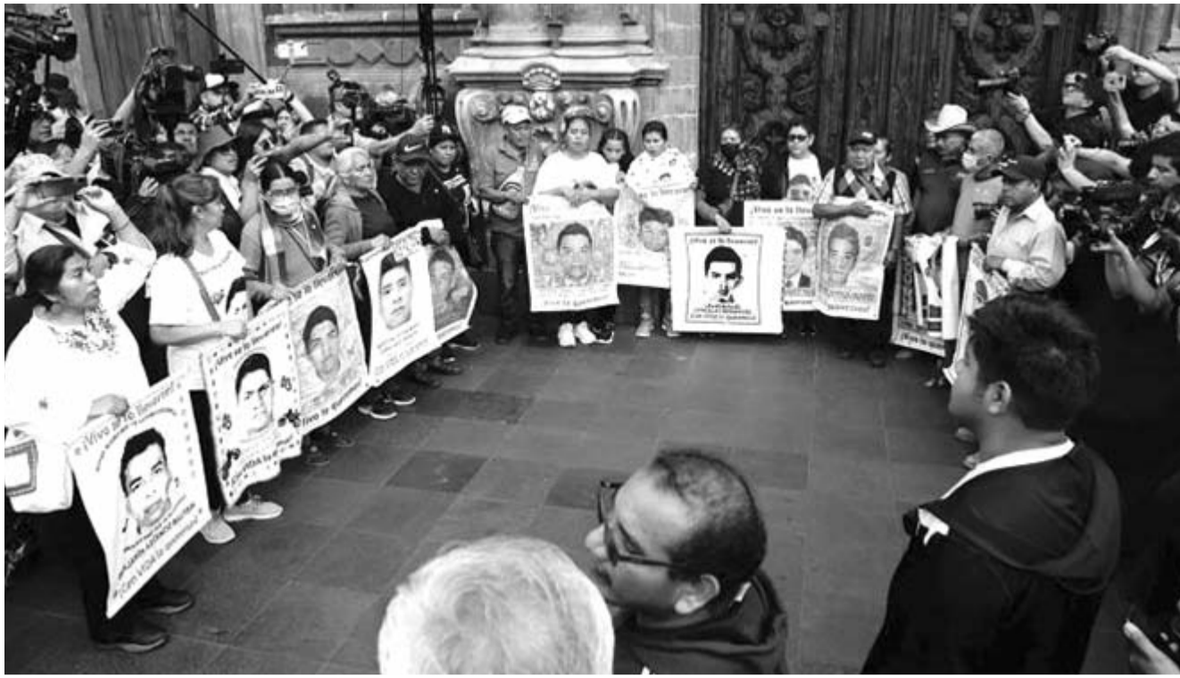
Será para el próximo 27 de agosto.

Agregó: "(...) ahorita los padres vienen en esa postura de hablar con