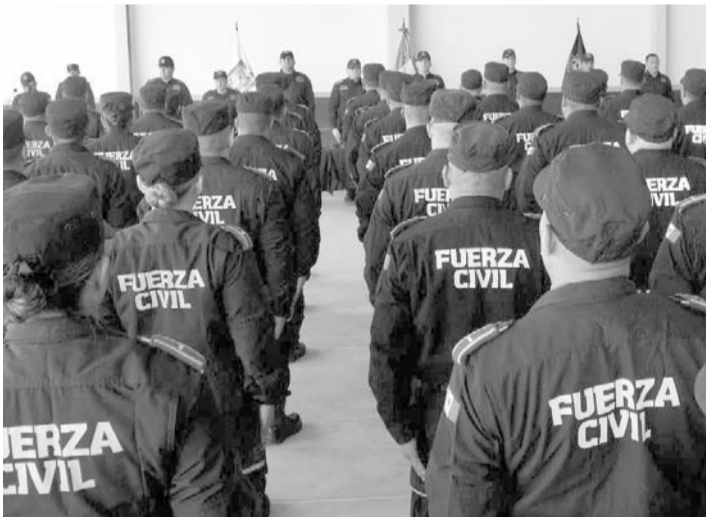
Es la única policía en el país que cuenta con una división Médica Táctica Policial.