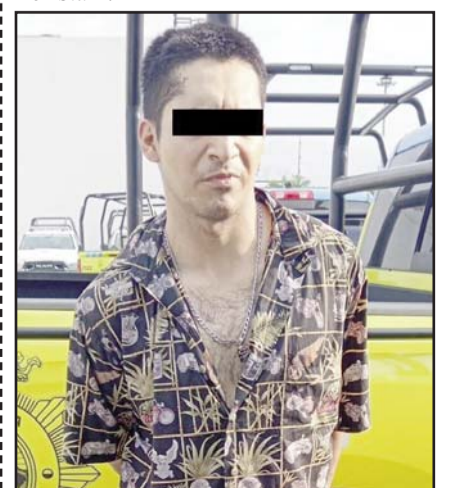
Uno de los detenidos.

En la revisión, a las dos mujeres les encontraron 16 envoltorios de hierba verde con las características a la marihuana, además de dos bolsitas con sustancia sólida de la droga tipo "cristal".