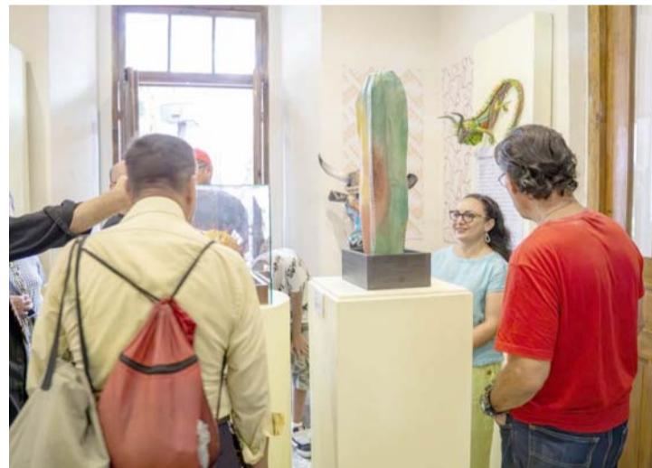
Se trata de 16 obras en cartonería, la cual se exhibe en el vestíbulo del Museo Estatal de Culturas Populares.

Este espacio expositivo está ubicado en el vestíbulo del Museo Estatal de Culturas Populares de Nuevo León y tiene el objetivo de impulsar y