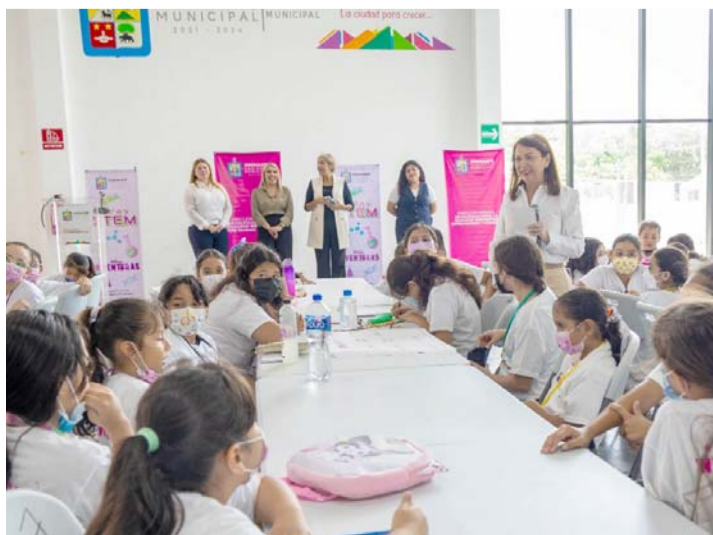
Adquieren conocimientos sobre sostenibilidad y primeros auxilios.

La gira contempla Guanajuato, Aguascalientes, Michoacán, Estado de México, y Ciudad de México para la clausura.