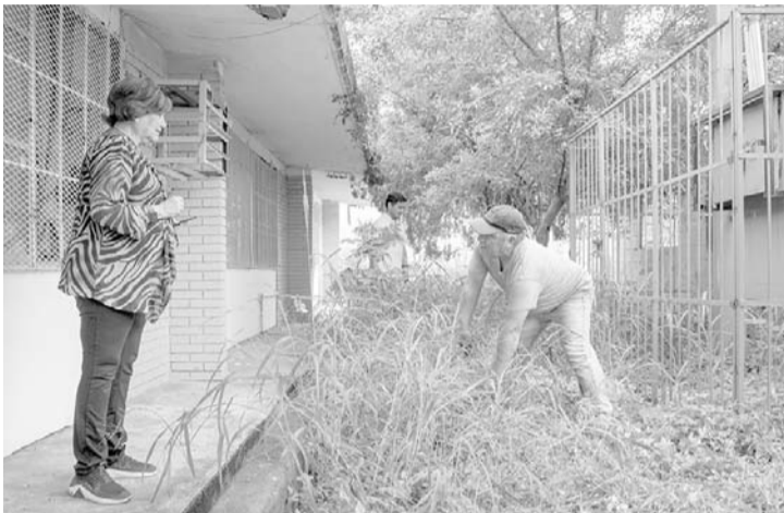
Se trabajará en coordinación con municipios y empresas.