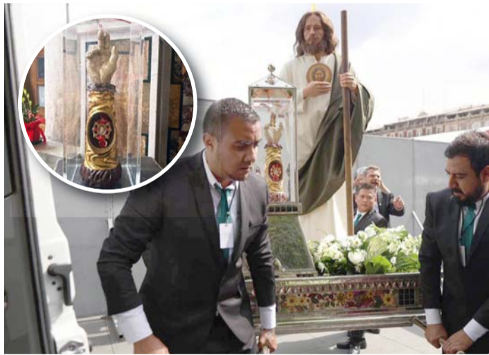
La primera escala fue la Catedral Metropolitana en CDMX.

Las reliquias de San Judas Tadeo han salido de Roma para arribar a la Ciudad de México (CDMX), ofreciendo a los fieles la oportunidad de contem-