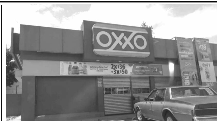
La semana pasada Oxxo y Oxxo gas dijeron que cerraron por "actos de violencia" que se registraron en Nuevo Laredo.