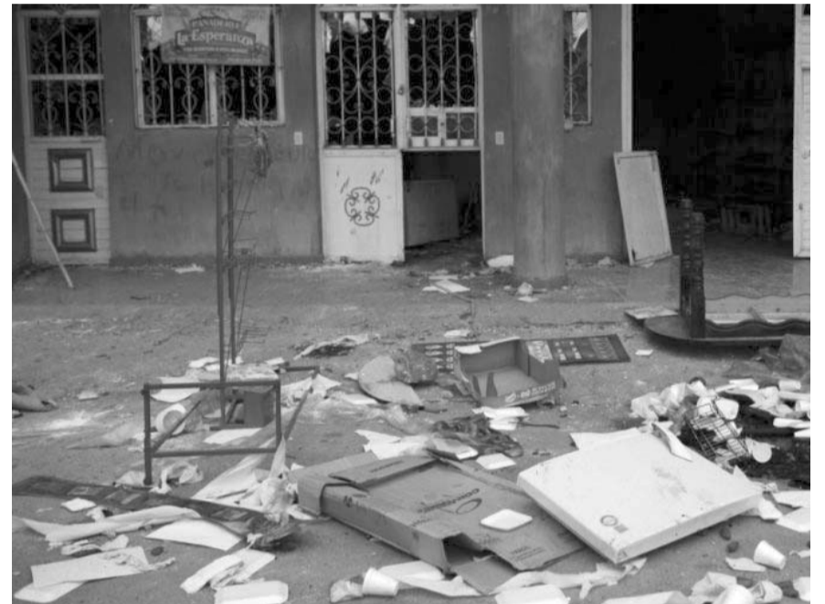
La comisión expuso que ya se llevó a cabo la instalación de los consejos municipales.