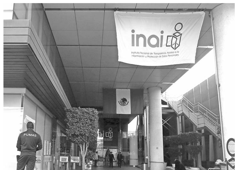
IMSS y Pemex encabezan la lista de quejas.

"Cada recurso de revisión que ingresa es turnado al equipo de una persona comisionada del Inai que se encargará de analizar el caso y hacer una propuesta de resolución que es votada en una sesión pública por el pleno, el máximo órgano de decisión del instituto", concluyó.