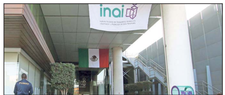
El proyecto sostiene que se busca racionalizar los recursos públicos, así como promover la austeridad y la no duplicidad de funciones.

También se explica que desde su creación y hasta 2024 se ha asignado a los organismos que se pretende extinguir la