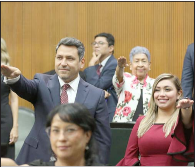
A tres días de haber iniciado labores la nueva legislatura empieza a tocarse el tema entre pasillos del Congreso.

"El Gobierno del Estado precisó que la importancia de lograr nuevos acuerdos a nivel estatal, se debe a que 2025 es un año atípico, porque al ser el inicio de un mandato presidencial, el Paquete Fiscal Federal se presentará el 15 de noviembre y, por lo tanto, aún existe la posibilidad de buscar integrar proyectos que beneficien al Estado", menciona el escrito.