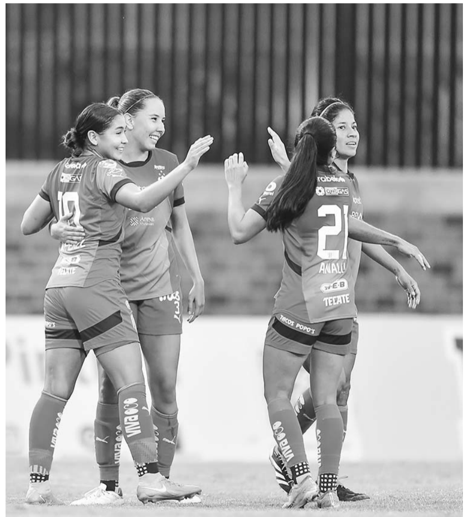
Monterrey ya tiene 21 puntos.