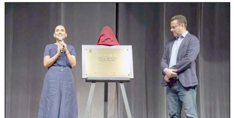
El Festival de Teatro Nuevo León 2024 deleitó con su programación a más de 5 mil 500 personas.