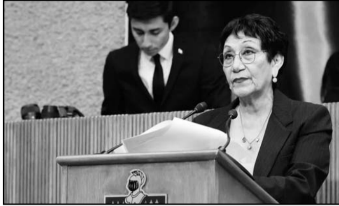
La legisladora presentó el acta constitutiva.

Lo anterior, con base en el Artículo 44 de la Ley Orgánica del Poder Legislativo del Estado, el cual estipula que en los casos donde un Partido Político sea representado por