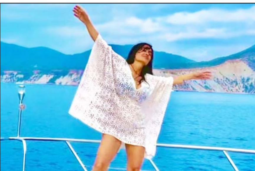
En las imágenes, la actriz mexicana aparece a bordo de un yate, luciendo un colorido traje de baño.