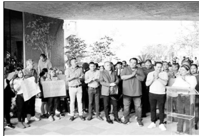
Se manifestaron con pancartas en mano.

a nivel Federal, una vez que llegue a NL haya visibilidad para todos los ciudadanos, se debata y se analice para que en su momento sean los Diputados quienes lo voten con la convicción y con el conocimiento”.