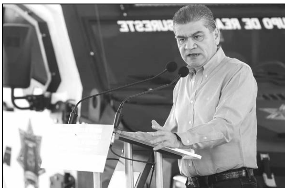
Riquelme Solís fue hospitalizado para ser sometido a un proceso médico que no pone en riesgo su salud.

La bancada tricolor informó que el exgobernador se mantendrá hospitalizado a la espera de que terminen los diferentes estudios médicos que se le practican, para dar certeza a su estado de salud y continuar con sus actividades en la nueva encomienda que tiene en el Senado de la República como integrante de la LXVI Legislatura Federal.