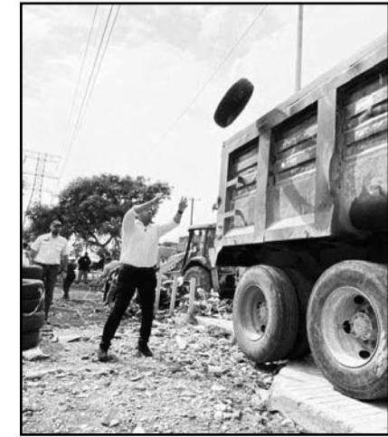
El alcalde colaboró directamente.

colonia Rincón de las Mitras se retiró material arrastrado por las corrientes de agua provenientes de las faldas del Cerro de las Mitras. Dicho ello el Alcalde de Santa Catarina mencionó que dicho sector es de recurrentes encharcamientos en periodos de lluvia, de ahí que se realicen estas labores de limpieza por parte del Municipio. (AME)