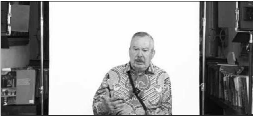
Mediante un video que publicó en sus redes dio a conocer sus prioridades.