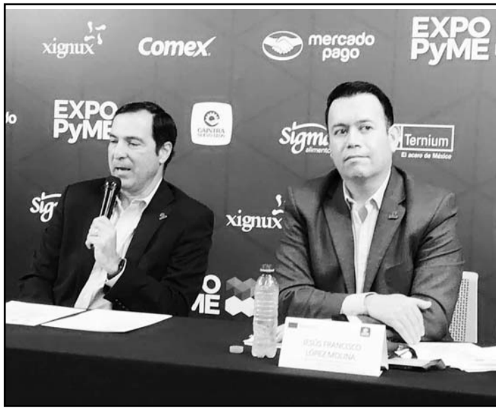
Mencionaron que deben resolver el caso de la Fiscalía.