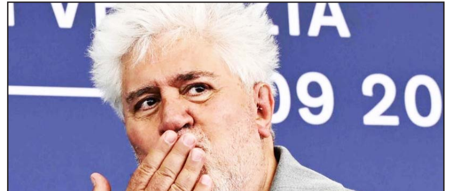
El director español cerró su discurso con un severo, "¡estamos en peligro!", al que toda la sala respondió con aplausos.

"Los Tigres aún abren camino, pero hay que decirlo, no hemos visto conciertos de esos cantantes en Colombia, China, Italia, Inglaterra... solo a Maná, Café Tacvba, Caifanes, Nodal y Pepe Aguilar. Cuando lo hagan, entonces se podrá decir que sí están abriendo brecha".