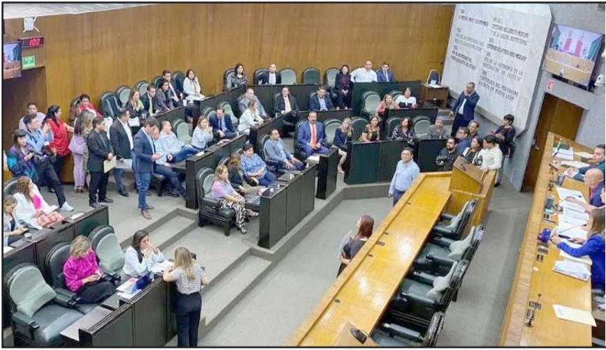
La sesión se suspendió ante la falta de acuerdos por el tema de la mesa directiva.