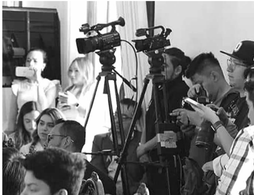
Del total de agresiones contra periodistas, 41% ocurrieron antes del día de la jornada electoral; 39% el mismo día de la votación.

Las entidades con mayor número de agresiones son Guanajuato, Sinaloa y Puebla; Zacatecas y Chiapas mostraron ausencia de denuncias, lo que podría