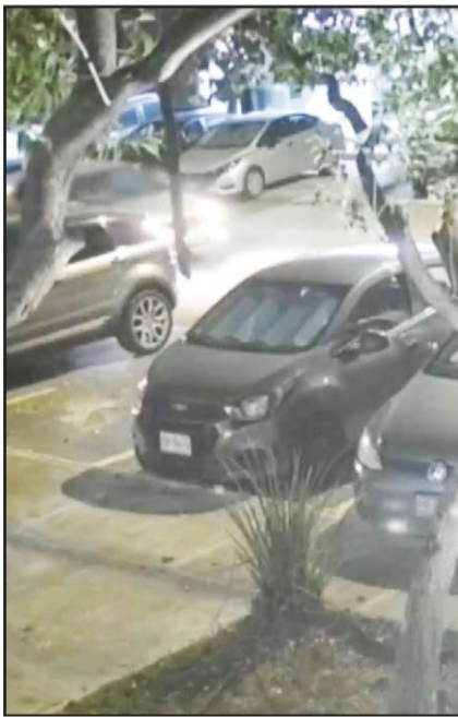
Ya investigan los videos.

Los hechos ocasionaron la movilización de los puestos de socorro, pero afortunadamente no se reportaron personas lesionadas.