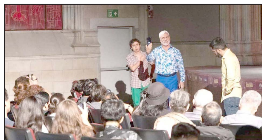
Del 1 al 30 de septiembre se realizarán presentaciones de teatro, poesía, danza y conciertos musicales