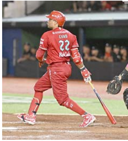
Sultanes y Diablos se enfrentan en la final de la Liga Mexicana.