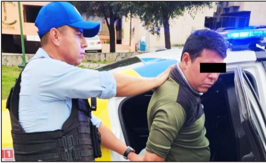
Fue detenido en la colonia Colinas de San Jerónimo.

Algunas de las unidades se encuentran desvalijadas o ponchadas, ya que presuntamente tiene más de un mes d