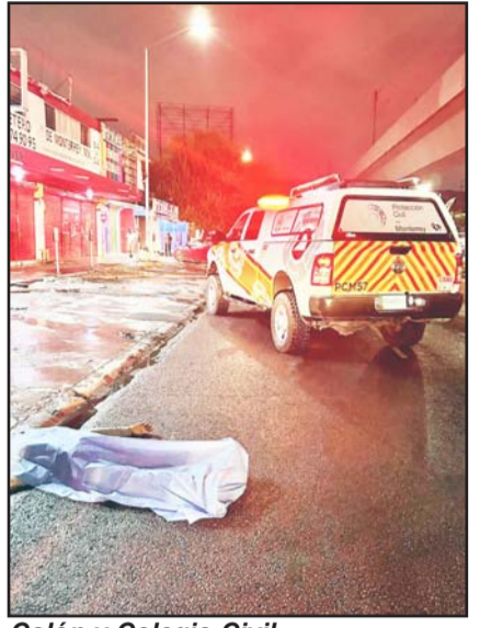
Colón y Colegio Civil.

De acuerdo con información recabada en el lugar de los hechos, el conductor de la pesada unidad de doble caja intentó ganarle el paso a la mole de