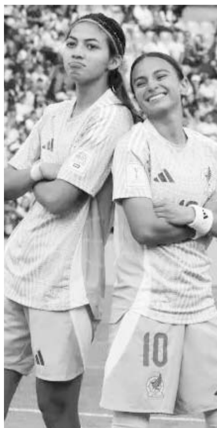
México se mide a Australia.

De vencer a las australianas, el conjunto mexicano llegaría a cuatro unidades y llegarían al último partido de la fase de grupos ya sea de líderes o con la oportunidad de ello, motivo por el cual su partido de este día será trascendental y habrá que ver si lo aprovechan para acercarse a una futura calificación, aunque también existe la posibilidad de que hoy tengan un resultado inesperado y se compliquen la misma.