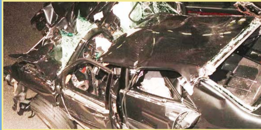
Xavier Gourmelon recuerda haber consolado brevemente a la princesa de Gales antes de realizar las maniobras para liberarla del automóvil.

Este momento se quedó grabado en la memoria de Gourmelon, que también recuerda que pudo consolarla brevemente antes de realizar las maniobras necesarias para liberarla del automóvil, casi completamente destruido por el impacto.