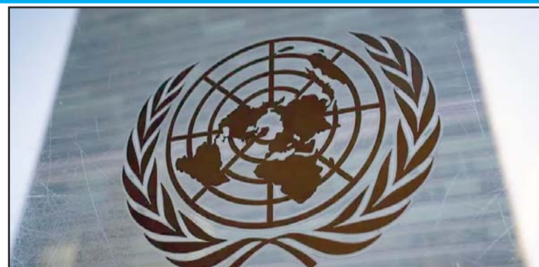
Las relatoras especiales instaron al gobierno mexicano a garantizar mecanismos efectivos para la libertad de expresión.

Gobierno a reconsiderar la decisión de eliminar el Instituto y las medidas conducentes a dicha supresión, así como a explorar mecanismos alternativos comprensivos y transversales para garantizar la transparencia, el acceso a la información y la privacidad de la ciudadanía", se lee en el comunicado.