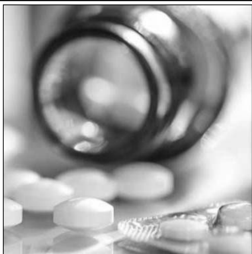
"Vamos a impulsar el tema de salud con diversos proyectos que ya se están trabajando contra la escasez de medicamentos, dar un impulso, un auge a los laboratorios, pero principalmente a los mexicanos".

Detalló que sin detener la reforma, la comisión de análisis que encabezan Leonel Godoy, Olga Sánchez Cordero y el vicecoordinador Alfonso Ramírez Cuéllar recibirán el pliego petitorio que entregarán empleados del PJF, con el objetivo de realizar posibles ajustes previo al debate en lo particular: "Hay diálogo y apertura", consideró.