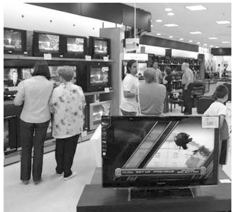
En el caso del sector comercio, la confianza empresarial registró una baja mensual de 0.3 puntos.

También el indicador de confianza empresarial de la construcción reportó un aumento mensual de 0.5 puntos en agosto, debido a que tres de sus cinco componentes