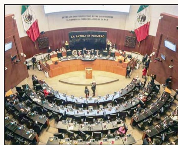
Ignacio Mier afirmó que nada impedirá la aprobación de la reforma judicial.