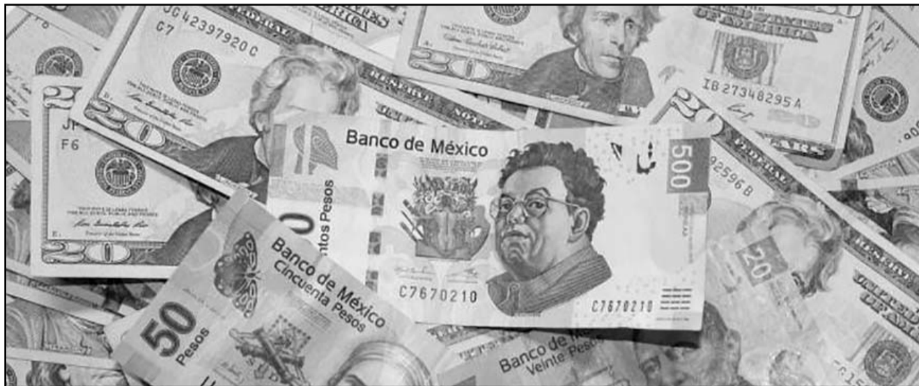
La depreciación del peso se debe al fortalecimiento del dólar, así como a la aversión al riesgo sobre México.

pesos a la venta en las ventanillas de las sucursales de CitiBanamex, 0.54% o 11 centavos por arriba del cierre del