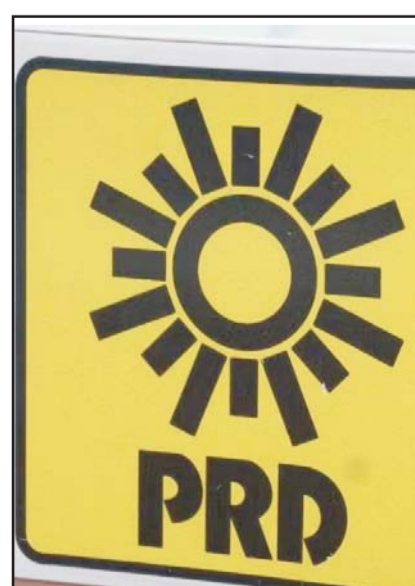
El partido tiene 72 horas para alegar su posición antes de que se formalice la pérdida del registro.

La semana pasada, el dirigente del PRD, Jesús Zambrano, señaló que la pérdida del registro era inminente, ya que el Tribunal Electoral había terminado de resolver todos los juicios relacionados a la elección federal. Sin embargo, abrió la posibilidad de constituir un nuevo partido.