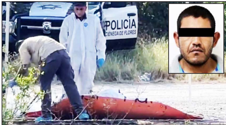
El hombre fue condenado a 50 años de prisión.