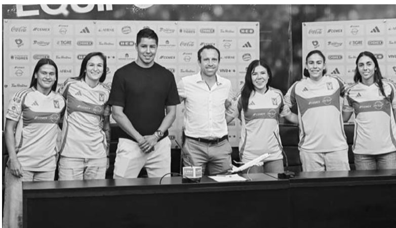
Las nuevas felinas, muy felices.