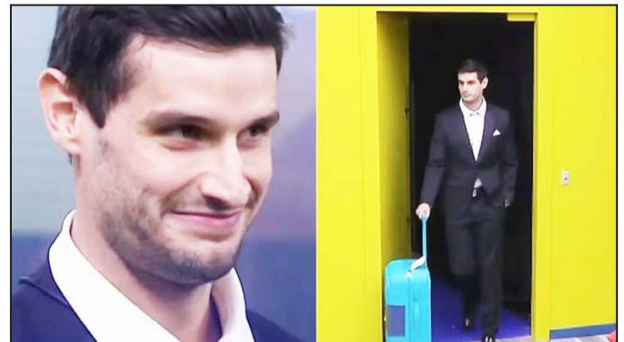
Con seis semanas de juego, el youtuber se ha convertido en el participante menos querido por el público.

En febrero del 2023, hizo fuertes declaraciones sobre las mujeres con sobrepeso, sugiriendo que no merecían ser presentadas en la portada de una revista, pues lo único que habían hecho en