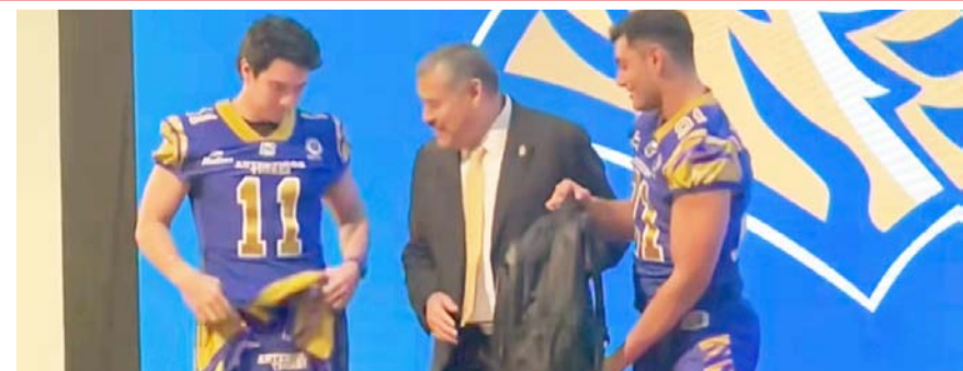
Los Auténticos Tigres inician el viernes en la Mayor de la Onefa.