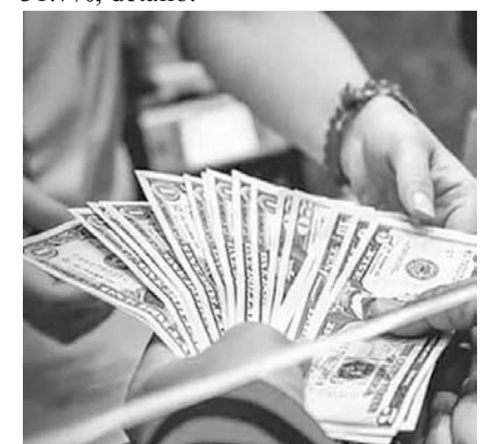
En comparación con julio de 2023 el resultado significó una caída anual de 1%.

De forma acumulada, es decir, durante los primeros siete meses de 2024, los egresos por remesas fueron de 796 millones de dólares, cifra superior a los 604 millones de dólares reportados en igual periodo de 2023, lo que significó una expansión anual de 31.7%, detalló.