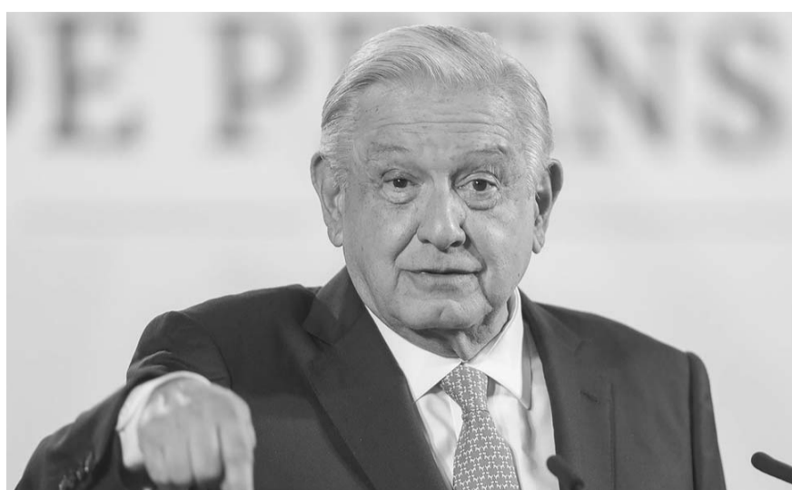
El presidente Andrés Manuel López Obrador acusó una "invasión arbitraria" al Poder Legislativo.

"Es un proceso. Y si ya está resuelto con claridad, no hace falta ninguna interpretación en la Constitución, en la Ley de Amparo y en la jurisprudencia del Poder Judicial. ¡Cómo es posible que quieran detener el proceso legislativo! Es una invasión franca, arbitraria a la facultad que tiene el Poder Legislativo, es una violación a la división y al equilibrio que debe de exi-