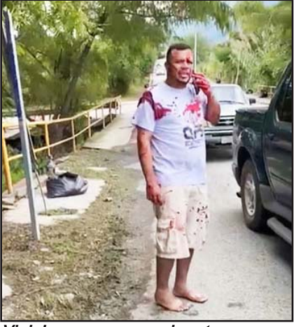
Viajaban en una camioneta.