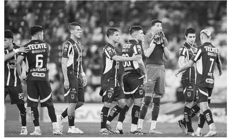
Monterrey ha tenido un mal torneo pese a sus 13 puntos.