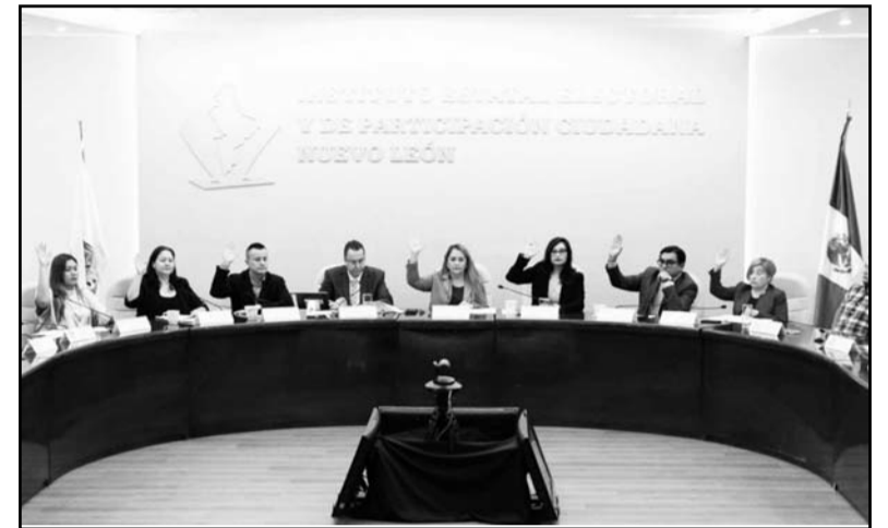
Fue aprobado en una sesión el día de ayer.

Son organismos coadyuvantes del proceso legislativo y tienden a lograr la participación de las y los diputados en todas las actividades. (JMD)