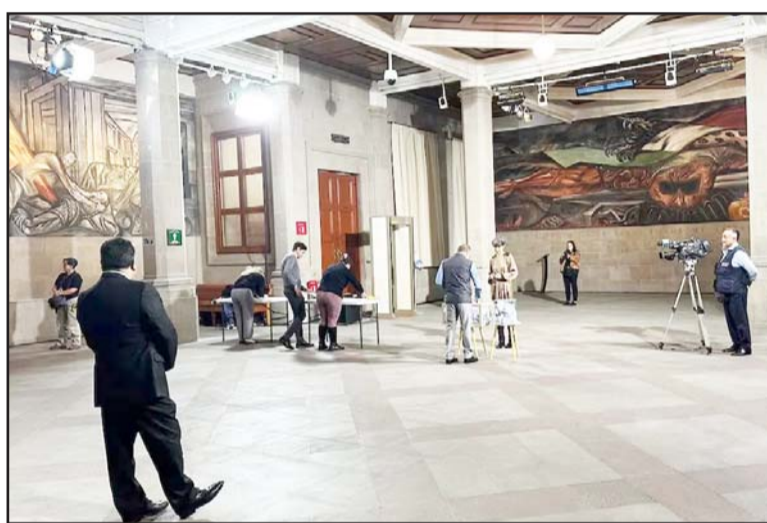
Los empleados de la Suprema Corte aprobaron la suspensión de labores con 951 votos.

El pleno de la Suprema Corte de Justicia de la Nación rechazó en una sesión privada la solicitud de la ministra Lenia Batres Guadarrama para instar al Consejo de la Judicatura Federal (CJF) a tomar medidas, así como a garantizar la función jurisdiccional