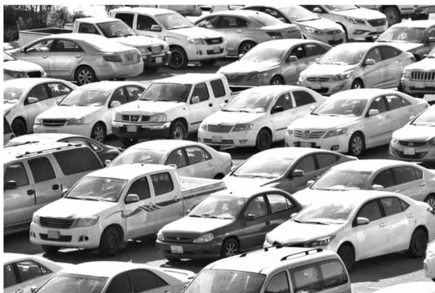
Los distribuidores de vehículos en el país manifestaron su rechazo a la reforma al Poder Judicial, ya que vulnera la independencia judicial.

Si bien el actual sistema es imperfecto y es necesario reformarlo para