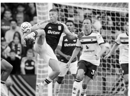
Chelsea es cuarto en el torneo inglés.