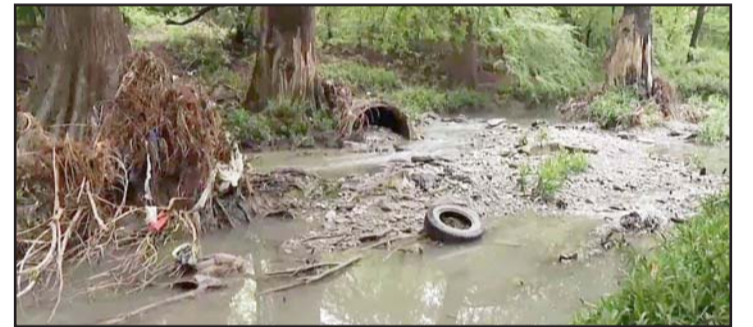
Hace ocho años fue construido en el municipio de Guadalupe.

El espacio es inseguro, ya que en el lugar es costumbre ver a indigentes embriagándose o ingiriendo alguna droga, y por si esto no fuera suficiente, el pavimento de los andadores está totalmente de-