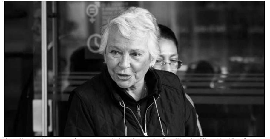
La diputada expresó sus condolencias a la familia de Ifigenia Martínez y manifestó su interés en participar en el proceso de sustitución.

Cabe destacar que una de las iniciativas es una reforma constitucional, otra corresponde a una propuesta de modificación de ley secundaria, mientras que la restante es una ley nueva que será sometida a su discusión.