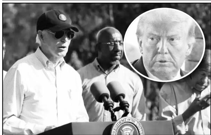
Biden aseguró que la recuperación de las zonas afectadas es una prioridad, 'sin importar cuánto tiempo tome'.

La ofensiva israelí ha causado hasta ahora 41.870 muertos, de acuerdo con cifras del Ministerio de Salud del territorio palestino, cuyos datos son considerados fiables por la ONU.