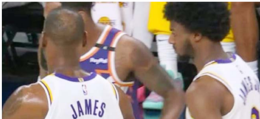
Lebron James y su hijo Bronny.

Los felinos buscarán en ese juego su cuarto triunfo sobre Rayados, cuando se enfrenten el sábado.