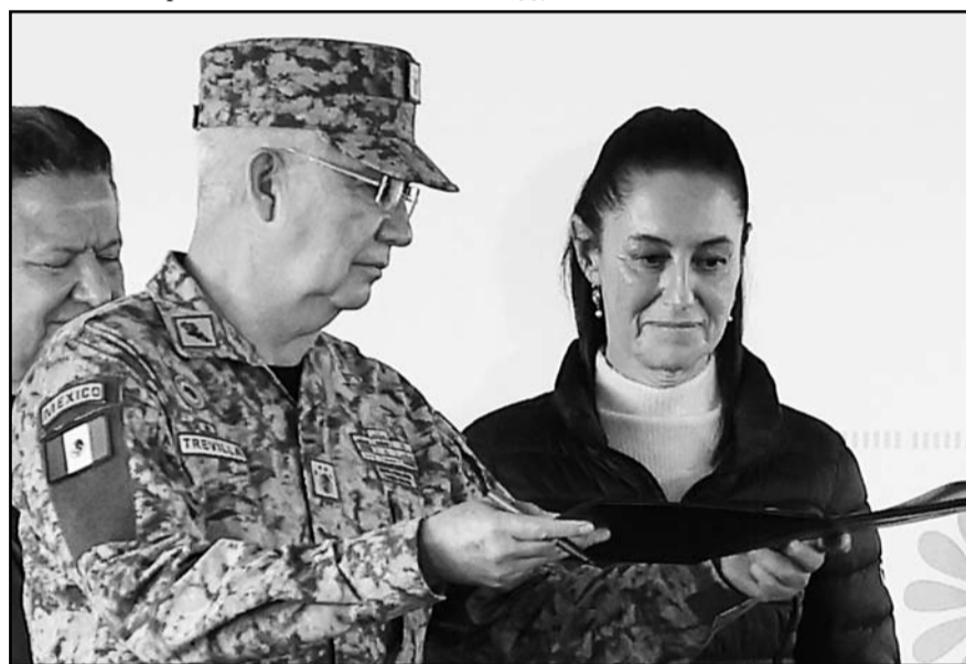
La presidenta anunció que ingenieros militares se encargarán de las obras estratégicas junto al sector privado.