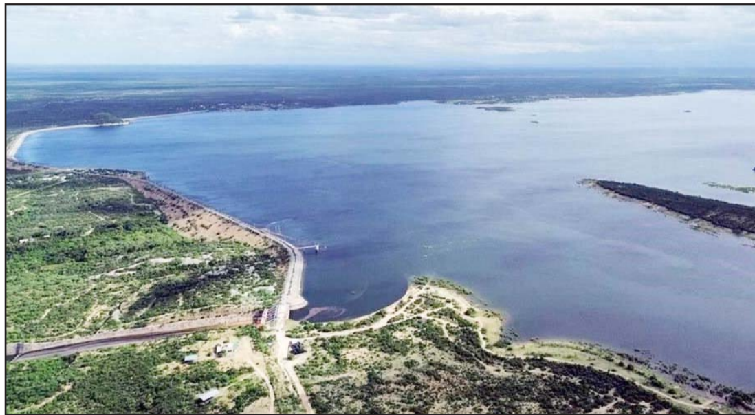
Las autoridades de Conagua, Agua y Drenaje y Protección Civil están en alerta en la presa.

“Esto nos permitirá tener ese grupo de reacción en presencia en zonas donde este más complicada la seguridad”, puntualizó el coordinador de la bancada del PAN en el Congreso local.