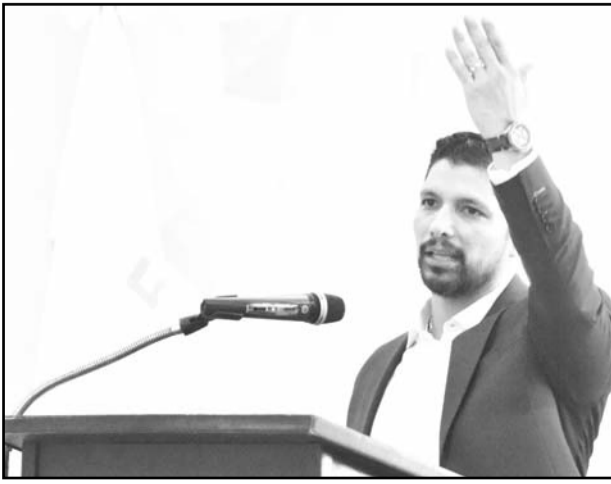
La dirigencia les rindió un homenaje.

Así mismo, el dirigente nacional pidió a la sociedad “reconocer la vocación de servicio, la capacitación permanente y el profesionalismo del magisterio mexicano.