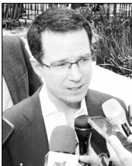
En redes sociales, el legislador panista dijo que el nuevo titular sea una persona independiente.