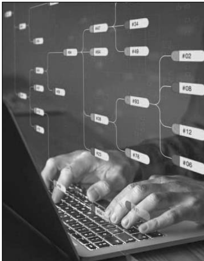
La Universidad de Harvard ofrece una serie de cursos en línea gratuitos sobre IA, disponibles para personas interesadas en profundizar en el tema desde cualquier lugar del mundo.

Acceder a los cursos gratuitos de Harvard sobre inteligencia artificial es una excelente oportunidad para formarte en uno de los campos más prometedores de la actualidad. ¡No pierdas la oportunidad de estudiar con una de las universidades más prestigiosas del mundo!