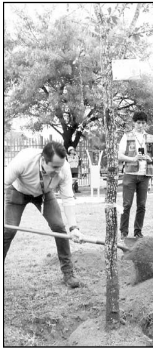
El alcalde sembró un árbol

"Arboleando San Nicolás", en esta ocasión también llegará a las colonias; Hacienda Los Morales, Fraccionamiento del Lago, Los Ángeles 3er. Sector, Nuevo Mezquital, Jardines del Mezquital, entre otras. (CLR)