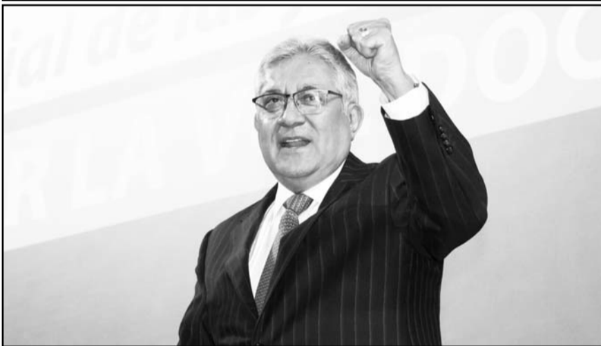
Durante el evento, el secretario general del SNTE resaltó la reciente reforma al Artículo 2 de la Constitución.