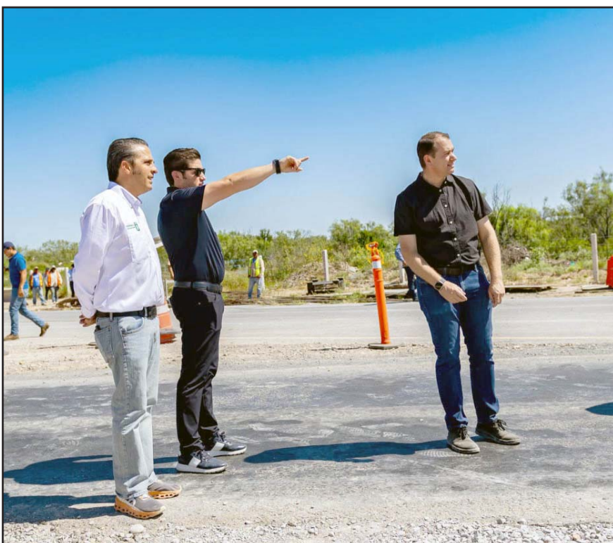
El gobernador comentó que fue un trabajo intenso para terminar rápido las obras.