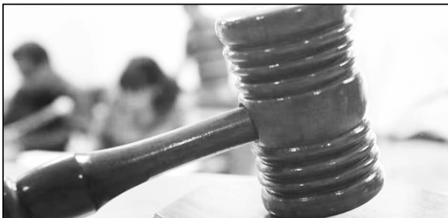
La revisión de la iniciativa es un acto trascendental, expresó Coparmex.

Al llegar al velatorio, la mandataria federal, abrazó a uno de los nietos de Ifigenia Martínez.