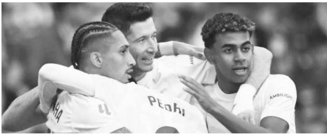
Barcelona venció al Alavés y continúan en lo más alto de España.

Los blaugranas alcanzaron las 24 unidades luego de nueve jornadas para ser líderes del futbol español, mientras que Alavés se quedó en las 10 unidades para que sean décimo segundos.