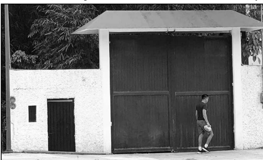
Se han instalado cámaras de videovigilancia y se ha colocado alambre de seguridad alrededor de la propiedad del expresidente.

En este sentido, la senadora priista puntualizó que su iniciativa está encaminada a poner fin al llamado huachicol presupuestario, que afecta no solo al erario, sino también a los proyectos de obras públicas.