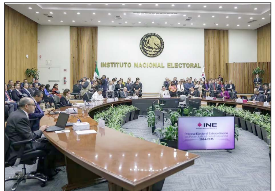
El recurso presentado por el INE contra los jueces de Distrito fue turnado al Tribunal Electoral.

La renovación llega cuando existen cinco vacantes en las salas regionales, así como dos en la Sala Superior por omisión