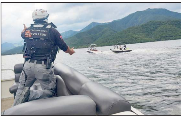
Los ocupantes de la lancha resultaron ilesos.