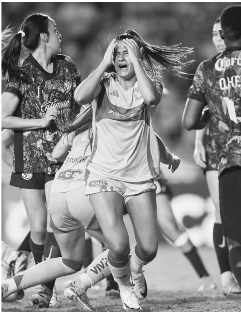
Las felinas fueron sorprendidas por las Águilas.

Si bien las felinas buscaron igualar en el marcador en el cierre del partido y tuvieron varias ocasiones para ello, al final no cayó el 1-1 y terminó el juego con una victoria de las azulcremas. (AC)