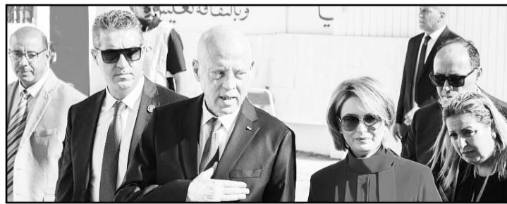
Tanto la oposición como las ONG acusan a Saied de llevar a Túnez hacia una "deriva autoritaria".

Este desinterés refleja las preocupaciones de la población, que enfrenta dificultades económicas y ha denunciado la "deriva autoritaria" del gobierno de Saied, acusación que han sido levantadas por la sociedad civil y la oposición política. A pesar de la baja participación, el presidente de la ISIE, Faruk Bouasker, calificó el 27,7% de participación como "respetable", aunque reconoció que es la cifra más