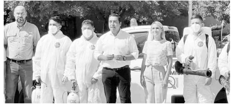
El presidente municipal, Jesús Nava anunció el nuevo programa.

"Como eso van a ser muchísimos temas y programas, están en un gran olvido las escuelas, en un gran olvido los centros comunitarios, en un gran olvido las guarderías, las vamos a arreglar todas, ya verán, yo quiero que esto esté súper flamante con el apoyo de todos ustedes y además pues sé que también cuento con su colaboración, entonces siéntense con esa confianza porque vamos a tener todo el equipo de la administración al pendiente", puntualizó. (ATT)