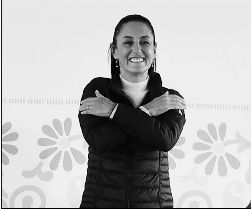
Sheinbaum hizo un llamado a la población para que permanezcan atentos a la información oficial.

Diez años después de que se adoptó la reelección consecutiva en el Poder