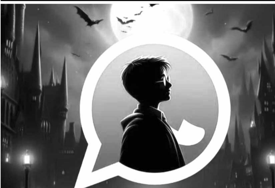
En sencillos pasos lograrás configurar la app de Meta con todo lo relacionado al colegio de Hogwarts

Además, cineastas, creadores, editores, fotógrafos, artistas y más han dejado clara su preocupación del alcance que puede llegar a tener un producto de este tipo.