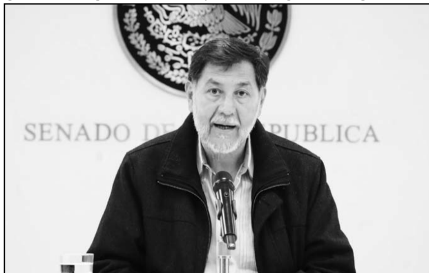
El presidente del Senado aseguró que la convocatoria avanzará sin retrasos.

Por ello, hizo un llamado al PJ para que deje de resistirse, además de recalcar que desde hace tiempo ha incumplido con sus responsabilidades constitucionales.