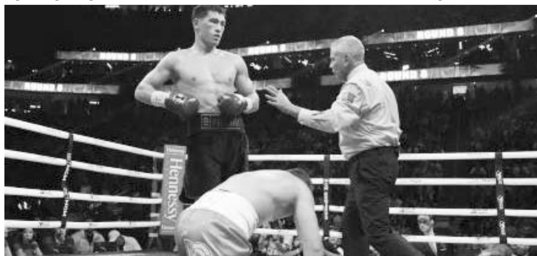
Bivol, enfrentará el próximo sábado al también ruso Arthur Beterbiev.

Ahora el tapatío está enfocado en el próximo año, donde está analizando sus posibles combates y una revancha con Bivol es una posibilidad.