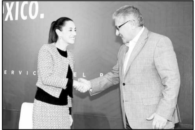
Los maestros se declararon listos para trabajar.

Y apoyan a la nueva presidenta como actor educativo, como actor social y como magisterio organizado. La asunción de la Presidenta de México motivó un compromiso público del SNTE para que los Trabajadores de la Educación continúen la ruta para otorgar servicios de calidad. A la vez que otorgaron un gran reconocimiento ante el suceso y garantizar que los agremiados mantendrán una posición propositiva en defensa de los derechos de la educación.