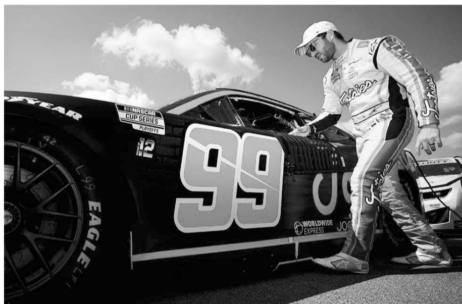
El regio llegó en el lugar 26 ayer.

El regio tendrá esa carrera dentro del Óvalo de Charlotte cuando pueda participar en ella durante el próximo domingo, iniciando todo a las 14:00 horas.