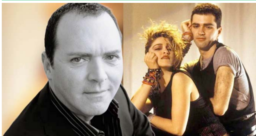
Durante un tiempo Christopher ayudó a su hermana durante sus giras.

La decisión de posponer la fecha causó molestia entre los seguidores que planeaban asistir este sábado 5 de octubre al Oktoberfest MX, sin embargo, se tomó la decisión por precaución.