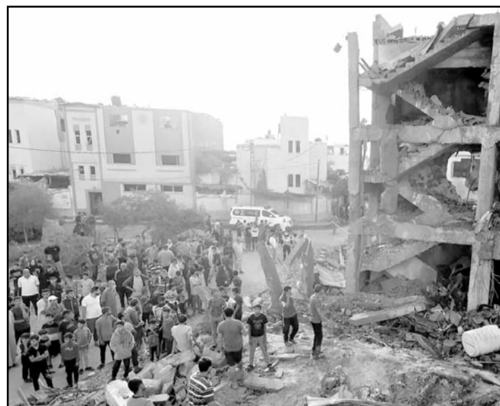
La ofensiva israelí en la Franja de Gaza ha dejado más de 41,870 muertos y desplazado a millones de personas.

El 7 de octubre de 2023, comandos de Hamás, infiltrados desde Gaza, cruzaron la barrera que separa el territorio palestino de Israel.