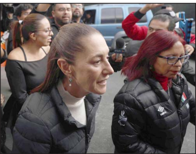
La mandataria asistió a la funeraria para despedir a quien le entregó la Banda Presidencial.

El magistrado Reyes Rodríguez Mondragón analiza esa posibilidad, aunque sin haber definido la ruta que tomará. En el caso de las dos vacantes de magistrados que sean electas, habrá una excepción para que puedan durar en el cargo ocho años, y de así toda la Sala Superior sea renovada en 2033.