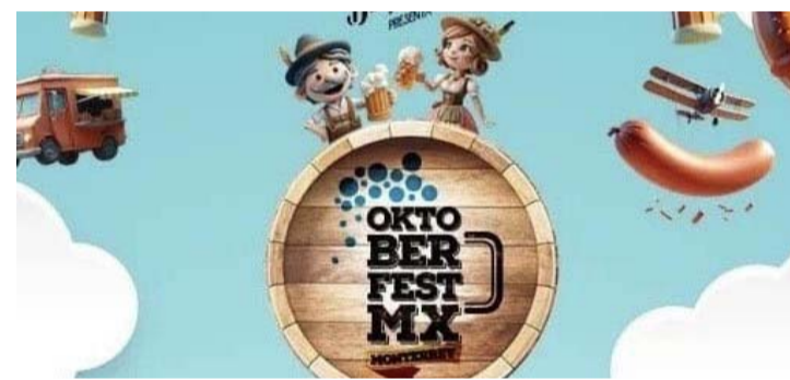
El Día 2 del Festival se realizará el próximo 2 de noviembre.