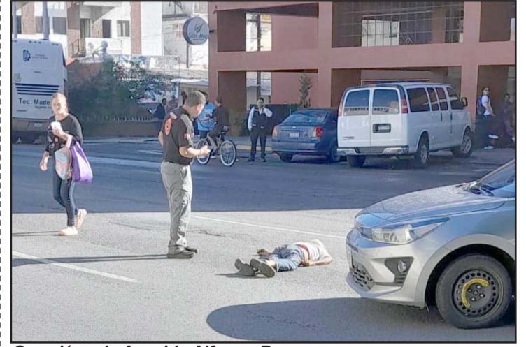
Ocurrió en la Avenida Alfonso Reyes.

"El Elefantito sin Cola" ya ha sido señalado por vecinos de su colonia, de haberles robado algunas bicicletas por las cuales ya existían denuncia ante el Ministerio Público, incluso hay videos de los ilícitos.