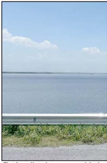
Está arriba de su capacidad.

Actualmente, este embalse se encuentra al 115.5 por ciento, porcentaje que es el segundo más