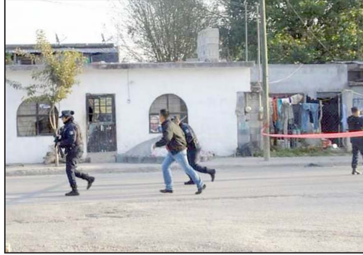
Hechos violentos registrados en Linares.

Los agresores al verlo malherido se dieron a la fuga cor-