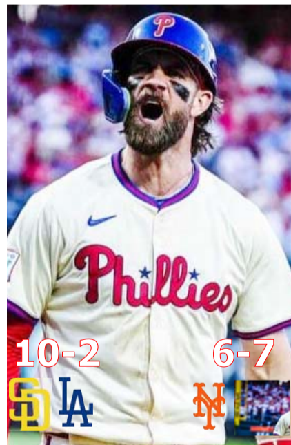
Filadelfia reaccionó ante Mets..

Mark Vientos pegó un par de jonrones de dos carreras para los Mets, quienes consiguieron cuadrangulares solitarios de Pete Alonso y Brandon