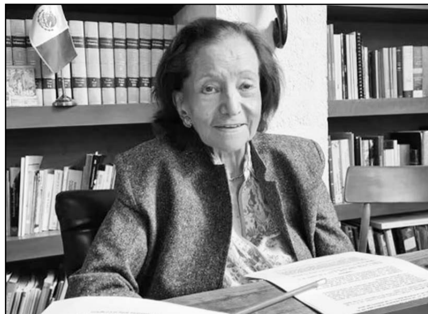
Los nietos destacaron que fue su mayor motivación para salir de su problema de salud fue el presentarse el 14 de septiembre.