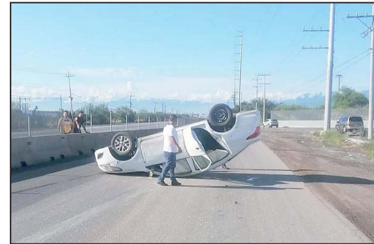
Se registró en la carretera a Laredo.

Esta persona se desplazaba a bordo de un automóvil Nissan