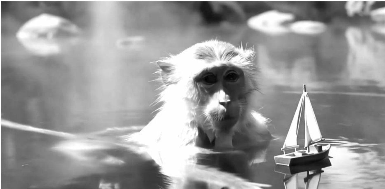
Por el momento, este producto aún no está disponible para el público y aún no se sabe cuándo llegará para su uso.

Además, que el video se podrá generar con diferentes relaciones de aspecto.