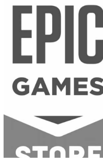
De acuerdo con Epic, Samsung y Google han conspirado para que su tienda sea difícil de descargar en los dispositivos de la compañía surcoreana.

En caso de que la demanda de Epic avance, Google y Samsung tendrán que modificar su política respecto al bloque de apps de terceros y hacer más simple saltarse el Auto Blocker.