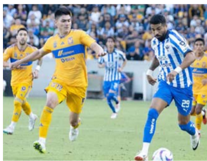
Tigres y Rayados se verán las caras.

Un año después, en la Interliga del 2007, Tigres venció 2-0 a los Rayados en la fase de