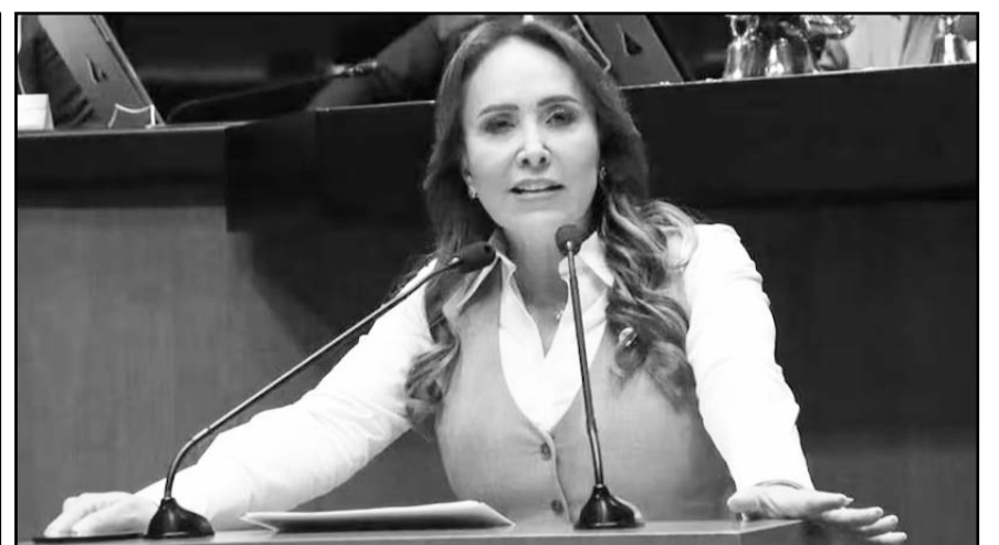
La legisladora priista presentó una iniciativa para reformar la Ley de Obras Públicas.

Además, el que será el nuevo barrio de López Obrador es ruidoso, está al pie de la carretera, con calles sin banquetas y con diversos comercios en los alrededores.