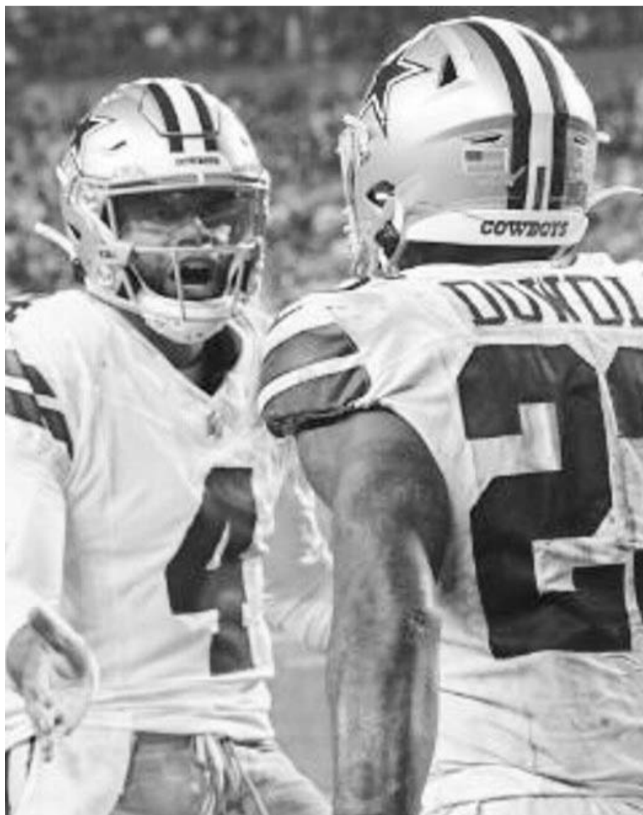
Prescott afinó su brazo en el juego de ayer.

Los Vaqueros tuvieron la última serie ofensiva para ganar el juego y lo consiguieron en una cuarta oportunidad y en la zona roja gracias a un pase de anotación del Prescott hacia el receptor Jalen Tolbert, culminando así el duelo.