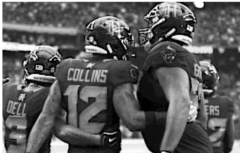
Los Texanos vencieron a los Bills en un aguerrido juego.