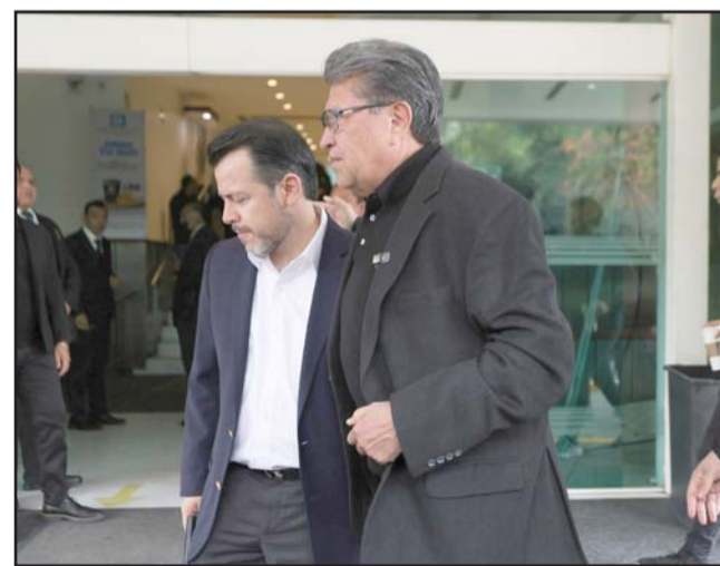
Monreal dijo que se realizará un homenaje luctuoso en la Cámara Baja.