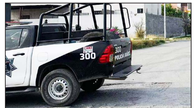
El agresor logró darse a la fuga.

Las balas hicieron blanco en los dos jóvenes cayendo al piso