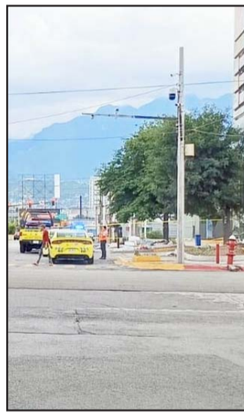
Centro de Monterrey.

Mencionaron que esperarán los resultados de la autopsia de ley correspondiente, para determinar las verdaderas causas del deceso.