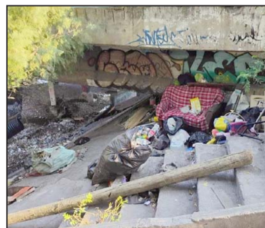
Hoy en día está lleno de basura, es inseguro y prácticamente se encuentra destrozado.

Los vecinos y habitantes de Guadalupe han manifestado que por las condiciones en que se encuentra este sitio, las palabras se las llevo el viento.