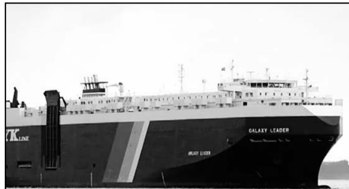
Las autoridades mexicanas continuarán gestiones para liberar a compatriotas retenidos por Hamás.

inmediato con los connacionales que se encuentran en situaciones de vulnerabilidad y mantendrá la comunicación efectiva con sus familiares".