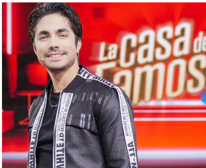
El actor confesó que está bajo ayuda profesional.

Ahora, y en entrevista para varios medios regiomontanos, el actor confesó que está bajo ayuda profesional, pues, aunque su familia y amigos le han demostrado su apoyo incondicional, busca una segunda opinión de todo lo sucedido: "Estoy en terapia. tomé la decisión (porque), a pesar de