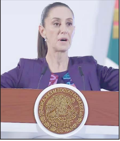
Sheinbaum aseguró que los fallos no invalidan la reforma judicial.