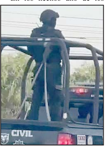
Ciénega de Flores.

efectivos resultó lesionado, por lo que fue auxiliado, en tanto arribaron otros elementos de diferentes corporaciones.