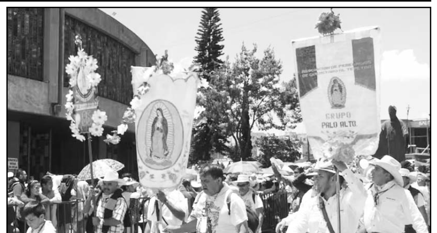
El coordinador de la bancada priista busca que el 'Día de la Virgen de Guadalupe' se convierta en descanso obligatorio.

Plantea que aquellas personas dedicadas a la preservación y conservación del medio ambiente, que se encuentren en situación de riesgo, tendrán el acceso al Mecanismo para la Protección de Personas Defensoras de Derechos Humanos y Periodistas. Así, serían beneficiarios de las Medidas de Prevención, Medidas Preventivas y Medidas Urgentes, establecidas para garantizar su vida, integridad, libertad y seguridad.