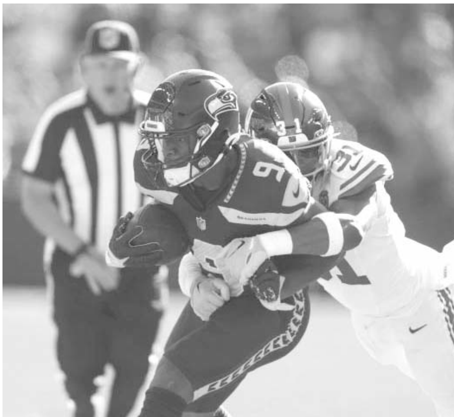
Seattle tiene una racha de cinco derrotas seguidas en la serie con San Francisco, que incluye un partido de postemporada.

Es la racha más extensa para los Seahawks en la historia de la serie ante