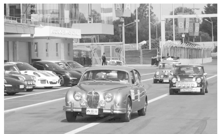
Al menos unos 300 autos clásicos y antiguos que han competido en distintas categorías del deporte motor van a formar parte de ese evento.

histórico de CDMX será el tres de noviembre, tan solamente días después de que la carrera de Fórmula 1 en el Autódromo Hermanos Rodríguez de CDMX se pueda realizar del 25 al 27 de octubre.