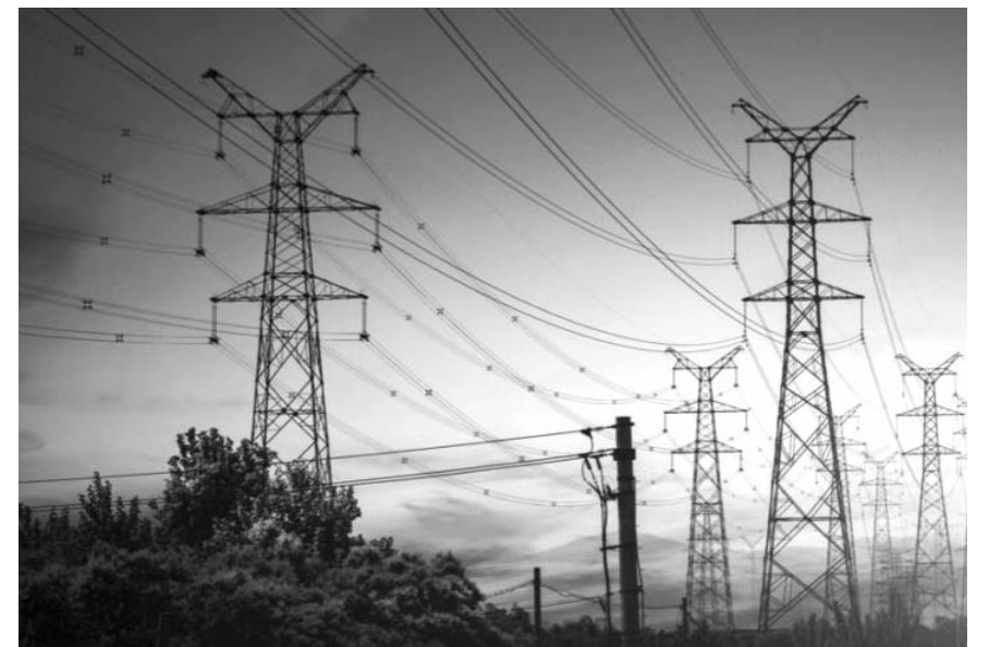
El gobierno federal debe mandar un mensaje de compromiso con el Estado de derecho y la certidumbre jurídica.

Desde su punto de vista no se prevé que el resultado de la elección en Estados Unidos sea impugnado y que genere más volatilidad.