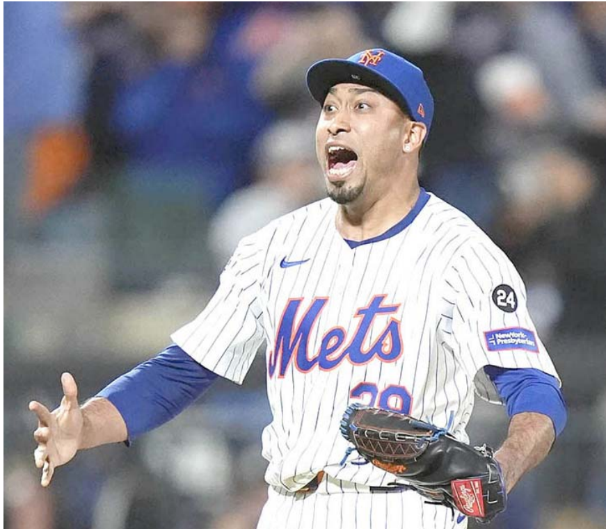
Los Mets de Nueva York vencieron 4-1 en casa a los Filis de Filadelfia y con ello avanzaron a la serie de campeonato en la Liga Nacional.

también produjo una de las ocho carreras de estos Dodgers.