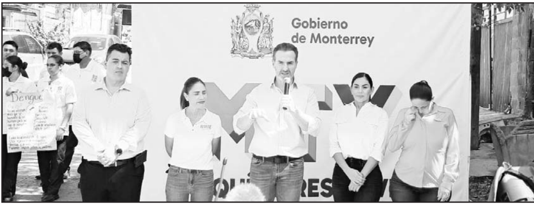
Ante el aumento de casos, el alcalde regio hizo la petición al gobernador.