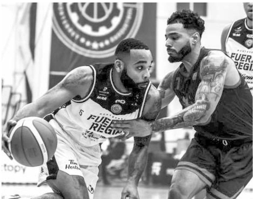
Fuerza Regia llega a esta serie en la segunda posición de la campaña con 49 unidades

Únicamente como dato, el boxeo olímpico le dio a México con Marco Verde una medalla de plata en los Juegos de París.