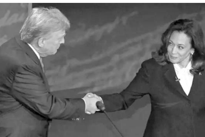
En la primera confrontación, se vio acorralado.

El primer debate entre los candidatos presidenciales de Estados Unidos, ocurrió el pasado 10 de septiembre y se caracterizó por ser intenso; ahí, el exmandatario se vio acorralado