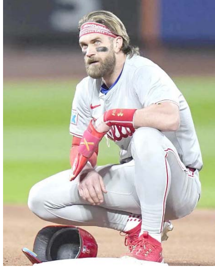
Filis, a esperar un año más.

Los Padres de San Diego recordaron a los aficionados su política de tolerancia cero para el mal comportamiento antes del juego cuatro de su Serie Divisional de la Liga Nacional contra su rival Los Ángeles, después de que los ánimos se caldearon en el campo y en las gradas del estadio de los Dodgers durante el domingo por la noche.