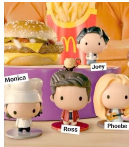
Por lo pronto se lanza en España y Estados Unidos.

Aunque en México aún no se sabe cuándo llegará esta edición especial, en España tendrá un costo de 9.50 euros (cerca de 200 pesos mexicanos) y cada semana se lanzará una figura diferente.