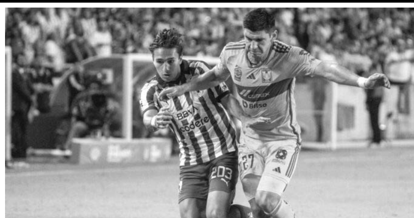
Rayados ha ganado cinco, mientras que Tigres se ha hecho de cuatro victorias.

Tras el partido del próximo domingo ante América, Gago viajará de Houston a Buenos Aires para iniciar su etapa en el club Boca Juniors. (AC)