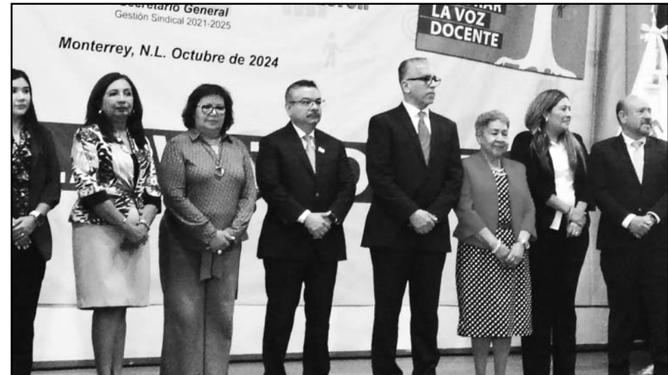
Fueron cuatro los maestros reconocidos como parte del 'Día del Docente'

Martínez Calderón destacó que la Unesco ha señalado que las celebraciones se centrarán en valorar la voz docente, teniendo como premisa el tema señalan la importancia de recuperar el cauce de la educación, poniendo a los educandos en el centro del Sistema Educativo.