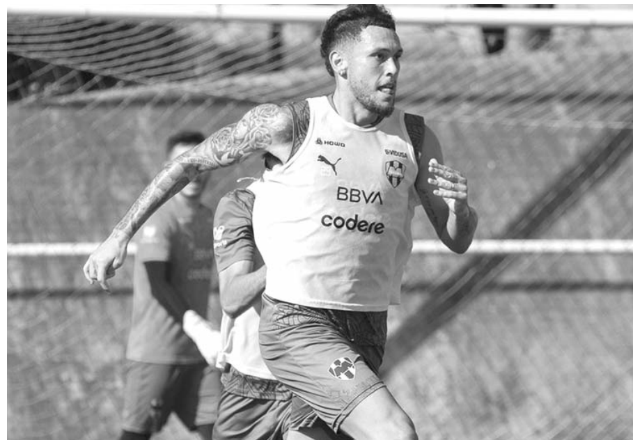
El duelo amistoso entre Rayados y Tigres será el próximo sábado

viajen a Estados Unidos para el duelo amistoso contra Tigres.