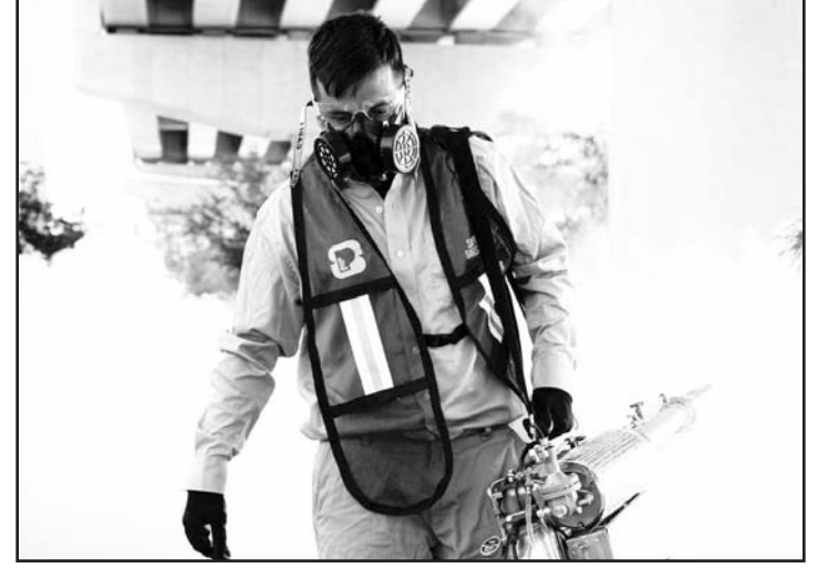
Van con todo contra el mosquito transmisor del dengue.

En estas áreas se desplegarán cuadrillas de personal a pie, equipadas con aspersores móviles; además, se utilizarán camionetas con equipo para fumigar las calles, y camiones para recolectar cacharros tanto en la vía pública como en los hogares.