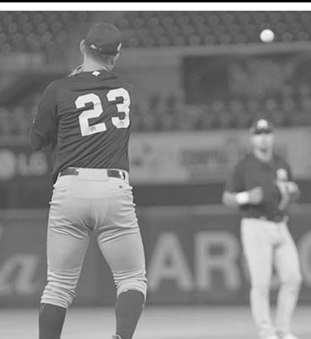
Vencen a Tomateros.