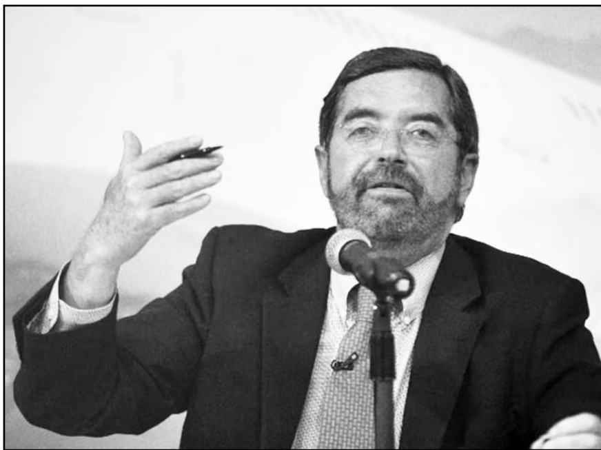
De la Fuente destacó la disposición del gobierno mexicano para aclarar "todas las dudas legítimas" que puedan tener los inversionistas estadounidenses.

Tras su aval en lo general, inició la discusión en lo particular.