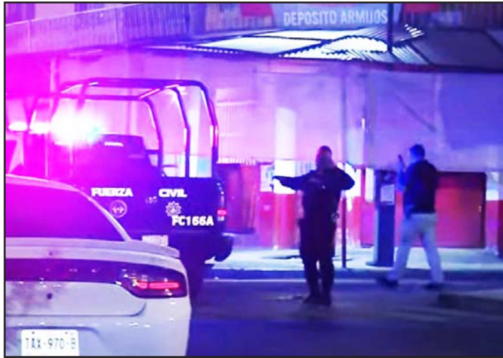
Ocurrió en la colonia San Bernabé.

Las autoridades mencionaron que al momento de los hechos,