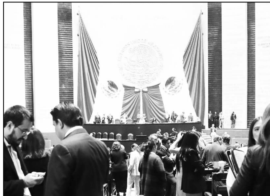
El proyecto de ley implica cambios en los Artículos 25, 27 y 28, permitiendo a la CFE generar hasta el 54% de la energía eléctrica en el país.

La reforma, que modifica los Artículos 25, 27 y 28 de la Constitución Política, establece que en materia de transmisión y