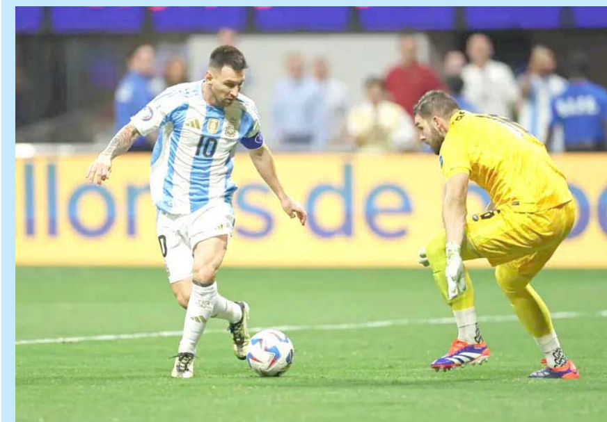
Argentina se enfrentará a Venezuela.