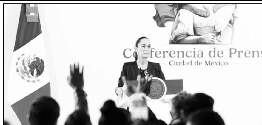
En conferencia de prensa la Presidenta reiteró que los contratos vigentes se mantendrán bajo la reforma energética actual.

Señalaron que para consolidar la transformación de la comisión es necesario que la actual presidenta tenga un segundo mandato, a fin de que concrete los cambios que aún hacen falta. Los legisladores también aprobaron un procedimiento de consulta pública para dicha elección, que será "transparente, de máxima publicidad y que se apegará a los términos y condiciones que determina la ley".