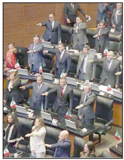
Con 124 votos a favor, el pleno de la Cámara Alta aprobó la iniciativa.