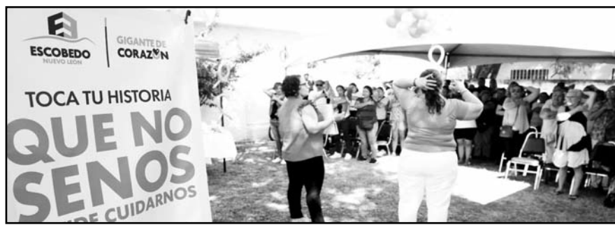
Se promoverá la prevención, detección y atención oportuna.