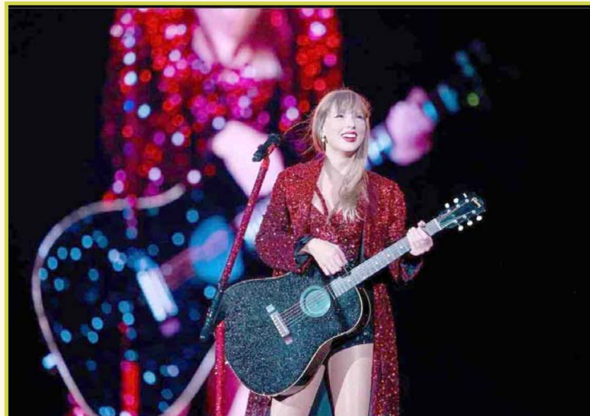
La fundación Feeding America es la encargada de distribuir los recursos.

Swift tiene previsto reanudar su gira por The Eras Tour en Miami a partir del 18 de octubre, hasta ahora los conciertos programados entre el 18 y el 20 no se han cancelado.