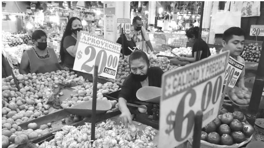
Llegó a 4.58% en septiembre

Los productos cuyo aumento de precio incidió más al alza fueron: limón con un alza mensual de 22.2%; papaya, 15.3%; colegiatura de primaria, 5.7%;