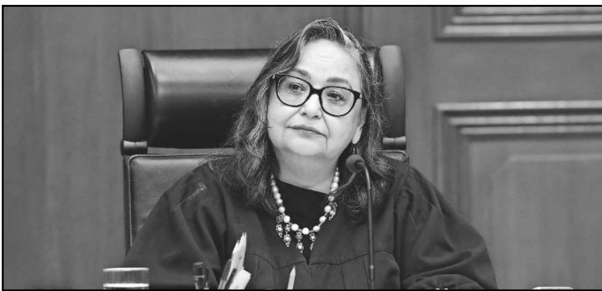
La presidenta de la SCJN turnó al ministro Juan Luis González Alcántara la acción de inconstitucionalidad.

"A la luz de este enunciado constitucional queda claro que la prohibición de participación de los partidos políticos en las acciones, actividades y sesiones relacionadas con este proceso responde a la preocupación de que sus intervenciones en la mesa del Consejo General puedan generar los efectos no deseados por la disposición constitucional precisada", sostuvo.