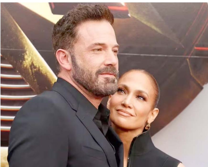
La relación más importante es la que tiene consigo misma.