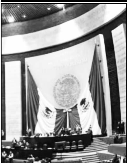
La Cámara de Diputados aprobó la creación de 20 comisiones ordinarias para la LXVI Legislatura.