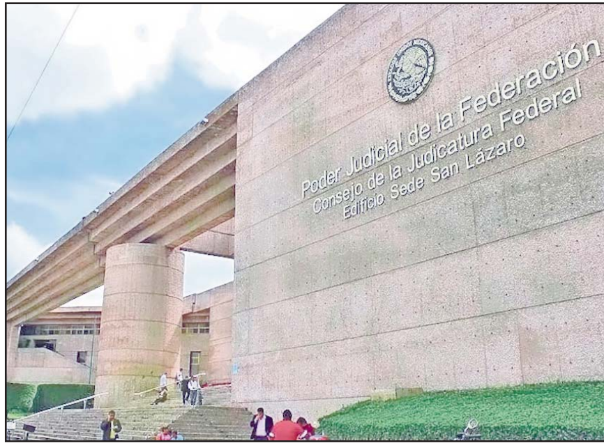
La ministra Piña y otros dos consejeros votaron en contra de la entrega de listas, alegando violación a suspensiones judiciales.

muy importante por lo que se convocará para que este sábado 12 de octubre a las 09:00 horas se lleve a cabo la insaculación de los cargos a elegir. En entrevista al término de la sesión indicó que el Consejo de la Judicatura Federal acordó entregar al Senado la información sobre los cargos y vacantes para postular en la elección de jueces y magistrados.