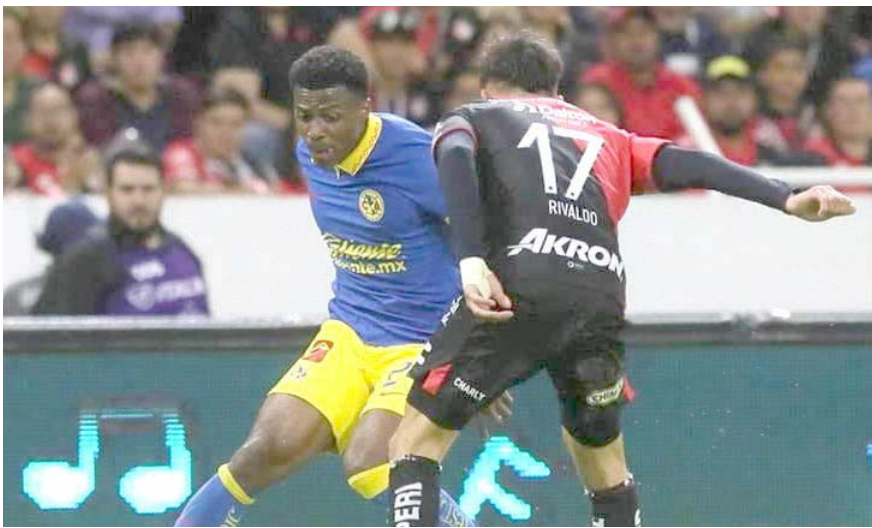
Deberán tener un último registro en ligas europeas, un mínimo de minutos en selección, proceso en selecciones menores entre otros requisitos.

Por su parte, el juego cuatro en Kansas City entre los Reales y los Yanquis será este jueves a las 18:08 horas.