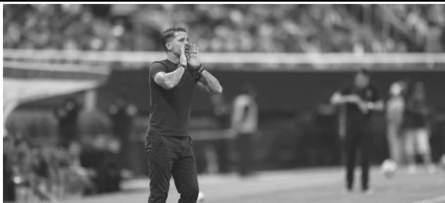
La salida de Gago de las Chivas es debido a que habría aceptado la oferta de Boca Juniors

La salida de Gago de las Chivas es debido a que habría aceptado la oferta de Boca Juniors para hacerse de sus servi-