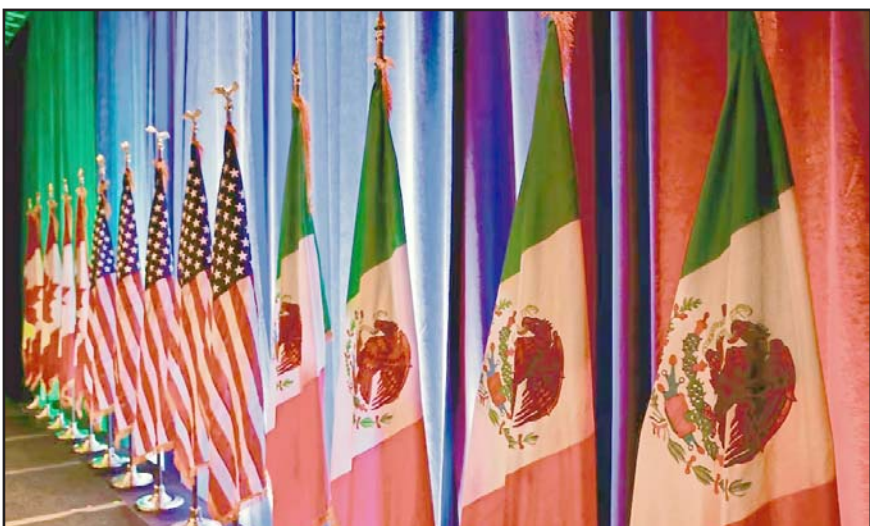
Se teme que la aprobación del proyecto energético reactive controversias con Estados Unidos y Canadá.

Al final, en 2023 los desacuerdos no escalaron a un panel de controversias del T-MEC luego de que la Suprema Corte de Justicia de la Nación (SCJN) declaró inconstitucional la reforma.