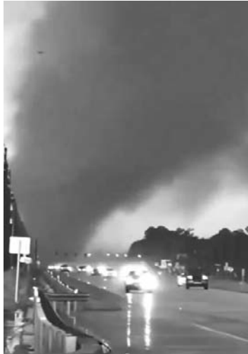
Además de daños y lluvias, se tuvo reporte de tornados.

El Servicio Meteorológico Nacional de EU reportó que un tornado grande y extremadamente peligroso estaba ubicado