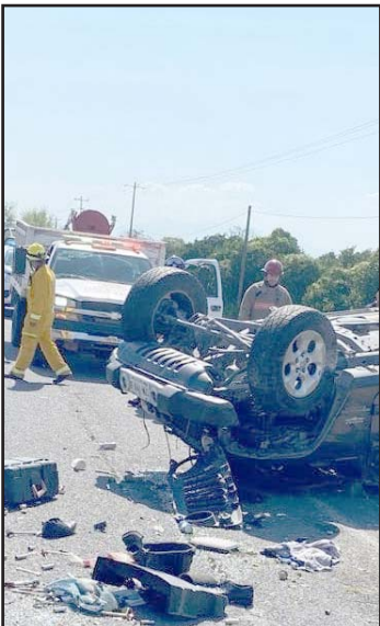
Murió en el hospital.