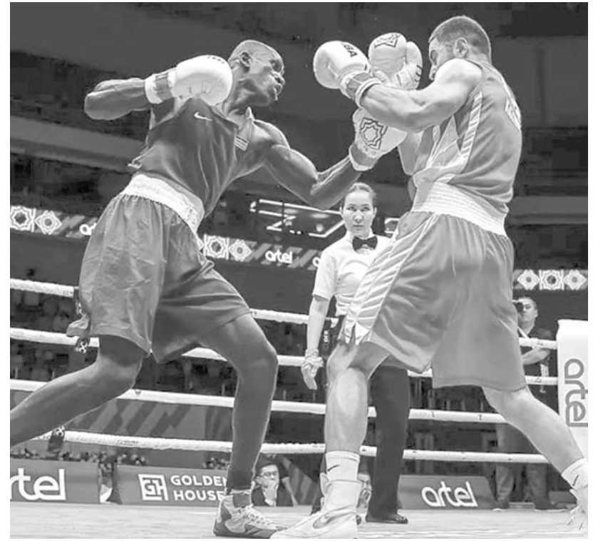
Los Juegos de París 2024 fueron los últimos en los que se repartieron medallas en una justa veraniega.

“Si yo tuviera que dar un elocuente discurso para prepararlos para este momento, probablemente no tengamos a los jugadores indicados”.