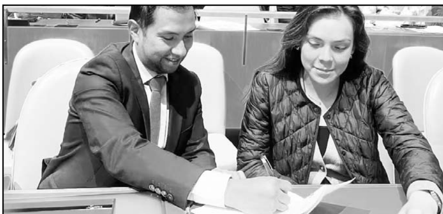
Las prioridades del país en el Consejo incluirán los derechos de las mujeres, la agenda de cuidados, la igualdad de género, entre otros.

Habrà quien no esté de acuerdo, "pero más por razones ideológicas que técnicas, o por razones de negocios y privilegios", dijo.