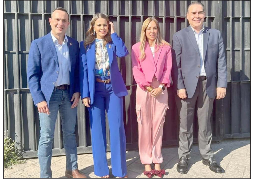
Rechazaron ir con el gobernador pero sí aceptaron reunirse con el alcalde.

“No estoy viendo disposición de mis compañeros. Hemos visto que recorren las sesiones por temas personales, pero no pueden recortar la sesión para una cita. Espero que todos los diputados entren en razón y tengamos esta reunión lo antes posible”, añadió.