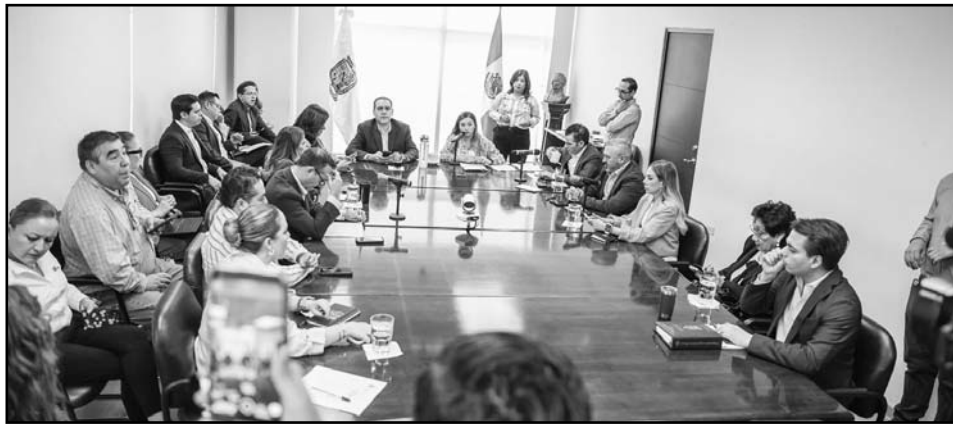
Se aprobó por unanimidad ante la nula respuesta del gobernador

“Es lamentable que no haya contestado (el gobernador) la solicitud por parte de la Presidencia del Congreso, a mi lo que me llama la atención es que la ley es muy clara el tema de