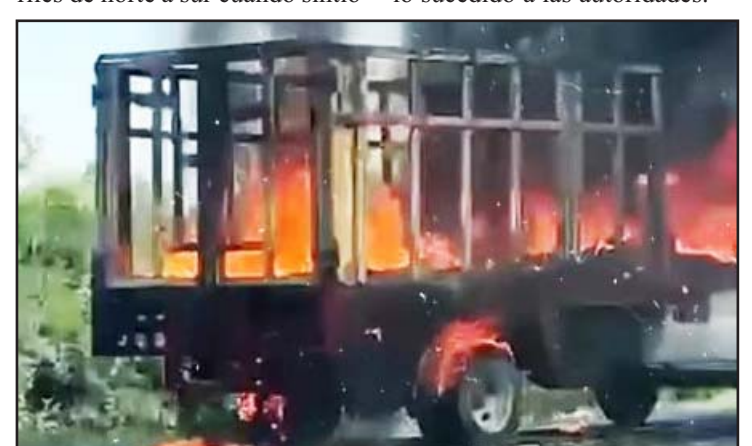
Fue en la carretera Nacional, en Montemorelos.

En los hechos no se reportaron lesionados, y ante el temor de que las llamas pudieran extenderse, fue que algunos vecinos del sector comunicaron lo sucedido a las autoridades.