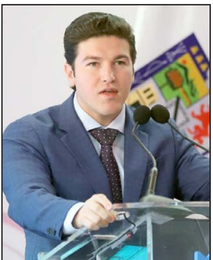
Samuel García sigue emitiendo vetos a acuerdos legislativos.