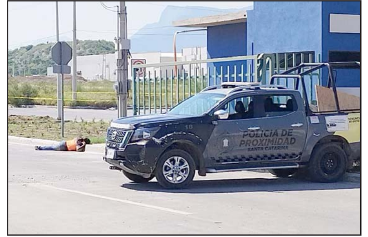
La víctima había estado en el Penal.

Indicaron que la puerta del domicilio estaba abierta, por lo que ingresaron a la zona de la sala.