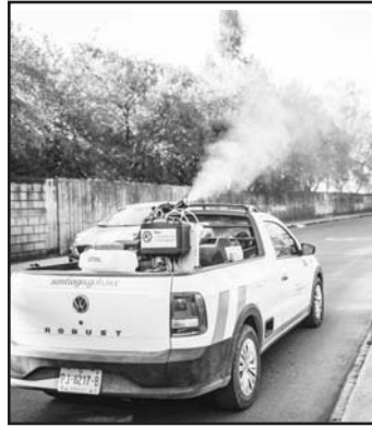
Se fumiga por las colonias.

"Hemos tenido un aumento muy considerable en esta enfermedad", señaló el Edil, "nosotros adquirimos una camioneta con su equipo para estar fumigando todas las colonias y calles de nuestro municipio, adquirimos dos mochilas aspersoras, y una motobomba con termonebulizadora, pero es importante que los ciudadanos pongan de su parte", dijo.