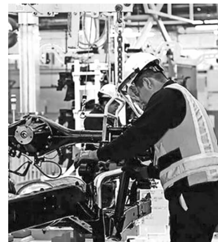
Se necesitan condiciones claras para la inversión

También mencionó que la elección presidencial en Estados Unidos es otro factor que están tomando en cuenta para el nearshoring porque prácticamente hay un empate hasta el momen-