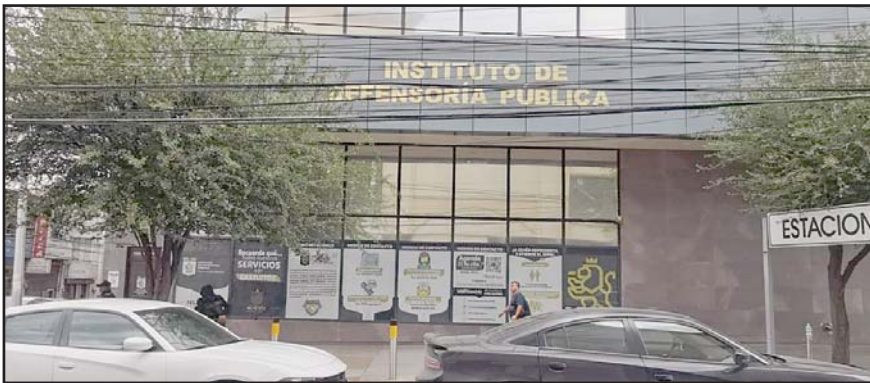
Así lo determinó la Primera Sala de la Suprema Corte de Justicia.

Una vez que culminó la reunión, el alcalde de Monterrey dejó el lugar por el acceso de Juan Álvarez en su camioneta, sin comentar nada.