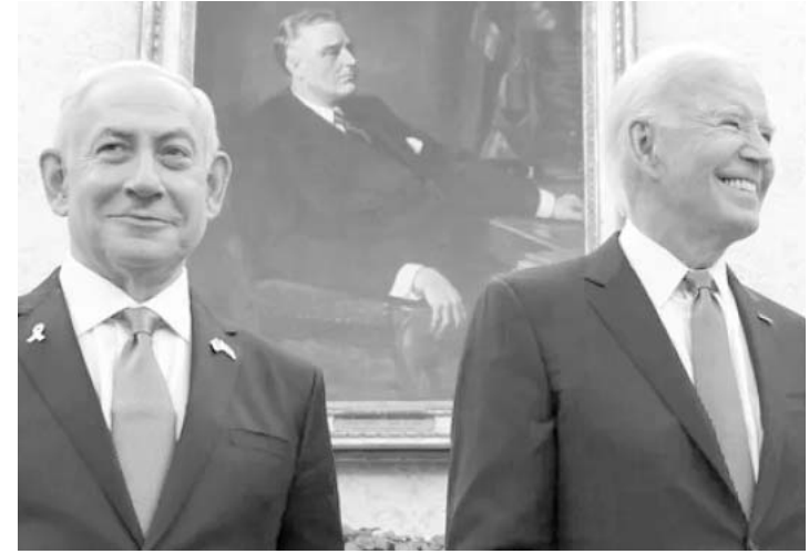
La llamada duró 30 minutos y fue "directa", "honesta" y "productiva", dijo la Casa Blanca.

presidenta Harris también participó en la conversación", dijo la Casa Blanca en un comunicado.