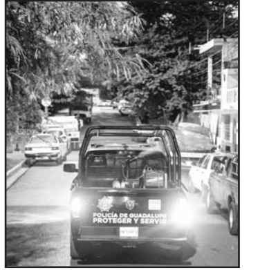
La idea es combatir al mosquito

Así mismo en el folleto vienen los teléfonos para si hay que ir a retirar llantas en domicilios o botes con agua de días y estanques llamen para que el personal del municipio vaya y les ayude a retirar.