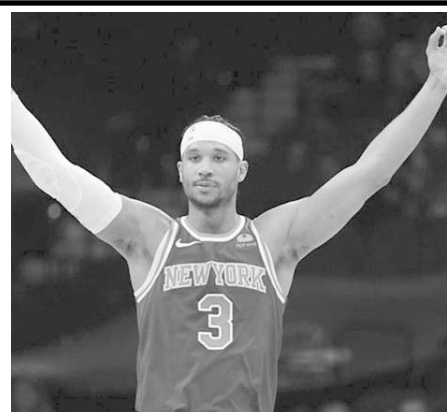
Los Knicks de Nueva York vencieron 117-104 a los Wizards

Con la victoria, los Knicks ahora tienen un récord de dos ganados por cero perdidos, todo esto mientras que los Wizards presentan una marca de dos derrotas y cero triunfos.