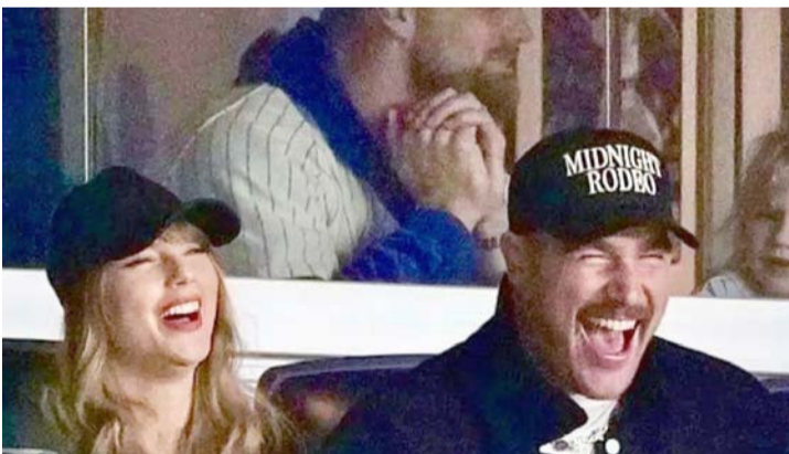
La cantante y el ala cerrada de Kansas acudieron al primer juego de post temporada entre Cleveland y Yankees, en NY.

Kelce y los Chiefs, dos veces campeones defensores del Super Bowl, descansaron este fin de semana después de iniciar la temporada con un récord de 5-0. Su próximo partido será el domingo en San Francisco, una revancha del Super Bowl de la temporada pasada.