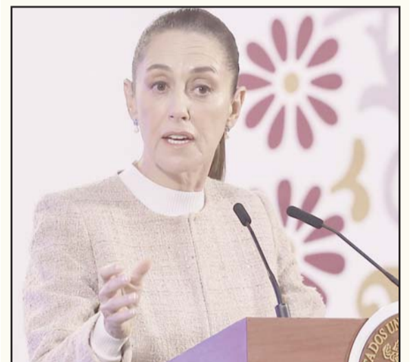
La Presidenta subrayó la importancia del proceso de insaculación en la Cámara Alta.

Dijo que va a esperar la determinación de la Suprema Corte de Justicia de la Nación sobre la reforma al Poder Judicial para tomar la decisión de si participa o no en la convocatoria.