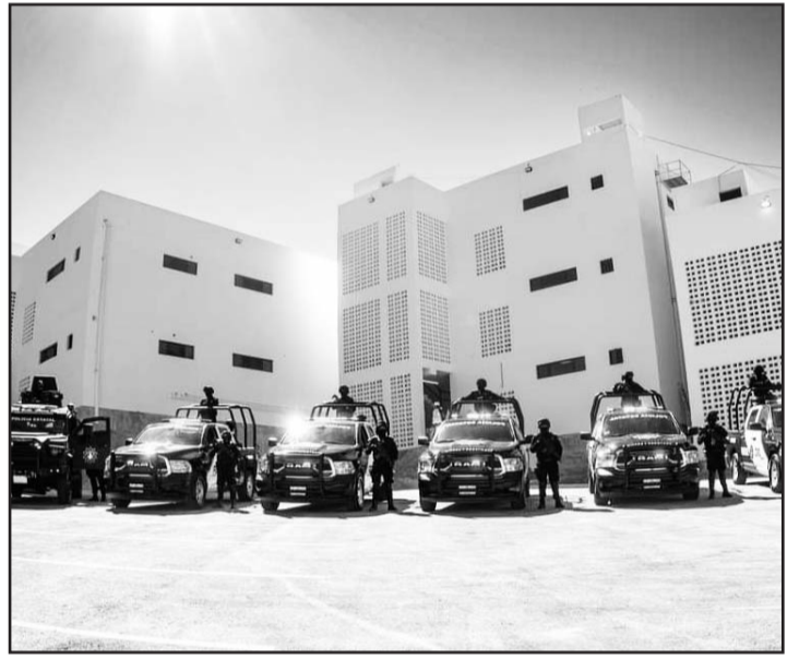
Contará con 350 elementos de la mencionada corporación.

Asistieron también funcionarios estatales y municipales, mandos de seguridad, y vecinos. (CLG)