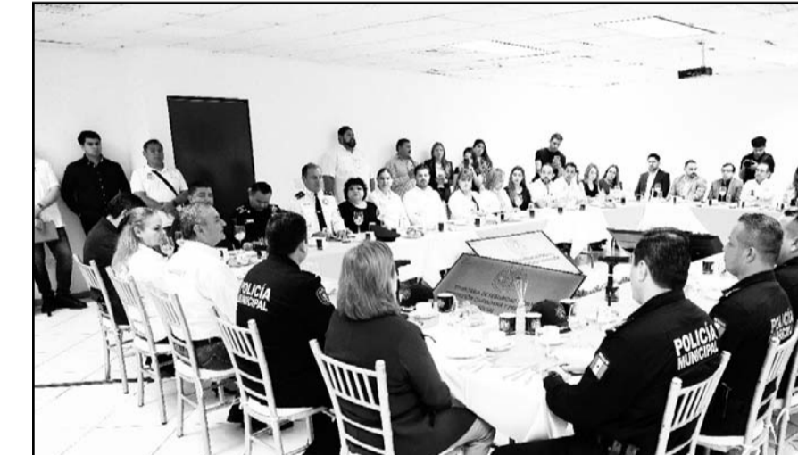
Se fijó una alianza por la seguridad mediante política transversal.