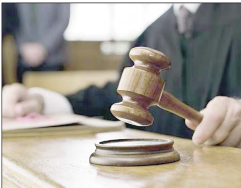
Externaron que participar en el proceso electoral validaría una reforma que pone en riesgo su carrera judicial.

Además, en la boleta se va a señalar incluso si el candidato es juez o magistrado en activo y, con respec-