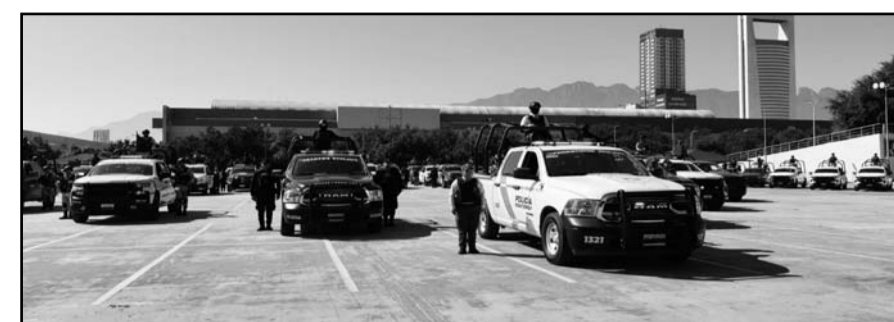
El objetivo es brindar una mayor seguridad y reducir los delitos.