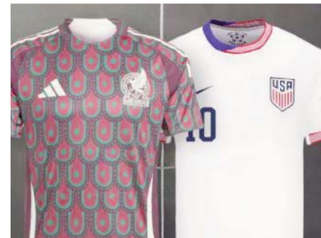
El Clásico de Concacaf, en acción.

Finalmente, Tigres ganó el caso, le pagó 2.5 millones de dólares al jugador francés y así acabó la novela.