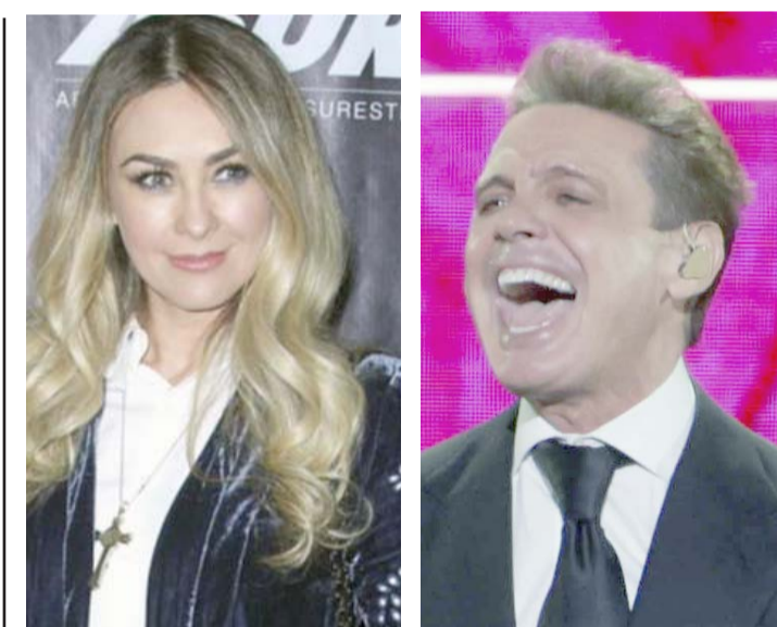
La rencillas estarían quedando en el pasado, alcanzando un acuerdo por la manutención de los hijos.