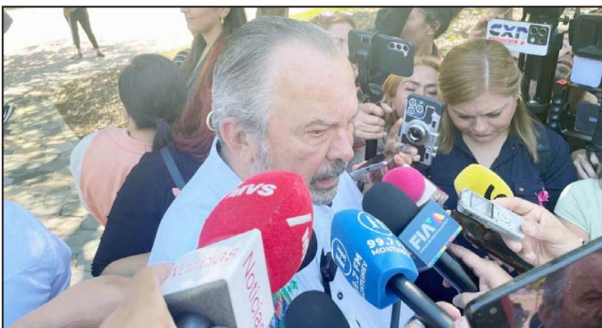
El alcalde dijo que es por la desaparición de información