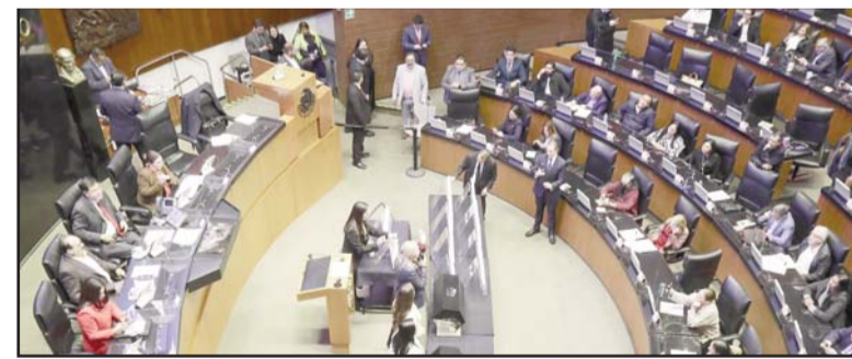
Los listados depurados de candidatos deberán ser aprobados por los Poderes de la Unión.

Para la elección de ministros de la Suprema Corte, magistradas de la Sala Superior y salas regionales del Tribunal Electoral e integrantes del Tribunal de Disciplina Judicial, los listados podrán contemplar hasta tres personas para cada cargo, y para la elección de integrantes de los tri-