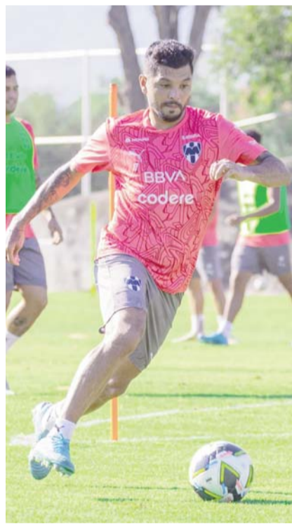
Monterrey llega motivado.

El Clásico Regio en su edición 139 se llevará a cabo el sábado 19 de octubre en punto de las 21:00 en el Estadio BBVA, duelo correspondiente a la Jornada 12 del Apertura 2024.