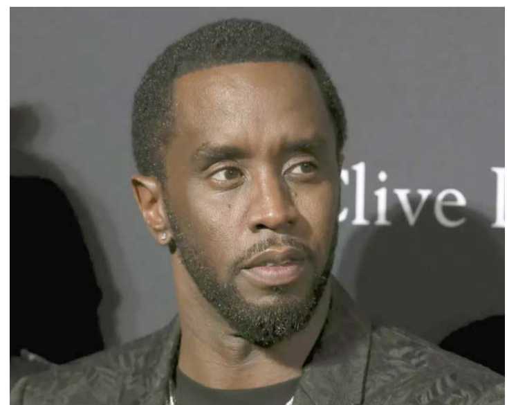
Los abogados del rapero consideran que acusaciones buscan ganar publicidad.

En un comunicado, los abogados de Combs criticaron esas tácticas como "claros intentos de ganar publicidad" y dijeron que "tienen plena confianza en los hechos."