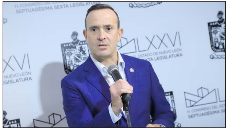
El diputado panista pidió al mandatario estatal hablar con la verdad.