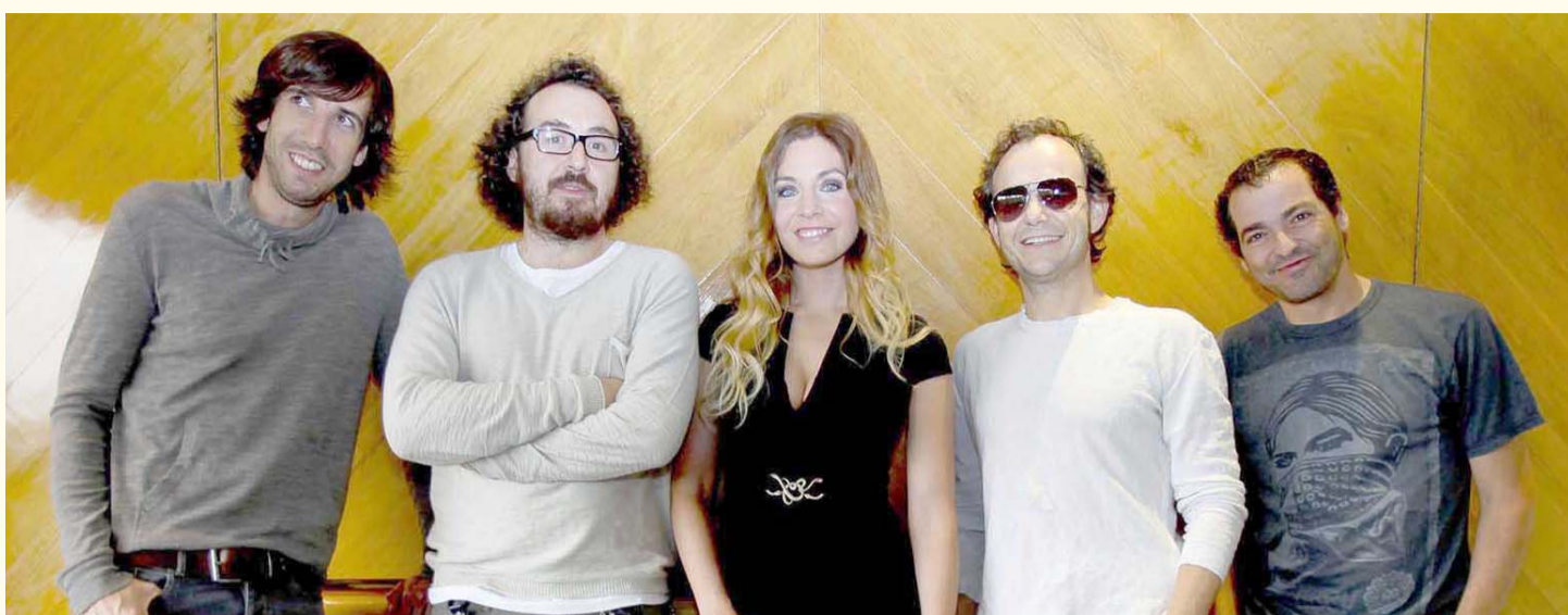
El anuncio tomó por sorpresa a los fanáticos y alimentó las especulaciones sobre un posible regreso de Amaia Montero.

En su edición 2024 celebrada en marzo, La Mole se anotó un jonrón al contar con la presencia de Anthony Daniels, Lou Ferrigno y Grace Caroline Currey y ahora, a cinco meses de la nueva fiesta, el World Trade Center se prepara para vestir de gala con la presencia de Hamilton.