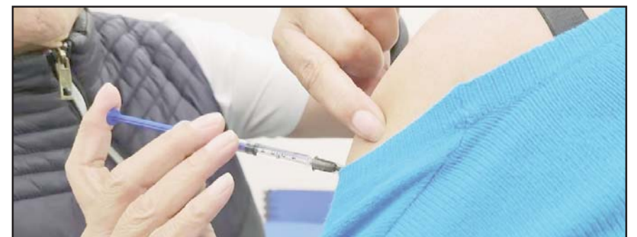
Se prevé la aplicación de más de 36 millones de inyecciones contra la influenza y casi 23 millones contra el Covid-19.

Las dosis se aplicarán en los centros de vacunación, las unidades de salud del Instituto Mexicano del Seguro Social (IMSS), IMSS-Bienestar, Instituto de Seguridad y ISSSTE, unidades de Pemex o servicios de salud de las entidades.