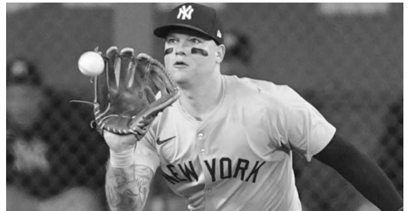
Alex Verdugo, ¿será el verdugo de Dodgers en la Serie Mundial?

Por su parte, los Cargadores de Los Ángeles ahora presentan un récord de tres ganados y la misma cifra de duelos perdidos.