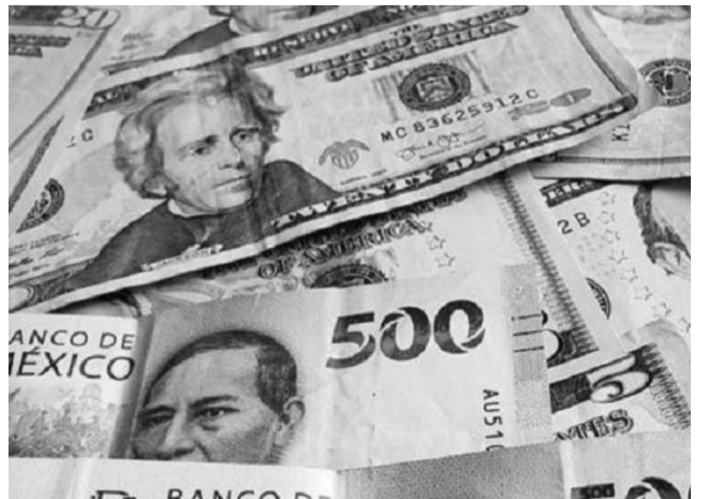
La divisa mexicana en los mercados internacionales extendió su pérdida de la semana pasada al concluir este lunes en 20.00 pesos por dólar

Resultado de lo anterior, la moneda nacional se ubica actualmente como la tercera divisa más depreciada frente al billete