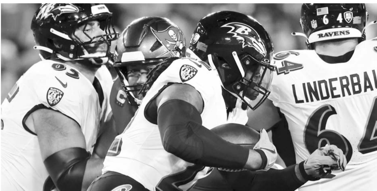
Baltimore se impuso a los Bucaneros en uno de los dos juegos de ayer.