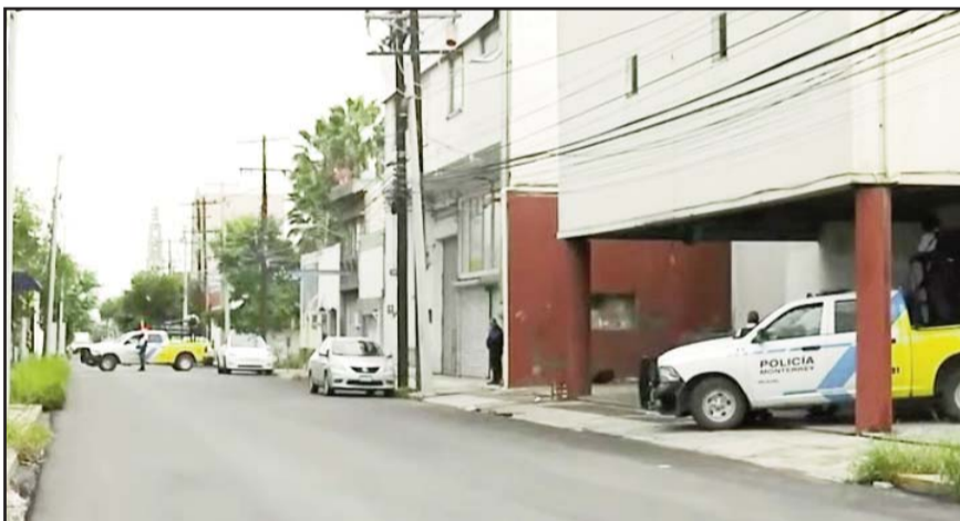
Fue en el cruce de Miguel Nieto y Reforma.

Un hombre que era buscado en la Colonia Guerra, en Guadalupe, fue encontrado sin vida en el anfiteatro del Hospital Universitario, luego de aho-