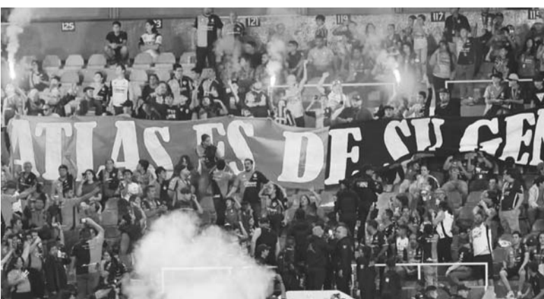
La comisión también le dio hasta dos partidos de veto al grupo de animación.

Sin embargo, la buena noticia es que Neymar volvió a jugar de manera profesional tras poco más de un año de espera, lo cual es una buena noticia para su club y la Selección de Brasil, así como también para sus fans y el propio fútbol.