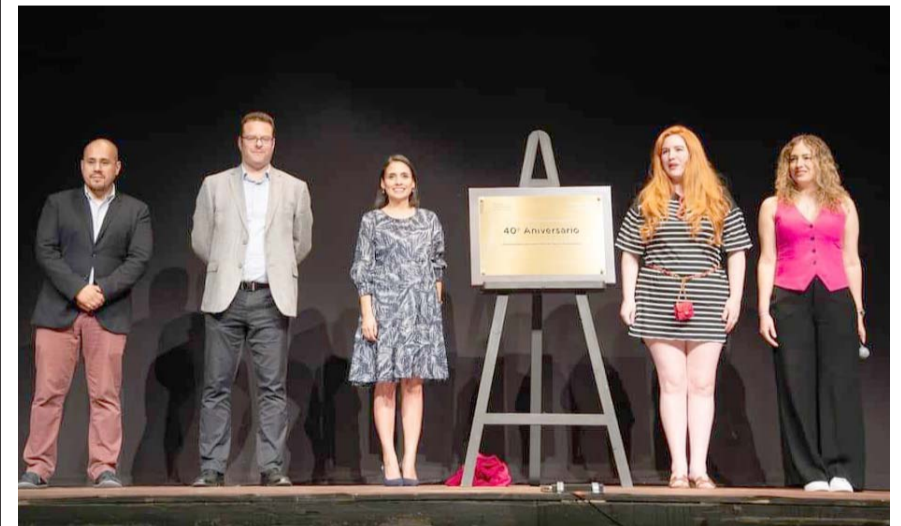
Se devolvió la placa alusiva a los 40 años del Teatro de la Ciudad.