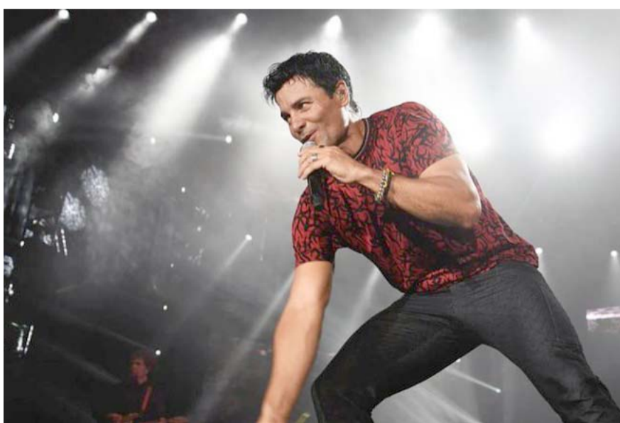
Trae su tour "Bailemos otra vez"; aún no hay fecha para Monterrey.

Según una publicación de Ocesa, el intérprete de "Un siglo sin ti" hará vibrar a la audiencia de los siguientes destinos: Ciudad de México, Cancún, Hermosillo, Guadalajara, Mérida, Mexicali, Morelia, La Paz, León, Puebla, Querétaro, Tijuana,