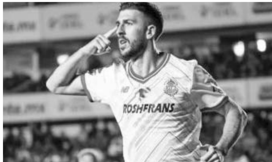
Los Diablos no la tienen tan complicada.

seguir en casa los tres puntos que le ayudarán a sumar y meterlos a la pelea por la calificación directa de la Liguilla.