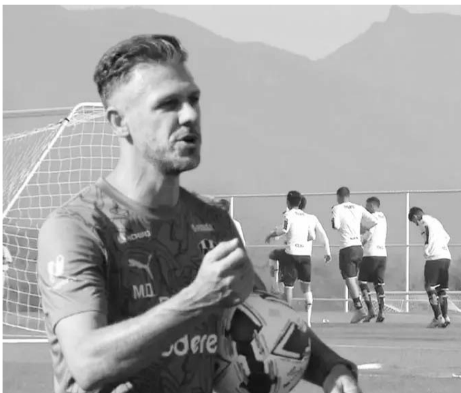
Martín Demichelis ensayará con su plantel.

Monterrey entrenó este lunes por la mañana en las instalaciones de El Barrial