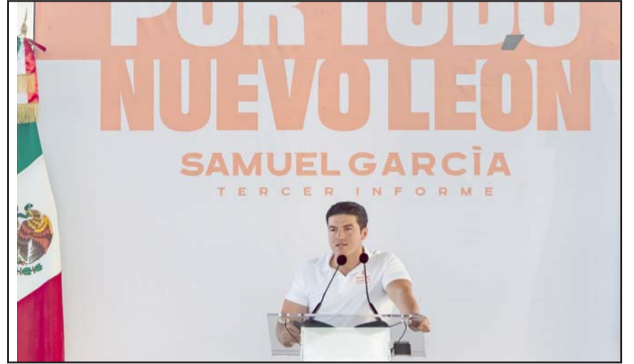
El mandatario estatal mencionó que están haciendo los estudios.

"Platicando con los alcaldes me da mucho gusto saber que alcaldías dónde antes de noche era imposible salir, hoy está