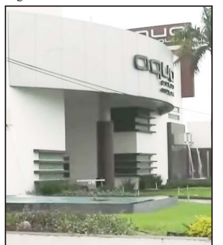
Ocurrió en Guadalupe.

Se informó que los sospechosos, dejaron en el lugar abandonado un automóvil que habían utilizado para ingresar al motel.