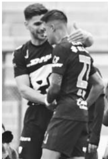
El conjunto universitario es peligroso.

Tras esta situación, los Rayados peligran ante unos Pumas enrachados, que pese a no contar con su goleador estrella César Huerta, no deja de ser peligroso. (AC)