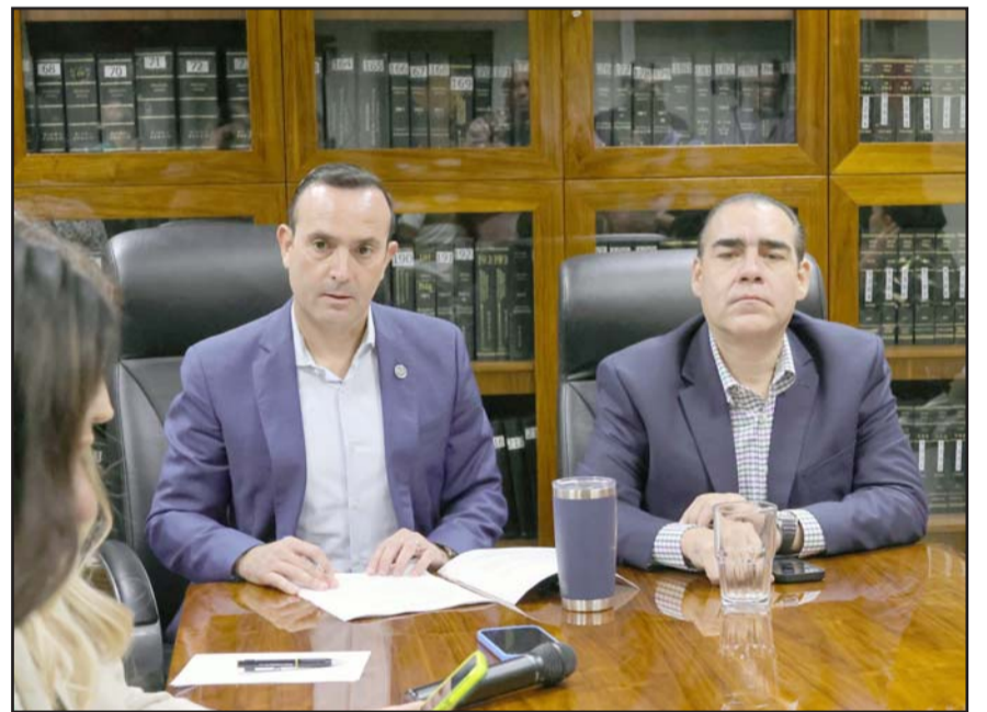
Van a exigir un presupuesto más equitativo, durante la reunión.

"Quizás es que no me conocen, los que me conocen saben que vamos a irnos hasta el fondo. Vamos a erradicar la violencia del municipio de Monterrey, de la ciudad, cueste lo que cueste, y lo vamos a hacer con toda nuestra inteligencia y con toda intensidad para darle seguridad a la gente de Monterrey".