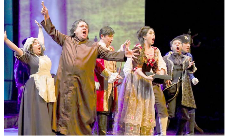
El elenco hizo brillar la plaza clásica de Rossini.

La Leyenda del Mictlán será presentada a partir del 25 de octubre al 3 de noviembre en horarios de 6:30, 7:30 y 8:30 PM, con entrada libre. La duración del evento es de 20 minutos, y durante los intervalos los asistentes podrán tomarse fotografías de su reflejo en el agua... conoce la sorpresa que se tiene preparada.