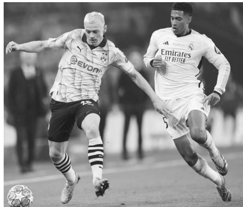
El líder de la competencia se enfrenta al máximo favorito.

El juego será mañana en el Gigante de Acero, iniciando el duelo a las 19:00 horas. (AC)