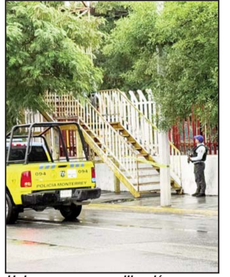
Hubo una gran movilización.

donde se encontraron restos fue en el cruce de las calles Miguel Nieto y Melchor Muzquiz, donde se encontró una cabeza de un hombre.