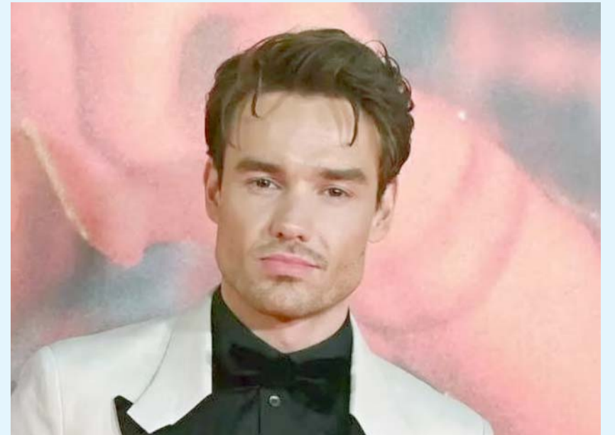
El exmiembro de One Direction tenía en su organismo "cocaína rosa".

En la llamada, el empleado expresó que tenían un huésped drogado que estaba destrozando la habitación y que temían por su vida debido a la presencia de un balcón. "Tenemos un huésped que está sobrepasado de droga y alcohol. Cuando