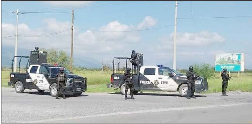
Según cifras de la Encuesta Nacional de Seguridad Pública Urbana del INEGI