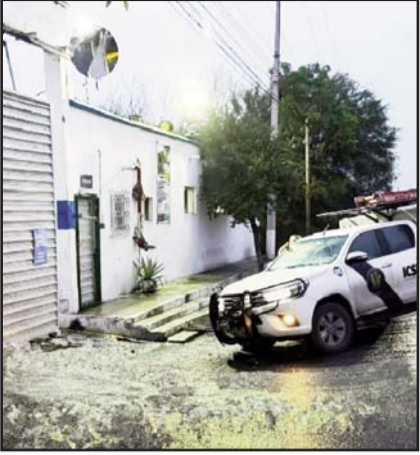
Ocurrió en Apodaca.