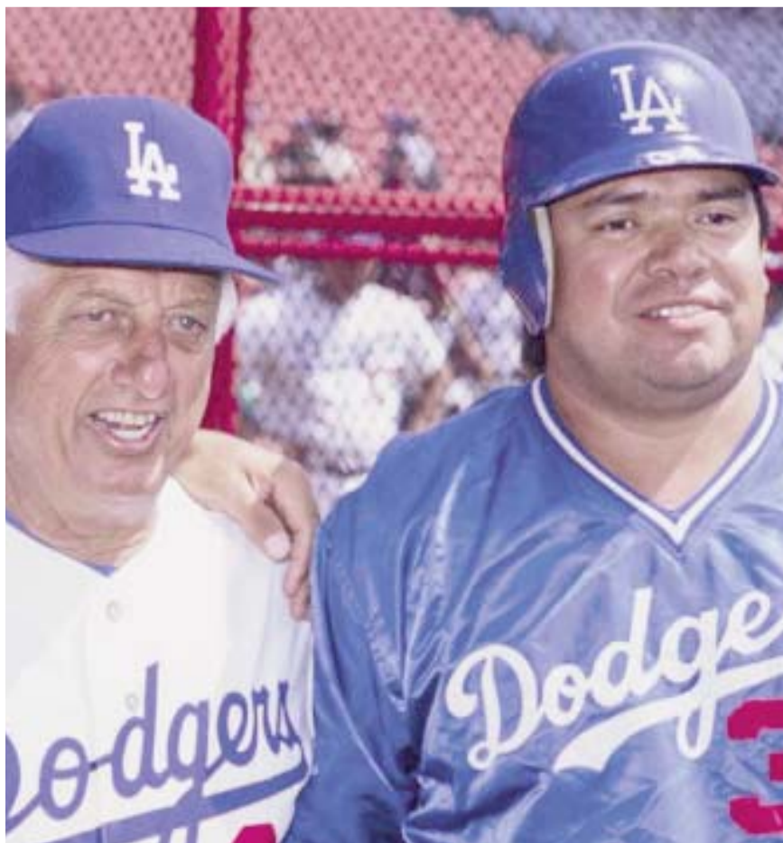
Valenzuela, en su momento de gloria al coronarse Dodgers sobre Yanquis en 1981.

Ahora las estrellas de los Dodgers son Shohei Ohtani, Mookie Betts, Max Muncy o Will Smith, entre otros.