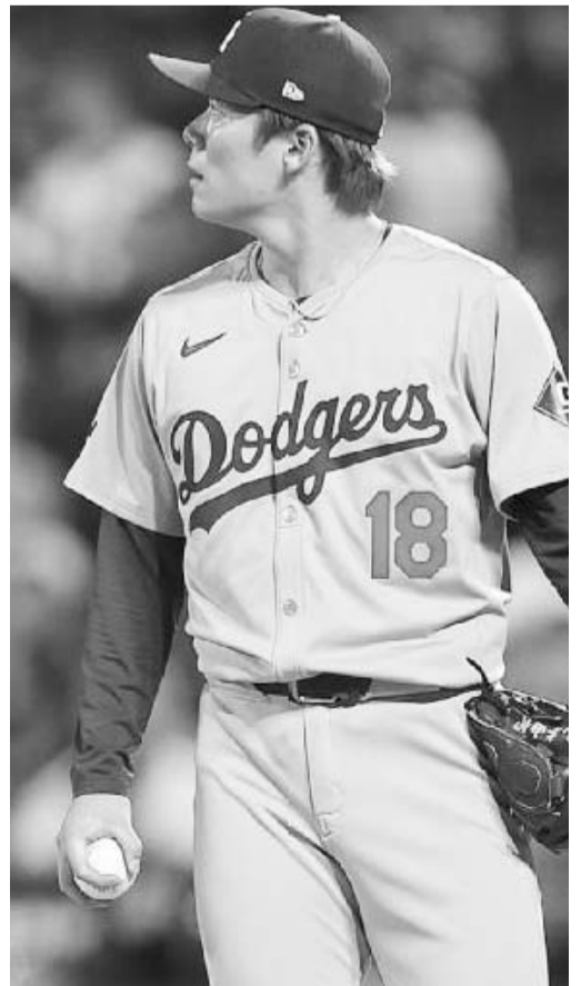
Dodgers, merecido protagonista.

Cabe señalar que el próximo Clásico de Otoño iniciará el próximo viernes y será en Los Ángeles, en el campo de los Dodgers y desde las 18:08 horas.