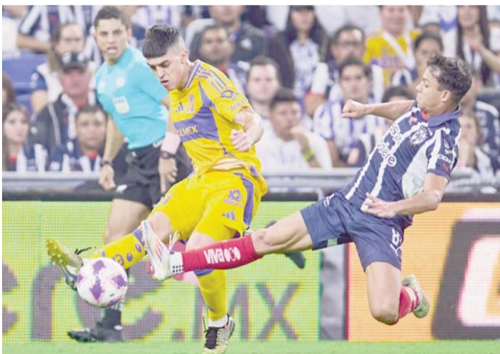
Otro hecho polémico se unió ayer al Clásico Regio.