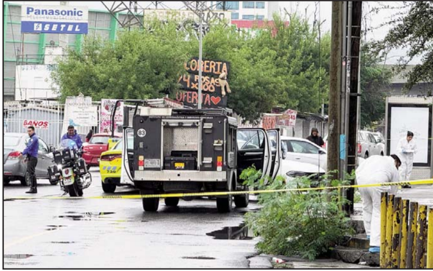
Determinaron que eran los restos de un hombre y una mujer.

Los hechos ocasionaron la rápida movilización de las corporaciones poli-