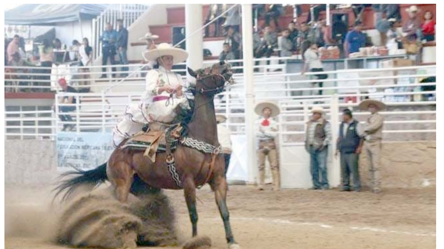
El nuevo ciclo de “Café con Historia”, comienza el 29 de octubre.

Posteriormente se formalizaron las competencias de las 9 suertes charras: la Calada de Caballos, Piales en el Lienzo, Coleadero, Jineteo del Toro, la Faena de la Tema en el Ruedo, Jineteo de Yegua, Manganas a Pie, Manganas a Caballo y el Paso de la Muerte.