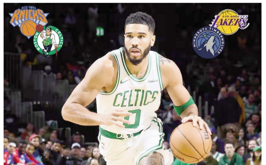
La NBA arranca esta noche con dos duelos.