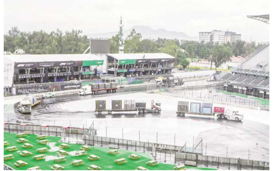
La caravana de la Gran Carpa arribó ya al Hermanos Rodríguez.

Nahuel Guzmán; Javier Aquino, Guido Pizarro, Joaquín Pereira, Jesús Angulo; Rafael Carioca, Fernando Gorriarán; Marcelo Flores, Uriel Antuna, Juan Brunetta y André Pierre Gignac tal vez sea el equipo que hoy inicie en Tigres.