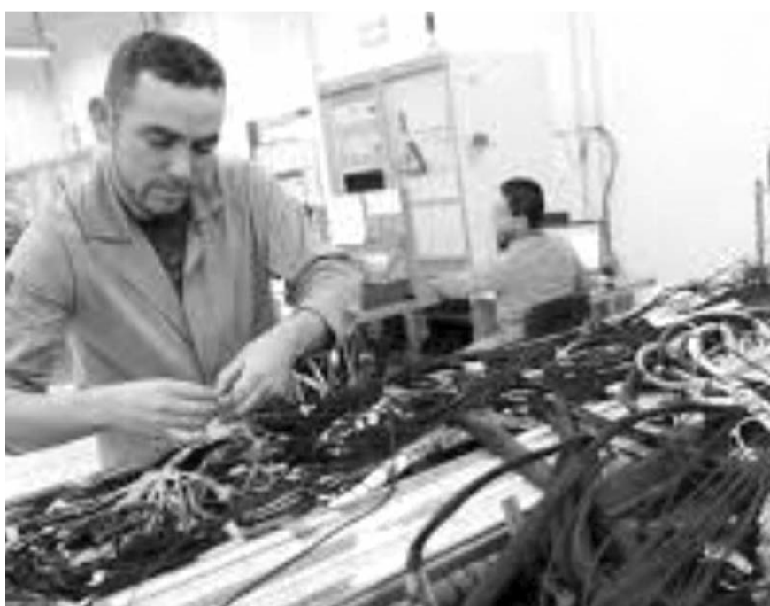
El estudio detalla que Apodaca y Escobedo de septiembre de 2019 al mismo mes de este año han añadido 80,290 y 29,739 nuevos puestos de trabajo, respectivamente.

"Cuando hay empleos formales, las familias podemos acceder a un mejor nivel de vida, pero para que esto ocurra es necesario que haya condiciones