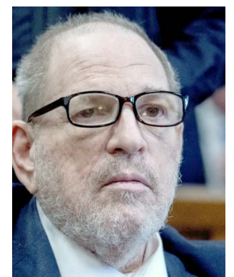
Más de 80 mujeres lo acusan.

Más de 80 mujeres lo acusaron de acoso, agresión sexual o violación, entre ellas las actrices Angelina Jolie, Gwyneth Paltrow y Ashley Judd.