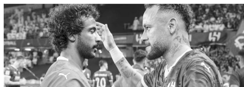
El carioca duró 370 días sin jugar.