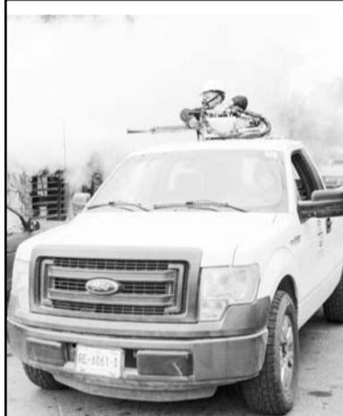
Se ha estado fumigando.

estatal reportó que en este 2024 el total de casos de dengue confirmados asciende a 7mil 428, y tan sólo durante la última semana el repunte alcanzó los mil 79 enfermos.