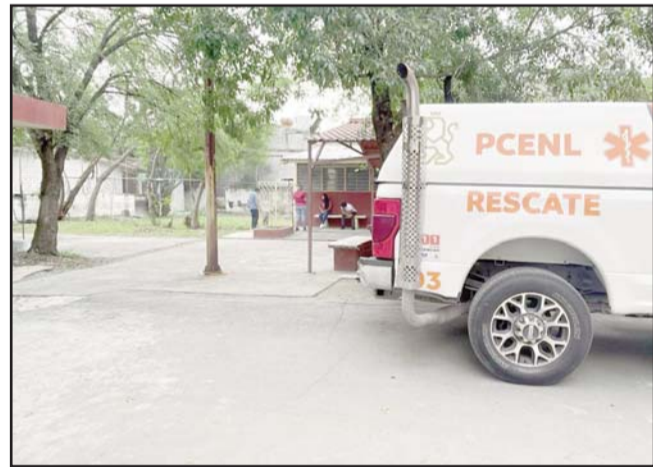
Jóvenes vivieron momentos de terror.

En el lugar se trasladó a un menor por parte del CRUM y otros dos se