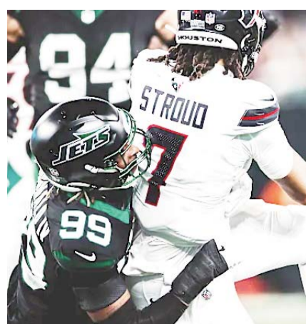
Jets se impuso a Houston.

Los Jets de Nueva York vencieron 21-13 en casa a los Texanos de Houston, en el inicio de la semana nueve de la NFL.