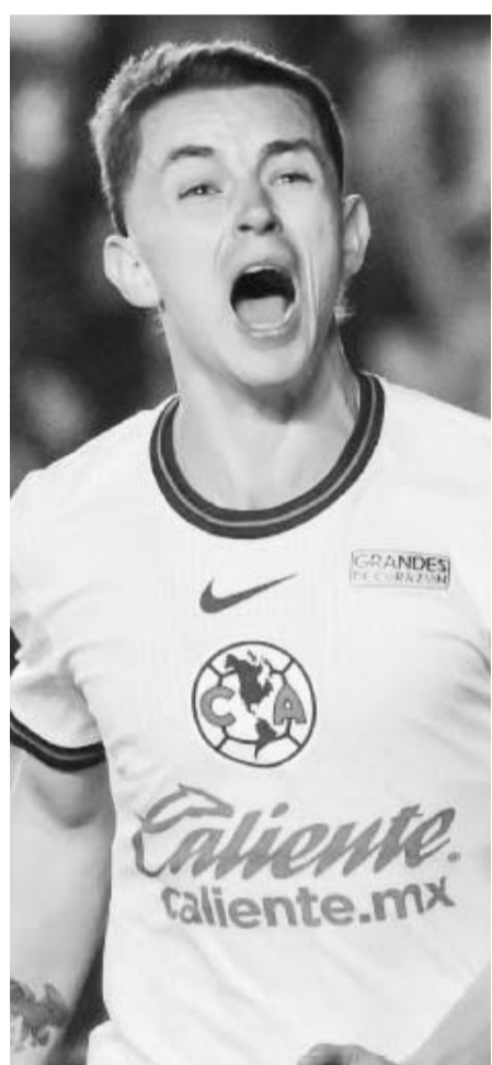
América quiere colarse a la Liguilla.

Cabe señalar que el juego cinco y definitivo entre ambos equipos va a ser el próximo domingo y en el Gimnasio Nuevo León Unido, iniciando todo a las 16:00 horas. (AC)