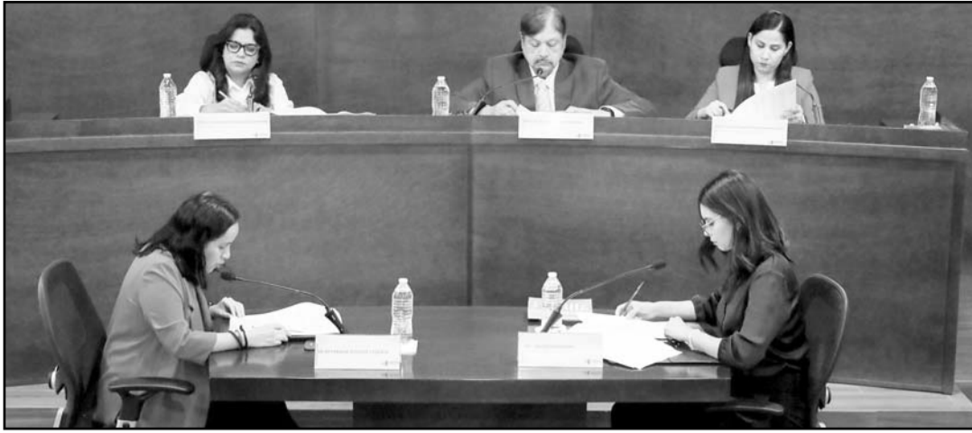
Es por haber incurrido en irregularidades durante el pasado proceso electoral.