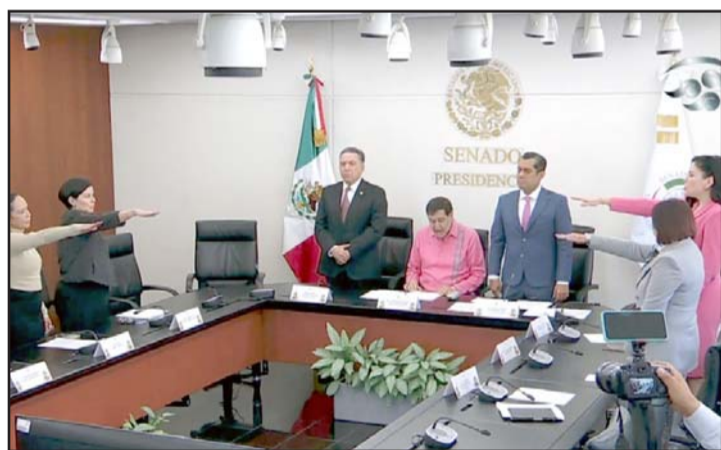
Rindió protesta el Comité del Poder Legislativo.

Ellos serán los encargados de verificar que los aspirantes cuenten con los conocimientos técnicos necesarios para el desempeño del cargo, además de que se distingan por su honestidad, buena fama pública, competencia y antecedentes académicos y pro-