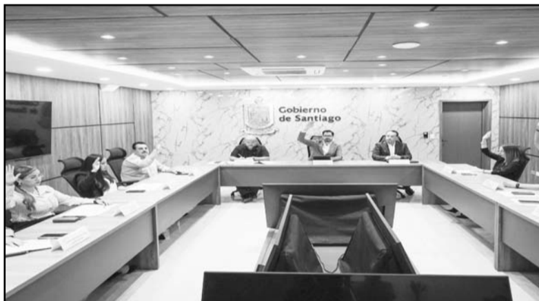
Se aprobó por unanimidad en la sesión de Cabildo realizada ayer.