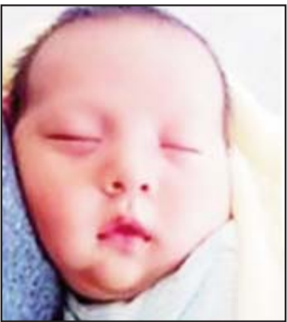
Activaron la Alerta Amber.

Las autoridades investigadoras mencionaron que la ejecución estaría relacionada con la venta de drogas.