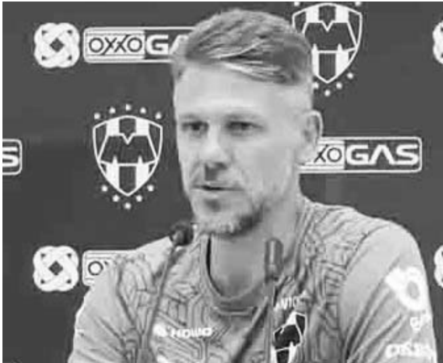
El estratega albiazul habló por sus muchachos.

de Alvaro Fidalgo contara en el marcador pese a que previo al tanto había un jalón de indumentaria de Henry Martín sobre Víctor Guzmán.