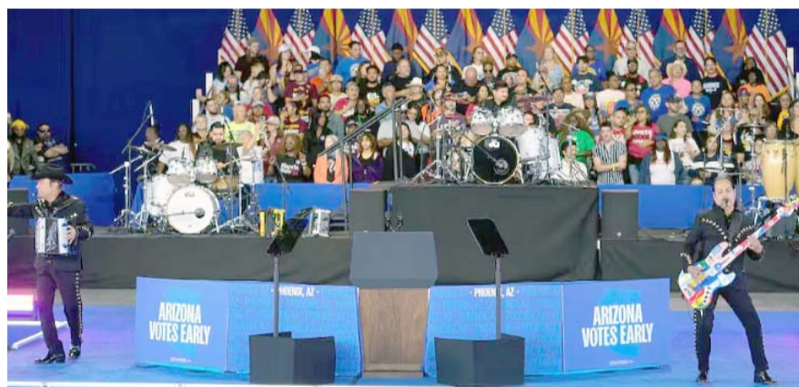
Vamos Kamala, animaban a la concurrencia alternando en inglés y español.

Harris agradeció a Los Tigres del Norte su actuación y afirmó que las elecciones del 5 de noviembre contra el expresidente y candidato republicano Donald Trump son "una de las más importantes de nuestras vidas".