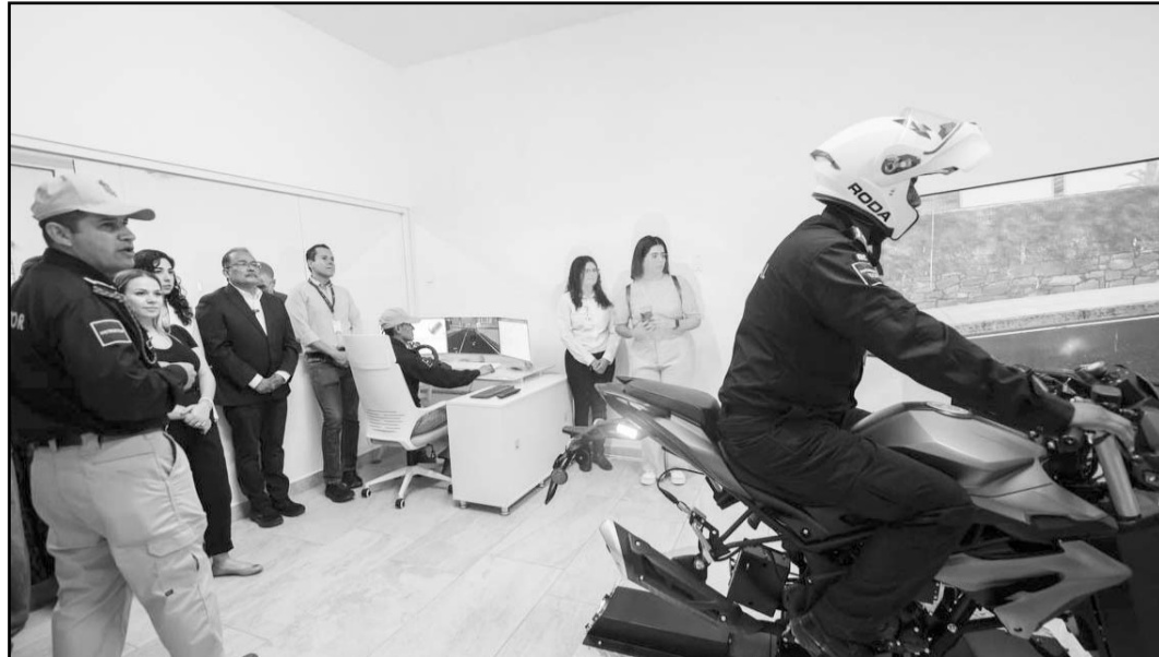
El objetivo es que los elementos tengan una mejor capacitación.

"Este Centro Virtual muestra que la transformación cree en la tecnología, la modernidad y la buena administración que está comprometida con los policías y con la seguridad para que haya más cre-