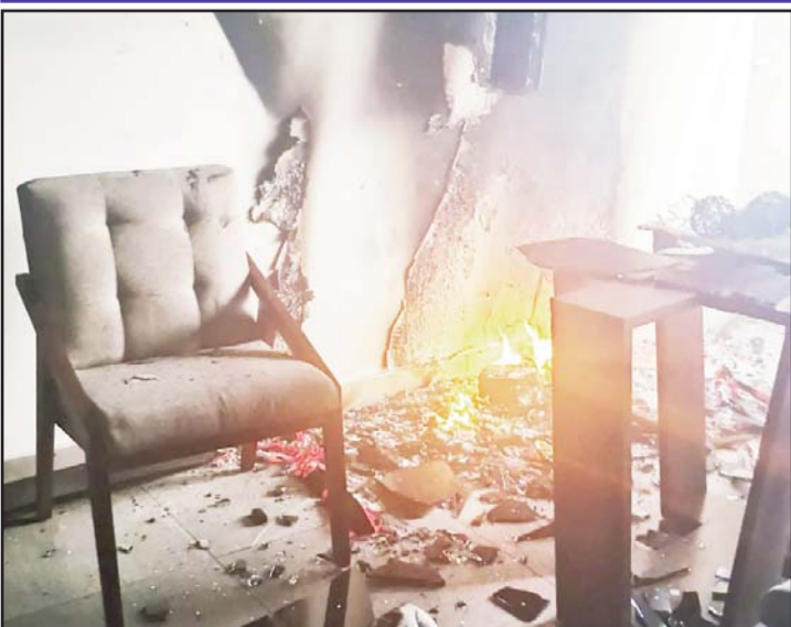
Fue un cortocircuito en un aire acondicionado.