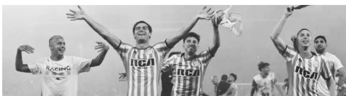
Vencieron 2-1 en casa al Corinthians