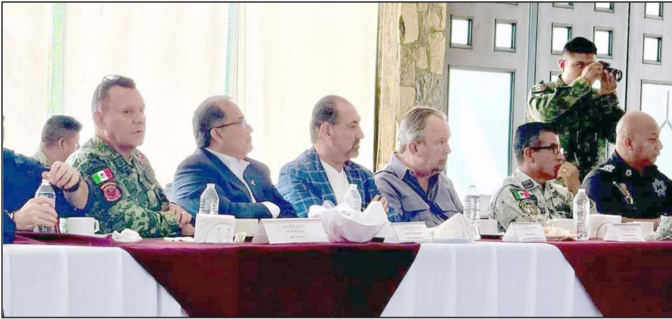
Los presidentes municipales tienen la confianza de que pronto se tendrán mejores resultados.