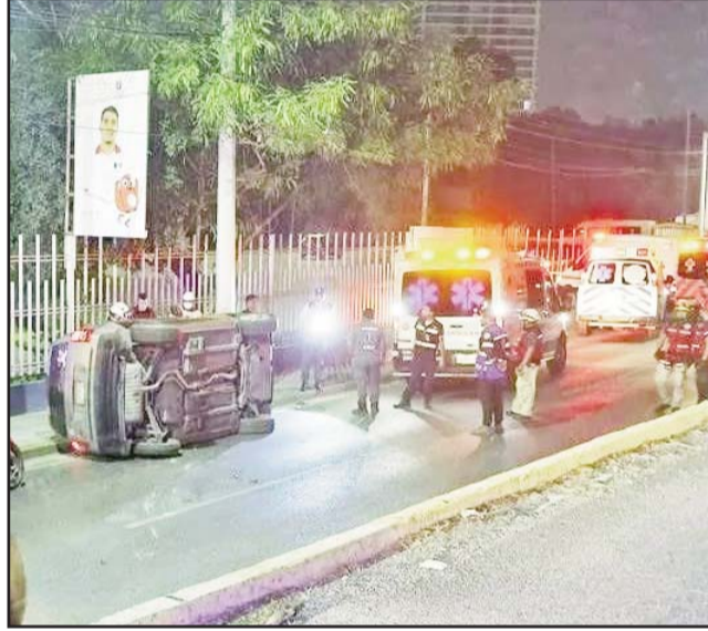
Ocurrió en la Avenida Manuel L. Barragán.

Al momento de los hechos vestía blusa blanca