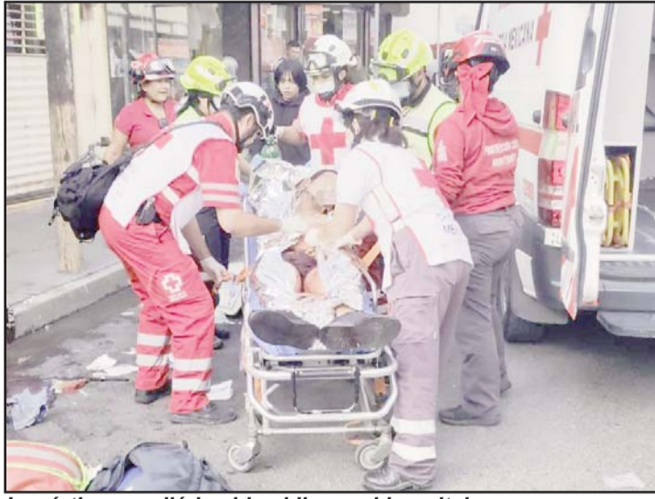
La víctima perdió la vida al llegar al hospital.

Una fuente allegada a las investigaciones señaló que a las