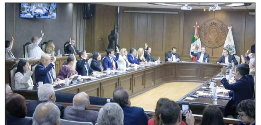
Por mayoría el Cabildo regiomontano aprobó sea un 29 por ciento.