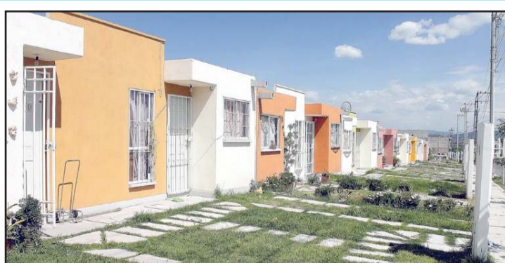
Hay un déficit de 8.2 millones de viviendas, según Inegi.

Asimismo, en la Ley del Instituto del Fondo Nacional de la Vivienda para los Trabajadores se establecerán los términos y condiciones para que los trabajadores puedan acceder a las viviendas en arrendamiento social, el cual no podrá exceder de 30% de su sala-