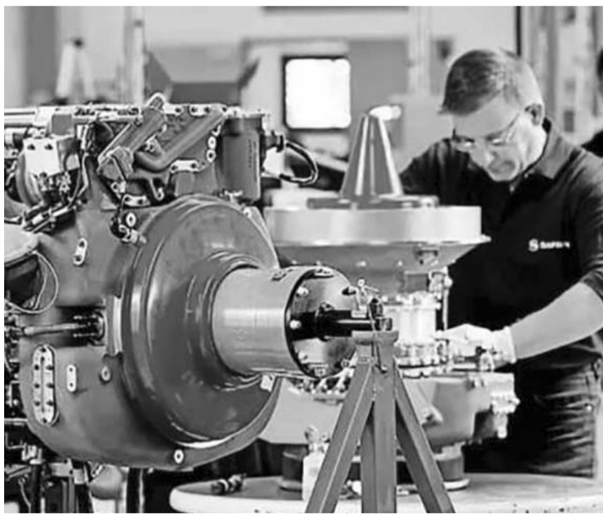
En el primer semestre del 2024 los países que más captaron Inversión Extranjera Directa (IED) en el mundo fueron Estados Unidos, Brasil y México

Mientras que China registra una caída en la captación de inversiones, lo que se da en un contexto de fuertes tensiones geopolíticas y una incertidum-