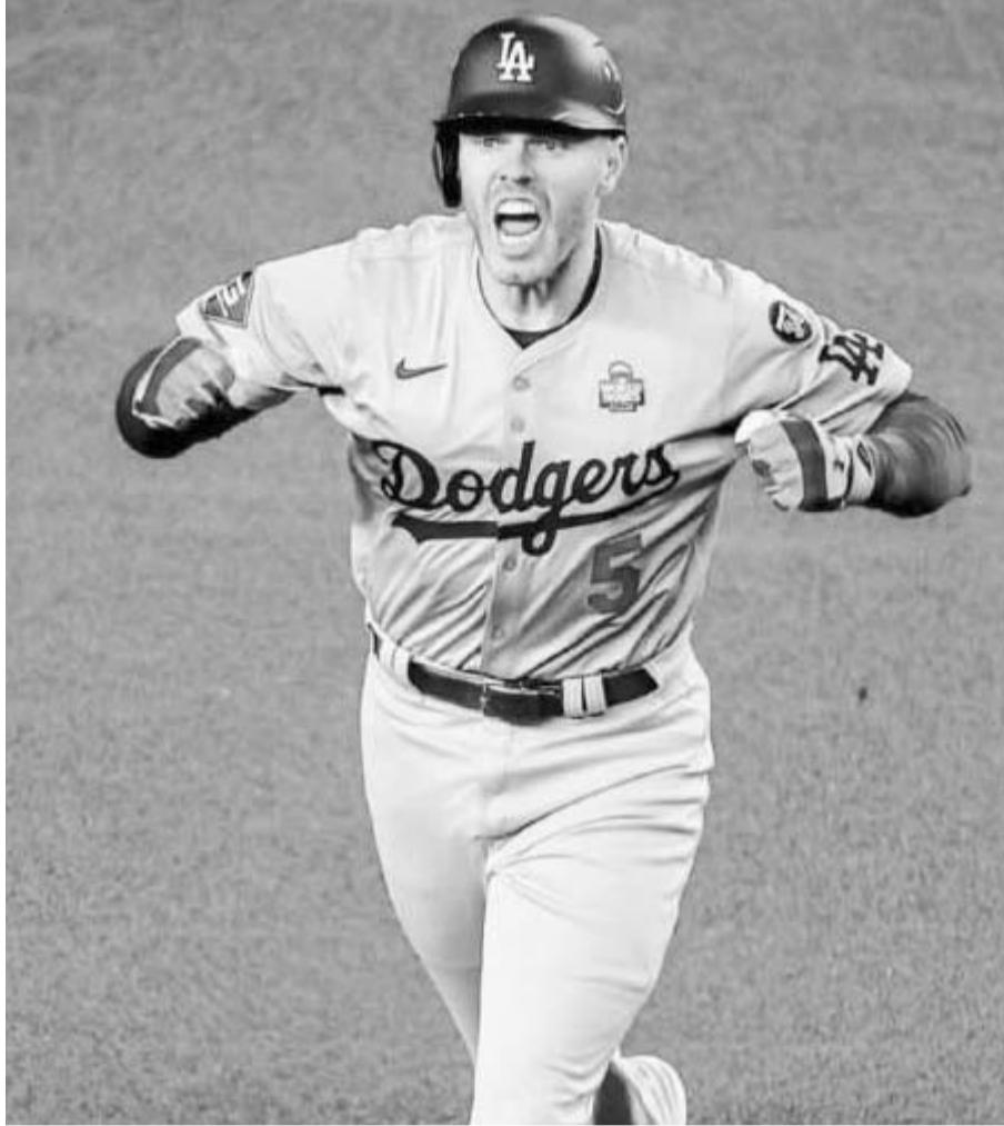
Freddie Freeman, el JMV de la Serie Mundial de las Grandes Ligas.

Cabe señalar que los Dodgers lograron su octavo título de Serie Mundial tras vencer en cinco juegos a los Yanquis de Nueva York, quienes por cierto continúan con su sequía de no ganar un título de las Mayores desde que se coronaron en el Clásico de Otoño del 2009, venciendo ahí a los Filis de Filadelfia