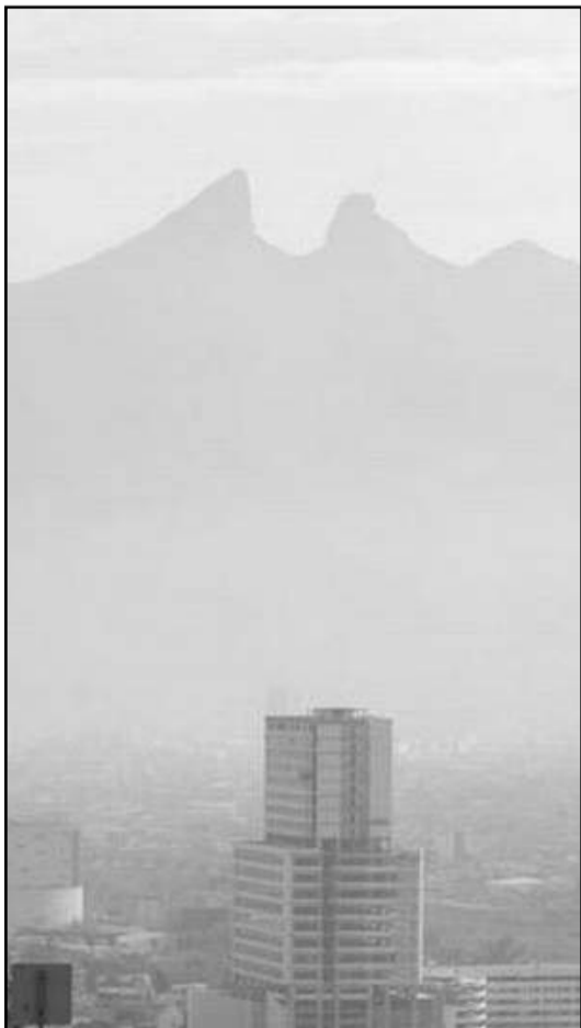
La recomendación es sobre todo a los que padecen enfermedades respiratorias.

Se espera que por la noche de este jueves mejoren las condiciones. Se recomienda estar al pendiente de la información que publique la Secretaría.(IGB)