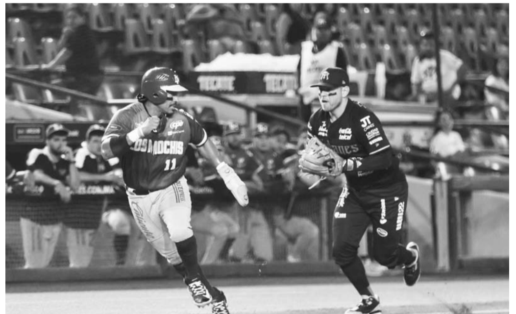
Los regios volvieron a su realidad.

La escuadra regia tendrá este fin de semana una serie de tres juegos como visitantes contra los Naranjeros de Hermosillo.