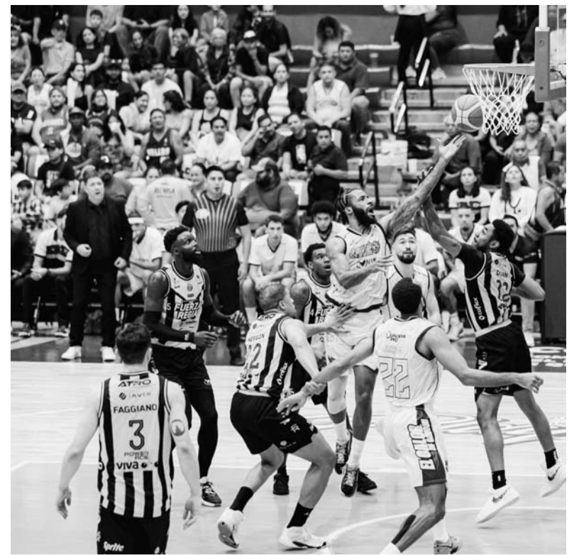
Fuerza Regia ganó anoche 70-56 al Calor de Cancún

"Si avanzamos directo y evitamos play-in, vamos a jugar amistosos para no perder ritmo, pero en el fútbol hay imponderables y cosas que a veces no esperabas como el jalón de Henry Martín a Víctor Guzmán en el 2-1 ante América", concluyó. (AC)