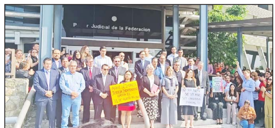
Se sumaron a una ola de protestas en contra de gobierno federal y sus imposiciones.

"Es una renuncia forzada", dijo, "porque la reforma ha alterado de manera significativa la carrera judicial".