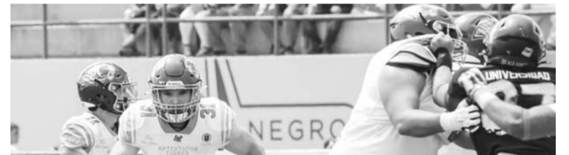
La UANL quiere mantenerse en los primeros sitios.

Hasta el momento, Bravos suma 10 derrotas, un empate y tres victorias; mientras que los Gallos Blancos tienen 9 partidos perdidos, tres empates y solo dos juegos ganados, resultados que los mantienen en los puestos 17 y 18 de la tabla general, respectivamente.