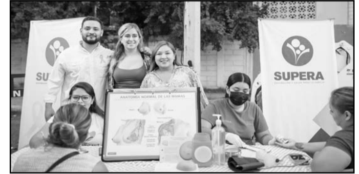
En esta ocasión fue a la colonia Pedregal de Santo Domingo