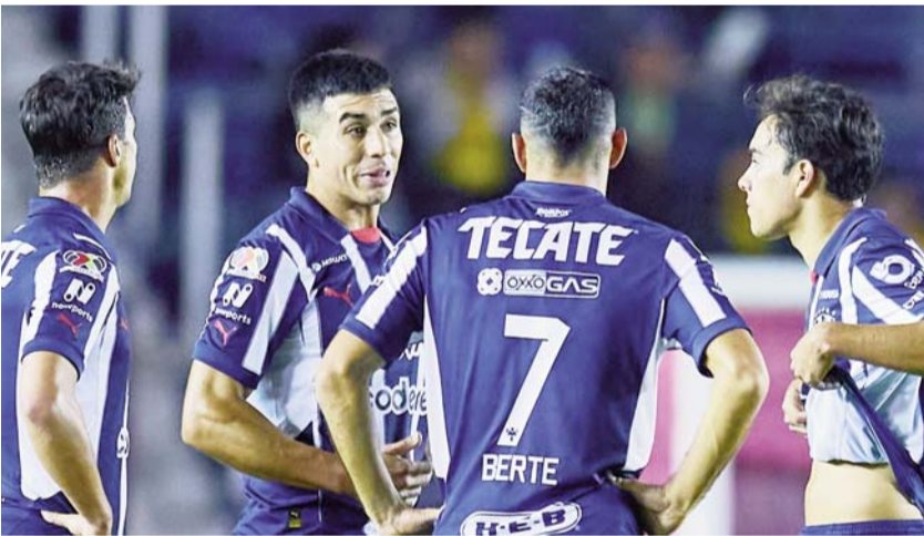
Con menos de esa cifra, Monterrey sólo ha ido al play-in.

Todos los galardonados recibirán un diploma, una medalla y un estímulo económico de 796 mil pesos de manos de la mandataria del país, el lugar y la sede lo determinará la agenda de Sheinbaum Pardo en la categoría de trayectoria.