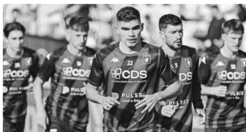
Vázquez y su equipo siguen en problemas en cuanto al descenso.

Por esto mismo es que los partidos de hoy para ambos equipos locales serán importantes y habrá que esperar a ver si se hacen de la victoria, esperando eso para que sean el uno y dos en la tabla de posiciones de este cierre de campaña, de cara a la postemporada. (AC)