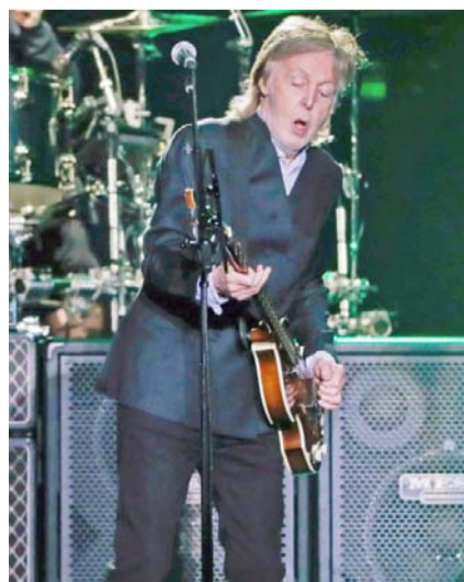
El ex beatle encabeza el Corona Capital.

escenario GNP la banda regresa para cumplirle a sus fanáticos con un único concierto.