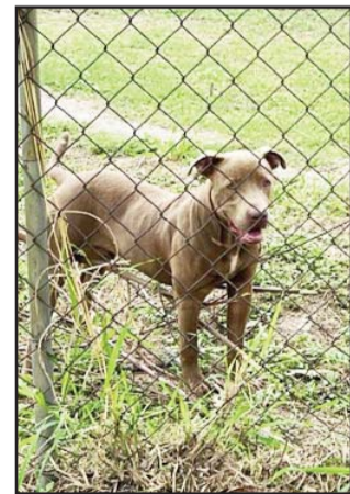
El can fue atrapado.

Los rescatistas procedieron a la captura del can y se puso en observación.