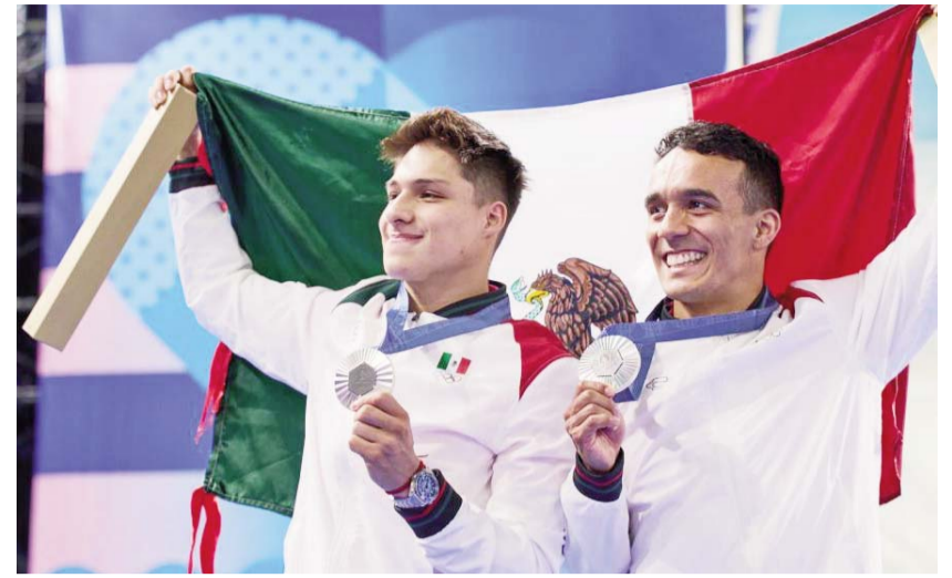
Fueron los elegidos para recibir esta distinción por obtener la medalla de plata en la justa veraniega.