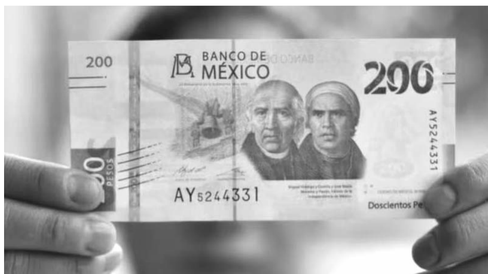
En octubre, el tipo de cambio estuvo marcado por una gran volatilidad, registrando un mínimo de 19.12 y un máximo de 20.23 unidades.

Por el lado interno, el tipo de cambio se vio presionado por la mayor aversión al riesgo sobre México. El proceso para la aprobación y puesta en marcha de la reforma judicial se agilizó en octubre, con miras a que en junio de 2025 se elija por voto popular a la mitad de jueces, además de que se aprobó la reforma de supremacía consti-