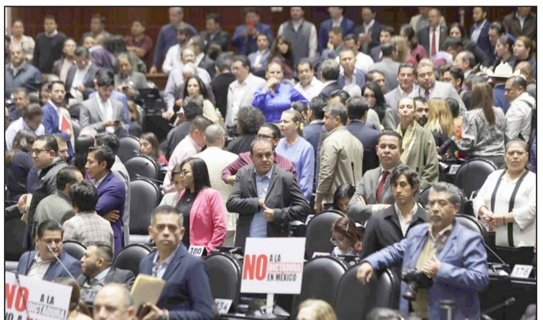
Más tarde, la reforma apareció publicada en el Diario Oficial de la Federación.

"Esas instituciones quedan incólumes, intocadas, lo que hicimos y ahora concluimos con esta declaratoria, es refrendar que el poder reformador de la