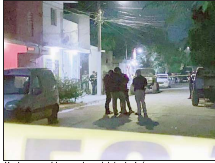
Hechos ocurridos en el municipio de Juárez.

Elementos de la Agencia Estatal de Investigaciones inda-