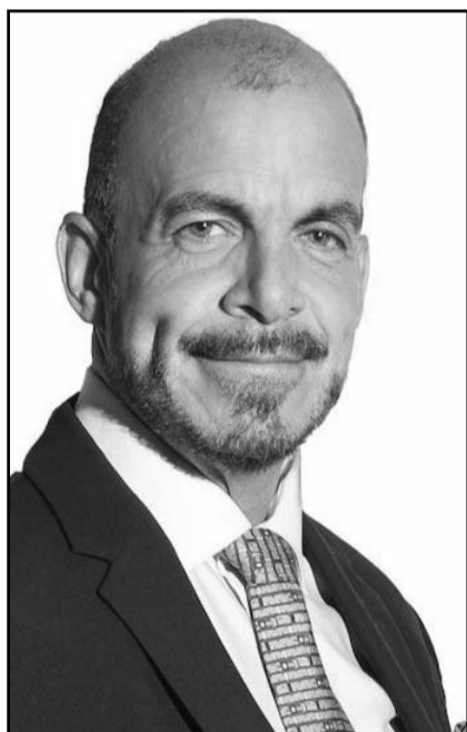
Padilla cuenta con más de 25 años de experiencia en la promoción de negocios, comercio exterior e inversión

Secretaría de Economía en el estado de Morelos.