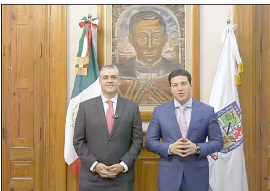
El gobernador Samuel García hizo el anuncio de la salida del funcionario estatal.