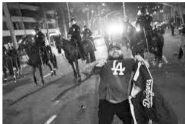
Esto ocurrió durante la madrugada de ayer.

Esto ocurrió durante la madrugada de ayer, momento en el que en el centro de Los Ángeles algunos fanáticos de los Dodgers incendiaron un autobús de policía mientras festejaban el título de su equipo en la Serie Mundial, aunque parece que no hubo heridos.