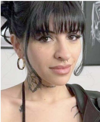
Difieren respecto a una eventual infidelidad por parte del cantante hacia la argentina.

¿Cuándo y dónde?: Estadio GNP, el 30 de noviembre