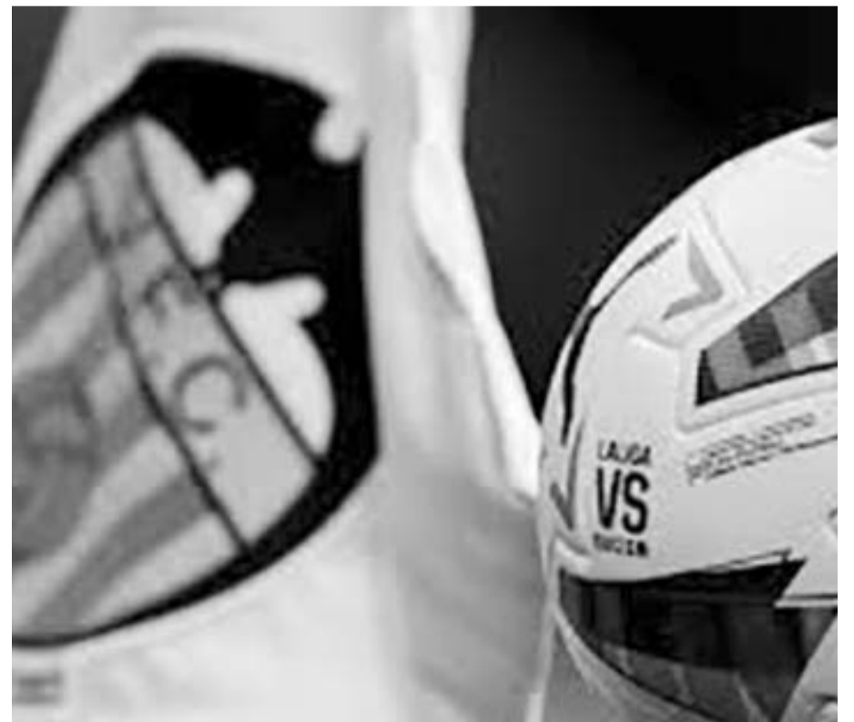
El encuentro se paralizó tras el paso del huracán en Valencia.

Cabe señalar que las inundaciones del fenómeno meteorológico 'Dana' cobró la vida de al menos 64 personas en la ciudad de Valencia, aspecto por el cual se espera que haya un minuto de silencio en los restantes partidos del fin de semana en el fútbol español, lo que sería como una manera de solidaridad hacia las familias afectadas por esa situación.