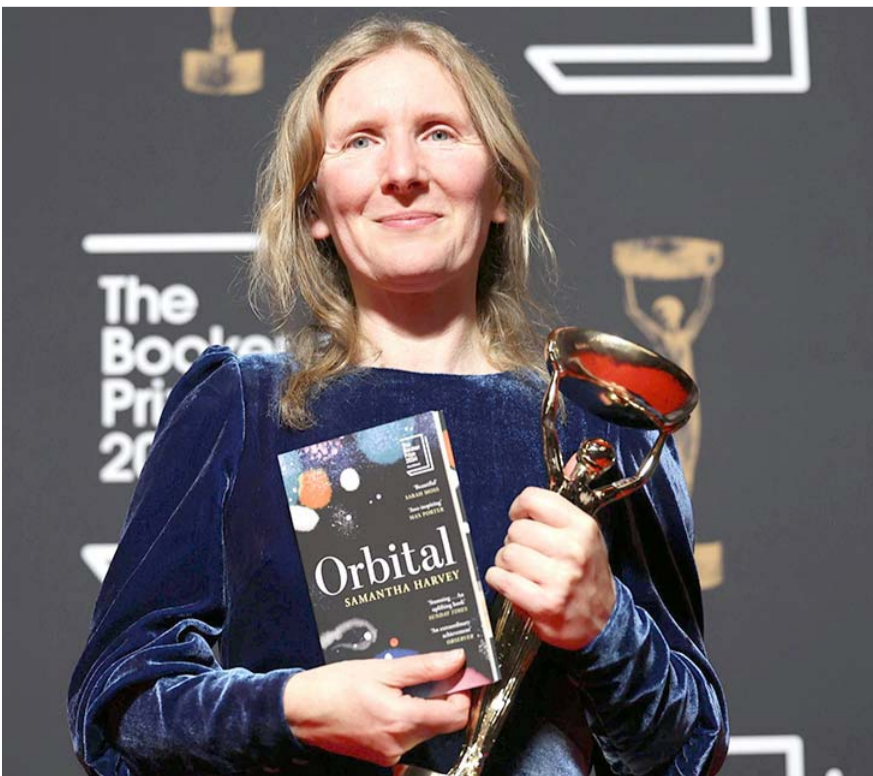
Harvey es la primera mujer ganadora del Booker desde 2019

Harvey es la primera mujer ganadora del Booker desde 2019, aunque una de las cinco mujeres en la lista de finalistas de este año, el mayor número en los 55 años de historia del premio. De Waal dijo que cuestiones como el género o la nacionalidad de los autores eran "ruido de fondo" que no influía en los jueces.