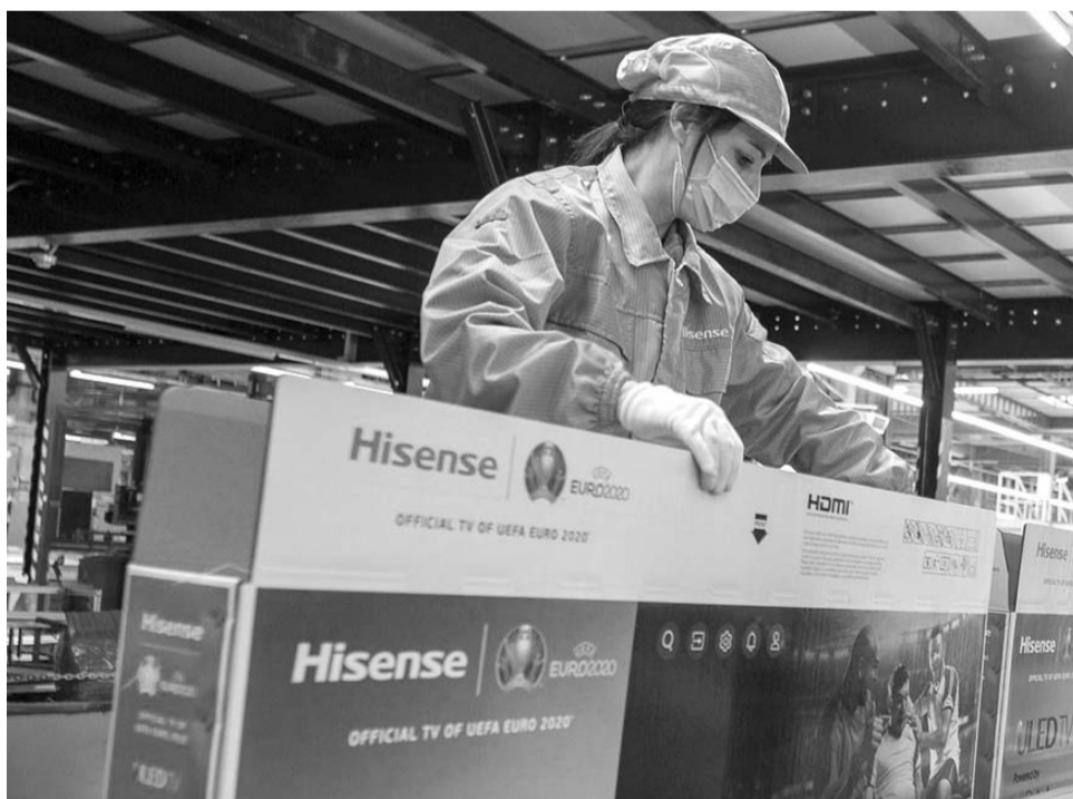
En los primeros 3 años y 2 trimestres de Jose Biden Nuevo León recibió 5,568 millones de dólares de inversión extranjera directa, Mientras que en los primeros 3 años y 2 trimestre de Donald Trump, Nuevo León captó 4 mil 904 millones de dólares.

"México debe darse cuenta que hay países asiáticos como Vietnam, que son nue-