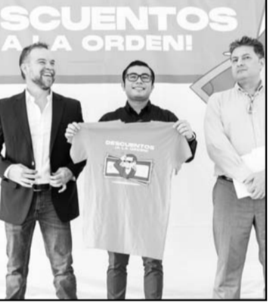
Habrà rebajas hasta del 70%

Tomamos esa decisión porque a pesar de que nos dejaron una Administración con muchas necesidades, con muchas precariedades, no vamos a lastimar el bolsillo de las y los juarenses