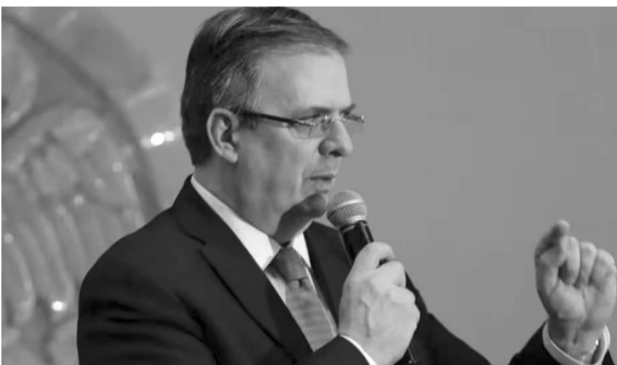
El secretario de Economía, Marcelo Ebrard

No obstante, en entrevista con medios de comunicación negó que el gobierno mexicano haya perdido el panel solicitado por Estados Unidos en junio de 2023 para impugnar las medidas establecidas en el decreto emitido por las autoridades mexicanas el 13 de febrero de 2023, en particular, por la