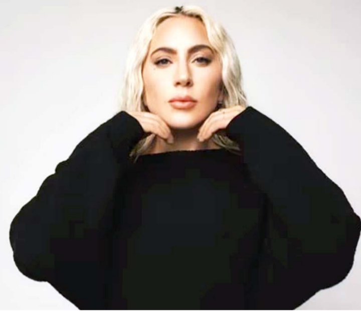
La intérprete de "Bad Romance", será parte de la segunda temporada de este proyecto.