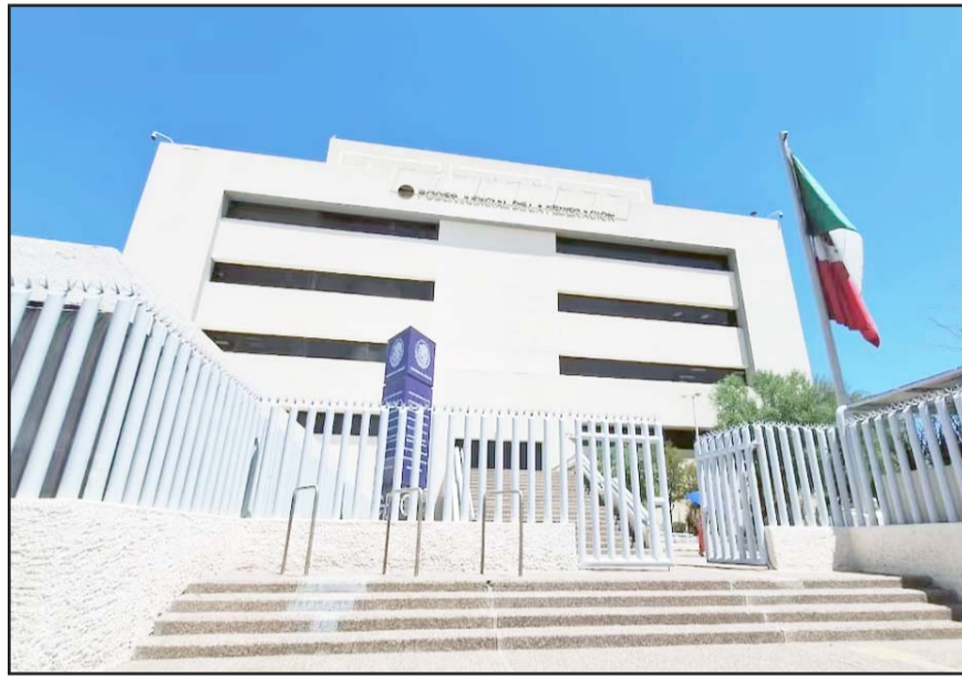
121 jueces y magistrados se retirarán en 2024, mientras que el año pasado sólo fueron 30.

Otro motivo es que decenas de impartidores de justicia, tras conceder suspensiones contra la reforma judicial, son