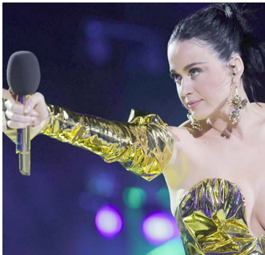
Katy Perry regresará a México con su nueva gira mundial, "The Life Tour", para presentar su sexto álbum de estudio, titulado "143"

Hasta el momento, no se han revelado los precios de las entradas, aunque se espera que se anuncien próximamente.