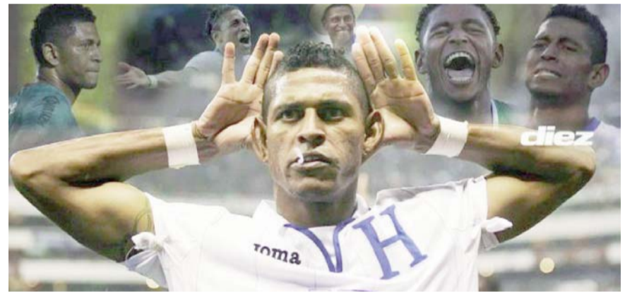
El ex jugador dijo que el árbitro le ayudó a México en la Liga de Naciones.

Ambos elementos abandonaron la práctica en El Barrial, pues en el caso de Cortizo, sufrió una molestia en el pie derecho, mientras que Rojas se quejó de un golpe en la rodilla derecha. Ambos serán sometidos a exámenes médicos para conocer la gravedad de sus casos.