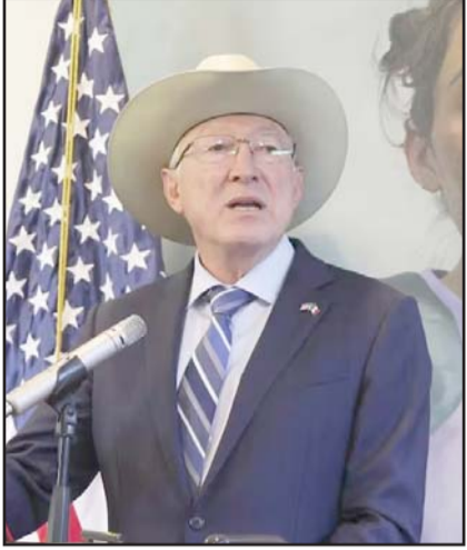
El Embajador de EU advirtió que los 'abrazos, no balazos' falló ante el crimen.