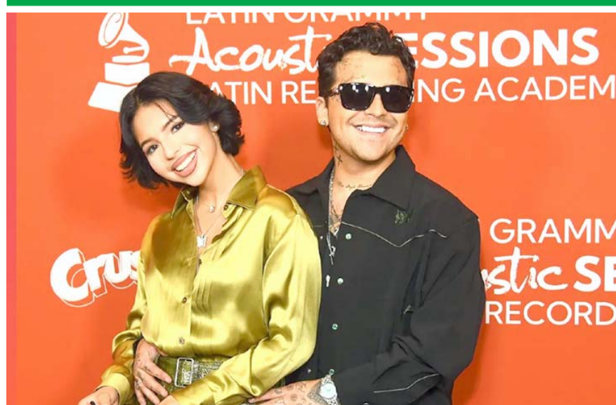
El certificado señala que la pareja se casó por bienes separados.

En 1967 fue el primer compositor negro nominado en la categoría de canción original de los Oscar por la película "Banning".