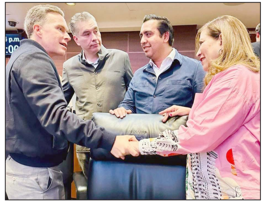
El alcalde estuvo ayer en el Senado con sus nuevos compañeros de partido

Es de decir que el martes previo la dirigente nacional de Morena, Luis María Alcalde formalizó la incorporación de Jesús Nava Rivera a Morena, con el compromiso de trabajar en conjunto en favor de Santa Catarina y Nuevo León, dentro del proyecto nacional de la 4T.