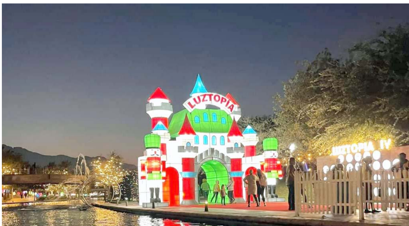
El Live Gardens San Pedro será el nuevo testigo de la "Navidad Mexicana" de Luztopía, que llegará de hoy 14 de noviembre del 2024 al 6 de enero de 2025.