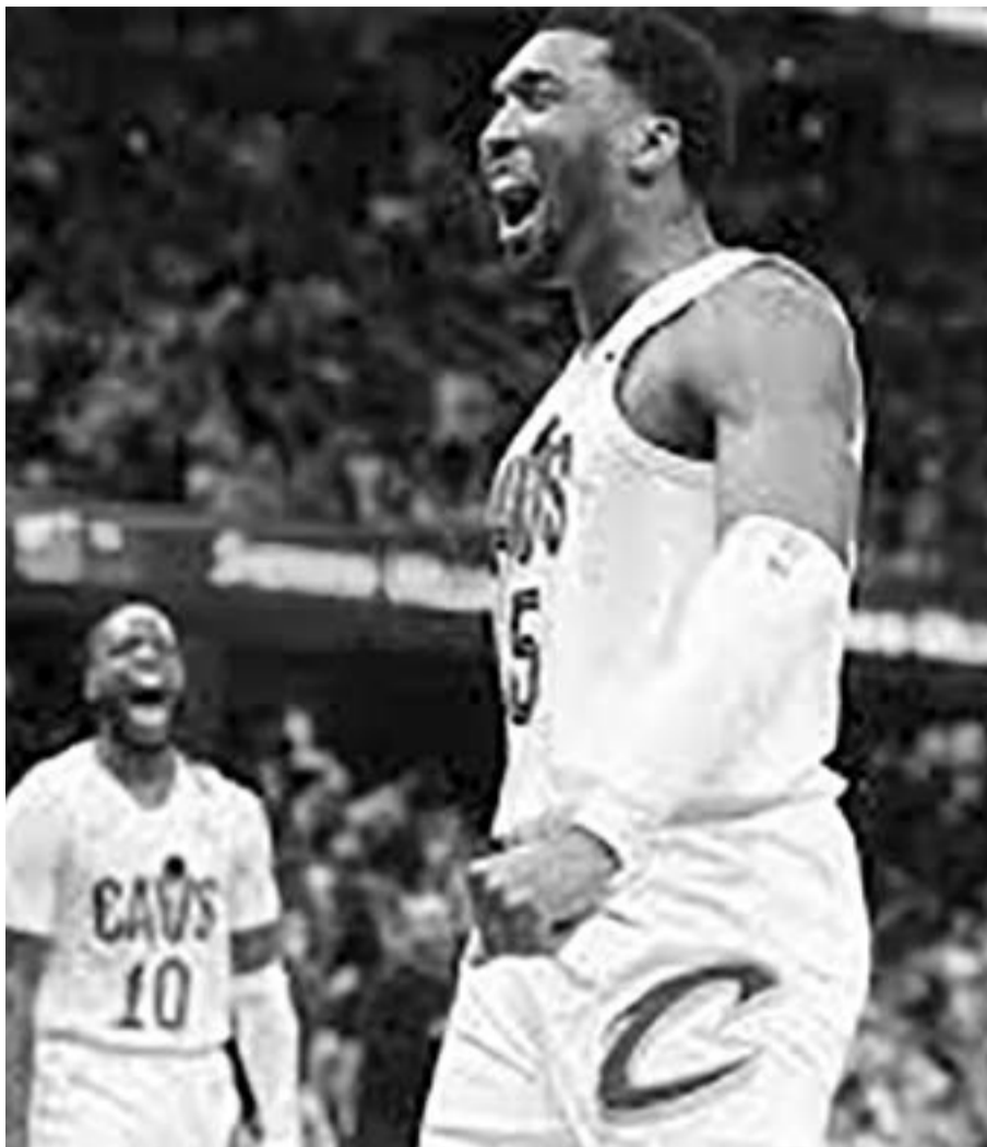
Cavaliers venció anoche a Filadelfia para mantener su invicto.

Kelly Oubre Jr. consiguió 20 puntos mientras que Caleb Martin agregó 18 por los Sixers.