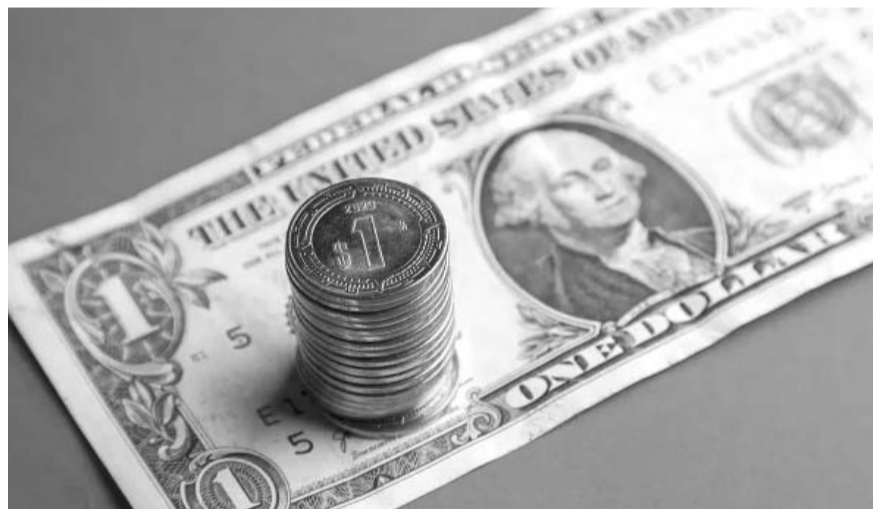
La divisa mexicana en los mercados internacionales concluyó alrededor de 20.54 pesos por dólar.

En México, el Índice de Precios y Cotizaciones de la BMV cerró la sesión con una pérdida de 0.68%, ligando cuatro sesiones a la baja. Al interior, resaltaron las caídas de las emisoras como Cemex, con una contracción de -3.0%; Grupo México, -1.6%, Banorte, -1.3%; Femsas -0.9%; y Arca Continental, -2.2%.