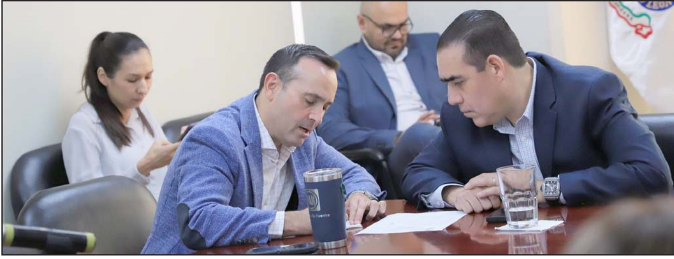
Le solicitaron al Estado que los convoque a la reunión que les prometieron para analizar el presupuesto.