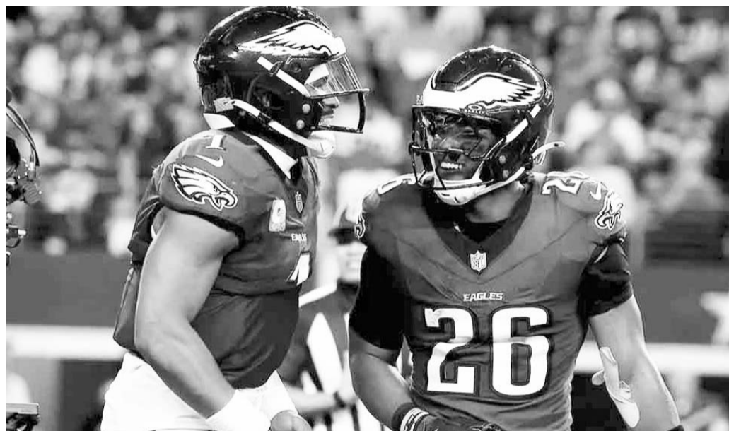
Águilas de Filadelfia se enfrentan a los Comandantes de Washington.

Se trata de un partido que definirá mucho en una división que ya es cosa de dos, porque los Vaqueros de Dallas y los Gigantes de Nueva York han empezado a