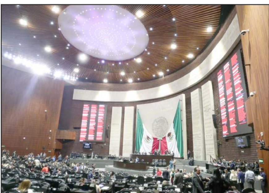
La diputada Zavala acusó a Morena de querer utilizar la iniciativa para 'perseguir a la oposición y a los periodistas'.