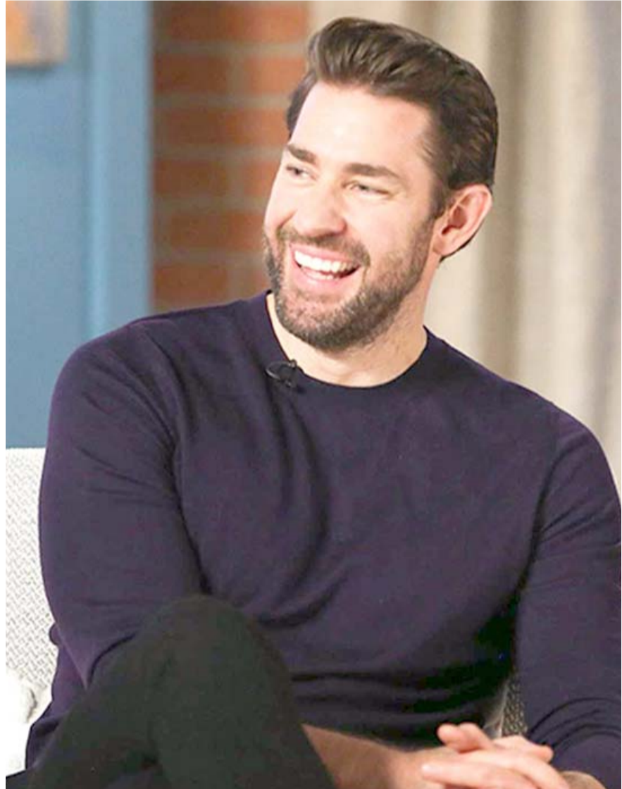
La publicación anunció la elección del actor, escritor y director en el programa de televisión "The Late Show with Stephen Colbert".

Ahora en su 40to año, el primer "Hombre vivo más sexy" elegido por la revista fue Mel Gibson. Entre los ganadores figuran Brad Pitt, George Clooney, John F. Kennedy Jr., David Beckham, Michael B. Jordan, John Legend, Dwayne Johnson, Paul Rudd y Pierce Brosnan.