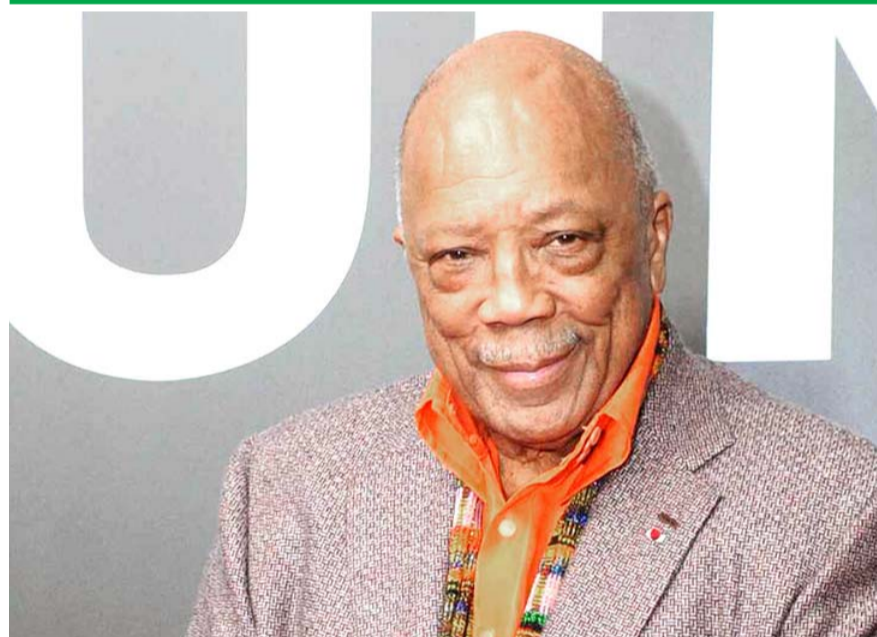
El último adiós del genio musical se llevó a cabo en un funeral privado de Los Angeles