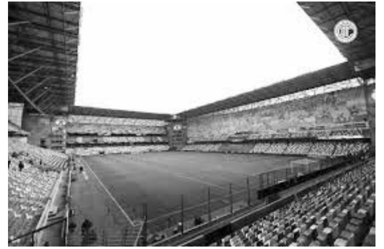
La bombonera estará que arde el martes.