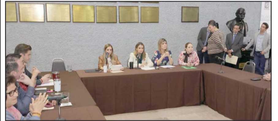
En medio de acusaciones e inconformidades se inició el análisis.

Aunque dijeron estar a favor de las sanciones, al final de la mesa de trabajo, los diputados de Morena votaron en abstención.