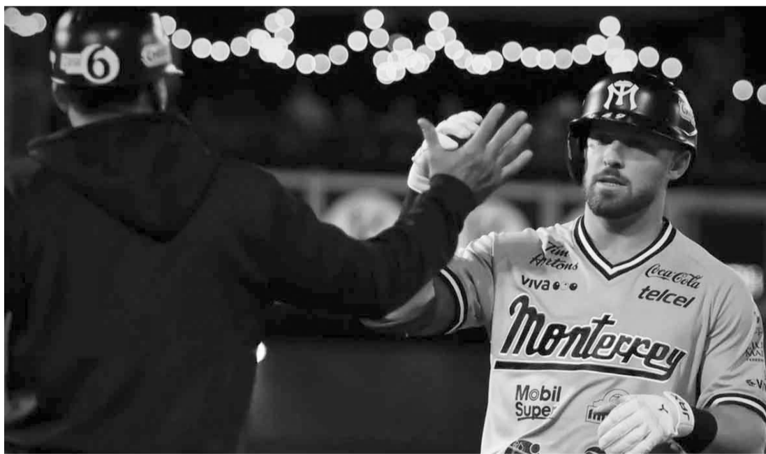
Los Sultanes sucumbieron ayer en Hermosillo.

Tres carreras en la parte baja de la sexta entrada y dos más en la séptima definieron el rumbo del encuentro, y los Sultanes de Monterrey volvieron a su realidad al caer 7-3 ante los Naranjeros de Hermosillo anoche, en el Fernando Valenzuela.