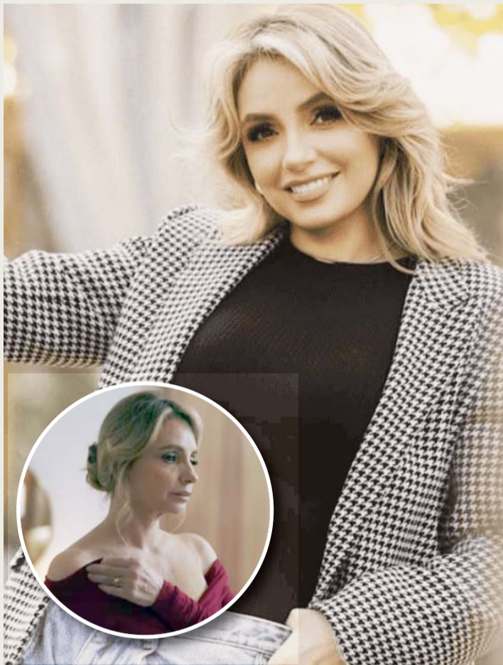
Angélica Rivera será protagonista de una nueva serie de Vix.

Junto a su esposa, Verónica Velasco, y otros socios, fundó