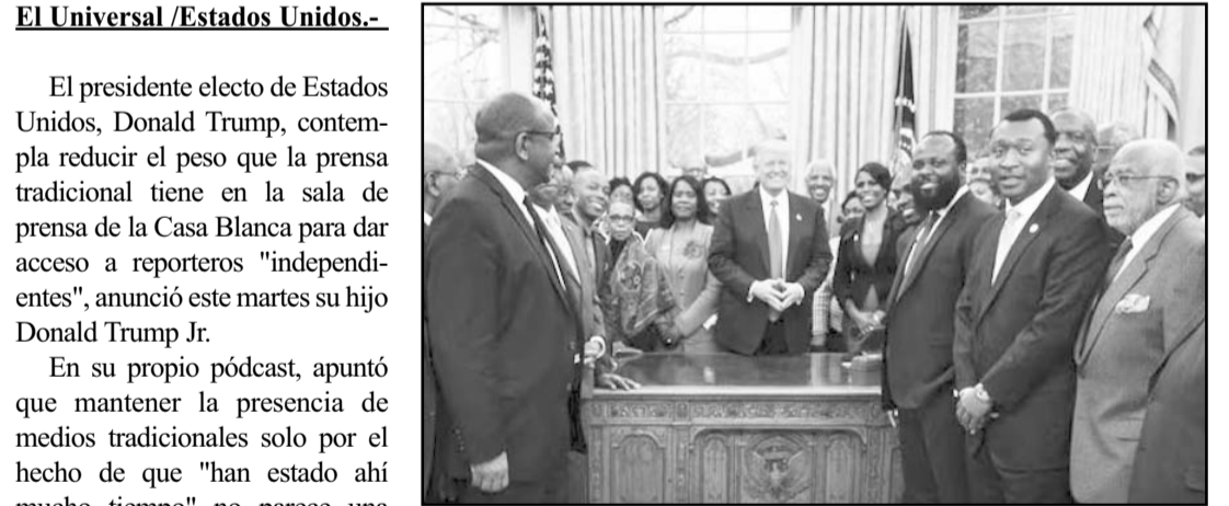
Trump contempla sustituir periodistas por blogueros afines en la Casa Blanca; asegura son personas "con más audiencia".

El magnate neoyorquino, según ahondó su hijo, está planteándose esa posibilidad por cómo se han comportado los