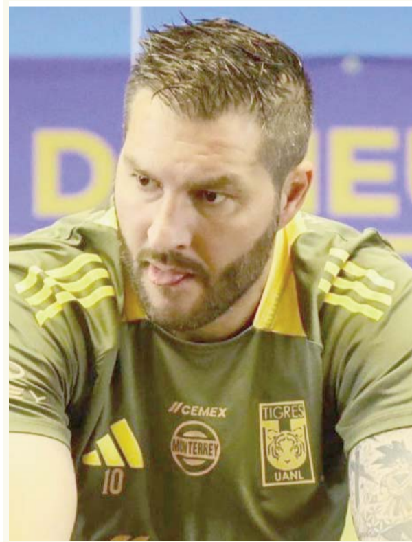
El francés sigue siendo una incógnita.