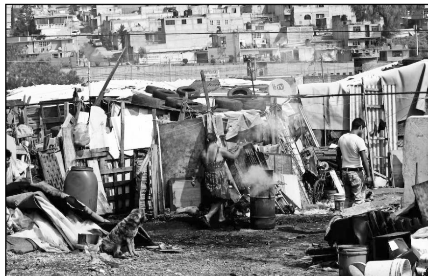
Pidieron reconsiderar la extinción del organismo.

Por otro lado, se llamó a que se consideren los plazos, presupuestos y mecanismos necesarios para llevar a cabo el cumplimiento de las actividades programadas para el próximo año: como la presentación de las estimaciones.