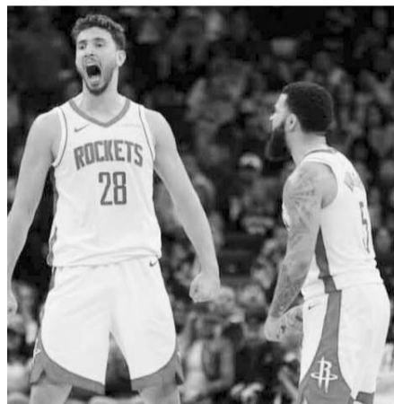
Houston venció anoche a Minnesota.

Houston lanzó 15 de 37 desde el territorio de tres puntos, incluyendo un 10 de 18 en la primera mitad para construir su ventaja. Houston juega en Filadelfia el miércoles por la noche, mientras que los Wolves se quedan en casa contra Sacramento.