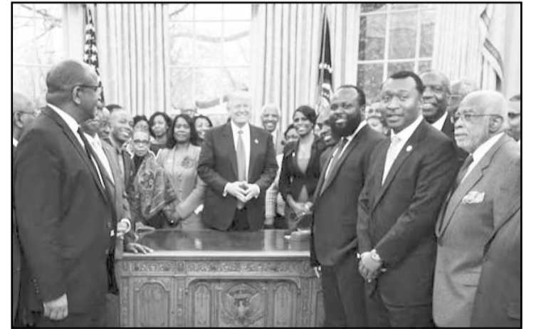
Trump contempla sustituir periodistas por blogueros afines en la Casa Blanca; asegura son personas "con más audiencia".

La Casa Blanca, no obstante, no decide por lo general quién ocupa un asiento en la sala de