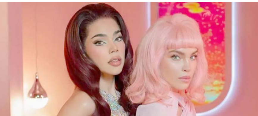
Kenia Os y Belinda colaboran juntas en el video "Jackpot".

Sin embargo, esta conexión no ha sido confirmada y sigue siendo solo un rumor. ¿Será que el intérprete de "LADY GAGA" finalmente encontró a la indicada?