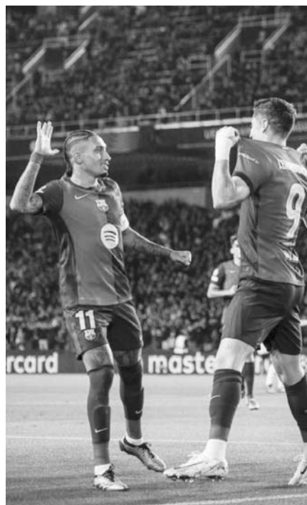
Barcelona llegó a 12 puntos.

2024. En Necaxa, equipo de la ciudad central de Aguascalientes, Larcamón tratará de emular lo que hizo en su paso por Puebla, conjunto con el que con uno de los presupuestos más bajos de la liga clasificó en sus cuatro torneos a la fase final.