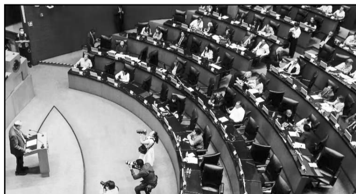
Se llevó a cabo la Sesión Ordinaria en el Senado de la República.

Además, se robustecen las funciones de la Secretaría de