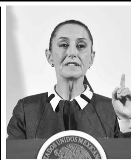
Apoyan las decisiones de la presidenta.