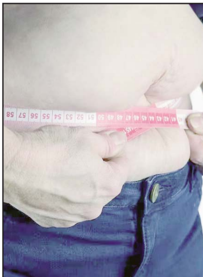
El promedio nacional de obesidad en adultos es de 37.1%, con un 41.0% en mujeres.

Detalló que el programa arrancará el próximo 1 de enero de 2025 con al menos 500 mil participantes que presenten factores de riesgo como la hipertensión arterial, colesterol, obesidad entre otras que serán vigiladas durante todo el sexenio.