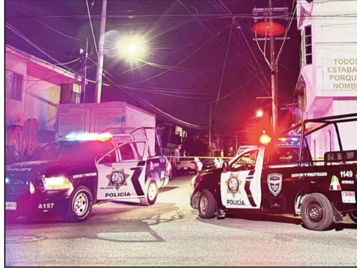
Los hechos se registraron en el municipio de San Nicolás.

avisó a su familiar que iría a comprar unos refrescos en una tienda cercana.