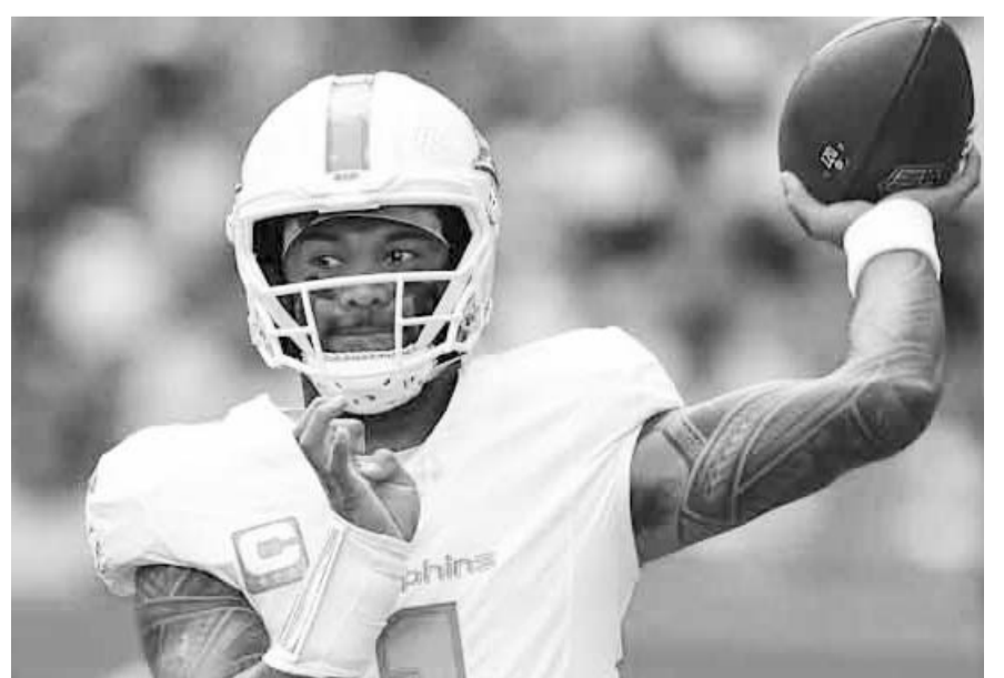
Tua Tagovailoa, el referente de los Delfines.

A pesar de lo bien que jugó el domingo, Tagovailoa estaba listo para centrar la atención en un difícil partido en el frío de visita a los Green Bay Packers el jueves próximo.