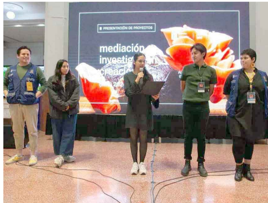
El Laboratorio Cultural Ciudadano Nuevo León realizó la presentación de proyectos de Mediación-Investigación-Creación (MIC).

El proyecto "Microteca" incursiona en el cultivo de setas y la germinación de semillas en dispositivos de cerámica diseñados colaborativamente a partir de diversas técnicas y materiales