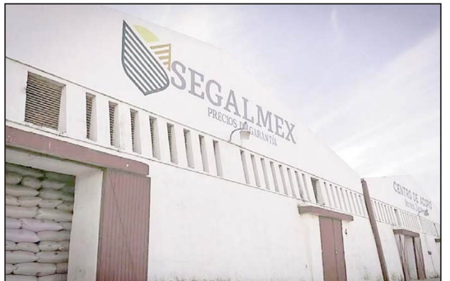
El imputado es señalado como responsable de un desvío de 145 millones de pesos relacionado con una compra simulada de azúcar para Segalmex.