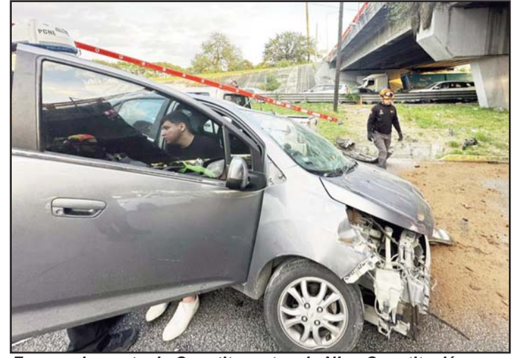
Fue en el puente de Constituyentes de NL a Constitución.

La persona arrestada además llevaba 10 dosis de "cristal" y una báscula gramera.