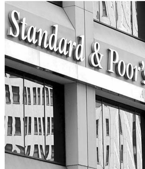
La firma redujo a 1.2% sus expectativas de crecimiento de México

las remesas. "En tercer lugar, las reformas mexicanas aprobadas recientemente (como los cambios al sistema judicial), que en algunos casos todavía requieren legislación secundaria, también podrían retrasar las decisiones de inversión hasta que haya más claridad sobre las implicaciones de esos proyectos de ley", resaltó. Para 2026, Standard and Poor's también redujo sus perspectivas de crecimiento a 1.9% desde el 2.2% previo que tenía en septiembre pasado.