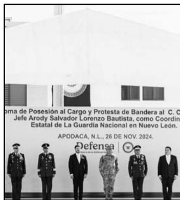
Ayer se hizo oficial.