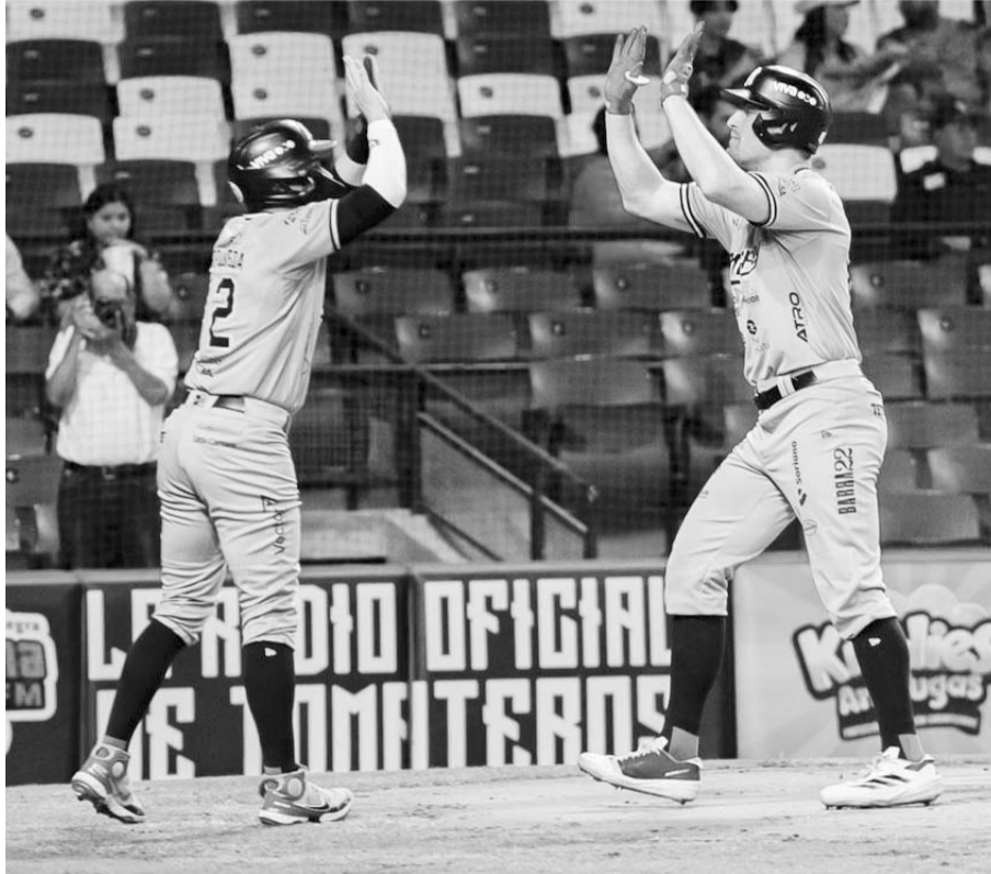
Los Sultanes de Monterrey abrieron serie ganando contra el líder.