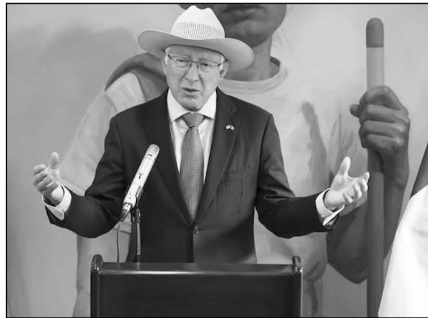
Ken Salazar dijo que al final de su gestión como embajador de México en Estados Unidos visitará constantemente el sur del país.

política de seguridad de México que externó hace dos semanas, el embajador de Estados Unidos en México, Ken Salazar, reconoció hoy que el consumo de drogas y el tráfico de armas provenientes de su país forman "parte del problema", por lo que los gobiernos de ambos lados de la frontera deben atenderlo "como socios".