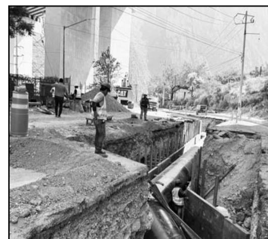
Para eso ampliarán las redes.

“Decirles que estamos listos y preparados para resolver los problemas que aún quedan en nuestra ciudad y preparar al Estado para recibir las ventajas del nearshoring”, apuntó.(JMD)