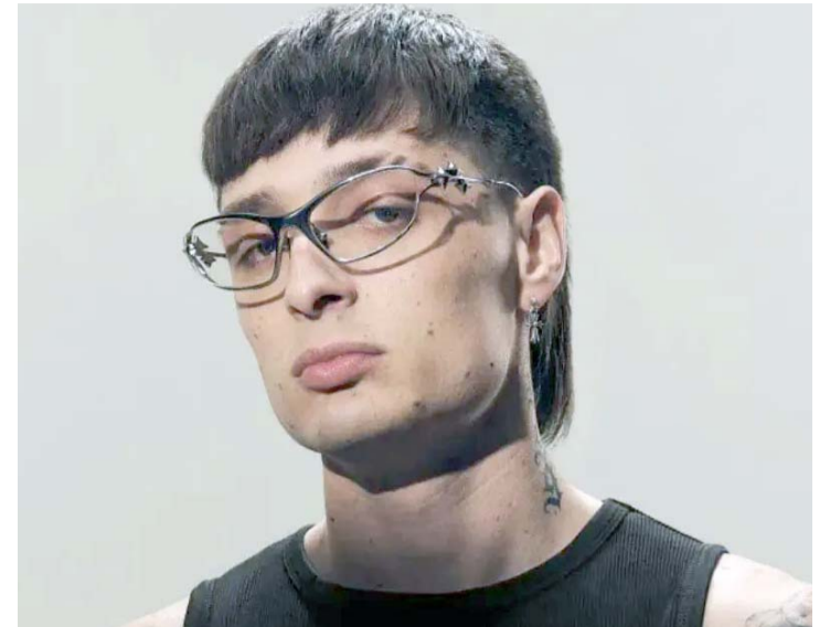
Hassan Emilio Kabal de Leija, conocido como Peso Pluma.

En aquella ocasión las críticas aumentaron debido a que, en paralelo, el gobierno de AMLO había eliminado los fideicomisos destinados a áreas clave como ciencia, educación y cultura, lo que aumentó la percepción de favoritismo hacia Ibarra.