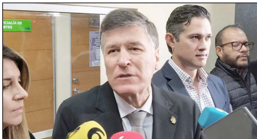
Se prohibiría en eventos públicos o privados realizados en lugares públicos

“A la fecha tenemos ya un avance del orden de 500 mil, es decir a mitad de la Administración vamos a la mitad del programa de cambio de medidores y esto efectivamente tiene una repercusión muy favorable en nuestras cuentas”, indicó.