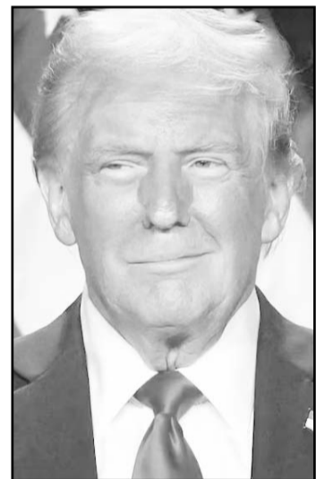
Empresas rechazan aranceles anunciados por Trump.

Estas empresas se verían afectadas por los aranceles, dado que muchas piezas de autos pasan varias veces por la frontera de los tres países antes de que se termine la instalación.