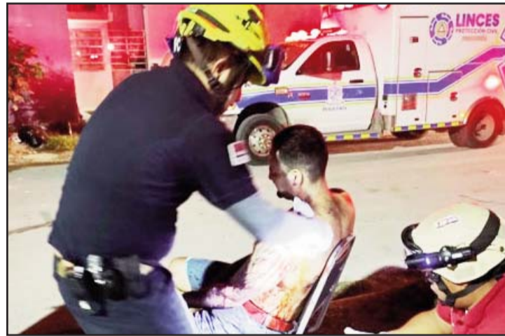
El incidente ocurrió en el municipio de Pesquería.

frente a dos pandilleros, quienes en forma repentina lo amagaron con un arma blanca para exigirle su celular y dinero en efectivo.