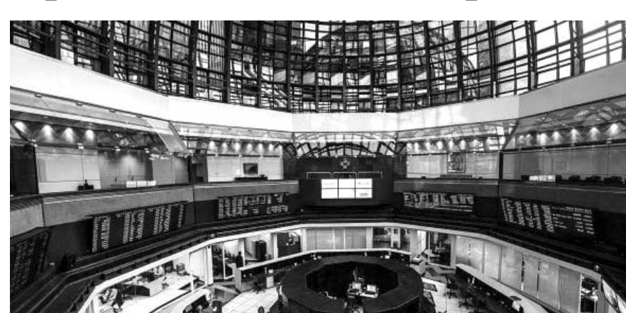
El mercado accionario mexicano fue impactado por las declaraciones de Trump y espera que la sensibilidad bursátil sea mayor.