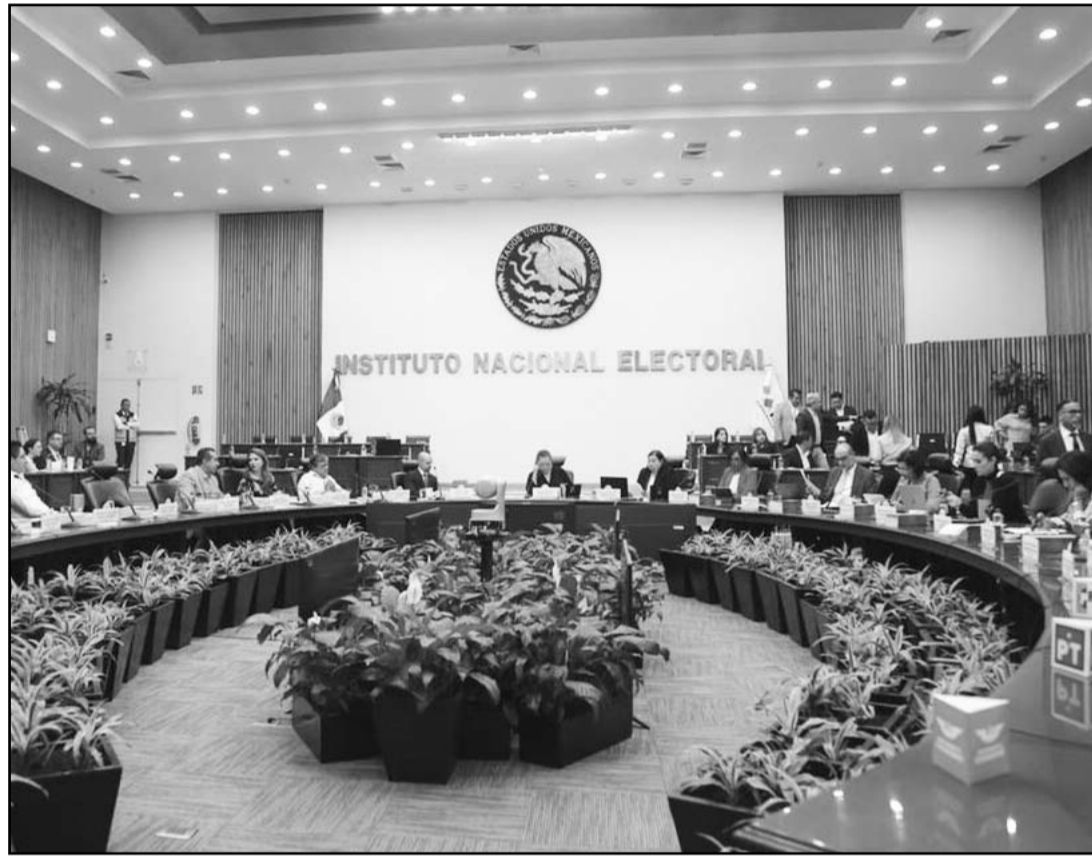
El Instituto Nacional Electoral instaló el Consejo General para organizar el PEE en que serán electos la primera tanda de jueces, magistrados y ministros en la historia de México.

También enfatizó que con esta posible prórroga, diversas titularidades de algunos órganos jurisdiccionales quedarían sin alguien que las dirija, ya que se prevén varias vacantes en dichos órganos, las cuales están programadas para