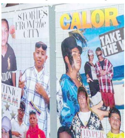
"Cholombianos" permanecerá abierta al público hasta marzo de 2025.

"Cholombianos" permanecerá abierta al público hasta marzo de 2025, en el mencionado espacio cultural del Centro de las Artes de CONARTE, al interior del Parque Fundidora.