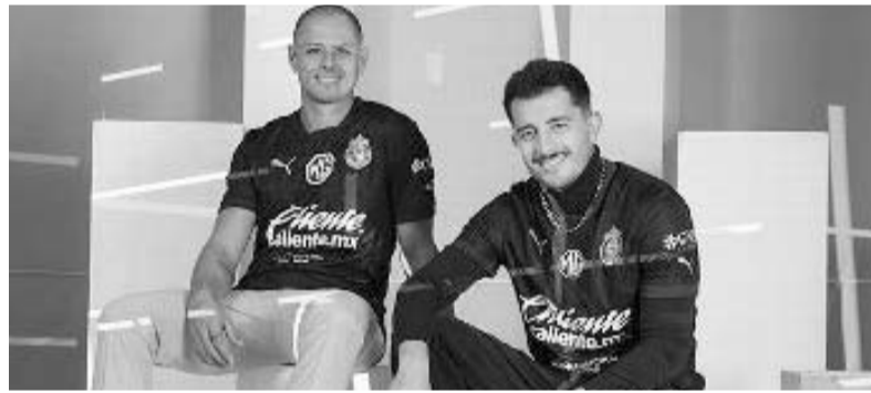
La afición recriminó los malos resultados.

"El Búfalo" llegó para este torneo al América y de inmediato se ganó un lugar en el esquema de André Jardine con goles y buenas actuaciones, el respeto de la afición y hasta un lugar en la selección uruguaya de Marcelo Bielsa: "Me siento en un buen momento. Estoy disfrutando y siendo feliz".