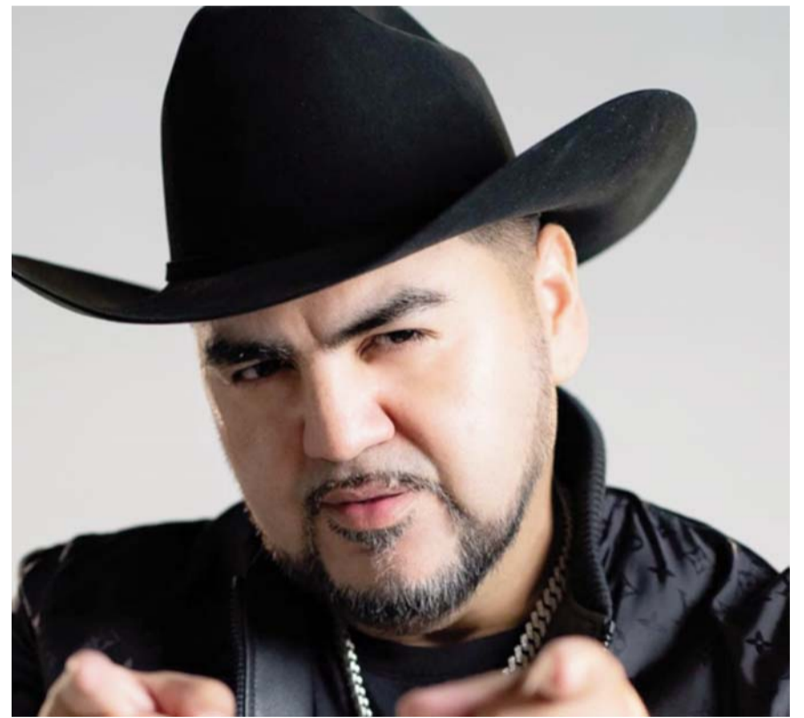
El Mimoso no podrá salir de la ciudad, lo que afectará sus conciertos.

Entre las medidas que le fueron impuestas al cantante se encuentran la prohibición de salir de la ciudad, lo que afectaría sus compromisos laborales, incluyendo el concierto que tiene programado para el próximo 31 de enero en el Auditorio Nacional.