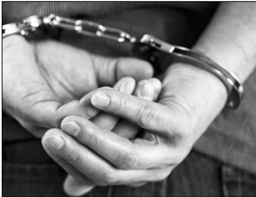
Las comisiones unidas de Puntos Constitucionales y Estudios Legislativos aprobaron, con 22 votos a favor y 10 en contra.

Los artículos transitorios señalan que las legislativas de los estados tendrán 65 para adecuar las normativas necesarias para cumplir con estas reformas; mientras el Congreso de la Unión contará