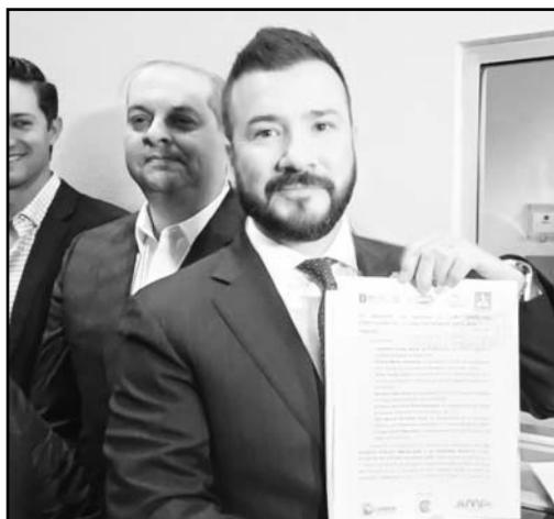
Se presentó una iniciativa de Ley