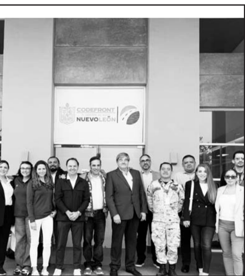
Lo será junto a la nueva carretera La Gloria-Colombia.

El operativo "San Pedro por una Navidad segura y en paz" se extenderá todo el mes de diciembre hasta el 7 de enero de 2025.(ATT)