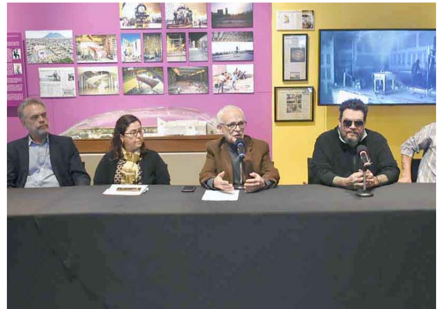
"Nuestra Historia, 30 años", es un viaje al pasado, cuando el museo estuvo en su etapa constructiva y las posteriores transformaciones.

La muestra incluye fotografías, publicaciones, folletos, maquetas, planos, instalaciones museográficas, material hemerográfico y audiovisual, elementos que reflejan parte de la narrativa