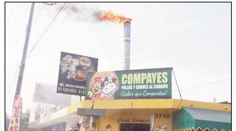
No hubo lesionados tras el incidente.

Luego de unos minutos, los sujetos se retiraron indicándole a los empleados que se tiraran al suelo sin ver para donde escapaban.