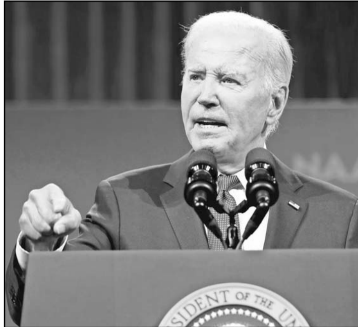
El presidente de Estados Unidos, Joe Biden confirmó el cese al fuego entre Israel y Hezbolá.

En una breve conferencia de prensa, el mandatario indicó que la idea es que sea permanente, pero que por lo pronto, regirá los próximos 60 días