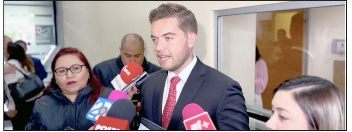
Los diputados morenistas presentó un escrito al Congreso del Estado.

Dijo que no había cómo medir el avance que se lleva en las negociaciones para sacar adelante el Presupuesto 2025.