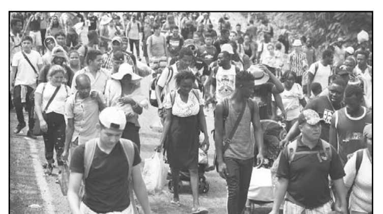
Previo a la toma de posesión de Trump, los miembros de su gabinete preparan deportación masiva en EU.

Homan se comprometió a trabajar en estrecha colaboración con el Estado para reforzar las medidas de seguridad y dijo que Trump utilizará acciones ejecutivas de gran alcance para endurecer la política de inmigración de Estados Unidos.