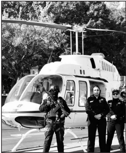
En total participarán 800 elementos municipales, de fuerzas federales y estatales.