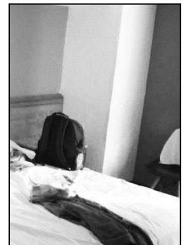
Buscan a los agresores.