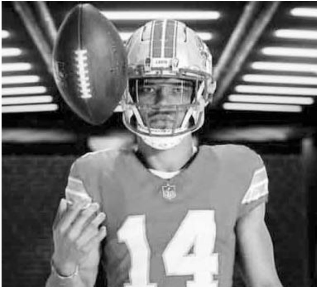
Con una victoria los Leones ya estarán del otro lado.

Ante esta situación, ambos equipos aspiran a la postemporada y lo antes mencionado es el atractivo del duelo de