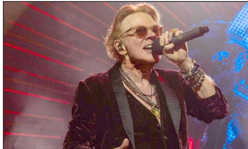
El rockero niega las acusaciones de abuso sexual.