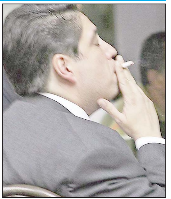
Pese a la prohibición de los cigarrillos electrónicos, se cree que continúa la venta informal.

Entre las marcas más solicitadas están: IPLAY, Icewave, Kuz, Teddy Vape, Elfbar, MaxAir, Waka, Starx, Airis, RabBeats, Packspod y Mentos Mints. Los precios que maneja van de los 80 pesos hasta los 500; también vende ropa, encendedores y vaporizadores de cannabis: "Estos están en 300, están en oferta porque son de 3.5 gramos", dice.