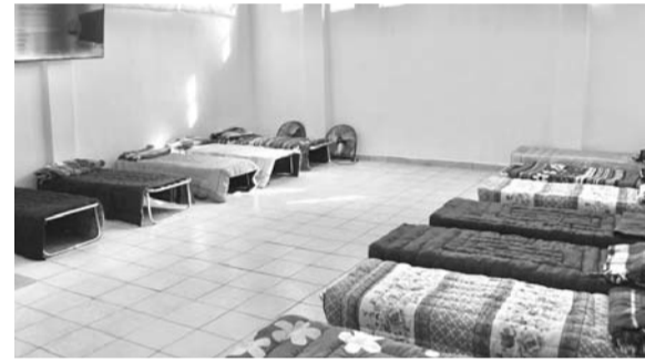
Se habilitó un espacio para dar refugio a un total de 30 personas.