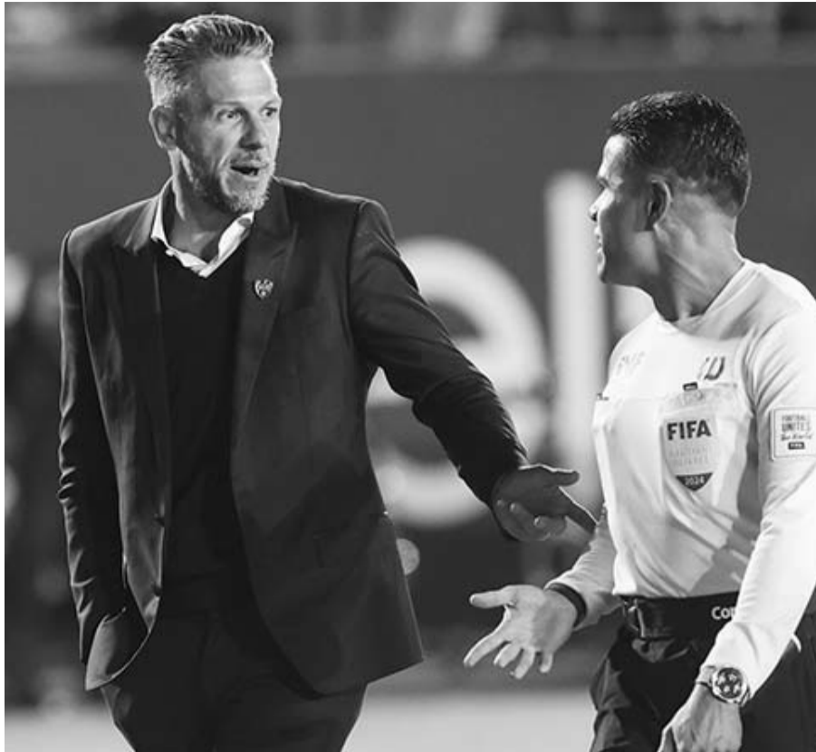
Demichelis dialoga con el árbitro al terminar el duelo.

"Me quedo con el segundo tiempo que fuimos mejor y con eso vamos el sábado a tratar de empatar el global", expresó.