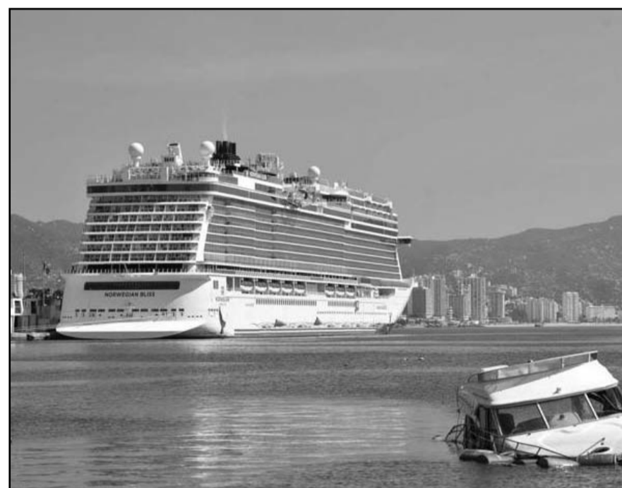
Empresas y organizaciones del ramo alertaron que el pago afectará la llegada de turistas al país.

"Prescribir fármacos existentes para no más de dos meses, con el objetivo de evitar un mayor desabasto al surtir recetas de tratamientos por tiempos prolongados; y utilizar la opción de receta resurtible en el módulo de receta gratuita, para que el paciente pueda recoger sus medicamentos periódicamente sin requerir una nueva prescripción".