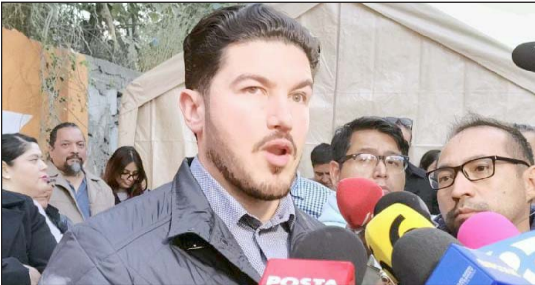
“No podemos ser rehenes, entonces mejor por las buenas pedirles que lo voten”.

“Es algo que se tiene que hablar con los diputados de PAN, yo por mí no daría nada, pero si al final tenemos que ceder, podríamos ceder”.