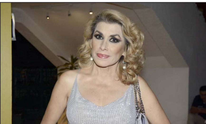
Dulce tuvo que ser hospitalizada y posponer todos sus conciertos.