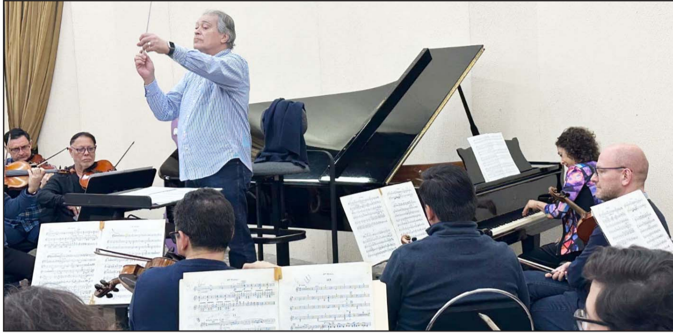
El programa arrancará con la "Pavana para una infanta difunta", obra ideal para "abrir oídos".