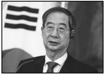
El posible reemplazo, el primer ministro Han Duck-soo