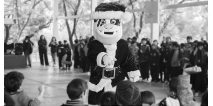
Los juguetes se recogieron en los juegos del club varonil y femenino.

Se espera que la entrega de regios diera comienzo durante este miércoles en la Alianza Anticáncer Infantil y continúe en más de 15 instituciones durante las próximas semanas. (AC)