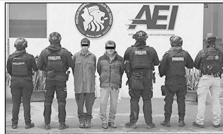
Las detenciones ocurrieron en García.