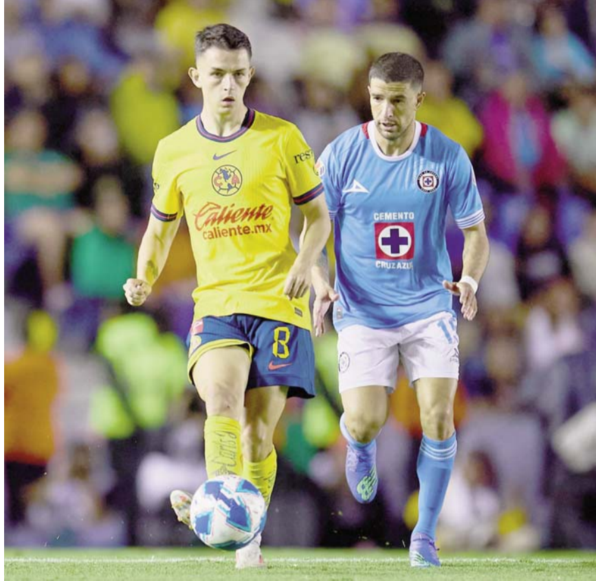
América busca mantener la hegemonía sobre La Máquina.