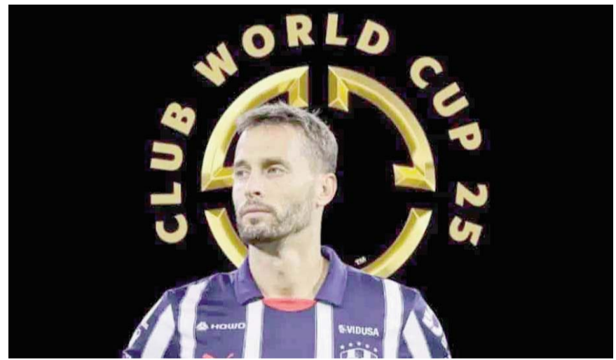
Hoy se celebra el sorteo de la justa mundialista.

Se especula que una de esas posiciones vendría siendo el mediocampo, mientras que la otra se desconoce.