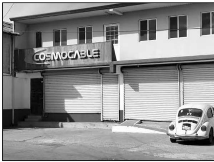
Algunos negocios chicos y grandes cerraron en Chihuahua como protesta por la violencia que viven en la región.

Estos lugares son considerados centro de reunión de personas generadoras de la violencia.