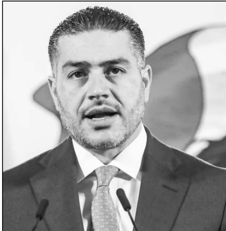
Harfuch resaltó que la violencia no va a terminar de la noche a la mañana, pero dijo, vamos a trabajar todos los días.

Este miércoles por la mañana ambos tuvieron una reunión privada en Palacio de Gobierno, en la que abordaron las nuevas estrategias que se implementarán en la entidad en materia de seguridad, según se informó en un comunicado.