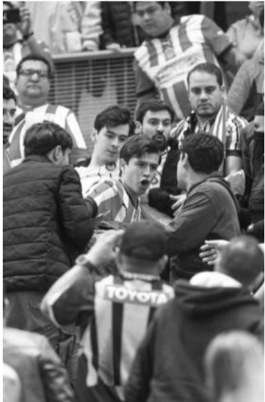
El Akron fue vetado.

Los hechos violentos que se presentaron en el más reciente Clásico Tapatío, el del play in donde el Atlas derrotó a las Chivas (1-2), ya tienen consecuencias para