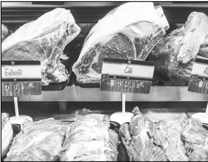
Entre enero y octubre, el consumo de carne registró un incremento interanual del 4.5% en 2024.

Por ejemplo, la carne de res luego de tener incrementos de precios de 10.2% en 2021, de 14% en 2022, se redujo el porcentaje a 3% en 2023 y 3.4%