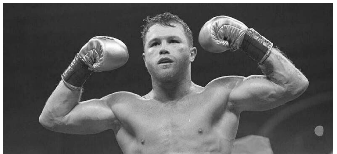
Tal parece que Saúl Álvarez le teme a Benavidez.

“Ahora lo único que quiere es ganar dinero, no le importan los desafíos, pero digo que tiene miedo porque le ofrecieron 70 millones de dólares para pelear conmigo, eso antes del PPV. Imagínense cuánto ganaría con el PPV”, expresó.