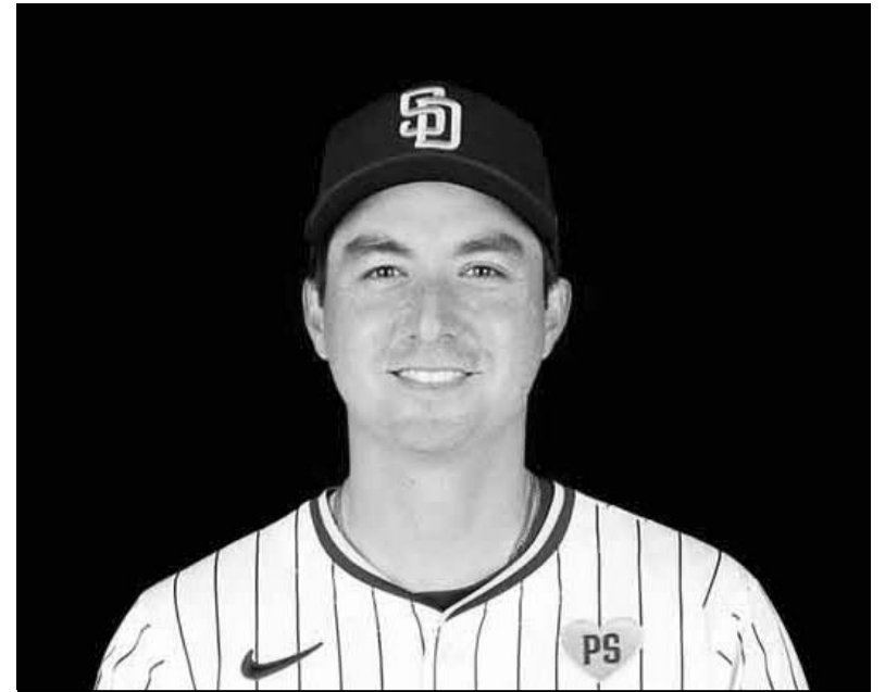
Higashioka llega a reforzar a los texanos.

esta noche, aspecto por el cual se espera un gran encuentro en el emparrillado de los Leones de Detroit, escenario en el que iniciará esta seguramente emocionante semana 14 del futbol americano y profesional de Estados Unidos.