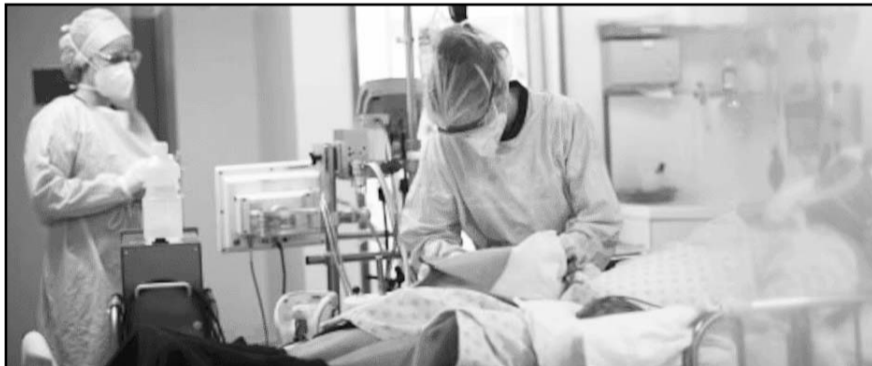
Secretaría de Salud ha encendido las alarmas tras emitir una alerta epidemiológica.

LIC. JORGE MALDONADO MONTEYAYOR NOTARIO PÚBLICO NUMERO 55 MAMJ-660316-CG1 (25 y 5)