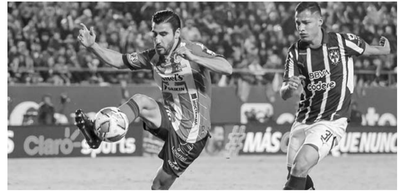
El próximo sábado existe la prioridad de ganar para avanzar a la final.