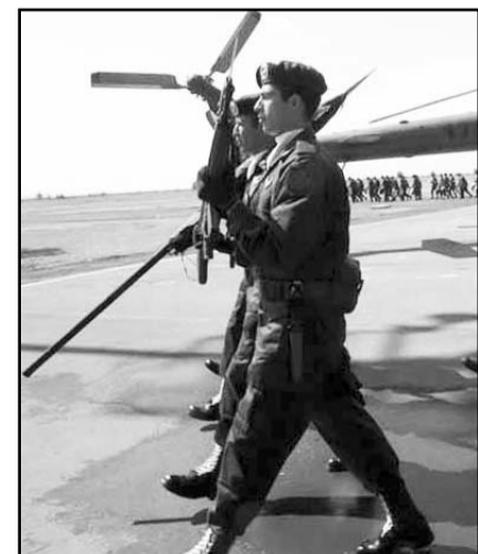
Las Fuerzas Armadas controlan casi tres cuartas partes del gasto de seguridad.

"La prioridad para AMLO fue la militarización de la seguridad, en detrimento de la construcción de capacidades locales para transitar hacia la pacificación.", Armando Vargas, coordinador del programa de seguridad.