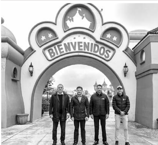
Se invirtieron 20 millones de pesos.