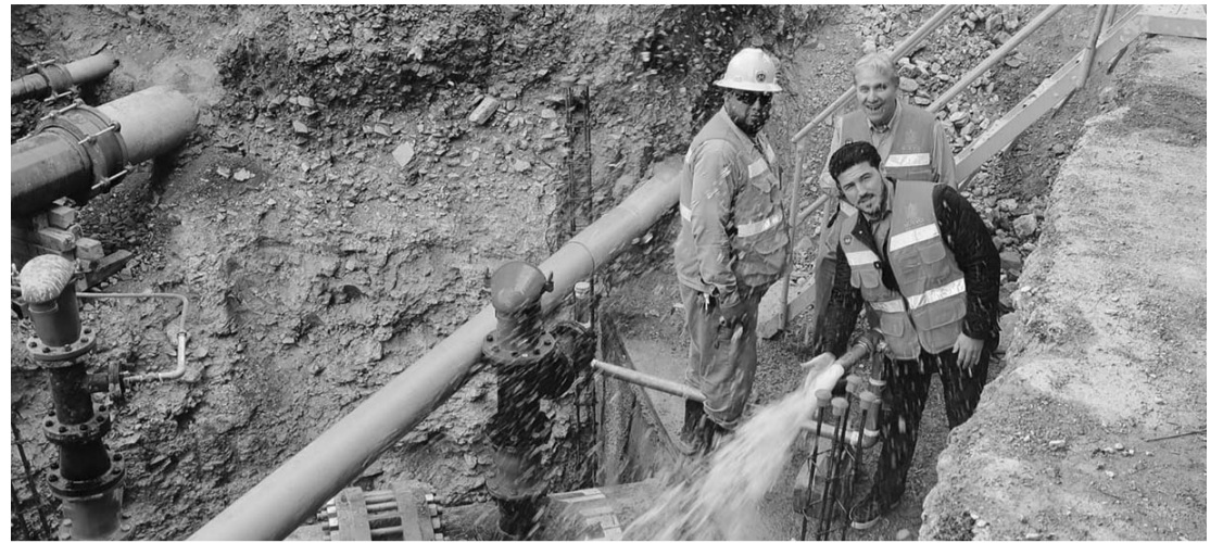
"Ya está el ducto conectado a la red, ya van a tener agua sin cortes"

Con una inversión de 69 millones de pesos, el sistema hidráulico que resultó dañado durante el paso de la tormenta tropical "Alberto", cuenta