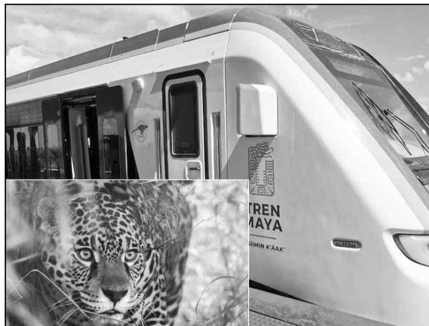
Profepa vigilará manejo de fauna en Tren Maya.

El senador del PVEM por el estado de Yucatán, Jorge Carlos Ramírez Marín, expresó que "en lo particular, voté en contra del cobro que propone la Ley Federal de Derechos para quienes viajan en cruceros porque ese aumento afectaría el sector turístico de Puerto Progreso".