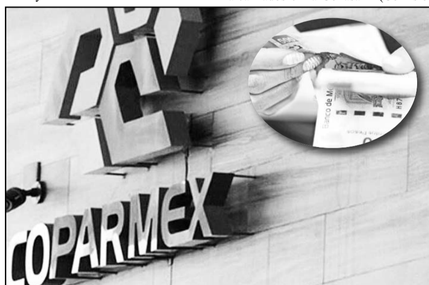
Coparmex resaltó su propuesta de una "nueva cultura salarial" para que dos salarios mínimos sean suficientes para sostener a una familia.