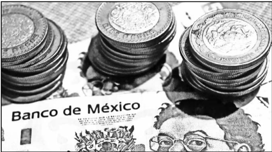
La OCDE mantuvo su proyección de crecimiento para el próximo año, el peor desempeño económico desde la contracción de 8.4% en 2020.