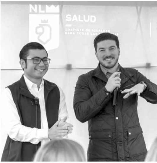
Analizan la factibilidad del proyecto.