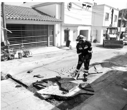
Un total de mil 200 baches fueron reparados, con el programa "Bye, bye, baches"

En este sentido, la Secretaría de Servicios Públicos y Medio Ambiente invitó a la población a reportar baches y daños en el pavimento en la línea telefónica de Atención Ciudadana, 81 1212 1212. (ATT)