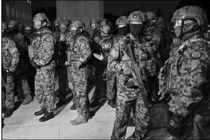
El levantamiento de la ley marcial muestra el compromiso de Corea del Sur con el Estado de derecho: OTAN

Y dejó en la cuerda floja a Yoon, un político conservador y exfiscal estrella, elegido presi-