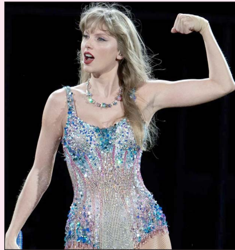
La intérprete se coronó con más de 26.6 mil millones de reproducciones.

Con Spotify Wrapped, los usuarios no solo descubren su banda sonora del año, sino también el impacto cultural de artistas como Swift, quienes redefinen el panorama musical con su éxito arrollador.