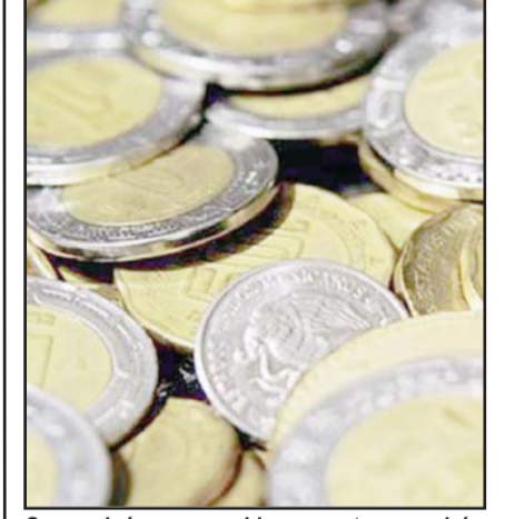
Se precisó que con el incremento se podrán comprar 1.85 veces la canasta básica.

Añadió que con el incremento se beneficiará de manera directa a 8.5 millones de trabajadores y trabajadoras de México.