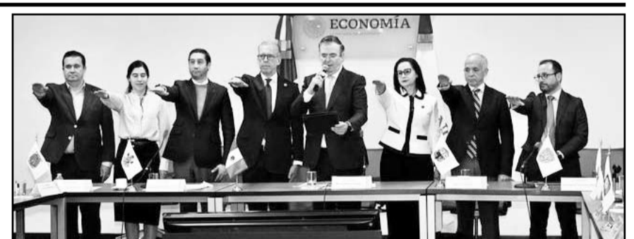
Ebrard liderará mesas de trabajo para fortalecer la economía estatal.

AMDA recordó que el éxito en las ventas de las automotrices chinas se dio entre 2022 y 2023, cuando había escasez de inventario en otras marcas.