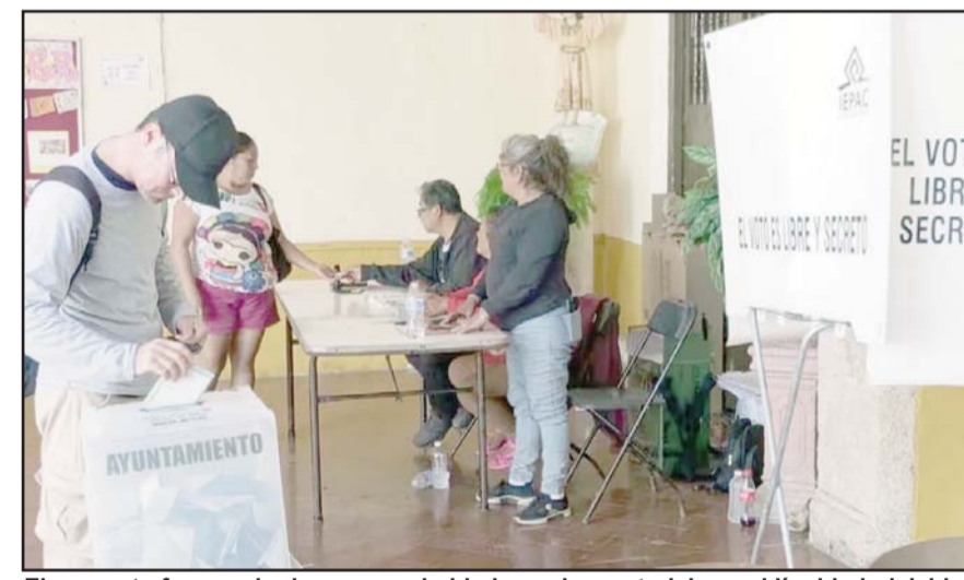
El proyecto fue aprobado por unanimidad para los materiales y el líquido indeleble.

El líquido indeleble será elaborado por la Escuela Nacional de Ciencias Biológicas del IPN, mientras que la certi-