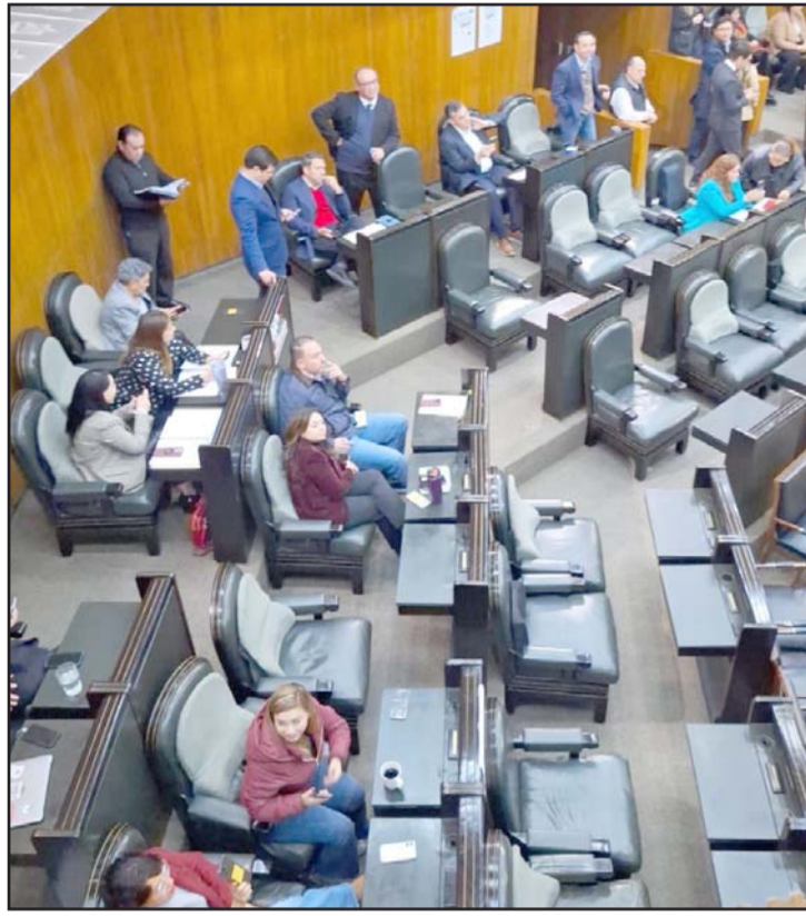
Al ponerse en votación se registraron 21 votos a favor de PRI, PAN y PRD; y 21 votos en abstención de los diputados de Movimiento Ciudadano, Morena, PT y Verde.

“Nos faltó un voto para que pudiera transitar la propuesta que estábamos planteando, se regresa a la Comisión, tendremos