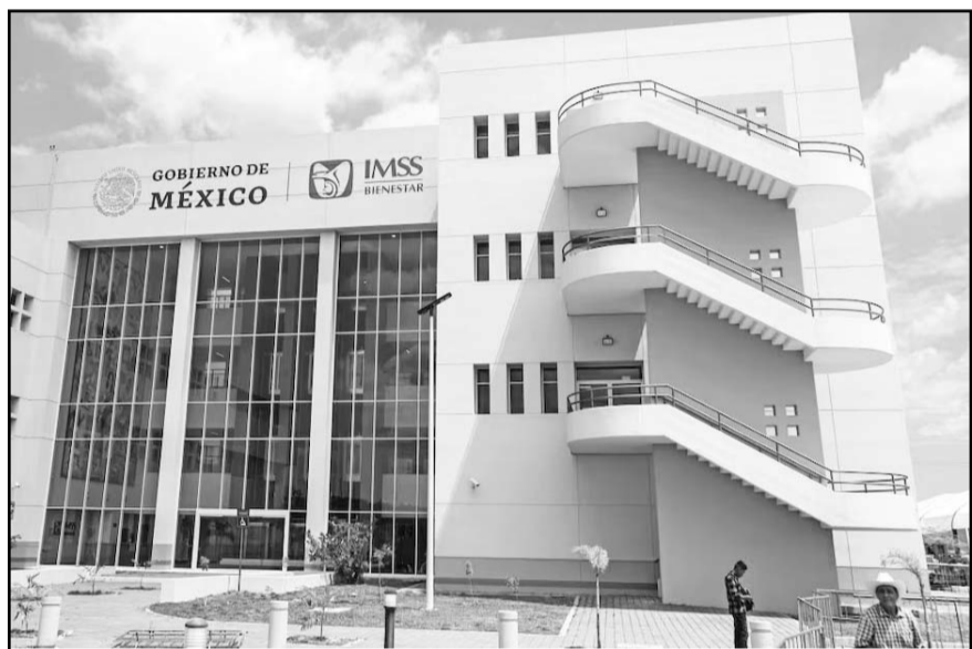
IMSS-Bienestar tendrá un aumento presupuestal del un aumento de 23.59%.