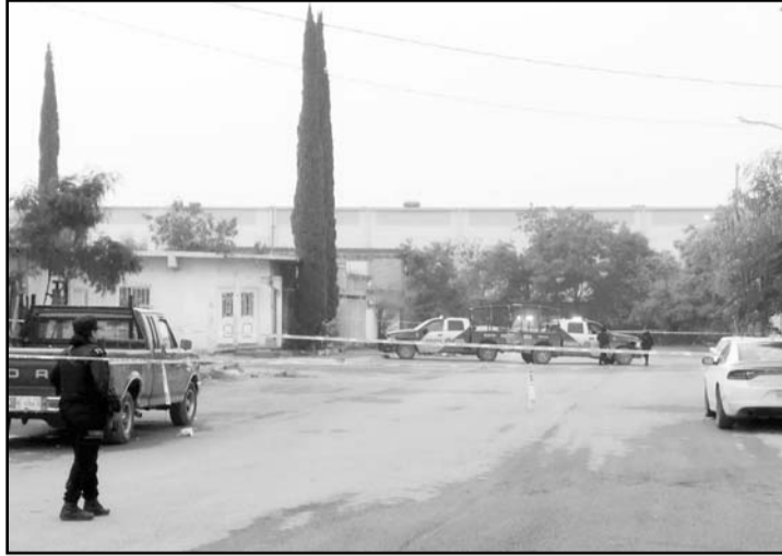
Se registró en la colonia La Alianza, en Monterrey.

Explicaron que los autores materiales del crimen dejaron