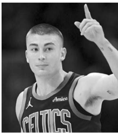
Celtics venció a Pistons.

Los Celtics mantuvieron la delantera de doble dígito hasta el cuarto periodo, cuando Detroit encestó cuatro triples consecutivos para acercarse a ocho puntos, 109-101, y obligar al entrenador de Boston, Joe Mazzulla, a reintegrar a Brown. Los Pistons redujeron la