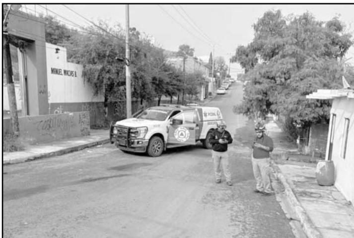
Trabaja para una empresa de cable.

Hasta anoche no había más informes sobre su salud.