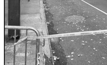
Thompson, era uno de los máximos ejecutivos de la industria de los seguros.