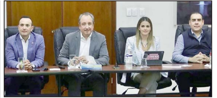
La idea es llegar a consensos.

Por tal motivo señaló que en los próximos días en mesas de trabajo realizarán de nuevo el análisis para entregar otra propuesta.