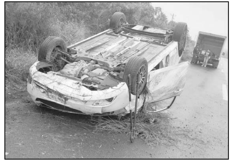
Se registró en el municipio de Montemorelos.

Los especialistas en urgencias médicas determinaron que la víctima estaba sin vida.