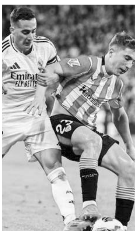
El Madrid dejó escapar la oportunidad.

A su vez, el cuadro del Newcastle alcanzó las 20 unidades para que así sean décimos en la competencia.