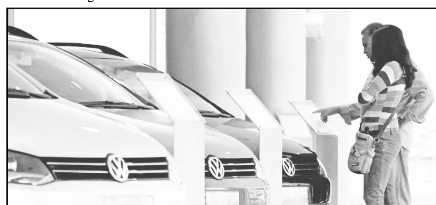
La venta de carros fue 2.6% superior a lo estimado para noviembre, y un 18.6% mayor que en el mismo mes antes de la pandemia.

El presidente ejecutivo de la AMDA dijo a su vez que las marcas chinas están mostrando un ligero retroceso en ventas