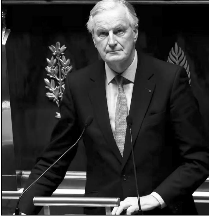
El primer ministro, se enfrentó a una dura oposición desde que el presidente Emmanuel Macron le nombró para el cargo.

Y finalmente lo dejó caer el lunes. Pese a conseguir varias concesiones, el primer ministro rechazó la última "línea roja" de