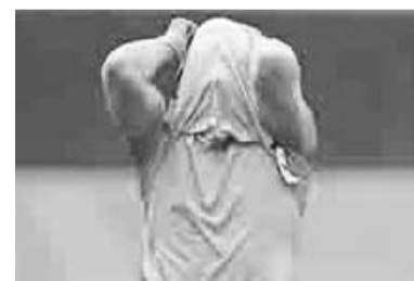
Tigres es subcampeón.

dieron vuelta en el marcador con las anotaciones de Abitia con su doblete al 12' y 23', además del tanto de Rodríguez al 43'.