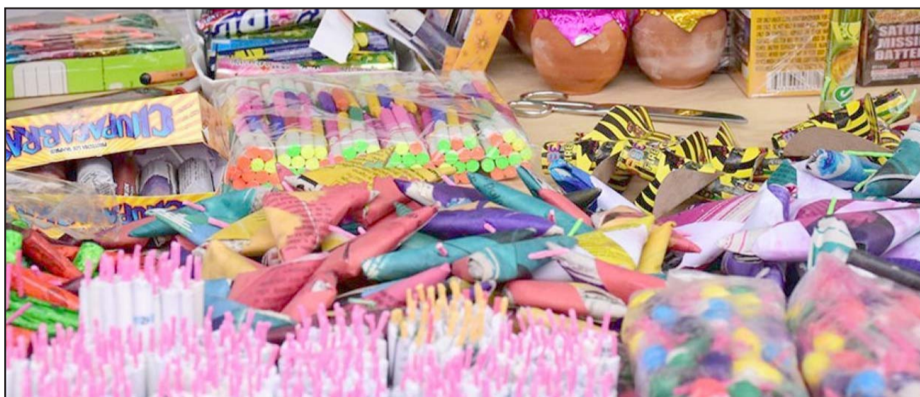
Con un solo click la gente puede adquirir una gran cantidad de pirotecnia de todos tamaños y precios.

Algunos de los municipios de la Zona Metropolitana y Periférica donde se comercializan a través de redes sociales los cohetes son Monterrey, Escobedo, San Nicolás, Juárez, Zuazua, Salinas Victoria, García, Guadalupe, Ciénega de Flores, entre otros.