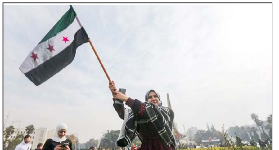
Tras la caída del régimen de Al-Assad, el país se encuentra en tiempos de incertidumbre.