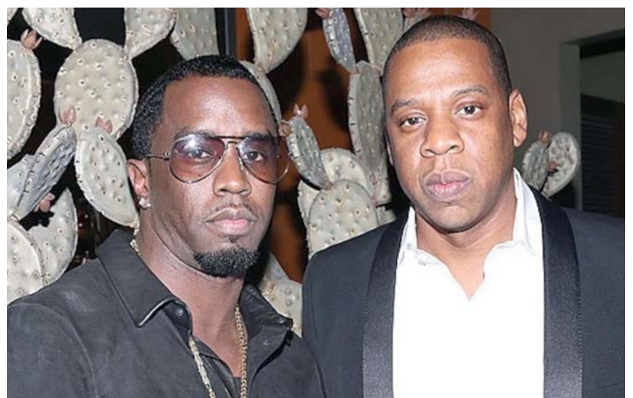
La acusadora afirma que el presunto abuso cometido por ambos raperos ocurrió en el año 2000 en los MTV Music Awards.

La invitó a una fiesta después del evento y le indicó que regresara a su automóvil más tarde esa noche,