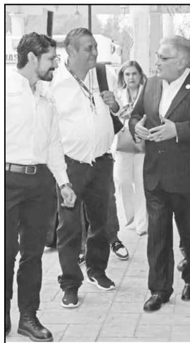
Fue todo un éxito.

"Hoy, más que nunca, reafirmamos que la unidad es nuestra mayor fortaleza y la profesionalización nuestra mejor herramienta para enfrentar los retos del presente y construir un futuro con justicia y oportunidades para todos", afirmó el Secretario General de la Sección 50 del SNTTE ante la estructura sindical que participó en la capacitación e intercambio de ideas con apertura y transparencia absoluta