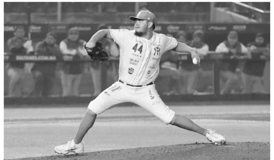
Sultanes ganó el juego de la honra.