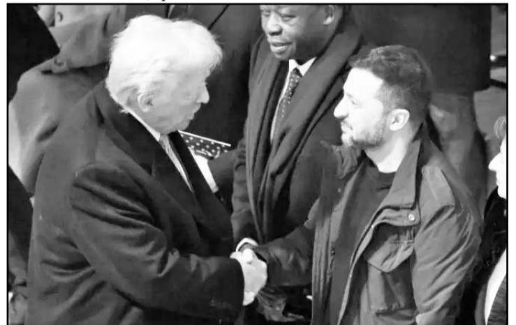
Después de su encuentro con Zelenski y Macron, Trump expresó en Truth Social que Rusia debería comenzar negociaciones.

El encuentro tuvo lugar en el Palacio del Eliseo, previo a la