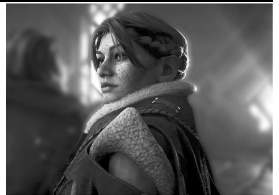
La franquicia de fantasía regresó con varios cambios