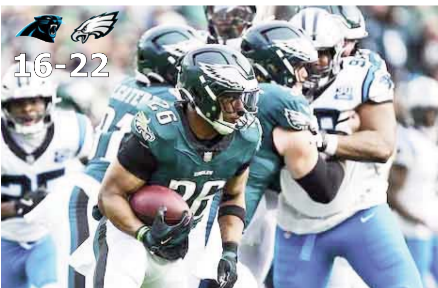
Las Águilas doblegaron a Carolina.

Pérez, quien tiene contrato con Red Bull Racing hasta el final de la temporada 2025, está en un equipo que realmente ya no lo quiere como piloto.