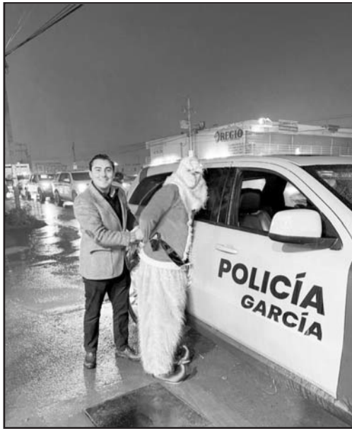
El alcalde encabezó el inicio del operativo de seguridad para las próximas fiestas.