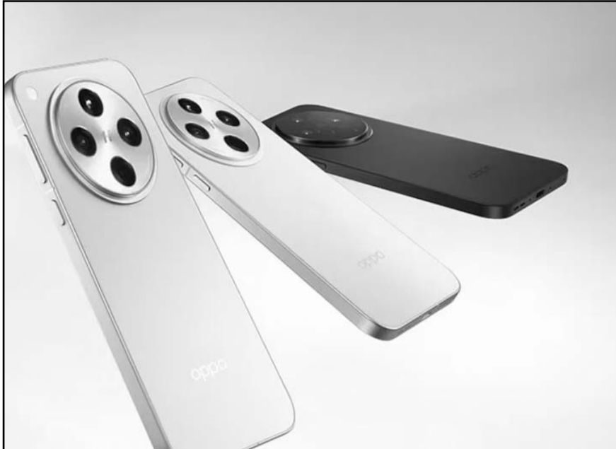
OPPO Find X8 Pro llega a México con innovaciones en cámaras, rendimiento y diseño premium para usuarios exigentes.

El lanzamiento del OPPO Find X8 Pro es un reflejo del compromiso de la marca por llevar sus dispositivos a nivel mundial. Según Billy Zhang, presidente de marketing, ventas y servicios en el extranjero de OPPO, el éxito de la marca radica en su capacidad para entender las comunidades locales y ofrecerles productos y servicios excepcionales. Esta expansión ha permitido que OPPO mantenga su posición en el cuarto lugar mundial en envíos de smartphones, con los merca-