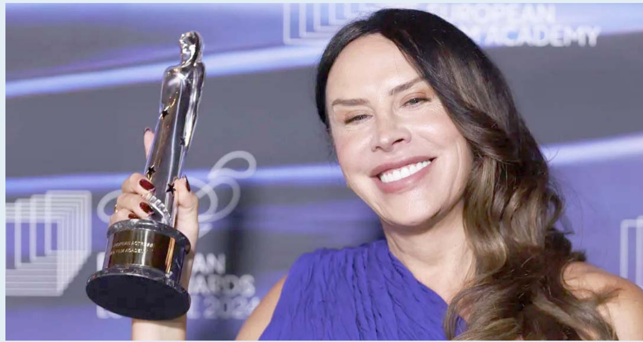
Karla Sofía Gascón hizo historia al convertirse en la primera actriz trans en ganar en la categoría a Mejor Actriz.