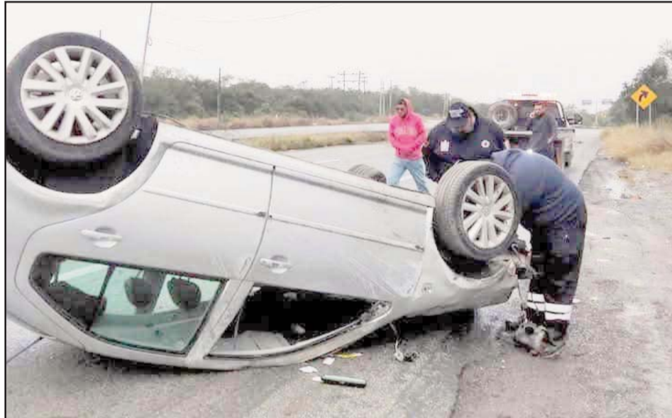
Fue el exceso de velocidad lo que provocó el accidente.

Las autoridades no dieron a conocer la identidad de los lesionados, quienes resultaron con golpes contusos en todo