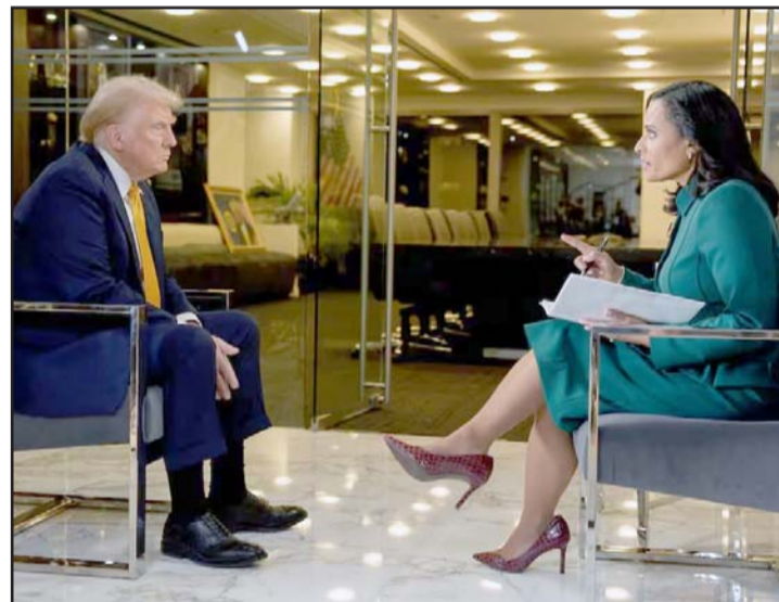
El republicano fue cuestionado en el programa 'Meet the Press'

El republicano se declaró "gran creyente en los aranceles,