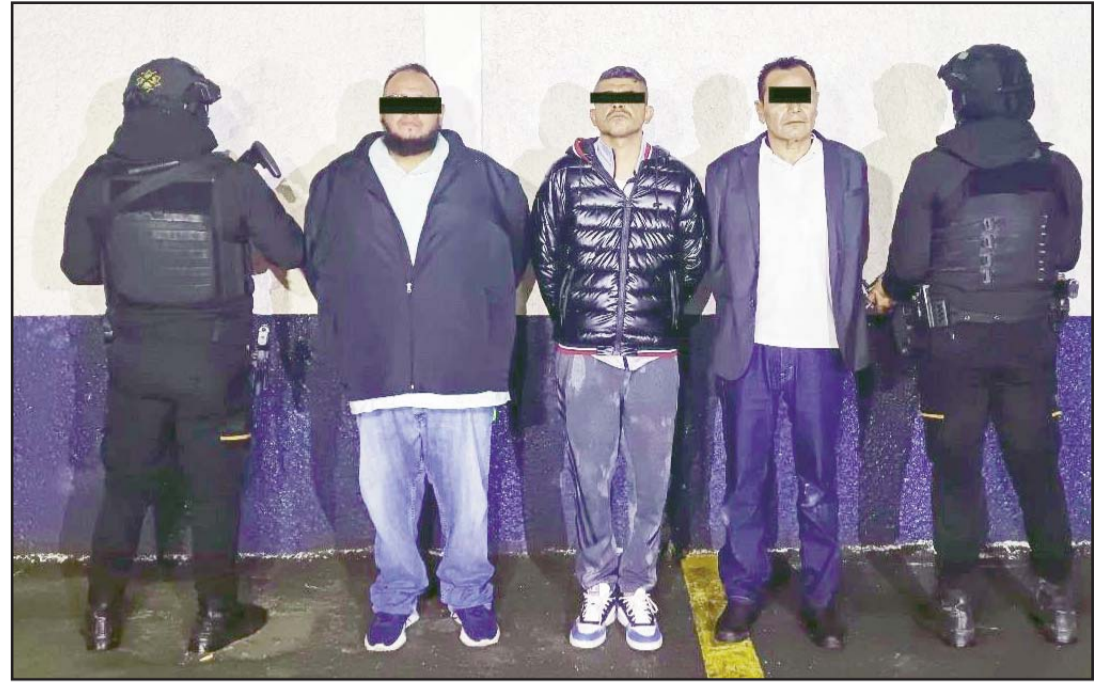
Fue la noche del sábado en las calles del Fraccionamiento Cosmópolis.