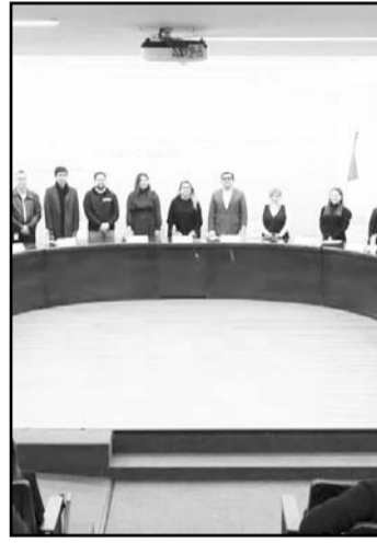
Lo formaron 10 personas.