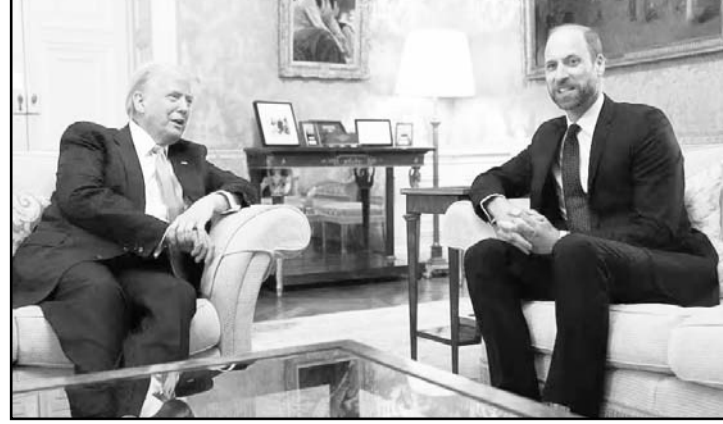
Ambos líderes compartieron palabras de elogio mutuo en un ambiente cordial y distendido.