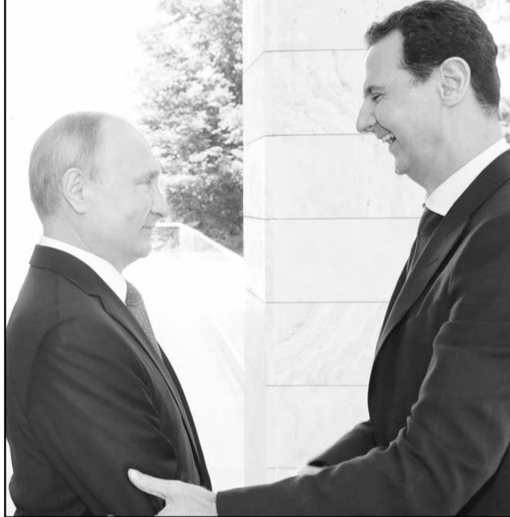
El presidente sirio Bashar Al Assad y su familia obtuvieron asilo tras ser derrocados por la ofensiva extremista.

El ministro español José Manuel Albares destacó la importancia de una solución pacífica