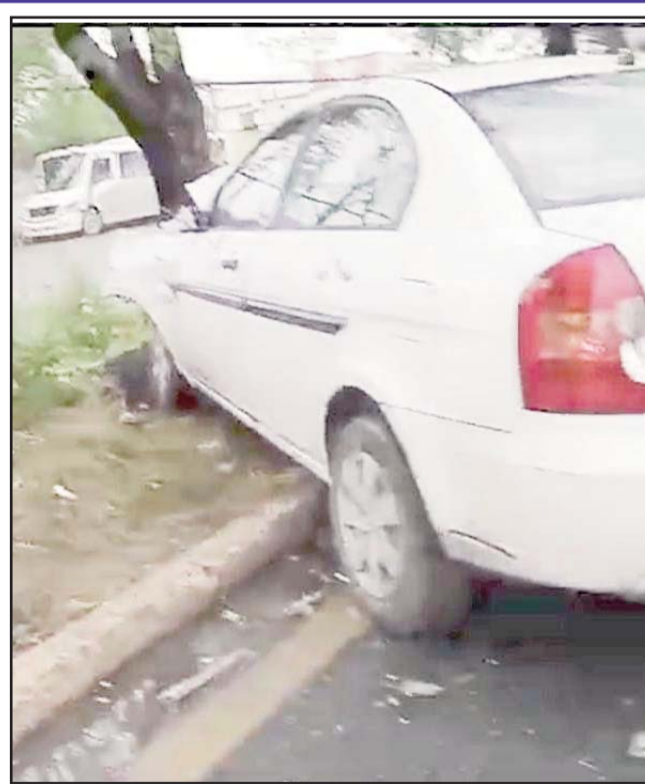
Fue en la colonia Rafael Ramírez en Guadalupe.

Las dos personas que iban en la unidad resultaron con heridas leves en diferentes partes del cuerpo, ninguna de gravedad, por lo que únicamente fueron valorados en el sitio.