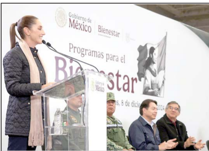
Claudia Sheinbaum hizo un llamado a cooperar en la lucha contra las drogas, como el fentanilo, así como el tráfico de armas.

Y que 80% de los salarios que ganan los mexicanos que viven en Estados Unidos lo gastan ahí, y que sólo 20% vienen de remesas para apoyar a las familias mexicanas.