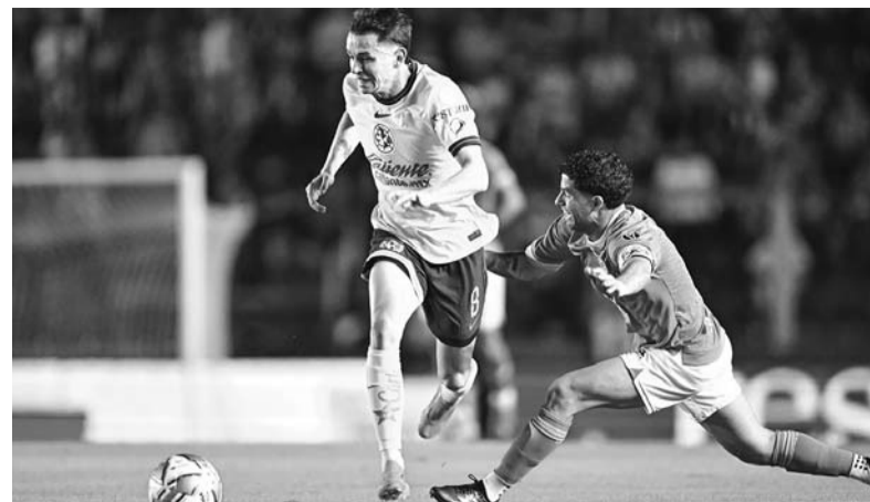
Fidalgo, pieza clave en el juego del América.