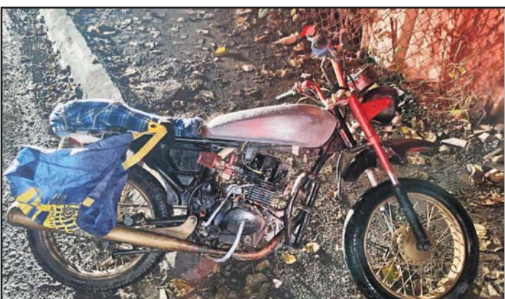
Se logró tras una larga persecución en Tierra Propia.

Elementos de tránsito de Monterrey se hicieron cargo del accidente, y tras levantar el parte correspondiente procedieron a retirar del vehículo del lugar.