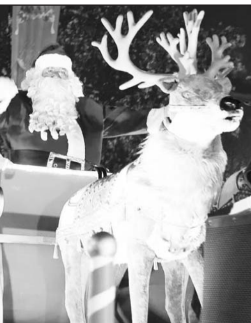
Se tuvo un desfile y además se hizo el encendido del pino.