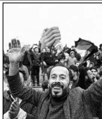
Imágenes mostraron personas derribando y pisoteando estatuas de Hafez al Asad.

El presidente ucraniano, en un tono firme, señaló que "la paz a