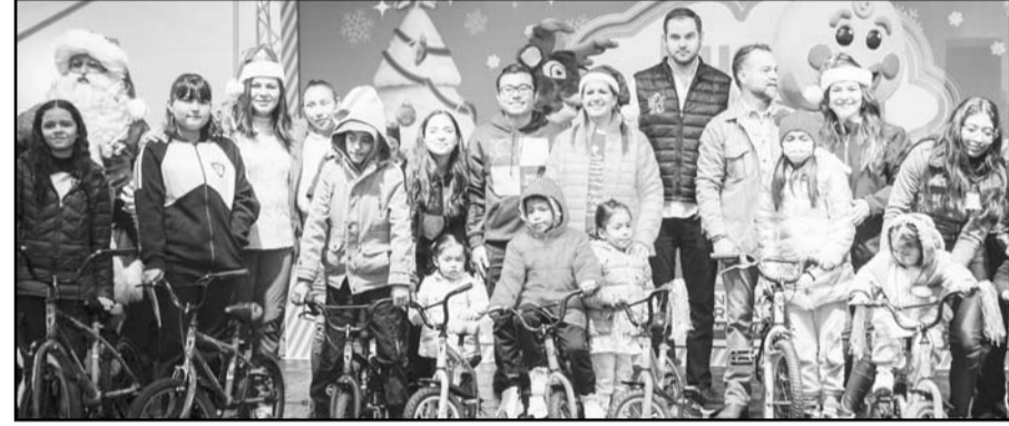
Cientos de familias, niños y niñas disfrutaron de 'Brilla Juárez'