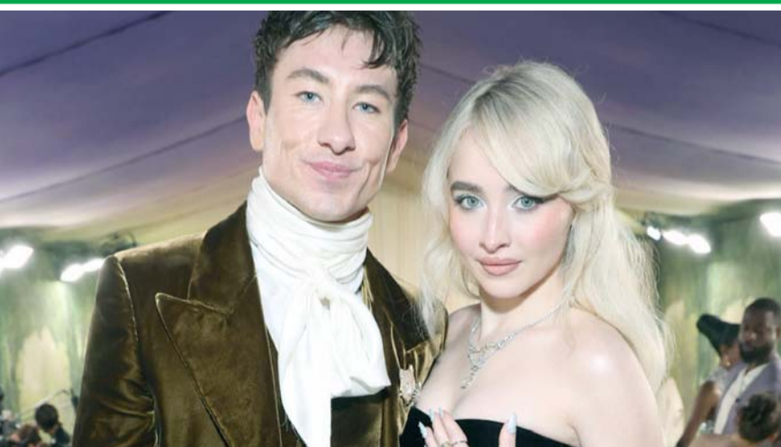
Hasta el momento, la cantante Sabrina Carpenter no se ha pronunciado.