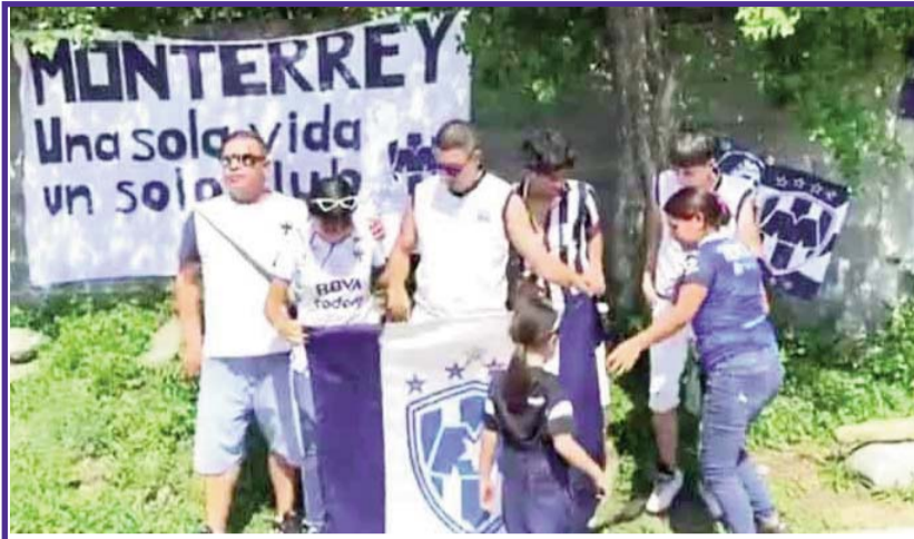
La afición se dejó sentir en El Barrial.