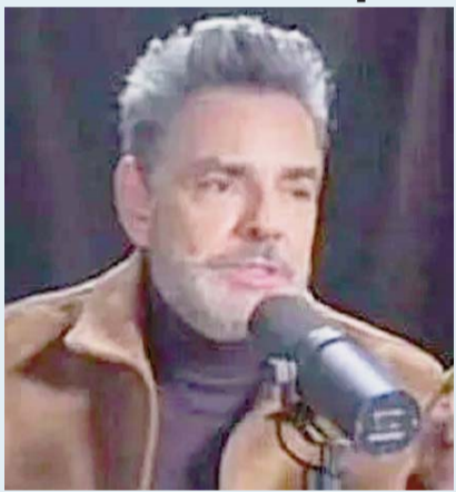
El actor criticó el trabajo de la actriz y cantante Selena Gomez.