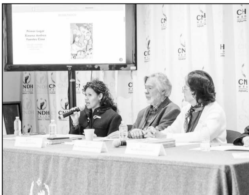
Es parte del compromiso con la Cultura de Paz. esta agenda".

"La población debe saber que las escuelas públicas en México están colocando lienzos blancos que identifican su participación a favor de la Cultura de Paz. Las comunidades escolares se movilizan para reflexionar y analizar el tema, registrar proyectos de construcción colectiva, elaborar propuestas, tomar acciones y establecer compromisos firmes con