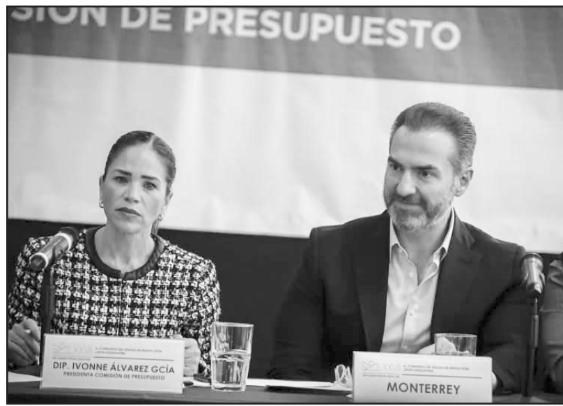
Dijo que el dinero público es para resolver los problemas de la gente

"El dinero no es del gobierno del Estado, es de y para la gente, para resolver sus problemas cotidianos, espero que al final de cuentas haga un presupuesto que sea con ese fin", sentenció.