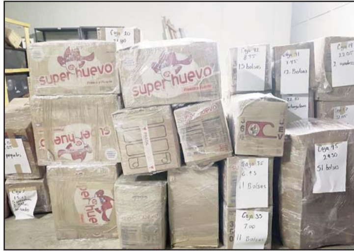
La transportaban en cajas supuestamente con huevo

Fue en el cruce de la Avenida Andrómeda y Libramiento Noreste, en