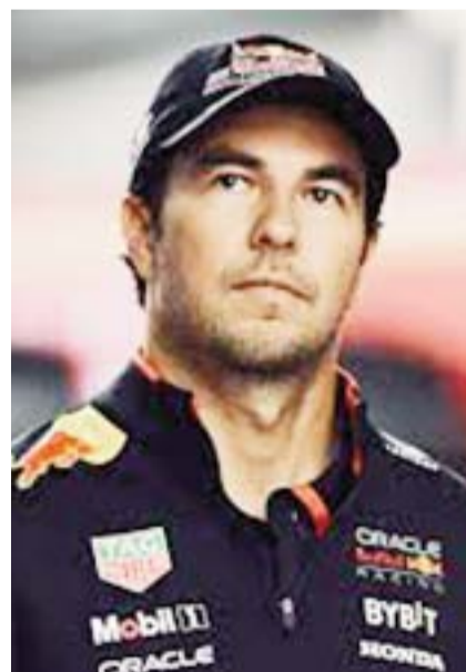
Sergio Pérez, pésima temporada.

También la carrera significó el adiós de Lewis Hamilton de Mercedes ya que el próximo año correrá con el equipo Ferrari.