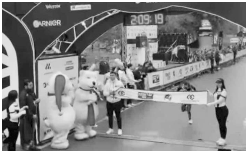
El Etiope se llevó la victoria en el maratón regio.

Tras la derrota, ahora los Bills de Buffalo presentan un récord de 10 ganados por tres perdidos, aunque ya están en la postemporada.