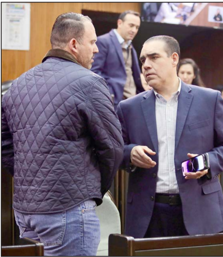
Buscarán evitar las malas prácticas con los recursos estatales.

Los legisladores buscarán encontrar los consensos para poder sacar a delante el tema antes del 20 de diciembre.