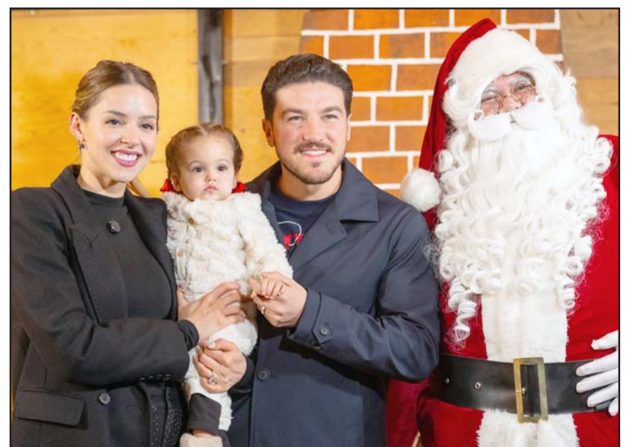
Junto a su familia el gobernador fue parte del inicio de las fiestas navideñas

El Monumental Pino Navideño en la Explanada del Museo de Historia Mexicana fue realizado por el artista Sergio Rodríguez con más de 4 mil 500 canastas, una metáfora de la abundancia, del fruto del trabajo, de los sueños y de la generosidad que caracteriza a nuestra gente.