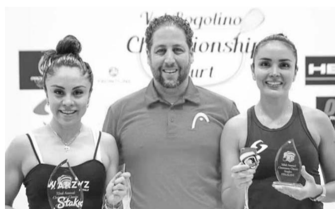
La potosina, radicada en Nuevo León ganó su primer Clásico.

La nacida en San Luis Potosí ahora estará a la espera de que se llegue el próximo año para en el mismo buscar cosechar más títulos.