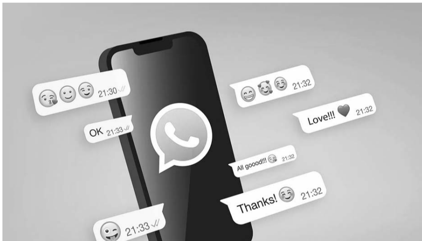
Se espera que sean habilitadas durante las últimas semanas de 2024 o las primeras semanas de 2025:

Recuerda que estas nuevas funciones han sido descubiertas en la versión Beta de WhatsApp, ello quiere decir que aún no se encuentran disponibles. Mantente pendiente de las actualizaciones en la tienda de apps de tu celular para utilizarlas cuando se estrenen.