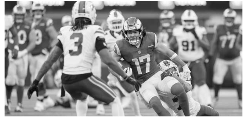
Carneros se llevó la victoria.

La ventaja al medio tiempo de Kansas City fue la mayor de la temporada y fue la primera vez que dejaron a un oponente en cero en la primera mitad.