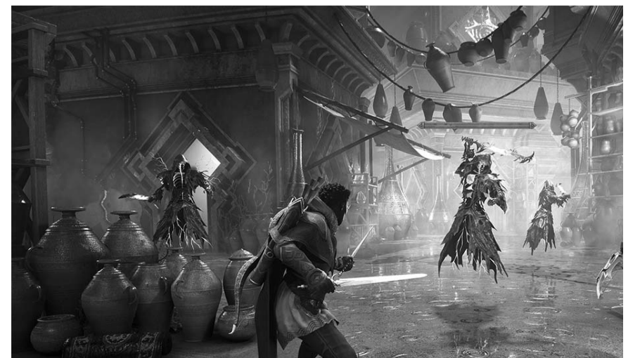
Dragon Age: The Veilguard, el videojuego que cumple con lo que promete

Por esta razón ya sabemos por qué es una de las continuaciones más esperadas de Dragon Age y consideramos que en primeras impresiones cumple con el objetivo. Sobre todo a nivel visual es algo de lo que no te puedes perder.