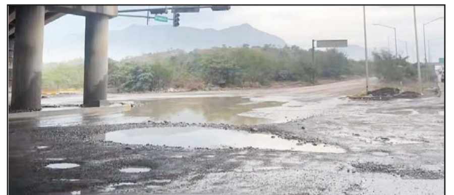
Por diversas zonas las avenidas se encuentran demasiado dañadas.