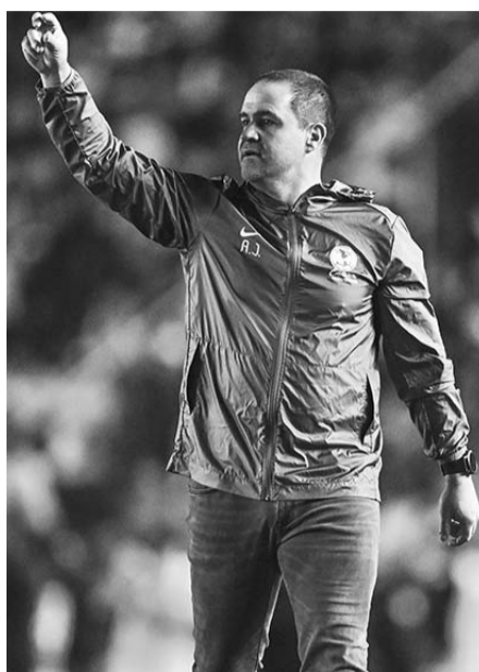
André Jardine vibró con su equipo.

“En el estadio Cuauhtémoc de Puebla nos sentimos mucho en casa y vamos a ver si hacemos en el estadio de Puebla la diferencia a nuestro favor”, aseveró Jardine.