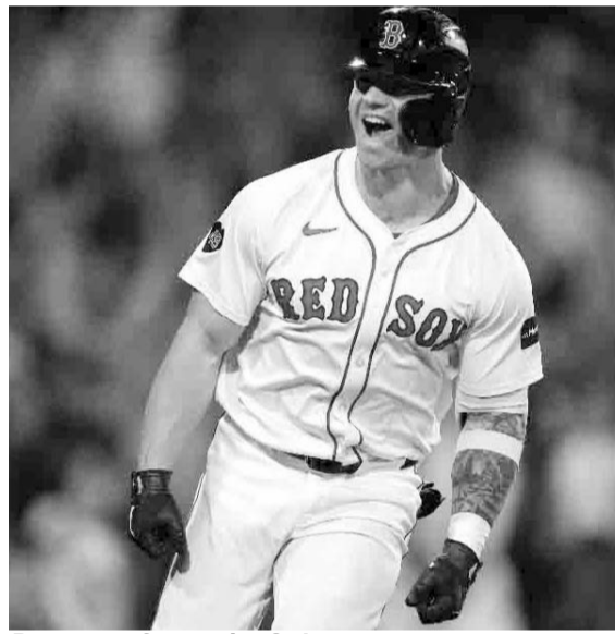
Boston enfrentará a Sultanes en marzo.

Sultanes iniciará hoy una serie como visitantes ante los Charros de Jalisco, a partir de las 19:30 horas de este martes.