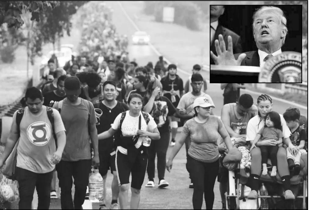
Migrantes caminan por la carretera de Huixtla, en el estado de Chiapas.

La ciudadanía por derecho de nacimiento significa que cualquier persona nacida en Estados Unidos se convierte automáticamente en ciudadano estadounidense. Esta práctica ha estado vigente durante décadas y se aplica a los hijos nacidos en el país de padres que están sin autorización en Estados Unidos o que cuentan con visa de turista o de estudiante y planean regresar a su país de origen.