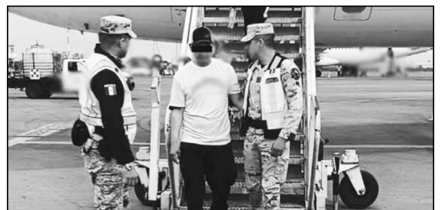
Mario N intentó desviar ayer el vuelo 3041 de Volaris a Estados Unidos.

"Decir que la autonomía judicial se pierde y, además, que lo diga el PRI, que concentró el poder Ejecutivo, el poder Legislativo y el poder Judicial en sus tiempos de hegemonía; decir que hay un despido masivo de juzgadores, de juzgadoras, es una gran mentira de Acción Nacional, y no recuerdan que ellos sí despidieron masivamente a 45 mil trabajadores de Sindicato Mexicano de Electricistas", comentó.