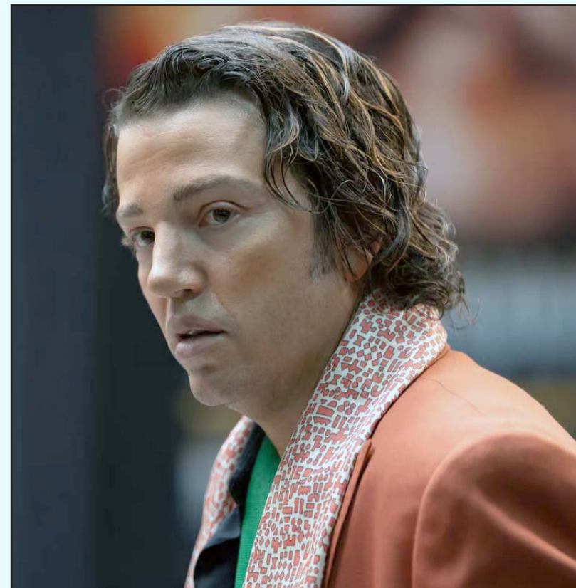
El actor recibió la nominación por su papel en la serie "La Máquina".

Con esta nominación, Diego Luna sigue consolidándose como una figura influyente en la industria del entretenimiento y como un representante destacado del talento mexicano en el ámbito internacional.