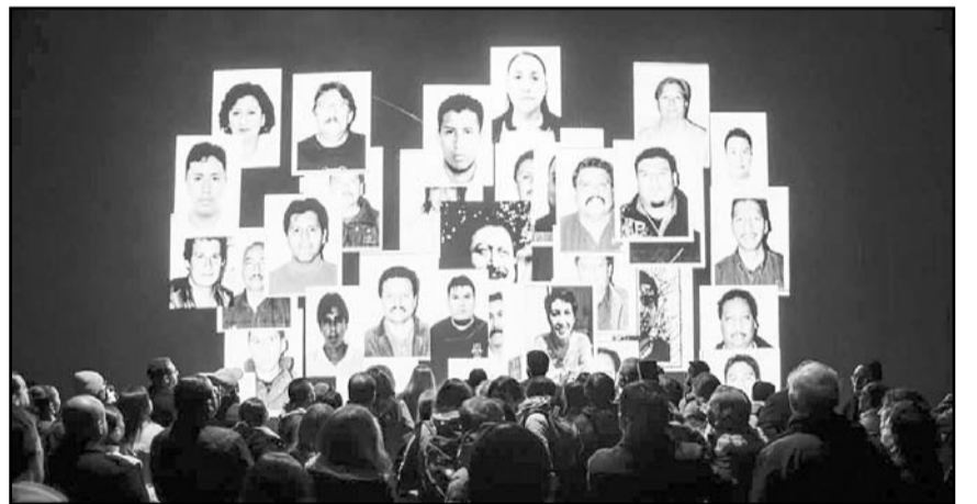
La experiencia inició con un video en el que destacaron rostros de trabajadores que han pasado por el recinto.

Ubicado a lado de la Macroplaza, el Teatro de la Ciudad diseñado por el arquitecto Óscar Bulnes, fue inaugurado el 7 de diciembre de 1984, el cual se mantiene vivo bajo la administración del Consejo para la Cultura y las Artes de Nuevo León.