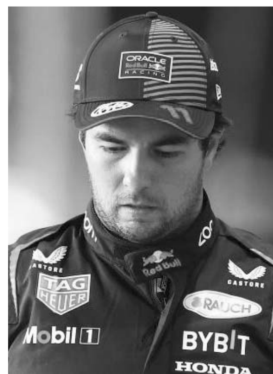
Sergio Pérez, en el ojo del huracán.

El tapatío viene de cerrar esta temporada con un abandono en el Gran Premio de Abu Dhabi ya que no sumó puntos en esa carrera luego de que Valtteri Bottas, piloto de Sauber, tuviera un contacto con el auto del mexicano en la vuelta dos de esa carrera.