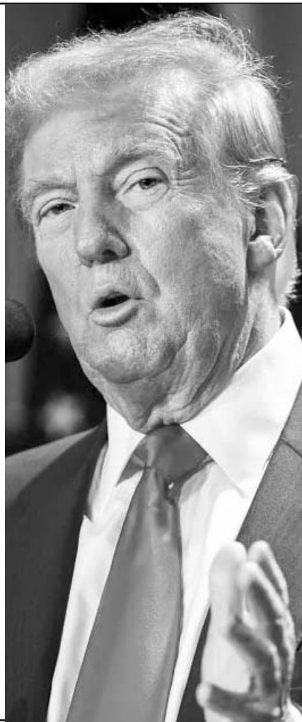
El presidente electo de EU, Donald Trump dijo que si se debe subsidiar a México, entonces que sea un estado más de la Unión Americana.