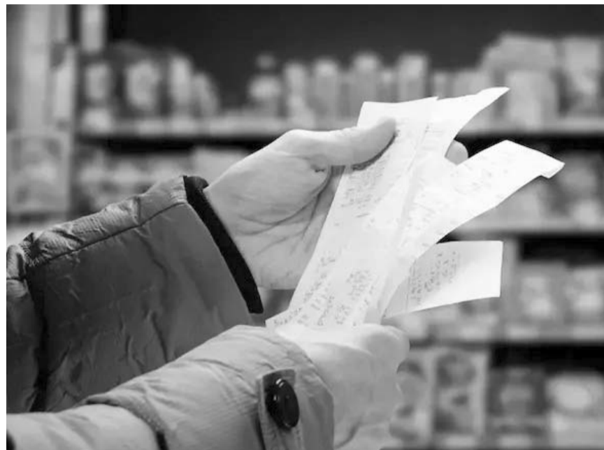
El incremento anual de precios en el onceavo mes del año estuvo ligeramente por debajo del consenso de los analistas de 4.61%.

Al interior del índice subyacente, los precios de las mercancías reportaron un decremento mensual de 0.27% y anual de 2.39%, mientras los servicios aumentaron 0.35% en el mes y 4.9% a