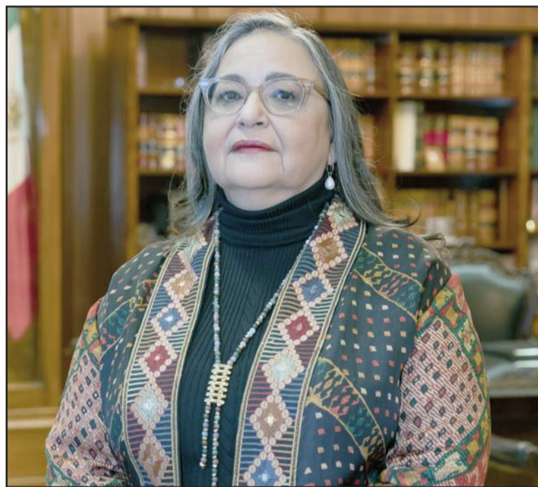
La ministra presentará su segundo y último informe de actividades como titular del Poder Judicial.

Además, se ha cumplido con un principio de máxima transparencia desde un inicio del proceso. Los otros poderes supongo que se harán cargo de la legitimidad de sus respec-