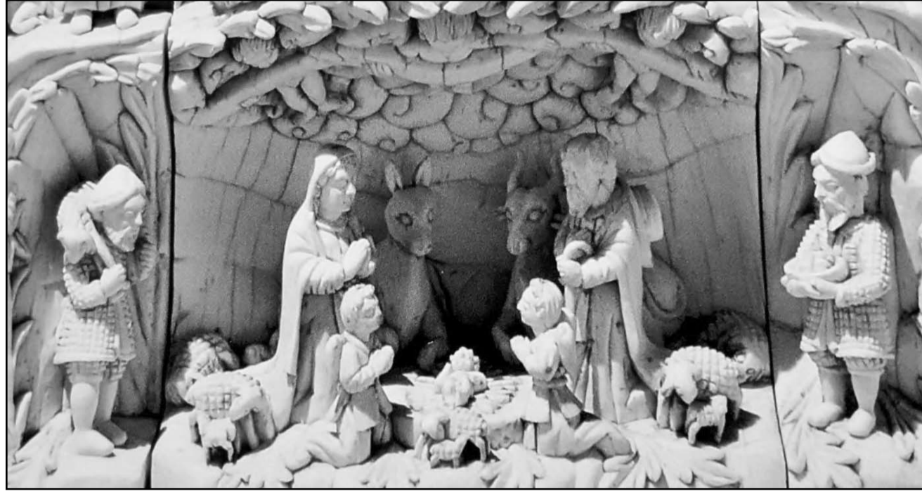
En la Sala Marfiles donde pueden admirar algunos de los nacimientos o Belenes que datan del siglo XVI al XVIII.