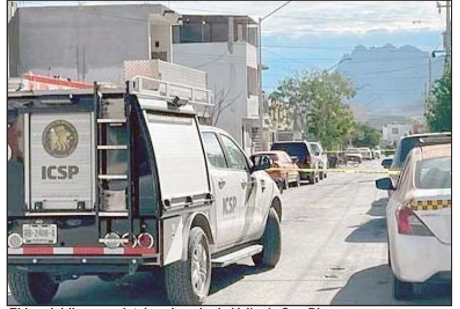
El homicidio se registró en la colonia Valle de San Blas.

Señalaron a los Policías de Cadereyta, que durante la madrugada escucharon detonaciones de arma