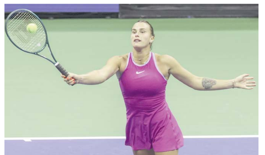
Aryna Sabalenka ganó dos grand slams en el año.

Sabalenka encabezó una votación de jugadora del año que también incluía a Iga Swiatek, Coco Gauff, Jasmine Paolini y Zheng Qinwen, pero la joven de 26 años ganó una votación de los medios de tenis para terminar en la cima después de registrar un récord de 56-14, llegar a siete finales en 2024 y ganar cuatro títulos, defendiendo su título del Abierto de Australia, levantando su primer trofeo del Abierto de Estados Unidos y llevándose a casa dos eventos WTA 1000 en Cincinnati y Wuhan.