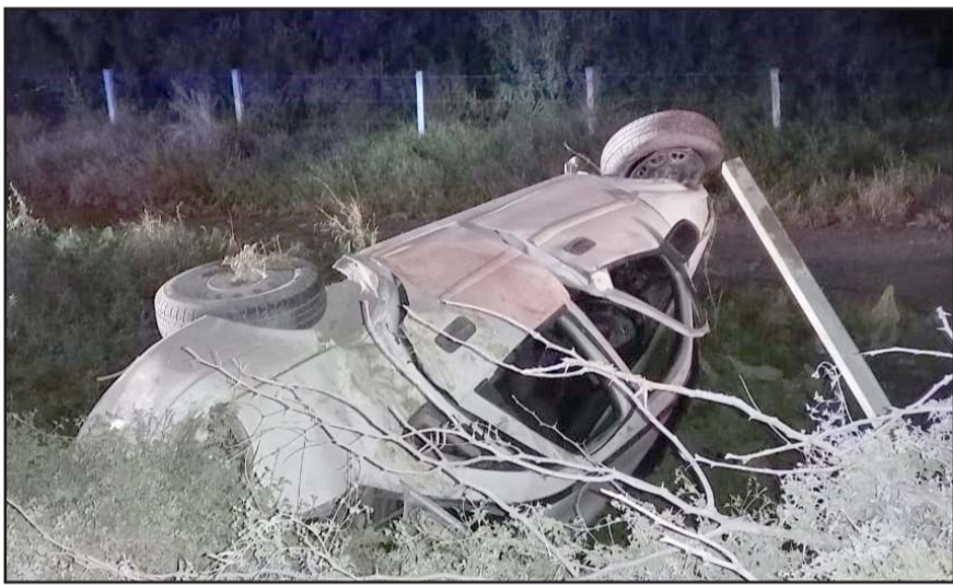
El accidente fue la noche del domingo en el municipio de García

al lugar de los hechos, quienes detectaron que fuera del auto y sobre la calle había cartuchos de arma corta, los cuales fueron resguardados.