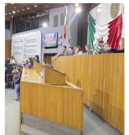
Se programó para mañana.

“Solamente se refiere a una homologación a lo que existe ya en el código fiscal federal, y que solamente adquiere muchas de las modalidades que se tienen a través de la Secretaría de Hacienda y Crédito Público de fiscalización, y algunas herramientas que también utiliza para aquellos que no pagan impuestos, es lo único para quien cumple con sus obligaciones.