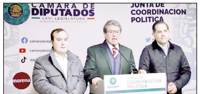
Los legisladores oficialistas señalaron que, de la distribución de los fondos, 10 mil millones de pesos serán destinados a la elección judicial.

"Se ha hecho un gran esfuerzo de conciliación y congruencia para otorgar la prioridad de vida a los