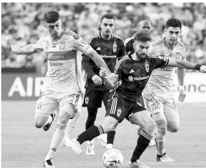
Tigres tiene que ir por todo en 2025.