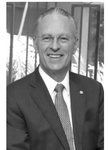
Medina Mora dijo que en estos momentos "el camino es ser claros en las posturas, firmes y siempre con propuestas"

Medina Mora comentó: "Vemos un plan muy estructurado, con actividad, objetivos... Vemos más diálogo con las distintas secretarías, no solo nosotros los buscamos, ellos nos buscan", además de que, a la inquietud de la reforma judicial, Sheinbaum reaccionó con una reunión con el sector privado nacional y extranjero.