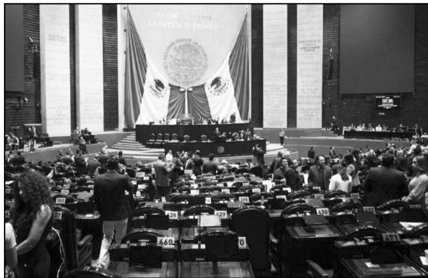
Legisladores, durante una sesión en la Cámara de Diputados.

"Estas leyes son profundamente contradictorias con la idea de justicia y los derechos de acceso a la justicia y la independencia judicial. Nada del derecho al acceso a la justicia y la independencia judicial se resuelve en estas leyes. Al contrario, fortalece la debilidad y la falta de independencia del Poder Judicial", expresó.