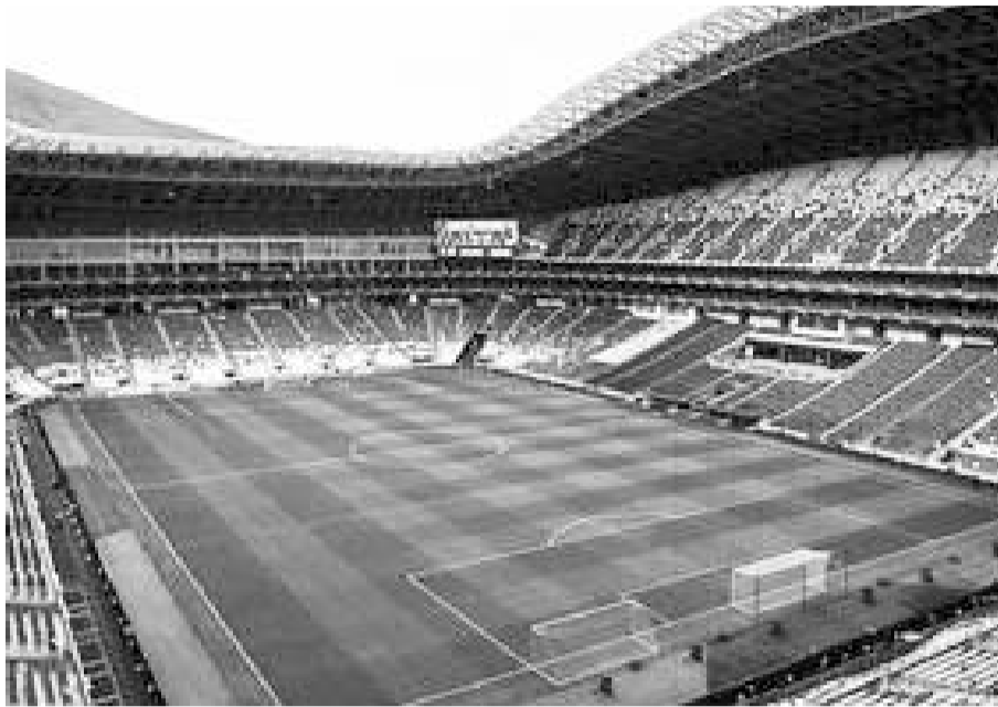
El estadio rayado ha visto a coronarse a dos equipos, que no son los albiazules.

Monterrey ha disputado dos finales en el BBVA, y las dos las ha perdido con Pachuca y Tigres, ¿la tercera la ganará?