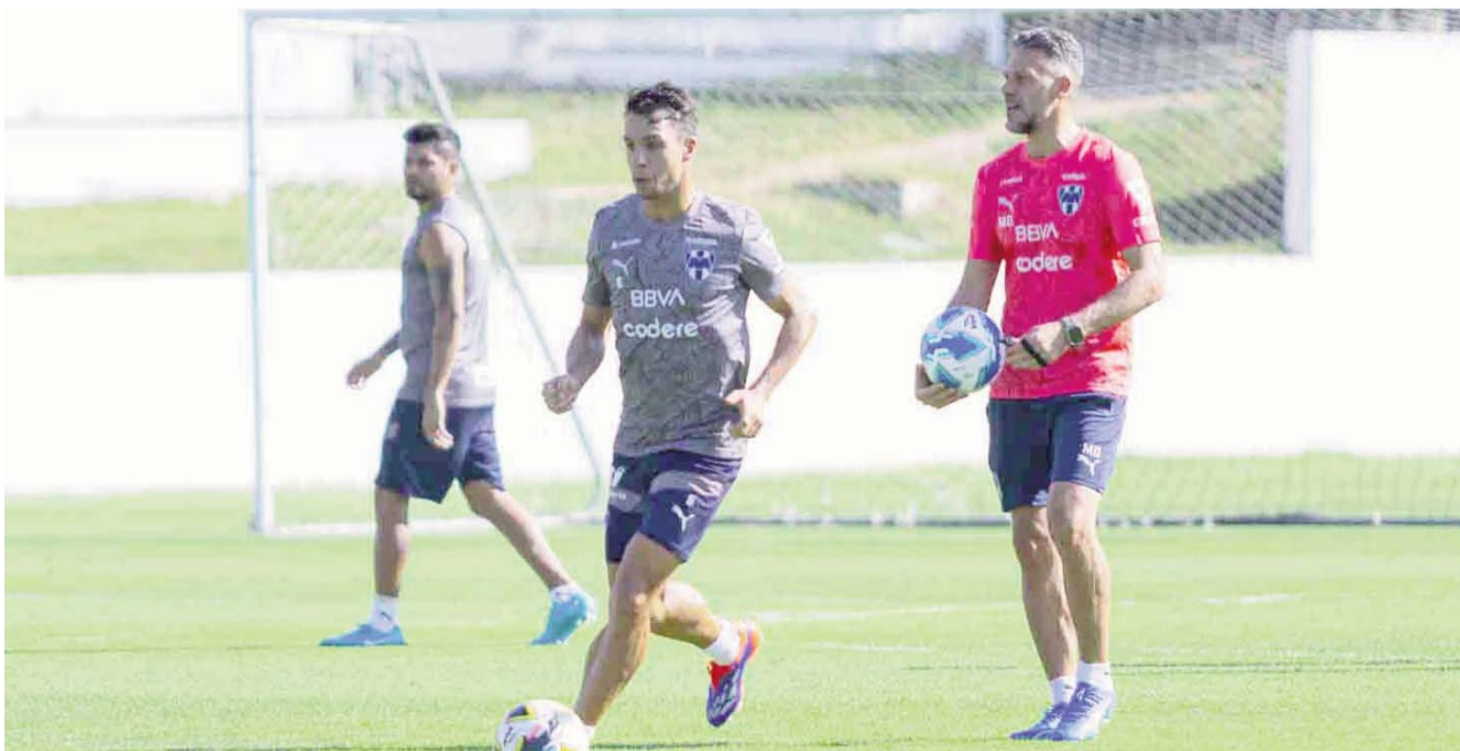
Monterrey entrenó ayer en El Barrial.