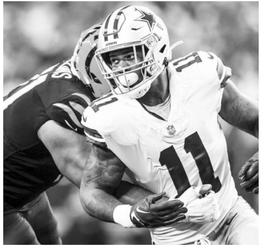
Vaqueros están muy cerca de quedar eliminados en la temporada de la NFL.

Los Bengalíes visitan Tennessee el domingo mientras los Vaqueros juegan en Carolina el domingo.