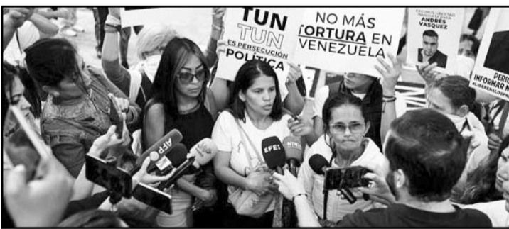
Familiares de "presos políticos" en Venezuela exigen su libertad y el cese de la "represión".

"capacidad de disparar una bala de nueve milímetros" y un silenciador, herramienta letal que podría haber sido fabricada con tornillos. Los investigadores están tratando de determinar si la radiografía pertenece al joven de 26 años o a un familiar, y si tiene algo que ver con el asesinato del CEO, dijeron dos altos funcionarios de la ley a "NBC News".