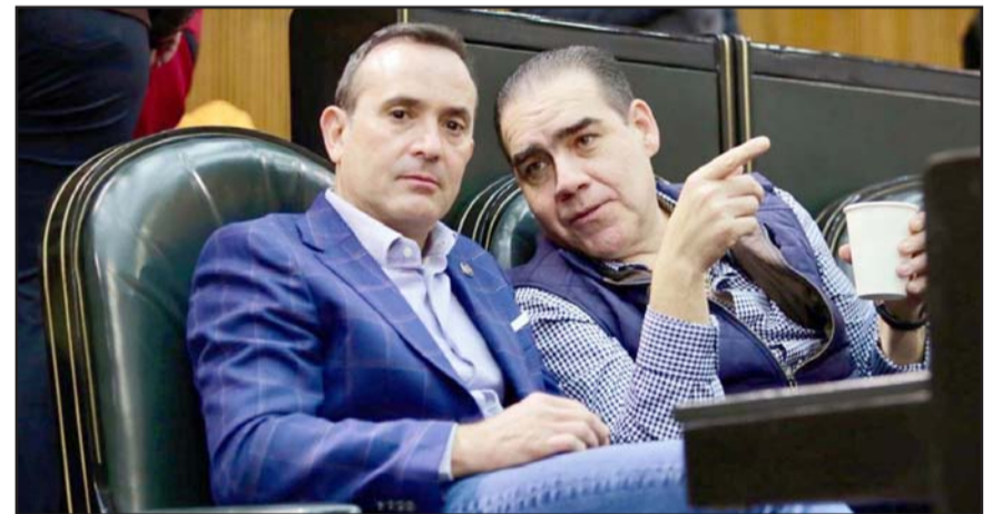
Lo hicieron al no ser aprobado el Código Fiscal