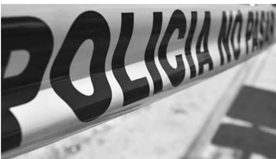
Tabasco lidera nuevamente en homicidios a nivel nacional.

Uno más, fue asesinado en la Villa Jalupa en el municipio de Jalpa de Méndez.