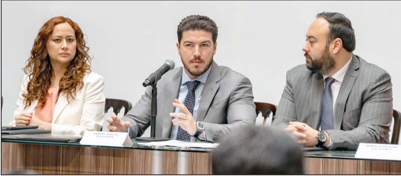
El gobernador mencionó que es el doble del Metro y para eso se requieren recursos.