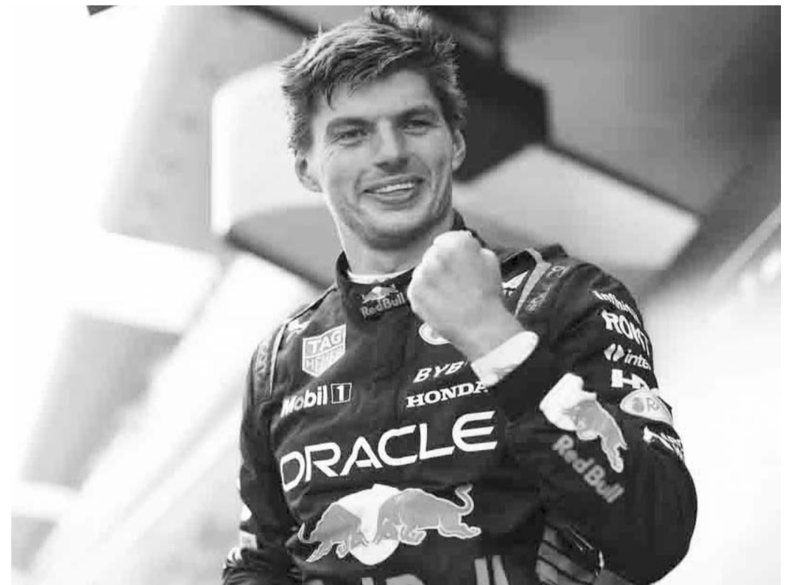
Max Verstappen, campeón de la Fórmula 1.

"Checo Pérez siempre ha sido considerado un gran piloto, pero no sólo para él ha sido duro, porque todos en el equipo también lo sufrimos, porque a veces era simplemente muy difícil conducir el RB20", concluyó.