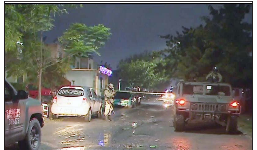
Fue en un baile colombiano en la colonia Valle de Santa María

Luego de que se reportó de lo ocurrido, al lugar arribaron paramédicos y efectivos de la