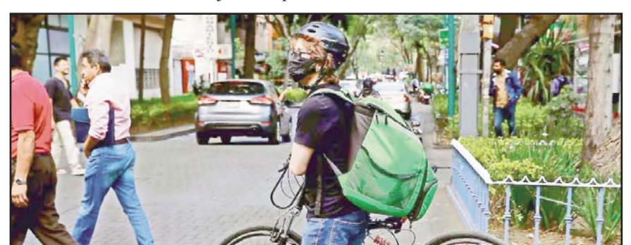
El proyecto de ley establece que las aplicaciones tengan contratos laborales, indemnizaciones, y derechos a utilidades.

También deberán considerarlos en el reparto de utilidades, siempre y cuando el tiempo efectivo laborado sea superior a 288 horas anuales; inscribir a sus trabajadores ante el IMSS; realizar las aportaciones al Infonavit y establecer capacitación.