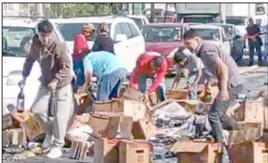
La rapiá se hizo presente por parte de la gente que pasaba por el lugar.

Personal de Guardia Nacional se hizo cargo del accidente múltiple, comenzando con los peritajes correspondientes.