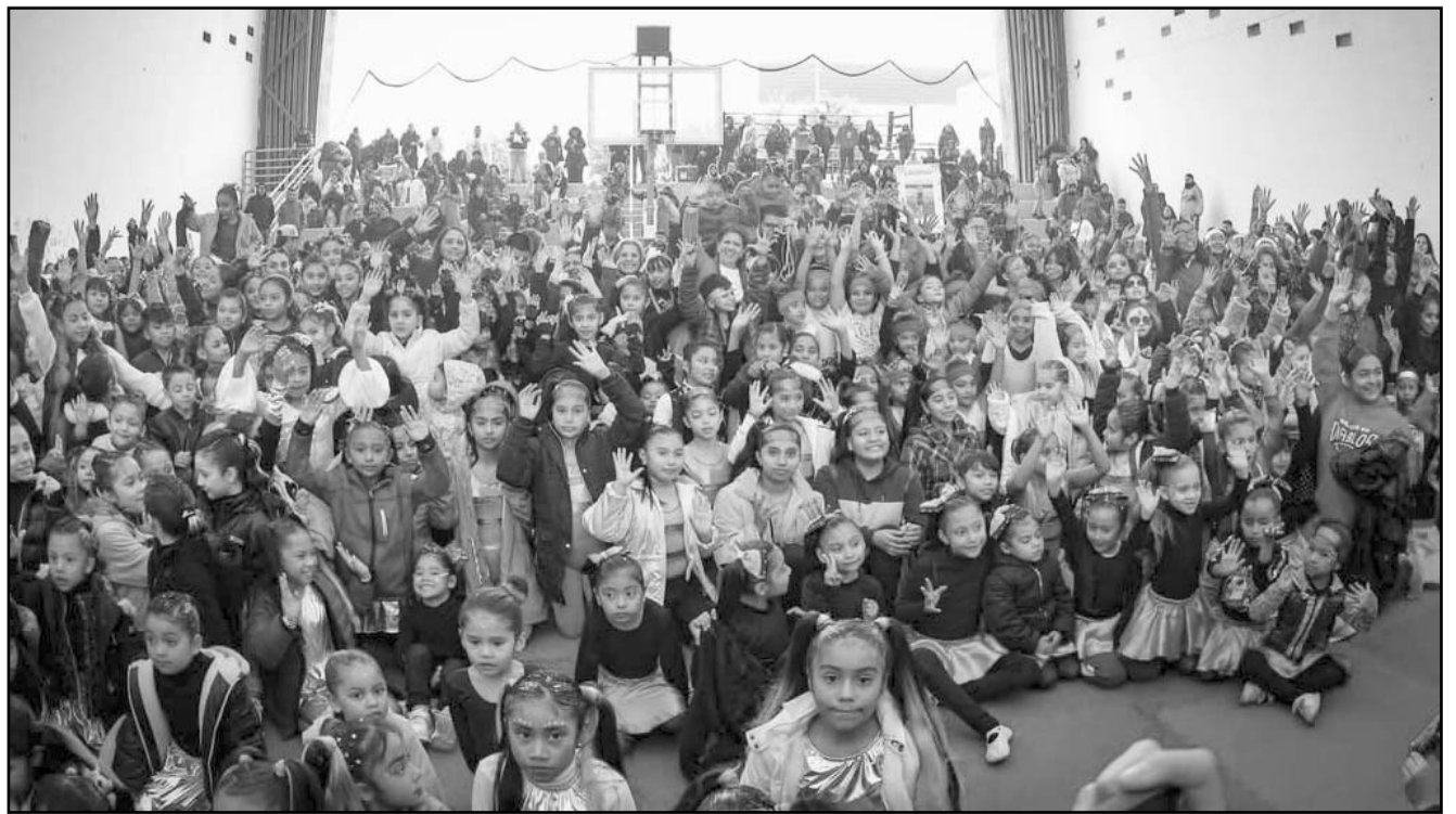
Las coreografías tuvieron un toque especial con temática de la época de los 70 y 80.

Para informes sobre los talleres y servicios que se ofrecen en Centros Comunitarios, se cuenta con el número de teléfono 81-2020-2070.