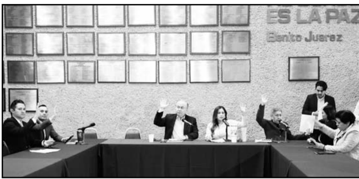
En una maratónica sesión de trabajo quedó aprobada.

En la Comisión Segunda de Hacienda Municipal aprobaron los ingresos al municipio de Apodaca