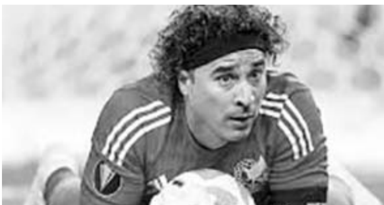
Guillermo Ochoa, en mal momento.

Previo a esto, Nahuel no logró evitar la goleada de 3-0 que recibió su equipo ante San Luis en los cuartos de final de ida del presente torneo corto, motivo por el cual terminó cerrando un año que fue más que irregular, donde sus acciones dentro y fuera de la cancha también influyeron para que los auriazules se fueran en blanco y sin ningún título durante este 2024. (AC)