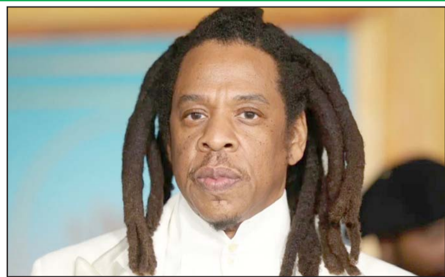
El rapero ha negado todos los señalamientos de abuso sexual a una menor.