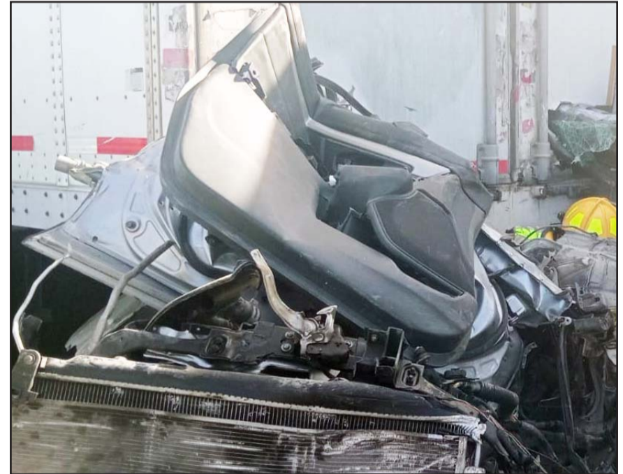
El auto en el que que viajaban fue embestido por dos tráileres.

En primera instancia la camioneta chocó contra un tráiler