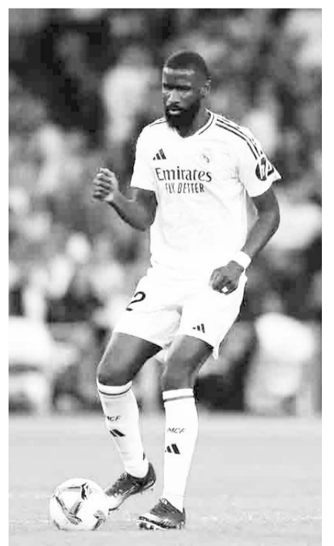
Real Madrid debe ganar hoy.

Cabe destacar que ambos clubes pertenecen a la cuarta división del fútbol español y serán locales en los encuentros frente a Real Madrid y Barcelona.