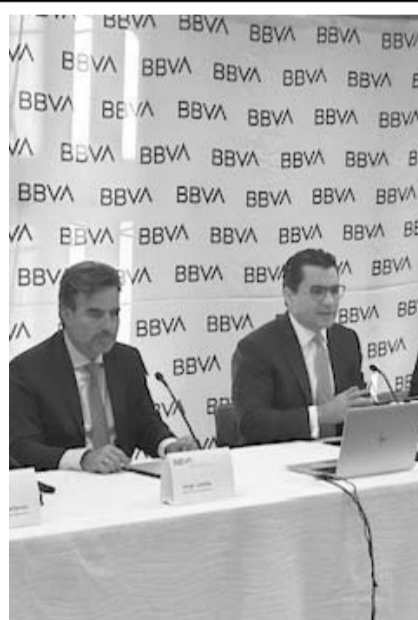
El crecimiento de las utilidades como se ha dado hasta ahora tenderá a ser más lento en 2025

"Lo que estamos viendo que hace la banca en este país es como seguimos incrementando el tamaño del mercado, generando inclusión, incorporando a más mexicanos al sistema financiero y eso habla del la solidez y de la inversión en tecnología que hacen los bancos en este país, el nivel de competidores distintos que tenemos, entonces, todo competidor es bienvenido en México siempre y cuando siga las reglas del juego, debemos de tener mismo servicio, mismo riesgo y misma regulación, por protección de los clientes", abundó.