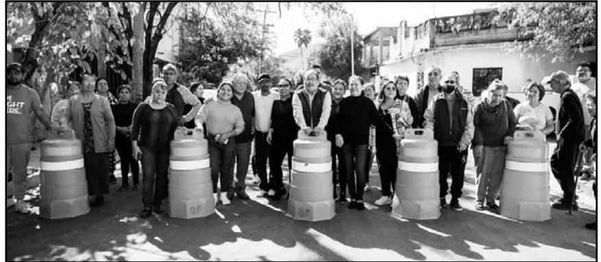
Acompañado de vecinos el alcalde de Escobedo entregó la obra.