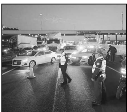
Cierre masivo de carreteras: Transportistas bloquean paso en demanda por el Tren Maya.

En el comunicado, Volaris apuntó que se ha constituido como parte acusadora en un eventual proceso judicial contra esta persona, "para asegurar que enfrente todo el peso de la ley, hasta sus últimas consecuencias", y lamentó los inconvenientes que tal situación causó a los pasajeros.<