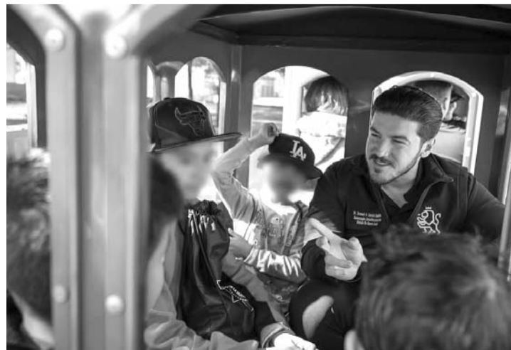
Disfrutaron en familia de los shows y regalos.

contó con la presentación de Los Tripayasos, las Muñequitas Elizabeth y el Grupo Fiebre Loka.(CLG)