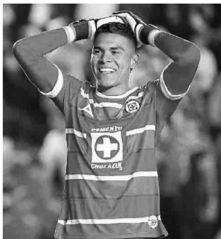
Cruz Azul se muda de casa.

Ante esta situación, los celestes jugarán en el estadio de los Pumas en el primer semestre del próximo año y lo harán en sus juegos de local tanto en la Liga MX como en la Concachampions, en donde buscarán hacerse del doblete.