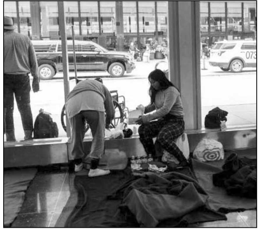
Hasta 500 migrantes juntos han compartido un espacio reducido en el Aeropuerto Internacional O'Hare, Chicago.

que el país está fuertemente dividido sobre cómo tratar a los inmigrantes. Ciudades como Chicago y San Francisco se han opuesto a que sus