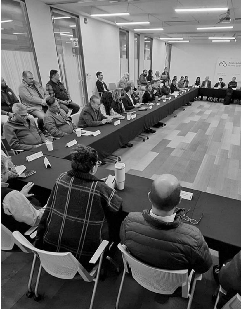
Las representantes de sociedad civil destacaron la urgencia de alertar a la ciudadanía sobre contingencias atmosféricas, y la responsabilidad del gobierno estatal en esta tarea.

Además de un recorrido diario de vigilancia, en municipios de Apodaca, San Nicolás y Escobedo, para detección de fuentes contaminantes.