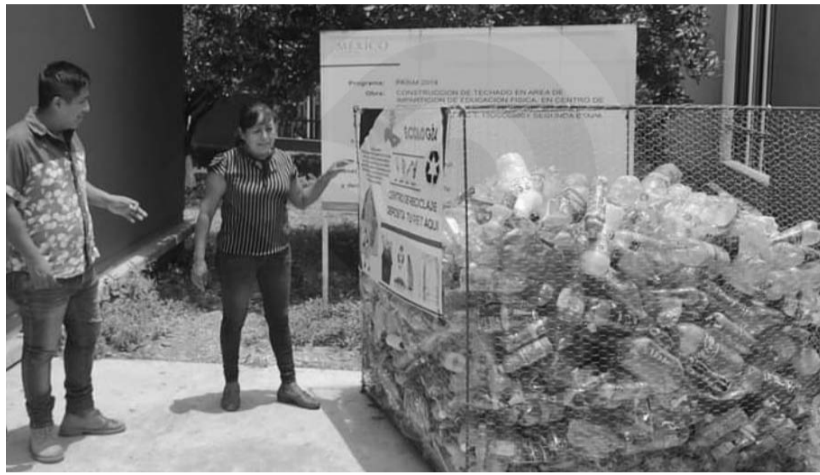
Buscan darle un buen uso.

Con base en la Ley de Hacienda para los Municipios del Estado de Nuevo León, la propuesta plantea un enfoque que permite a los ciudadanos contribuir al fomento de la sostenibilidad, mediante el pago de