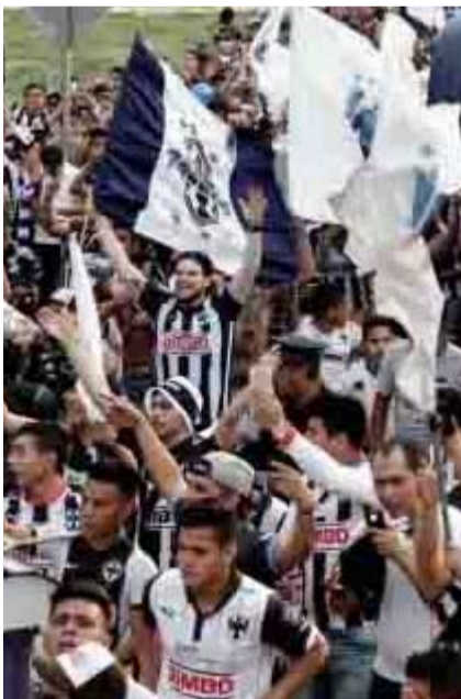
La afición también se prepara.