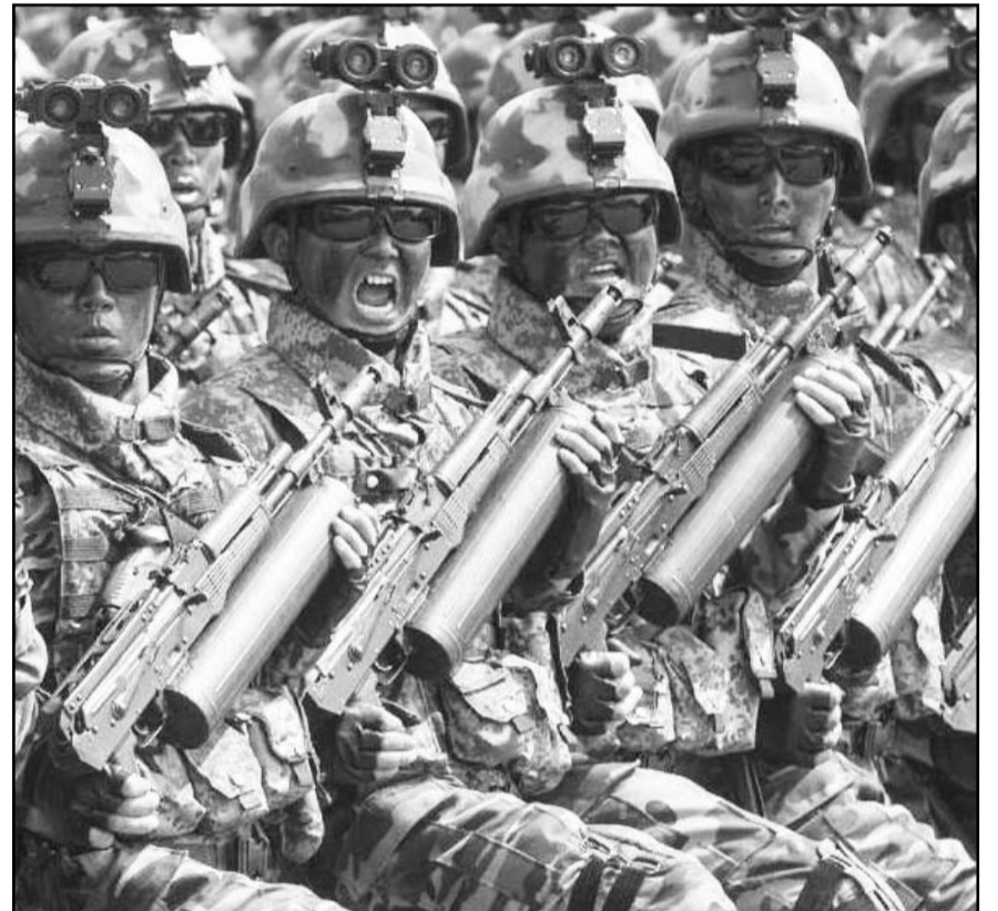
Los rusos intentan llevar a cabo operaciones de asalto con la ayuda de los coreanos, escribió Kovalenko en Telegram.

Moscú en casi una quinta parte de su territorio, lanzó en agosto una incursión en la región rusa de Kursk, creando un enclave que, según dijo, podría utilizarse como moneda de cambio en las conversaciones para poner fin a la guerra.