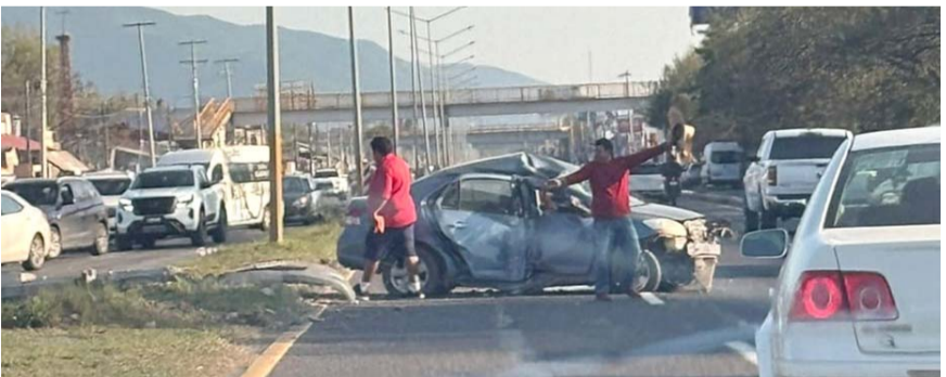
El accidente fue reportado sobre la Carretera Nacional