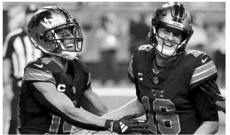
Leones busca consolidarse en las alturas de la NFL.

Por estos motivos es que hoy se esperaría que haya un gran encuentro en el estadio de los Leones de Detroit y el juego sea de pronóstico reservado, esperando así que la NFL no defraude en la previa de este emocionante encuentro.