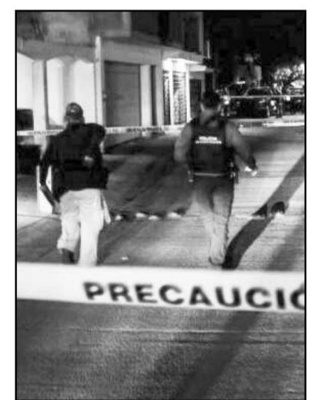
Los asesinatos de influencers reflejan la ola de violencia.

Lo último que circuló sobre el youtuber, fue que el pasado 28 de noviembre, dos sucursales del restaurante Ranch Roll, presuntamente vinculadas con él, fueron escenario de ataques armados en Culiacán, Sinaloa. Aunque el no declaró nada al respecto.