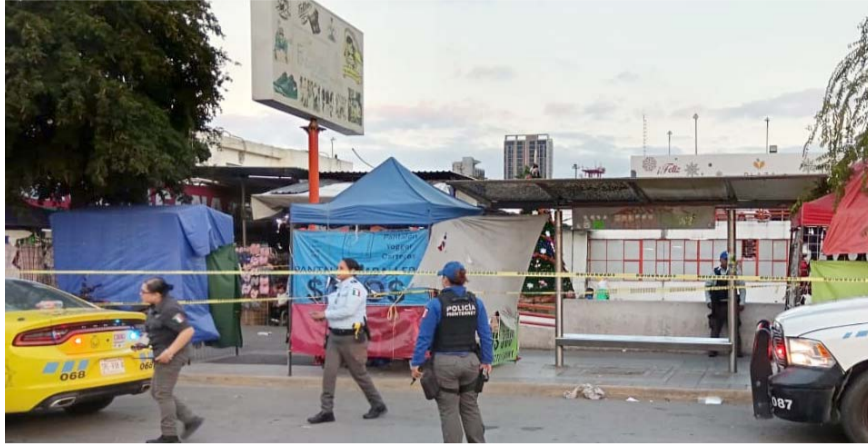
La víctima no fue identificada

Al lugar arribaron socorristas de la Cruz Roja, quienes al revisar al masculino solo confirmaron que ya no contaba con signos vitales.