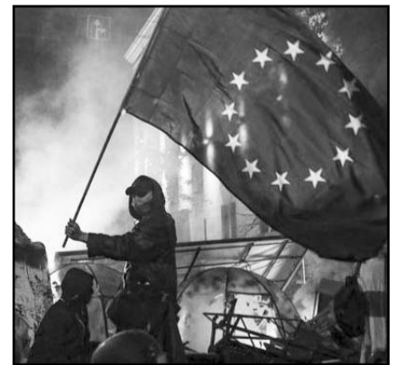
Antes de las elecciones la gente salía a la calle todos los días a favor de un rumbo proeuropeo.

De acuerdo a diversos analistas, antes de que el país elija un nuevo presidente, deberá resolverse una intensa batalla legal en los tribunales.