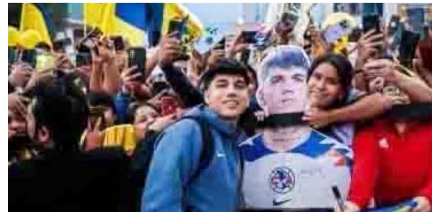
América recibió el calor de su afición en la sultana del norte.

Con la frase de "Yo tengo corazón y quiero que gane el Monterrey y pierda el América", Ricardo "Tuca" Ferretti dijo en un programa de ESPN que preferiría que el acérrimo rival de su equipo se coronara a que lo hagan las Águilas.