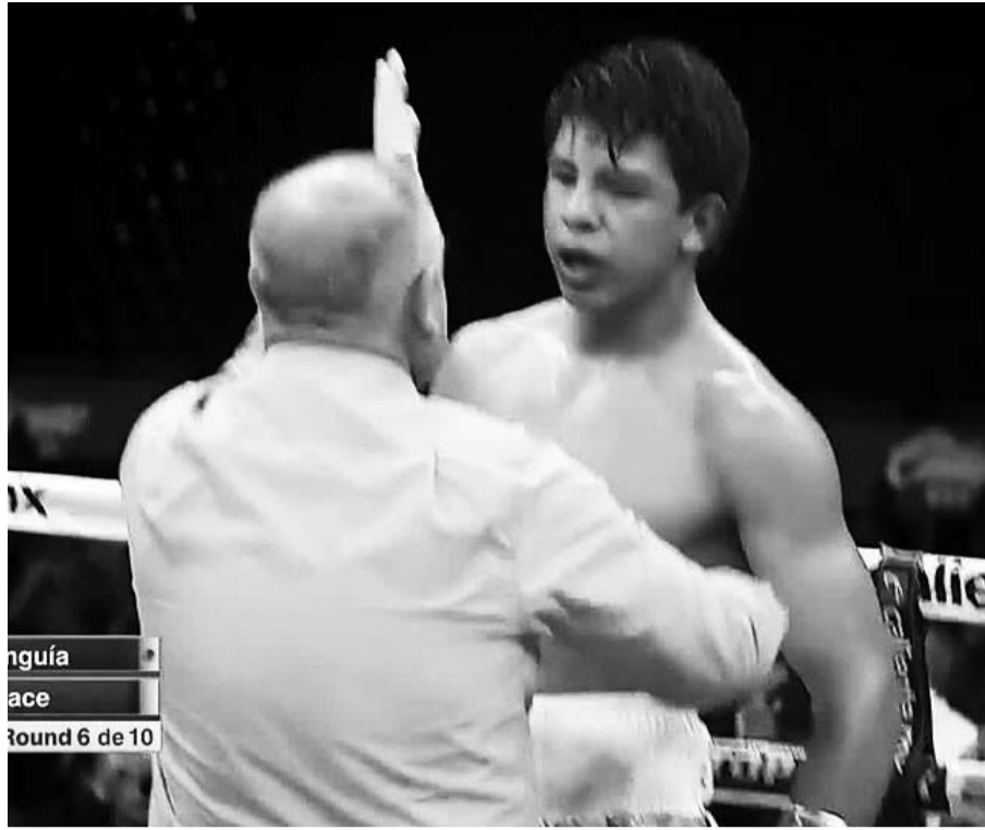
El referee tuvo que detener la pelea dada la condición del mexicano.

Ante esta situación, el nacido en Tijuana ya tiene dos derrotas como boxeador profesional y este segundo traspié es aún más inesperado que el primero, en donde Saúl Álvarez lo superó con facilidad en mayo pasado.