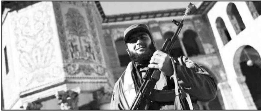
Hayat Tahrir al-Sham es el grupo islamista que lidera la coalición rebelde que tomó el poder en Siria.

policías apliquen las leyes de inmigración, mientras que algunos condados en Massachusetts y Texas están tratando ahora de sumarse a la iniciativa.