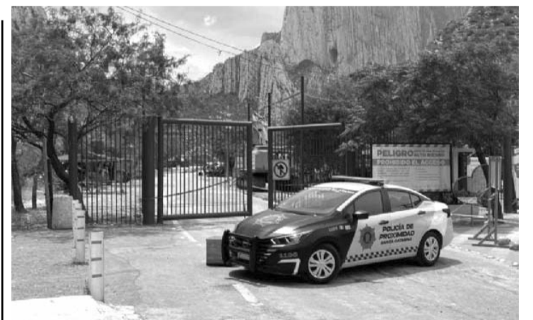
No hay garantías