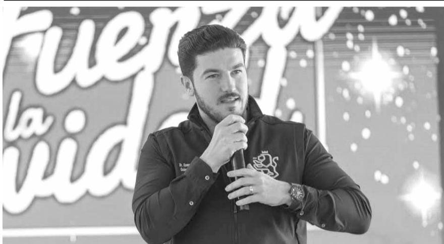
A través de historias de Instagram, el mandatario estatal compartió que por primera vez la entidad logró ser el número uno.

sociedad de Nuevo León y que son la vida todos los neoloneses”, agrega el escrito. (CLG)