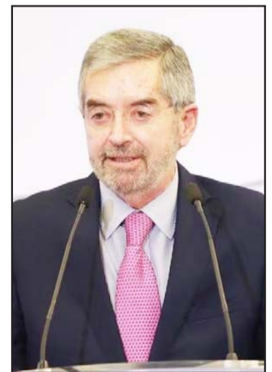
La SRE destacó la importancia de tener una relación bilateral con Canadá.

Durante su visita, De la Fuente se reunió con los cónsules de los estados de Texas y Oklahoma, además de tener encuentros con abogados del Programa de Asistencia Jurídica a Personas Mexicanas en Estados Unidos (PALE).