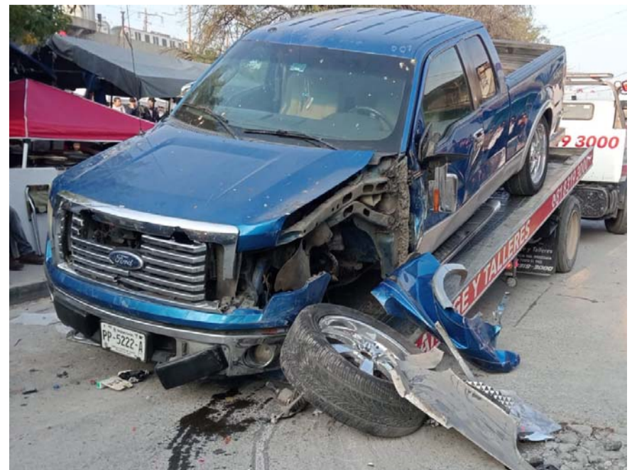
El conductor de la camioneta aseguró que fue un desperfecto en el sistema de frenos lo que provocó que perdiera el control

Personal de Movilidad y elementos de Protección Civil del Estado se encargaron de investigar las causas del accidente.