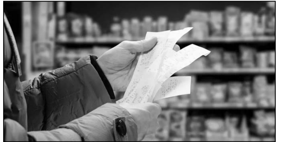
Expertos de Banamex calculan que la inflación sea de 3.8% al final del siguiente año.