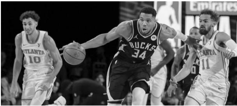
Milwaukee dejó en el camino a los Hawks de Atlanta.

Ante esta situación, hoy volverá la actividad de los toros en la Sultana del Norte y por eso se esperaría una gran tarde en la Plaza de Toros de Cadereyta Jiménez, esperando que en el espectáculo pueda cumplir a las expectativas. (AC)