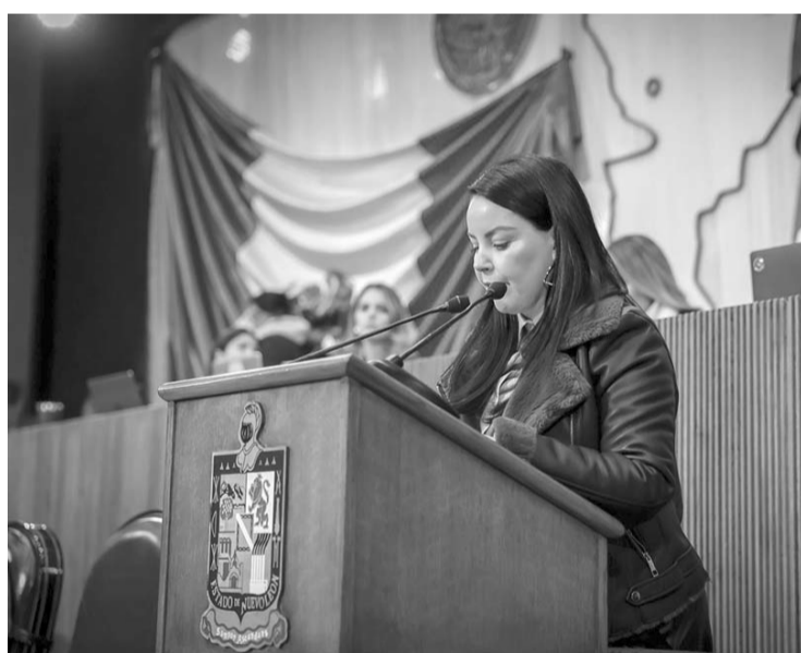
La bancada de Morena del Congreso Local, impulsará una iniciativa con proyecto de Decreto a la Ley de Educación.

El lunes 23 cierran las festividades de la Regia Navidad con el Show de Santa a las 16:00 horas. Posteriormente divertirá con sus travesuras el Payaso Yepa Yepa. (JMD)