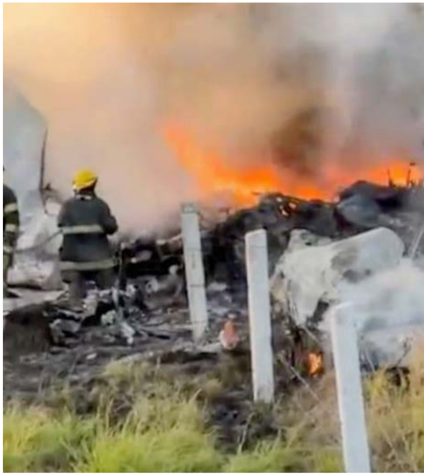
A pesar de la rápida movilización de los puestos de socorro, cuando llegaron el hombre ya estaba sin vida.

Hasta el sitio llegaron elementos de Servicios Periciales y la Agencia Estatal de Investigaciones para iniciar las indagatorias del caso.