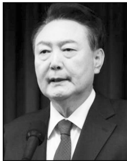
El Parlamento, formado por 300 legisladores, logró los votos para avanzar con el proceso.

En el Parlamento, los miembros de la oposición celebraron con vítores, mientras que los oficialistas aban-