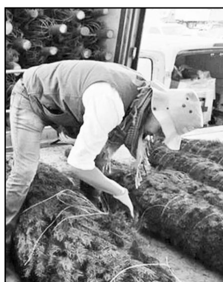
Del total de árboles inspeccionados, solo un lote de mil 150 presentaba larvas.

En Baja California se revisaron 477 mil 324 árboles, en Sonora 75 mil 471 y en Tamaulipas 3 mil 654.