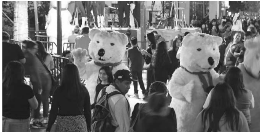
Del domingo 15 de diciembre al lunes 23 habrá presentaciones musicales, de baile y otras expresiones artísticas.