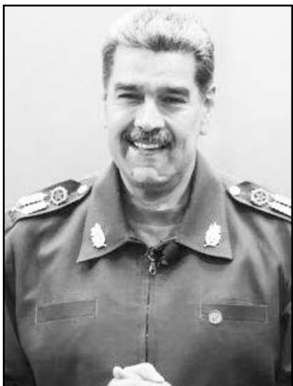
El líder venezolano calificó al organismo de 'cobarde y cómplice'.

Las protestas se producen en medio del creciente enfrentamiento entre la oposición política y el partido gobernante, Sueño Georgiano. Comenzó con las elecciones parlamentarias de octubre, y se intensificó con el reciente anuncio del gobierno de suspensión del proceso de adhesión de Georgia a la Unión Europea.