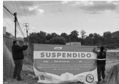
Fue por emitir contaminantes a la atmosfera

Desde la Alianza del Aire se hizo un llamado a los 18 municipios convocados, incluyendo a los 3 ausentes: Abasolo, Cadereyta y Ciénega de Flores, a que participen del convenio de colaboración propuesto por la Secretaría estatal de Medio Ambiente y se comprometan con este esfuerzo de actualizar el PRCA.