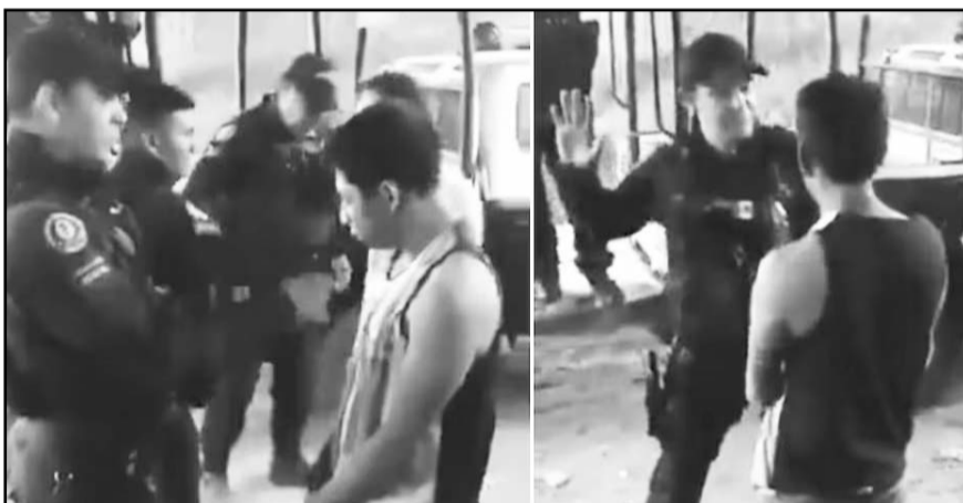
La Secretaría de Seguridad de Celaya se deslindó de los abusos y humillaciones cometidos por ex policías municipales.