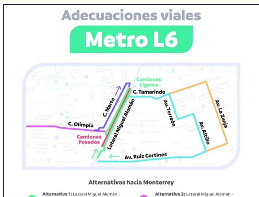
La Secretaría de Movilidad y Planeación Urbana cerró los carriles principales de la Avenida Miguel Alemán.

nes y utilizar las vías alternas. ¡Disculpa los inconvenientes!”.