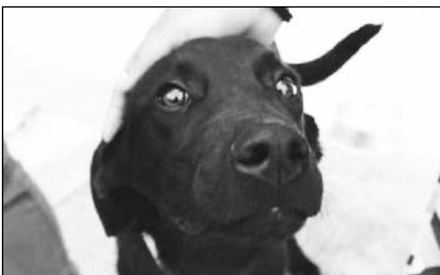
Organizaciones animalistas exhortan a no regalar mascotas ya que la mayoría de los animales que son obsequiados terminan en situación de abandono.