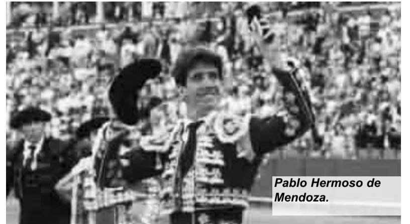
Pablo Hermoso de Mendoza.