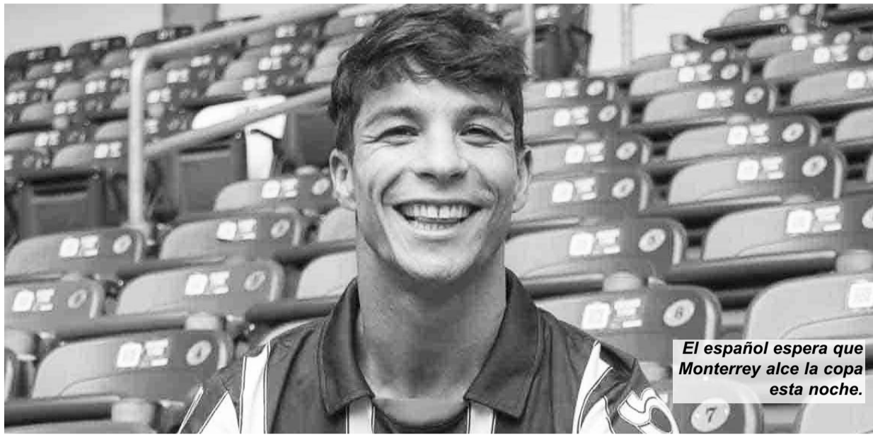
El español espera que Monterrey alce la copa esta noche.

Los Rayados perdieron en la final de ida ante América 2-1 en el estadio Cuauhtémoc de Puebla, y ahora la vuelta será hoy y en el Gigante de Acero a las 19:00 horas. (AC)