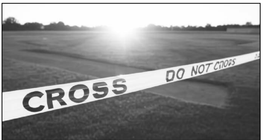
Hasta el momento se reporta un hombre muerto, de quien se desconoce su identidad. Extraoficialmente se sabe que hay dos hombres detenidos.

Los ampáyer del juego deportivo determinaron suspender el juego de béisbol, al desconocer lo que había sucedido, dado que los disparos se escucharon muy cerca de las canchas de la Liga de Béisbol de Recursos.