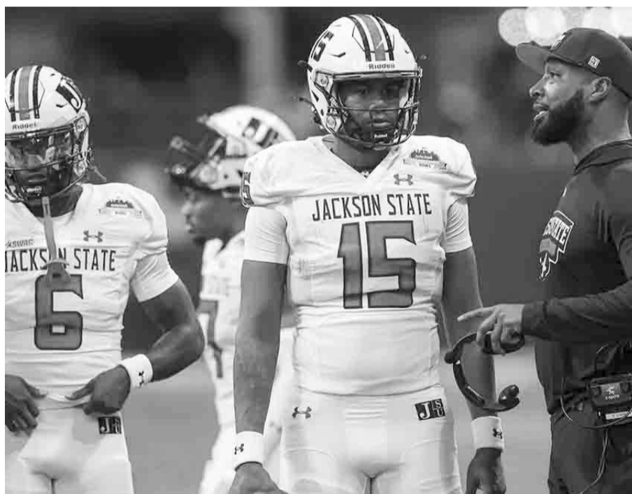
El Estado de Jackson se impuso a la Universidad de Carolina del Sur.

Con esta situación, el equipo de Jackson State conquistó el primer tazón colegial de la NCAA y será entre este mes, así como también el próximo, cuando se realicen los siguientes.