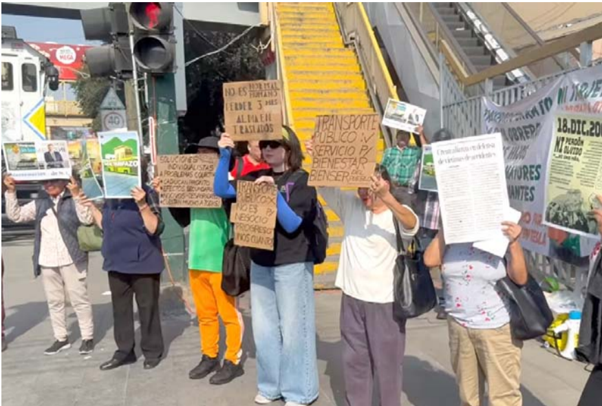
Con pancartas en mano, los afectados exigieron al Gobierno del Estado detener el nuevo incremento