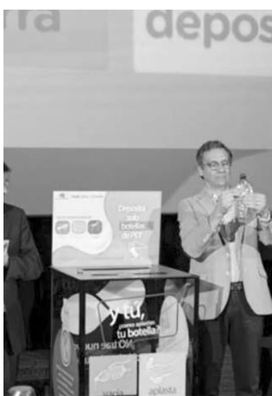
Buscan impulsar el reciclaje.

Así nace el programa se complementa con un cine spot informativo proyectado en 33 cines de Nuevo León, que invita a los asistentes a participar activamente en el proceso