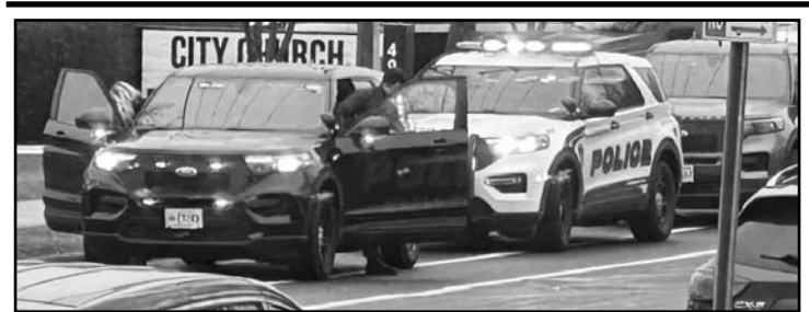
Las víctimas fatales son una profesora y un estudiante adolescente; mientras que el agresor era alumno de la escuela.

Sin embargo, este lunes 16 de diciembre, el juez Juan M. Merchan rechazó la petición del presidente electo de Estados Unidos, Donald Trump, aunque aún no hay claridad sobre el caso.