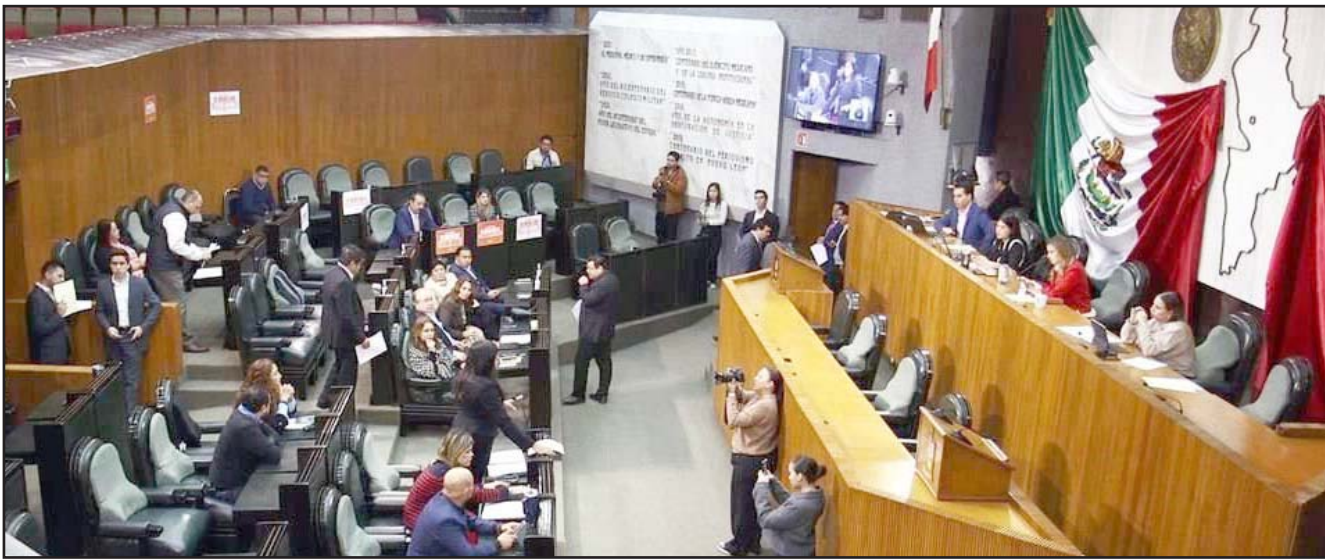
De acuerdo con la ley, el viernes 20 de diciembre es el último día de labores por parte de los diputados antes de irse a su período vacacional.