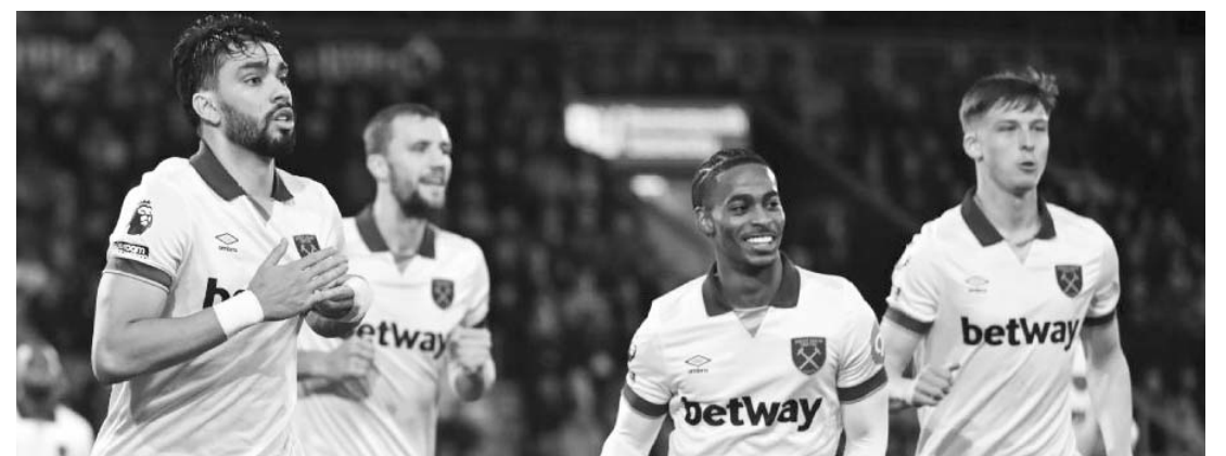
West Ham empató con Bournemouth

Mientras tanto, la escuadra del Bournemouth es sexta con 25 unidades cosechadas en la campaña.