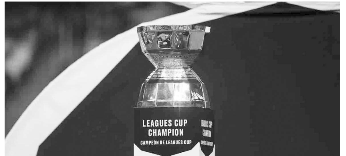
Será hasta inicios del próximo año cuando Concacaf dé a conocer el calendario.

Los clubes mexicanos intentarán terminar en la próxima Leagues Cup con el dominio de la MLS en este torneo; recordar que la escuadra del Inter Miami se coronó en esa justa durante agosto del año pasado.