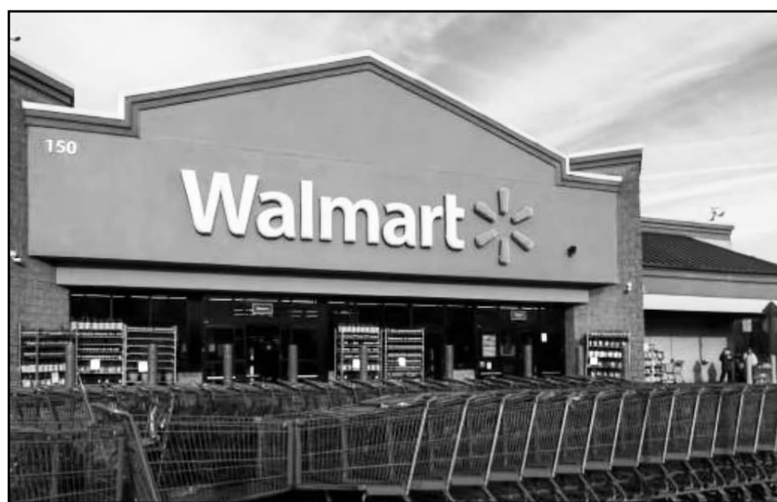
La Cofece ordenó cesar las prácticas abusivas, prohibiendo la aplicación de represalias contra proveedores y exigiendo actualizaciones en sus políticas internas.

La semana pasada, Walmart aseguró que la decisión de Cofece es incorrecta porque "han actuado en conformidad con las leyes aplicables" y advirtió que "... Walmart impugnará la decisión de Cofece".