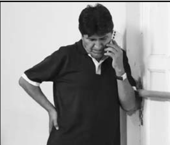
La fiscal dijo que la orden de aprehensión fue emitida el pasado 16 de octubre.

Gutiérrez explicó que no hizo mención antes porque "el caso es muy complejo", debido