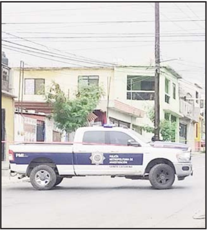
Ocurrió en Santa Catarina.

La unidad de carga siniestrada, informaron las autoridades correspondientes, traía la razón social Transportes Especializados Rothka y remolcaba las dos pipas con capacidad de 35 mil litros cada una.