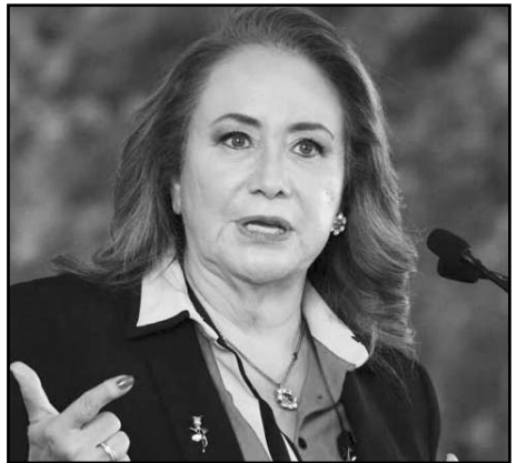
Esquivel interpuso diversos amparos y recursos para impugnar.

La Máxima Casa de Estudios señaló que acatará en sus términos la resolución