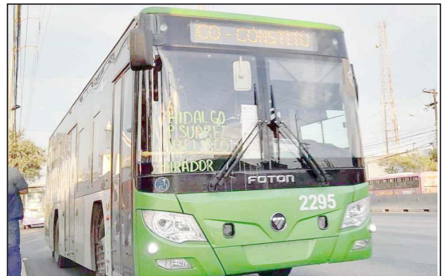
Como cada año, se revisará el incremento en el precio de los insumos, sin que esto sea un sinónimo de aumento en los costos por pasaje.

“Sabemos que todo se está incrementando, lo que si podemos asegurar es que vamos a cuidar la economía de los usuarios”.