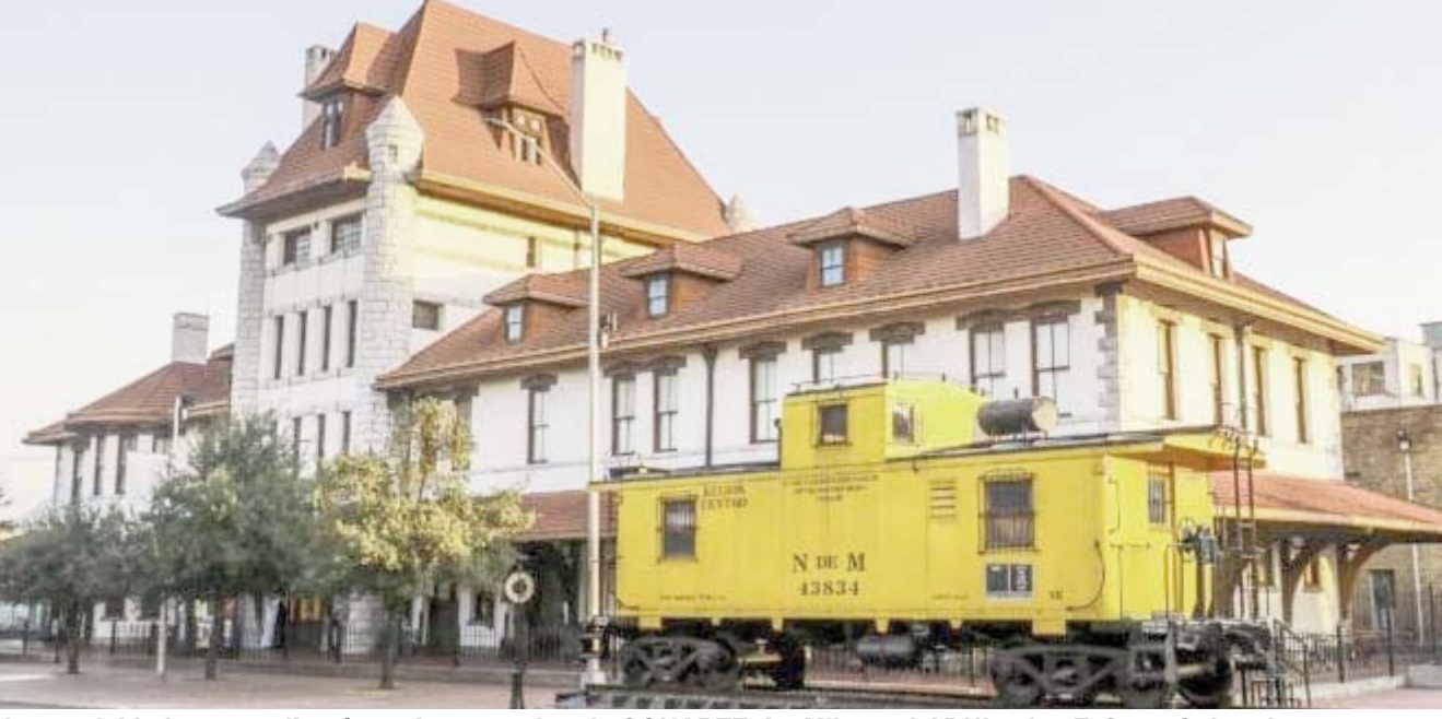
Las actividades se realizarán en los espacios de CONARTE, La Milarca, LABNL y las Esferas Culturales.