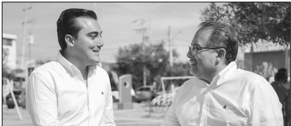
Exhortaron al resto de la militancia a unirse y dejar a un lado las divisiones.