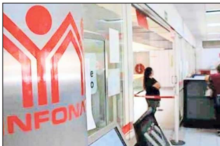
La Comisión de Vivienda de la Cámara de Diputados suspendió la sesión para dictaminar la propuesta.

Más tarde, Monreal ofreció una conferencia de prensa en la que detalló que, a pesar de que había disposición de todos los grupos parlamentarios para convocar a una sesión extraordinaria, determinó no promover el periodo extraordinario, toda vez que el sector empresarial le pidió hacer un análisis más profundo en la materia. "No habrá extraordinario (...) me reuní con empresarios y me han pedido que valoremos más esta minuta. Todos están en disposición de llevar a cabo el periodo, pero es una valoración interna de que no haya periodo extraordinario, para dar tiempo a