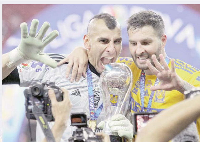
Tigres cuenta con cinco títulos en los últimos diez años.

En los últimos 10 años, América y Tigres han sido los equipos que más títulos han sumado en el fútbol mexicano con cinco cada quien