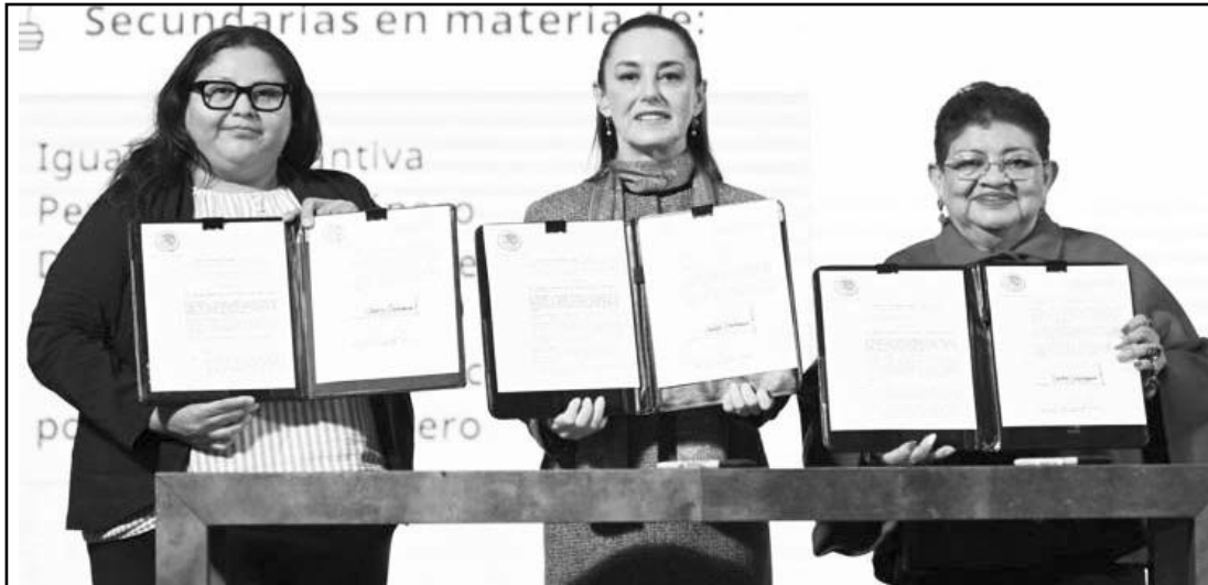
La presidenta Claudia Sheinbaum firmó el Decreto de siete leyes secundarias en materia de igualdad de género, perspectiva de género.

“Yo creo que ese derecho deben de respetarlo, de que este parlamento abierto o el diálogo deben de existir y ahí en ese diálogo que nos escuchen nuestro punto de vista, porque la iniciativa que ya fue aprobada en el Senado la vemos que no está completa”, remarcó.