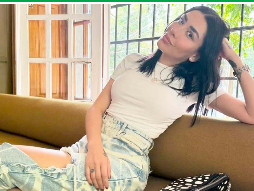
"La Matrioshka" es reconocida por su participación en "Acapulco Shore".