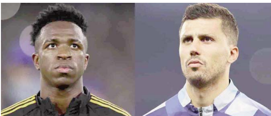
El brasileño Vinicius y el español Rodri, los principales candidatos.