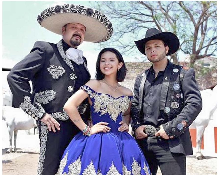
Diversos videos en redes sociales muestran la baja asistencia al concierto.

Además, Pepe aprovechó la ocasión para respaldar a su hija Ángela, quien también ha sido blanco de comentarios por su relación con el cantante sonorense. Tras el show, Nodal y Ángela fueron vistos juntos.