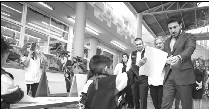
El mandatario estatal recorrió las instalaciones

Posteriormente, se trasladó a la Universidad General Emiliano Zapata, donde constató los proyectos de Educación Media Superior y Superior impulsados por este frente. (CLG)