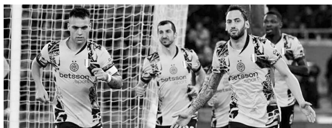
Inter se alzó con un contundente triunfo.

Por su parte, la escuadra de Lazio se quedó en las 31 unidades para que así sean quintos en el campeonato.