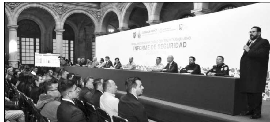
El ex vocero y fiscal en turno dijo que se han detenido 147 agresores durante 2024.

Indicó que ha llevado adelante un proceso de revisión y actualización de su normatividad interna que le permite realizar el análisis y los trámites correspondientes dentro de los cauces universitarios, para dirimir los asuntos relacionados con la integridad y honestidad académicas.