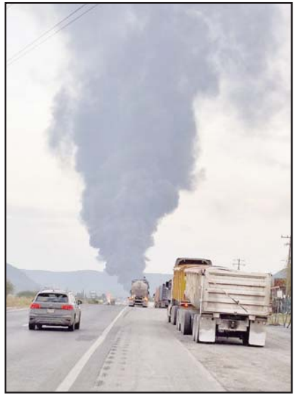
El tráiler remolcaba dos pipas.

Fue necesario que los rescatistas de las diversas direcciones de Protección Civil, cerraran el tránsito vehicular de