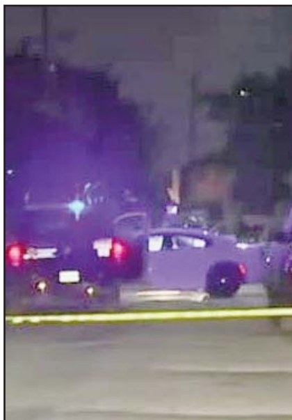
Recibió al menos ocho balazos.

De acuerdo con una fuente allegada a los hechos, la tarde del lunes arribaron dos sujetos portando armas de fuego hasta donde se hallaba su adversario, al tenerlo en la mira le dispararon para luego escapar a toda velocidad en el auto.