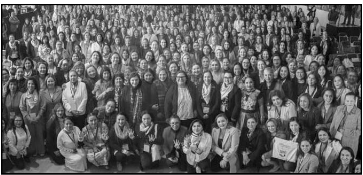
Presidentas municipales se reúnen en Los Pinos; buscan fortalecer liderazgo femenino.

Las áreas federales de seguridad, han sostenido que la exigencia del CJNG a los funcionarios de esta administración y la anterior, es exigir la salida del Ejército Mexicano de las calles y que designe a algún mando policial de sus filas.