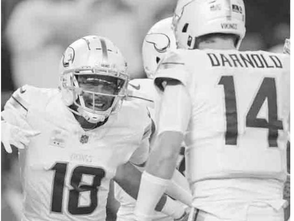
Minnesota alcanzó las doce victorias en la temporada y ya está en postemporada.