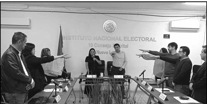
El Consejo Local aprobó los nombramientos de 84 consejerías titulares

Durante la reunión, las consejerías recibieron información sobre la reforma constitucional en materia del Poder Judicial, el marco geográfico electoral para esta elección y la integración de mesas directivas de casillas, entre otros temas. (CLR)