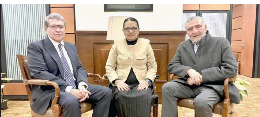
Los coordinadores parlamentarios de la Cámara Baja y Alta se reunieron en Palacio Nacional.

"El Comité de Administración, consciente de la importancia de la difusión de las actividades que se desarrollaron en el interior de la Cámara de Diputados, así como del contenido y alcance de los logros, de las diferentes reformas discutidas y aprobadas, considera conveniente que se autorice llevar a cabo la campaña de difusión de logros legislativos con motivo de la conclusión de la 65 Legislatura. Se autorizan recursos hasta por 75 millones de pesos".