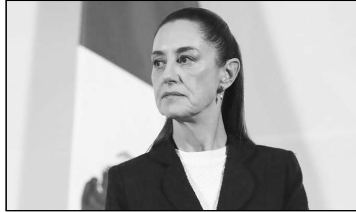
La Asociación General de las y los Trabajadores, exigen diálogo con Sheinbaum y diputados por reforma al Infonavit.

“Ahora toca a los Estados también legislar en la materi.