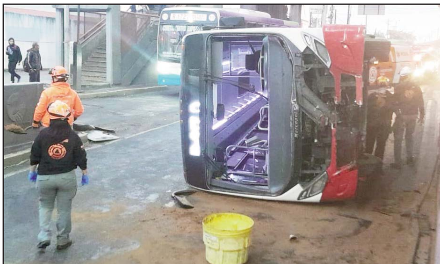
Presuntamente el chofer recibió un cerrón y luego se estrelló.

Los oficiales circularon por la calle Guerrero cuando visualizaron a tres personas a bordo de un vehículo en color gris HB20s con placas de circulación SGY-705B de Nuevo León en actitud sospecha.