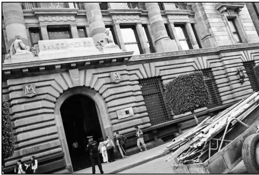
La expectativa para el crecimiento del PIB de México en 2025 se ajustó a 1.12%, ligeramente inferior al 1.20% anterior.

Con ello, el consenso de 41 grupos de análisis y consultoría económica del sector privado nacional y extranjero redujo el pronóstico del PIB del primer trimestre