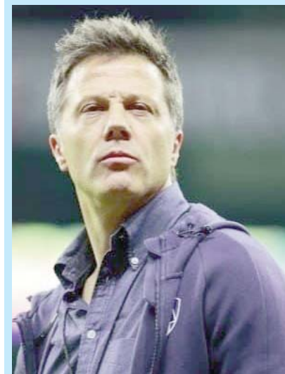
No conoce el éxito en toda su carrera.

Sin embargo, los más ganadores han sido tanto Águilas como felinos, quienes sin duda alguna han marcado una pauta en el fútbol mexicano en los últimos tiempos.