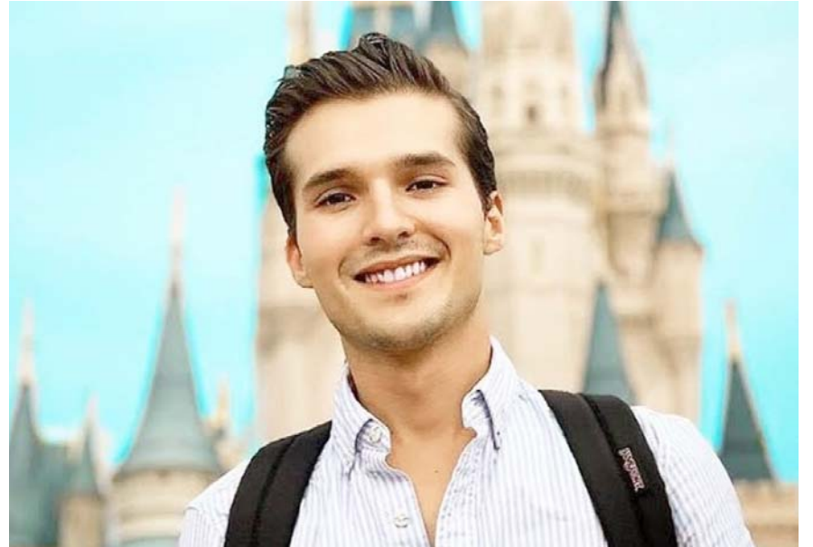
Los exnovios del influencer compartieron sus experiencias de maltrato.

Incluso, en noviembre el influencer amenazó con suicidarse, luego de que Shadia terminara la relación, por las múltiples infidelidades de Aponte.