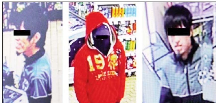
Asaltaba principalmente tiendas de conveniencia.

De inmediato los policías siguieron al masculino y lograron detenerlo.