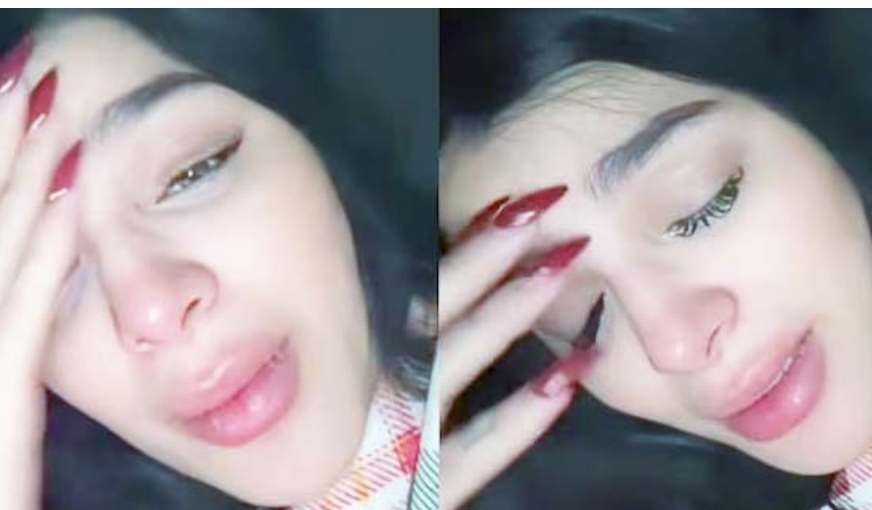
La influencer confesó tener una infección urinaria que la ha dejado muy mal.