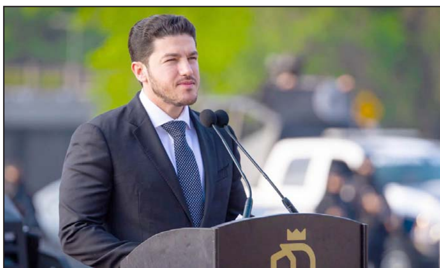
Las administraciones municipales afectadas serán las de San Pedro Garza García, Juárez, García, Pesquería y Marín.