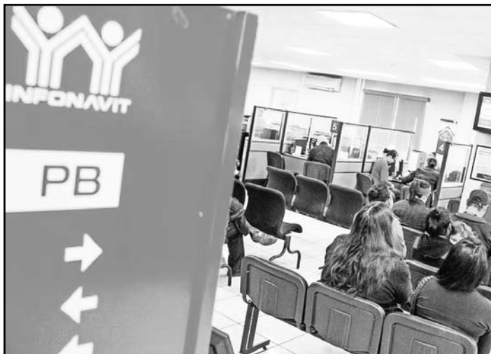
Aseguraron que la iniciativa aprobada por el Senado otorga mayor poder de decisión al gobierno federal.

El expresidente de la Confederación Patronal de la República Mexicana (Coparmex), Gustavo de Hoyos, dijo que "es nocivo lo que se quiere hacer, eliminando el gobierno tripartito del Infonavit, dejarlo decorativamente para que el gobierno federal decida qué se hace, qué no y cómo se invierte el recurso".