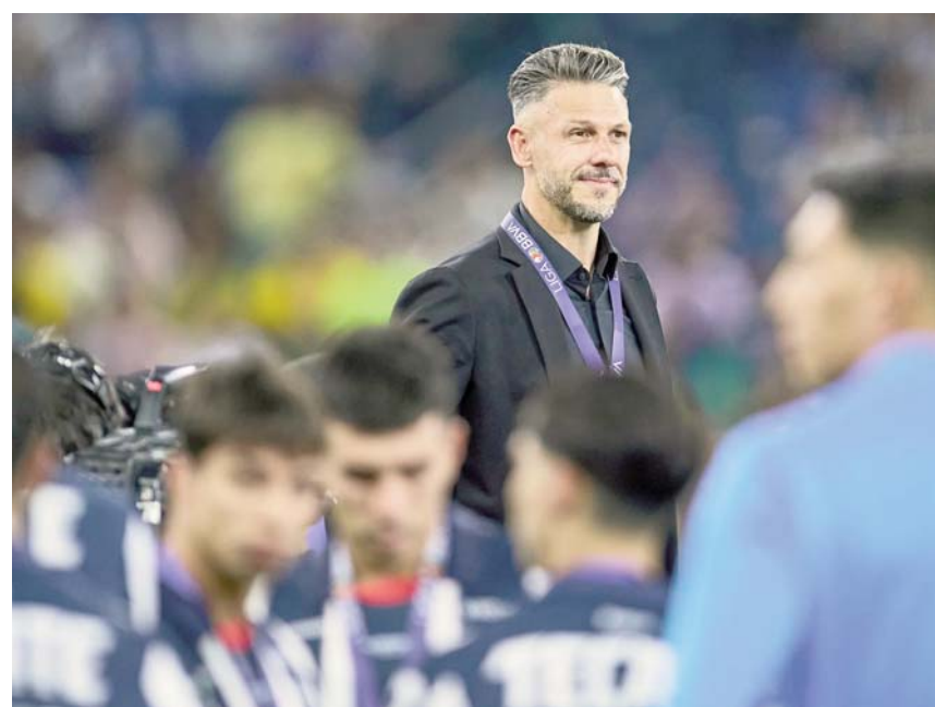
El equipo consumó un fracaso más el pasado domingo.

El equipo albiazul afrontará el primer semestre del próximo año con hasta dos competencias en puerta, las cuales serán el Torneo Clausura 2025 y la respectiva Concachampions.