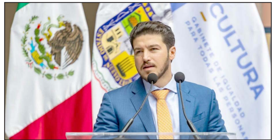
Exhortó a pensar en Nuevo León y dejar de lado tintes partidistas, juicios políticos y pleitos de partidos.

“A las Universidades, a la Iniciativa Privada, y a todos los que hoy nos acompañan, les pedimos que nos apoyen, que abracen este esfuerzo, que sean mediadores, y que logremos ir por otros 200 años igual de exitosos”, concluyó.