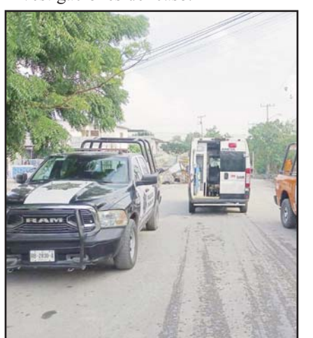
Fue en Guadalupe.

Policías de Guadalupe acudieron al sitio, quienes comenzaron con las investigaciones del caso.