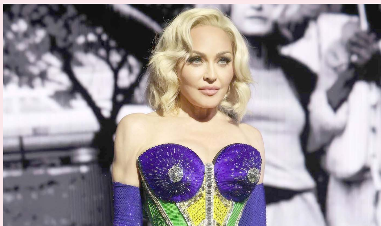
La cantante no había lanzado un álbum desde su exitoso "Madame X" en 2019; se dedicó a hacer giras mundiales.