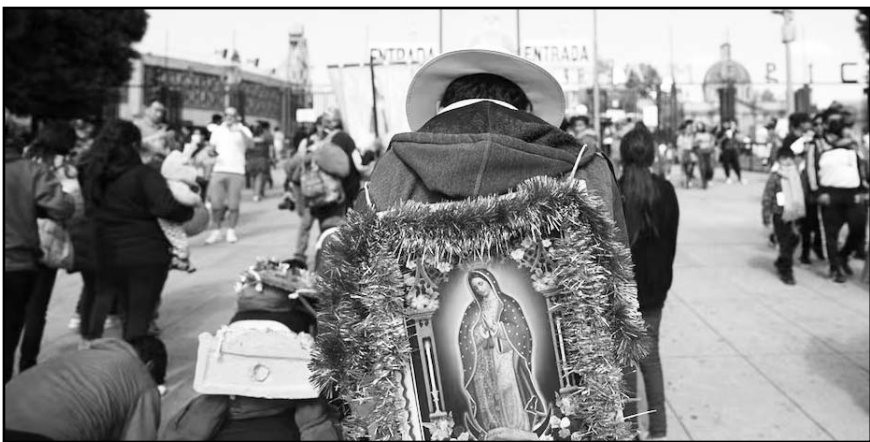
A nivel nacional, se proyecta una derrama económica de aproximadamente 150 mil millones de pesos para este mes de diciembre.