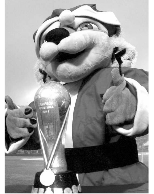
El festejo sería en el Uni.