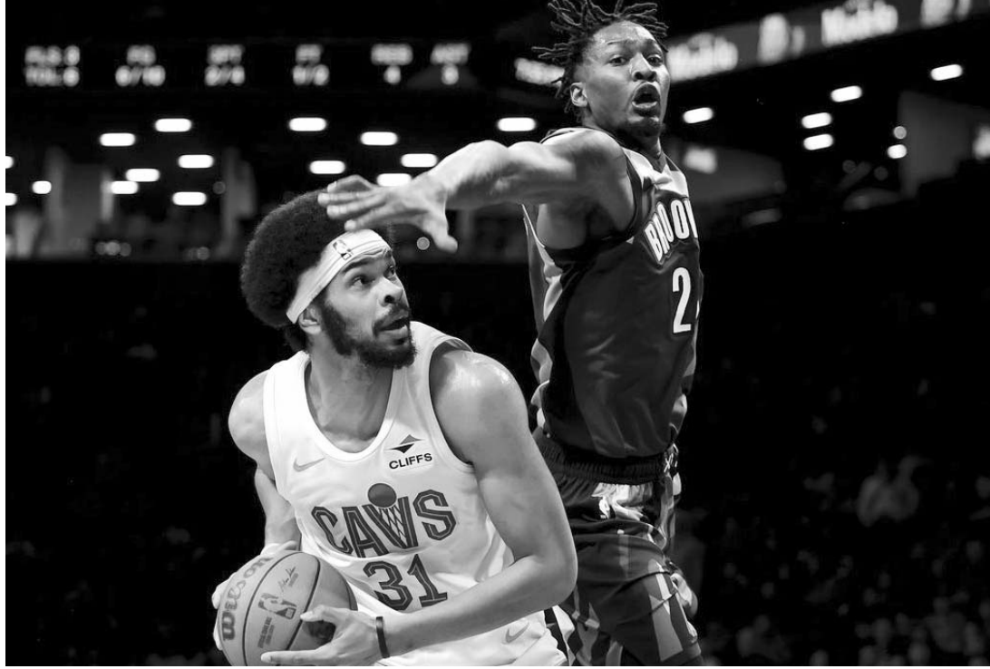
Cavaliers se impuso a los Nets por paliza de 130-101

Los Cavaliers reciben a Milwaukee Bucks el viernes. Los Nets juegan el jueves en Toronto