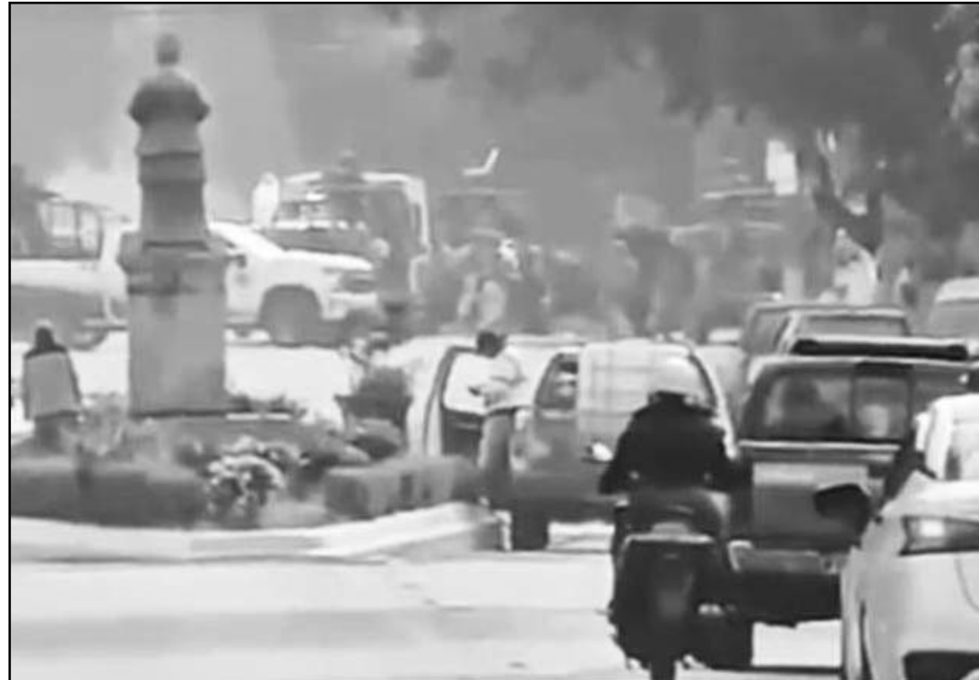
CJNG ataca con explosivos a Ejército Mexicano en Cotija, Michoacán; reportan seis militares lesionados y uno más fallecido.

Videos en poder de este medio de comunicación, grabadas por los habitantes de esa zona de Michoacán colindante con el estado de Jalisco, revelan la manera en la que el grupo armado se moviliza por