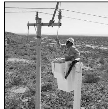
La CNDH reiteró a la CFE es es fundamental la prevención.

Por lo que le recomendó que colabore en el trámite de inscripción de las víctimas directas e indirectas, para que pueda proceder a la inmediata reparación