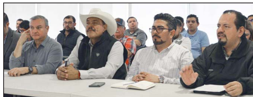
Se reunió con los alcaldes de los 38 municipios en los que se trabajará.

Entre los proyectos están la instalación de pozos, plantas de bombeo, potabilizadoras, líneas de conducción y tanques de almacenamiento.