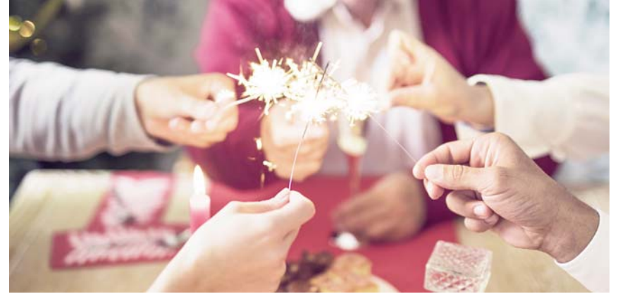
El origen de las posadas es de carácter religioso.

A la posada los integrantes llevan consigo velas y un cuadernillo con las letanías y una vez concedida la posada comienza la convivencia entre los participantes y culmina con la piñata.