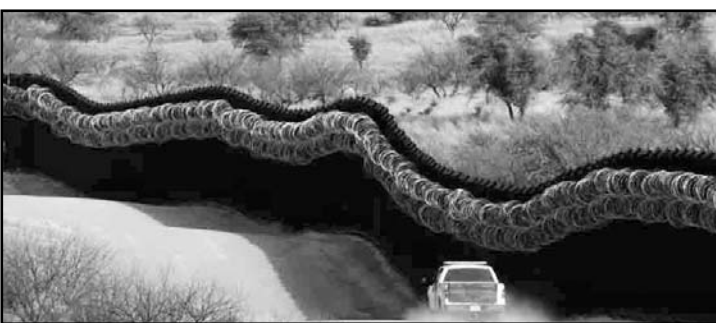
Trump defendió la construcción del muro como una forma de frenar el flujo de migrantes que, según él, afectan económicamente.

Stormy Daniels, actriz de cine para adultos, hace tiempo