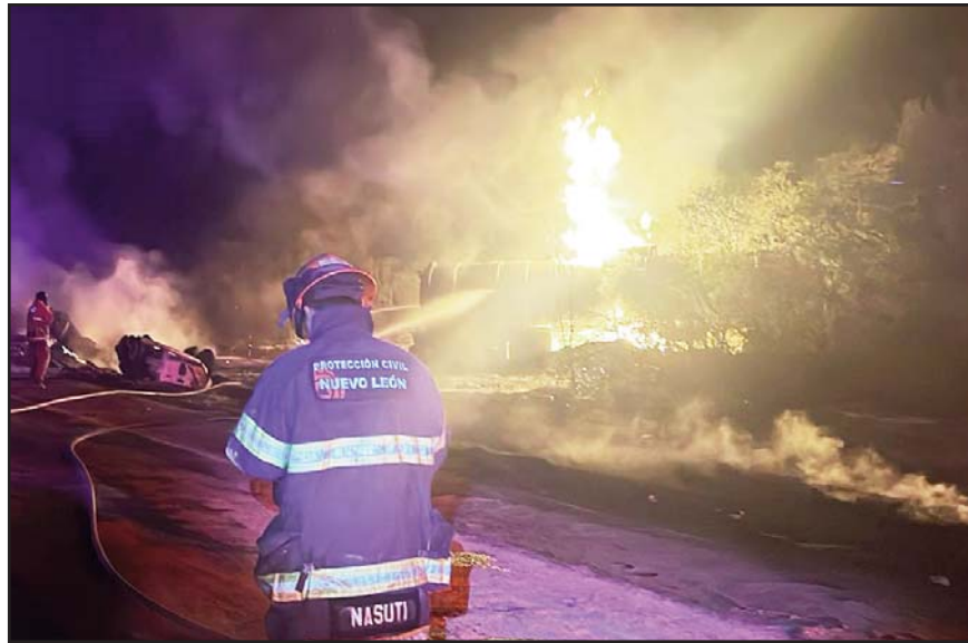
Los hechos se registraron en Montemorelos.

El accidente fue reportado a las 17:45 horas a la altura del kilómetro 199, en la mencionada carretera federal situada al del estado.