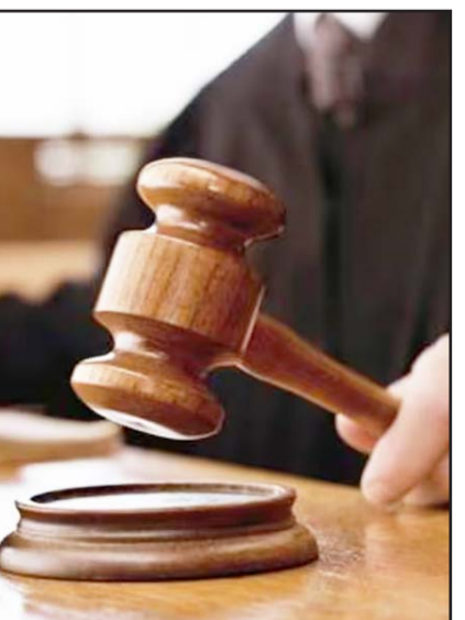
La investigación reveló violaciones laborales en Odisa, como el descuento indebido de cuotas sindicales.