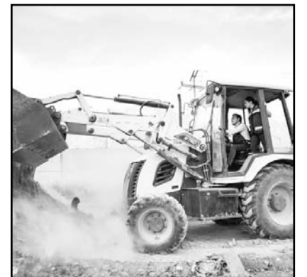
También siguen tapandobaches

Explicó que en Google Maps están mapeando cada bache que atienden desde el día uno, como en Heberto Castillo, Sor Juana, Lincoln, Prolongación Ruiz Cortines, Leones. (IGB)