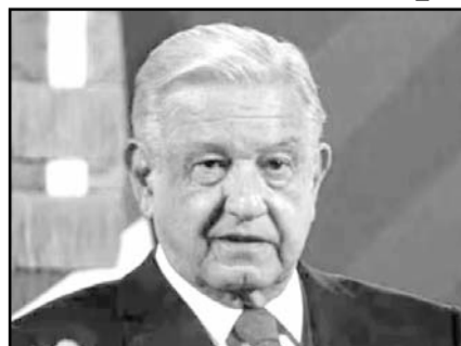
El Tribunal Electoral descartó violencia política de género en las declaraciones del expresidente.

En su proyecto, el magistrado Luis Espindola propuso declarar la inexistencia de la violencia política de género, "respecto de las expresiones en las que el entonces titular del Ejecutivo federal, en diversas conferencias matutinas, refirió que la denunciante obtuvo una candidatura por decisión de un grupo de personas con poder político que la designaron para utilizar su imagen como mujer de pueblo y que con ellos pretendían causar simpatía en el electorado".