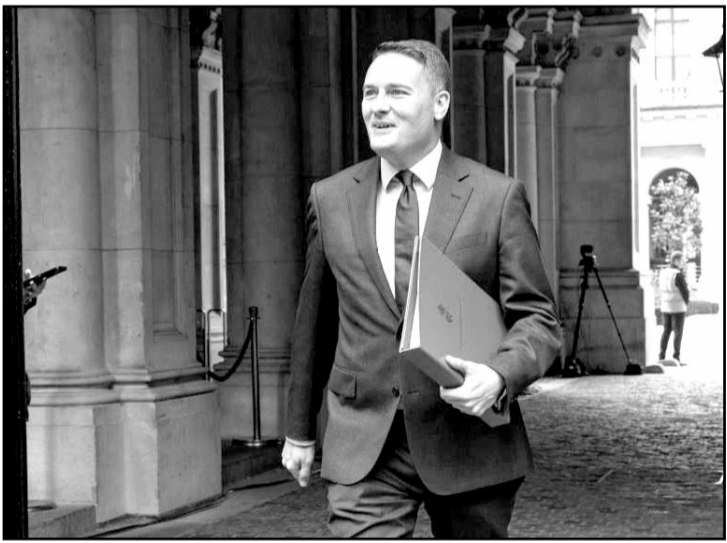
El secretario de Salud británico calificó las críticas de Musk como "equivocadas".

La intervención del exmandatario parece haber sido clave para consolidar la unidad republicana en un momento de incertidumbre.