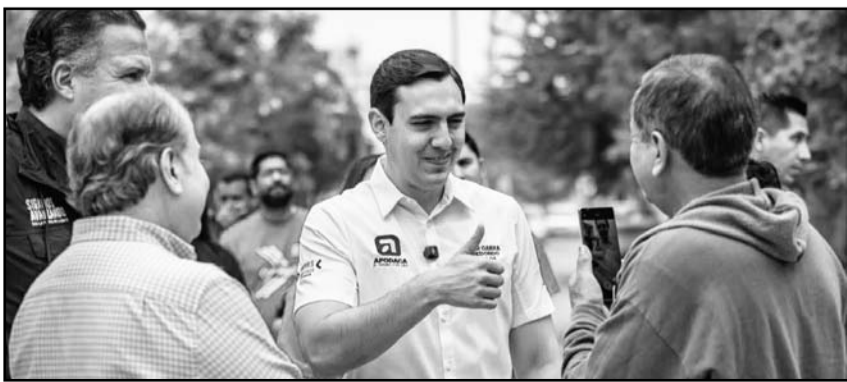
El alcalde apodaquense dijo que darán apoyo con transporte.