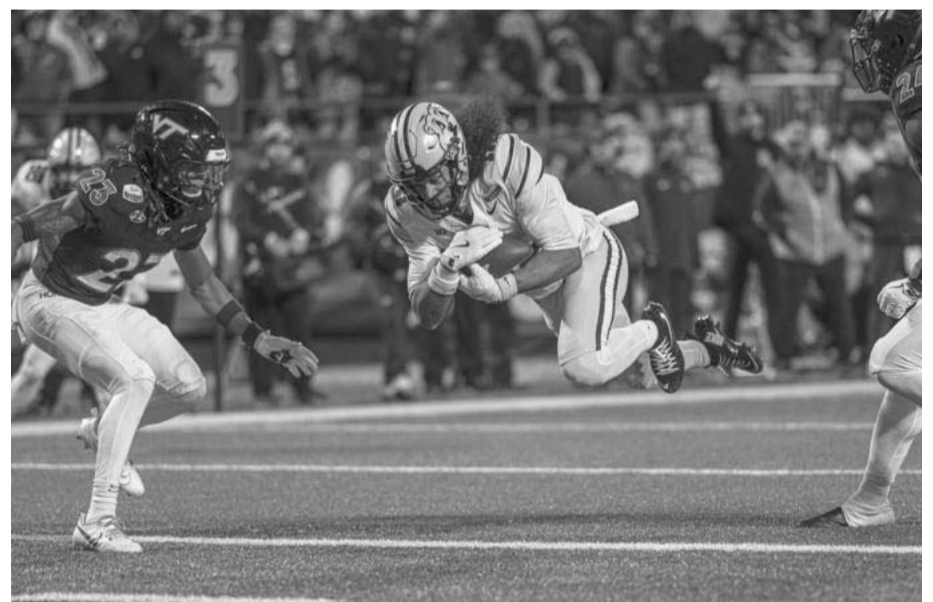
Todo listo para las semifinales.

jueves en el estadio Hard Rock de Miami entre Penn State contra Notre Dame, mientras que la segunda será el viernes de la siguiente semana, sucediendo entre