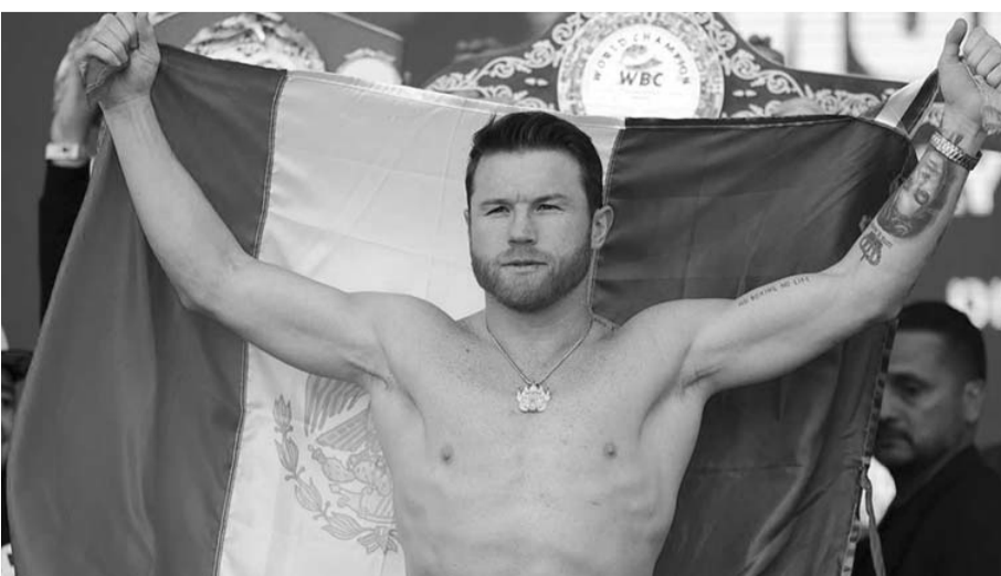
Scull heredó el cinturón en las 168 libras de Saúl Álvarez que dejó vacante el tapatío