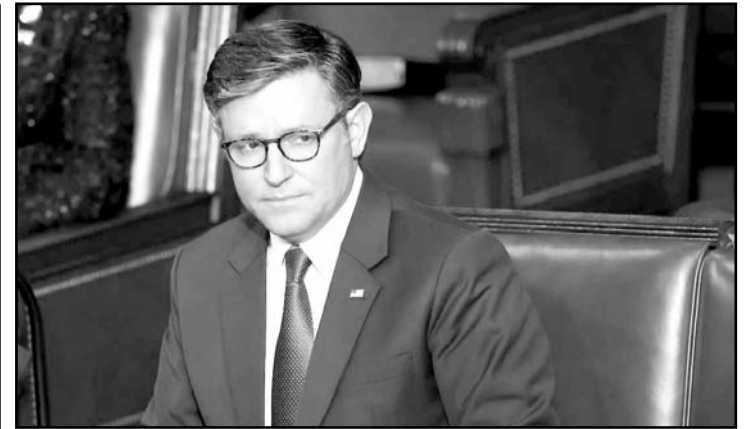
El republicano fue reelecto el viernes con 218 votos a favor.

El mandatario ucraniano sigue buscando garantías de que la administración de Trump mantendrá el apoyo militar y político hacia Ucrania en su lucha contra Rusia. "Trabajaremos para que la fuerza y la imprevisibilidad de Trump jueguen a favor de Ucrania", concluyó.