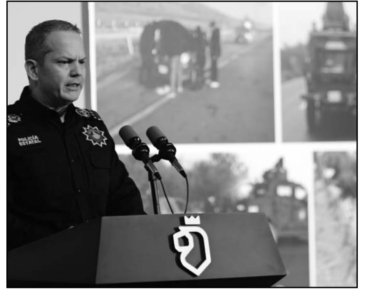
Se detuvieron a 141 generadores de violencia y el aseguramiento de 173 vehículos.

“Quiero aprovechar para agradecer a la población de Nuevo León por la confianza otorgada durante el 2024 y por parte de los policías de Fuerza civil y de las Policías Metropolitanas, deseables que en este 2025 tengamos paz para nuestras familias”, agregó.(CLG)