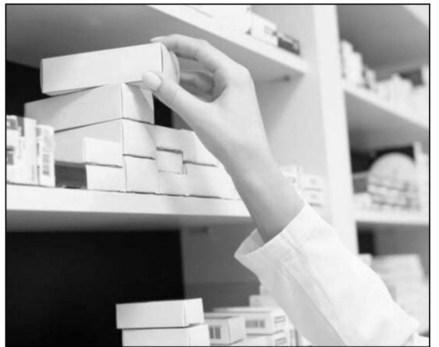
La licitación para la compra de medicamentos y suministros médicos, prevista para el 4 de enero, ha sido diferida.

Al explicar el motivo del plazo del procedimiento de contratación recortado, Birmex apuntó que buscan contar con los medicamentos e insumos de manera oportuna y no suspender la atención de los pacientes de los diversos institutos que participan en la compra consolidada. Por lo que la fecha estimada del inicio del contrato es el 28 de enero de 2025.