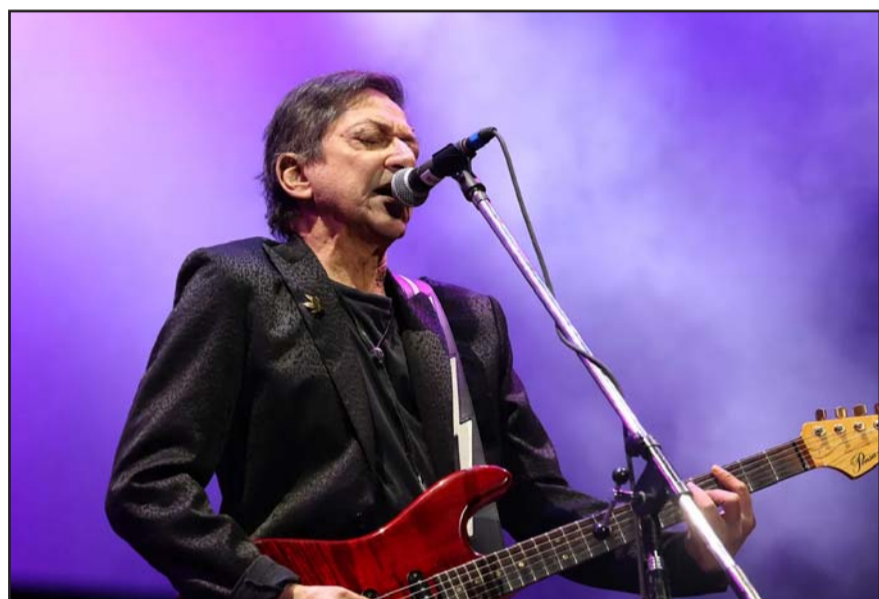
La mujer fue hallada sin vida con signos de asfixia en el cuello.

En los últimos años, Virus celebró el 40 aniversario de su emblemático álbum Relax con una serie de presentaciones en vivo, incluyendo una actuación destacada en el Teatro Gran Rex de Buenos Aires en 2024.