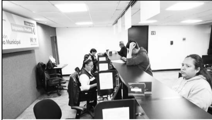
Estarán abiertas las 14 delegaciones para recibir los pagos