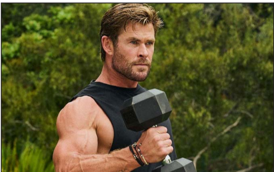
El actor australiano logró desbancar a Timothée Chalamet.