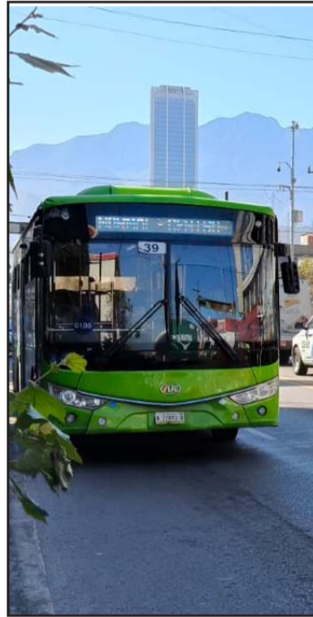
A partir del 10 de enero no habrá pago en efectivo.

"Realmente comentar que se aprueba una tarifa máxima de 17 pesos, pero no es tal", ex-