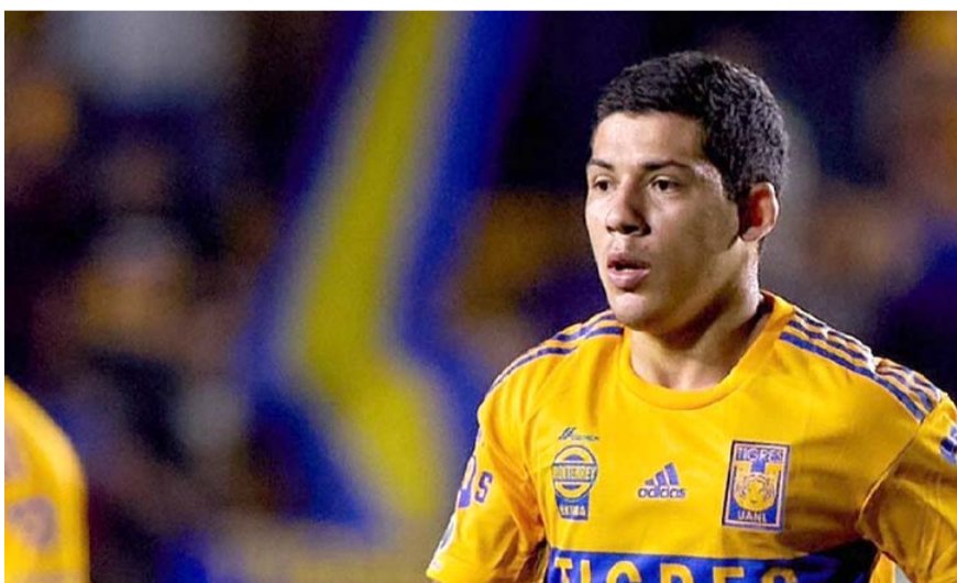
Fierro, quien también interesaba a las Chivas, buscaba tener más minutos como titular.

El tapatío es agente libre y es una de las opciones a reforzar al Monterrey, pero hasta estos momentos todo es un rumor y no algo ya oficial.