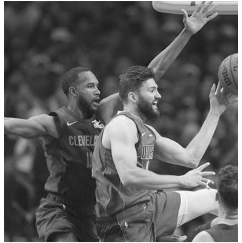
Los Cavaliers de Cleveland vencieron 134-122 a los Mavericks de Dallas y con ello se mantuvieron en la cima de la conferencia Este.