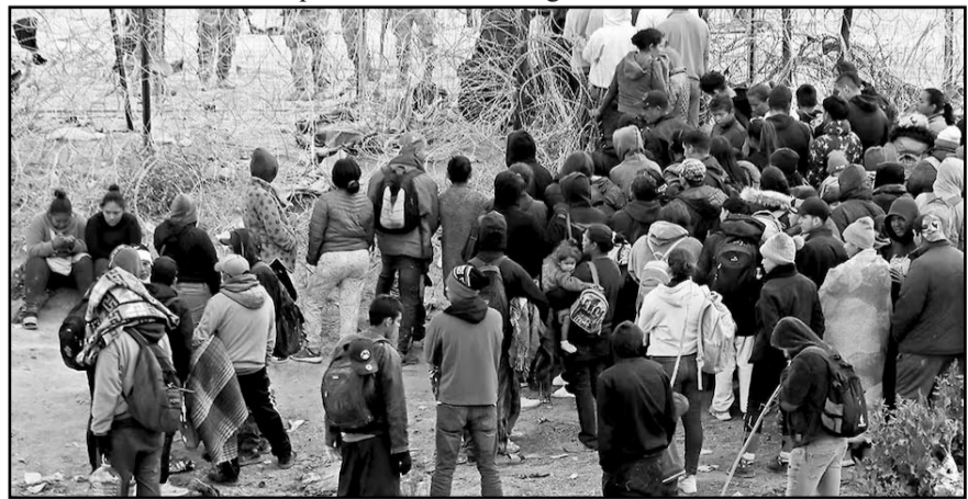
La iniciativa busca establecer una bolsa económica para subsidiar a los connacionales que regresen.