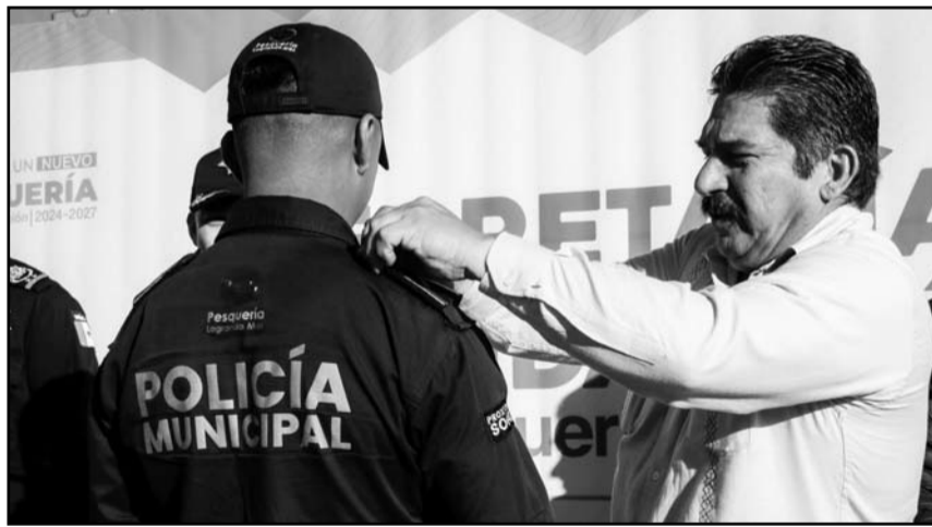
El alcalde Francisco Esquivel hizo personalmente la entrega.

El edil apodaquense comentó que de esta manera trabajan en ayudar a los usuarios del transporte público, luego de la aprobación del incremento en las tarifas del transporte público de 15 a 17 pesos de forma gradual a quienes pagan con tarjeta o aplicación. AT