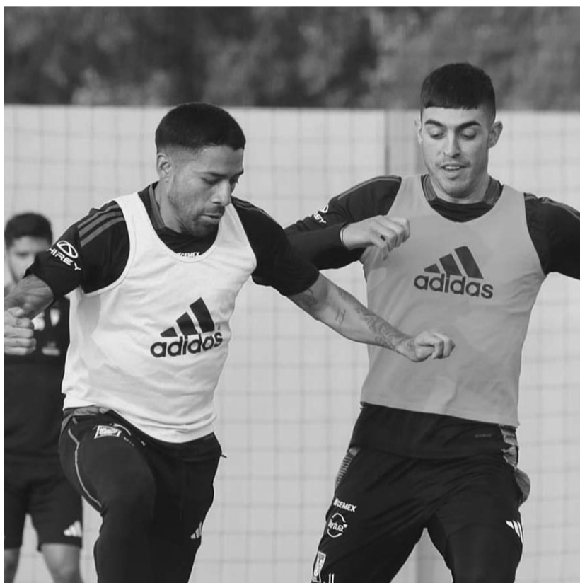
Tigres continuó ayer con sus entrenamientos a doble sesión en la pretemporada

De momento se desconoce la razón de la muerte de Cristóbal Ortega, pero se espera que se conozca con el pasar de las horas. (AC)