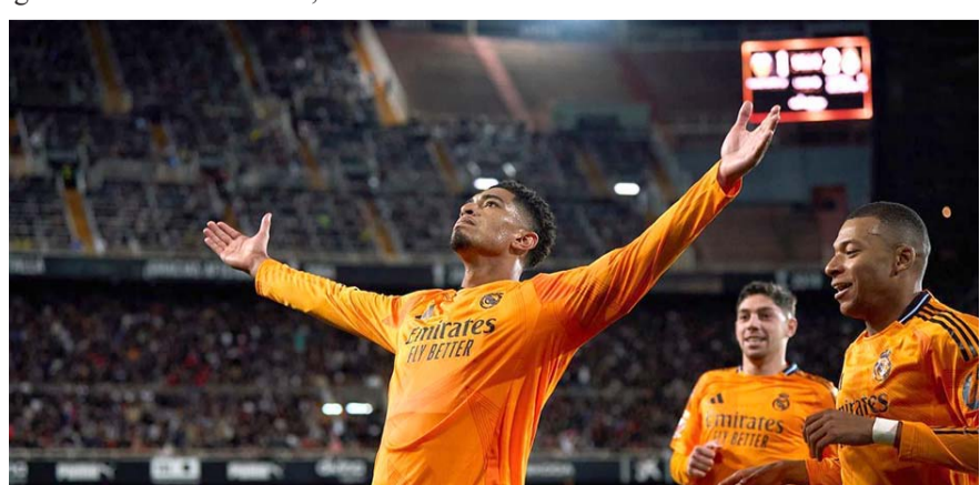
Real Madrid superó 2-1 de visitante al Valencia y con ello los merengues han tomado la cima en la competencia.

Por su parte, la escuadra del Valencia se quedó en las 12 unidades y con ello siguen en la zona del descenso.