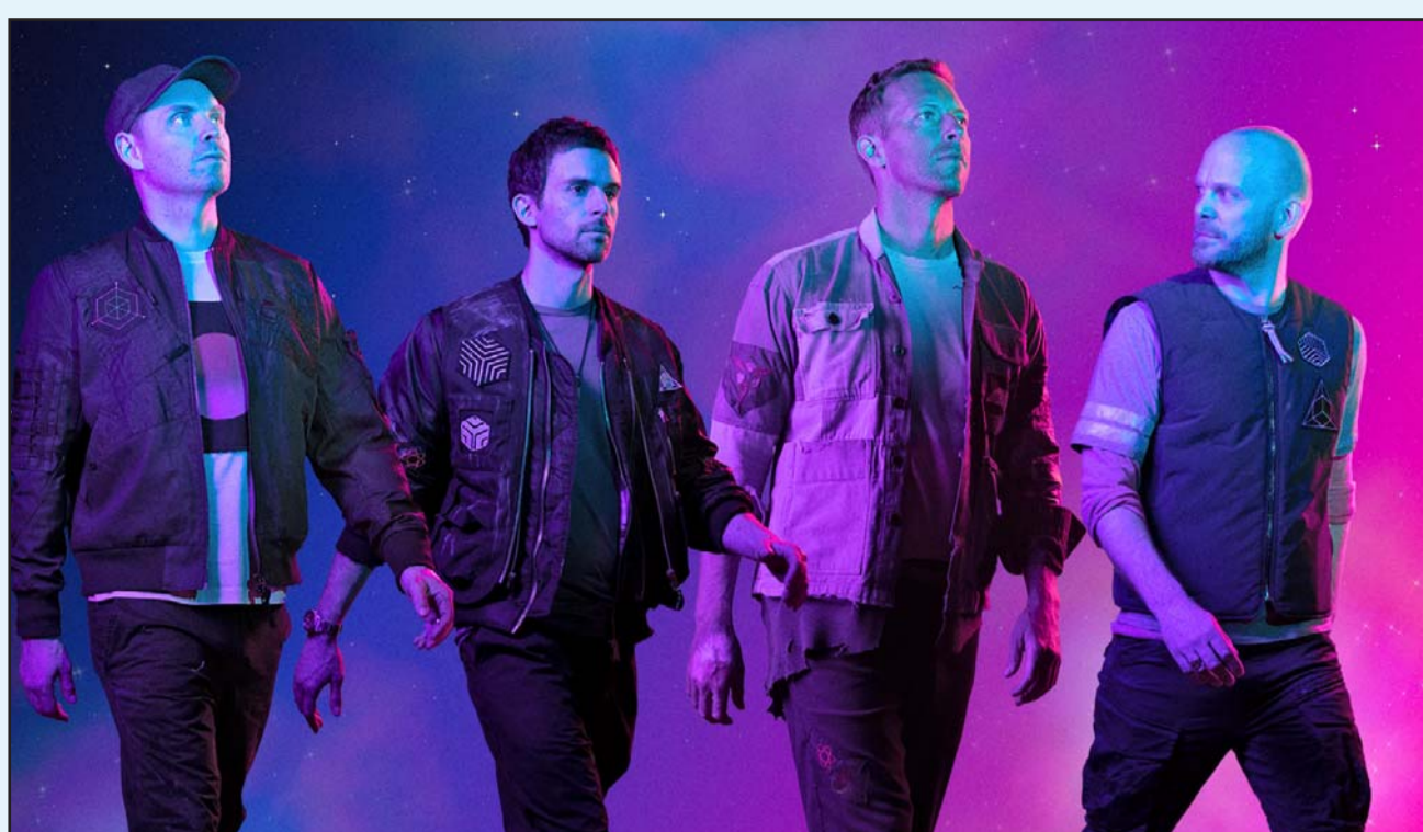
Las autoridades están trabajando con agencias internacionales para identificar a otros posibles involucrados.