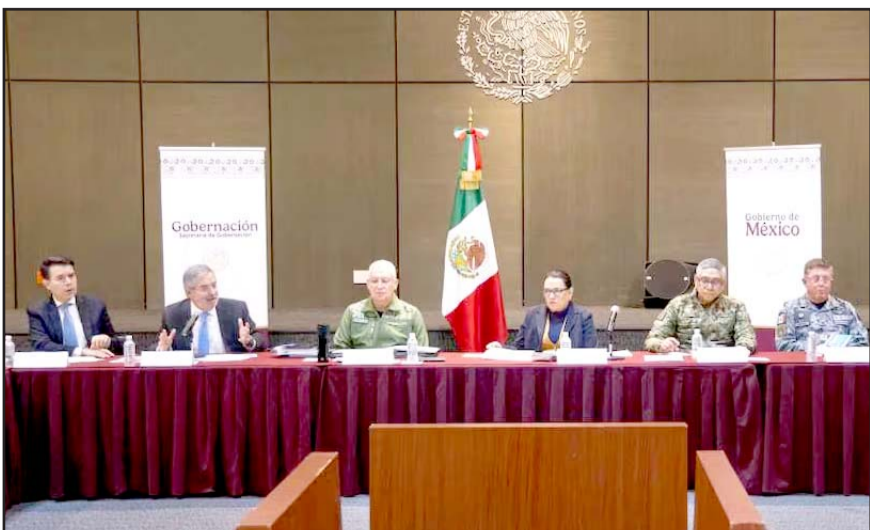
En la reunión encabezada por la Segob, se discutió un plan de acción para atender a los connacionales que pudieran ser deportados.

"Vamos a esperar también a ver cómo se dan las condiciones en Estados Unidos y, a partir de ahí, lo definimos y lo presentamos, pero está todo preparado y en coordinación con los estados fronterizos.