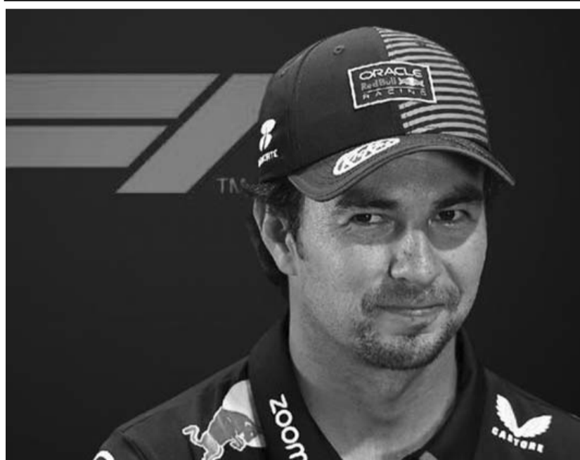
En Alpine estarían valorando la experiencia del mexicano

Ante esta situación, Sabalenka enfrentará en las semifinales y este sábado por la madrugada a Mirra Andréyeva.