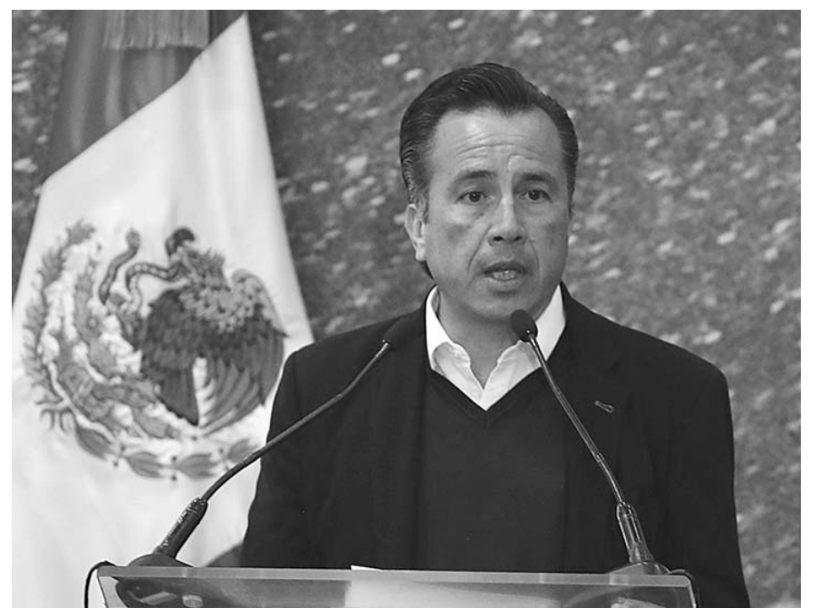
"Él nos va a ayudar a coordinar todos los trabajos que tienen que ver con producción, consumo, distribución de gas natural en Cenagas"

El gas natural es consumido por sólo 7% de los hogares en el país, indican los resultados de la Encuesta Nacional sobre Consumo de Energéticos en Viviendas Particulares (Encevi) del Inegi.