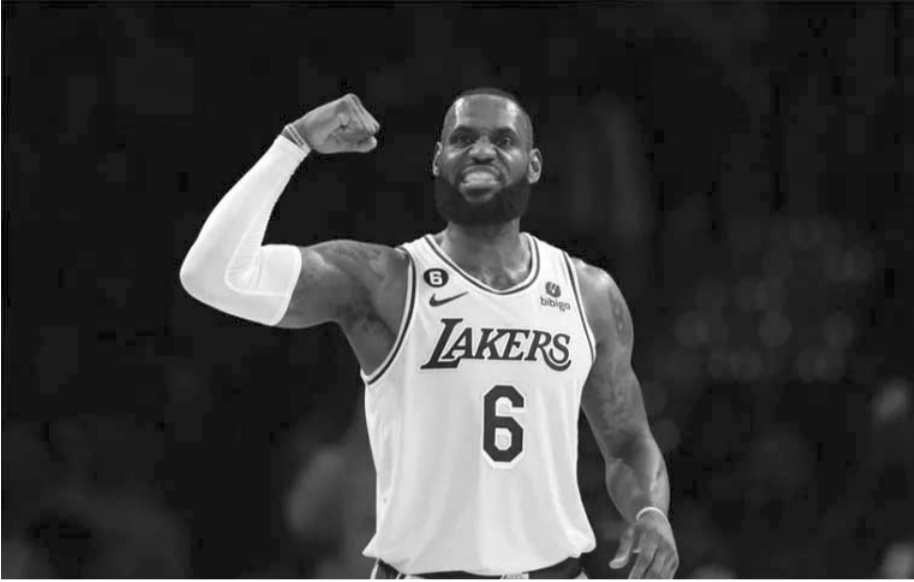
LeBron James superó el récord de la NBA de Michael Jordan de partidos con 30 puntos durante el juego de los Lakers de Los Ángeles contra Atlanta

James se convirtió en el líder anotador de la carrera de la NBA la temporada pasada, y posee varios récords adicionales de longevidad. Ha anotado al menos 10 puntos en 1,253 partidos consecutivos durante los últimos 18 años, destrozando el récord establecido por Jordan de 1986 a 2001 (866).