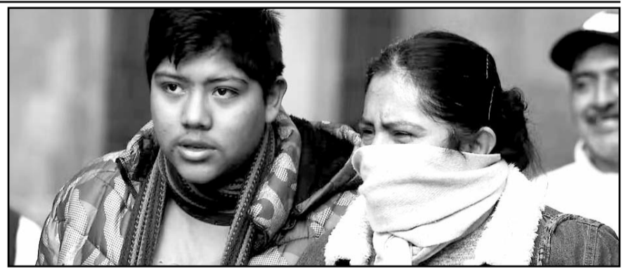
La llegada del Frente Frío 21 traerá temperaturas muy bajas, especialmente en el norte y noreste del país.

Asimismo, exhortó a la elección responsable de videojuegos.