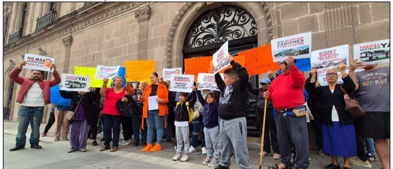
Con pancartas adultos y niños de manifestaron en las puertas del Palacio de Gobierno.