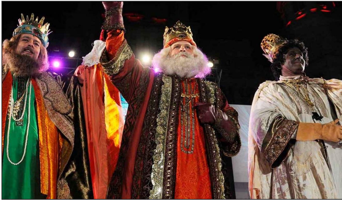
Los Reyes Magos, aparecieron por primera vez en el famoso mosaico de San Apollinaire Nuovo que data del siglo VI.