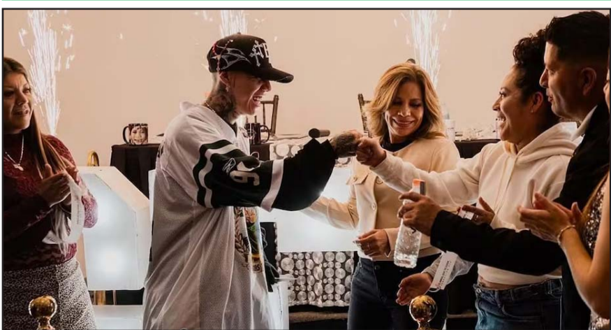
Se trata de una asociación civil que apoyará a personas de bajos recursos.