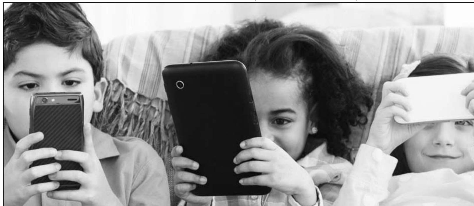
Ya es muy común ver a los niños en reuniones familiares con su celular y tablet.

Messenger Kids Es la aplicación para que los niños conversen de manera segura y controlada por sus padres para que el menor solo mantenga comunicación con las personas que los tutores han seleccionado.