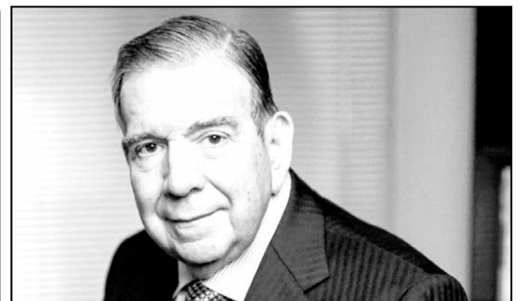
El líder opositor ha insistido en que regresará a Caracas el 10 de enero para asumir la Presidencia, a pesar de las acusaciones.