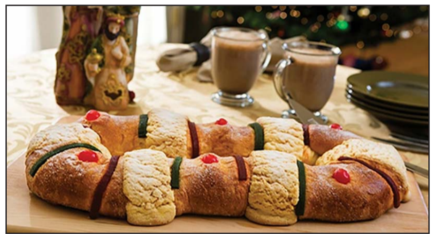
La rosca, simboliza un pasaje bíblico conocido como Epifanía, el cual va contando la travesía de los Reyes Magos hasta llegar al portal donde se encontraba el niño Dios.

Por último, como parte de estas tradiciones, se acostumbra que a quien le salga la figura del niño Jesús, tendrá el privilegio de ofrecer tamales y atole para el Día de la Candelaria, el 2 de febrero, que es el día en que se presenta al niño Jesús a la iglesia.