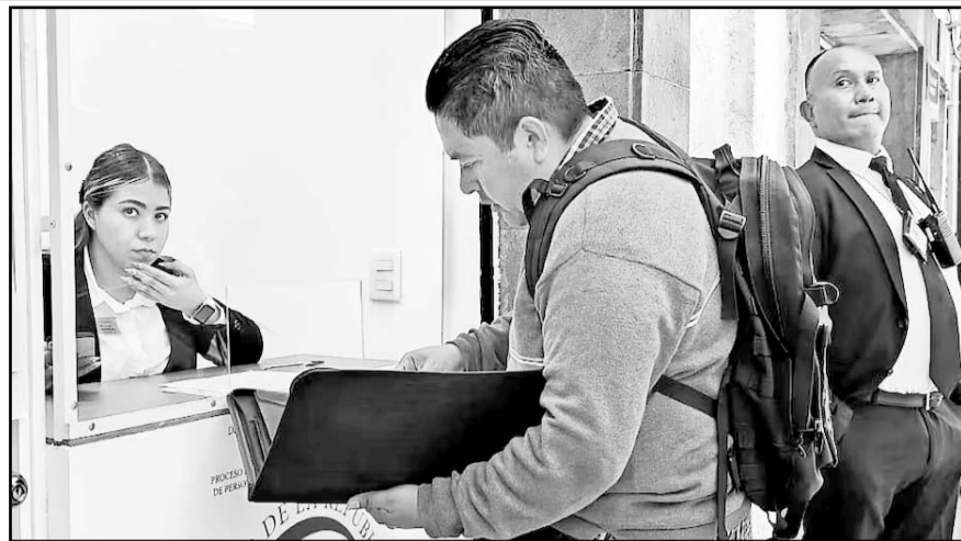
Un total de 2,768 aspirantes fueron excluidos por no cumplir los requisitos.