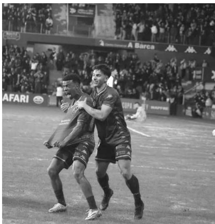
El cuadro del Pontevedra terminó eliminando al conjunto del Mallorca, a los cuales superaron por un marcador de 3-0.

Ya en más resultados de los 16vos de la Copa del Rey, Rayo Vallecano venció 3-1 al Racing Ferrol y Getafe venció 1-0 al Granada.