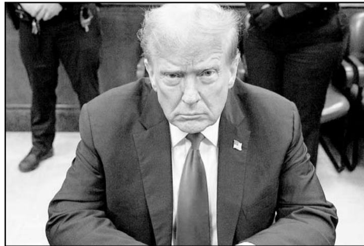
El tribunal desestimó los intentos de Trump de anular el caso argumentando inmunidad presidencial.

El fallo también pone en la balanza la decisión de la Corte Suprema federal de otorgar inmu-