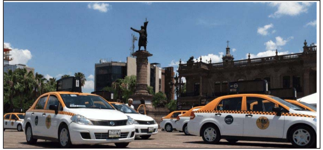
La votación para aumentar tarifas fue de 19 a favor, uno en contra y una abstención.

Usuarios en el lugar intentaron, sin éxito, bloquear el paso a los funcionarios que aprobaron el aumento.