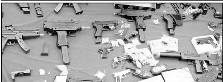
La Secretaría Ejecutiva señaló que los juguetes bélicos, como los que simulan armas, pueden incitar a conductas agresivas.