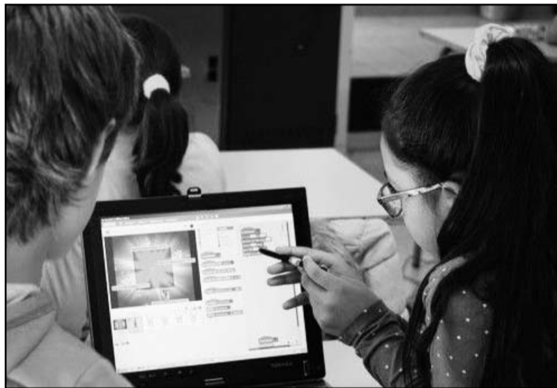
Cada vez son más los menores que tienen un excesivo uso del mundo digital.

También se puede configurar un dispositivo como uso exclusivo de un menor. Con esto se pueden evitar