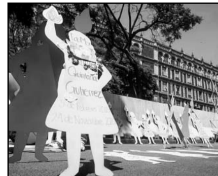
Los feminicidios de niñas y adolescentes aumentaron en 2024.

En cuanto a feminicidios contra niñas y adolescentes, la Redim destaca que de enero a octubre de 2023, se registraron 60 incidentes de este delito, cifra que aumentó a 67 en el mismo periodo de 2024. La CRC urgió al gobierno de México a adoptar urgentemente medidas para prevenir los homicidios y feminicidios de niños y a prevenir, investigar y sancionar todos los casos de desaparición de niños.