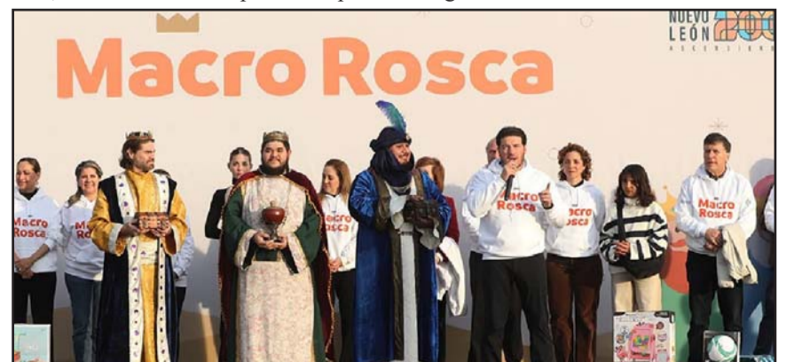
La Macroplaza se convertirá una vez más, en el sitio ideal para compartir.

tir risas, abrazos y momentos que duran para siempre con festejos, convivios y recuerdos inolvidables que los neoleonenses podrán disfrutar gratuitamente.