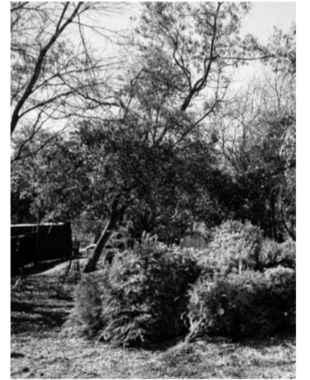
Es para que no los tiren en la calle

Durante la implementación de este programa el año pasado se recolectaron más de 5 mil pinos y se espera recibir una cantidad similar en los diferentes centros de acopio. (CLR)