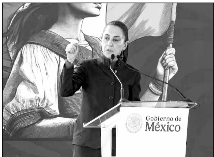
Sheinbaum recordó que, en sus conversaciones con Donald Trump, ambos discutieron la crisis del fentanilo en Estados Unidos.

En el Salón Tesorería, la Presidenta destacó las secciones Infodemia y Detector de Mentiras que se presentan en la mañanera.