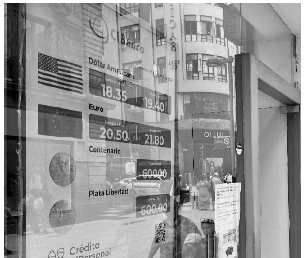
El peso borró sus ganancias iniciales

112.8 millones de acciones, por debajo del promedio diario de más de 200 millones de los últimos meses. Los títulos de la productora de tequila José Cuervo encabezarón las pérdidas, con 4.85 por ciento menos a 22.37 pesos, seguidos por los de la embotelladora y minorista Femsa, que restaron 4.58 por ciento a 167.67 pesos.