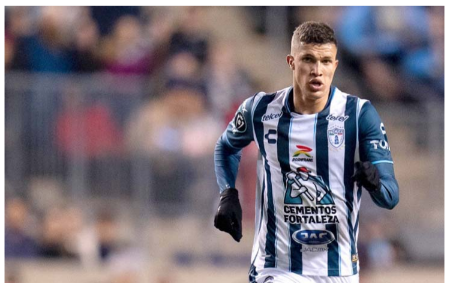
Deossa, jugador hasta hace poco del Pachuca, llegaría a Rayados bajo una venta definitiva que rondaría los siete millones de dólares