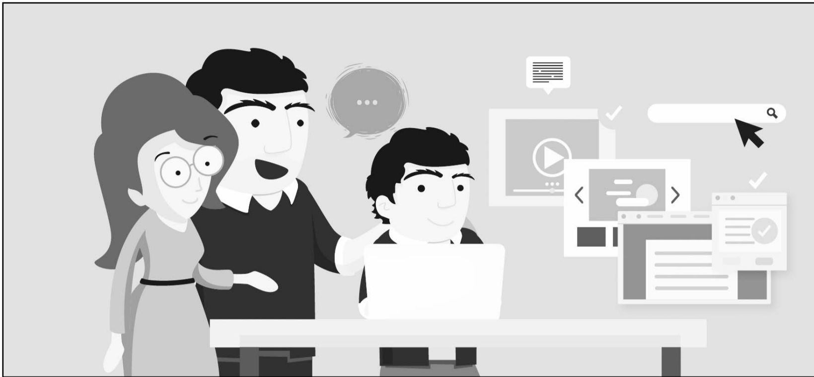
Los controles parentales son herramientas que permiten supervisar el acceso a internet.