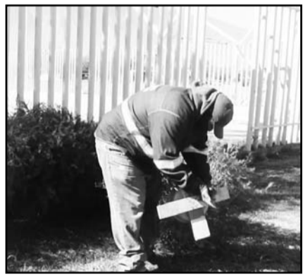
Estarán hasta el 14 de febrero .