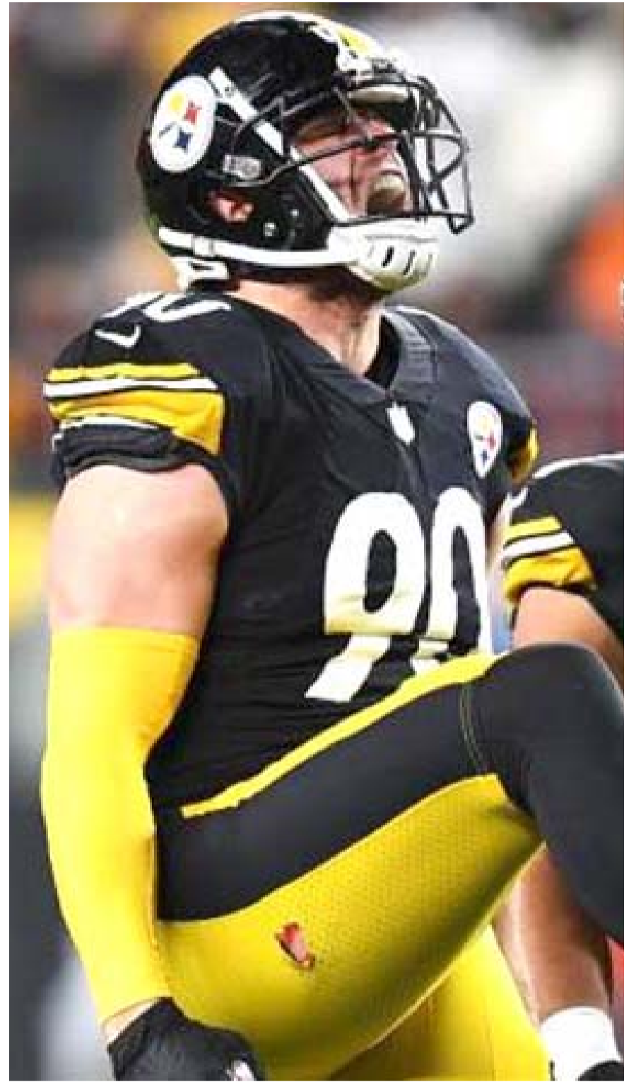
Baltimore y Pittsburgh se disputarán la cima de la división Norte en la conferencia americana y el hecho de tener un juego como local en los siguientes playoffs.

Donald Trump, presidente de Estados Unidos, aseguró que Jayden Daniels ganará el novato del año y tal vez el jugador más valioso de esta temporada en la NFL.