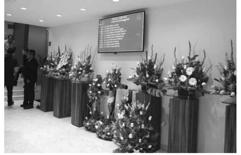
De momento se desconoce la razón de la muerte de Cristóbal Ortega