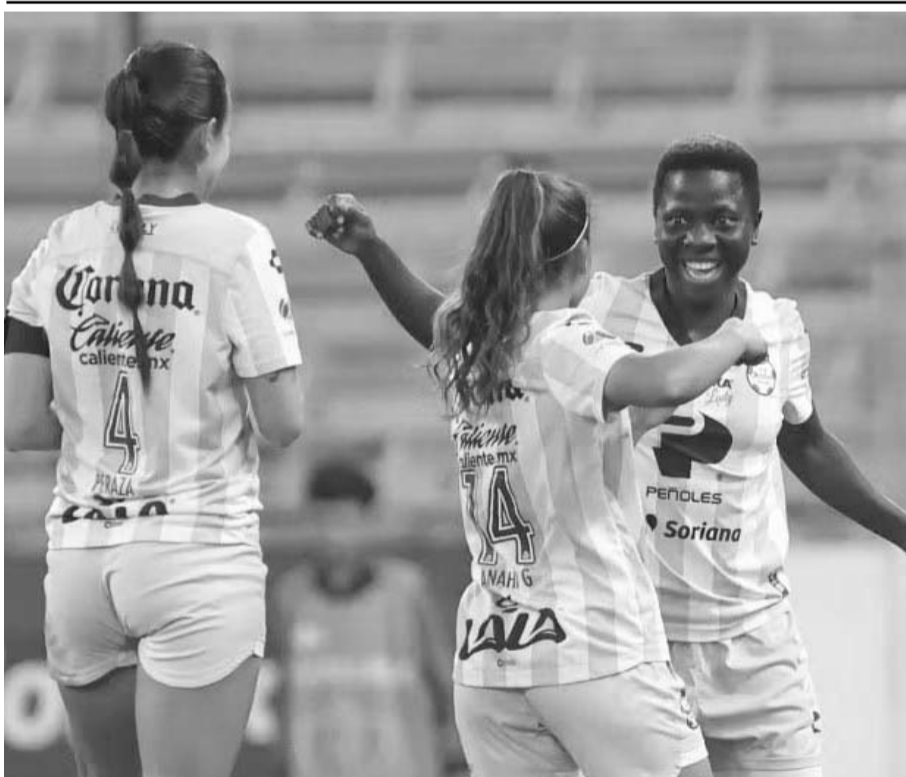
De visitantes y en la fecha uno del torneo, el equipo de Santos superó por un marcador de 3-1 al cuadro del Atlas.