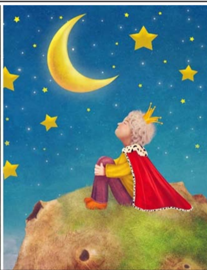
La obra fue escrita por el escritor y aviador francés Antoine de Saint-Exupéry.