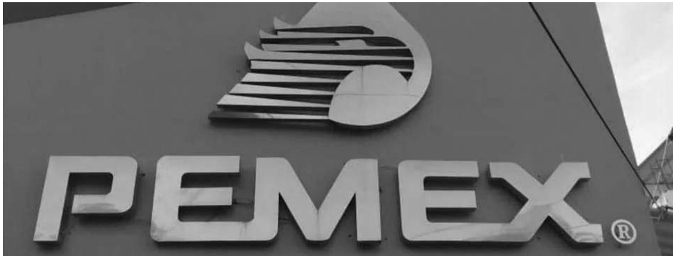
En septiembre pasado, el adeudo de Pemex con proveedores y contratistas ascendía a 402 mil millones de pesos.

Aclaró que en diciembre una parte de los proveedores recibió sus pagos, aunque no en su totalidad, pero se