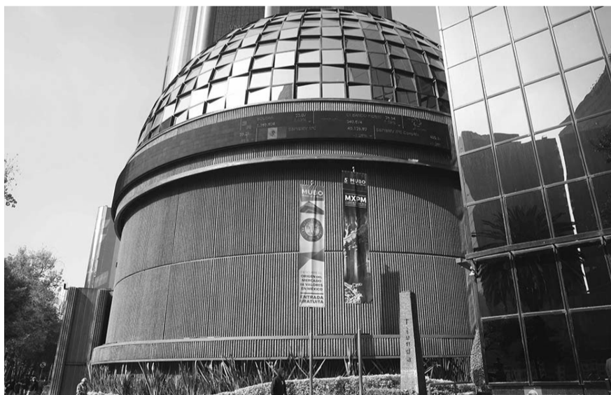
En un reporte que dio a conocer el viernes, señaló que activos como el peso, las fibras y las acciones mexicanas estarán atados a los vaivenes.

Lo anterior, explicó, debido a que por un lado los grandes ganadores