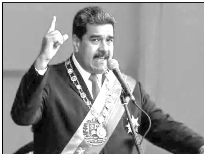
Nicolás Maduro aseguró que asumirá el cargo en el Parlamento, controlado por el chavismo.

Las acusaciones se enmarcan en el contexto de las tensiones políticas que continúan marcando la situación interna del país, en la cual la polarización entre el gobierno y la oposición.